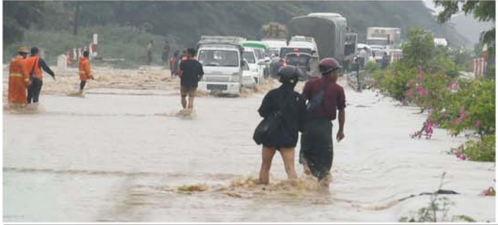
သတင်း-စာမျက်နှာ ၇ မှ