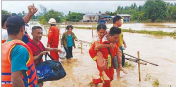
စက်တင်ဘာ ၁၃ ရက်က ပဲခူးတိုင်းဒေသကြီး အုတ်တွင်းမြို့ကျေးရွာများ (ဝဲပုံ)နှင့် တောင်ငူမြို့ကျေးရွာများ (အပေါ်ပုံ) တွင် ရေဝင်ရောက်မှုဖြစ်ပွားသဖြင့် မီးသတ် တပ်ဖွဲ့ဝင်များ၊ လူမှုကူညီရေးအသင်းအဖွဲ့များက ရေဘေးသင့်ပြည်သူများအား ကူညီကယ်ဆယ်ဆောင်ရွက်ပေးစဉ်။