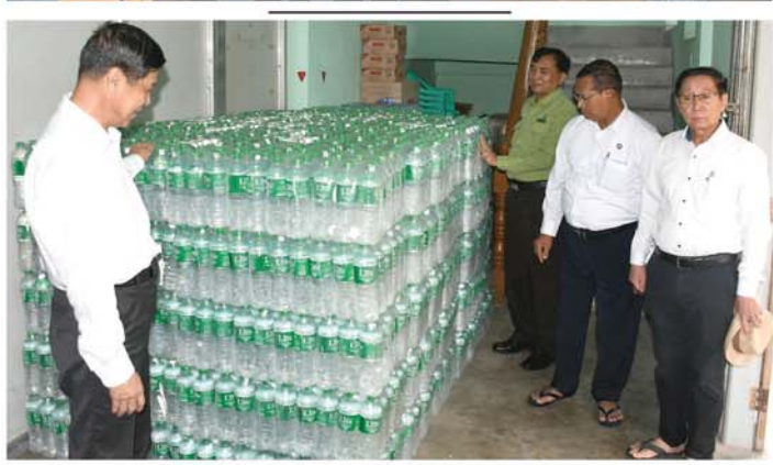
သတင်း-စာမျက်နှာ ၇ မှ