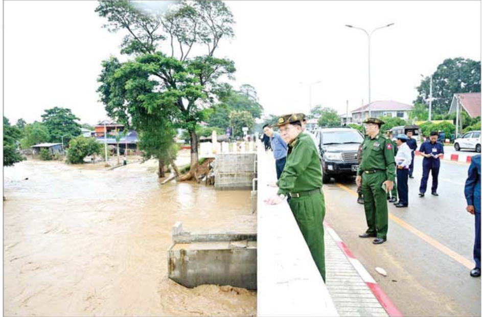
နိုင်ငံတော်စီမံအုပ်ချုပ်ရေးကောင်စီဥက္ကဋ္ဌ တပ်မတော်ကာကွယ်ရေးဦးစီးချုပ် ဗိုလ်ချုပ်မှူးကြီးမင်းအောင်လှိုင် ကျောက်ချက်တံတား (ဆင်သေချောင်းကူး) တွင် ကြည့်ရှုစစ်ဆေးစဉ်။

စကားပြောကြားသည်။ အုပ်ချုပ်ရေး ကောင်စီဥက္ကဋ္ဌ ချုပ်နှင့် အဖွဲ့ဝင်များသည် ဆက်လက်ပြီး နိုင်ငံတော်စီမံ တပ်မတော် ကာကွယ်ရေးဦးစီး အေးမြင့်သာယာတံတား(ဆင်သေ