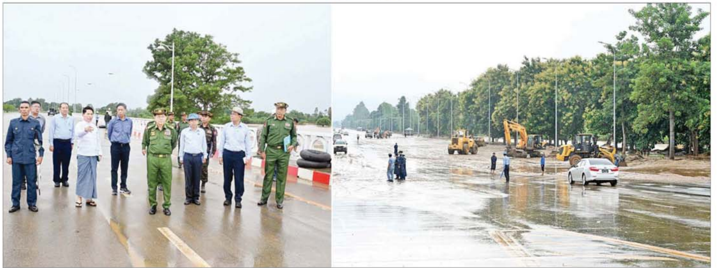
နိုင်ငံတော်စီမံအုပ်ချုပ်ရေးကောင်စီဥက္ကဋ္ဌ တပ်မတော်ကာကွယ်ရေးဦးစီးချုပ် ဗိုလ်ချုပ်မှူးကြီး မင်းအောင်လှိုင် ရေကြီးရေလျှံမှုများဖြစ်ပေါ်ခဲ့သည့်လမ်းများ၌ စက်ယန္တရားအင်အား၊ လူအင်အားဖြင့် ရှင်းလင်းရေးဆောင်ရွက်နေမှုများကို ကြည့်ရှုစစ်ဆေးစဉ်။