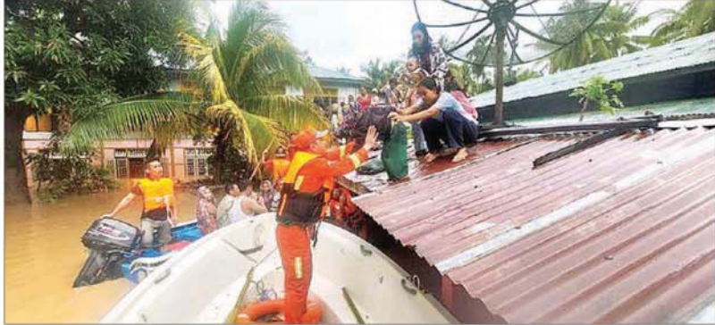
စက်တင်ဘာ ၁၁ ရက်က နေပြည်တော်ကောင်စီနယ်မြေ တပ်ကုန်းမြို့နယ်အတွင်း ရေကြီးနစ်မြုပ်မှုဖြစ်ပွားသည့် ကျေးရွာများမှ ရေဘေးသင့်ပြည်သူများအား မြန်မာနိုင်ငံမီးသတ်တပ်ဖွဲ့နှင့် လူမှုကူညီရေးအသင်းအဖွဲ့များက ခံရာခဲခစ် ကူညီကယ်ဆယ်ရေးဆောင်ရွက်မှုကို တွေ့ရစဉ်။