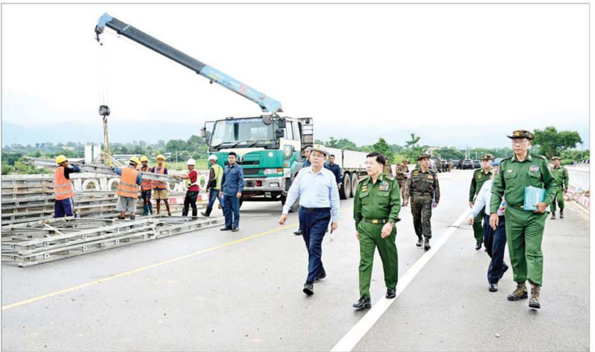
နိုင်ငံတော်စီမံအုပ်ချုပ်ရေးကောင်စီဥက္ကဋ္ဌ တပ်မတော်ကာကွယ်ရေးဦးစီးချုပ် ဗိုလ်ချုပ်မှူးကြီး မင်းအောင်လှိုင် သိုက်ချောင်းတံတား(ဆင်သေချောင်းကူး)၌ ဘေလီတံတားထိုး၍ ပြင်ဆင်ဆောင်ရွက်နေမှုကို ကြည့်ရှုစစ်ဆေးစဉ်။

ထိုသို့ဖြစ်ပေါ်ခဲ့ရာ သက်ဆိုင်ရာ နယ်မြေအလိုက် နယ်မြေခံ တပ်မတော်သားများက ဌာန ဆိုင်ရာဝန်ထမ်းများ၊ ပရဟိတ လူမှုရေးအသင်းအဖွဲ့များနှင့် အတူ ရေဘေးသင့် ပြည်သူများအား ရေဘေးလွတ်ရာသို့ ကူညီ ရွှေ့ပြောင်းပေးခြင်း၊ လမ်း/တံတား များအား ပြန်လည်ပြုပြင်ခြင်း၊ ပြိုကျပျက်စီးခဲ့သည့် အုတ်တံတိုင်း များနှင့် အဆောက်အအုံများအား ဖယ်ရှား ရှင်းလင်းပေးခြင်းနှင့် လမ်းများ၌ ပိတ်ဆို့နေသည့် သစ်ပင်/သစ်ကိုင်းများ အား ခုတ်ထွင် ရှင်းလင်းပေးခြင်းလုပ်ငန်း များကို ဆောင်ရွက်ပေးလျက်ရှိပြီး ရေဘေးသင့် ပြည်သူများအား သက်ဆိုင်ရာ မြို့နယ်အလိုက် ဖွင့်လှစ်ထားသည့် ယာယီရေဘေး ရှောင်စခန်းများ၌ ကူညီ ကယ်ဆယ် နေရာချထားပေးကာ လိုအပ်သည့် ကျန်းမာရေး စောင့်ရှောက်မှုများ ဆောင်ရွက်ပေးခြင်း၊ စားရေရိက္ခာများဝေငှခြင်းတို့ကို ဆောင်ရွက်ပေးလျက်ရှိသည်။