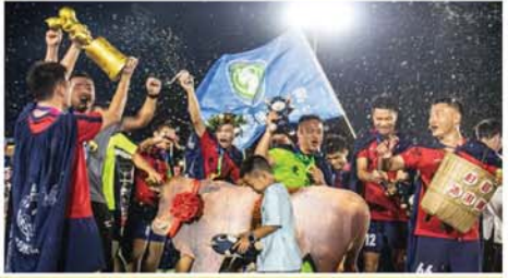
တရုတ်နိုင်ငံ ကွိုကျိုးကျေးရွာများဖလားဘောလုံးပြိုင်ပွဲ နောက်ဆုံးပိုလ်လုပွဲ၌ ဆုဖလားရရှိသွားသောအသင်း အောင်ပွဲခံနေသည်ကို စက်တင်ဘာ ၁၂ ရက်က တွေ့ရစဉ်။ Mon