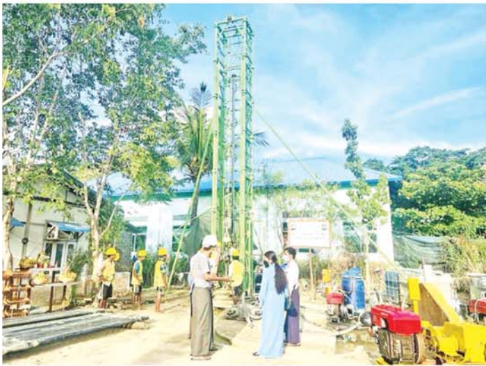
စီမံကိန်းများဖြင့် ဆောင်ရွက်

ဆည်မြောင်းဦးစီးဌာနနှင့် မန္တလေးမြို့စည်ပင် သာယာရေးအဖွဲ့၊ ဆောက်လုပ်ထိန်းသိမ်းရေးဌာန၊ ရေပေးရေးဌာနခွဲတို့ ညှိနှိုင်းပြီး ကျေးရေပေးရေး လုပ်ငန်းဆောင်ရွက်ခဲ့သည်။ ထိုစဉ်က ဆည်မြောင်း ဦးစီးဌာနမှ ကျေးအတွင်းသို့ တစ်ရက်လျှင် ရေဂါလန် ၁၂ သန်းဖြည့်သွင်းရန်၊ စည်ပင်သာယာရေးအဖွဲ့မှ ရေထွက်ပေါက် ၃၂ ပေါက်ဖြင့် မြို့တွင်းသို့ ရေ ဖြန့်ဝေရန် ဆောင်ရွက်ခဲ့ခြင်းဖြစ်သည်။