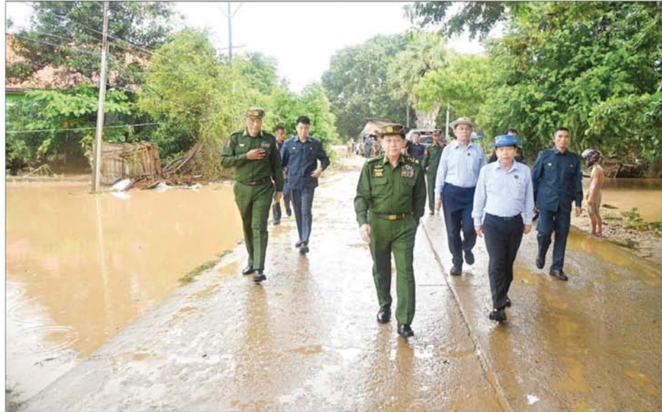
နိုင်ငံတော်စီမံအုပ်ချုပ်ရေးကောင်စီဥက္ကဋ္ဌ တပ်မတော်ကာကွယ်ရေးဦးစီးချုပ် ဗိုလ်ချုပ်မှူးကြီးမင်းအောင်လှိုင် ရေကြီးရေလျှံမှုများ ဖြစ်ပေါ်ခဲ့သည့် နေရာများအား ကြည့်ရှုစစ်ဆေးစဉ်။

ကာကွယ်ရေး ဦးစီးချုပ်သည် တာဝန်ရှိသူများအား နိုင်ငံတော်စီမံ ရေကြီးရေလျှံမှုဒဏ် ခံခဲ့ရသည့် ဒေသများ၌ ကူညီကယ်ဆယ်ရေး လုပ်ငန်းများကို အင်ပြည့်အား ပြည့်ဖြင့် အမြန်ဆုံး ဆက်လက် ဆောင်ရွက်သွားရန် လိုကြောင်း၊ ရေဘေးသင့် ပြည်သူများ၏ လက်လယ်သို့ ကူညီကယ်ဆယ် ရေးနှင့် ထောက်ပံ့ရေးပစ္စည်းများ အမြန်ဆုံးရောက်ရှိရေးအတွက် လည်း ဆောင်ရွက်သွားရန်လို ကြောင်း၊ တိုင်ပင်ဖွဲ့စည်းရန်ရက်စွာ အရှိန်ကြောင့် ရေကြီးရေလျှံမှုများ ကြုံတွေ့ခံစားခဲ့ရသည့် အခြား နိုင်ငံများနှင့်တူ ပြည်ပနိုင်ငံ များမှ ကူညီကယ်ဆယ်ရေးနှင့် ထောက်ပံ့ရေးပစ္စည်းများ အမြန် ဆုံး ရရှိနိုင်ရေးအတွက်လည်း နိုင်ငံတော်အစိုးရက တာဝန်ရှိသူ များအနေဖြင့် အမြန်ဆုံးချိတ်ဆက် ရယူနိုင်ရေး ဆောင်ရွက်သွားရန် နှင့် ရေဘေးသင့်ပြည်သူများအား အမြန်ဆုံးထောက်ပံ့ပေးနိုင်ရေး ဆက်လက် ဆောင်ရွက်သွားရန်လို ကြောင်း မှာကြားသည်။