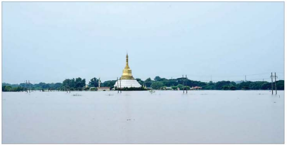
ပြည်ထောင်စုနယ်မြေ နေပြည်တော်၌ မိုးအဆက်မပြတ်ရွာသွန်းမှုကြောင့် ရေကြီးရေလျှံမှု ဖြစ်ပေါ်လျက်ရှိသည်ကို တွေ့ရစဉ်။

မွန်အောင် ဆောင်ရွက်ပေးနိုင် မှသာလျှင် ရေဝင်မှုများကျဆင်း သွားမည်ဖြစ်သဖြင့် လုပ်ငန်းများ ဆောင်ရွက်ရာတွင် စက်ယန္တရား အင်အား၊ လူအင်အားများကို အင်ပြည့်အားပြည့်ဖြင့် အသုံးပြု ဆောင်ရွက်သွားရန်လိုကြောင်း၊ စက်ယန္တရားများရှိသည့် ဝန်ကြီး ဌာနများနှင့် တပ်မတော်အင်ဂျင် နီယာတပ်ဖွဲ့များမှ စက်ယန္တရား များ ထပ်မံထုတ်ယူ၍ ရေစီး ရေလာ ကောင်းမွန်အောင် ရေလမ်း ကြောင်း အမြန်ရှင်းလင်းရန်လို ကြောင်း၊ ကူညီကယ်ဆယ်ရေးနှင့် ပြန်လည်ထူထောင်ရေး လုပ်ငန်း များကိုလည်း အမြန်ဆုံးဆောင် ရွက်ပေးနိုင်ရေး စီမံဆောင်ရွက် သွားရမည်ဖြစ်ကြောင်း မှာကြား ခဲ့ပြီး ရေဘေးသင့်ပြည်သူများကို ရှင်းရင်းနှီးနှီးနှုတ်ဆက် အားပေး