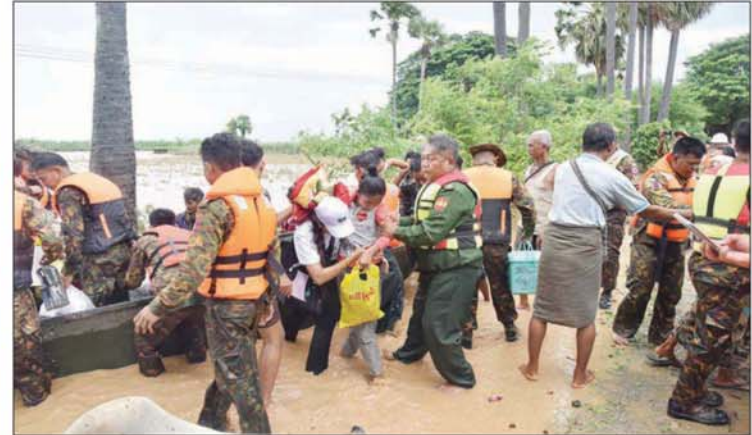
တပ်မတော်သားများ၊ ရဲတပ်ဖွဲ့ဝင်များ၊ ကူညီကယ်ဆယ်ရေးအသင်းအဖွဲ့များက ရေကြီးနစ်မြုပ်မှုဖြစ်ပွားသည့်ဒေသများမှ ပြည်သူများအား ကူညီကယ်ဆယ်ရေးဆောင်ရွက်ပေးမှုကို တွေ့ရစဉ်။ သတင်းစဉ်