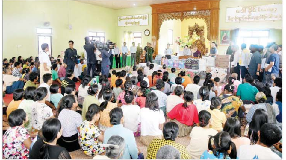
နိုင်ငံတော်စီမံအုပ်ချုပ်ရေးကောင်စီ ဒုတိယဥက္ကဋ္ဌ ဒုတိယဝန်ကြီးချုပ် ဒုတိယဗိုလ်ချုပ်မှူးကြီး စိုးဝင်း တပ်ကုန်းမြို့ရှိ ချမ်းမြေ့မြိုင်ရိပ်သာ ကျောင်းတိုက်၌ရောက်ရှိနေသော ရေဘေးသင့်ပြည်သူများအား တွေ့ဆုံအားပေးစကားပြောကြားစဉ်။

က လိုအပ်သည့်ကယ်ဆယ်ရေး စခန်း(သို့မဟုတ်) စိတ်ဆန္ဒရှိသည့် ကယ်ဆယ်ရေး စခန်းများသို့ လမ်းညွှန်လျက် စနစ်တကျ လျှော့ဒါန်းနိုင်ရေး ဆောင်ရွက်ပါက ပိုမိုထိရောက် တွင်ကျယ်ပါကြောင်း၊ ပိုင်းဝန်းဆောင်ရွက်စေ လိုကြောင်း၊ ကေလားဟလသတင်း နှင့်ပတ်သက်၍လည်း ယခုဖြစ်စဉ် မှာ တစ်ညအတွင်း မိုးရေချိန် ၁၁ လက်မခန့် ရွာသွန်းခဲ့မှုကြောင့် ဖြစ်ပေါ်ခဲ့မှုအပေါ် ဆည်တစ်ဖျား ကျိုးပေါက်ခြင်း၊ ဆည်တစ်ဖျားမှ ရေအလုံးအရင်း ဖောက်ထုတ်ခြင်း ကြောင့် ရေကြီးရေလွှဲမှုဖြစ်သည့် အပြင် ထပ်မံ၍လည်း ဖြစ်ပေါ်လာ နိုင်၍ မိမိတို့နေရာမှ အမြန် ရွှေ့ပြောင်းကြရေး တရားမဝင် ပြည်ဖျက်မီဗီယာများ ဖမ်းသတ်ပေး ချက်များ ဖြစ်ပေါ်မှုလည်း ဒေသခံပြည်သူများ စိတ်အနှောင့် အယှက်ဖြစ်စေခြင်း၊ စိုးရိမ်ပူပန်မှု