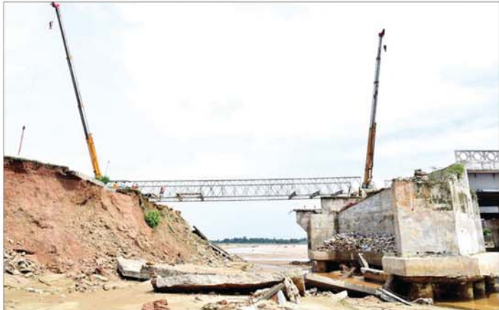
သိုက်ချောင်းတံတား (ဆင်သေချောင်းကူး) ပြင်ဆင်ဆောင်ရွက်နေမှုကို တွေ့ရစဉ်။