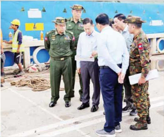
နိုင်ငံတော်စီမံအုပ်ချုပ်ရေးကောင်စီဒုတိယဥက္ကဋ္ဌ ဒုတိယဝန်ကြီးချုပ် ဒုတိယဗိုလ်ချုပ်မှူးကြီးစိုးဝင်း နဝင်းချောင်း ယာယီဘေလိတ်တား တည်ဆောက်နေမှုကို ကြည့်ရှုစစ်ဆေးစဉ်။