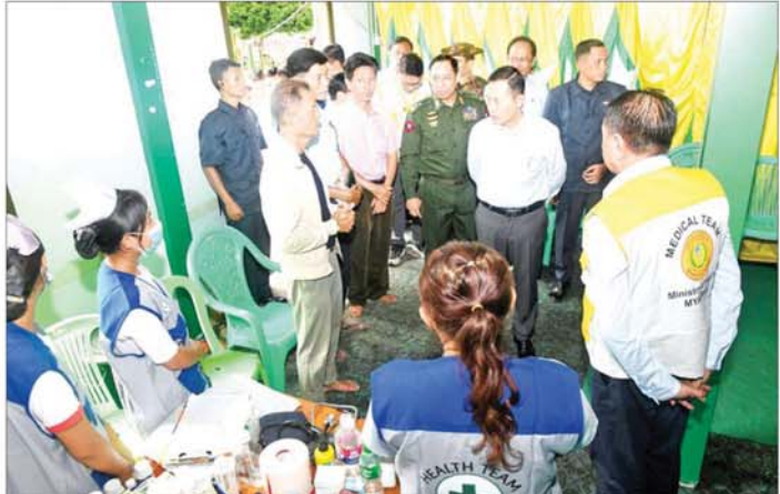
နိုင်ငံတော်စီမံအုပ်ချုပ်ရေးကောင်စီဒုတိယဥက္ကဋ္ဌ ဒုတိယဝန်ကြီးချုပ် ဒုတိယဗိုလ်ချုပ်မှူးကြီး စိုးဝင်း တပ်ကုန်းမြို့ အမှတ်(၁) အခြေခံပညာအထက်တန်းကျောင်း၌ ရောက်ရှိနေသည့် ရေဘေးသင့်ပြည်သူများ အား ကျန်းမာရေးစောင့်ရှောက်မှုပေးနေသည့်အဖွဲ့များကို တွေ့ဆုံအားပေးစကားပြောကြားစဉ်။

နဝင်းချောင်းတံတား ထို့နောက် အမျိုးသားသဘာဝ ဘေးအန္တရာယ်ဆိုင်ရာ စီမံခန့်ခွဲမှု ကော်မတီဥက္ကဋ္ဌ နိုင်ငံတော်စီမံ အုပ်ချုပ်ရေးကောင်စီ ဒုတိယ ဥက္ကဋ္ဌ ဒုတိယဝန်ကြီးချုပ် ဒုတိယ ဗိုလ်ချုပ်မှူးကြီး စိုးဝင်းနှင့် အဖွဲ့ ဝင်များသည် ရန်ကုန်-မန္တလေး ကားလမ်းဟောင်းပေါ်ရှိ အရှည် ဝေ ၁၉၀၊ အကျယ် ၂၈ ပေရှိ နဝင်း ချောင်းတံတားအား ရေတိုက်စားမှု ကြောင့် ပြိုကျပျက်စီးခဲ့မှု အခြေ အနေများကို သွားရောက်ကြည့်ရှု ၍ ခရီးသွားပြည်သူများ အဆင် ပြေစွာ သွားလာနိုင်ရေးအတွက် လမ်းတံတားဦးစီးဌာနမှ ဝန်ထမ်း များနှင့် တာဝန်ရှိသူများက ယာယီ ဘေးလိတ်တား တည်ဆောက်နေမှု အခြေအနေများကို ကြည့်ရှုကာ တာဝန်ရှိသူများအား လိုအပ်သည် များ မှာကြားခဲ့သည်။ အဆိုပါ နဝင်းချောင်းတံတား ယာယီဘေးလိတ်တားကို တံတား ခံနိုင်ရည်တန် ၄၀၊ အရှည် ပေ ၁၀၀၊ ယာဉ်သွားလမ်းအကျယ် ၂၄ ပေ၊ သံဘေးလိတ်သားလွှာ တစ်ထပ် တံတားလုံးခြင်း လုပ်ငန်းကို စက်တင်ဘာ ၁၁ ရက်မှစ၍ အစားထိုး စတင်တည်ဆောက် လျက်ရှိရာ စက်တင်ဘာ ၁၆ ရက် တွင် ပုံမှန်အတိုင်း ပြန်လည် သွားလာနိုင်မည် ဖြစ်ကြောင်း သိရသည်။ ထို့နောက် အမျိုးသားသဘာဝ ဘေးအန္တရာယ်ဆိုင်ရာ စီမံခန့်ခွဲမှု ကော်မတီဥက္ကဋ္ဌ နိုင်ငံတော်စီမံ အုပ်ချုပ်ရေးကောင်စီ ဒုတိယ ဥက္ကဋ္ဌ ဒုတိယဝန်ကြီးချုပ် ဒုတိယ ဗိုလ်ချုပ်မှူးကြီး စိုးဝင်းနှင့် အဖွဲ့ဝင် များသည် ကင်းသာလမ်းဆုံမှ ရန်ကုန်-မန္တလေး လမ်းဟောင်း အတိုင်း နေပြည်တော်ကောင်စီ နယ်မြေအတွင်း လူနေရပ်ကွက်များ၊ ကျေးရွာများအတွင်း မော်တော် ယာဉ်များဖြင့် လှည့်လည်၍ ရေတိုက်စားမှုကြောင့် ထိခိုက် ပျက်စီးနေမှု အခြေအနေများ၊ စာမျက်နှာ ၄ သို့ *