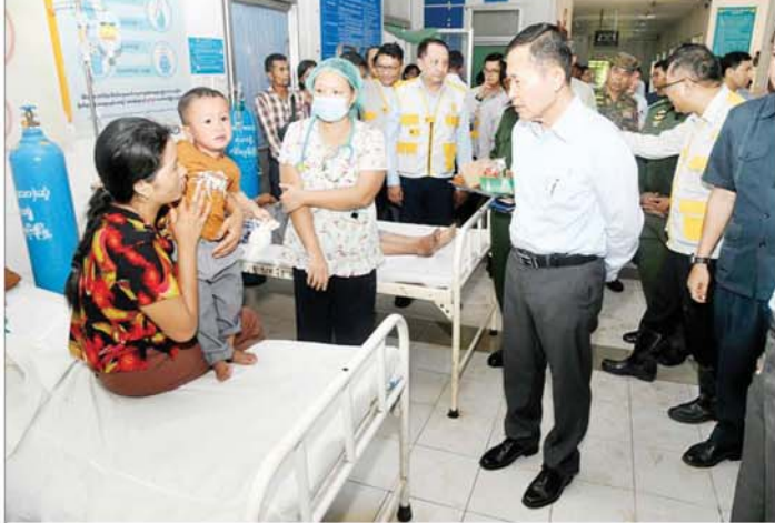
နိုင်ငံတော်စီမံအုပ်ချုပ်ရေးကောင်စီ ဒုတိယဥက္ကဋ္ဌ ဒုတိယဝန်ကြီးချုပ် ဒုတိယဗိုလ်ချုပ်မှူးကြီး စိုးဝင်း တပ်ကုန်းမြို့ အထွေထွေရောဂါကုဆေးရုံကြီး ဒုတင် (၁၀၀) ၌ တက်ရောက်ဆေးကုသမှုခံယူနေသူတစ်ဦးအား ရင်းရင်းနှီးနှီးအားပေးစကားပြောကြားစဉ်။

မြင့်တက်ခြင်းများ ဖြစ်ပေါ်သည် ကိုကြားသိရပါကြောင်း၊ ဆည်တစ် နှင့်ပတ်သက်၍ နေ့စဉ်စိုက်ပျိုး ရေး၊ မွေးမြူရေးနှင့် ဆည်မြောင်း ဝန်ကြီးဌာနက ရေဝင်ရောက်မှု၊ စိုးရိမ်ရမှု၊ မစိုးရိမ်ရမှုများကို နေ့စဉ် နိုင်ငံတော်စီမံအုပ်ချုပ်ရေး