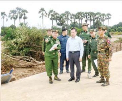
နိုင်ငံတော်စီမံအုပ်ချုပ်ရေးကောင်စီ ဒုတိယဥက္ကဋ္ဌ ဒုတိယဝန်ကြီးချုပ် ဒုတိယဗိုလ်ချုပ်မှူးကြီး စိုးဝင်း နဝင်းချောင်းတံတား (သာယာအေး) ယာယီဘေလိတ်တား တည်ဆောက်နေမှုကို ကြည့်ရှုစစ်ဆေးစဉ်။

နိုင်ငံတော်စီမံ အုပ်ချုပ်ရေး ကောင်စီ ဒုတိယဥက္ကဋ္ဌ ဒုတိယ ဝန်ကြီးချုပ် ဒုတိယဗိုလ်ချုပ်မှူး ကြီး စိုးဝင်းနှင့်အဖွဲ့ဝင်များသည် တပ်ကုန်းမြို့ရှိ ချမ်းမြေ့မြင်ရိပ်သာ ကျောင်းတိုက်သို့ သွားရောက်၍ ဆရာတော်ဘဒ္ဒန္တသီဟဉာဏအား ဖူးမြော်ကြည့်ညိကာ လှူဖွယ် ပစ္စည်းများ ဆက်ကပ်လှူဒါန်းပြီး အဆိုပါ ကျောင်းတိုက်တွင် ရောက်ရှိနေသည့် ရောက်ကုန်း၊ ကျားသေအိုင်၊ ပုန္နမာ သာယာကုန်း၊ ဆင်သေနှင့် ပိန္နဲကုန်းကျေးရွာများ ရှိ ရေဘေးသင့်ပြည်သူ ၅၀၀ ခန့် အား တွေ့ဆုံ၍ ပြန်လည်ထူထောင် ရေးလုပ်ငန်းများအတွက် လိုအပ် သည့်များ ကူညီဆောင်ရွက်ပေး