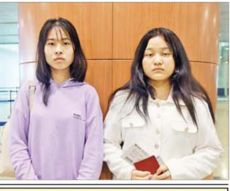
အသက်သည် သွေး၊ သွေးသည် အသက်။

ဝယ်ဆင်ဝေမျှခြင်း၊ အားပေးကူညီခြင်းများ ပြုလုပ်ခဲ့လျှင် အကြမ်းဖက်မှုတိုက်ဖျက်ရေးဥပဒေပုဒ်မ ၅၂(က)၊ ရာဇသတ်ကြီးပုဒ်မ ၁၂၄-ကနှင့် ပုဒ်မ ၅၅၅-က၊ အီလက်ထရောနစ်ဆက်သွယ် ဆောင်ရွက်ရေးဥပဒေပုဒ်မ ၃၃(က)နှင့် တည်ဆဲဥပဒေများအရ အရေးယူခံရမည့်အပြင် ပြစ်မှုနှင့်သက်ဆိုင်သည့် ရွှေပြောင်းနိုင်ငံသေပစ္စည်း၊ မရွှေပြောင်းနိုင်ငံသေပစ္စည်းများကို အကြမ်းဖက်မှုတိုက်ဖျက်ရေးဥပဒေအရ သိမ်းဆည်းခံရနိုင်ပြီး ပြစ်မှုထင်ရှားစီရင်ခြင်းခံရပါက နိုင်ငံတော်ဘဏ္ဍာအဖြစ် သိမ်းဆည်းခံရနိုင်ကြောင်း ၂၀၂၂ ခုနှစ် ဇန်နဝါရီ ၂၅ ရက်တွင် နိုင်ငံပိုင်မီဒီယာများမှတစ်ဆင့် အသိပေးသတင်းထုတ်ပြန်ခဲ့ပြီး ဖြစ်သည်။