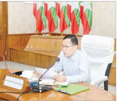
နိုင်ငံတော်စီမံအုပ်ချုပ်ရေးကောင်စီဒုတိယဥက္ကဋ္ဌ ဒုတိယဝန်ကြီးချုပ် ဒုတိယဗိုလ်ချုပ်မှူးကြီးစိုးဝင်း နေပြည်တော်ကောင်စီနယ်မြေအတွင်း ရေကြီးရေလျှံမှုများကြောင့် ပျက်စီးမှုများနှင့်ပတ်သက်၍ ပြန်လည်ထူထောင်ရေးလုပ်ငန်းများ ဆောင်ရွက်နိုင်ရန်အတွက် အမျိုးသားသဘာဝဘေးအန္တရာယ်ဆိုင်ရာစီမံခန့်ခွဲမှုကော်မတီ လုပ်ငန်းညှိနှိုင်း အစည်းအဝေးတွင် အမှာစကားပြောကြားစဉ်။