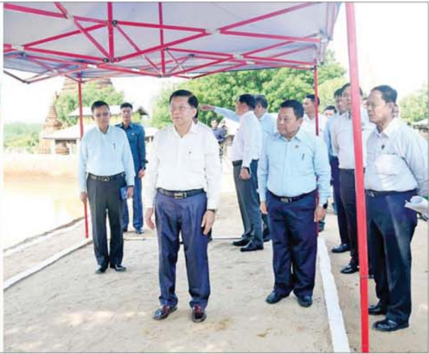
နိုင်ငံတော်စီမံအုပ်ချုပ်ရေးကောင်စီဥက္ကဋ္ဌ နိုင်ငံတော်ဝန်ကြီးချုပ် ဗိုလ်ချုပ်မှူးကြီးမင်းအောင်လှိုင် အရှေ့ဖွားစောကျေးရွာအနီးရှိ ဇေယျဝတီ(ဇယဝေရီ)ကန်ကို ကြည့်ရှုစစ်ဆေးစဉ်။