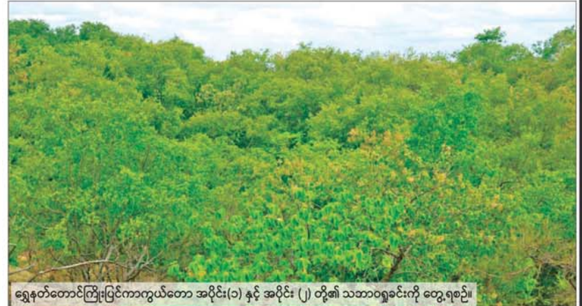
ရွှေနတ်တောင်ကြီးပြင်ကာကွယ်တော အပိုင်း(၁) နှင့် အပိုင်း (၂) တို့၏ သဘာဝရှုခင်းကို တွေ့ရစဉ်။

ထိန်းသိမ်းရေးဝန်ကြီးဌာနသည် အပူပိုင်းဒေသ၏ သဘာဝတောကျန်များအား ထိန်းသိမ်းခြင်းကြောင့် ပတ်ဝန်းကျင်ဒေသအား အပူချိန်လျော့နည်းကျဆင်းပြီး ပူပြင်းခြောက်သွေ့မှုကာကွယ်ရန်၊ ရာသီဥတု သာယာမှုတစ်စုံတစ်ရာ စီမံခန့်ခွဲမှု ပတ်ဝန်းကျင် ထိခိုက်ပျက်စီးမှုလျော့နည်းသက်သာစေရန်၊ မြေဆီလွှာတိုက်စားမှုများ တားဆီးကာကွယ်ရန်နှင့် အပူပိုင်းသစ်တောများ ထိန်းသိမ်းရန်ရည်ရွယ်၍ ကြီးပိုင်း/ ကြီးပြင်ကာကွယ်တောများ အဖြစ် ဖွဲ့စည်းသတ်မှတ်ခြင်းဖြစ်ပါသည်။ ရွှေနတ်တောင် ကြီးပြင်ကာကွယ်တောအပိုင်း(၁)နှင့်အပိုင်း(၂)သတ်မှတ်ခြင်းဖြင့် အဆိုပါဧရိယာအတွင်း ပေါက်ရောက်လျက်ရှိသော အပူပိုင်းဒေသ၏ ဒေသမျိုးရင်းသစ်မျိုးများဖြစ်သည့် သန်း၊ ဒဟတ်၊ ရှား၊ ထနောင်း၊ တမာ၊ ဆူးဖြူ၊ နတ် စသည်