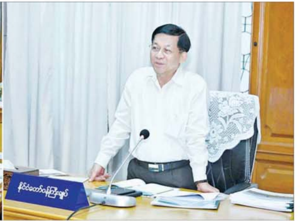
နိုင်ငံတော်စီမံအုပ်ချုပ်ရေးကောင်စီဥက္ကဋ္ဌ နိုင်ငံတော်ဝန်ကြီးချုပ် ဗိုလ်ချုပ်မှူးကြီး မင်းအောင်လှိုင် ညောင်ဦးခရိုင်အတွင်းရှိ ဌာနဆိုင်ရာတာဝန်ရှိသူများနှင့်တွေ့ဆုံ၍ ဒေသဖွံ့ဖြိုးတိုးတက်ရေးဆိုင်ရာများ ဆွေးနွေးစဉ်။