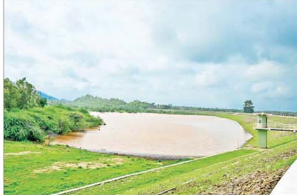
မြကန်ရေလှောင်တံမံ ပြုပြင်ပြီးစီးမှု(ဝဲပုံ)နှင့် ရေဝင်ရောက်နေမှု(ယာပုံ)ကို တွေ့ရစဉ်။