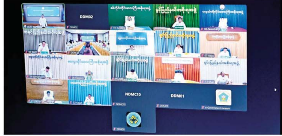
အမျိုးသား သဘာဝဘေးအန္တရာယ်ဆိုင်ရာစီမံခန့်ခွဲမှုကော်မတီ (၂/၂၀၂၄) အစည်းအဝေးတွင် တိုင်းဒေသကြီးနှင့် ပြည်နယ်ဝန်ကြီးချုပ် များနှင့် တာဝန်ရှိသူများက ဗီဒီယိုကွန်ဖရင့်စနစ်ဖြင့် တက်ရောက်စဉ်။

ကြောင်း၊ နိုင်ငံတော်အနေဖြင့် အလှူရှင်များ မရောက်နိုင်သည့် အချို့ ရေဘေးသင့်ယာယီကယ် ဆယ်ရေးစခန်းများ အပါအဝင် ယာယီ သဘာဝဘေးအန္တရာယ် ကယ်ဆယ်ရေးစခန်းများသို့လည်း ကျန်းမာရေးနှင့် ညီညွတ်သည့် အခြေခံအစားအစာ ငါးမျိုးနှင့် သောက်သုံးရေ ရရှိရေးအတွက် ပို့ဆောင်ပေးလျက်ရှိကြောင်း။ ရေဘေးသင့် ဒေသများရှိ ပြည်သူများအား သက်ဆိုင်ရာ ဒေသအလိုက် ဖွဲ့စည်းထားသည့် စီမံခန့်ခွဲမှုအဖွဲ့မှ တာဝန်ရှိသူ များက သွားရောက်အားပေးစကား ပြောကြားပြီး လိုအပ်ချက်များကို အဓိကထား၍ ပံ့ပိုးပေးသွားရမည် ဖြစ်ကြောင်း၊ ဆည်မြောင်းတာဝန် များနှင့်စပ်လျဉ်း၍ ပြည်သူများ စိုးရိမ်ပူပန်မှု မရှိစေရေး ရှင်းလင်း ပြောကြားရန်လိုကြောင်း၊ အမျိုး သား သဘာဝဘေးအန္တရာယ် ဆိုင်ရာ စီမံခန့်ခွဲမှုကော်မတီ အနေဖြင့် သဘာဝဘေးနှင့် ပတ်သက်၍ အတွေ့အကြုံရှိပြီးဖြစ် သည့်အတွက် နောက်ဆက်တွဲ ဆောင်ရွက်ရမည့် ကိစ္စရပ်များကို အကောင်းဆုံး ဖြေရှင်းဆောင်ရွက် ပေးနိုင်ရန် ပိုင်းဝန်းဆွေးနွေးပေး ကြရန်လိုကြောင်း၊ မိမိတို့နိုင်ငံ ဖြစ်ပွားစဉ်က လုပ်ငန်းကော်မတီ