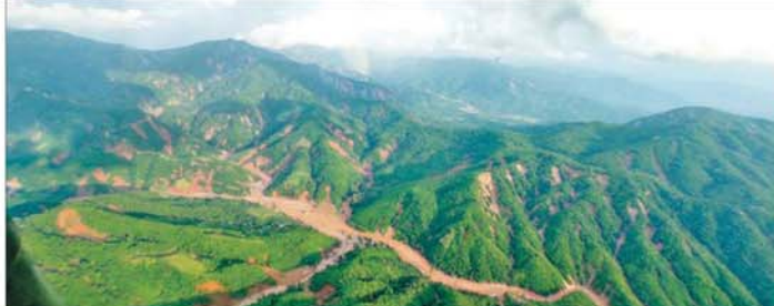
တောင်ကုန်းတောင်တန်းများပေါ်မှ ဖြတ်သန်းစီးဆင်းလာသည့် တောင်ကျချောင်းရေများ အရှိန်အဟုန်ဖြင့် စီးဆင်းခဲ့မှုကို တွေ့မြင်ရစဉ်။

အတွင်းရှိ မြို့နယ်အချို့တို့တွင် ရေကြီးရေလျှံမှုများဖြစ်ပေါ်ခဲ့မှု၏ ရေစီးဆင်းရာ အစဖြစ်သည့် ရှမ်းကုန်းပြင်မြင့်နှင့် ဆက်စပ်တောင်ကုန်းတောင်တန်းများပေါ်မှ ရေများစီးဆင်းတိုက်စားခဲ့မှုကြောင့် တောင်ပြို၊ မြေပြိုမှုများ ဖြစ်ပေါ်နေမှု၊ အဆိုပါ တောင်ကုန်းတောင်တန်းများပေါ်မှ ဖြတ်သန်းစီးဆင်းလာသည့် တောင်ကျချောင်းရေများသည် မှန်ချောင်း၊ နဝင်းချောင်း၊ ကင်းသာချောင်းတို့နှင့် ၎င်းချောင်းများ အားလုံးစုစည်း၍ စီးဝင်ရာ ဆင်သေချောင်း တစ်လျှောက်တို့၌ တောင်ကျချောင်းရေ အရှိန်အဟုန်ဖြင့် စီးဆင်းခဲ့မှုကြောင့် ရေတိုက်စားရာ လမ်းကြောင်းကြီးများဖြစ်ပေါ်နေမှုနှင့် ရေပြန်လည်ကျဆင်းသွားပြီး နောက် သဲနုန်းများ၊ အပျက်အစီးများ ဖြစ်ပေါ်ကျန်နေမှု စိုက်ဧကအများအပြား ပျက်စီးခဲ့မှုနှင့် ရေစီးဆင်းရာလမ်းကြောင်းနှင့် နီးစပ်သည့် အချို့သောကျေးရွာများ ရေဖုံးလွှမ်းခဲ့မှုဖြစ်ပေါ်ခဲ့ပြီး ထိုဒိုက်ပျက်စီးခဲ့မှုမှ အခြေအနေများကို ရဟတ်ယာဉ်ပေါ်မှ အသေးစိတ်ကြည့်ရှုစစ်ဆေးခဲ့ပြီး ပြန်လည်ထူထောင်ရေးလုပ်ငန်းများနှင့် သဘာဝဘေးအန္တရာယ်ကြိုတင်ကာကွယ်ရေးလုပ်ငန်းများ ဆက်လက်ဆောင်ရွက်ရမည့် အခြေအနေများနှင့် ပတ်သက်၍ တာဝန်ရှိသူများကို မှာကြားခဲ့ကြောင်း သိရသည်။ သတင်းစဉ်