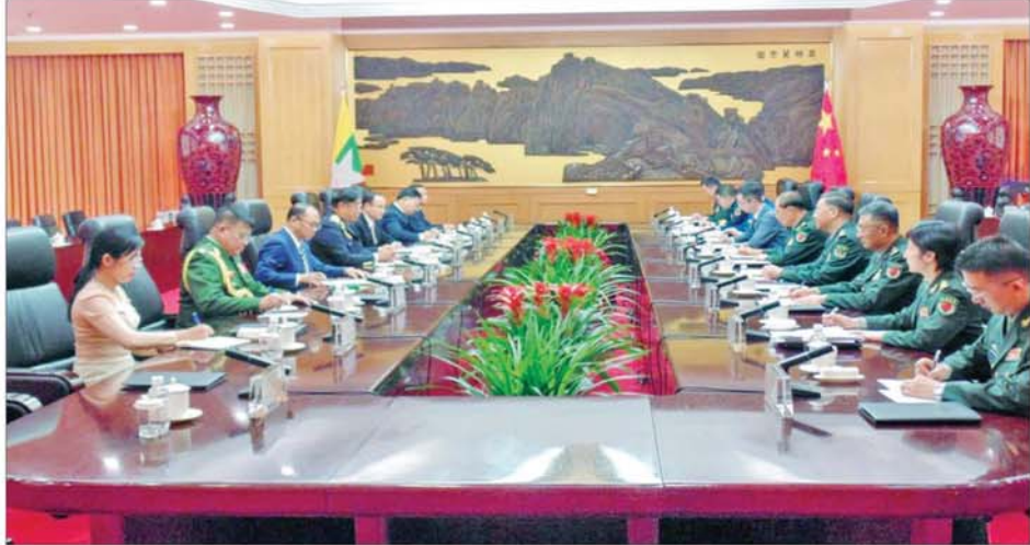
တရုတ်-မြန်မာ နှစ်နိုင်ငံတွေ့ဆုံဆွေးနွေးပွဲ ကျင်းပစဉ်။

ခရီးစဉ်အတွင်း မြန်မာကိုယ်စား လှယ်အဖွဲ့သည် တရုတ်နိုင်ငံ ပေကျင်းမြို့အခြေစိုက် အဆင့်မြင့် စက်မှုနှင့် ပညာဆိုင်ရာ ကုမ္ပဏီ များသို့ သွားရောက်လေ့လာခဲ့ပြီး လေကြောင်း နည်းပညာဆိုင်ရာ ခေတ်မီထုတ်ကုန်များ၊ မောင်းသုံး