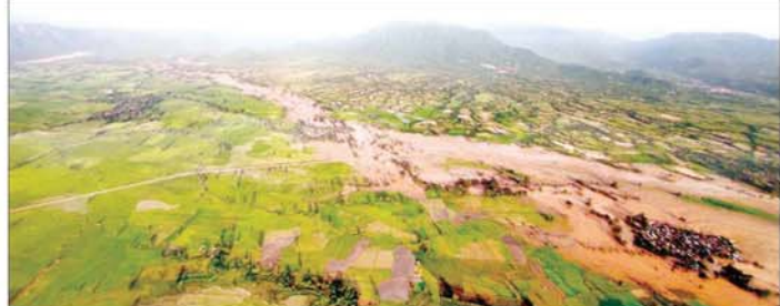
ရေတိုက်စားရာလမ်းကြောင်းတစ်လျှောက် ရေဖုံးလွှမ်းမှုများနှင့် ရေပြန်လည်ကျဆင်းသွားပြီးနောက် သဲနုန်းများ၊ အပျက်အစီးများ ဖြစ်ပေါ်နေမှုကို တွေ့မြင်ရစဉ်။