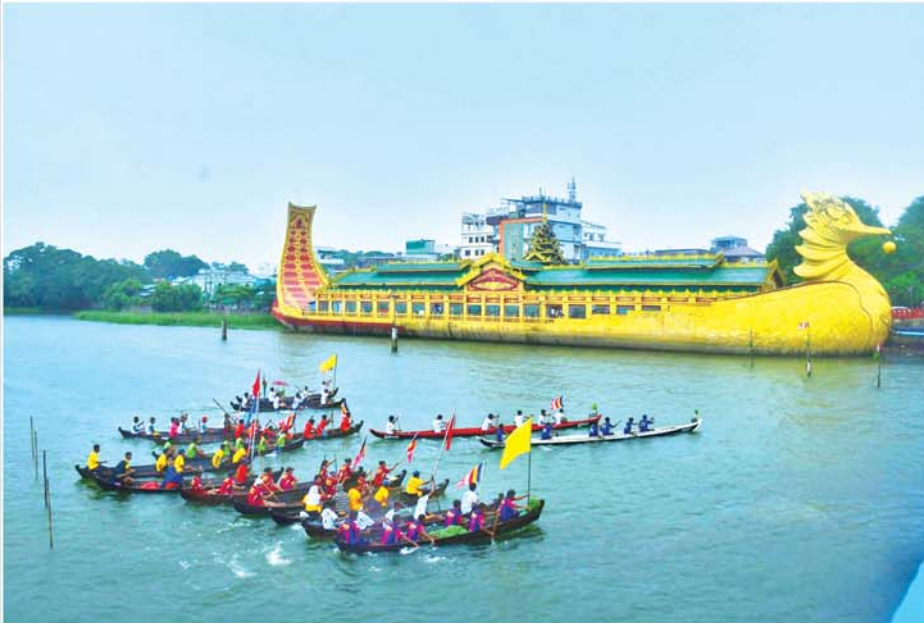
ဂရုဓမ္မအခါတော်နေ့

ဆရာတော် ဦးပညာသာဓိ(မာဂဓိ-သာစည်)ရေးသားစီရင်တော် မူသော 'ဗုဒ္ဓဘာသာဝင်တို့၏ အခါတော်နေ့ကြီးများ' ကျမ်းတွင် မြန်မာ့တစ်နှစ်တာ ဆယ့်နှစ်လတွင် ဗုဒ္ဓဘာသာဝင်တို့ ရှေးကပင် အဆက်မပြတ် အလေးဂရုထား ပြုလုပ်ခဲ့ကြသည့် အခါတော်နေ့ကြီး ၁၃ နေ့အကြောင်း ဖော်ပြထားသည်။ ဤ တော်သလင်းလပြည့်နေ့တွင် 'ဂရုဓမ္မအခါတော်နေ့'ကို မြို့ပြရော ကျေးလက်ပါ မကျန် ဗုဒ္ဓဘာသာဘုန်းတော်ကြီးကျောင်းများ၊ တန်ခိုးကြီးစေတီပုထိုးတော်ကြီးများတွင် အထူးစည်ကားစွာ ဘာသာတရားကိုင်းရှိုင်းစွာဖြင့် ယနေ့တိုင် ကျင်းပပြုလုပ်ဆဲပင် ဖြစ်သည်။