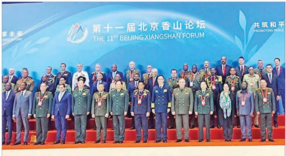
နိုင်ငံတော်စီမံအုပ်ချုပ်ရေးကောင်စီဝင် ဒုတိယဝန်ကြီးချုပ်နှင့် ပြည်ထောင်စုဝန်ကြီး ဗိုလ်ချုပ်ကြီး တင်အောင်စန်း (၁၁) ကြိမ်မြောက် ပေကျင်း ရှန်ကျန်းဖိုရမ်သို့ တက်ရောက်လာကြသူများနှင့်အတူ စုပေါင်းမှတ်တမ်းတင်ဓာတ်ပုံရိုက်စဉ်။

စိုးမိုးရေး၊ ကာကွယ်ရေးဆိုင်ရာ နယ်ပယ်ကဏ္ဍနှင့် ပူးပေါင်းဆောင် ရွက်မှုများတိုးမြှင့်ရေး၊ နှစ်နိုင်ငံ ဆွေမျိုးပေါက်ဖော် ချစ်ကြည်