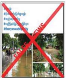
ရိုကြောင်း သိရသည်။ အဆိုပါ သတင်းနှင့်ပတ်သက်၍ သက်ဆိုင်ရာ ဆည်မြောင်းဦးစီး

ပဲခူးတိုင်းဒေသကြီး(အနောက်) သာယာဝတီခရိုင် ဇီးကုန်းမြို့နယ် တွင် မိုးအဆက်မပြတ် ရွာသွန်းမှုကြောင့် ဘော်ဘင်ရေလျှောင့်တစ် ရေပြည့်လျှံ၍ ဆည်ရေဖောက်ချမှုကြောင့် ရေကြီးနစ်မြုပ်မှုများ ဖြစ်ပွားနေသည်ဟု မဟုတ်မမှန်သတင်းများအား တရားမဝင် ပြည်ဖျက်ပြည်ဖျက်မီဒီယာ Tharyarwaddy 8 City က ရေးသားထုတ်ဝေလျက်