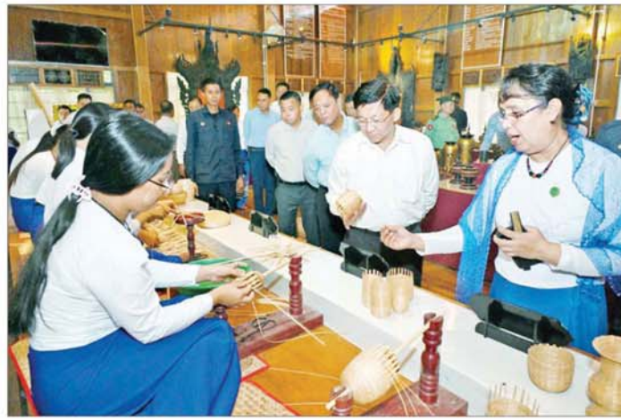
နိုင်ငံတော်စီမံအုပ်ချုပ်ရေးကောင်စီဥက္ကဋ္ဌ နိုင်ငံတော်ဝန်ကြီးချုပ် ဗိုလ်ချုပ်မှူးကြီး မင်းအောင်လှိုင် ယွန်းညောကောလိပ်၌ သင်တန်းသား သင်တန်းသူများ၏ ယွန်းနည်းစဉ်အဆင့်ဆင့်အား လက်တွေ့ ဆောင်ရွက်နေမှုကို ကြည့်ရှုလေ့လာစဉ်။

၁၇ စာမျက်နှာ ၄ မှ ယခုရက်ပိုင်းအတွင်း နိုင်ငံတစ်ဝန်း မိုးများ သည်းထန်စွာရွာသွန်းခဲ့ပြီး ရေကြီးရေလျှံမှုများ ဖြစ်ပေါ်ခဲ့စဉ် သောင်ဦးခရိုင်အနေဖြင့် ထိခိုက်မှု အနည်းငယ်သာရှိခဲ့သည်ကို တွေ့ရ ကြောင်း၊ အလားတူ လမ်းညွှန် အမှတ်အသားများ ကိုလည်း သတိမှတ်ထားသည့် အင်္ဂါရပ်များ အတိုင်း စနစ်တကျဖြင့် ဆောင်ရွက် ထားရှိရန်လိုကြောင်း ဖြည့်စွက် မှုကြားသည်။