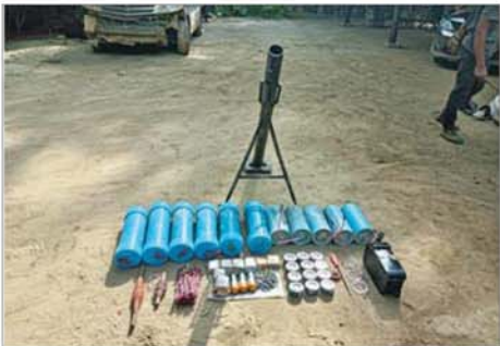
တောင်သာမြို့ သာယာကြီးကျေးရွာတွင် အကြမ်းဖက်သမားများ၏ လက်နက်၊ ခဲယမ်းနှင့် အကြမ်းဖက်ပစ္စည်းများ ဖမ်းဆီးရရှိသည့် မှတ်တမ်းဓာတ်ပုံ။

ထပ်မံဖြည့်တင်း တုံ့ပြန်လာသည့် အတွက် လေကြောင်းပစ်ခတ်မှုရယူ၍ ချေမှုန်းခဲ့ရာ ပစ်ခတ်မှုများ ညနေပိုင်းတွင် ပြီးဆုံးခဲ့သည်။ ဖြစ်စဉ်တွင် အကြမ်းဖက်အဖွဲ့များ ထိခိုက်သေဆုံးဒဏ်ရာအများအပြားဖြင့် သာယာကြီးရွာအတွင်း မှ တောင်ဘက်နှင့်အနောက်ဘက်များသို့ ဖရိုဖရဲဆုတ်ခွာထွက်ပြေး