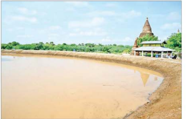
ဇေယျဝတီ(ဇယဝေရီ)ကန် ပြုပြင်ပြီးစီးမှု(ဝဲပုံ)နှင့် ရေဝင်ရောက်နေမှု(ယာပုံ)ကို တွေ့ရစဉ်။

ရှေးဟောင်းယဉ်ကျေးမှုနယ်မြေ သို့လာရောက်စဉ် ပုဂံဒေသ စိမ်းလန်းစိုပြည်ရေးနှင့် ရေဝင် ရေထွက် ကောင်းမွန်စေရေး အတွက် လမ်းညွှန်မှာကြားချက် များအား အကောင်အထည်ဖော် ဆောင်ရွက်ပြီးစီးမှု အခြေအနေ များ၊ မြကန်ရေလှောင်တံမံဆိုင်ရာ အချက်အလက်များနှင့် ခေတ် အဆက်ဆက် ပြုပြင်ထိန်းသိမ်း ဆောင်ရွက်ခဲ့သည့် အခြေအနေ များ၊ မြကန်တံမံအား ဘူမိရူပဗေဒ ဆိုင်ရာ စူးစမ်းလေ့လာမှုများအရ ရေစိမ့်ယိုမှုအနည်းငယ်နှင့် ရေငွေ့ ပြန်မှု များပြားခြင်းတို့ကြောင့် ရေသိုလှောင်ထားနိုင်မှု နည်းပါး လျက်ရှိသည်ကို တွေ့ရှိရသည့် အတွက် လိုအပ်သည့် ပြုပြင် ထိန်းသိမ်းမှုများနှင့် ရေဝင်လမ်း