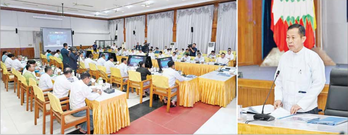
နိုင်ငံတော်စီမံအုပ်ချုပ်ရေးကောင်စီ ဒုတိယဥက္ကဋ္ဌ ဒုတိယဝန်ကြီးချုပ် ဒုတိယဗိုလ်ချုပ်မှူးကြီးစိုးဝင်း အမျိုးသားသဘာဝဘေးအန္တရာယ်ဆိုင်ရာ စီမံခန့်ခွဲမှုကော်မတီအစည်းအဝေး (၂/၂၀၂၄)သို့ တက်ရောက်အမှာစကားပြောကြားစဉ်။

နေပြည်တော် စက်တင်ဘာ ၁၆ အမျိုးသား သဘာဝဘေး အန္တရာယ်ဆိုင်ရာ စီမံခန့်ခွဲမှု ကော်မတီအစည်းအဝေး (၂/၂၀၂၄) ကို ယနေ့မနက် ၉ နာရီခွဲတွင် နေပြည်တော်ရှိ လူမှုဝန်ထမ်း၊ ကယ်ဆယ်ရေးနှင့် ပြန်လည်နေရာ ချထားရေးဝန်ကြီးဌာန စုပေါင်း ခန်းမ၌ ကျင်းပရာ အမျိုးသား သဘာဝဘေးအန္တရာယ်ဆိုင်ရာ စီမံခန့်ခွဲမှုကော်မတီဥက္ကဋ္ဌ နိုင်ငံ တော်စီမံအုပ်ချုပ်ရေး ကောင်စီ ဒုတိယဥက္ကဋ္ဌ ဒုတိယဝန်ကြီးချုပ် ဒုတိယဗိုလ်ချုပ်မှူးကြီး စိုးဝင်း တက်ရောက် အမှာစကားပြော ကြားသည်။ အခမ်းအနားသို့ ကော်မတီအဖွဲ့ ဝင် ပြည်ထောင်စုဝန်ကြီးများ၊ စာမျက်နှာ ၆ သို့ *