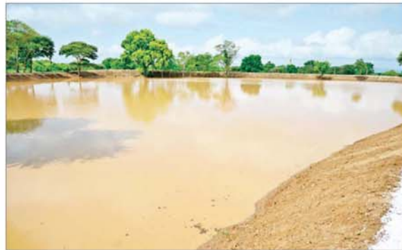
မင်္ဂလာကန် အမှတ် (၃) (မွန်းတိမ်းကန်) ပြုပြင်ပြီးစီးမှု(ဝဲပုံ)နှင့် ရေဝင်ရောက်နေမှု(ယာပုံ)ကို တွေ့ရစဉ်။

»» စာမျက်နှာ ၃ မှ အမှတ်(၃) (မွန်းတိမ်းကန်) အတွင်း ရေဝင်ရောက်မှု အခြေ အနေများကို သွားရောက်ကြည့်ရှု စစ်ဆေးရာ တာဝန်ရှိသူများက ရေဝင်ရောက်လျက်ရှိမှု အခြေ အနေများကို ရှင်းလင်းတင်ပြ သည်။