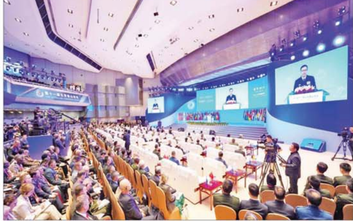
(၁၁) ကြိမ်မြောက် ပေကျင်း ရှန်ကျန်းဖိုရမ် ကျင်းပစဉ်။

Xiangshan Forum ဖွင့်ပွဲအခမ်း အနားနှင့် မျက်နှာစုံညီအစည်း အဝေးသို့ ပါဝင်တက်ရောက်ခဲ့ သည်။ ဖွင့်ပွဲအခမ်းအနားတွင် တရုတ် ပြည်သူ့သမ္မတနိုင်ငံ သမ္မတ မစ္စတာ ရှီကျင်ဖျင်က ပေးပို့သော သဝဏ် လွှာကို ဖတ်ကြားပြီး တရုတ် အမျိုးသားကာကွယ်ရေးဝန်ကြီး ဌာန ဝန်ကြီး ဗိုလ်ချုပ်ကြီး တွန်ကျွင်း (Admiral Dong Jun)က အဖွင့် အမှာစကား ပြောကြားခဲ့သည်။ ဗိုလ်ချုပ်ကြီးဟဲဝေတန်နှင့် တွေ့ဆုံ ထိုနောက် နိုင်ငံတော်စီမံအုပ်ချုပ် ရေးကောင်စီအဖွဲ့ဝင် ဒုတိယ ဝန်ကြီးချုပ်နှင့် ပြည်ထောင်စု ဝန်ကြီးသည် ပေကျင်းမြို့ ပိုင်ယီ ခန်းမ (Bayi Hall)၌ တရုတ် ပြည်သူ့သမ္မတနိုင်ငံ ဗဟိုစစ် ကော်မရှင် ဒုတိယဥက္ကဋ္ဌ ဗိုလ်ချုပ် ကြီး ဟဲဝေတန် (General He Weidong)နှင့် တွေ့ဆုံ နှစ်နိုင်ငံ နယ်စပ်ဒေသများ တည်ငြိမ် အေးချမ်းရေးနှင့် တရားဥပဒေ