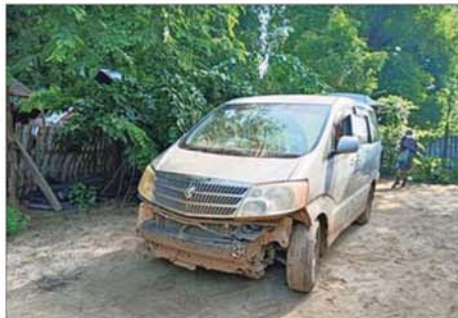
တောင်သာမြို့ သာယာကြီးကျေးရွာတွင် အကြမ်းဖက်သမားများ အသုံးပြုသည့် မော်တော်ယာဉ်များအား ဖမ်းဆီးရရှိသည့် မှတ်တမ်းဓာတ်ပုံ။

လိုအပ်သည့် ကူညီပံ့ပိုးမှုများ အပြည့်အဝ ပူးပေါင်းကူညီ ဆောင်ရွက်လျက် ရှိကြောင်းနှင့် တပ်မတော် စစ်ကြောင်းများမှ လည်း အကြမ်းဖက်အဖွဲ့အစည်းများ၏ မတရားနှိပ်စက်ညှဉ်းပန်း၍ ဆက်ကြေးကောက်၊ လူသတ်၊ ပြန်ပေးဆွဲလုပ်ရပ်များ ခံစားရသည့် ကျေးရွာများသို့ ကိုယ်တိုင်