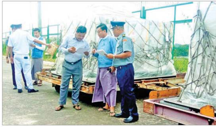
ရောက်ရှိလာသောကယ်ဆယ် ရေးပစ္စည်းများကို တာဝန်ရှိသူ များ စစ်ဆေးလက်ခံစဉ်။

သ မျိုး ပါဝင်သော ကယ်ဆယ်ရေး ပစ္စည်း ၅၅၆၀ ကီလိုဂရမ် ရောက်ရှိ ခဲ့ခြင်းဖြစ်သည်။ ထိုသို့ AHA Centre မှ မြန်မာ နိုင်ငံသို့ ပို့ဆောင်လှူဒါန်းသော ကယ်ဆယ်ရေး ပစ္စည်းများကို ရေဘေးဒဏ်သင့် ဒေသများသို့ ဆက်လက် ပြန်ပို့ဆောင်လှူဒါန်း သွားမည်ဖြစ်ကြောင်း သိရသည်။