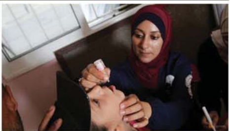
စက်တင်ဘာ ၁၆ ရက်က ၉၀ ရာခိုင်နှုန်းအထိ ပြီးစီးနေပြီ ဆိုသော ဂါဇာကမ်းမြောင်းဒေသမှကလေးငယ်များ ဝိုလီယိုအစကံချ ကာကွယ်ဆေးတိုက်ကျွေးမှုကို တွေ့ရစဉ်။ Mon