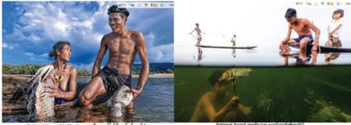
National Honorable Mention ဆုရရှိသည့် ပြည်ထောင်စုအဖွဲ့၏ဓာတ်ပုံ National Award ဆုရရှိသည့် ဓာတ်ပုံ၏ဓာတ်ပုံ