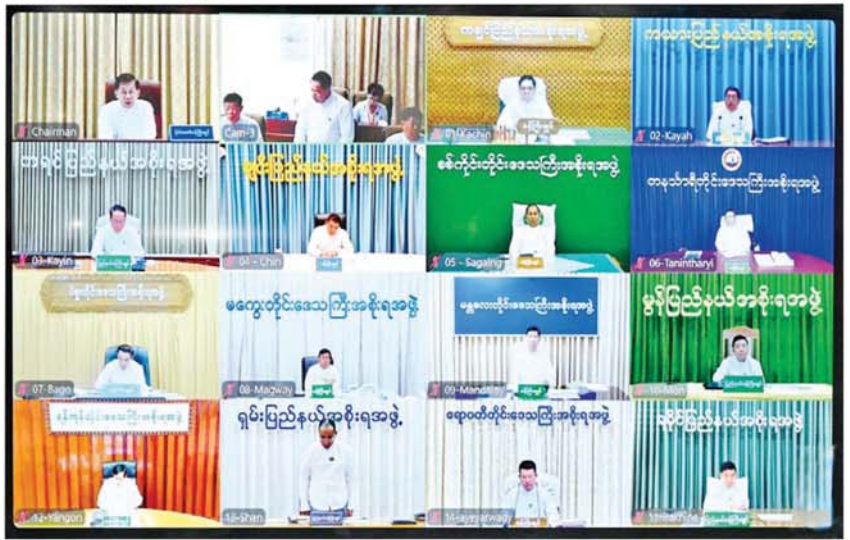
သဘာဝဘေးအန္တရာယ်စီမံခန့်ခွဲမှုဆိုင်ရာအစည်းအဝေးသို့ တိုင်းဒေသကြီးနှင့် ပြည်နယ်ဝန်ကြီးချုပ်များက ဝီဒီယိုထုန်းပရင့် ဖြင့် တက်ရောက်စဉ်။

အမျိုးသား သဘာဝဘေးအန္တရာယ် ဆိုင်ရာ စီမံခန့်ခွဲမှုကော်မတီ ဒုတိယဥက္ကဋ္ဌများ၊ ကော်မတီဝင်များနှင့် တာဝန်ရှိသူများက ရှင်းလင်းတင်ပြ ယင်းနောက် အမျိုးသားသဘာဝဘေး အန္တရာယ်ဆိုင်ရာ စီမံခန့်ခွဲမှုကော်မတီ ဒုတိယဥက္ကဋ္ဌ(၁) ကောင်စီဝင် ပြည်ထောင်စု ဝန်ကြီးဌာန ပြည်ထောင်စုဝန်ကြီးနှင့် ကော်မတီ ဒုတိယဥက္ကဋ္ဌ(၂) လူမှုဝန်ထမ်း၊