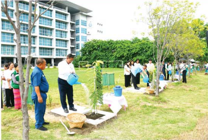
မန္တလေး စက်တင်ဘာ ၁၇

မန္တလေးအခြေစိုက် အိန္ဒိယနိုင်ငံကောင်စစ်ဝန်ချုပ်ရုံး၏ သဘာဝပတ်ဝန်းကျင်နှင့် မိခင်ကမ္ဘာမြေကြီးအား ထိန်းသိမ်းရေး(One-day Special Planting Campaign) အစီအစဉ်ဖြင့် ကျင်းပသည့် သစ်ပင်စိုက်ပျိုးပွဲတော်အခမ်းအနားကို ချမ်းမြသာစည်မြို့နယ်၊ ၇၃ လမ်း၊ ၁၀၇ လမ်းနှင့် ၁၀၈ လမ်းကြားရှိ မြန်မာသတင်းအချက်အလက်နည်းပညာတက္ကသိုလ်(MIIT) ကျောင်းဝင်းအတွင်း၌ ကျင်းပသည်။