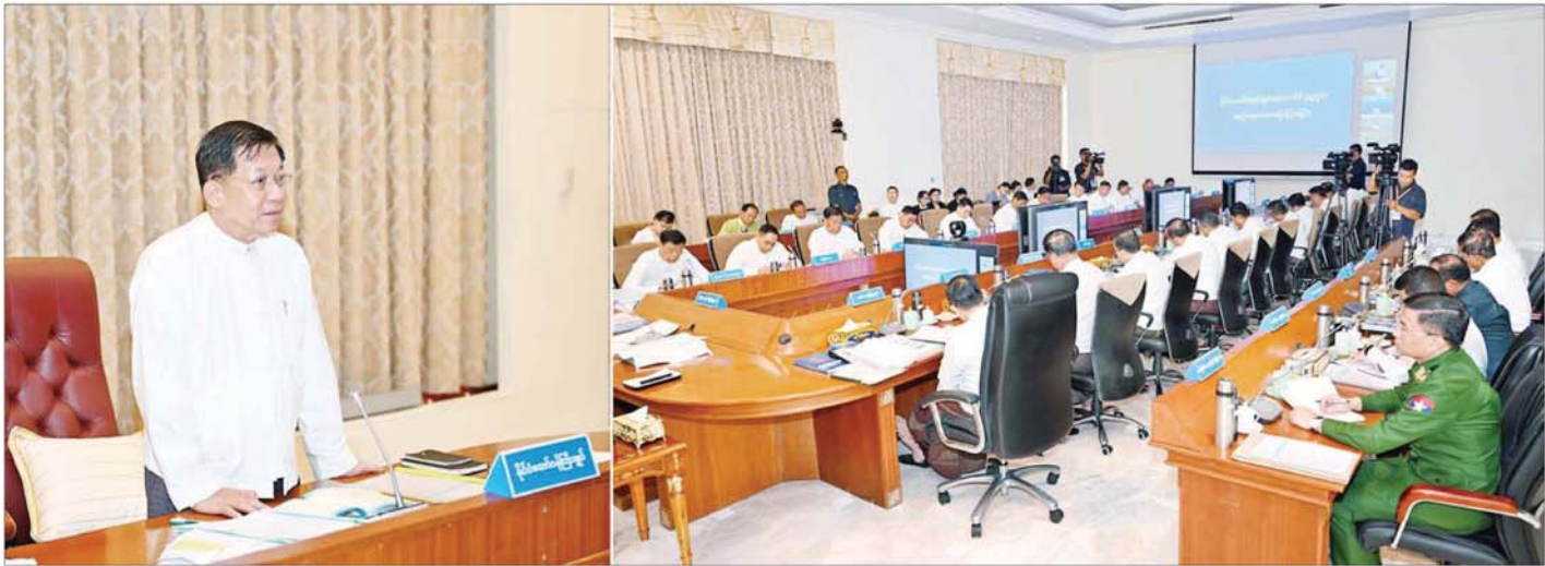
နိုင်ငံတော်စီမံအုပ်ချုပ်ရေးကောင်စီဥက္ကဋ္ဌ နိုင်ငံတော်ဝန်ကြီးချုပ် ဗိုလ်ချုပ်မှူးကြီးမင်းအောင်လှိုင် သဘာဝဘေးအန္တရာယ် စီမံခန့်ခွဲမှုဆိုင်ရာအစည်းအဝေးတွင် အမှာစကားပြောကြားစဉ်။