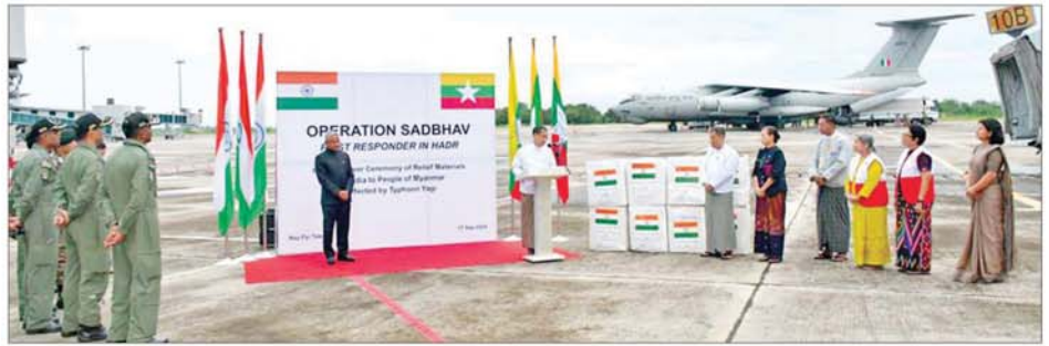
မြန်မာနိုင်ငံ ရေဘေးဒဏ်သင့်ဒေသများအတွက် အိန္ဒိယနိုင်ငံအစိုးရက ပေးပို့သည့် လူသားချင်းစာနာထောက်ထားမှုအကူအညီပစ္စည်း များ လွှဲပြောင်းပေးအပ်ခြင်းအခမ်းအနား ကျင်းပစဉ်။

ဝန်ကြီးဌာန (၂) ပြည်ထောင်စု ဝန်ကြီး ဦးကိုလှိုင်၊ လူမှုဝန်ထမ်း၊ ကယ်ဆယ်ရေးနှင့် ပြန်လည်နေရာ ချထားရေးဝန်ကြီးဌာနမှ အမြဲတမ်း နှင့် တာဝန်ရှိသူများ၊ နိုင်ငံခြားရေး ဝန်ကြီးဌာနမှ တာဝန်ရှိသူများ၊ မြန်မာနိုင်ငံ ကြက်ခြေနီအသင်း နှင့် မြန်မာနိုင်ငံဆိုင်ရာ အိန္ဒိယ နိုင်ငံသံရုံးမှ တာဝန်ရှိသူများ တက်ရောက်ကြသည်။