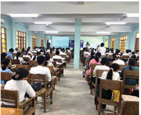
အကြောင်းအရာဆိုင်ရာ မေးခွန်းအလိုက် စာတွေ့လက်တွေ့ သင်ကြားပို့ချသွားမည်ဖြစ်ပြီး သင်တန်းသား ၁၂၉ ဦး တက်ရောက်ခဲ့ကြောင်း သိရသည်။ (၀၇၂)

၎င်းသင်တန်းအား စက်တင်ဘာ ၂၈ ရက်အထိ နေ့စဉ် နံနက် ၉ နာရီမှ ညနေ ၄ နာရီအထိ ဖွင့်လှစ်သွားမည်ဖြစ်ပြီး သန်းခေါင်စာရင်းလုပ်ငန်းစဉ်များ၊ စာရင်းစစ်စာရင်းကောက်များ၏ အခန်းကဏ္ဍနှင့် တာဝန်များ၊ ဥပဒေပြဋ္ဌာန်းချက်များ၊ လူဦးရေနှင့် အိမ်