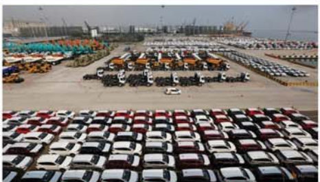
အင်ဒိုနီးရှားနိုင်ငံ၏ ပို့ကုန်ပမာဏမြင့်တက်လာ ဩဂုတ်လအတွင်း ခုနစ်ရာခိုင်နှုန်းထက်ကျော်လွန်ခဲ့

ဂျပာန် စက်တင်ဘာ ၁၇ အင်ဒိုနီးရှားနိုင်ငံ၏ ပို့ကုန် ပမာဏ မြင့်တက်လာရာ ဩဂုတ် လအတွင်း ခုနစ်ရာခိုင်နှုန်းထက် ကျော်လွန်ကျော်ရန်ရှိခဲ့ ကြောင်း ဖော်ပြသည်။ ယင်းပြည်ပပို့ကုန်၏ တန်ဖိုးသည် အမေရိကန်ဒေါ်လာ ၂၃ ဒသမ ၅၆ ဘီလျံရှိကြောင်း အစိုးရစာရင်းအင်းဌာနက ထွက်ချက်အစီရင်ခံစာသည်။ ယမန်နှစ် ဩဂုတ်လက ထက် ပို့ကုန်ပမာဏ ၇ ဒသမ ၁၃ ရာခိုင်နှုန်း မြင့်တက်ခဲ့ခြင်း ဖြစ်သည်ဟု အင်ဒိုနီးရှားအစိုးရ ပြောခွင့် ရသူက အတည်ပြု ကြောင်း သိရသည်။ Mon