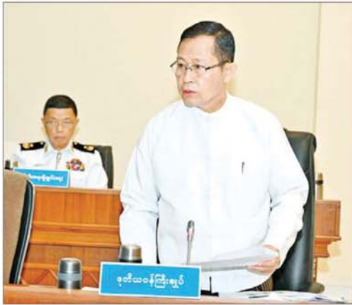
နိုင်ငံတော်စီမံအုပ်ချုပ်ရေးကောင်စီ ဒုတိယဥက္ကဋ္ဌ ဒုတိယဝန်ကြီးချုပ် ဒုတိယဗိုလ်ချုပ်မှူးကြီး စိုးဝင်း ဆွေးနွေးတင်ပြစဉ်။

၀ ရှေ့မှပု အစည်းအဝေးသို့ အမျိုးသားသဘာဝဘေးအန္တရာယ်ဆိုင်ရာ စီမံခန့်ခွဲမှုကော်မတီဥက္ကဋ္ဌ နိုင်ငံတော်စီမံအုပ်ချုပ်ရေးကောင်စီ ဒုတိယဥက္ကဋ္ဌ ဒုတိယဝန်ကြီးချုပ် ဒုတိယဗိုလ်ချုပ်မှူးကြီး စိုးဝင်း၊ အမျိုးသားသဘာဝဘေးအန္တရာယ်ဆိုင်ရာစီမံခန့်ခွဲမှုကော်မတီ ဒုတိယဥက္ကဋ္ဌ(၁) ကောင်စီဝင် ပြည်ထောင်စုဝန်ကြီးဌာန ပြည်ထောင်စုဝန်ကြီး ဒုတိယဗိုလ်ချုပ်ကြီး ရာပြည့်၊ အမျိုးသားသဘာဝဘေးအန္တရာယ်ဆိုင်ရာ စီမံခန့်ခွဲမှုကော်မတီ ဒုတိယဥက္ကဋ္ဌ(၂) လူမှုဝန်ထမ်း၊ ကယ်ဆယ်ရေးနှင့် ပြန်လည်နေရာချထားရေးဝန်ကြီးဌာန ပြည်ထောင်စုဝန်ကြီး ဒေါက်တာစိုးဝင်း၊ အမျိုးသားသဘာဝဘေးအန္တရာယ်ဆိုင်ရာ စီမံခန့်ခွဲမှုလုပ်ငန်းကော်မတီဥက္ကဋ္ဌများ ဖြစ်ကြသည့် ပြည်ထောင်စုဝန်ကြီးများ၊ အမျိုးသားသဘာဝဘေးအန္တရာယ်ဆိုင်ရာ စီမံခန့်ခွဲမှုကော်မတီအဖွဲ့ဝင်များ ဖြစ်ကြသည့် နေပြည်တော်ကောင်စီဥက္ကဋ္ဌ ဒုတိယ