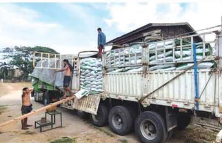
၂၀၂၄-၂၀၂၅ ဘဏ္ဍာရေးနှစ်တွင် မြေဩဇာတန်ချိန် ၁ ဒသမ ၆ သန်းကျော် ပြည်ပမှ တင်သွင်းရန်လျာထား

မြန်မာနိုင်ငံတွင် ကော်ဖီ တန်ချိန် ၇၀၀၀ ဝန်းကျင်သာ ရှိသောကြောင့် စိုက်ဧကများ အထွက်နှုန်းတိုးအောင် စိုက်ပျိုးသင့်သလို အသစ်စိုက်ပျိုးမှုများ တိုးချဲ့စိုက်ပျိုးသင့်သည်။ ကော်ဖီဈေးကွက် အလားလားကောင်းများ ရှိသောကြောင့် ကော်ဖီစိုက်ပျိုးမြေသစ်များ ရရှိရန်နှင့် ပိုင်ဆိုင်မှုခိုင်မာစွာ ဆောင်ရွက်ပေးနိုင်မှသာ နှစ်ရှည်ရင်းနှီးမြှုပ်နှံ လုပ်ကိုင်နိုင်မှာ ဖြစ်သည်။ လက်ရှိမှာ ကော်ဖီစိုက်ပျိုးဒေသများတွင် ရေကြီး၊ မြေမြို့မှုများ ဖြစ်ပွားခဲ့သောကြောင့် လာမည့်ကော်ဖီရာသီတွင် ကော်ဖီထွက်ရှိမှု အနည်းငယ်ကျဆင်းနိုင်သော်လည်း တိုးချဲ့စိုက်ပျိုးမှုများ ကြောင့် ယခင်ထွက်ရှိမှု ပမာဏ ခန့် ထွက်ရှိနိုင်မည်ဖြစ်ကြောင်း သိရသည်။