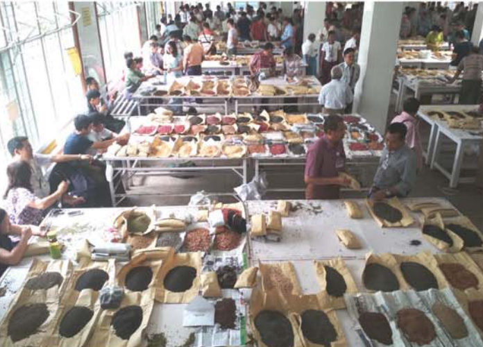
ရွှေမန်း

အနည်းငယ်ဈေးမြင့်တက်လာရာ ကုလားပဲ V2 တစ်အိတ်လျှင် ငွေကျပ် ၃၁၅၀၀၀-၃၁၇၀၀၀၊ ကုလားပဲ V7 တစ်အိတ်လျှင် ငွေကျပ် ၃၄၅၀၀၀၊ ထိုင်ဝမ် ကုလားပဲ တစ်အိတ်လျှင် ငွေကျပ် ၂၅၅၀၀၀၊ ၂၄၂၀ ကုလားပဲတစ် အိတ်လျှင် ငွေကျပ် ၂၅၅၀၀၀ ပေါက်ဈေး ဖြစ်လာသည်။ မိုးမြေပဲနှင့် နှမ်းမျိုးစုံ ဈေး ကျဆင်းမှုရှိသော်လည်း ပြည်တွင်း သုံး ပဲမာလိုင်များ ဈေးတည် ငြိမ်နေရာ စက်တင်ဘာ ၁၉ ရက် တွင် ပဲကြီးတစ်အိတ်လျှင် ငွေကျပ် ၂၅၀၀၀၀၊ ပဲထောပတ် တစ်အိတ် လျှင် ငွေကျပ် ၄၃၀၀၀၀၊ ပဲပုပ် (ရှမ်း)တစ်အိတ်လျှင် ငွေကျပ် ၃၉၀၀၀၀၊ မြေထောက်ပဲ တစ် အိတ်လျှင် ငွေကျပ် ၃၆၅၀၀၀၊ ကျွန်းစားတော်ပဲ တစ်အိတ်လျှင် ငွေကျပ် ၄၀၀၀၀၀ပေါက်ဈေးရှိနေ ပြီး မြေပဲအနီလုံးဆန် တစ်ပိဿာ လျှင် ငွေကျပ် ၈၅၀၀-၉၀၀၀ ပေါက်ဈေးရှိနေပြီး မြေပဲအနီလုံးဆန် တစ်ပိဿာ လျှင် ငွေကျပ် ၁၇၀၀၀ ပေါက်ဈေး ရှိနေသည်။ နှမ်းဈေးကွက်တွင် အက်စစ် ပါဝင်မှု အရည်အသွေးအပေါ် မူတည်ရာ စက်တင်ဘာ ၁၉ ရက်