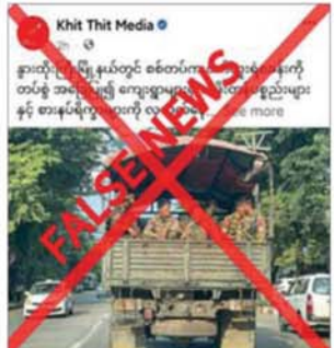
များအပေါ် ပြည်သူများ အထင်အမြင်လွှဲများ စေရန် မဟုတ်မမှန် လုပ်ကြံရေးသားနေခြင်း သာဖြစ်ကြောင်း သတင်းရရှိသည်။

တရားမဝင်ပြည်ဖျက်မီဒီယာများက PDF အမည်ခံအကြမ်းဖက်သမား၏ လက်နက်ကြီး ပစ်ခတ်မှုကြောင့် နေအိမ်များထိခိုက်ပျက်စီး သွားခဲ့သည်ကို ဖုံးကွယ်ပြီး လုံခြုံရေးတပ်ဖွဲ့ဝင်