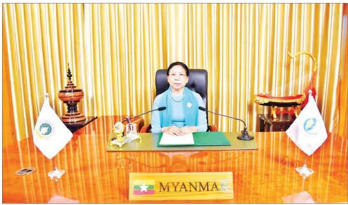
နိုင်ငံတော်စီမံအုပ်ချုပ်ရေးကောင်စီဥက္ကဋ္ဌ နိုင်ငံတော်ဝန်ကြီးချုပ်၏ ဇနီး ဒေါ်ကြူကြူလှ စတုတ္ထအကြိမ်မြောက် ယူရေးရှားအမျိုးသမီးဖိုရမ်တွင် ဗီဒီယိုမိန့်ခွန်းပြောကြားစဉ်။

မြန်မာနိုင်ငံ၏ လူဦးရေထက်ဝက်ကျော်သည် အမျိုးသမီးများဖြစ်သည့်အတွက် ကမ္ဘာ့အမျိုးသမီးများနှင့်အတူ မြန်မာအမျိုးသမီးများသည်လည်း ယုံကြည်မှုနှင့် ကမ္ဘာလုံးဆိုင်ရာပူးပေါင်းဆောင်ရွက်မှုအတွက် အဓိကအခန်းကဏ္ဍမှ ပါဝင်လျက်ရှိပါကြောင်း။ မျက်မှောက်ခေတ်ကမ္ဘာကြီးတွင် ရာသီဥတု