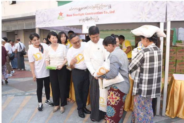
မန္တလေး: စက်တင်ဘာ ၂၀

New Starlight Construction Co.,Ltd က တည်ဆောက်ခဲ့သည့် မင်္ဂလာမန္တလေး ၁၀ နှစ်ပြည့်အထိမ်းအမှတ်အဖြစ် အိမ်ထောင်စုတစ်စုလျှင် ငွေကျပ် ၅၀၀၀၀ တန်ဖိုးရှိ စားသောက်ဖွယ်ရာ ပစ္စည်း ၁၁ မျိုးအား အိမ်ထောင်စု ၅၀၀၀ ကို ပေးအပ်လှူဒါန်းသည့် အခမ်းအနားကို ယနေ့နံနက်ပိုင်းက ချမ်းမြသာစည်မြို့နယ်ရှိ မင်္ဂလာမန္တလေးပရိုမိုးရှင်းဧရိယာတွင် ကျင်းပရာ မန္တလေးတိုင်းဒေသကြီး အစိုးရအဖွဲ့ ဝန်ကြီးချုပ် ဦးမျိုးအောင်၊ တိုင်းဒေသကြီးတရားလွှတ်တော်တရားသူကြီးချုပ် ဒေါ်ခင်သင်းဝေ၊ တိုင်းဒေသကြီးအစိုးရအဖွဲ့ဝင် ဝန်ကြီးများနှင့် တာဝန်ရှိသူများ၊ မန္တလေးမြို့အခြေစိုက် တရုတ်ပြည်သူ့ သမ္မတနိုင်ငံကောင်စစ်ဝန်ချုပ် မစ္စကောင်းပိုင် (Ms.Gao Ping)၊ မန္တလေးမြို့အခြေစိုက် အိန္ဒိယ နိုင်ငံကောင်စစ်ဝန်ချုပ် H.E. Mr. Sundeep Kaushal၊ New Starlight Construction Co.,Ltd မှ ဥက္ကဋ္ဌ ဦးကျော်ကျော်ဝင်းနှင့် ဒါရိုက်တာအဖွဲ့ဝင်များ၊ ဖိတ်ကြားထားသည့် ဧည့်သည်များ တက်