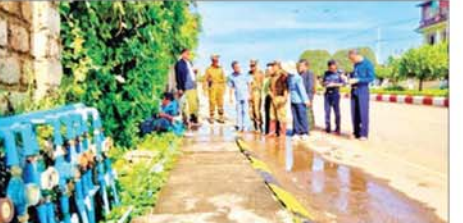
ကလေးတပ်နယ်မှ။ ခရိုင်/မြို့နယ်စီမံအုပ်ချုပ်ရေးအဖွဲ့ ဥက္ကဋ္ဌနှင့် အဖွဲ့ဝင်များ၊ စည်ပင်သာယာရေးဌာနမှ တာဝန်ရှိသူများက ကွင်းဆင်းကြည့်ရှုစစ်ဆေးခဲ့ကြကြောင်း သိရသည်။ မြို့နယ်(ပြန်/ဆက်)

မြို့ပေါ်ရပ်ကွက်များ သောက်သုံးရေရရှိရေး ရေပေးဝေနေမှုအား