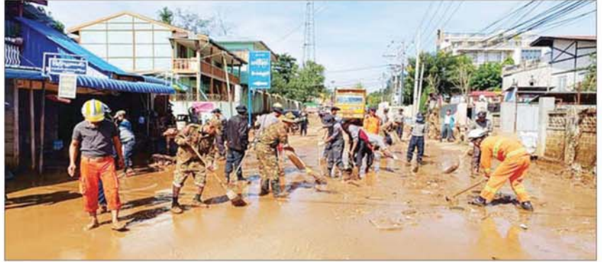
လမ်း၊ တံတားများ၊ ရပ်ကွက်၊ ကျေးရွာများအတွင်း၌ တင်ကျန်ခဲ့သည့်နွမ်းနယ်မှုများ ရှင်းလင်းဆောင်ရွက်စဉ်။

သည်။ အဆိုပါ ဧပျာသီရိမြို့နယ်နှင့် ပျဉ်းမနားမြို့နယ်သို့ ဆက်သွယ်ထားရှိ သော မြို့နယ်ချင်းဆက် ဆင်သေ ချောင်းကူးတံတားသည် ဧပျာသီရိ မြို့နယ် စည်ပင်ကြီးကျေးရွာ၊ ချောင်း ကမ်းကြီးကျေးရွာ၊ ညောင်ပင်ကြီး ကျေးရွာ၊ သာယာကုန်းကျေးရွာ၊ ရုံးပင် စောင်းကျေးရွာနှင့် စည်ပင်သာယာ ကျေးရွာတို့မှ ကျောင်းသား ကျောင်းသူ များက ပျဉ်းမနားမြို့နယ်ရှိ အခြေခံပညာ အထက်တန်းကျောင်းများသို့ ကျောင်း တက်ရောက်ရာတွင် အသုံးပြုရသော ဆင်သေချောင်းကူး တံတားဖြစ်ကြောင်း သိရသည်။ ယင်းအပြင် ရေကြီးမှုကြောင့် ပျက်စီး မှုများဖြစ်ပေါ်ခဲ့သည့် လမ်း/ တံတားများ ကိုလည်း လမ်းပန်းဆက်သွယ်ရေးအမြန် ပြန်လည် ကောင်းမွန်စေရန်အတွက် ကြိုးပမ်းဆောင်ရွက်လျက်ရှိရာ ပျက်စီး ခဲ့သည့် လမ်း/ တံတားများကိုလည်း ယာယီသံပေါင် ဘေလီတံတားများ အစားထိုး၍ အမြန်ဆုံးပြန်လည်ပြင်ဆင် ဆောင်ရွက်ပေးလျက် ရှိကြောင်းနှင့် ပြုပြင်ရန်ကျန်ရှိနေသည့် တံတားများကို လည်း အမြန်ဆုံးဆက်လက်ပြုပြင် ဆောင်ရွက်လျက်ရှိသည်။ သတင်းစဉ်