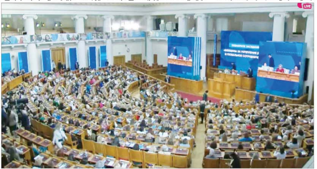
စတုတ္ထအကြိမ်မြောက် ယူရေးရှားအမျိုးသမီးဖိုရမ် ကျင်းပစဉ်။

ထို့နောက် အဆိုပါဖိုရမ်ကို “ငြိမ်းချမ်းရေးနှင့် ယုံကြည်မှုအတွက် အစီအစဉ်သစ်”၊ “စီးပွားရေးဆိုင်ရာ အမှန်တရား-နည်းပညာများနှင့် တီထွင်ဆန်းသစ်မှုများ”၊ “ကျန်းမာသန်စွမ်းသော လူ့အသိုင်းအဝိုင်းနှင့် သာယာဝပြောသော လူမှုအဖွဲ့အစည်း”၊ “သန့်ရှင်းသောကမ္ဘာနှင့် အစားအသောက်လုံခြုံရေး”၊ “ဓလေ့ထုံးတမ်းများကို ထိန်းသိမ်းခြင်းနှင့် ယဉ်ကျေးမှုကွဲပြားခြားနားခြင်း” တို့အတွက် အမျိုးသမီးများ၏ ကဏ္ဍနှင့် “BRICS အမျိုးသမီးဖိုရမ်ဆွေးနွေးပွဲ” တို့ကို ခေါင်းစဉ်များအလိုက် ကျင်းပဆွေးနွေးကြသည်။ “ဓလေ့ထုံးတမ်းများကို ထိန်းသိမ်းခြင်းနှင့် ယဉ်ကျေး