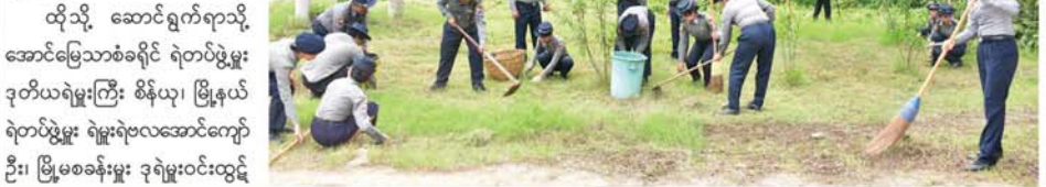
ပုသိမ်ကြီး စက်တင်ဘာ ၂၀ မန္တလေးတိုင်းဒေသကြီး၊ အောင်မြေသာစံခရိုင်၊ ပုသိမ်ကြီးမြို့နယ်၊ ရဲတပ်ဖွဲ့ဝင်များသည် နှစ်(၆၀)ပြည့် မြန်မာနိုင်ငံရဲတပ်ဖွဲ့နေ့ကို ကြိုဆိုဂုဏ်ပြုသောအားဖြင့် ပုသိမ်ကြီးပြည်သူ့ဆေးရုံ၌ ယနေ့ နံနက် ၇ နာရီက စတင်၍ စုပေါင်းသန့်ရှင်းရေးဆောင်ရွက်ကြသည်။ (ယာပုံ)

ကျောက်ဆည် စက်တင်ဘာ ၂၀ မန္တလေးတိုင်းဒေသကြီး၊ ကျောက်ဆည်ခရိုင်၊ ကျောက်ဆည်မြို့နယ်၌ ရေဝင်ရောက်ခဲ့သည့် ရပ်ကွက်၊ ကျေးရွာများတွင် ခရိုင်စီမံအုပ်ချုပ်ရေးအဖွဲ့ ဦးဆောင်မှုဖြင့် မြို့နယ်စီမံအုပ်ချုပ်ရေးအဖွဲ့နှင့် မြို့နယ်ပြည်သူ့ကျန်းမာရေးဦးစီးဌာန၊ သက်ဆိုင်ရာ ရပ်ကွက်၊ ကျေးရွာတို့ ပူးပေါင်းပြီး ကျန်းမာရေးစောင့်ရှောက်မှုအဖြစ် ကလိုရင်းဆေးခတ်ခြင်းများ ဆောင်ရွက်ပေးလျက်ရှိသည်။ (ဝဲပုံ)