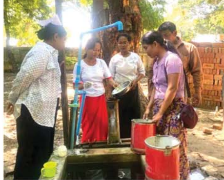
ကျောက်ဆည် စက်တင်ဘာ ၂၀ မန္တလေးတိုင်းဒေသကြီး၊ ကျောက်ဆည်ခရိုင်၊ ကျောက်ဆည်မြို့နယ်၌ ရေဝင်ရောက်ခဲ့သည့် ရပ်ကွက်၊ ကျေးရွာများတွင် ခရိုင်စီမံအုပ်ချုပ်ရေးအဖွဲ့ ဦးဆောင်မှုဖြင့် မြို့နယ်စီမံအုပ်ချုပ်ရေးအဖွဲ့နှင့် မြို့နယ်ပြည်သူ့ကျန်းမာရေးဦးစီးဌာန၊ သက်ဆိုင်ရာ ရပ်ကွက်၊ ကျေးရွာတို့ ပူးပေါင်းပြီး ကျန်းမာရေးစောင့်ရှောက်မှုအဖြစ် ကလိုရင်းဆေးခတ်ခြင်းများ ဆောင်ရွက်ပေးလျက်ရှိသည်။ (ဝဲပုံ)