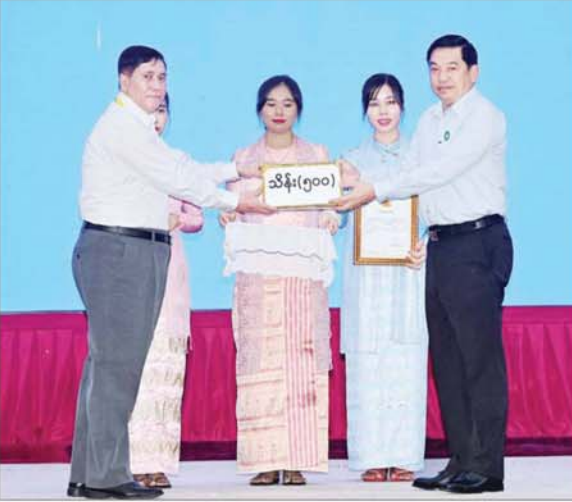
နိုင်ငံတော်စီမံအုပ်ချုပ်ရေးကောင်စီဝင် ဗိုလ်ချုပ်ကြီး ညိုစော စေတနာရှင်၊ အလှူရှင် တစ်ဦးက အလှူငွေများ ပေးအပ်လှူဒါန်းမှုကို လက်ခံရယူစဉ်။

ယခုဖြစ်ပေါ်ခဲ့သည့် ရေကြီး ရေလျှံမှုသည် မိုးသည်းထန်စွာရွာ သွန်းမှုကြောင့် ဖြစ်ပေါ်ခဲ့ခြင်း ဖြစ်ပြီး လေပြင်းတိုက်ခတ်မှုမရှိခဲ့ ကြောင်း၊ မိမိတို့အနေဖြင့် သဘာဝ ဘေးအန္တရာယ်ကို ရင်ဆိုင်နိုင်ရန် အတွက် ပြင်ဆင်မှုများကို ဆောင်ရွက်ထားရန်လိုကြောင်း၊ နေထိုင်မှုများ စည်းကမ်းတကျရှိ ပါက ထိခိုက်ပျက်စီးမှုများနည်းနိုင် မည်ဖြစ်ပြီး အမှိုက်များကိုစည်း ကမ်းမဲ့စွာ စွန့်ပစ်ခြင်းကြောင့် ရေစီးရေလာများကို ထိခိုက်စေနိုင် ကြောင်း၊ ထိုမှတစ်ဆင့် ရေကြီးရေ လျှံမှုများကို ဖြစ်ပေါ်စေနိုင်သဖြင့် နေထိုင်မှုများ စည်းကမ်းတကျ ရှိစေရေး ဝိုင်းဝန်းဆောင်ရွက်ကြ ရန်လိုကြောင်း ပြောကြားသည်။