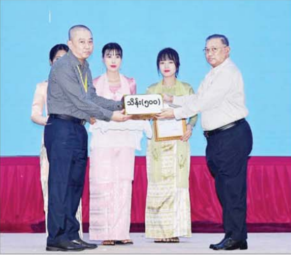
နိုင်ငံတော်စီမံအုပ်ချုပ်ရေးကောင်စီဝင် ဦးဝဏ္ဏမောင်လှိုင် စေတနာရှင်၊ အလှူရှင် တစ်ဦးက အလှူငွေများ ပေးအပ်လှူဒါန်းမှုကို လက်ခံရယူစဉ်။

ထိုနေ့က နိုင်ငံတော်စီမံအုပ်ချုပ် ရေးကောင်စီဥက္ကဋ္ဌ နိုင်ငံတော် ဝန်ကြီးချုပ်က အလှူငွေများ လှူဒါန်းမှုနှင့်ပတ်သက်၍ ကျေးဇူး တင်စကား ပြောကြားရာတွင် “စုပေါင်းအားနဲ့ ကျွန်တော်တို့ ကျော်လွှားရမှာဖြစ်ပါတယ်။ ဒီနေ့ ခင်ဗျားတို့လှူတဲ့ ပိုက်ဆံက ၃၁ ဘီလီယံကျော်ဟာ နည်းတိုက်ဆံ မဟုတ်ပါဘူး။ ကျွန်တော် တော် တော်ကြီးကို ကျေးဇူးတင်ပါတယ်။ ကျွန်တော်တို့လည်း ငွေသုံးရ