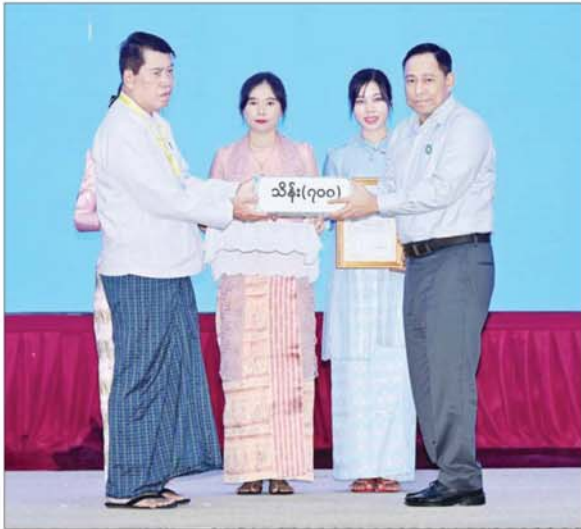
နိုင်ငံတော်စီမံအုပ်ချုပ်ရေးကောင်စီဝင် ဒုတိယဗိုလ်ချုပ်ကြီး ရာပြည့် စေတနာရှင်၊ အလှူရှင်တစ်ဦးက အလှူငွေများ ပေးအပ်လှူဒါန်းမှုကို လက်ခံရယူစဉ်။

တရားထက်သန်စွာဖြင့် လှူဒါန်းကြခြင်းဖြစ်ကြောင်း၊ ရေဘေးသင့်ပြည်သူများအနေဖြင့် ရေရုတ်တရက် စီးဆင်းလာချိန်တွင် ရုရှာပစ္စည်းများကိုသာ ယူဆောင်လာရသဖြင့် အခက်အခဲများစွာရှိကြကြောင်း။