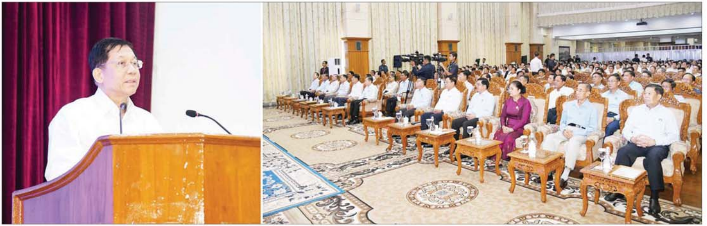
နိုင်ငံတော်စီမံအုပ်ချုပ်ရေးကောင်စီဥက္ကဋ္ဌ နိုင်ငံတော်ဝန်ကြီးချုပ် ဗိုလ်ချုပ်မှူးကြီးမင်းအောင်လှိုင် ရာဂီမှန်တိုင်းနှင့် ဆက်စပ်ဖြစ်ပွားသော ရေဘေးကြောင့် ရေဘေးဒဏ်သင့်ခဲ့ရသည့် ဒေသများ၌ ကူညီကယ်ဆယ်ရေးနှင့် ပြန်လည်ထူထောင်ရေးလုပ်ငန်းများ ဆောင်ရွက်ရန်အတွက် စေတနာရှင်၊ အလှူရှင်များက အလှူငွေများ ပေးအပ်လှူဒါန်းပွဲတွင် ကျေးဇူးတင်စကား ပြန်လည်ပြောကြားခဲ့ပါသည်။

၀ ရှေ့ဖိုးမှ ဦးစွာ ရာဂီမှန်တိုင်းနှင့် ဆက်စပ် ဖြစ်ပွားသော ရေဘေးကြောင့် သဘာဝဘေးအန္တရာယ်ကျရောက် ခဲ့မှု အခြေအနေများ၊ ရှာဖွေ ကယ်ဆယ်ထောက်ပံ့ရေးလုပ်ငန်း များ ဆောင်ရွက်ခဲ့မှု အခြေအနေ များကို မှတ်တမ်းတင်ထားသည့် “သဘာဝ ဘေးအန္တရာယ်ကို ညီညွတ်မှုဖြင့် ရင်ဆိုင်ကျော်လွှား ကြမည်” Video Clip ကို ဖွင့်လှစ် ပြသသည်။