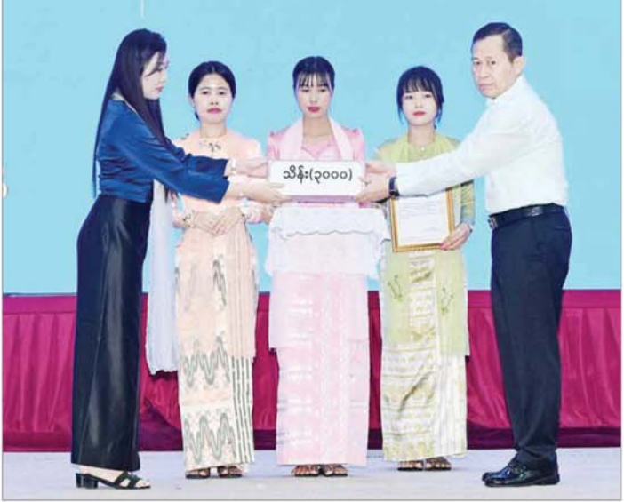
နိုင်ငံတော်စီမံအုပ်ချုပ်ရေးကောင်စီဒုတိယဥက္ကဋ္ဌ ဒုတိယဝန်ကြီးချုပ် ဒုတိယဗိုလ်ချုပ်မှူးကြီးစိုးဝင်း စေတနာရှင်၊ အလှူရှင်တစ်ဦးက အလှူငွေများ ပေးအပ်လှူဒါန်းမှုကို လက်ခံရယူစဉ်။

ပြန်လည်ပေးအပ်သည်။ အမျိုးသားသဘာဝဘေးအန္တရာယ် ဆက်လက်ပြီး စေတနာရှင်၊ အလှူရှင်များက အလှူငွေများ ပေးအပ် လှူဒါန်းကြရာ နိုင်ငံတော် စီမံအုပ်ချုပ်ရေးကောင်စီ ဥက္ကဋ္ဌ နိုင်ငံတော်ဝန်ကြီးချုပ် ဗိုလ်ချုပ် မှူးကြီး မင်းအောင်လှိုင်က လက်ခံ ရယူပြီး ဂုဏ်ပြုမှတ်တမ်းလွှာ