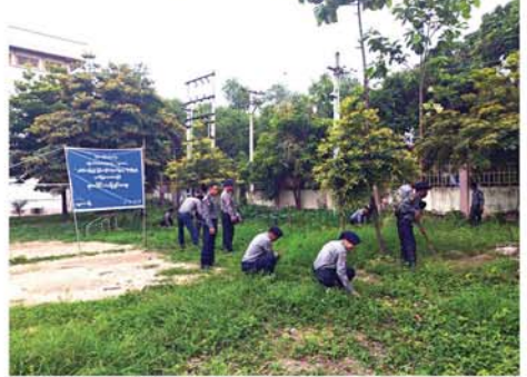
မြန်မာနိုင်ငံရဲတပ်ဖွဲ့(မန္တလေး)မှ နှစ်(၆၀)ပြည့် မြန်မာနိုင်ငံရဲတပ်ဖွဲ့နေ့ကို ဂုဏ်ပြုသောအားဖြင့် စုပေါင်းသန့်ရှင်းရေး ပြုလုပ်ရာ ကျောင်းတာဝန်ရှိသူများက နံနက်စာဖြင့် ပြန်လည်တည်ခင်းစဉ်ခံပေးခဲ့သည်။

မန္တလေး စက်တင်ဘာ ၂၀ ၊ မြန်မာနိုင်ငံရဲတပ်ဖွဲ့၊ စည်ပင်သာယာရေးတပ်ဖွဲ့(မန္တလေး)မှ နှစ်(၆၀)ပြည့် မြန်မာနိုင်ငံရဲတပ်ဖွဲ့နေ့ကို ဂုဏ်ပြုသောအားဖြင့် စုပေါင်းသန့်ရှင်းရေးကို ချမ်းမြသာစည်မြို့နယ်၊ သူနာပြုတက္ကသိုလ်ကျောင်းဝင်း အတွင်း၊ အပြင်၌ ပြုလုပ်ခဲ့သည်။ (ယာပုံ)