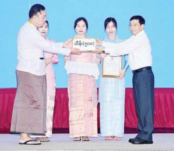
နေပြည်တော်ကောင်စီဥက္ကဋ္ဌ ဦးသန်းထွန်းဦး စေတနာရှင်၊ အလှူရှင်တစ်ဦးက အလှူငွေများ ပေးအပ်လှူဒါန်းမှုကို လက်ခံရယူစဉ်။

အခမ်းအနားအပြီးတွင် နိုင်ငံ တော်စီမံအုပ်ချုပ်ရေးကောင်စီ ဥက္ကဋ္ဌ နိုင်ငံတော် ဝန်ကြီးချုပ်နှင့် အဖွဲ့ဝင်များသည် စေတနာရှင်၊ အလှူရှင်များအား ရင်းရင်းနှီးနှီး နှုတ်ဆက်ပြီး လက်စပ်ရည်ပိုင်း ဖြင့် တည်ခင်းစဉ်ခံခဲ့ရသည်။ ယနေ့ နေပြည်တော် မြို့တော် ခန်းမ၌ ကျင်းပပြုလုပ်သည့် ရေဘေး ဒဏ်သင့် ခဲ့ရသည့် ဒေသများ၌ ကူညီကယ်ဆယ်ရေးနှင့် ပြန်လည် ထူထောင်ရေးလုပ်ငန်းများ ဆောင် ရွက်ရန်အတွက် စေတနာရှင်၊ အလှူရှင်များက အလှူငွေများပေး အပ်လှူဒါန်းပွဲ အခမ်းအနားတွင် စုစုပေါင်းအလှူငွေ ငွေကျပ်သန်း ပေါင်း ၃၂၃၀ (ငွေကျပ် ၃၂ ဒသမ ၂ ဘီလီယံ)ကျော်ကို လက်ခံရရှိခဲ့ ကြောင်း သိရသည်။ သတင်းစဉ်