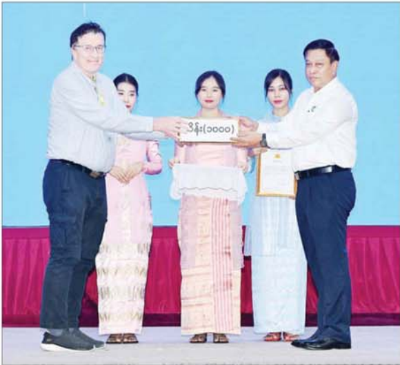
နိုင်ငံတော်စီမံအုပ်ချုပ်ရေးကောင်စီဝင် တင်အောင်စန် စေတနာရှင်၊ အလှူရှင်တစ်ဦးက အလှူငွေများ ပေးအပ်လှူဒါန်းမှုကို လက်ခံရယူစဉ်။