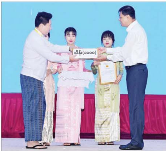
နိုင်ငံတော်စီမံအုပ်ချုပ်ရေးကောင်စီဝင် ဗိုလ်ချုပ်ကြီး မြထွန်းဦး စေတနာရှင်၊ အလှူရှင်တစ်ဦးက အလှူငွေများ ပေးအပ်လှူဒါန်းမှုကို လက်ခံရယူစဉ်။