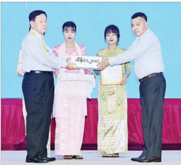
နိုင်ငံတော်စီမံအုပ်ချုပ်ရေးကောင်စီ တွဲဖက်အတွင်းရေးမှူး ဗိုလ်ချုပ်ကြီး ရဲဝင်းဦး စေတနာရှင်၊ အလှူရှင်တစ်ဦးက အလှူငွေများ ပေးအပ်လှူဒါန်းမှုကို လက်ခံရယူစဉ်။

ယခုအချိန်သည် အားလုံးအတွက် အခက်အခဲများ ကိုယ်စီဖြစ်ပေါ်လျက်ရှိသည့်အချိန် ဖြစ်သော်လည်း အလှူငွေများ များစွာထည့်ဝင်ခဲ့ကြသည်ကို တွေ့ရှိရသည့်အတွက် များစွာခံမိမြောက်ရပါကြောင်း၊ ပြန်လည်ထူထောင်ရေးလုပ်ငန်းများ ဆောင်ရွက်ရာတွင် များစွာအထောက်အကူ ဖြစ်စေမည်ဖြစ်ကြောင်း၊ အလားတူ ရေဘေးသင့်ပြည်သူများကိုလည်း အားလုံးက ဝိုင်းဝန်း၍လှူဒါန်းခြင်း၊ ကူညီကယ်ဆယ်ခြင်းများကိုလည်း အဆက်မပြတ် ဆောင်ရွက်နေသည်ကို တွေ့ရကြောင်း၊ မြန်မာလူမျိုးများ၏ လှူဒါန်းတန်ခူးသည် စိတ်များကြောင့် စေတနာသွား