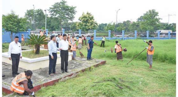
အတွင်း ကျန်းမာရေးအထူး တက္ကသိုလ်(မန္တလေး) ပါမောက္ခ သည်များကို ဖြည့်ဆည်းဆောင်ရွက်ပေးခဲ့ကြောင်း သိရသည်။၏ ယဉ်ကျေးမှုနှင့် အနုပညာ ပြုများအား မှာကြားပြီး လိုအပ် (မန္တလေးနေ့စဉ်)

ထားဆောင်ရွက်သွားရန်တို့ကို မှာကြားပြီး လိုအပ်သည်များကို ဖြည့်ဆည်းဆောင်ရွက်ပေးခဲ့သည်။ ၎င်းနောက် တိုင်းဒေသကြီးဝန်ကြီးချုပ်နှင့်အဖွဲ့သည် အောင်မြင်သောမြို့နယ်ရှိ အနုပညာအထက်တန်းကျောင်း(မန္တလေး)သို့ ရောက်ရှိပြီး(၂၅)ကြိမ်မြောက် ငွေရတုအထိမ်းအမှတ် မြန်မာရိုးရာယဉ်ကျေးမှု အဆို၊ အက၊ အရေး၊ အတီးပြိုင်ပွဲ ဗဟိုအဆင့်သို့ မန္တလေးတိုင်းဒေသကြီးကိုယ်စားပြု သွားရောက်ယှဉ်ပြိုင်မည့် ပြိုင်ပွဲဝင်များ ပြိုင်ပွဲဝင်ဘာသာရပ်အလိုက် လေ့ကျင့်နေမှုများကို လိုက်လံ ကြည့်ရှုအားပေးပြီး စခန်းသွင်း လေ့ကျင့်နေစဉ်ကာလ