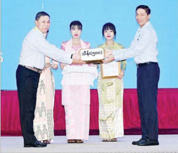
ပြည်ထောင်စုဝန်ကြီး ဒေါက်တာ စိုးဝင်း စေတနာရှင်၊ အလှူရှင်တစ်ဦးက အလှူငွေ များ ပေးအပ်လှူဒါန်းမှုကို လက်ခံရယူစဉ်။

လည်း ဝိုင်းဝန်းကူညီဆောင်ရွက် ပေးဖို့အတွက်လည်း ကျွန်တော် အနေနဲ့ တိုက်တွန်းလိုပါတယ်။ ကျွန်တော်တို့အနေနဲ့ ရှေ့လုပ်ငန်း စဉ် (၅)ရပ်အတိုင်းပဲ ဖြစ်အောင် သွားပါမယ်။ ကျွန်တော်တို့တကယ် တမ်းပြောရလို့ရှိရင်တော့ ရှေ့လုပ် ငန်းစဉ်(၅)ရပ်က ပြီးခဲ့တဲ့ ဟို နှစ် နှစ်ကတည်းက ပြီးရမှာပါ။ အကြောင်းအမျိုးမျိုးကြောင့် မပြီး တဲ့ဖြစ်သွားပြီးတော့ ဒီဘက်အထိ