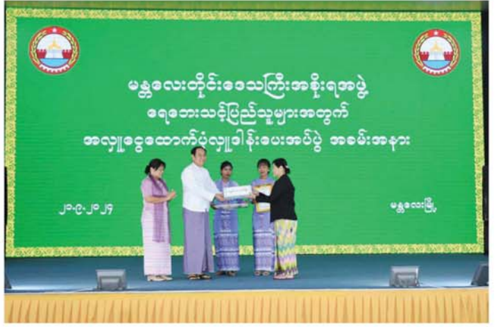
သတင်း စာမျက်နှာ ၇