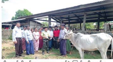
မျိုးကောင်းမျိုးသန့်ဒေသန္တာမ ၁၀ ကောင်ကို တာဝန်ရှိသူများက ပေး အပ်ခဲ့ကြောင်း သိရသည်။ (အပေါ်ပုံ)မြို့နယ်(မြန်/ဆက်)

မိုးခုံ စက်တင်ဘာ ၂၃ စိုက်ပျိုးရေး၊ မွေးမြူရေးနှင့် ဆည်မြောင်းဝန်ကြီးဌာန မွေးမြူ ရေးနှင့်ကုသရေးဦးစီးဌာန နှစ်စနစ် ခရိုင်၊ မိုးခုံမြို့နယ်ရုံး၏ ၂၀၂၄- ၂၀၂၅ ဘဏ္ဍာရေးနှစ် မေထုန်မဲ့ သားစပ်စီမံချက်အရ မွေးမြူရေး ဘဏ်စနစ်ဖြင့် မျိုးကောင်းမျိုးသန့် ဒေသန္တာမများ ပေးအပ်ခြင်းကို နားခံကျေးရွာအုပ်စု ယန်အုကျေးရွာ ၌ ယမန်နေ့ နံနက် ၁၀ နာရီက ပေးအပ်ခဲ့သည်။