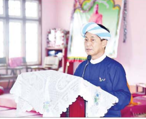
နိုင်ငံတော်စီမံအုပ်ချုပ်ရေးကောင်စီအဖွဲ့ဝင် ခွန်စုံလွင် ဟိုပုံးမြို့နယ် စံဖူးကျေးရွာ ဘုန်းတော်ကြီးကျောင်း၌ ရေဘေးသင့်ပြည်သူများကို တွေ့ဆုံအားပေးစကားပြောကြားစဉ်။

လူ့ဖွယ်ဝတ္ထုပစ္စည်းများ ဆက်ကပ် ဦးစွာ ဟိုပုံးမြို့ နောင်တောင်း ပရဟိတ တပ်ဦးကျောင်းတိုက် ပဓာန နာယက ဆရာတော် ဘဒ္ဒန္တရာဇိန္ဒထံမှ ငါးပါးသီလခံဆောင် ဆောက်တည်ကြပြီး ပရိတ် တရားတော်များ နာယုကြကာ ဆရာတော်၊ သံဃာတော်များအား နိုင်ငံတော်စီမံအုပ်ချုပ်ရေးကောင်စီ