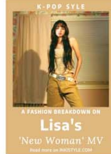
Woman နှင့် Pop Star အသွင် ကူးပြောင်းသွားခဲ့သည်။(SKY)

ဘလက်ပင့်ခံအဖွဲ့ဝင် လီဆာ ၏ တစ်ကိုယ်တော်ဂီတထွက်ရှိ လာပြီး Rockstar မှ New Woman အဖြစ် မြင်တွေ့ခဲ့ကြ ရသည်ဟု ပရိသတ်မှတ်ချက်ပေး ထားကြကြောင်း ဆွန်ပီဝက်ဘ် ဆိုက်တွင် ဖော်ပြသည်။ လီဆာသည် ဘလက်ပင့်ခံ အဖွဲ့နှင့် သီဆိုစဉ်ကပင် အသံ အရည်အသွေးကောင်းမွန်သူဖြစ် ပြီး၊ တစ်ကိုယ်တော်ဂီတနှင့် Money တွင်လည်း ဂီတစွမ်းရည် ပြသခဲ့ကာ New Woman တွင် ပို၍ ပြီးပြည့်စုံလာခဲ့သည်။ လီဆာ၏ ရက်ပီအစမှာ Rap Flow ထဲ တန်းဝင်ခဲ့ပြီး Chorus တွင် နောက်ခံအသံများ ကြောင့် ပို၍သစ်လွင်လာကာ လီဆာနှင့်အတူ ရီဆာလီအာ၏ အဆိုနှင့် လိုက်ဖက်မှုရှိပြီး အချိတ်အဆက်မိခဲ့ကြသည်။ ပိုင်ဂျီနှင့် လမ်းခွဲ၍ ဂီတ လမ်းလျှောက်ချိန် ပိုမိုတောက်ပ လာသော လီဆာသည် New