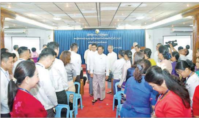
များ၊ ဝါရင့်သံတမန်များ၊ ဘာသာရပ်ဆိုင်ရာကျွမ်းကျင်သူများ၊ တက္ကသိုလ်များမှ ပါမောက္ခဆရာကြီး၊ ဆရာမကြီးများ၊ သင်တန်းသား သင်တန်းသူများ တက်ရောက်ကြသည်။ သတင်းစဉ်

ရန်ကုန် စက်တင်ဘာ ၂၃ နိုင်ငံခြားရေးဝန်ကြီးဌာနက ဖွင့်လှစ်မည့် အခြေခံသံတမန်ရေးရာကျွမ်းကျင်မှုသင်တန်း အမှတ်စဉ် (၄၆/၂၀၂၄) နေပြည်တော်တန်းခွဲနှင့် ရန်ကုန်တန်းခွဲတို့၏ သင်တန်းဖွင့်ပွဲအခမ်းအနားများကို ယနေ့နံနက် ၁၀ နာရီတွင် နိုင်ငံခြားရေးဝန်ကြီးဌာန နေပြည်တော်ရှိ လေ့လာကတ်ခန်းမနှင့် ရန်ကုန်ရှိ ဝန်ထမ်းရောစခန်းမတို့၌ တစ်ပြိုင်တည်းကျင်းပရာ ဒုတိယဝန်ကြီးချုပ်နှင့် နိုင်ငံခြားရေးဝန်ကြီးဌာန ပြည်ထောင်စုဝန်ကြီး ဦးသန်းဆွေ ရန်ကုန်မြို့၌ တက်ရောက်၍ သင်တန်းဖွင့်ပွဲအမှာစကား ပြောကြားသည်။ တက်ရောက် အခမ်းအနားများသို့ နိုင်ငံခြားရေးဝန်ကြီးဌာန ဒုတိယဝန်ကြီး၊ အမြဲတမ်းအတွင်းဝန်၊ ပြည်ထောင်စုဝန်ကြီးရုံးနှင့် ဦးစီးဌာနများမှ ညွှန်ကြားရေးမှူးချုပ်များနှင့် တာဝန်ရှိသူများ၊ အခြားစားသံအမတ်ကြီး