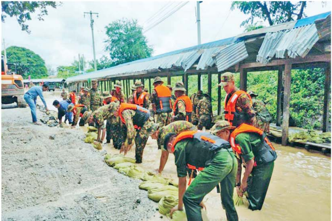
ရေကြီးရေလျှံမှုဖြစ်ပေါ်ခဲ့သည့်နေရာ၌ တပ်မတော်သားများနှင့်တာဝန်ရှိသူများက ပြန်လည်ထူထောင်ရေးလုပ်ငန်းများ ဆောင်ရွက်စဉ်။

နေပြည်တော် စက်တင်ဘာ ၂၃ နေပြည်တော်ကောင်စီနယ်မြေ အပါအဝင် တိုင်းဒေသကြီးနှင့် ပြည်နယ်များရှိ ရေကြီးရေလျှံမှု ဖြစ်ပေါ်ခဲ့သည့် ရပ်ကွက်/ကျေးရွာများတွင် ကူညီကယ်ဆယ်ရေးလုပ်ငန်းများနှင့် ပြန်လည်ထူထောင်ရေးလုပ်ငန်းများကို အင်တိုက်အားတိုက် တက်ကြွစွာ ပူးပေါင်းဆောင်ရွက်ပေးလျက်ရှိသည်။ တက်ကြွစွာဆောင်ရွက်ပေးလျက်ရှိ ယနေ့တွင်လည်း နေပြည်တော်ကောင်စီနယ်မြေ ဧပျာသီရိမြို့နယ်၊ ပျဉ်းမနားမြို့နယ်၊ တပ်ကုန်းမြို့နယ်၊ လယ်ဝေးမြို့နယ်၊ ပုဗ္ဗသီရိမြို့နယ်တို့တွင် လည်းကောင်း၊ ရှမ်းပြည်နယ်(တောင်ပိုင်း) ကလေးမြို့နယ်တွင်လည်းကောင်း၊ ကယားပြည်နယ်လွိုင်ကော်မြို့နယ်နှင့် လွိုင်လင် လေးမြို့နယ်တို့တွင်လည်းကောင်း ဘုန်းတော်ကြီးကျောင်းများ၊ စာသင်ကျောင်းများ၊ ဆေးရုံ၊ ဆေးခန်းများ၊ ဌာနဆိုင်ရာအဆောက်အအုံများတွင် လိုအပ်သည်များ ကူညီရွှေ့ပြောင်းပေးခြင်းနှင့် သန့်ရှင်းရေးလုပ်ငန်းများ ဆောင်ရွက်ပေးခြင်း၊ လမ်း၊ တံတားများ၊ ရပ်ကွက်၊ ကျေးရွာများအတွင်း၌ တင်ကျန်ခဲ့သည့်နွမ်းနယ်မှုများ၊ သစ်ပင်သစ်ကိုင်းများ ဖယ်ရှားပေးခြင်းအပါအဝင် အခြားလိုအပ်သည်များကို တပ်မတော်သားများ၊ မြန်မာနိုင်ငံရဲတပ်ဖွဲ့ဝင်များ၊ စီးသတ်တပ်ဖွဲ့ဝင်များ၊ ကြက်ခြေနီတပ်ဖွဲ့ဝင်များနှင့် လူမှုဝန်ထမ်းကယ်ဆယ်ရေးအဖွဲ့များက ဒေသခံပြည်သူများနှင့်ပူးပေါင်း၍ တက်ကြွစွာဆောင်ရွက်ပေးလျက်ရှိသည်။ စာမျက်နှာ ၅ သို့ ၆