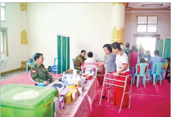
ရေဘေးသင့်ပြည်သူများအား ကျန်းမာရေးစောင့်ရှောက်မှုလုပ်ငန်းများ ဆောင်ရွက်ပေးစဉ်။

တာဝန်ရှိသူများသည် လယ်ဝေးမြို့နယ် သစ်ခေါက်ခွကျေးရွာရှိ ရေဘေးသင့် ပြည်သူများအား တွေ့ဆုံအေးပေးစကားပြောကြားပြီး ဆန်၊ စားသောက်ဖွယ်ရာများနှင့် တစ်အိမ်ထောင်လျှင် တစ်သောင်းကျပ်ကို ထောက်ပံ့ပေးအပ်ခဲ့သည်။ ထို့နောက် သစ်ခေါက်ခွကျေးရွာ သုခါရာမ