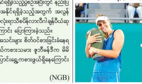
ဆိုင်ဖို ဆက်လက်ကြိုးစားသွားမှာပါ။ (အောက်ပုံ)

2024 Hana Bank Korea Open တင်းနစ်ပြိုင်ပွဲ ချန်ပီယံဆုကို Beatriz Haddad Maia ဆွတ်ခူး ဆိုလ် စက်တင်ဘာ ၂၃ Korea Open တင်းနစ်ပြိုင်ပွဲ တောင်ကိုရီးယားနိုင်ငံ၊ ဆိုလ်မြို့တွင် ကျင်းပလျက်ရှိသော အမျိုးသမီးတင်းနစ်ပြိုင်ပွဲဖြစ်သည့် 2024 Hana Bank Korea Open တင်းနစ်ပြိုင်ပွဲ ချန်ပီယံဆုကို ဘရာဇီးတင်းနစ်မယ် Beatriz Haddad Maia ထိုက်ထိုက်တန်တန် ဆွတ်ခူးခဲ့သည်။ အဆိုပါ ဘရာဇီးတင်းနစ်မယ် Beatriz Haddad Maia သည် 2024 Hana Bank