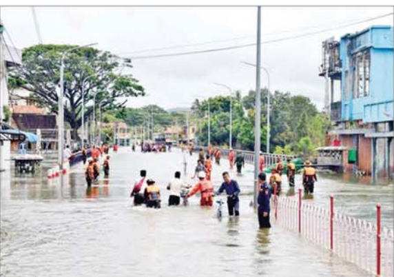
ရေဘေးသင့်ပြည်သူများအား ကူညီကယ်ဆယ်ရေးလုပ်ငန်းများ ဆောင်ရွက်ပေးစဉ်။