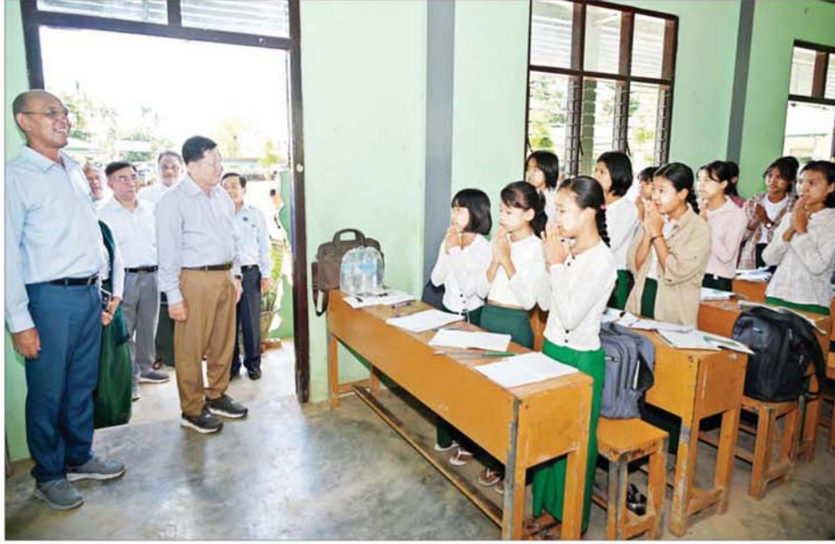
နိုင်ငံတော်စီမံအုပ်ချုပ်ရေးကောင်စီဥက္ကဋ္ဌ နိုင်ငံတော်ဝန်ကြီးချုပ် ဗိုလ်ချုပ်မှူးကြီးမင်းအောင်လှိုင် အခြေခံပညာအထက်တန်းကျောင်း (ကျောက်ချက်)၌ ကျောင်းသား ကျောင်းသူများ ပညာသင်ကြားနေမှုကို ကြည့်ရှုစစ်ဆေးစဉ်။

မှု ကောင်းမွန်အောင် ဆောင်ရွက် ရန်လိုကြောင်းနှင့် လမ်းပိုင်းနှင့် တံတားအား အဆင့်မြှင့်တင်နိုင် မည့် အခြေအနေများနှင့်ပတ်သက် ၍ လိုအပ်သည်များ မှာကြားသည်။ ယင်းနောက် နိုင်ငံတော် စီမံအုပ်ချုပ်ရေးကောင်စီ ဥက္ကဋ္ဌ နိုင်ငံတော်ဝန်ကြီးချုပ်နှင့် အဖွဲ့ဝင် များသည် ပေါင်းလောင်းမြစ်ကူး တံတား(အဝေရာ)၏ ပျဉ်းမနား ဘက်ခြမ်းရှိ တံတားချဉ်းကပ်လမ်း ရေတိုက်စားခံမှုကြောင့် ပျက်စီးမှု အား နှစ်လွှာတစ်ထပ် ယာယီ ဘေးလိတ်တားထိုး၍ ပြင်ဆင် ပြီးစီးမှုအခြေအနေများကို လိုက်လံ ကြည့်ရှုစစ်ဆေးပြီး လိုအပ်သည် များ မှာကြားသည်။ ပေါင်းလောင်း(အဝေရာဆည်) လက်ယာရေပေးမြောင်းမကြီး ဆက်လက်၍ နိုင်ငံတော် စီမံအုပ်ချုပ်ရေးကောင်စီ ဥက္ကဋ္ဌ နိုင်ငံတော်ဝန်ကြီးချုပ်နှင့် အဖွဲ့ဝင် များသည် ပေါင်းလောင်း(အဝေရာ ဆည်) လက်ယာရေပေးမြောင်းမ ကြီး၌ ရေတိုက်စားခံရမှုကြောင့် မြောင်းတာပေါင် ကျိုးပေါက်ခဲ့ သည့်နေရာများအား ပြန်လည် ပြင်ဆင်ခြင်း ဆောင်ရွက်နေမှုနှင့် ရေကြီးရေလျှံမှု ဖြစ်ပေါ်ခဲ့သည့်