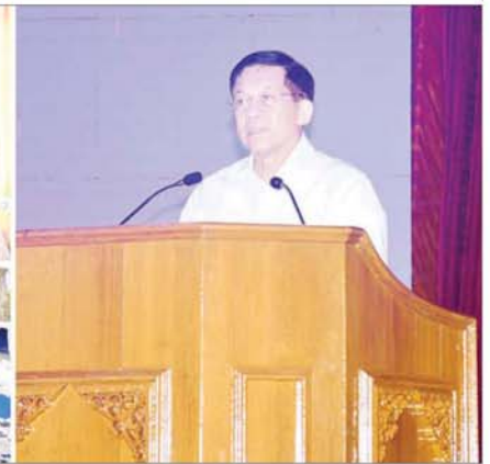
နိုင်ငံတော်စီမံအုပ်ချုပ်ရေးကောင်စီဥက္ကဋ္ဌ နိုင်ငံတော်ဝန်ကြီးချုပ် ဗိုလ်ချုပ်မှူးကြီး မင်းအောင်လှိုင် မြန်မာနိုင်ငံအတွင်း ရာဂီမုန်တိုင်းနှင့် ဆက်စပ်ဖြစ်ပွားသော ရေဘေးကြောင့် ရေဘေးဒဏ်သင့်ခဲ့ရသည့် ဒေသများ၌ ကူညီကယ်ဆယ်ရေးနှင့် ပြန်လည်ထူထောင်ရေးလုပ်ငန်းများဆောင်ရွက်ရန်အတွက် စေတနာရှင်၊ အလှူရှင်များက အလှူငွေများ ဒုတိယအကြိမ် ပေးအပ်လှူဒါန်းပွဲတွင် ကျေးဇူးတင်စကားပြောကြားစဉ်။