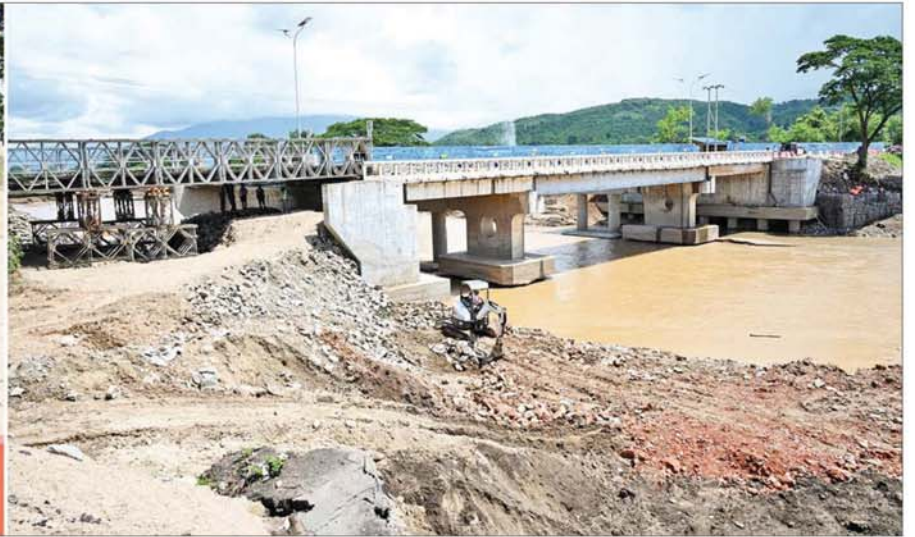
နိုင်ငံတော်စီမံအုပ်ချုပ်ရေးကောင်စီဥက္ကဋ္ဌ နိုင်ငံတော်ဝန်ကြီးချုပ် ဗိုလ်ချုပ်မှူးကြီးမင်းအောင်လှိုင် နှုတ်ခမ်းတောင်းဆိုရာတွင် (အဆုံ) ရေတိုက်စားမှုကြောင့် တံတားချဉ်းကပ်လမ်း ပြိုကျပျက်စီးခဲ့မှုအား ယာယီဘေးလိပ်တား တည်ဆောက်ပြုပြင်ပြီးစီးမှုနှင့် တံတားချဉ်းကပ်လမ်း ကမ်းကပ်ခံအား ပြန်လည်ပြုပြင်ဆောင်ရွက်နေမှုကို ကြည့်ရှုစစ်ဆေးစဉ်။

»» စာမျက်နှာ ၄ မှ အခြေခံပညာ အထက်တန်း ကျောင်း(ကျောက်ချက်) ထို့နောက် နိုင်ငံတော်စီမံအုပ်ချုပ်ရေးကောင်စီဥက္ကဋ္ဌ နိုင်ငံတော်ဝန်ကြီးချုပ်နှင့် အဖွဲ့ဝင်များသည် ဝေယျာသီရိမြို့နယ် ကျောက်ချက်ကျေးရွာ အခြေခံပညာအထက်တန်းကျောင်းသို့ ရောက်ရှိပြီး ရေငတ်ရောက်မှုများအား ပြန်လည်ရှင်းလင်း ဆောင်ရွက်ထားရှိမှု၊ ကျောင်းသား ကျောင်းသူများ ပညာသင်ကြားနေမှု၊ ပညာရေးဝန်ကြီးဌာနမှ စာရေးကိရိယာများနှင့် ကျောင်းသုံးစာအုပ်များ ထောက်ပံ့ပေးထားမှု အခြေအနေများကို ကြည့်ရှုစစ်ဆေးပြီး ကျောင်းအုပ် ဆရာမကြီးနှင့် တာဝန်ရှိသူများ၏ တင်ပြချက်များအပေါ် လိုအပ်သည်များ မှာကြားသည်။