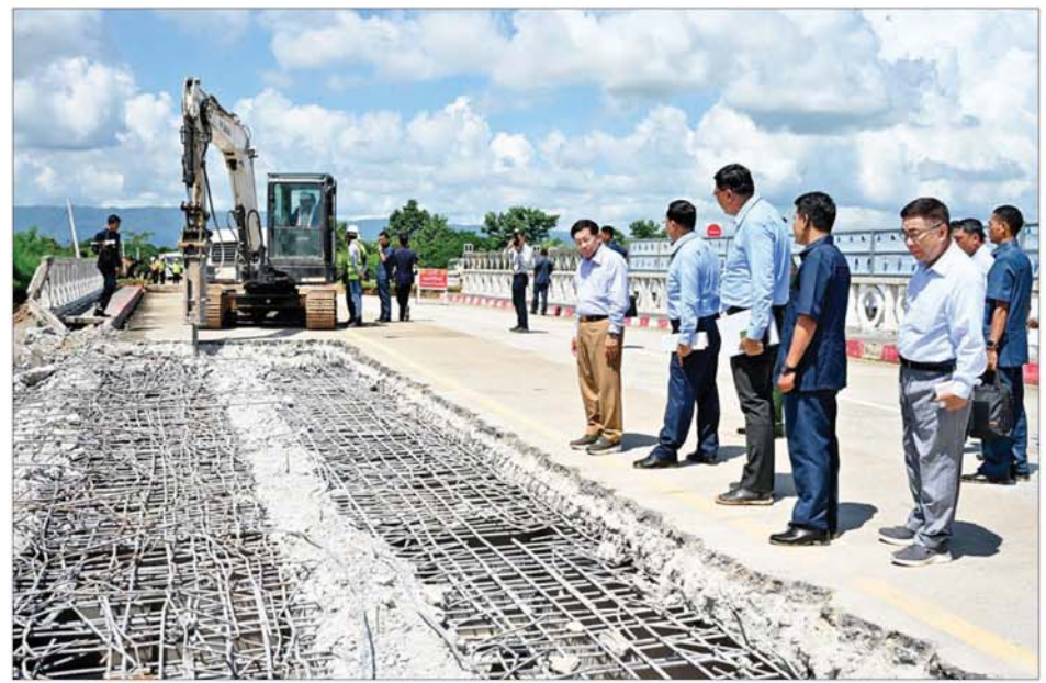
နိုင်ငံတော်စီမံအုပ်ချုပ်ရေးကောင်စီဥက္ကဋ္ဌ နိုင်ငံတော်ဝန်ကြီးချုပ် ဗိုလ်ချုပ်မှူးကြီးမင်းအောင်လှိုင် သိုက်ချောင်းတံတား (ဆင်သေချောင်းကူး) ပြန်လည်ပြင်ဆင်နေမှုကို ကြည့်ရှုစစ်ဆေးစဉ်။

နိုင်ငံတော် ဝန်ကြီးချုပ်က ကျောင်းပြန်လည်ဖွင့်လှစ်သင်ကြား ပေးနိုင်ရေးအတွက် လိုအပ်သည် များကို အမြန်ဆုံးဆောင်ရွက် ပေးသွားရန် တာဝန်ရှိသူများကို ဖွဲ့စည်းသည်။ ယင်းနောက် နိုင်ငံတော် စီမံအုပ်ချုပ်ရေးကောင်စီ ဥက္ကဋ္ဌ နိုင်ငံတော် ဝန်ကြီးချုပ်သည် နန်းများ ဖယ်ရှားရှင်းလင်းခြင်းနှင့် သန့်ရှင်းရေး လုပ်ငန်းများ ဆောင်ရွက် ပေးနေကြသည့် မြန်မာနိုင်ငံ ရဲတပ်ဖွဲ့ဝင်များ၊ မီးသတ်တပ်ဖွဲ့ဝင်များ အတွက် ချီးမြှင့်ငွေများကို ပေးအပ်ပြီး ဆရာ ဆရာမများအား ရင်းရင်း နှီးနှီး နှုတ်ဆက်သည်။ ဆက်လက်၍ နိုင်ငံတော် စီမံအုပ်ချုပ်ရေးကောင်စီ ဥက္ကဋ္ဌ နိုင်ငံတော်ဝန်ကြီးချုပ်နှင့် အဖွဲ့ဝင် များသည် ဆင်သေကျေးရွာမှ လမ်း အတိုင်း ရေကြီးရေလျှံမှုကြောင့် ရေဝင်နှစ်ခြပ်ခဲ့မှု အခြေအနေများ ကို ကြည့်ရှုစစ်ဆေးပြီး အပျက် အစီးများ၊ သစ်ပင်သစ်ကိုင်းများ ဖယ်ရှား ရှင်းလင်းခြင်းတို့ကို