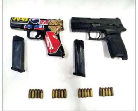
Anonymous Force အမည်ခံအကြမ်းဖက်အဖွဲ့က ရန်ကုန်တိုင်းဒေသကြီးအတွင်း အပြစ်မဲ့ပြည်သူများအား ဒလန်ဟုစွပ်စွဲ၍ လုပ်ကြံသတ်ဖြတ်ရာတွင် အသုံးပြုခဲ့သည့် လက်နက်/ ခဲယမ်းများ၏ မှတ်တမ်းဓာတ်ပုံ။