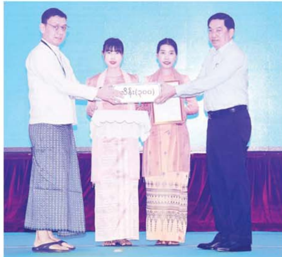
နိုင်ငံတော် စီမံ အုပ်ချုပ်ရေး ကောင်စီ အဖွဲ့ဝင် ဗိုလ်ချုပ်ကြီး ညိုစော စေတနာရှင်၊ အလှူရှင် တစ်ဦးက လှူဒါန်းသည့် အလှူငွေကို လက်ခံရယူ စဉ်။

ကောင်းမွန်ပြီး ဂုဏ်ယူဖွယ်ရာ စိတ်ဓာတ်များပင် ဖြစ်ပြီး နိုင်ငံသားတိုင်းအနေဖြင့် ထိုကဲ့သို့ စိတ်ရင်းစေတနာ၊ စိတ်ဓာတ် ကောင်းတို့ဖြင့် ဆောင်ရွက်သွား မည်ဆိုပါက နိုင်ငံဖွံ့ဖြိုးတိုးတက် ရေးကိုလည်း များစွာအထောက် အကူဖြစ်စေနိုင်မည် ဖြစ်ကြောင်း ဖြင့် ပြောကြားပြီး သဘာဝဘေး ဖြစ်ပေါ်ခဲ့မှု အခြေအနေများနှင့် ပြန်လည်ထူထောင်ရေး လုပ်ငန်း များ အမြန်ဆုံးဆောင်ရွက်ပေးနိုင် ရေး လိုက်လံကြည့်ရှုစစ်ဆေးခဲ့ သည့် အခြေအနေများ၊ မိခါ မှန်တိုင်းဒဏ်ကြောင့် ရေဝင်၊ ရေဝပ်မှု ဖြစ်ပေါ်ခဲ့မှုများကို သင်ခန်းစာယူ၍ ပုဂံရေးဟောင်း ယဉ်ကျေးမှုနယ်မြေ၌ လိုအပ် သည့် ကြိုတင်ပြင်ဆင်မှုလုပ်ငန်း များကို ဆောင်ရွက်ခဲ့ခြင်းကြောင့် ယခု မိုးသည်းထန်စွာရွာသွန်း ချိန်တွင် ထိခိုက်ပျက်စီးမှုအနည်း ငယ်သာရှိခဲ့သည့် အခြေအနေ များကို ရှင်းလင်းပြောကြားသည်။ စာမျက်နှာ ၇ သို့ #