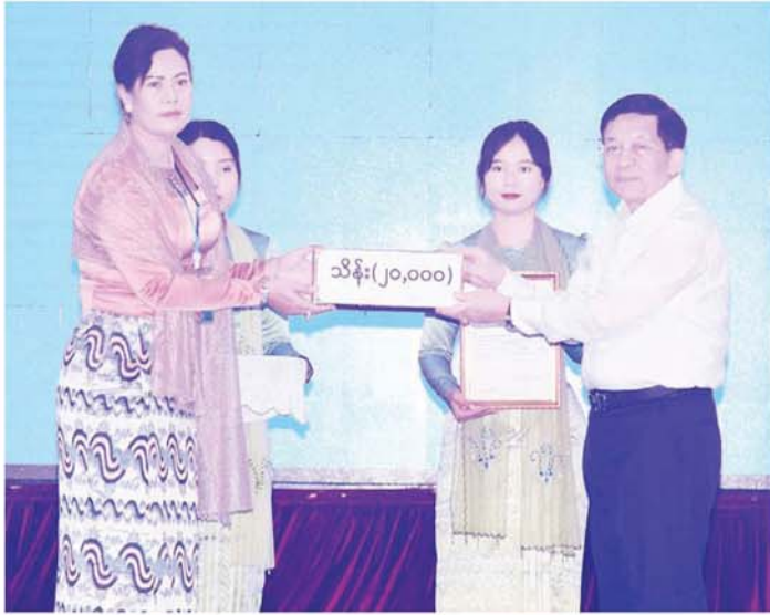
နိုင်ငံတော်စီမံအုပ်ချုပ်ရေးကောင်စီဥက္ကဋ္ဌ နိုင်ငံတော်ဝန်ကြီးချုပ် ဗိုလ်ချုပ်မှူးကြီး မင်းအောင်လှိုင် ရေးဘေးဒဏ်သင့်ခဲ့ရသည့် ဒေသများ၌ ကူညီကယ်ဆယ်ရေးနှင့် ပြန်လည်ထူထောင်ရေးလုပ်ငန်းများ ဆောင်ရွက်ရန်အတွက် စေတနာရှင်၊ အလှူရှင်တစ်ဦးက လှူဒါန်းသည့် အလှူငွေကို လက်ခံရယူစဉ်။