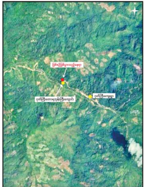
PDF အမည်ခံအကြမ်းဖက်သမားများက အကြောင်းမဲ့ပစ်ခတ်တိုက်ခိုက်ခဲ့မှုကြောင့် ငမဲမြို့နယ် ဂုတ်ကြီးကျေးရွာမှ ဖခင်ဖြစ်သူနှင့် အသက်လေးနှစ်အရွယ် သမီးငယ်တစ်ဦး သေဆုံးခဲ့မှု ဖြစ်စဉ်ပြပုံ

နေပြည်တော် စက်တင်ဘာ ၂၈ မကွေးတိုင်းဒေသကြီး ငမဲမြို့နယ် ဂုတ်ကြီးကျေးရွာမှ ဖခင်နှင့် သမီးငယ်တို့ နှစ်ဦးသည် ကျေးရွာရှိ တောရတနာတော်ကြီးကျောင်းသို့ ဆွမ်းချိုင့်ပို့ရန် သွားရောက်စဉ် PDF အမည်ခံအကြမ်းဖက်သမားများက လက်နက်ငယ်များဖြင့် အကြောင်းမဲ့ပစ်ခတ်ခဲ့ရာ ဖခင်ဖြစ်သူနှင့် အသက်လေးနှစ်အရွယ် သမီးတို့ သေဆုံးခဲ့ကြောင်း သိရသည်။