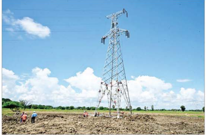
ကင်းသာလမ်းခွဲအနီးရှိ ဓာတ်အားလိုင်းတာဝါတိုင် ပြန်လည်ပြုပြင်ဆောင်ရွက်နေမှုကို တွေ့ရစဉ်။

နဝင်းချောင်းတံတား(အဆုံ) ချဉ်းကပ်လမ်းကမ်းကပ်ခံ ဆောင်ရွက်နေမှု ယင်းနောက် နိုင်ငံတော်စီမံအုပ်ချုပ်ရေးကောင်စီ ဥက္ကဋ္ဌ နိုင်ငံတော်ဝန်ကြီးချုပ်နှင့် အဖွဲ့ဝင်များသည် နဝင်းချောင်းတံတား(အဆုံ)နေရာသို့ ရောက်ရှိကြပြီး ရေတိုက်စားမှုကြောင့် တံတားချဉ်းကပ်လမ်း ပြိုကျပျက်စီးခဲ့မှုအား ယာယီဘေးလိပ်တား တည်ဆောက် ပြုပြင်ပြီးစီးမှုနှင့် တံတားချဉ်းကပ်လမ်း ကမ်းကပ်ခံအတွက် စားသောက်ဖွယ်ရာများ ပေးအပ်ကာ ရင်းရင်းနှီးနှီးနှုတ်ဆက်သည်။ ထို့နောက် နန်းများဖယ်ရှားရှင်းလင်းခြင်းနှင့် သန့်ရှင်းရေးလုပ်ငန်းများ ဆောင်ရွက်ပေးနေကြသည့် မြန်မာနိုင်ငံရဲတပ်ဖွဲ့ဝင်