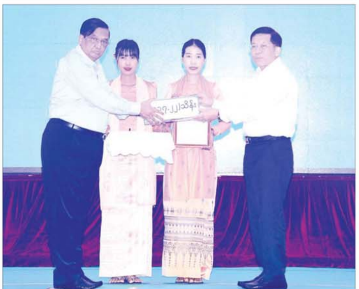
နိုင်ငံတော်စီမံအုပ်ချုပ်ရေးကောင်စီဥက္ကဋ္ဌ နိုင်ငံတော်ဝန်ကြီးချုပ် ဗိုလ်ချုပ်မှူးကြီး မင်းအောင်လှိုင် ရေဘေးဒဏ်သင့်ခဲ့ရသည့် ဒေသများ၌ ကူညီကယ်ဆယ်ရေးနှင့် ပြန်လည်ထူထောင်ရေးလုပ်ငန်းများ ဆောင်ရွက်ရန်အတွက် စက်မှုဝန်ကြီးဌာနက လှူဒါန်းသည့် အလှူငွေကို လက်ခံရယူစဉ်။

ရာဂီမုန်တိုင်းနှင့် ဆက်စပ်ဖြစ်ပွားသော ရေဘေးကြောင့် ရေဘေးဒဏ်သင့်ခဲ့ရသည့် ဒေသများ၌ ကူညီကယ်ဆယ် ရေးနှင့် ပြန်လည်ထူထောင်ရေး လုပ်ငန်းများ ဆောင်ရွက်ရန် အတွက် ဝန်ကြီးဌာနများ၊ တိုင်းဒေသကြီးနှင့်ပြည်နယ်အစိုးရ အဖွဲ့များနှင့် ဝန်ထမ်းများ၊ ပြည်တွင်း ပြည်ပ စေတနာရှင်၊ အလှူရှင်များက အလှူငွေများ ပေးအပ်လှူဒါန်းကြရာ နိုင်ငံတော် စီမံအုပ်ချုပ်ရေးကောင်စီ ဥက္ကဋ္ဌ နိုင်ငံတော်ဝန်ကြီးချုပ် ဗိုလ်ချုပ် မှူးကြီး မင်းအောင်လှိုင်က လက်ခံ ရယူပြီး ဂုဏ်ပြုမှတ်တမ်းလွှာ စာမျက်နှာ ၆ သို့ ၈