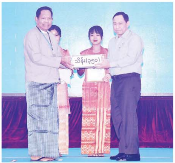
နိုင်ငံတော်စီမံအုပ်ချုပ်ရေးကောင်စီအဖွဲ့ဝင် ဒုတိယဗိုလ်ချုပ်ကြီး ရာပြည့် စေတနာရှင်၊ အလှူရှင်တစ်ဦးက လှူဒါန်းသည့် အလှူငွေကို လက်ခံရယူစဉ်။