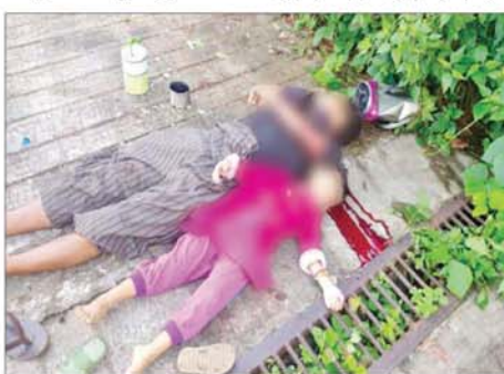
PDF အမည်ခံအကြမ်းဖက်သမားများက အကြောင်းမဲ့ပစ်ခတ်တိုက်ခိုက်ခဲ့မှုကြောင့် ငမဲမြို့နယ် ဂုတ်ကြီးကျေးရွာမှ ဖခင်ဖြစ်သူနှင့် အသက်လေးနှစ်အရွယ် သမီးငယ်တစ်ဦး သေဆုံးခဲ့မှုအား တွေ့မြင်ရစဉ်။

နေပြည်တော် စက်တင်ဘာ ၂၈ မကွေးတိုင်းဒေသကြီး ငမဲမြို့နယ် ဂုတ်ကြီးကျေးရွာမှ ဖခင်နှင့် သမီးငယ်တို့ နှစ်ဦးသည် ကျေးရွာရှိ တောရတနာတော်ကြီးကျောင်းသို့ ဆွမ်းချိုင့်ပို့ရန် သွားရောက်စဉ် PDF အမည်ခံအကြမ်းဖက်သမားများက လက်နက်ငယ်များဖြင့် အကြောင်းမဲ့ပစ်ခတ်ခဲ့ရာ ဖခင်ဖြစ်သူနှင့် အသက်လေးနှစ်အရွယ် သမီးတို့ သေဆုံးခဲ့ကြောင်း သိရသည်။