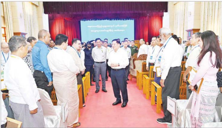
နိုင်ငံတော်စီမံအုပ်ချုပ်ရေးကောင်စီဥက္ကဋ္ဌ နိုင်ငံတော်ဝန်ကြီးချုပ် ဗိုလ်ချုပ်မှူးကြီးမင်းအောင်လှိုင် စေတနာရှင် အလှူရှင်များအား ရင်းရင်းနှီးနှီး နှုတ်ဆက်စဉ်။

ဆက်လက်ပြောကြားရာတွင် မိမိတို့အနေဖြင့် နိုင်ငံတော်တွင် ဖြစ်ပေါ်ခဲ့သည့် သဘာဝဘေးဒဏ်များကို သင်ခန်းစာယူပြီး နောင် ဖြစ်ပေါ်ချိန်များတွင် ထိခိုက်ပျက်စီးမှု အနည်းဆုံးဖြစ်စေရေး ကြိုတင်ပြင်ဆင်မှုများကို ဆောင်ရွက်သွားရန်လိုကြောင်း၊ နိုင်ငံအတွင်းရှိ မြစ်များ၊ ချောင်းများ တစ်လျှောက်၌ ရေလမ်းကြောင်း ထိန်းသိမ်းခြင်း လုပ်ငန်းများကို စနစ်တကျဖြင့် နှစ်စဉ်ဆောင်ရွက်သွားရန်လိုကြောင်း၊ စာသင်ကျောင်းများ၊ ဆေးရုံများအပါအဝင် အများပြည်သူလူထုနှင့် သက်ဆိုင်သည့် အဆောက်အအုံများ၊ မြို့ပြများ အသစ်တည်ဆောက်ရာတွင်လည်း ဖြစ်ပေါ်လာနိုင်သည့် သဘာဝဘေးအန္တရာယ်ကို အဘက်ဘက်မှ ထည့်သွင်း