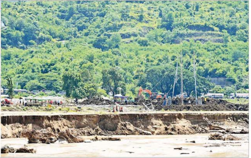
နိုင်ငံတော်စီမံအုပ်ချုပ်ရေးကောင်စီဥက္ကဋ္ဌ နိုင်ငံတော်ဝန်ကြီးချုပ် ဗိုလ်ချုပ်မှူးကြီးမင်းအောင်လှိုင် ကင်းသာလမ်းခွဲအနီးရှိ ဓာတ်အားလိုင်းတာဝါတိုင်ပြုလုပ်ပျက်စီးမှုများအား ပြန်လည်ပြုပြင်ရေး ဆောင်ရွက်နေမှုကို ကြည့်ရှုစစ်ဆေးစဉ်။