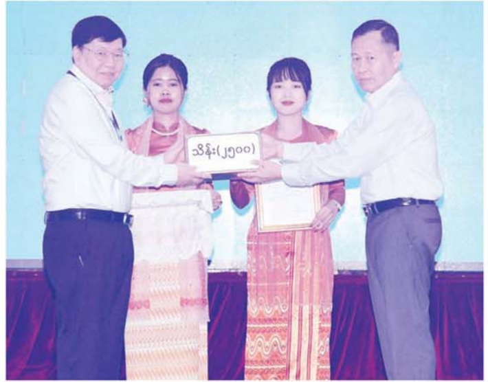
နိုင်ငံတော်စီမံအုပ်ချုပ်ရေးကောင်စီ ဒုတိယဥက္ကဋ္ဌ ဒုတိယဝန်ကြီးချုပ် ဒုတိယဗိုလ်ချုပ်မှူးကြီးစိုးဝင်း ရေးဘေးဒဏ်သင့်ခဲ့ရသည့်ဒေသများ၌ ကူညီကယ်ဆယ်ရေးနှင့် ပြန်လည်ထူထောင်ရေးလုပ်ငန်းများ ဆောင်ရွက်ရန်အတွက် စေတနာရှင်၊ အလှူရှင်တစ်ဦးက လှူဒါန်းသည့် အလှူငွေကို လက်ခံရယူစဉ်။