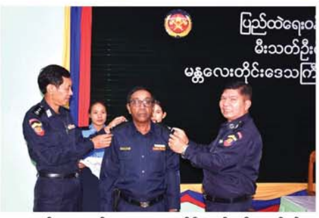
အခမ်းအနားတွင် မန္တလေး အရန်မီးသတ်ဒုတိယတပ်ရင်းမှူးရာထူးသို့ တိုးမြှင့်ခန့်ထားခြင်းခံရသော မဟာအောင်မြေမြို့နယ်မှ အရန်မီးသတ်ဒုတိယတပ်ရင်းမှူးရာထူးမှ နှင့် အောင်မြေသာစံမြို့နယ်မှ

မန္တလေး စက်တင်ဘာ ၂၀ ပြည်ထဲရေးဝန်ကြီးဌာန၊ မီးသတ်ဦးစီးဌာန၊ မန္တလေးတိုင်းဒေသကြီး မီးသတ်ဦးစီးမှူးရုံးတွင် အရန်မီးသတ်ဒုတိယတပ်ရင်းမှူးရာထူးမှ အရန်မီးသတ်ဒုတိယတပ်ရင်းမှူးရာထူးသို့ တိုးမြှင့်ခန့်ထားခံရသူများအား ရာထူးအဆင့် တံဆိပ်တပ်ဆင်ပွဲအခမ်းအနားကို စက်တင်ဘာ ၂၇ရက် ဖြန်းလွှဲ ၂၃၁၅ရက် ချမ်းအေးသာစံမြို့နယ် စာလမ်းနှင့်၂၉လမ်းထောင့်၊ ဗဟိုမီးသတ်စခန်း၊ မန္တလေးတိုင်းဒေသကြီး မီးသတ်ဦးစီးဌာန အစည်းအဝေးခန်းမတွင် ကျင်းပသည်။