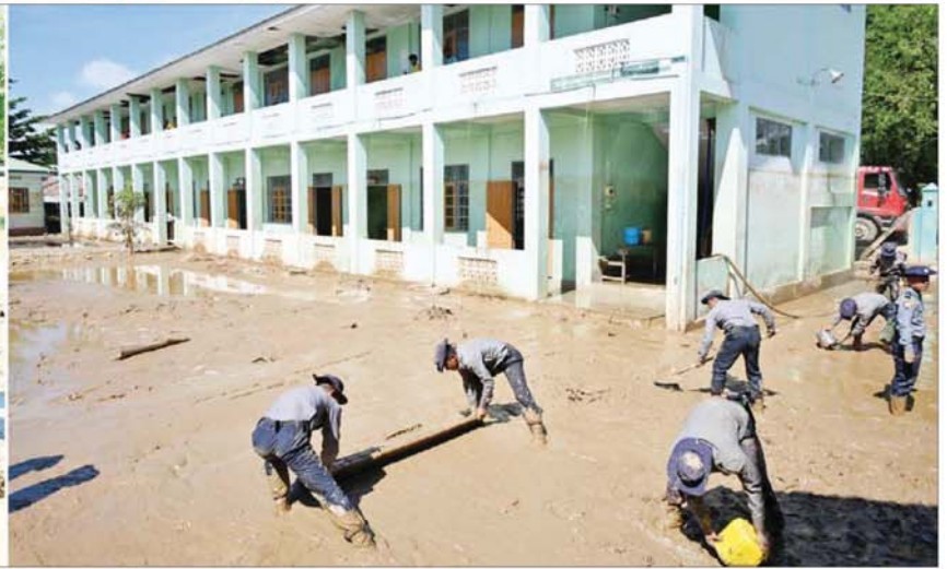
နိုင်ငံတော်စီမံအုပ်ချုပ်ရေးကောင်စီဥက္ကဋ္ဌ နိုင်ငံတော်ဝန်ကြီးချုပ် ဗိုလ်ချုပ်မှူးကြီးမင်းအောင်လှိုင် အခြေခံပညာအထက်တန်းကျောင်းခွဲ(ဆင်သေ)၌ နန်းများဖယ်ရှားရှင်းလင်းခြင်းနှင့် သန့်ရှင်းရေးလုပ်ငန်းများ ဆောင်ရွက်နေမှုကို ကြည့်ရှုစစ်ဆေးစဉ်။

။။ စာမျက်နှာ ၃ မှ တူးမြောင်းများ၌ ရေဝင်ရေထွက် ကောင်းမွန်စေရန် နှစ်စဉ်စစ်ဆေး မှုများ ပြုလုပ်နေရန် လိုကြောင်းနှင့် အခြားလိုအပ်သည်များကို ဖွဲ့စည်း သည့်။