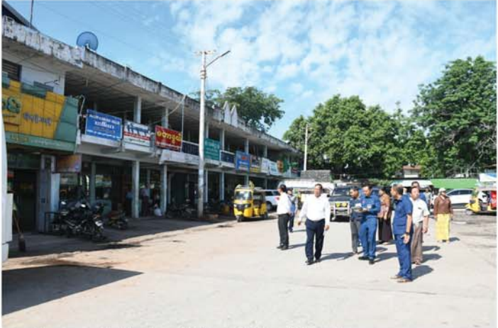
လာမည့်ဘဏ္ဍာရေးနှစ်တွင် ကွန်ကရစ်ခင်းပေးရန်တို့ကို မှာကြားခဲ့သည်။

ရှေးဦးစွာ မြို့တော်ဝန်နှင့်အဖွဲ့သည် သိရိမန္တလာအဝေးပြေးခရီးသည်တင်ယာဉ်ရပ်နားစခန်းဝင်းပေါက်ရှိ ဆိုင်ကယ်နှင့် မော်တော်ယာဉ်များ ဝင်ကြေးကောက်ခံသည့် ဂိတ်တွင် ကွန်ပျူတာ(ETC)စနစ်ဖြင့် သတ်မှတ်နှုန်းထားအလိုက် ကောက်ခံဆောင်ရွက်နေမှုကို ကြည့်ရှုစစ်ဆေးခဲ့ပြီး မြို့တော်ဝန်က ယာဉ်ရပ်နားစခန်းသို့ ဝင်ရောက်သည့် ဆိုင်ကယ်လမ်းအား ကားများဝင်ရောက်နိုင်သည့်အထိ တိုးချဲ့ပြုပြင်ပေးရန်၊ လမ်းကာတုံးများရှိ ဖြူ၊ နီကြားများအား ဆေးသုတ်ပေးရန်နှင့် ပင်မဂိတ်ခန်းမအဆောက်အအုံကြီးအား ဆေးရောင်များ မကောင်းတော့၍ ဆေးသုတ်မွမ်းမံပြင်ဆင်ပေးရန်၊ ပြုပြင်ရန်ကုန်ရှိနေသေးသည့် ကားဝင်းပတ်လည် ဂိတ်ခန်းများ၊ ဈေးဆိုင်ခန်းများ၊ စားသောက်ဆိုင်များအား နှစ်အလိုက် ပုံစံတစ်ပြေးညီအဆင့်မီ ပြန်လည်ပြုပြင်ပေးသင့်သည့်နှစ်အလိုက် ရေးဆွဲ၍ ဘဏ္ဍာငွေထည့်သွင်းပြုပြင်ဆောင်ရွက်ပေးရန်နှင့် ကားကွင်းအတွင်း ယာဉ်ရပ်နားနေရာများ၌ မြေသားများ ကျန်ရှိနေခြင်းအား