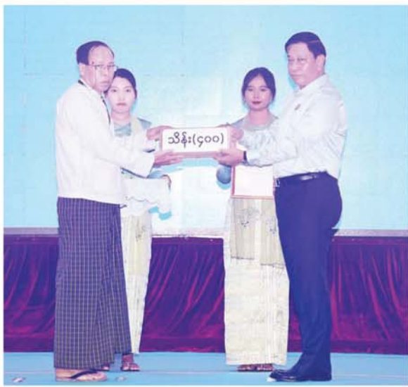
နိုင်ငံတော်စီမံအုပ်ချုပ်ရေးကောင်စီအဖွဲ့ဝင် ဗိုလ်ချုပ်ကြီး တင်အောင်စန်း စေတနာရှင်၊ အလှူရှင်တစ်ဦးက လှူဒါန်းသည့် အလှူငွေကို လက်ခံရယူစဉ်။

ယင်းနောက် နိုင်ငံတော်စီမံ အုပ်ချုပ်ရေးကောင်စီ ဥက္ကဋ္ဌ နိုင်ငံတော်ဝန်ကြီးချုပ်က အလှူငွေ များ ပေးအပ်လှူဒါန်းမှုအပေါ် ကျေးဇူးတင်စကား ပြန်လည် ပြောကြားရာတွင် သဘာဝဘေး အန္တရာယ် ကြုံတွေ့ခဲ့ရသည့် ဒေသများ၌ ကူညီကယ်ဆယ်ရေး နှင့် ပြန်လည်ထူထောင်ရေး လုပ်ငန်းများ ဆောင်ရွက်ရန် အတွက် အလှူငွေများပေးအပ်ကြ မှုအပေါ် နိုင်ငံတော်အနေဖြင့် ကျေးဇူးတင်ရှိကြောင်း၊ ယခု အကြိမ်သည် ဒုတိယအကြိမ် လှူဒါန်းမှုဖြစ်ပြီး ပထမအကြိမ် လှူဒါန်းမှု အခမ်းအနားတွင် ငွေကျပ် ၃၂ ဒသမ ၂ ဘီလီယံ ကျော်ကို လက်ခံရရှိခဲ့ကြောင်း၊ အခက်အခဲများကြားမှ စိတ် စေတနာ ထက်သန်စွာဖြင့် လှူဒါန်းခဲ့ကြခြင်း ဖြစ်ကြောင်း၊ ပြန်လည်ထူထောင်ရေး လုပ်ငန်း များကို အမြန်ဆုံးဆောင်ရွက်နိုင် ရေးအတွက် အလှူငွေလက်ခံခြင်း များကို ဆောင်ရွက်ခဲ့ကြခြင်း ဖြစ်ပြီး ယနေ့ ဒုတိယအကြိမ် အလှူငွေပေးအပ်လှူဒါန်းပွဲတွင် ငွေကျပ် ၁၀ ဘီလီယံကျော်ကို ပေးအပ် လှူဒါန်းခဲ့ကြကြောင်း၊ အလားတူ မိမိတို့အစီအစဉ်ဖြင့် ရေးဘေးသင့်ဒေသများကို သွား ရောက် လှူဒါန်းလျက်ရှိသည့် စေတနာရှင် ပြည်သူများသည် လည်း များစွာရှိပြီး မိမိတို့နိုင်ငံသား များအနေဖြင့် လူမှုရေးကိစ္စရပ် များတွင် စေတနာသဒ္ဓါတရားထက် သန်စွာဖြင့် လှူဒါန်းလိုသည့် စိတ်ရင်းစေတနာများ၊ အခြေခံ စိတ်ဓာတ်ကောင်းများ ကို ဝမ်းမြောက်ဖွယ်တွေ့ရကြောင်း။