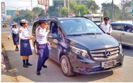
အဆိုပါယာဉ်စည်းကမ်း၊ လမ်းစည်းကမ်းဆိုင်ရာစစ်ဆေးရာတွင် မော်တော်ဆိုင်ကယ်များ ယာဉ်နံပါတ်ပြားပါရှိခြင်း ရှိ၊ မရှိ၊ မော်တော်ယာဉ်လိုင်စင်နှင့် ဆိုင်ကယ်လိုင်စင်များပါရှိခြင်း ရှိ၊ မရှိ၊ ဆိုင်ကယ်စီနင်းမောင်းနှင်သူများ ဆိုင်ကယ်စီနင်းထုတ်ဝတ်ဆင်မောင်း

မန္တလေး၊ မဟာအောင်မြေမြို့နယ်၊ အမှတ်(၉၀)ယာဉ်ထိန်းရဲတပ်ဖွဲ့မှ တပ်ဖွဲ့ဝင်များသည် ယာဉ်စည်းကမ်း၊ လမ်းစည်းကမ်းများနှင့်ပတ်သက်၍ မော်တော်ယာဉ်မောင်းနှင်သူနှင့် ဆိုင်ကယ်စီနင်းသူများအား ယာဉ်အန္တရာယ်ကင်းရှင်းရေးစစ်ဆေးခြင်းများကို စက်တင်ဘာ ၂၆ ရက် ညနေ ၄ နာရီက ၃၅လမ်းနှင့် ၆၉လမ်းထောင့်မီးပွိုင့်လမ်းဆုံတွင် ဆောင်ရွက်ခဲ့သည်။