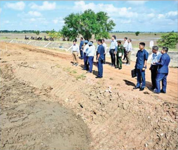
နိုင်ငံတော်စီမံအုပ်ချုပ်ရေးကောင်စီဥက္ကဋ္ဌ နိုင်ငံတော်ဝန်ကြီးချုပ် ဗိုလ်ချုပ်မှူးကြီးမင်းအောင်လှိုင် ပေါင်းလောင်း(အဝေရာဆည်)လက်ယာရေပေးမြောင်းမကြီး၌ ရေတိုက်စားခံရမှုကြောင့် မြောင်းတာပေါင် ကျိုးပေါက်ခဲ့သည့်နေရာများအား ပြန်လည်ပြင်ဆင်နေမှုကို ကြည့်ရှုစစ်ဆေးစဉ်။