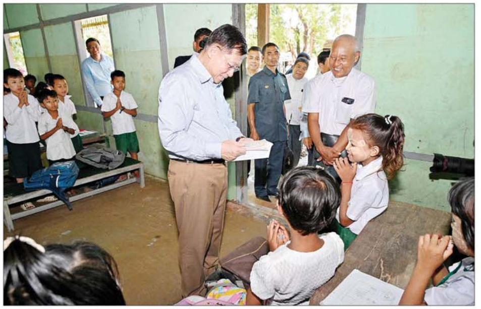
နိုင်ငံတော်စီမံအုပ်ချုပ်ရေးကောင်စီဥက္ကဋ္ဌ နိုင်ငံတော်ဝန်ကြီးချုပ် ဗိုလ်ချုပ်မှူးကြီး မင်းအောင်လှိုင် အဆိုစီးကုန်းကျေးရွာ အခြေခံပညာမူလတန်းကျောင်း၌ ကျောင်းသား ကျောင်းသူများ စာပေသင်ကြားနေမှုကို ကြည့်ရှုအားပေးစဉ်။

ပေါ်ရှိ သိုက်ချောင်းတံတား (ဆင်သေချောင်းကျ) သိုက်ချောင်းဘက်သို့ အသွားတံတား တံတားရေလယ်တိုင်(Pier)များ နိမ့်ကျခြင်းဖြစ်ပေါ်နေမှုကို ပြန်လည်ပြင်ဆင်နေမှု အခြေအနေများအား သွားရောက်ကြည့်ရှုစစ်ဆေးရာ ဆောက်လုပ်ရေး ဝန်ကြီးဌာနပြည်ထောင်စုဝန်ကြီးနှင့် တာဝန်ရှိသူများက လုပ်ငန်းဆောင်ရွက်နေမှု အခြေအနေများကို ရှင်းလင်းတင်ပြသည်။