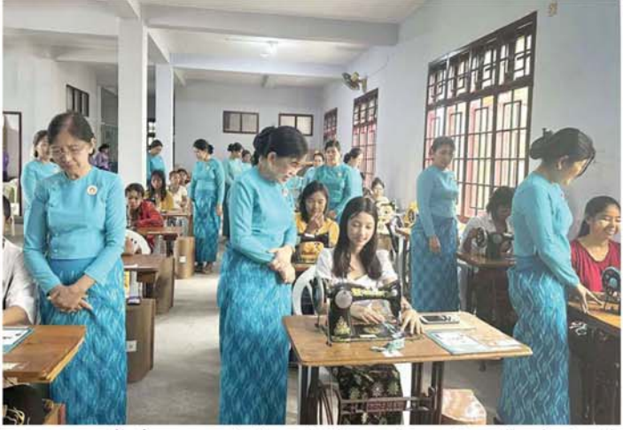
မန္တလေး စက်တင်ဘာ ၂ မန္တလေးတိုင်းဒေသကြီး အမျိုးသမီးရေးရာအဖွဲ့မှ ကြီးပွား ဖွင့်ပွဲအခမ်းအနားအဖြစ်ကျင်းပခဲ့သည့် အခြေခံစက်ချုပ် သင်တန်းအမှတ်စဉ်(၁/၂၀၂၄) ဖွင့်ပွဲအခမ်းအနားကို ယနေ့ နံနက် ပိုင်းက မဟာအောင်မြေမြို့နယ် ရှိ တိုင်းဒေသကြီးအမျိုးသမီးရေး ရာအဖွဲ့မှာကျင်းပ ကျင်းပခဲ့သည်။ အခမ်းအနားသို့ မန္တလေး တိုင်းဒေသကြီး အမျိုးသမီးရေး ရာအဖွဲ့မှာကျင်းပ ကျင်းပခဲ့သည်။