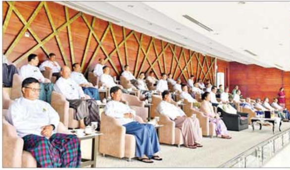
နိုင်ငံတော်စီမံအုပ်ချုပ်ရေးကောင်စီအဖွဲ့ဝင်များနှင့် တာဝန်ရှိသူများ ၂၀၂၄ ခုနှစ် ဝန်ကြီးဌာနပေါင်းစုံ တက္ကသိုလ်များ ဘောလုံးပြိုင်ပွဲ ဖွင့်ပွဲအခမ်းအနားပေးစဉ်။

အခမ်းအနားသို့ နိုင်ငံတော်စီမံအုပ်ချုပ်ရေးကောင်စီ အဖွဲ့ဝင်များ ဖြစ်ကြသည့် ဒေါ်ခွဲတု၊ ပိုးရယ်အောင်သိန်း၊ မန်းမြမ်းမောင်၊ ဒေါက်တာမူထွန်း၊ ဒေါက်တာဘရွှေဦးရန်ကျော်၊ ပြည်ထောင်စုဝန်ကြီးများ၊ ဒုတိယဝန်ကြီးများ၊ ဌာနဆိုင်ရာတာဝန်ရှိသူများ၊ ပါမောက္ခချုပ်များ၊ ကျောင်းအုပ်ကြီးများ၊ ဆရာ ဆရာမများ၊ စိတ်ကြားထားသည့် စည်သူညောင်တော်များ၊ ပြိုင်ပွဲဝင်အသင်းများမှ အုပ်ချုပ်သူ/နည်းပြများနှင့် အားကစားသမားများ တက်ရောက်ကြသည်။