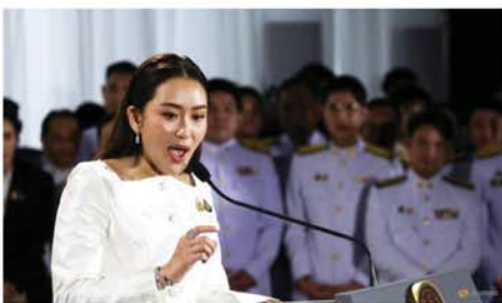
စက်တင်ဘာလလယ်လောက် မှ အစိုးရဖွဲ့စည်းပြီးနောက် ဖွဲ့စည်း ဖွဲ့စည်းပြီးဖြစ်သည် ဟု ထိုင်းအစိုးရအဖွဲ့အဖွဲ့ဝင် အကဲအချို့ သြဂုတ်လအတွင်းက ခန့်မှန်းခဲ့သော်လည်း ယခု ဆော လျင်စွာ ပြီးစီးခဲ့ခြင်းဖြစ်သည်။ ဘဏ္ဍာရေးနှင့် နိုင်ငံခြားရေး ဝန်ကြီး ပြောင်းလဲမည်မဟုတ်ဘဲ

ဘန်ကောက် စက်တင်ဘာ ၂ အစိုးရအဖွဲ့သစ် ဖွဲ့စည်းပြီး ဖြစ်သည်ဟု ထိုင်းဝန်ကြီးချုပ် ပေတုန်တန်ရှိရာဝါထရာ စက် တင်ဘာ ၂ ရက်က အတည်ပြု ပြောကြားလိုက်ကြောင်း စီအင်နို အေသတင်းဌာနက ဖော်ပြသည်။ ထိုသို့ ဖွဲ့စည်းပြီးသော အစိုးရဝန်ကြီးအဖွဲ့ကို ရှေ့အပတ် တွင် ထိုင်းဘုရင်က လက်ခံ အတည်ပြုပေးမည်ဖြစ်ကြောင်း ၎င်းက ဆက်လက်ရှင်းလင်းပြော ကြားသည်။