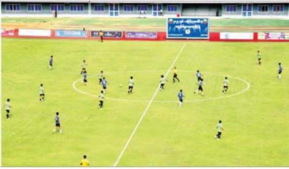
နိုင်ငံတော်စီမံအုပ်ချုပ်ရေးကောင်စီအဖွဲ့ဝင်များနှင့် တာဝန်ရှိသူများ ၂၀၂၄ ခုနှစ် ဝန်ကြီးဌာနပေါင်းစုံ တက္ကသိုလ်များ ဘောလုံးပြိုင်ပွဲ ဖွင့်ပွဲအခမ်းအနားပေးစဉ်။

ထက်မြက်သည့် တက္ကသိုလ်ကျောင်းသား အားကစားသမားများကို ရွေးချယ်လေ့ကျင့်ပြီး အာဆီယံ တက္ကသိုလ်များအားကစားပြိုင်ပွဲ အပါအဝင် နိုင်ငံတကာပြိုင်ပွဲများတွင် ပါဝင်ယှဉ်ပြိုင်ကြစေမည် ဖြစ်ပါကြောင်း။