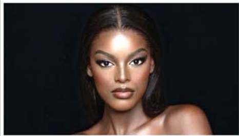
၂၀၂၄ ခုနှစ် နိုင်ငံ့ရိုးရိုးယားမယ် သရဖူဆောင်းခဲ့သော အသက် ၂၃ နှစ်အရွယ် တောင်အာဖရိက အလှမယ် ချီဒင်မိ မာအဒက်ရှိဟာကို တွေ့ရစဉ်။ Mon

နိုင်ငံမြောက်ပိုင်းသို့ ဝင်ရောက် တိုက်ခတ်ခဲ့သည်။ မနီလာမြို့တော် အရှေ့တောင်ဘက် ဘီကောလ် လာခဲ့သည်။ ဒေသအတွင်းသို့လည်း ယာဂီမုန် တိုင်း အရှိန်အဟုန်ဖြင့် ဝင်ရောက် လာခဲ့သည်။ လူစုန့်ကျွန်းအရှေ့မြောက် ဘက် ကမ်းရိုးတန်းတစ်လျှောက် တွင် မြေပြိုမှုများဖြစ်ပွားကာ ပျက်စီးမှုအခြေအနေဆိုးရွားခဲ့ သည်။ ရေကြီးမှုကြောင့် အသွား အလာခက်ခဲသဖြင့် မနီလာနှင့် အခြားမြို့ကြီးများတွင် စက်တင် ဘာ ၂ ရက်က စာသင်ကျောင်း များနှင့် အစိုးရရုံးဌာနများကို ပိတ် ထားကြောင်း သိရသည်။ Mon