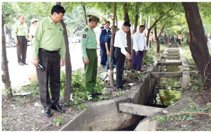
သတင်း-စာမျက်နှာ ၄