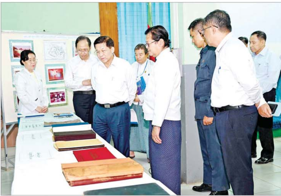
နိုင်ငံတော်စီမံအုပ်ချုပ်ရေးကောင်စီဥက္ကဋ္ဌ နိုင်ငံတော်ဝန်ကြီးချုပ် ဗိုလ်ချုပ်မှူးကြီး မင်းအောင်လှိုင် ခင်းကျင်းပြသထားသည့် စစ်တပ်မှူးကြီး ဦးကျော်စွာ၏အဖွဲ့အစည်းနှင့်အတူ သွားရောက်ကြည့်ရှုစစ်ဆေး၊ ကျန်းမာရေးဝန်ထမ်းများအား တွေ့ဆုံအမှာစကားပြောကြားစဉ်။

ထို့နောက် ဆေးရုံကြီး အစည်း အဝေးခန်းမတွင် ဆေးရုံအုပ်ကြီး ဒေါက်တာ ဝင်းမော်ဦးက ဆေးရုံ၏ သမိုင်းအကျဉ်း၊ အဆောက်အအုံ များ ဆောက်လုပ်ထားရှိမှုနှင့် လူနာဆောင်သစ်များ ဆောက်လုပ် ထားရှိမှု၊ ကင်ဆာရောဂါကုသရေး လုပ်ငန်းများ ဆောင်ရွက်လျက်ရှိမှု၊ လအလိုက် ဆေးကုသမှုလုပ်ငန်း များဆောင်ရွက်နေမှု၊ အထူး ကြပ်မတ်ကုသမှုများ ဆောင်ရွက် နိုင်မှု၊ ဓာတ်မှန်လုပ်ငန်းများဆောင်