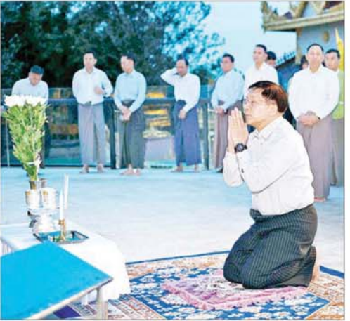
နိုင်ငံတော်စီမံအုပ်ချုပ်ရေးကောင်စီဥက္ကဋ္ဌ နိုင်ငံတော်ဝန်ကြီးချုပ် ဗိုလ်ချုပ်မှူးကြီးမင်းအောင်လှိုင် တောင်ကြီးမြို့ကျက်သရေဆောင် ရွှေဘုန်းပွင့်စေတီတော်မြတ်ကြီးအား ဖူးမြော်ကြည့်ညိဉ်း

အဆက်ဆက်တွင် ထိန်းထိန်းသိမ်းသိမ်းဖြင့်သာ ဖြေရှင်းဆောင်ရွက်ခဲ့မှု၊ အချို့သော တိုင်းရင်းသားလက်နက်ကိုင်အဖွဲ့များအနေဖြင့် နိုင်ငံတော်တွင် နိုင်ငံရေးအရ အကျပ်အတည်းများဖြစ်ပေါ်နေမှုကို အခွင့်ကောင်းရယူ၍ နယ်မြေချွတ်ရန် ကြိုးပမ်းဆောင်ရွက်မှုများကို ကြုံတွေ့လာခဲ့ရမှု၊ ၎င်းတို့၏ အကြမ်းဖက်လုပ်ရပ်များကြောင့် ဒေသခံပြည်သူများအနေဖြင့် နေရပ်ဒေသများနှင့် နေအိမ်စည်းစိမ်များကို စွန့်ခွာပြီး အခြားဘေးလွတ်ရာဒေသများတွင် ယာယီသွားရောက်ခိုလှုံနေကြရမှု၊ လက်ရှိအချိန်တွင် အဆိုပါလက်နက်ကိုင်အကြမ်းဖက်သောင်းကျန်းမှုများ အနေဖြင့် ၎င်းတို့ အဓမ္မဝင်ရောက်နေထိုင်နေသည့် မြို့ရွာများ၌ တပ်မတော်၏ တန်ပြန်ထိုးစစ်ဆင်မှုများကို တာဝန်ယူရန်အတွက် ပြည်သူတို့၏ နေအိမ်အဆောက်အအုံများ၊ အရပ်ဘက် အုပ်ချုပ်မှုဆိုင်ရာ အဆောက်အအုံများကို အသုံးပြုခြင်း၊ အပြစ်မဲ့ပြည်သူလူထုတို့ကို လူသားတတ်တိုင်းအဖြစ် အသုံးပြုနိုင်ရေး ယာယီနေရပ်စွန့်ခွာနေရသူများကို ပြန်လည်နေထိုင်ရန် ဆွဲဆောင်စည်းရုံးခြင်း၊ အတင်းအဓမ္မ လူသတ်စုဆောင်းခြင်းများကို လုပ်ဆောင်လျက်ရှိမှု၊