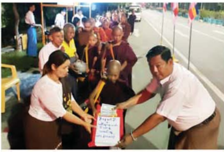
မန္တလေး စက်တင်ဘာ ၃ မြို့နယ်၊ မဟာမြိုင်(၁)ရပ်ကွက် မန္တလေး၊ မဟာအောင်မြေ အုပ်ချုပ်ရေးမှူးရုံးနှင့် ရပ်ကွက်

ဘုံဆွမ်းလောင်းအသင်းတို့၏ (၁၈)ကြိမ်မြောက် ဘုံဆွမ်းလောင်းလှူပွဲကို ယနေ့နံနက် ၅ နာရီခွဲက ဖိလမ်းနှင့် သိပ္ပံလမ်းတောင့်တွင် ကျင်းပသည်။