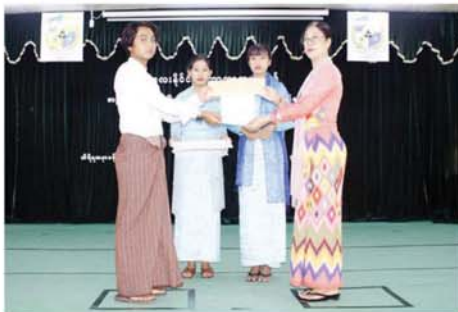
မန္တလေး စက်တင်ဘာ ၃ မန္တလေးနိုင်ငံခြားဘာသာတက္ကသိုလ် သီရိရတနာခန်းမ၌ မန္တလေးနိုင်ငံခြားဘာသာတက္ကသိုလ် သီရိရတနာခန်းမ၌ ကျင်းပသည့် Book Review Competition အက်ဖြတ်စိစစ်ရေးအဖွဲ့ဝင်များအား ဂုဏ်ပြုမှတ်တမ်းလွှာများကိုလည်းကောင်း၊ ပထမဆု၊ ဒုတိယဆု၊ တတိယဆုနှင့် သင်တန်းနှစ်အလိုက် ပထမဆု၊ ဒုတိယဆု၊ တတိယဆုရရှိကြသည့် ကျောင်းသား၊ ကျောင်းသူ များကိုလည်းကောင်း ပြောကြားခဲ့သည်။

မန္တလေး စက်တင်ဘာ ၃ မန္တလေးနိုင်ငံခြားဘာသာ တက္ကသိုလ် ၂၀၂၃-၂၀၂၄ ပညာသင်နှစ်နှင့် ၂၀၂၄-၂၀၂၅ ပညာသင်နှစ် စာကြည့်တိုက်များ ဖွံ့ဖြိုးတိုးတက်ရေးနှင့် စာပတ်ရိန်မြှင့်တင်ရေး Book Review Competition ဆုချီးမြှင့်ပွဲအခမ်းအနားကို ယနေ့ နံနက်ပိုင်းက မန္တလေးနိုင်ငံခြားဘာသာတက္ကသိုလ် သီရိရတနာခန်းမ၌ ကျင်းပသည်။