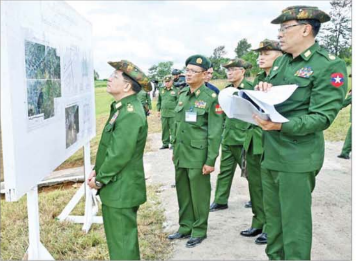
နိုင်ငံတော်စီမံအုပ်ချုပ်ရေးကောင်စီဥက္ကဋ္ဌ တပ်မတော်ကာကွယ်ရေးဦးစီးချုပ် ဗိုလ်ချုပ်မှူးကြီးမင်းအောင်လှိုင် ဆေးရုံအတွင်း မိတာ ၄၀၀ ပြေးလမ်းပါ ဘောလုံးကွင်းတည်ဆောက်ရန် ဆောင်ရွက်နေမှု အခြေအနေများကို ကြည့်ရှုစစ်ဆေးစဉ်။

အောင်ရွက်ရန်နှင့် ဆက်သွယ်နေသူများအနေဖြင့်လည်း အကြမ်းဖက်မှုများကို အားပေးနေကြသူများပင်ဖြစ်ကြောင်း။