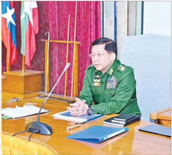
နိုင်ငံတော်စီမံအုပ်ချုပ်ရေးကောင်စီဥက္ကဋ္ဌ တပ်မတော်ကာကွယ်ရေးဦးစီးချုပ် ဗိုလ်ချုပ်မှူးကြီး မင်းအောင်လှိုင် အရှေ့ပိုင်းတိုင်းစစ်ဌာနချုပ်နယ်မြေအတွင်း နယ်မြေတည်ငြိမ်အေးချမ်းရေးဆိုင်ရာ ဆောင်ရွက်ထားရှိမှုများနှင့်ပတ်သက်၍ လမ်းညွှန်မှာကြားစဉ်။