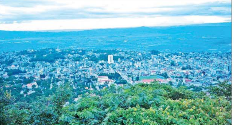
နိုင်ငံတော်စီမံအုပ်ချုပ်ရေးကောင်စီဥက္ကဋ္ဌ နိုင်ငံတော်ဝန်ကြီးချုပ် ဗိုလ်ချုပ်မှူးကြီးမင်းအောင်လှိုင် ရွှေဘုန်းပွင့်စေတီတော်မြတ်ကြီးပေါ်ရှိ ရှုခင်းသော View Point မှတစ်ဆင့် တောင်ကြီးမြို့၏ ရှုခင်းများကို ကြည့်ရှုစဉ်။