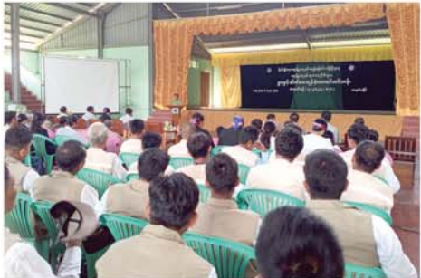
သစ်ပင်စိုက်ပျိုးမှု တိုက်ပွား သာယာလှပ စိမ်းမြေ့

အခမ်းအနားသို့ ကျောက်ဆည်တက္ကသိုလ် ပါမောက္ခချုပ်နှင့် ဒုတိယပါမောက္ခချုပ်များ၊ ဌာနမှူးများ၊ ကထိကများ၊ နည်းပြ၊ သရုပ်ပြ ဆရာ၊ ဆရာမများနှင့် နေ့သင်တန်း ကျောင်းသား၊ ကျောင်းသူများ တက်ရောက်ခဲ့ကြောင်း သိရသည်။