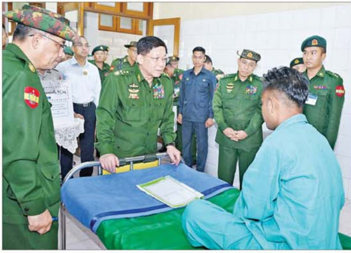
နိုင်ငံတော်စီမံအုပ်ချုပ်ရေးကောင်စီဥက္ကဋ္ဌ တပ်မတော်ကာကွယ်ရေးဦးစီးချုပ် ဗိုလ်ချုပ်မှူးကြီးမင်းအောင်လှိုင် နယ်မြေခံတပ်မတော်ဆေးရုံ၌ တက်ရောက်ကုသမှုခံယူလျက်ရှိသူတစ်ဦးအား ရင်းနှီးနွေးထွေးစွာ မေးမြန်းအားပေးစကားပြောကြားစဉ်။

ဦးစွာ အရှေ့ပိုင်းတိုင်းစစ်ဌာနချုပ် အစည်းအဝေးခန်းမတွင် တိုင်းမှူးဗိုလ်ချုပ် ဇော်မင်းလတ်က အရှေ့ပိုင်းတိုင်းစစ်ဌာနချုပ် နယ်မြေအတွင်း တပ်မတော်သားများ၊ မြန်မာနိုင်ငံရဲတပ်ဖွဲ့ဝင်များနှင့် ပြည်သူ့စစ်(ဌာန)အဖွဲ့ဝင်များ ပူးပေါင်း၍ နယ်မြေလုံခြုံရေးနှင့် လမ်းတံတားများ လုံခြုံရေးအတွက် ဆောင်ရွက်လျက်ရှိမှု၊ KNPP၊ KNDF အဖွဲ့နှင့် PDF အမည်ခံ အကြမ်းဖက်သမားများ၏တိုက်ခိုက်မှုကြောင့် ထိခိုက်ပျက်စီးမှုများ ဖြစ်ပေါ်ခဲ့သည့် လျှင်ကော်မြို့နှင့် အခြားမြို့များအား ပြန်လည်ထူထောင်ရေး လုပ်ငန်းများ ဆောင်ရွက်ပေးလျက်ရှိမှု နယ်မြေလုံခြုံရေးလုပ်ငန်းများ ဆောင်ရွက်စဉ် PDF အမည်ခံ အကြမ်းဖက် သမားများထံမှ လက်နက်ခဲယမ်းများ သိမ်းဆည်းရမိမှုနှင့် PDF အမည်ခံအကြမ်းဖက် သမားများ အလင်းဝင်ရောက်လာမှု တရားမဝင်သစ်များ ဖမ်းဆီးရမိမှု အခြေအနေများနှင့်ပတ်သက်၍ ရှင်းလင်းတင်ပြသည်။