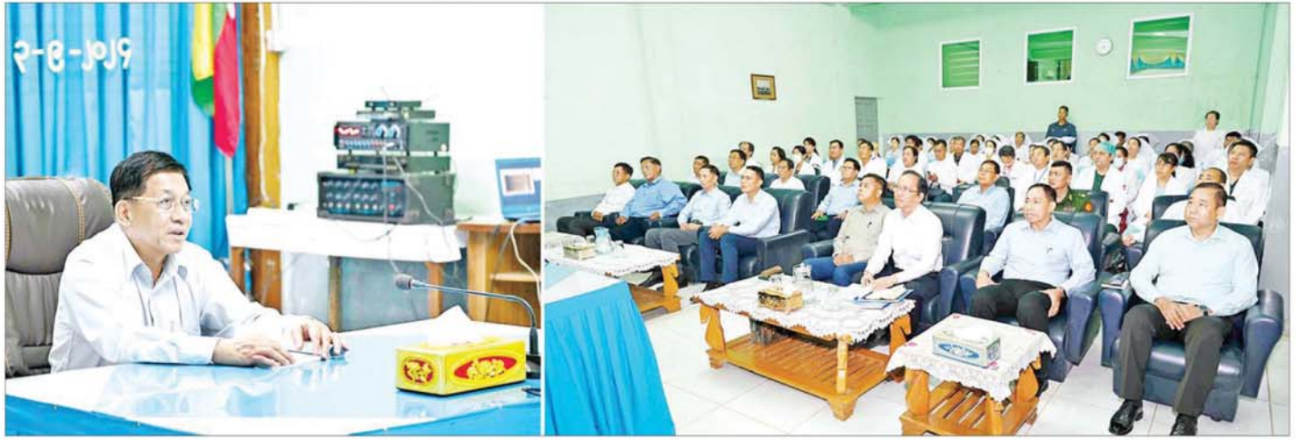
နိုင်ငံတော်စီမံအုပ်ချုပ်ရေးကောင်စီဥက္ကဋ္ဌ နိုင်ငံတော်ဝန်ကြီးချုပ် ဗိုလ်ချုပ်မှူးကြီး မင်းအောင်လှိုင် တောင်ကြီးမြို့ စစ်တပ်မှူးကြီး ဦးကျော်စွာ၏အဖွဲ့အစည်းနှင့်အတူ အစည်းအဝေးအစည်းအဝေးများအား တွေ့ဆုံအမှာစကားပြောကြားစဉ်။