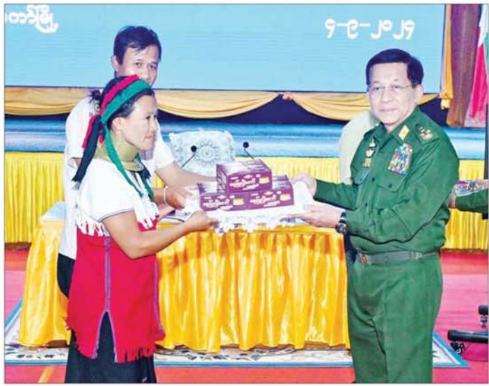
နိုင်ငံတော်စီမံအုပ်ချုပ်ရေးကောင်စီဥက္ကဋ္ဌ နိုင်ငံတော်ဝန်ကြီးချုပ် ဗိုလ်ချုပ်မှူးကြီး မင်းအောင်လှိုင် ယာယီနေရပ်စွန့်ခွာပြည်သူများအတွက် စားသောက်ဖွယ်ရာပစ္စည်းများနှင့် ထောက်ပံ့ရေးပစ္စည်းများ ပေးအပ်စဉ်။

ပူးပေါင်းပါဝင် ဆောင်ရွက်ကြရန် လိုကြောင်း၊ ဌာနဆိုင်ရာဝန်ထမ်း များအနေဖြင့် ယခုကဲ့သို့ ပြန်လည် ထူထောင်ရေး လုပ်ငန်းများ ဆောင်ရွက်ချိန်တွင် ဒေသအတွင်း ပြန်လည် ဝင်ရောက်နေထိုင်၍ လုပ်ငန်းတာဝန် ထမ်းဆောင်နေ မှုကို မိမိအနေဖြင့် ဂုဏ်ယူ အသိ အမှတ်ပြုချီးကျူးပါကြောင်း။ မိမိတို့အနေဖြင့် လွတ်လပ်၍ တရားမျှတသည့် ပါတီစုံဒီမို ကရေစီ အထွေထွေရွေးကောက် ပွဲပြန်လည်ကျင်းပနိုင်ရေး ကြိုတင် ပြင်ဆင် ဆောင်ရွက်လျက်ရှိ ကြောင်း၊ ထိုသို့ကြိုတင်ပြင်ဆင် ခြင်းလုပ်ငန်းများ ဆောင်ရွက်ရာ တွင် လူဦးရေနှင့်အိမ်အကြောင်း အရာသန့်ခေါင်စာရင်း ကောက် ယူခြင်းလုပ်ငန်းများကို အောက်တို ဘာလအတွင်း ဆောင်ရွက်သွား မည်ဖြစ်ကြောင်း၊ ကယားပြည်နယ် အတွင်း၌လည်း သန့်ခေါင်စာရင်း ကောက်ယူခြင်း လုပ်ငန်းများကို အောင်မြင်စွာ ဆောင်ရွက်နိုင်ရန် လိုကြောင်း၊ ရွေးကောက်ပွဲ မကျင်း ပမီ ကြိုတင်ပြင်ဆင်သည့် ကာလ အတွင်း ကိုယ်စားလှယ်လောင်း များအနေဖြင့် စည်းရုံးရေးလုပ်ငန်း များဆောင်ရွက်ရကြောင်း၊ ထိုသို့ ဆောင်ရွက်နိုင်ရန်အတွက် ဒေသ တွင်း တည်ငြိမ်အေးချမ်းမှုများ ရရှိအောင် ဆောင်ရွက်ကြရမည် ဖြစ်ကြောင်း မှာကြားသည်။