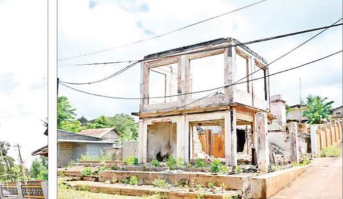
ဆီဆိုင်မြို့၌ အကြမ်းဖက်သမားများ၏ တိုက်ခိုက်မှုကြောင့် ပျက်စီးဆုံးရှုံးမှုများကို တွေ့ရစဉ်။