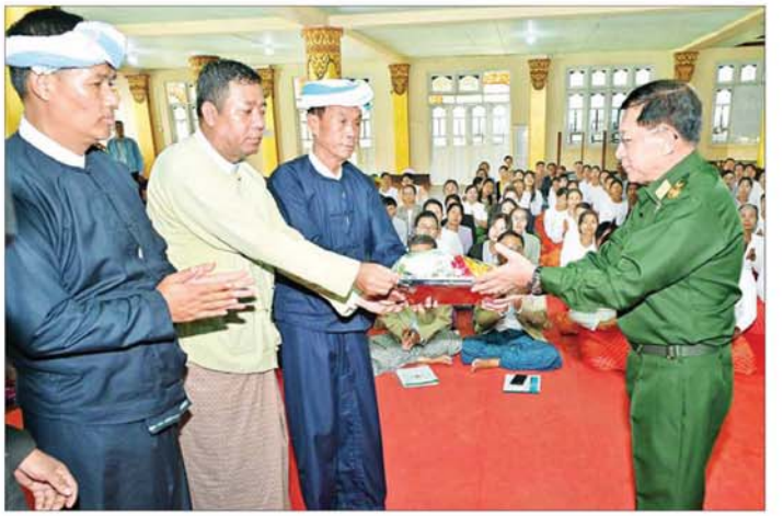
နိုင်ငံတော်စီမံအုပ်ချုပ်ရေးကောင်စီဥက္ကဋ္ဌ နိုင်ငံတော်ဝန်ကြီးချုပ် ဗိုလ်ချုပ်မှူးကြီးမင်းအောင်လှိုင် ဆီဆိုင်မြို့မှ ဒေသခံပြည်သူများအတွက် စားသောက်ဖွယ်ရာများနှင့် ထောက်ပံ့ရေးပစ္စည်းများ ပေးအပ်စဉ်။

စာမျက်နှာ ၄ မှ ဒေသဖြစ်ပြီး ဖွံ့ဖြိုးတိုးတက်ရေးကို အောင်မြင်စွာဆောင်ရွက်နိုင်မည့်အလားအလာကောင်းများကို ပိုင်ဆိုင်ထားသည့် ဒေသတစ်ခုလည်းဖြစ်ကြောင်း၊ သို့သော်လည်း အစဉ်အဆက် တည်ငြိမ်အေးချမ်း၍ ရိုးသားအေးချမ်းစွာနေထိုင်ခဲ့သော ပအိုဝ်းတိုင်းရင်းသားတို့၏ ဆီဆိုင်ဒေသသည် PNLO အကြမ်းဖက်အဖွဲ့၏ အခွင့်အလမ်းတစ်ခုကိုမျှော်မှန်းပြီး ဆောင်ရွက်သည့် မိုက်ခဲသည် အကြမ်းဖက်လုပ်ရပ်ကြောင့် ယခုကဲ့သို့ ထိခိုက်ပျက်စီးမှုများဖြစ်ပေါ်ခဲ့ကြောင်း၊ ဒေသတစ်ခု နိုင်ငံတစ်ခု ဖွံ့ဖြိုးတိုးတက်ရန်အတွက်မှာ ရပ်တန့်နေချိန်မရဘဲ ရှေ့သို့အစဉ်အဆက် ဆက်လက်လှမ်းချီနေရမည်၊ အလုပ်လုပ်နေရမည်ဖြစ်ကြောင်း၊ ရပ်တန့်နေပါက မိမိတို့အနေဖြင့် နောက်တွင် ကျန်နေခဲ့မည်ဖြစ်ကြောင်း၊ ယခုကဲ့သို့သော အကြမ်းဖက်လုပ်ရပ်များကြောင့် ပျက်စီးခဲ့ရသည်များကို ပြန်လည်ထူထောင်ရေးလုပ်ငန်းများ ဆောင်ရွက်နေခြင်းဖြင့် ဖွံ့ဖြိုးတိုးတက်မှုများ နှောင့်နှေးကြန့်ကြာနေကြောင်း၊ ဒေသ၏ တည်ငြိမ်အေးချမ်းရေးနှင့် ဖွံ့ဖြိုးတိုးတက်ရေးကို ဆောင်ရွက်နိုင်