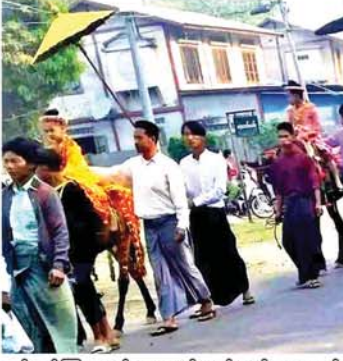
ဆင်ယင်ကြရာဝယ် ရွှေရောင်လှည်းယဉ်၊ ငွေရောင်လှည်းယဉ်များ စီးစေပြီး ကျင်းပကြသည်။

မြန်မာအလှူတော်ပွဲများကို လေ့လာကြည့်မိရာ ရိုးရာဓလေ့ယဉ်ကျေးမှုနှင့်အညီ ရှင်လောင်းလှည့်ပွဲပြုလုပ်လေ့ရှိသည်ကို တွေ့မြင်ရသောကြောင့် မိဘတို့သည် မိမိတို့၏ သားလှရတနာများဖြစ်ကြသော မောင်ရှင်လောင်းတို့ကို ဆင်စီးပြီး မြင်းရုံစေတတ်သည်။ သမီးအလှရတနာများကိုလည်း ကဏ္ဍပိန်အပ်သွားမြဲဖြင့် မြတ်နိုးသမင်္ဂလာ