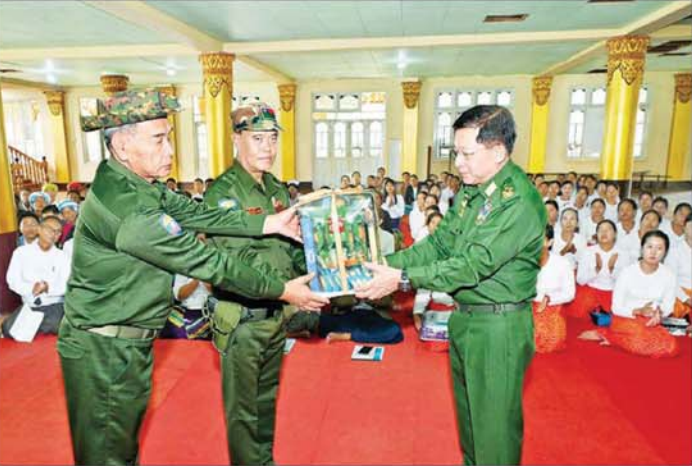
နိုင်ငံတော်စီမံအုပ်ချုပ်ရေးကောင်စီဥက္ကဋ္ဌ နိုင်ငံတော်ဝန်ကြီးချုပ် ဗိုလ်ချုပ်မှူးကြီး မင်းအောင်လှိုင် ပြည်သူ့စစ်(ဌာန)တပ်ဖွဲ့ဝင်များအတွက် စားသောက်ဖွယ်ရာများနှင့် ထောက်ပံ့ရေးပစ္စည်းများ ပေးအပ်စဉ်။

တွင်တည်ရှိပြီး မြောက်ဘက်တွင် ဟိုပုံးမြို့နယ်၊ အရှေ့ဘက်တွင် မောက်မယ်မြို့နယ်၊ တောင်ဘက်တွင် ကယားပြည်နယ်၊ အနောက်ဘက်တွင် ဖယ်ခုံမြို့နယ်၊ ညောင်ရွှေမြို့နယ်၊ တောင်ကြီးမြို့နယ်တို့နှင့် နယ်နိမိတ်ချင်း ထိစပ်လျက်ရှိပြီး ပအိုဝ်းတိုင်းရင်းသား အများစုအေးချမ်းစွာ နေထိုင်လုပ်ကိုင်စားသောက်ကြသည့် မြို့တစ်မြို့ဖြစ်သည်။ သို့သော်လည်း PNLO အကြမ်းဖက်အဖွဲ့အနေဖြင့် KNDF အဖွဲ့နှင့် PDF အမည်ခံ အကြမ်းဖက်သမား၏ မြောက်ပိုင်းစည်းရုံးမှုကြောင့် ဒေသအတွင်း အာဏာတည်ဆောက်နိုင်ရေး၊ အကြမ်းဖက်အုပ်ချုပ်ရေးအတွက် အကြောက်တရားဖြင့် မိမိတို့လူမျိုးတူ ပအိုဝ်းတိုင်းရင်းသားတို့အပေါ် စာနာမှုကင်းမဲ့စွာဖြင့် အကြမ်းဖက်လုပ်ရပ်များကို လုပ်ဆောင်ခဲ့ခြင်းကြောင့် ဒေသတွင်း တည်ငြိမ်အေးချမ်းမှု