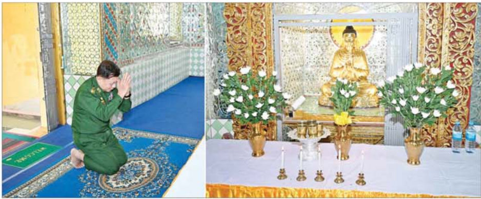
နိုင်ငံတော်စီမံအုပ်ချုပ်ရေးကောင်စီဥက္ကဋ္ဌ နိုင်ငံတော်ဝန်ကြီးချုပ် ဗိုလ်ချုပ်မှူးကြီးမင်းအောင်လှိုင် လှိုင်ကော်မြို့ ကျက်သရေဆောင်သမိုင်းဝင် ဆုတောင်းပြည့် မြို့နယ်ရွှေစေတီတော်မြတ်ကြီးရှိ ဗုဒ္ဓရုပ်ပွားတော်မြတ်အား ဖူးမြော်ကြည့်ည့်စဉ်။

ထို့ကြောင့် ဒေသအတွင်း တည်ငြိမ်အေးချမ်းရေးနှင့်ဒေသခံများ၏ လုံခြုံရေးကို ဖျက်ဆီးနေသည့် ဒေသတွင်းနေထိုင်သော လက်နက်ကိုင်အဖွဲ့အစည်းများ၏ အကြမ်းဖက် လုပ်ဆောင်မှုများ လျော့ပါးစေရေးအတွက် ပြည်သူများအနေဖြင့် ငင်းတိုက်ဆိုးရည်စေမည့်ကိစ္စရပ်များကို ဝိုင်းဝန်းတားဆီး ဆောင်ရွက်ပေးကြစေလိုကြောင်း၊ အကြမ်းဖက်သောင်းကျန်းသူများအနေဖြင့် ဖြိုခွဲမှုများရှိ ပြည်သူလူထုများ၏ နေအိမ်များ၌ ဝင်ရောက်နေထိုင်၍ အကာအကွယ်ယူ တိုက်ခိုက်ကြခြင်းဖြစ်ကြောင်း၊ ၎င်းတို့ ယာယီအားဖြင့် ထိန်းသိမ်းထားသည့် မြို့ရွာများ၊ နေရာဒေသများတွင်လည်း ပြည်သူလူထုကို အကာအကွယ်ယူ၍ တိုက်ခိုက်မှုများလုပ်ဆောင်ခြင်း ဖြစ်သဖြင့် ပြည်သူများအနေဖြင့် သတိတရား၊ အသိတရားများဖြင့် ရှောင်ရှားမည်ဆိုပါက သောင်းကျန်းသူ အဖြစ် ပြတ်ချေနှုန်းရေးလုပ်ငန်းများကို