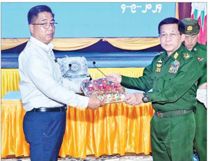
နိုင်ငံတော်စီမံအုပ်ချုပ်ရေးကောင်စီဥက္ကဋ္ဌ နိုင်ငံတော်ဝန်ကြီးချုပ် ဗိုလ်ချုပ်မှူးကြီးမင်းအောင်လှိုင် ကယားပြည်နယ်အစိုးရအဖွဲ့ဝင်များ၊ ပြည်နယ်အဆင့်ဌာနဆိုင်ရာတာဝန်ရှိသူများအတွက် စားသောက်ဖွယ်ရာပစ္စည်းများနှင့် ထောက်ပံ့ရေးပစ္စည်းများပေးပို့စဉ်။

ထားရှိမှု၊ ဒေသတွင်း ဆန်နှင့်ဆီဖူလုံမှု၊ သီးနှံစိုက်ပျိုးမှုများ အထွက်နှုန်းတိုးတက်ရေး ဆောင်ရွက်လျက်ရှိမှု၊ နိုင်ငံစီးပွားမြှင့်တင်ရေး ရန်ပုံငွေများ ထုတ်ချေးပေးထားမှု၊ လျှင်ကော်စက်မှုစုန် ပြန်လည်ဆောင်ရွက်လျက်ရှိမှု၊ စိုက်ပျိုးရေးလုပ်ငန်းများအတွက် လိုအပ်သည့် မြေဩဇာများနှင့် အစေ့ချက်ရှိယာများကသက်သောချေးနှုန်းများဖြင့် ရောင်းချပေးလျက်ရှိမှု၊ ဒေသအတွင်း ထုတ်ကုန်များ ထုတ်လုပ်လျက်ရှိမှု၊ ပြည်သူများ၏ ကျန်းမာရေးကုမ္ပဏီဖြင့်တင်ပေးနိုင်ရေး ဆောင်ရွက်လျက်ရှိမှု၊ လျှင်ကော်မြို့ရှိ အခြေခံပညာကျောင်းများ၊ ကောလိပ်နှင့် တက္ကသိုလ်များ ပြန်လည်ဖွင့်လှစ်နိုင်ရေး ဆောင်ရွက်လျက်ရှိမှု၊ ပြန်လည်ထူထောင်ရေး လုပ်ငန်းများ ဆောင်ရွက်လျက်ရှိမှု၊ ဌာနဆိုင်ရာ အဆောက်အအုံများအား ဦးစားပေးအလိုက် ပြင်ဆင်ဆောင်ရွက်ပေးလျက်ရှိမှု၊ သောက်သုံးရေ လုံလောက်စွာရရှိရေး