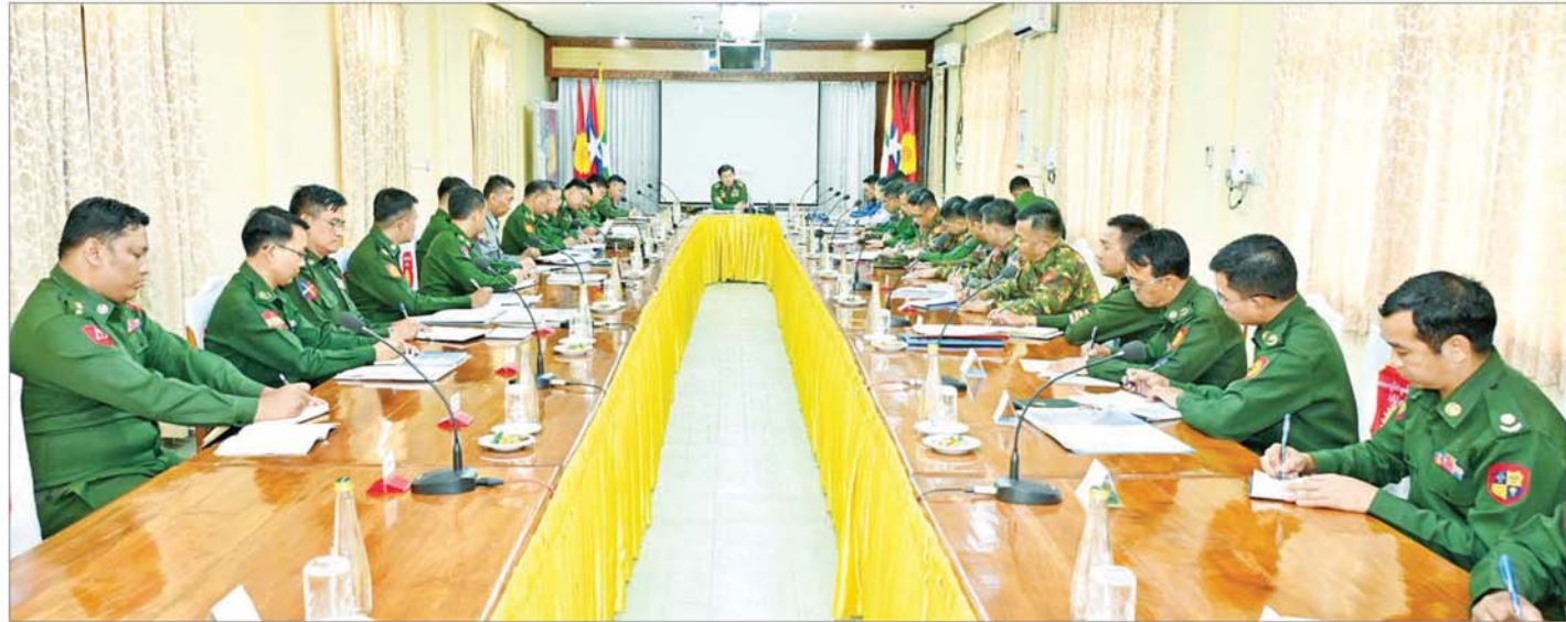
နိုင်ငံတော်စီမံအုပ်ချုပ်ရေးကောင်စီဥက္ကဋ္ဌ တပ်မတော်ကာကွယ်ရေးဦးစီးချုပ် ဗိုလ်ချုပ်မှူးကြီး မင်းအောင်လှိုင် ဒေသကွပ်ကဲမှုစစ်ဌာနချုပ်(လွိုင်ကော်)၌ တာဝန်ရှိသူများအား လမ်းညွှန်မှာကြားစဉ်။

နေပြည်တော် စက်တင်ဘာ ၄ နိုင်ငံတော်စီမံအုပ်ချုပ်ရေးကောင်စီဥက္ကဋ္ဌ တပ်မတော်ကာကွယ်ရေးဦးစီးချုပ် ဗိုလ်ချုပ်မှူးကြီး မင်းအောင်လှိုင်သည် ကာကွယ်ရေးဦးစီးချုပ်(ရေ) ဒုတိယဗိုလ်ချုပ်ကြီး ထိန်ဝင်း၊ ကာကွယ်ရေးဦးစီးချုပ်(လေ) ဗိုလ်ချုပ်ကြီး ထွန်းအောင်၊ ပြည်ထောင်စုအဆင့်ပုဂ္ဂိုလ်များ၊ ကာကွယ်ရေးဦးစီးချုပ်ရုံးမှ အဆင့်မြင့်တပ်မတော်အရာရှိကြီးများနှင့် တာဝန်ရှိသူများလိုက်ပါ၍ ယနေ့နံနက်ပိုင်းတွင် ဒေသကွပ်ကဲမှုစစ်ဌာနချုပ် (လွိုင်ကော်) နယ်မြေအတွင်း နယ်မြေတည်ငြိမ်အေးချမ်းရေးဆိုင်ရာ ဆောင်ရွက်ထားရှိမှုများကို စစ်ဆေးသည်။