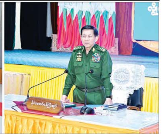
နိုင်ငံတော်စီမံအုပ်ချုပ်ရေးကောင်စီဥက္ကဋ္ဌ နိုင်ငံတော်ဝန်ကြီးချုပ် ဗိုလ်ချုပ်မှူးကြီး မင်းအောင်လှိုင် ကယားပြည်နယ် အစိုးရအဖွဲ့ဝင်များ၊ ပြည်နယ်အဆင့် ဌာနဆိုင်ရာတာဝန်ရှိသူများ၊ မြို့မိမြို့ဖများနှင့် ဒေသခံပြည်သူများအား ဒေသစီးပွားဖွံ့ဖြိုးတိုးတက်ရေးဆိုင်ရာများ ဆွေးနွေးပြောကြားစဉ်။