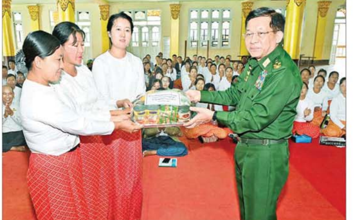
နိုင်ငံတော်စီမံအုပ်ချုပ်ရေးကောင်စီဥက္ကဋ္ဌ နိုင်ငံတော်ဝန်ကြီးချုပ် ဗိုလ်ချုပ်မှူးကြီးမင်းအောင်လှိုင် နယ်မြေခံတပ်မတော်သားများနှင့် မိသားစုဝင်များအတွက် စားသောက်ဖွယ်ရာများနှင့် ထောက်ပံ့ရေးပစ္စည်းများ ပေးအပ်စဉ်။