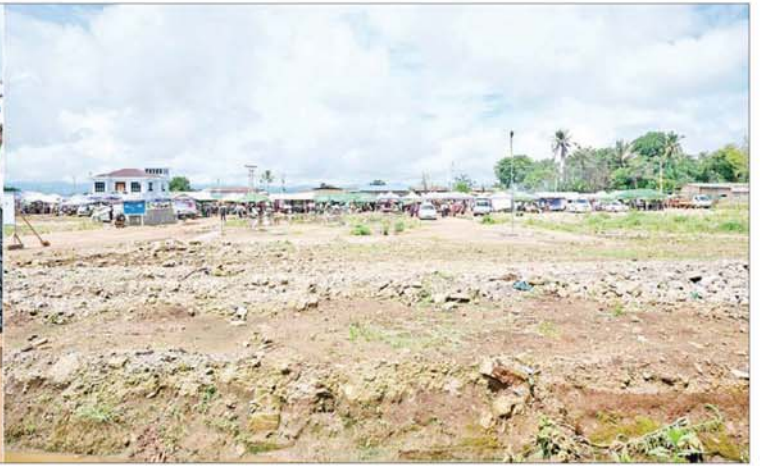
နိုင်ငံတော်စီမံအုပ်ချုပ်ရေးကောင်စီဥက္ကဋ္ဌ နိုင်ငံတော်ဝန်ကြီးချုပ် ဗိုလ်ချုပ်မှူးကြီး မင်းအောင်လှိုင် ဆီဆိုင်မြို့၊ မြို့မဈေးအသစ်ပြန်လည်တည်ဆောက်မည့်နေရာကို ကြည့်ရှုစစ်ဆေးစဉ်။