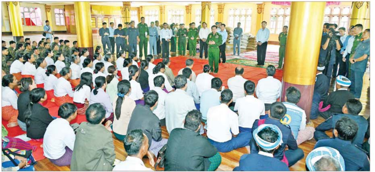
နိုင်ငံတော်စီမံအုပ်ချုပ်ရေးကောင်စီဥက္ကဋ္ဌ နိုင်ငံတော်ဝန်ကြီးချုပ် ဗိုလ်ချုပ်မှူးကြီးမင်းအောင်လှိုင် ဆီဆိုင်မြို့မှ ဌာနဆိုင်ရာတာဝန်ရှိသူများ၊ နယ်မြေခံတပ်မတော်သားများနှင့် မိသားစုဝင်များ၊ မြန်မာနိုင်ငံရတပ်ဖွဲ့ဝင်များ၊ ပြည်သူ့စစ်(ဌာန)တပ်ဖွဲ့ဝင်များ၊ မြို့မိမြို့ဖများနှင့် တာဝန်ရှိသူများအား တွေ့ဆုံအမှာစကားပြောကြားစဉ်။

စာမျက်နှာ ၄ မှ ဒေသဖြစ်ပြီး ဖွံ့ဖြိုးတိုးတက်ရေးကို အောင်မြင်စွာဆောင်ရွက်နိုင်မည့်အလားအလာကောင်းများကို ပိုင်ဆိုင်ထားသည့် ဒေသတစ်ခုလည်းဖြစ်ကြောင်း၊ သို့သော်လည်း အစဉ်အဆက် တည်ငြိမ်အေးချမ်း၍ ရိုးသားအေးချမ်းစွာနေထိုင်ခဲ့သော ပအိုဝ်းတိုင်းရင်းသားတို့၏ ဆီဆိုင်ဒေသသည် PNLO အကြမ်းဖက်အဖွဲ့၏ အခွင့်အလမ်းတစ်ခုကိုမျှော်မှန်းပြီး ဆောင်ရွက်သည့် မိုက်ခဲသည် အကြမ်းဖက်လုပ်ရပ်ကြောင့် ယခုကဲ့သို့ ထိခိုက်ပျက်စီးမှုများဖြစ်ပေါ်ခဲ့ကြောင်း၊ ဒေသတစ်ခု နိုင်ငံတစ်ခု ဖွံ့ဖြိုးတိုးတက်ရန်အတွက်မှာ ရပ်တန့်နေချိန်မရဘဲ ရှေ့သို့အစဉ်အဆက် ဆက်လက်လှမ်းချီနေရမည်၊ အလုပ်လုပ်နေရမည်ဖြစ်ကြောင်း၊ ရပ်တန့်နေပါက မိမိတို့အနေဖြင့် နောက်တွင် ကျန်နေခဲ့မည်ဖြစ်ကြောင်း၊ ယခုကဲ့သို့သော အကြမ်းဖက်လုပ်ရပ်များကြောင့် ပျက်စီးခဲ့ရသည်များကို ပြန်လည်ထူထောင်ရေးလုပ်ငန်းများ ဆောင်ရွက်နေခြင်းဖြင့် ဖွံ့ဖြိုးတိုးတက်မှုများ နှောင့်နှေးကြန့်ကြာနေကြောင်း၊ ဒေသ၏ တည်ငြိမ်အေးချမ်းရေးနှင့် ဖွံ့ဖြိုးတိုးတက်ရေးကို ဆောင်ရွက်နိုင်