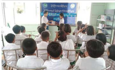
အောက်ပုံ