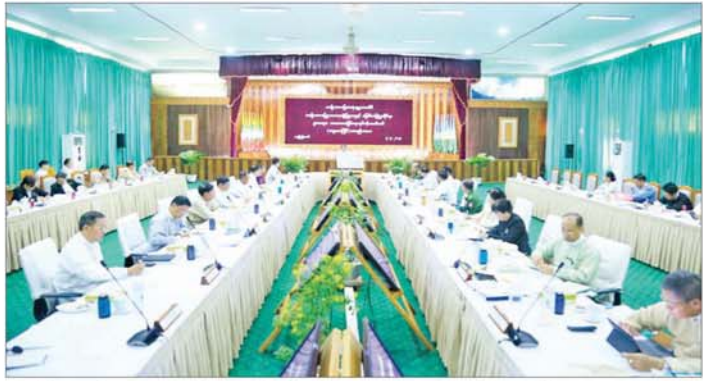
ဆောင်ရွက်နိုင်ရေး လုပ်ဆောင်ကြရမည်ဖြစ်ကြောင်း၊ ပြည်သူ့အကျိုးပြုနိုင်မည့် လက်တွေ့ကျသည့်မူဝါဒ၊ တရားမျှတမှုရှိသည့် ဥပဒေများ၊ လုပ်ထုံးလုပ်နည်းများ၊ စီမံခန့်ခွဲမှုပုံစံများ ဖြစ်လာစေရန်အတွက် မြေယာ စီမံခန့်ခွဲမှုနှင့် ဆက်စပ်နေသော လက်ရှိဥပဒေများကို လေ့လာဆန်းစစ်ပြီး အဆိုပါဥပဒေများကို လွှမ်းမိုးသည့် သာဓာတုပြစ်စေမည့် အမျိုးသားမြေဥပဒေ တစ်ရပ်ကို ရေးဆွဲပြဋ္ဌာန်းနိုင်ရေးသည် အရေးကြီးဆုံး တာဝန်တစ်ရပ်ဖြစ်ကြောင်း၊ အနာဂတ်တွင် စနစ်ကျ၍ ကောင်းမွန်သော မြေယာစီမံခန့်ခွဲမှုစနစ်များ ပေါ်ထွန်း

နေပြည်တော် စက်တင်ဘာ ၅ အမျိုးသားမြေဥပဒေရေးဆွဲပြုစုရေးနှင့် မြေစီမံခန့်ခွဲမှုဆိုင်ရာဥပဒေများ သာဓာတုပြစ်ရေးလုပ်ငန်းကော်မတီ၏ ဆဋ္ဌမအကြိမ် အစည်းအဝေးကို ယနေ့ နံနက်ပိုင်းတွင် နေပြည်တော်ရှိ သစ်တောဦးစီးဌာန အင်ကြင်းခန်းမ၌ ကျင်းပရာ လုပ်ငန်းကော်မတီဥက္ကဋ္ဌ-၂ ပြည်ထောင်စုဝန်ကြီး ဦးခင်မောင်ရှိနှင့် ကော်မတီ အဖွဲ့ဝင်များ၊ အထောက်အကူပြုလုပ်ငန်းအဖွဲ့ ဥက္ကဋ္ဌ များ၊ ဥပဒေရေးဆွဲရေးအဖွဲ့ ငယ် အဖွဲ့ခေါင်းဆောင် များနှင့် တာဝန်ရှိသူများ တက်ရောက်ကြသည်။ ဦးစွာ ပြည်ထောင်စုဝန်ကြီး ဦးခင်မောင်ရှိက အမျိုးသားမြေဥပဒေကို ၂၀၀၈ ခုနှစ် နိုင်ငံတော် ဖွဲ့စည်းပုံအခြေခံဥပဒေနှင့် ညီညွတ်စေရေး၊ မြေစီမံခန့်ခွဲခြင်းနှင့်စပ်လျဉ်းသော တည်ဆဲဥပဒေများကို လွှမ်းမိုးသက်ရောက်မှုရှိပြီး ဥပဒေအချင်းချင်း သာဓာတုပြစ်စေရေးကို အလေးထားဆောင်ရွက်ခြင်းဖြစ်ကြောင်း၊ အမျိုးသားမြေအသုံးချမှုကောင်စီက သတ်မှတ်ပေးထားသည့်ကာလ(Timeline) အတွင်း အမျိုးသားမြေဥပဒေကြမ်းကို ပြီးစီးအောင်