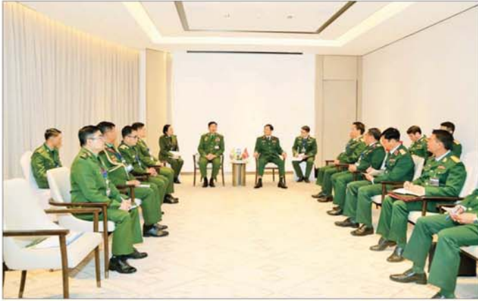
ကာကွယ်ရေးဦးစီးချုပ်ရုံး(ကြည်း)မှ စစ်ရေးချုပ် ဒုတိယဗိုလ်ချုပ်ကြီး စိုးမင်းဦးနှင့် ဗီယက်နမ် အမျိုးသားကာကွယ်ရေးဝန်ကြီးဌာန ဒုတိယဝန်ကြီးနှင့် ဗီယက်နမ်ပြည်သူ့တပ်မတော် စစ်ဦးစီးအရာရှိချုပ် Senior Lieutenant General Nguyen Tan Cuong တို့ တွေ့ဆုံဆွေးနွေးစဉ်။