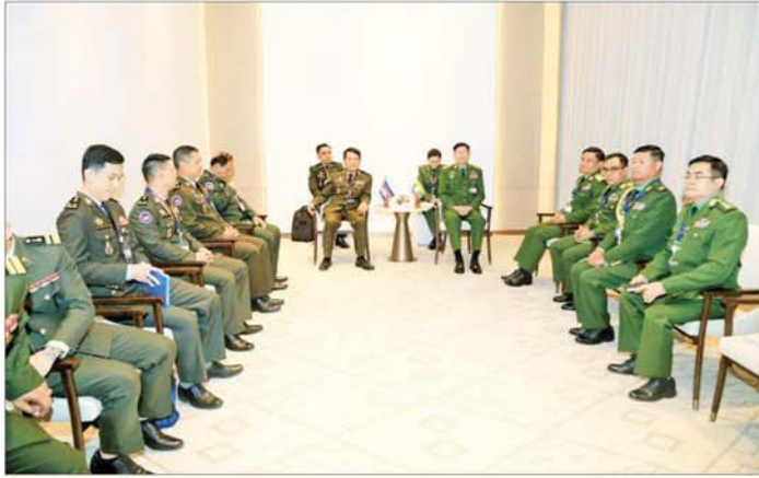
ကာကွယ်ရေးဦးစီးချုပ်ရုံး(ကြည်း)မှ စစ်ရေးချုပ် ဒုတိယဗိုလ်ချုပ်ကြီး စိုးမင်းဦးနှင့် ကမ္ဘောဒီးယား ဘုရင့်တပ်မတော်ကာကွယ်ရေးဦးစီးချုပ် General Vong Pisen တို့ တွေ့ဆုံဆွေးနွေးစဉ်။