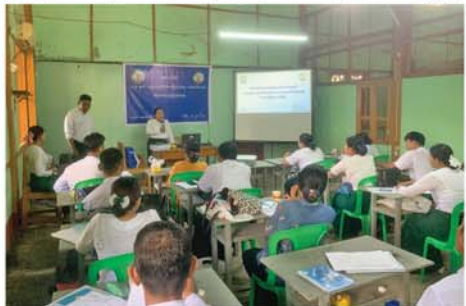
အာကာ(ပြန်/ဆက်)

ကော်မတီအဖွဲ့ဝင်များတွင် ပါဝင် သောသင်တန်းသားများက တစ်ဦး ချင်း မိတ်ဆက်ခဲ့ပြီး တက်ရောက် လာသော ဌာနဆိုင်ရာများနှင့် သင်တန်းသားများ စုပေါင်းအမှတ် တရ မှတ်တမ်းတင် စာတံ ပုံ ရိုက်ကူးခဲ့ပြီး သင်တန်းကာလမှာ စက်တင်ဘာ ၃ ရက်မှ ၁၄ ရက် ထိ ၁၀ ရက်အကြာ သင်တန်း ပို့ချသွားမည်ဖြစ်ကြောင်း သိရ သည်။ အာကာ(ပြန်/ဆက်)