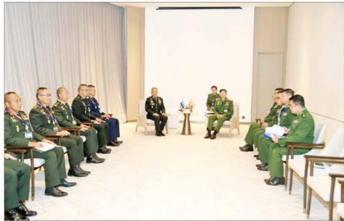
ကာကွယ်ရေးဦးစီးချုပ်ရုံး(ကြည်း)မှ စစ်ရေးချုပ် ဒုတိယဗိုလ်ချုပ်ကြီး စိုးမင်းဦးနှင့် ထိုင်းဘုရင့်တပ်မတော်ကာကွယ်ရေးဦးစီးချုပ် General Songwit Noonpackdee တို့ တွေ့ဆုံဆွေးနွေးစဉ်။

တို့အတွက် လက်တွဲဆောင်ရွက်ခြင်း (ASEAN-Together for Peace, Security and Resilience)" ခေါင်းစဉ်ဖြင့် နိုင်ငံအကွရာစဉ်အလိုက် အသီးသီး ပါဝင်ဆွေးနွေးကြသည်။