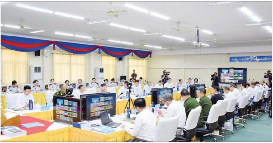
နိုင်ငံတော်စီမံအုပ်ချုပ်ရေးကောင်စီ ဒုတိယဥက္ကဋ္ဌ ဒုတိယဝန်ကြီးချုပ် ဒုတိယဗိုလ်ချုပ်မှူးကြီးစိုးဝင်း ဗဟိုသန်းခေါင်စာရင်းကော်မရှင်၏ ပဉ္စမအကြိမ် လုပ်ငန်းညှိနှိုင်းအစည်းအဝေးတွင် အမှာစကားပြောကြားစဉ်။