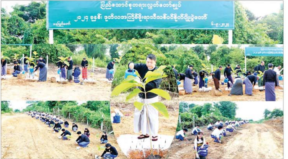
သတင်းစဉ်

အခမ်းအနားသို့ ပြည်ထောင်စုတရားသူကြီးချုပ် ဦးသာဌေးနှင့် ပြည်ထောင်စုတရားလွှတ်တော်ချုပ် တရားသူကြီးများ တက်ရောက်၍ ရတနာတန်းဝင် ကျွန်းပင်များကို ဦးဆောင်စိုက်ပျိုးပေးကြပြီး အမြဲတမ်း အတွင်းဝန်၊ ညွှန်ကြားရေးမှူးချုပ်၊ ဒုတိယအမြဲတမ်းအတွင်းဝန်၊ ဒုတိယညွှန်ကြားရေးမှူးချုပ်များ၊ လက်ထောက်အတွင်းဝန်နှင့် ညွှန်ကြားရေးမှူးများ၊ နေပြည်တော်ကောင်စီနယ်မြေအတွင်းရှိ ပျဉ်းမနားခရိုင်တရားရုံး၊ လယ်ဝေးခရိုင်တရားရုံးနှင့် ဖြို့နယ်တရားရုံး တို့မှ တရားသူကြီးများ၊ တရားရေးအရာရှိများ၊ ရုံးဝန်ထမ်းများက ရတနာတန်းဝင် ကျွန်းပင်စုစုပေါင်း ၂၅ ပင်ကို စုပေါင်းစိုက်ပျိုးခဲ့ကြ ကြောင်း သိရသည်။