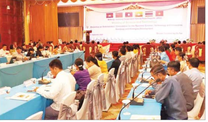
ပါမောက္ခချုပ်များ၊ ဒုတိယညွှန်ကြားရေးမှူးချုပ်များ နှင့် ဆက်စပ်ဝန်ကြီးဌာန ၁၄ ခုမှ မူဝါဒဆိုင်ရာ ပညာရှင်များ၊ တက္ကသိုလ်များမှ ပါမောက္ခများ၊ UMFCCI မှ ကိုယ်စားလှယ်များ၊ ကျွမ်းကျင်ပညာရှင် များ၊ MSMEs အသင်းအဖွဲ့များမှ ကိုယ်စားလှယ်များ တက်ရောက်ကြသည်။

မဲခေါင်-လန်ချန်း ပူးပေါင်းဆောင်ရွက်မှု အထူးရန်ပုံငွေစီမံကိန်း ၂၀၂၂ ဖြင့် ဆောင်ရွက်သော အမျိုးသားအဆင့် သိပ္ပံ၊ နည်းပညာနှင့် ဆန်းသစ် တီထွင်မှုဆိုင်ရာ လမ်းပြမြေပုံနှင့် မဟာဗျူဟာများ ပေါ်ထွက်နိုင်ရန်အတွက် သိပ္ပံနှင့် နည်းပညာဆိုင်ရာ လက်ရှိဆောင်ရွက်နေမှုများနှင့် အမျိုးသားလူမှုစီးပွား ရေရှည်ဖွံ့ဖြိုးတိုးတက်ရေးကို အထောက်အကူပေးနေ မှုများကို Stakeholders များနှင့် ညှိနှိုင်းဆွေးနွေး နိုင်ရန်အတွက် အမျိုးသားအဆင့် သိပ္ပံ၊ နည်းပညာနှင့် ဆန်းသစ်တီထွင်မှု လမ်းပြမြေပုံနှင့် မဟာဗျူဟာများ ထွက်ပေါ်လာစေရေးအတွက် ဆက်စပ်ဝန်ကြီးဌာန များ၊ အဖွဲ့အစည်းများနှင့် အလုပ်ရုံဆွေးနွေးပွဲကို နေပြည်တော် မင်္ဂလာသီရိတိုက်သိပ္ပံ ယနေ့နံနက်ပိုင်း တွင် ကျင်းပသည်။