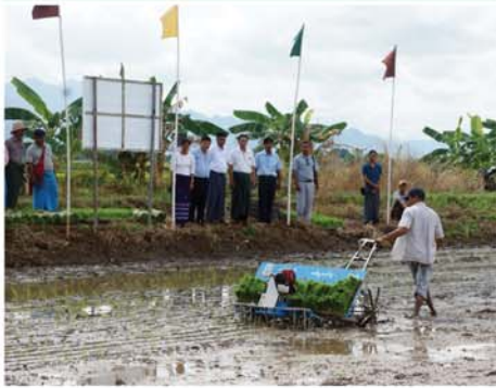
အမရပူရ စက်တင်ဘာ ၆

မန္တလေးတိုင်းဒေသကြီး၊ အမရပူရခရိုင်၊ အမရပူရမြို့နယ် အတွင်း ဒေသခံတောင်သူများ အနေဖြင့် လယ်ယာသုံးစက် ကိရိယာများကို တွင်ကျယ်စွာ အသုံးပြုလာစေရန်၊ လက်မှု လယ်ယာစနစ်မှ စက်မှုလယ်ယာ စနစ်သို့ အသွင်ကူးပြောင်းဆောင်ရွက်နိုင်ရေး၊ လုပ်သားအင်အား ရှားပါးမှုပြဿနာ ဖြေရှင်းပေးနိုင်ရေး၊ အချိန်တိုအတွင်း စိုက်စက်များစွာကို ထွန်းထွက်ပျိုးနိုင်ခြင်းနှင့် စပါးအထွက်နှုန်းကောင်းမွန်စေခြင်းစသည့် ကောင်းကျိုးများစွာရရှိစေရန် ရည်ရွယ်၍ စိုက်ပျိုးရေး၊ မွေးမြူရေးနှင့် ဆည်မြောင်း ဝန်ကြီးဌာန၊ စက်မှုလယ်ယာ ဦးစီးဌာနနှင့် စိုက်ပျိုးရေးဦးစီးဌာနတို့ ပူးပေါင်း၍ အင်ဂျင်နီယာ အားသုံး (၆)တန်းသွားလက်ဆွဲ ကောက်စိုက်ဖြင့် မိုးစပါးစိုက်ပျိုးခြင်း သရုပ်ပြပွဲကို ယနေ့နံနက် ၉ နာရီတွင် အမရပူရမြို့နယ်၊ တမုတ်ဆိုးကျေးရွာအုပ်စု၊ ဂျီရွာ ကျေးရွာ၊ ကွင်းအမှတ်(၅၇၀-ခ)၊