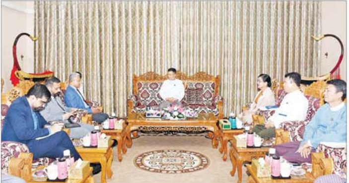
အတွက် ရေးပေးသည့်သင်တန်းနှင့် အမျိုးသား ပြတိုက်ဦးစီးဌာနမှ သင်တန်းသားနှစ်ဦးခန့်နှင့် ပြတိုက်ပညာမဟာဘွဲ့သင်တန်းအတွက်သင်တန်းသား နှစ်ဦးခန့်နှစ်ဦးစဉ်အဖွဲ့အစည်းများ ပါဝင်ဆောင်ရွက်ခဲ့ကြောင်း သိရသည်။

နေပြည်တော် စက်တင်ဘာ ၆ သာသနာရေးနှင့် ယဉ်ကျေးမှုဝန်ကြီးဌာန ပြည်ထောင်စုဝန်ကြီး ဦးတင်ဦးလွင်သည် အိန္ဒိယ နိုင်ငံသံအမတ်ကြီး မစ္စတာ အဘ်ပေး တာကူးရီ အား ယနေ့ညနေ ၄ နာရီတွင် နေပြည်တော်ရှိ သာသနာရေးနှင့် ယဉ်ကျေးမှုဝန်ကြီးဌာန ပြည်ထောင်စု ဝန်ကြီး၏ ဧည့်ခန်းမ၌ လက်ခံတွေ့ဆုံသည်။ တွေ့ဆုံစဉ် မြန်မာ-အိန္ဒိယ နှစ်နိုင်ငံအကြား ချစ်ကြည်ရင်းနှီးသော ဆက်ဆံရေးကိုအခြေခံ၍ သာသနာရေးနှင့် ယဉ်ကျေးမှုကဏ္ဍဆိုင်ရာကိစ္စရပ် များတွင် နှစ်နိုင်ငံ ပူးပေါင်းဆောင်ရွက်မှုများ တိုးမြှင့်ရေး၊ ပညာတော်သင်များ အပြန်အလှန် စေလွှတ်ရေးနှင့် အိန္ဒိယနိုင်ငံတွင် Archaeological Survey of India (ASI) မှ ဖွင့်လှစ်သည့် Field School of Archaeology တွင် ဘွဲ့လွန်ဒီပလိုမာသင်တန်း