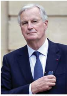
အကြွအလည်ပြောဆိုဆွေးနွေးခဲ့ပြီးနောက် ၎င်းကို ဝန်ကြီးချုပ်

ပဲရစ် စက်တင်ဘာ ၆ အသက် ၇၃ နှစ်အရွယ် ရှေးရိုးစွဲဝါဒီ မိချဲဘာနီယေ စက်တင်ဘာလဆန်းပိုင်းက ပြင်သစ်ဝန်ကြီးချုပ်အဖြစ် ရွေးချယ်တင်မြှောက်ခံရကြောင်း ဘီဘီစီသတင်းဌာနက ဖော်ပြသည်။ လွန်ခဲ့သော ဇူလိုင်လနှင့် ဩဂုတ်လအတွင်း ပြင်သစ်သမ္မတ အီမန်ဖျူယယ်မာခရန်နှင့် ပါလီမန်ရွေးကောက်ပွဲတွင် အနိုင်ရသော နိုင်ငံရေးပါတီများကြား