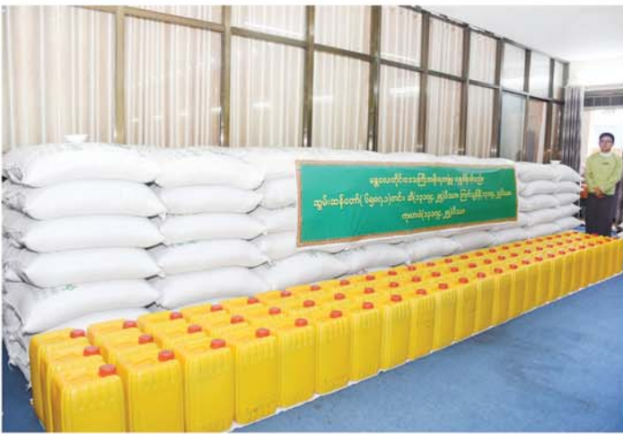
သတင်း-စာမျက်နှာ ၅