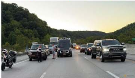
သို့ ချက်ချင်းပင် ရောက်ရှိလာခဲ့ကြသည်။ လူခုနှစ်ဦး ဒဏ်ရာရရှိသည့် ရဲတပ်ဖွဲ့မှူးက ထုတ်ဖော်ပြော

ကြားသည်။ ထို သေနတ်ပစ်ခတ်မှု၏ အဓိကသံသယရှိသူမှာ အသက် ၃၂ နှစ်အရွယ် ဂျိုးစက်အေကောက်ချီဖြစ်သည်ဟု ရဲစုထောက်များ ဖော်ထုတ်နိုင်ခဲ့သည်။ ထို့နောက် အရပ် ၅ ပေ ၁၀ လက်မ၊ ကိုယ်အလေးချိန် ၁၅၄ ပေါင်ရှိသော ယင်းသံသယရှိသူကို လက်ရဖမ်းဆီးနိုင်ရန် ရဲတပ်ဖွဲ့က ကြိုးစားနေကြောင်း သိရသည်။