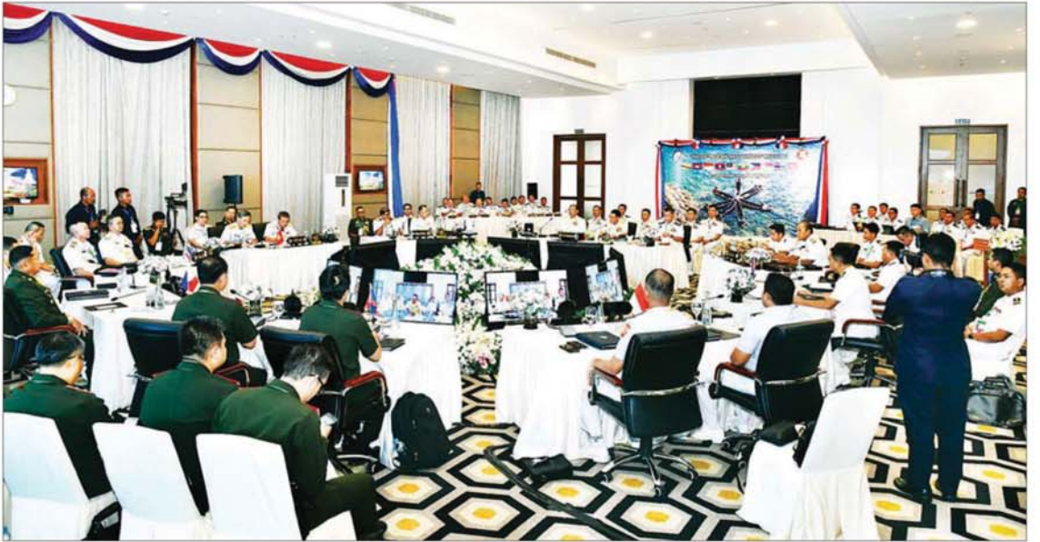
မြန်မာနိုင်ငံက ဒုတိယအကြိမ် အိမ်ရှင်အဖြစ် လက်ခံကျင်းပသည့် (၁၈) ကြိမ်မြောက် အာဆီယံရေတပ်ဦးစီးချုပ်များအစည်းအဝေး 18 th ASEAN Navy Chiefs' Meeting (18 th ANCM) ကျင်းပစဉ်။

နေပြည်တော် အောက်တိုဘာ ၁၁ မြန်မာနိုင်ငံက ဒုတိယအကြိမ် အိမ်ရှင်အဖြစ် လက်ခံကျင်းပသည့် (၁၈) ကြိမ်မြောက် အာဆီယံရေတပ်ဦးစီးချုပ်များအစည်းအဝေး 18 th ASEAN Navy Chiefs' Meeting (18 th ANCM) ကို အောက်တိုဘာ ၁၀ ရက် နံနက်ပိုင်းတွင် နေပြည်တော်ရှိ M-Gallery Hotel ၌ ကျင်းပပြုလုပ်ရာ အစည်းအဝေးသို့ ဘရူနိုင်းနိုင်ငံ၊ ကမ္ဘောဒီးယားနိုင်ငံ၊ လာအိုနိုင်ငံ၊ ဗီယက်နမ်နိုင်ငံ၊ ထိုင်းနိုင်ငံ၊ မလေးရှားနိုင်ငံ၊ အင်ဒိုနီးရှားနိုင်ငံနှင့် ဖိလစ်ပိုင်နိုင်ငံတို့မှ ရေတပ်အကြီးအကဲများနှင့် ကိုယ်စားလှယ်အဖွဲ့ခေါင်းဆောင်များ တက်ရောက်ကြသည်။ အစည်းအဝေးအား သဘာပတိ ကာကွယ်ရေးဦးစီးချုပ် (ရေ) ဒုတိယဗိုလ်ချုပ်ကြီး ထိန်ဝင်းက ဦးဆောင်၍ ကျင်းပခဲ့ပြီး အစည်းအဝေးတွင် အာဆီယံရေတပ်ဦးစီးချုပ်များအတွက် Welcome Video Clip အားပြသသည်။