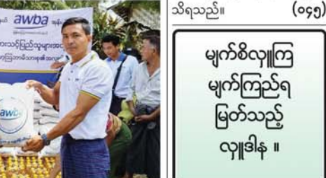
အိမ်ထောင်စု ၄၁၇၇ အတွက် ငွေ ကျပ် သိန်း ၁၃၅၀ တန်ဖိုးရှိ ဆန်၊ ဆီ၊ ခေါက်ဆွဲခြောက်၊ ဆပ်ပြာမှုန့်၊ ဆပ်ပြာခဲ၊ ဖယောင်းတိုင်၊ ရေသန့်၊ မီးသွေးတို့ကို ပေးအပ်လှူဒါန်းခဲ့ ကြောင်း သိရသည်။ (အောက်ပုံ) (မန္တလေးနေ့စဉ်-၆)

ရွေ့လျားဆေးခန်းဖွင့်လှစ်ရန် အလှူ ငွေများပေးအပ်ပွဲကို အောက်တို ဘာ ၉ ရက် နံနက်ပိုင်းက ချမ်း အိမ်ထောင်စု ၄၁၇၇ အတွက် ငွေ ကျပ် သိန်း ၁၃၅၀ တန်ဖိုးရှိ ဆန်၊ ဆီ၊ ခေါက်ဆွဲခြောက်၊ ဆပ်ပြာမှုန့်၊ ဆပ်ပြာခဲ၊ ဖယောင်းတိုင်၊ ရေသန့်၊ မီးသွေးတို့ကို ပေးအပ်လှူဒါန်းခဲ့ ကြောင်း သိရသည်။ (အောက်ပုံ) (မန္တလေးနေ့စဉ်-၆)