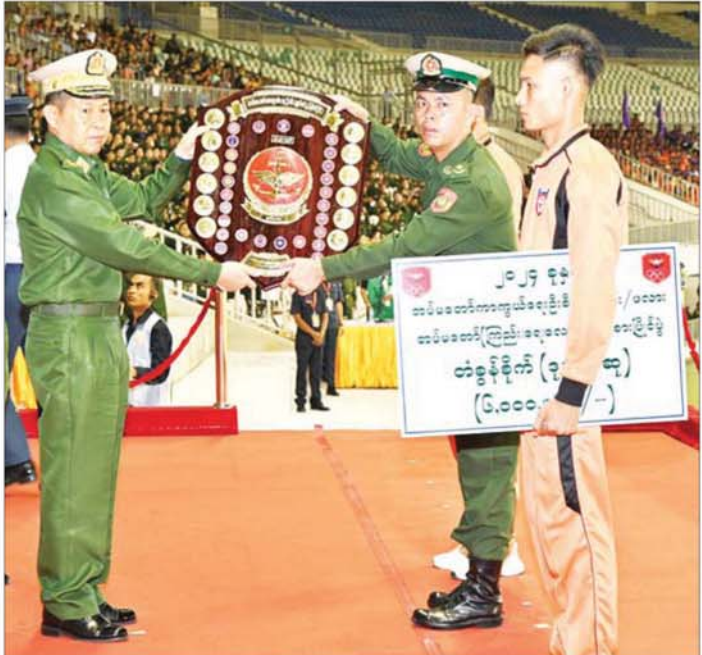
နိုင်ငံတော်စီမံအုပ်ချုပ်ရေးကောင်စီ ဒုတိယဥက္ကဋ္ဌ ဒုတိယတပ်မတော်ကာကွယ်ရေးဦးစီးချုပ် ကာကွယ်ရေးဦးစီးချုပ် (ကြည်း) ဒုတိယဗိုလ်ချုပ်မှူးကြီး စိုးမင်း ဆုတံဆိပ် ဒုတိယအများဆုံးရရှိသည့် ရန်ကုန်တိုင်းစစ်ဌာနချုပ် ကိုယ်စားပြုအသင်းအား တပ်မတော်ကာကွယ်ရေးဦးစီးချုပ်၏ တံခွန်စိုက်ပိုင်း (ဒုတိယ) ဆုပေးအပ်ချီးမြှင့်စဉ်။

ဆုရဘောလုံးအသင်း သုံးသင်းတို့မှ အားကစားသမားများက ဇေယျာသီရိတပ်မတော်အားကစားကွင်းအတွင်း ဝင်ရောက်နေရာယူကြသည်။ ဆုများပေးအပ်ချီးမြှင့် ထို့နောက် ၂၀၂၄ ခုနှစ်၊ တပ်မတော် (ကြည်း၊ ရေ၊ လေ) အားကစားပြိုင်ပွဲ ဆုချီးမြှင့်ပွဲ အခမ်းအနားကို ကျင်းပပြုလုပ်ရာ တပ်မတော်အားကစားနှင့် ကာယပညာ အုပ်ချုပ်ရေးအဖွဲ့ဥက္ကဋ္ဌ စစ်ရေးချုပ် ဒုတိယဗိုလ်ချုပ်ကြီး စိုးမင်းဦးက ၂၀၂၄ ခုနှစ်၊ (၆၁) ကြိမ်မြောက် တပ်မတော်ကာကွယ်ရေးဦးစီးချုပ်ဖလား (ကြည်း၊ ရေ၊ လေ) ဘောလုံးပြိုင်ပွဲတွင် နေရာအလိုက် အကောင်းဆုံး အားကစားသမား ဆုရရှိသူများ၊ ပွဲစဉ်တစ်လျှောက် အကောင်းဆုံး ကစားသမားဆုရရှိသူများနှင့် အသန်ရှင်းဆုံးဆုရရှိသည့် ကာကွယ်ရေးဦးစီးချုပ်ရုံး (ကြည်း) ကိုယ်စားပြုအသင်းတို့ကိုလည်းကောင်း၊ ကာကွယ်ရေးဦးစီးချုပ်ရုံး (ကြည်း) မှ ဒုတိယဗိုလ်ချုပ်ကြီး ဖုန်းမြတ်က