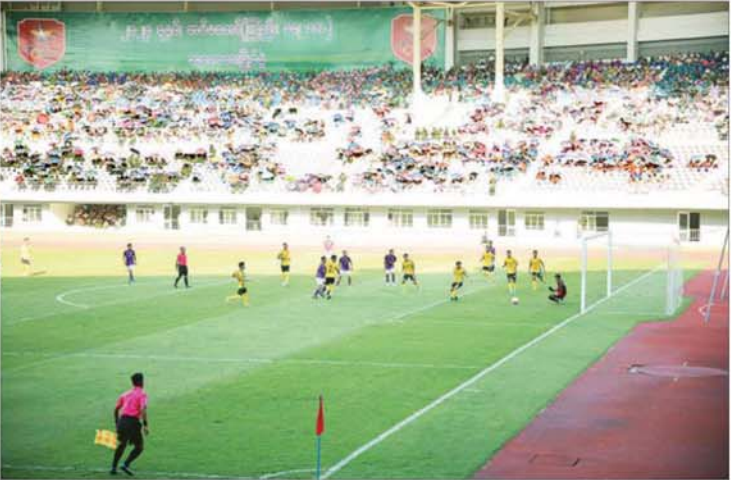
နိုင်ငံတော်စီမံအုပ်ချုပ်ရေးကောင်စီဥက္ကဋ္ဌ တပ်မတော်ကာကွယ်ရေးဦးစီးချုပ် ဗိုလ်ချုပ်မှူးကြီး မင်းအောင်လှိုင်၊ ဇနီး ဒေါ်ကြူကြူလှနှင့်အဖွဲ့ဝင်များ တပ်မတော်ကာကွယ်ရေးဦးစီးချုပ်ဖလား (ကြည်း၊ ရေ၊ လေ) ဘောလုံးပြိုင်ပွဲ အလွတ်တန်းအဆင့် ဗိုလ်လုပွဲအဖြစ် အလယ်ပိုင်းတိုင်းစစ်ဌာနချုပ် ကိုယ်စားပြုအသင်းနှင့် ရန်ကုန်တိုင်းစစ်ဌာနချုပ်ကိုယ်စားပြုအသင်းတို့ ယှဉ်ပြိုင်ကစားနေမှုကို ကြည့်ရှုအားပေးကြစဉ်။