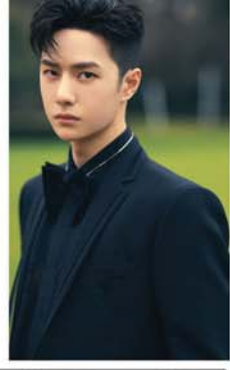
အဆိုပါ ပန်းချီကားတွင် အမှောင်ရူထုမှ တစ်ဦးတည်းထိုင်နေသည့် လူငယ်လေး၊ ဦးခေါင်းထက်မှအလင်းရောင်က အမှောင်ထုကို တွန်းလှန်ရန် ကြိုးစားနေပုံ ဖြစ်ပြီး ယခင်ကလို အမှောင်ကြောက်သည့်သူ မဟုတ်ဘဲ သန်မာလာကြောင်း ပြသထားခြင်းဖြစ်လာသည်ဟု မှတ်ချက်ပေးထားကြသည်။ Wang Yibo သည် အမှောင်

ကြောက်သကဲ့သို့ ပိုးကောင်များကိုလည်း ထိတွေ့ကိုင်တွယ်ရန် မကြောက်တော့သူဖြစ်ကာ မှတ်တမ်းရုပ်ရှင်နှင့် ပြောင်းလဲသွားပုံကို ယင်းပန်းချီကားချပ်ဖြင့် ပြောကြားထားခြင်းဖြစ်သည်ဟု ပရိသတ်များက မှတ်ချက်ပေးထားကြသည်။ (SKY)