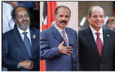
ဟတ်ဆန်ရှိုက်ခိုမိုဟာမက်၊ အီရစ်ထရီးယားသမ္မတ အစ်ဆိုင်

အက်စမာရာ အောက်တိုဘာ ၁၁ ဆိုမာလီယာ၊ အီရစ်ထရီးယားနှင့် အီဂျစ်သမ္မတသုံးဦး ဒေသလုံခြုံရေးပေါင်းဆောင်ရွက်ရန် အောက်တိုဘာ ၁၀ ရက်က သဘောတူညီလိုက်ကြောင်း ဘီဘီစီသတင်းဌာနက ဖော်ပြသည်။ အီရစ်ထရီးယားနိုင်ငံ အက်စမာရာမြို့တော်၌ လက်ခံကျင်းပသော သုံးနိုင်ငံထိပ်သီးအစည်းအဝေးတွင် ဆိုမာလီယာသမ္မတ