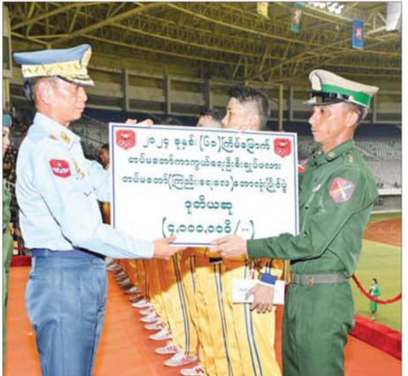
နိုင်ငံတော်စီမံအုပ်ချုပ်ရေးကောင်စီအဖွဲ့ဝင် ညွှန်ကြားကွပ်ကဲရေးမှူး (ကြည်း၊ ရေ၊ လေ) ဗိုလ်ချုပ်ကြီး မောင်မောင်အေး ဆုတံဆိပ် တတိယအများဆုံးရရှိသည့် အလယ်ပိုင်း တိုင်းစစ်ဌာနချုပ် ကိုယ်စားပြုအသင်းအား တပ်မတော်ကာကွယ်ရေးဦးစီးချုပ်၏ တံခွန်စိုက်ခိုင်း (တတိယ)ဆု ပေးအပ်ချီးမြှင့်စဉ်။