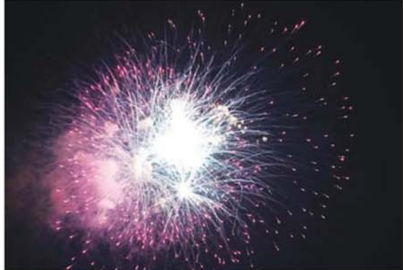
အခမ်းအနားအောင်မြင်ခြင်းအထိမ်းအမှတ်အဖြစ် မီးရှူး၊ မီးပန်းများကို ဂုဏ်ပြုပစ်ဖောက်စဉ်။

အောင်မြင်စွာပိတ်သိမ်း ထိုသို့ ချီတက်ထွက်ခွာနေချိန် တွင် (ပိတ်)ကြိမ်မြောက် တပ်မတော် ကာကွယ်ရေးဦးစီးချုပ် ဖလား (ကြည်း၊ ရေ၊ လေ)ဘောလုံးပြိုင်ပွဲ ဆုချီးမြှင့်ပွဲအခမ်းအနားနှင့် ၂၀၂၄ ခုနှစ်၊ တပ်မတော် (ကြည်း၊ ရေ၊ လေ) အားကစားပြိုင်ပွဲဆုချီးမြှင့်ပွဲ အခမ်းအနား အောင်မြင်ခြင်း အထိမ်းအမှတ်အဖြစ် မီးရှူး၊ မီးပန်းများကို ဂုဏ်ပြုပစ်ဖောက်ခဲ့ ပြီး အခမ်းအနားကို အောင်မြင်စွာ ပိတ်သိမ်းခဲ့ကြောင်း သတင်းရရှိ သည်။ သတင်းစဉ်