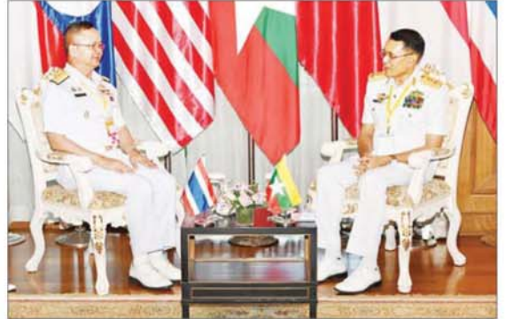
ကာကွယ်ရေးဦးစီးချုပ်(ရေ) ဒုတိယဗိုလ်ချုပ်ကြီး ထိန်ဝင်း ထိုင်းနိုင်ငံမှ ရေတပ်အကြီးအကဲနှင့် တွေ့ဆုံဆွေးနွေးစဉ်။

ရေတပ်ဦးစီးချုပ်များ အစည်းအဝေးကို အောင်မြင်စွာ ရပ်သိမ်းခဲ့သည်။ ထို့နောက် ကာကွယ်ရေးဦးစီးချုပ် (ရေ) ဒုတိယဗိုလ်ချုပ်ကြီး ထိန်ဝင်း က အာဆီယံ ရေတပ်အကြီးအကဲများနှင့် ကိုယ်စားလှယ်အဖွဲ့ခေါင်းဆောင်များအား နှစ်နိုင်ငံ သီးခြားစီတွေ့ဆုံ၍ နှစ်နိုင်ငံရေတပ်များအကြား ချစ်ကြည်ရင်းနှီးစွာ ပူးပေါင်းဆောင်ရွက်ရေးဆိုင်ရာကိစ္စရပ်များ၊ အာဆီယံအဖွဲ့အစည်းအတွင်း ချစ်ကြည်ရင်းနှီးစွာ ပူးပေါင်းဆောင်ရွက်ရေးဆိုင်ရာကိစ္စရပ်များ၊ လူသားချင်းစာနာထောက်ထားမှုဆိုင်ရာ အကူအညီများနှင့် သဘာဝဘေးအန္တရာယ် ကာကွယ်တားဆီးရေးလုပ်ငန်းများ ပူးပေါင်းဆောင်ရွက်ရေးတို့အတွက် နှစ်နိုင်ငံ ရေတပ်များအကြား ပိုမိုနီးကပ်စွာ ပူးပေါင်းဆောင်ရွက်နိုင်ရေးကိစ္စရပ်များကို ဆွေးနွေးခဲ့ကြသည်။