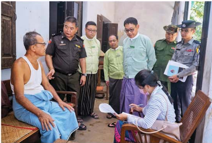
ပခုက္ကူ အောက်တိုဘာ ၁၁