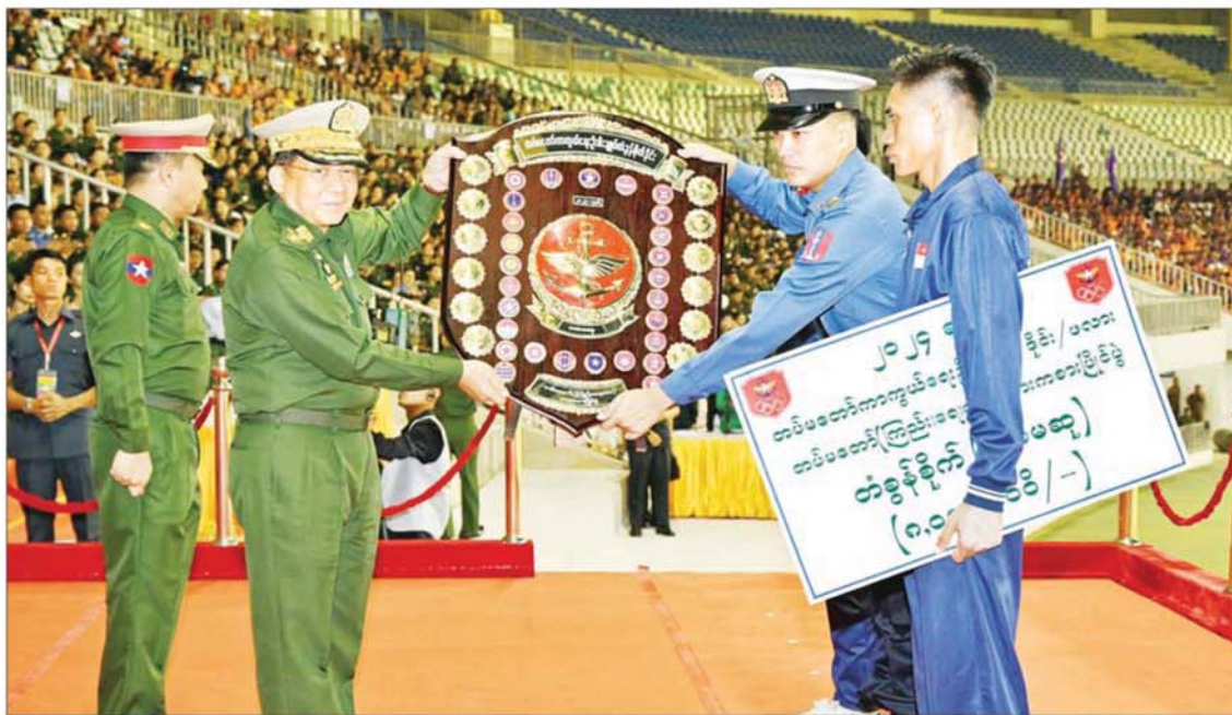
နိုင်ငံတော်စီမံအုပ်ချုပ်ရေးကောင်စီဥက္ကဋ္ဌ တပ်မတော်ကာကွယ်ရေးဦးစီးချုပ် ဗိုလ်ချုပ်မှူးကြီး မင်းအောင်လှိုင် ၂၀၂၄ ခုနှစ်၊ တပ်မတော် (ကြည်း၊ ရေ၊ လေ) အားကစား ပြိုင်ပွဲများတွင် ဆုအများဆုံးရရှိသည့် ကာကွယ်ရေးဦးစီးချုပ်ချုပ်(ရေ)ကိုယ်စားပြုအသင်းအား တပ်မတော်ကာကွယ်ရေးဦးစီးချုပ်၏ တံခွန်စိုက်ခိုင်းဆုကြီး ပေးအပ်ချီးမြှင့်စဉ်။

နေပြည်တော် အောက်တိုဘာ ၁၁ ၂၀၂၄ ခုနှစ်၊ တပ်မတော် (ကြည်း၊ ရေ၊ လေ) အားကစားပြိုင်ပွဲ ဆုချီးမြှင့်ပွဲအခမ်းအနားကို ယနေ့ညနေပိုင်းတွင် နေပြည်တော်ရှိ စေယျာသီရိတပ်မတော် အားကစားကွင်း၌ ကျင်းပပြုလုပ်ရာ နိုင်ငံတော်စီမံအုပ်ချုပ်ရေးကောင်စီဥက္ကဋ္ဌ တပ်မတော်ကာကွယ်ရေး ဦးစီးချုပ် ဗိုလ်ချုပ်မှူးကြီး မင်းအောင်လှိုင် တက်ရောက်အားပေးပြီး ဆုများပေးအပ် ချီးမြှင့်သည်။ အဆိုပါအခမ်းအနားသို့ နိုင်ငံတော် စီမံအုပ်ချုပ်ရေးကောင်စီဥက္ကဋ္ဌ တပ်မတော် ကာကွယ်ရေးဦးစီးချုပ် ဗိုလ်ချုပ်မှူးကြီး မင်းအောင်လှိုင်နှင့်အတူ ဇနီး ဒေါ်ကြာကြာလှ၊ နိုင်ငံတော်စီမံအုပ်ချုပ်ရေး ကောင်စီ ဒုတိယဥက္ကဋ္ဌ ဒုတိယတပ်မတော် ကာကွယ်ရေးဦးစီးချုပ် ကာကွယ်ရေးဦးစီး ချုပ်(ကြည်း)ဒုတိယဗိုလ်ချုပ်မှူးကြီး စိုးဝင်း နှင့်ဇနီး ဒေါ်သန်းသန်းနွယ်၊ ကောင်စီဝင် ညွှန်ကြားမှုဦးစီးဌာနမှူး (ကြည်း၊ ရေ၊ လေ) ဗိုလ်ချုပ်ကြီး မောင်မောင်အေးနှင့် ဇနီး၊ ပြည်ထောင်စုအဆင့်ပုဂ္ဂိုလ်များ၊ ပြည်ထောင်စုဝန်ကြီးများနှင့် ဇနီးများ၊ စာမျက်နှာ ၃ သို့ ❖