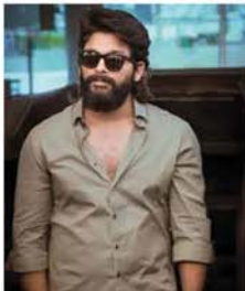
အနုပညာရှင်များက သူတို့၏ ပရိသတ်များကိုလည်း ရေဘေးတွင် ပါဝင်ကူညီကြရန် ဆိုရယ်မီဒီယာများမှတစ်ဆင့် နှိုးဆော်ပေးထားကြရာ အာလူးအာဂျန် ထိပ်ဆုံးမှ ပါဝင်ခဲ့သည်။ (SKY)