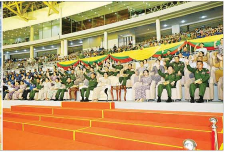
စစ်ရေးပြမှုကြီးဦးဆောင်သော အလံတော်အဖွဲ့၊ အားကစားအသင်း ၁၇ သင်းနှင့် တပ်မတော် (ကြည်း၊ ရေ၊ လေ) ကိုယ်စားပြု စစ်တီးဝိုင်းအဖွဲ့တို့က စစ်ကြောင်းပုံဖြင့်ချီတက်၍ လက်ဝှေ့ယမ်းနှုတ်ဆက်ပြီး အားကစားကွင်းအတွင်းမှ ပြန်လည်ထွက်ခွာကြရာ နိုင်ငံတော်စီမံအုပ်ချုပ်ရေးကောင်စီဥက္ကဋ္ဌ တပ်မတော်ကာကွယ်ရေးဦးစီးချုပ် ဗိုလ်ချုပ်မှူးကြီး မင်းအောင်လှိုင်၊ ဇနီး ဒေါ်ကြူကြူလှနှင့် တက်ရောက်လာကြသူများက ပြန်လည်လက်ပြန်တော်ကြစဉ်။