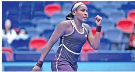
ဘာသာ ဒတ်ရာကြောင့် ဖင်လန်အသင်းနှင့် ကစားမည့် ပွဲစဉ်လွဲချော်မည်

ပိုင်နယ်အဆင့်တွင် ပိုလန်တင်းနစ်မယ် Magda Linette အား ၆-၀၊ ၆-၄ဖြင့် အနိုင်ရရှိကာ ဆိမ်းဖိုင်နယ်အဆင့်သို့ တက်ရောက်ခဲ့ခြင်း ဖြစ်သည်။ (ယာပုံ) 2024 Dongfeng Voyah Wuhan Open တင်းနစ်ပြိုင်ပွဲ ဆိမ်းဖိုင်နယ်အဆင့်တွင် အမေရိကန်တင်းနစ်မယ် Coco Gauff နှင့် ဘီလာဂျတင်းနစ်မယ် Aryna Sabalenka တို့ ယှဉ်ပြိုင်ကစားသွားမည် ဖြစ်သည်။ (NGB)