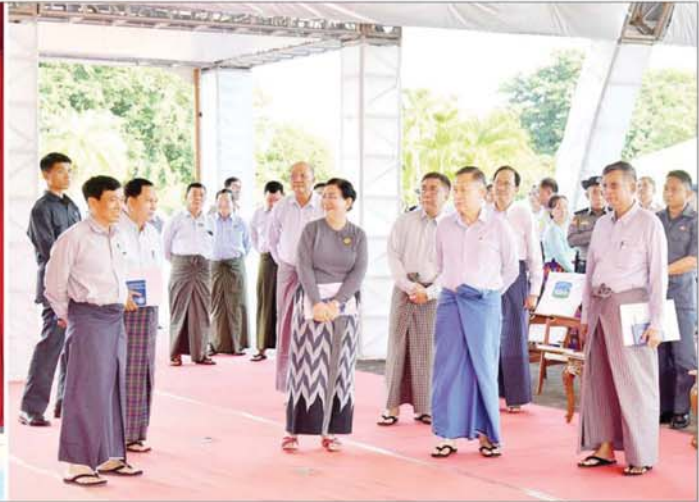
နိုင်ငံတော်စီမံအုပ်ချုပ်ရေးကောင်စီ ဒုတိယဥက္ကဋ္ဌ ဒုတိယဝန်ကြီးချုပ် ဒုတိယဗိုလ်ချုပ်မှူးကြီးစိုးဝင်း (၂၅)ကြိမ်မြောက် ငွေရတုအထိမ်းအမှတ် မြန်မာ့ရိုးရာယဉ်ကျေးမှု အဆို၊ အက၊ အရေး၊ အတီးပြိုင်ပွဲ အောင်မြင်စွာ ကျင်းပနိုင်ရေး ပြင်ဆင်ဆောင်ရွက်ထားရှိမှုများကို ကြည့်ရှုစစ်ဆေးစဉ်။

ရှေ့ဖွဲ့မှု ဦးစွာ နိုင်ငံတော်စီမံအုပ်ချုပ်ရေး ကောင်စီဒုတိယဥက္ကဋ္ဌ ဒုတိယဝန်ကြီးချုပ် ဒုတိယဗိုလ်ချုပ်မှူးကြီးစိုးဝင်းနှင့် အဖွဲ့ဝင် များသည်နေပြည်တော်စည်ပင်သာယာရေး ကော်မတီရှိ လဟာပြင်ဇာတိရုံ၊ မြန်မာ အပြည်ပြည်ဆိုင်ရာကွန်ဗင်းရှင်းဗဟိုဌာန-၂ တို့၌ (၂၅)ကြိမ်မြောက် ငွေရတုအထိမ်း အမှတ် မြန်မာ့ရိုးရာယဉ်ကျေးမှု အဆို၊ အက၊ အရေး၊ အတီး ပြိုင်ပွဲကျင်းပနိုင်ရေး အတွက် ကြိုတင်ပြင်ဆင်ဆောင်ရွက်ထား ရှိမှု၊ ဖွင့်ပွဲအခမ်းအနား အစီအစဉ်အတိုင်း လေ့ကျင့်နေမှုများကို လိုက်လံကြည့်ရှု စစ်ဆေးရာ တာဝန်ရှိသူများက သက်ဆိုင် ရာ ကဏ္ဍအလိုက် ရှင်းလင်းတင်ပြကြပြီး ဒုတိယဝန်ကြီးချုပ်က လိုအပ်သည်များကို ညှိနှိုင်းဖြည့်ဆည်းဆောင်ရွက်ပေးကာ ပြည်ထောင်စုတိုင်းရင်းသားတို့၏ ရိုးရာ သံစုံတေးဂီတအဖွဲ့အား ရင်းရင်းနှီးနှီး လိုက်လံနူးတင်ဆက်သည့်။ နွတ်ဆက်အားပေးစကားပြောကြား ထိုမှတစ်ဆင့် နိုင်ငံတော်စီမံအုပ်ချုပ် ရေးကောင်စီဒုတိယဥက္ကဋ္ဌ ဒုတိယဝန်ကြီး ချုပ်နှင့်အဖွဲ့ဝင်များသည် နေပြည်တော် စစ်ကြောရေးနှင့် တည်ဆဲရေးစခန်း၌ (၁၅)ကြိမ်မြောက် ငွေရတုအထိမ်းအမှတ် မြန်မာ့ရိုးရာယဉ်ကျေးမှု အဆို၊ အက၊ အရေး၊ အတီးပြိုင်ပွဲတွင် အကဲဖြတ်ခွင့်များ အဖြစ် စိတ်ရောက်ယုံပါ ကူညီဆောင်ရွက် ပေးကြမည် ဝါရင့်အနုပညာရှင်ကြီးများ နှင့် ပါဝင်ယှဉ်ပြိုင်ကြမည့် တိုင်းဒေသကြီး