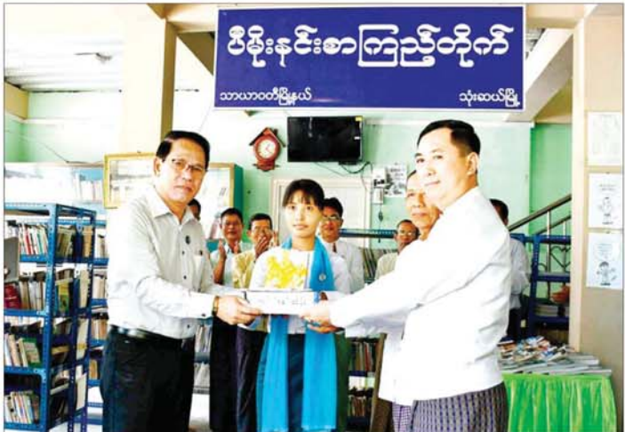
ပြည်ထောင်စုဝန်ကြီး ဦးမောင်မောင်အုန်း သုံးဆယ်မြို့ရှိ ဝိမိန်းနင်းစာကြည့်တိုက်အတွက် အလှူငွေနှင့် စာအုပ်စာစောင်များ ပေးအပ်လှူဒါန်းစဉ်။

ထို့နောက် တိုက်ကြီးမြို့နယ် အင်္ဂလိပ်ကျောင်းတွင် တည်ဆောက်ထားသည့် ပညာအလင်းစာကြည့်တိုက် ဖွင့်လှစ်ပွဲအခမ်းအနားသို့ တက်ရောက်၍