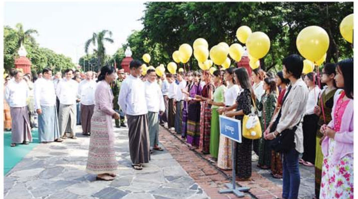
နှုတ်ဆက်ခဲ့ကြောင်းနှင့် ယခု တက္ကသိုလ်၊ မန္တလေးတက္ကသိုလ်၊ ဆိုင်ရာသုတေသနစာတမ်း ၂၂ မန္တလေးအဝေးသင်တက္ကသိုလ်၊ စောင် ဖတ်ကြားသွားမည် ၁၃ရက်အထိ ကျင်းပသွားမည် မန္တလေးနိုင်ငံခြားဘာသာတက္ကသိုလ်နှင့် မန္တလေးတက္ကသိုလ်များ မြစ်ကြောင်း သိရသည်။ (မန္တလေးနေ့စဉ်) ၀-၀-၀-၀