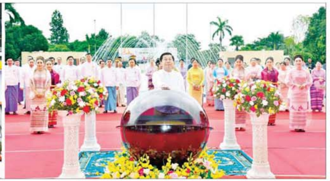
နိုင်ငံတော်စီမံအုပ်ချုပ်ရေးကောင်စီဥက္ကဋ္ဌ နိုင်ငံတော်ဝန်ကြီးချုပ် ဗိုလ်ချုပ်မှူးကြီး မင်းအောင်လှိုင် (၂၅) ကြိမ်မြောက် ငွေရတုအထိမ်းအမှတ် မြန်မာ့ရိုးရာယဉ်ကျေးမှု အဆို၊ အက၊ အရေး၊ အတီးပြိုင်ပွဲဆိုင်ရာဘက်ကို စက်ခလုတ်နှိပ်ဖွင့်လှစ်ပေးစဉ်။