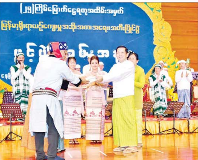
နိုင်ငံတော်စီမံအုပ်ချုပ်ရေးကောင်စီဥက္ကဋ္ဌ နိုင်ငံတော်ဝန်ကြီးချုပ် ဦးလှိုင်အောင်လှိုင်နှင့် ဒေါ်ကြူကြူလှ ဖျော်ဖြေတင်ဆက်ခဲ့ကြသည့် ပြည်ထောင်စုဖွားတိုင်းရင်းသားတို့၏ တိုင်းရင်းသားတူရိယာ ရိုးရာသံစုံတေးဂီတအဖွဲ့မှ တိုင်းရင်းသားဂီတပညာရှင်များအား ဂုဏ်ပြုချီးမြှင့်ငွေများ ပေးအပ်စဉ်။

ထို့အပြင် ယခုနှစ်ငွေရတုပြိုင်ပွဲကြီး၏ ဖွင့်ပွဲအခမ်းအနားတွင် တိုင်းရင်းသားများ၏ ရိုးရာတူရိယာများနှင့် စုပေါင်းတီးခတ်ထားသည့် တေးဂီတများဖြင့် ဖျော်ဖြေတင်ဆက်ကြခြင်းအပြင် ထူးခြားသော ဝိသေသဖြစ်သည့် ပြည်နယ်များ၏ တိုင်းရင်းသားရိုးရာ တေးဂီတများနှင့် ဂုဏ်ပြုဖျော်ဖြေနိုင်ခြင်း သည်လည်း ပြည်ထောင်စုဖွား မြန်မာ တိုင်းရင်းသားအားလုံး၏ ရိုးရာ အနုပညာအမွေအနှစ် တန်ဖိုးများကို ဖော်ထုတ်ပြသနိုင်ရုံသာမကဘဲ သွေးစည်းညီညွတ်မှုကိုပါ အနုပညာဖြင့် သက်သေပြု တင်ဆက်ပြသခြင်း ပင်ဖြစ်ကြောင်း။ ခေတ်အဆက်ဆက် ထွန်းကားလာခဲ့သည့် မြန်မာ့ယဉ်ကျေးမှု