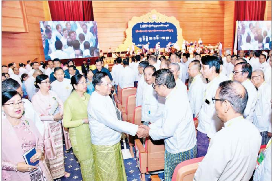
နိုင်ငံတော်စီမံအုပ်ချုပ်ရေးကောင်စီဥက္ကဋ္ဌ နိုင်ငံတော်ဝန်ကြီးချုပ် ဗိုလ်ချုပ်မှူးကြီး မင်းအောင်လှိုင် အကဖြတ်ပညာရှင်များကို ရင်းရင်းနှီးနှီးနှုတ်ဆက်စဉ်။

တူညီသည့် အခြေခံအတွင်း၌ပင် ဆင့်ပွား တည်ရှိနေသည်ကို တွေ့မြင်ကြရမည်ဖြစ်ကြောင်း။ ထို့ကြောင့် အဆို၊ အက၊ အရေး၊ အတီး ပြိုင်ပွဲကြီးများတွင် ယဉ်ကျေးမှုဖလှယ်သည့် အနေဖြင့် ပြည်နယ်အသီးသီး၏ ရိုးရာအကများကို နှစ်စဉ်မဲနှိုက်စေပြီး မဲကျရာ တိုင်းရင်းသားရိုးရာအကကို တိုင်းဒေသကြီးနှင့် ပြည်နယ်များမှ အနုပညာရှင်များအနေဖြင့် အတူတကွပူးပေါင်းပါဝင် ယှဉ်ပြိုင်ကြသည်ကို တွေ့မြင်ကြရမည်ဖြစ်ကြောင်း။ စာမျက်နှာ ၄ သို့ ၀