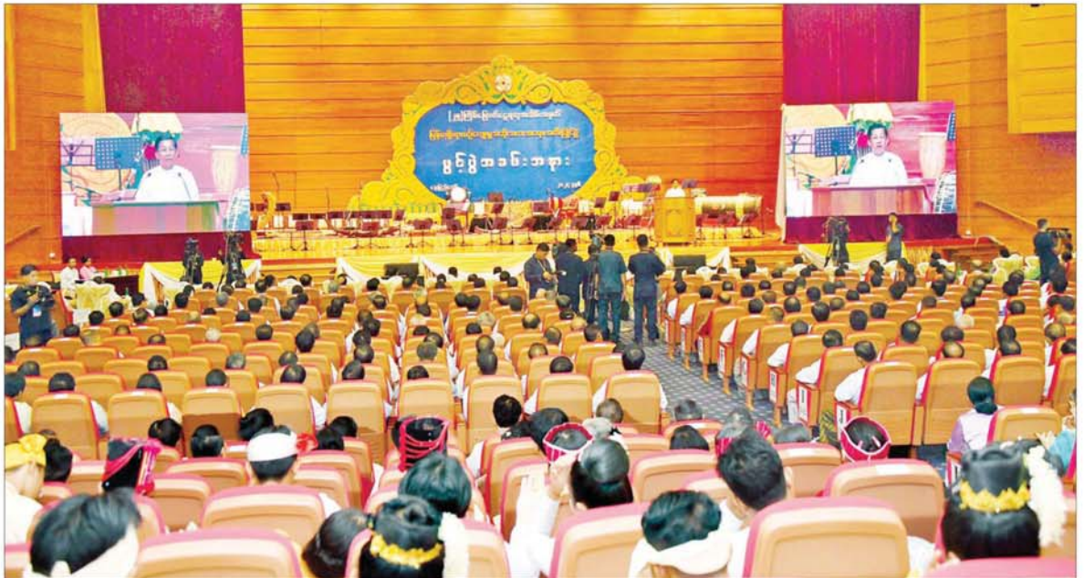
နိုင်ငံတော်စီမံအုပ်ချုပ်ရေးကောင်စီဥက္ကဋ္ဌ နိုင်ငံတော်ဝန်ကြီးချုပ် ဗိုလ်ချုပ်မှူးကြီး မင်းအောင်လှိုင် (၂၅)ကြိမ်မြောက် ငွေရတုအထိမ်းအမှတ် မြန်မာ့ရိုးရာယဉ်ကျေးမှု အဆို၊ အက၊ အရေး၊ အတီးပြိုင်ပွဲ ဖွင့်ပွဲအခမ်းအနားတွင် အမှာစကားပြောကြားစဉ်။

မြန်မာ့ရိုးရာယဉ်ကျေးမှု အဆို၊ အက၊ အရေး၊ အတီးပြိုင်ပွဲကြီးများကို ခမ်းနားသိုက်မြိုက်စွာဖြင့် ပြည်ထောင်စုသား အားလုံး ပူးပေါင်းပါဝင်ပြီး အောင်အောင် မြင်မြင်ဖြင့် ကျင်းပလာခဲ့သည့်မှာ ယခုအခါ ငွေရတုမှတ်တိုင်ကို