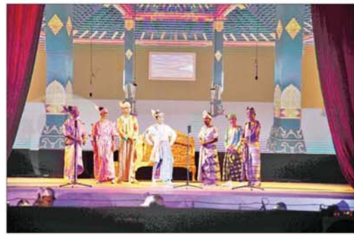
နိုင်ငံတော်စီမံအုပ်ချုပ်ရေးကောင်စီအဖွဲ့ဝင်များ၊ ပြည်ထောင်စုအဆင့်ပုဂ္ဂိုလ်များ၊ ဒုတိယဝန်ကြီးများနှင့် တာဝန်ရှိသူများ ဧရာဝတီတိုင်းဒေသကြီးကိုယ်စားပြု မဟာဇရာဇာတ်တော်ကြီးအဖွဲ့ ယှဉ်ပြိုင်နေမှုကို ကြည့်ရှုအားပေးစဉ်။

သာသနာရေးနှင့် ယဉ်ကျေးမှုဝန်ကြီးဌာနရှိ ယဉ်ကျေးမှုရာဇာခန်းမ၌ကျင်းပရာ ရုပ်စုံသဘင် အဖွဲ့လိုက် ဝါသနာရှင်အဆင့် (ပထမတန်း) ပြိုင်ပွဲတွင် “ဝေသန္တရာ” ဇာတ်တော်ကြီးဖြင့် မွန်ပြည်နယ်ကိုယ်စားပြု အောင်နန်းစိုး ရုပ်စုံသဘင်အဖွဲ့က မြန်မာ့ရိုးရာယဉ်ကျေးမှု အမွေအနှစ်များကို ဖော်ကျူးသည့် အကအလှများ၊ စကားပြောများဖြင့် တင်ဆက်ကပြ ယှဉ်ပြိုင်ကြသည်။ ဇာတ်တော်ကြီး ပြိုင်ပွဲကို နေပြည်တော် စည်ပင်သာယာရေးကော်မတီ လဟာပြင်ဇာတ်ရုံ၌ ကျင်းပရာ ဇာတ်တော်ကြီးအဖွဲ့လိုက် ဝါသနာရှင်အဆင့် (ပထမတန်း) ပြိုင်ပွဲတွင် “မဟာဇနက” ဇာတ်တော်ကြီးဖြင့် ဧရာဝတီတိုင်းဒေသကြီးကိုယ်စားပြု မဟာဇရာဇာတ်တော်ကြီးအဖွဲ့က မူရင်းဇာတ်တော်ကြီး၏တီးလုံးတီးချက်များကို မြန်မာ့ဇာတ်သဘင်၏