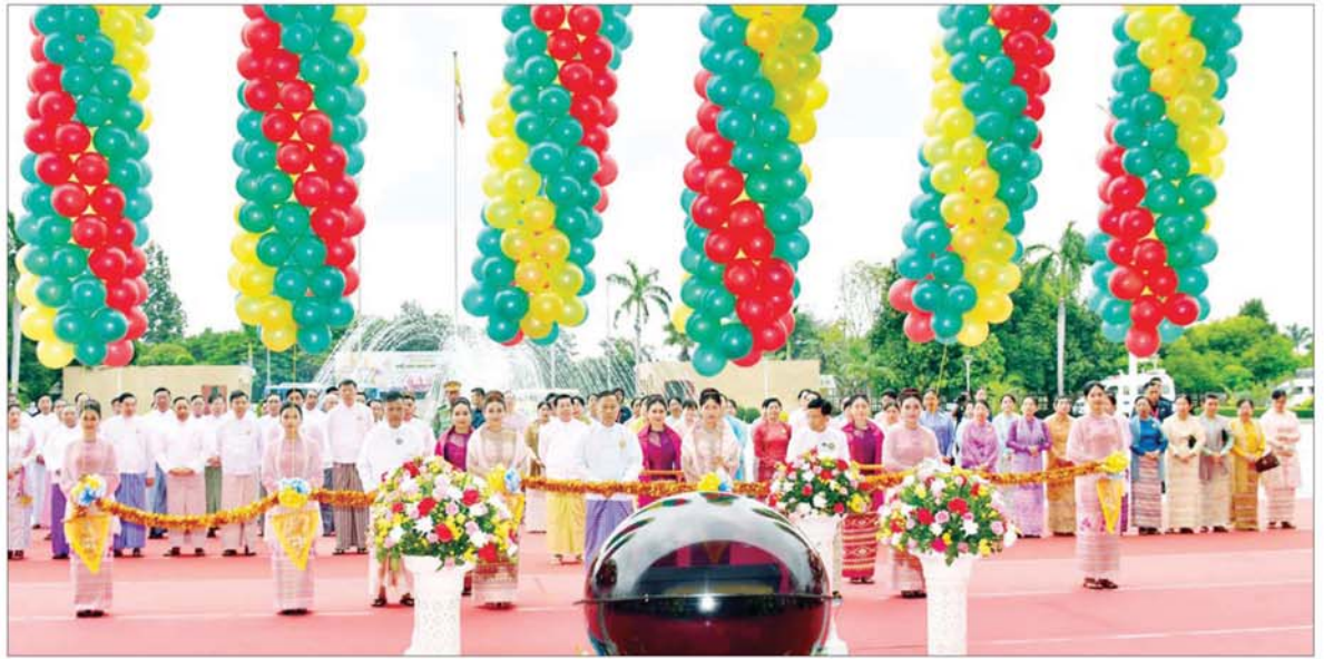
ပြိုင်ပွဲကျင်းပရေးဦးစီးကော်မတီနာယက နိုင်ငံတော်စီမံအုပ်ချုပ်ရေးကောင်စီ ဒုတိယဥက္ကဋ္ဌ ဒုတိယဝန်ကြီးချုပ် ဒုတိယဗိုလ်ချုပ်မှူးကြီး စိုးဝင်း၊ ပြိုင်ပွဲကျင်းပရေးဦးစီးကော်မတီဥက္ကဋ္ဌ ပြည်ထောင်စုဝန်ကြီး ဦးတင်ဦးလွင်နှင့် နေပြည်တော်ကောင်စီဥက္ကဋ္ဌ ဦးသန်းထွန်းဦးတို့ (၂၅) ကြိမ်မြောက် ငွေရတုအထိမ်းအမှတ် မြန်မာ့ရိုးရာယဉ်ကျေးမှု အဆို၊ အက၊ အရေး၊ အတီး ပြိုင်ပွဲဖွင့်ပွဲအခမ်းအနားကို ဖဲကြိုးဖြတ်ဖွင့်လှစ်ပေးကြစဉ်။

အခမ်းအနားသို့ နိုင်ငံတော်စီမံအုပ်ချုပ်ရေးကောင်စီ ဥက္ကဋ္ဌ နိုင်ငံတော် ဝန်ကြီးချုပ်၏ဇနီး ဒေါ်ကြူကြူလှ၊ နိုင်ငံတော်စီမံအုပ်ချုပ်ရေးကောင်စီ ဒုတိယဥက္ကဋ္ဌ ဒုတိယဝန်ကြီးချုပ် ဒုတိယဗိုလ်ချုပ်မှူးကြီးစိုးဝင်းနှင့်ဇနီး ဒေါ်သန်းသန်းနွယ်၊ ကောင်စီတွဲဖက် အတွင်းရေးမှူးနှင့် ဇနီး၊ ကောင်စီဝင်များနှင့် ဇနီးများ၊ ပြည်ထောင်စုအဆင့် ပုဂ္ဂိုလ်များ၊ ပြည်ထောင်စုဝန်ကြီးများနှင့်ဇနီးများ၊ နေပြည်တော်ကောင်စီဥက္ကဋ္ဌ၊ ကာကွယ်ရေးဦးစီးချုပ်ရုံးမှ အဆင့်မြင့် တပ်မတော်အရာရှိကြီးများ၊ နေပြည်တော် တိုင်းစစ်ဌာနချုပ် တိုင်းမှူး၊ ဒုတိယဝန်ကြီးများ၊ ပြိုင်ပွဲကျင်းပရေး ဦးစီးကော်မတီ၊ လုပ်ငန်းကော်မတီနှင့် ဆက်ကော်မတီတို့မှ ကော်မတီဝင်များ၊ တိုင်းဒေသကြီးနှင့် ပြည်နယ်ဝန်ကြီးများ၊ အက်ဖြတ်ပညာရှင်ကြီးများ၊ ကြီးကြပ်အုပ်ချုပ်သူများ၊ နည်းပြများ၊ အထောက်အကူပြုများ၊ တိုင်းဒေသကြီးနှင့် ပြည်နယ်များမှ ပြိုင်ပွဲဝင်တိုင်းရင်းသား ညီအစ်ကိုမောင်နှမများနှင့် တာဝန်ရှိသူများ တက်ရောက်ကြသည်။