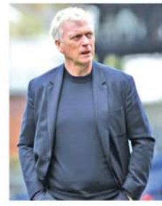
အမြစ် မြင်တွေ့ရမည်လားဆိုသည်မှာ စိတ်ဝင်စားဖွယ် စောင့်ကြည့်ရမည်ဖြစ်သည်။ (အပေါ်ပုံ) (NGB)

စဉ်းစားသွားဖွယ်ရှိနေသည်။ နည်းပြ ဒေးဗစ်မိုယကစ်သည် နည်းပြဘဝတစ်လျှောက်တွင် အဲဗာတန်၊ မန်ချက်စတာယူနိုက်တက်၊ ဆိုစီဒက်၊ ဆန်းဒါးလန်း၊ ဝက်စ်ဟမ်းစသည့် ကလပ်အသင်းများအား ကိုင်တွယ်ပြီး နည်းပြတာဝန်ပေးလည်းဖြစ်သည်။ ထို့ကြောင့် နည်းပြ ဒေးဗစ်မိုယကစ်အား လက်ရှိထွက်ပေါ်နေသည့် သတင်းများအတိုင်း ခရစ္စတယ်ပဲလေ့စ်အသင်းနည်းပြ