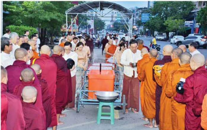
မန္တလေး အောက်တိုဘာ ၁၇ ဗုဒ္ဓဘာသာဘုရားကျောင်း ဂေါပက ယူပွဲကို အောက်တိုဘာ ၁၇ ရက် (သီတင်းကျွတ်လပြည့်)နေ့ နံနက် ၆ နာရီက ကျင်းပခဲ့သည်။

ထိုသို့ ဘုံဆွမ်းလောင်းလှူပွဲတွင် မြတောင်တိုက်မှ သံဃာတော် အပါး ၂၅၀ တို့အား ပင့်ဖိတ်၍ ယူနန်ဗုဒ္ဓဘာသာဘုရားကျောင်း ဂေါပကအဖွဲ့ဥက္ကဋ္ဌနှင့် တာဝန်ရှိသူများက ဆွမ်း၊ ဆွမ်းဟင်းများ၊ လှူဖွယ်ပစ္စည်းများနှင့် နဝကမ္မဝတ္ထုငွေများ ဆက်ကပ်လောင်းလှူကြသည်။