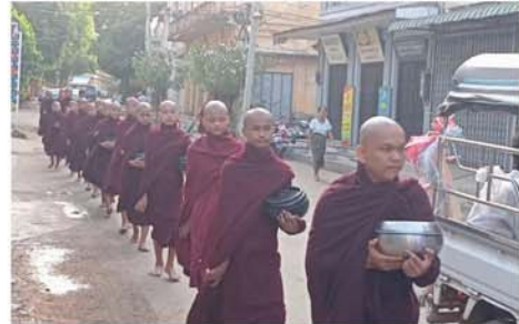
သီးရှိ လမ်းများသို့ သီတင်းကျွတ်လပြည့်မတိုင်ခင်မှ စတင်ကာ ငါးရက်တိုင်တိုင် ဆွမ်းအလှူကြွတော်မူကြခြင်း ဖြစ်သည်။ မုံရွာမြို့ မဟာဇောတိကရာဇကျောင်းတိုက်ကြီးကို ၁၉၂၅ ခုနှစ်၊ ဖေဖော်ဝါရီ ၃ ရက်၊ ၁၂၈၆ ခု တပို့တွဲလဆန်း ၁၁ ရက်က ဆရာတော် ဘဒ္ဒန္တဇောတိက စတင်တည်ထောင်ခဲ့သည့်အတွက် လာမည့် ၂၀၂၅ ခုနှစ်၊ ဖေဖော်ဝါရီ ၃ ရက်တွင် နှစ် ၁၀၀ (ရာပြည့်)ပြည့်ဖြစ်ကြောင်း သိရသည်။

ကာလ တစ်ကြိမ်၊ ဝါဝင်တစ်ကြိမ်နဲ့ သီတင်းကျွတ် တစ်ကြိမ် မုံရွာမြို့ထဲက ရပ်ကွက်တွေကို ရက်ခွဲပြီး ဆွမ်းအလှူကြွတာ ဖြစ်ပါတယ်။ မုံရွာမြို့သူ၊ မြို့သားတွေကလည်း ဒီလိုလှူဒါန်းခွင့်ကို လက်လွှတ်မခံဘဲ လှူဒါန်းကြပါတယ်ဟု မုံရွာမြို့နေ အလှူရှင်တစ်ဦးက ပြောသည်။ မဟာဇောတိကရာဇကျောင်းတိုက် လက်ရှိ ဆရာတော် ဦးဆောင်၍ တိုက်အုပ်၊ တိုက်ကြပ်များလိုက်ပါပြီး သံဃာတော်နှင့် ကိုရင် ၆၉ ပါးသည် မုံရွာမြို့ ရပ်ကွက်အသီး