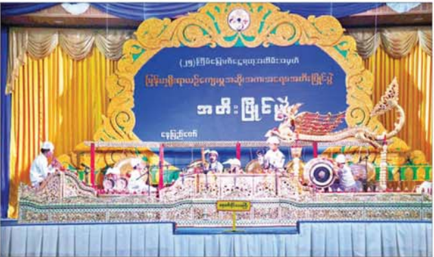
နိုင်ငံတော်စီမံအုပ်ချုပ်ရေးကောင်စီအဖွဲ့ဝင် ဒုတိယဗိုလ်ချုပ်ကြီးရာပြည့်နှင့် တာဝန်ရှိသူများ ဆိုင်းရိုင်းကြီးအဖွဲ့လိုက်အတီးပြိုင်ပွဲ အခြေခံပညာအဆင့်(အသက် ၁၀ နှစ်မှ ၁၅ နှစ်အတွင်း)အမျိုးသားပြိုင်ပွဲတွင် ဧရာဝတီတိုင်းဒေသကြီးမှ ပြိုင်ပွဲဝင်များ တီးခတ်ယှဉ်ပြိုင်နေမှုကို ကြည့်ရှုအားပေးကြစဉ်။

ယနေ့တွင် “မဟာဂီတ” တေးသီချင်း အဆိုပြိုင်ပွဲကို မြန်မာအပြည်ပြည်ဆိုင်ရာကွန်ဗင်းရှင်းဗဟိုဌာန(၂) Signing Room ၌ ကျင်းပရာ အခြေခံပညာအဆင့်(အသက် ၁၅ နှစ်မှ ၂၀ နှစ်အတွင်း) အမျိုးသားပြိုင်ပွဲတွင် ကချင်ပြည်နယ်၊ ရှမ်းပြည်နယ်၊ ချင်းပြည်နယ်၊ တနင်္သာရီတိုင်းဒေသကြီး၊ စစ်ကိုင်းတိုင်းဒေသကြီး၊ ရန်ကုန်တိုင်းဒေသကြီး၊ ဧရာဝတီတိုင်းဒေသကြီး၊ ပဲခူးတိုင်းဒေသကြီး၊ မကွေးတိုင်း