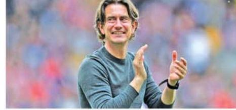
အဆိုပါ နည်းပြသည် ဘရန့်ပိုဒ် အသင်းအား ၂၀၁၈ ခုနှစ်အောက်တိုဘာ ၁၆ရက်က စတင်ကိုင်တွယ်ပြီး ပြိုင်ပွဲပေါင်း ၂၅၃ ပွဲ ကိုင်တွယ်အပြီးတွင် ၁၃၉ ပွဲနိုင်၊ ၆၉ ပွဲသရေ၊ ၉၅ပွဲရှုံး

စွမ်းဆောင်ပေးသွားမှာပါဟု ဖြောကြားသည်။ (အောက်ပုံ) ဘရန့်ပိုဒ်အသင်းသည် ယခုနှစ်ဘောလုံးရာသီ ပရီးမီးယားလိဂ်ပွဲစဉ် (၇)ပွဲကစားပြီးတွင် ရမှတ် ၁၀မှတ်ဖြင့် အဆင့် ၁၁ နေရာတွင် ရပ်တည်လျက်ရှိသည်။ (NGB)