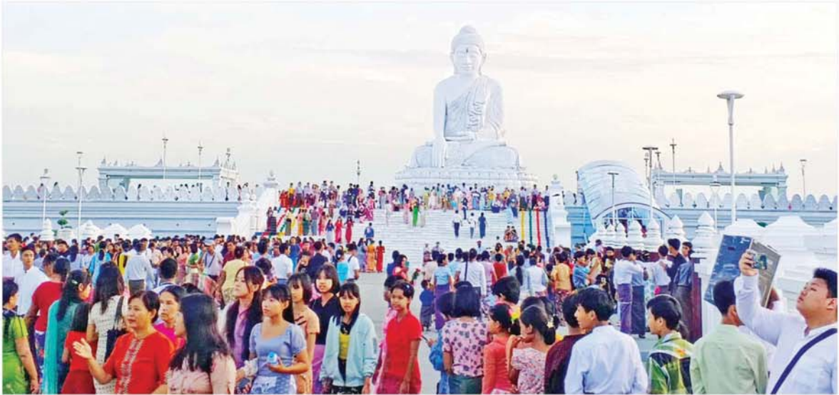
မာရဂဗဇယဗုဒ္ဓရုပ်ပွားတော်မြတ်ကြီး၌ သီတင်းကျွတ်လပြည့်နေ့ (အဘိဓမ္မာအခါတော်နေ့) တွင် ဘုရားဖူးလာပြည်သူများဖြင့် အထူးစည်ကားလျက်ရှိသည်ကို တွေ့ရစဉ်။

နေပြည်တော် အောက်တိုဘာ ၁၇ ယနေ့သည် ဗုဒ္ဓဘာသာဝင် တို့၏ နေ့ထူးနေ့မြတ် သီတင်းကျွတ်လပြည့်နေ့ (အဘိဓမ္မာအခါတော်နေ့) ဖြစ်သည့်အတွက် နိုင်ငံတစ်ဝန်းရှိ ဘုရား၊ စေတီ၊ ပုထိုးများ၌ ဆွမ်း၊ ပန်း၊ ရေချမ်း၊ ဆီမီးများ ကပ်လှူပူဇော်ခြင်း၊ အလှူဒါနပြုခြင်း၊ သီလဆောက်တည်ခြင်းနှင့် တရားဘာဝနာပွားများခြင်းစသည့် ကုသိုလ်ကောင်းမှုများကို ပြုလုပ်လျက် ရှိရာ ပြည်ထောင်စုနယ်မြေ နေပြည်တော်ရှိ တန်ခိုးကြီးဘုရားစေတီပုထိုးများ၌လည်း ဗုဒ္ဓဘာသာ ထုံးတမ်းအစဉ်အလာနှင့်အညီ ကုသိုလ်ကောင်းမှု ပြုလုပ်၍ သီတင်းသီလ ဆောက်တည်ကြသူ ရဟန်းရှင်လူပြည်သူများဖြင့် စည်ကားခဲ့သည်။