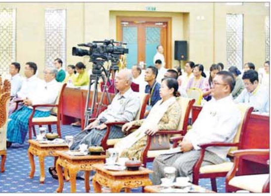
နိုင်ငံတော်စီမံအုပ်ချုပ်ရေးကောင်စီအဖွဲ့ဝင် ဒုတိယဗိုလ်ချုပ်ကြီးရာပြည့်နှင့် တာဝန်ရှိသူများ ဆိုင်းရိုင်းကြီးအဖွဲ့လိုက်အတီးပြိုင်ပွဲ အခြေခံပညာအဆင့်(အသက် ၁၀ နှစ်မှ ၁၅ နှစ်အတွင်း)အမျိုးသားပြိုင်ပွဲတွင် ကချင်ပြည်နယ်မှ ပြိုင်ပွဲဝင်တစ်ဦး ယှဉ်ပြိုင်နေမှုကို ကြည့်ရှုအားပေးကြစဉ်။