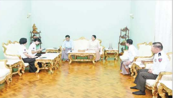
နိုင်ငံတော်စီမံအုပ်ချုပ်ရေးကောင်စီအဖွဲ့ဝင် ဗိုလ်ချုပ်ကြီး မောင်မောင်အေး၏ မိသားစုက သန်းခေါင်စာရင်း ကောက်ယူရေးအဖွဲ့၏ မေးခွန်းများကို ဖြေကြားစဉ်။