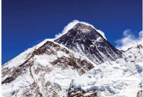
၁၅ မီတာမှ မီတာ ၅၀ အထိ ပိုမြင့်လာသည်ဆိုသော ကမ္ဘာ့အမြင့်ဆုံး ၈၀ရက်တောင်ကို တွေ့ရစဉ်။ Mon

လန်ဒန် အောက်တိုဘာ ၁ ကျောက်မီးသွေးသုံးပြီး လျှပ်စစ်ဓာတ်အားထုတ်ယူခြင်းကို ဗြိတိန်နိုင်ငံတွင် အပြီးအပိုင်ရပ်တန့်တော့မည်ဖြစ်ကြောင်း ဘီဘီစီသတင်းဌာနက ဖော်ပြသည်။ ၁၉၆၇ ခုနှစ်ကတည်းက ကျောက်မီးသွေးလောင်စာသုံးပြီး လျှပ်စစ်ဓာတ်အားထုတ်ယူခဲ့သော စက်ရုံအပေါ်အခြေအနေကျောက်မီးသွေးအခြေပြုဓာတ်အားပေးစက်ရုံများကို ပိတ်ပစ်တော့မည်ဟု စွမ်းအင်ဝန်ကြီး မိုက်ကယ်လ်ရှန်က ထုတ်ဖော်ပြောကြားသည်။ လေထုညစ်ညမ်းမှုလျှော့ချနိုင်ရန် ထိုစက်ရုံများ ပိတ်ပစ်ပြီးနောက် နေ့စွမ်းအင်၊ လေစွမ်းအင်တို့ဖြင့် အစားထိုးရာတွင် စိန်ခေါ်မှုများစွာရှိလာနိုင်ကြောင်း သိရသည်။ Mon