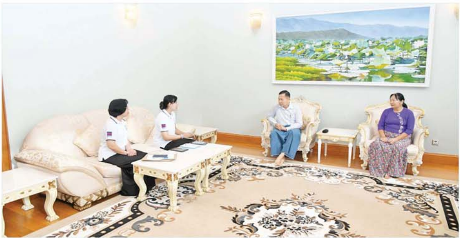
နိုင်ငံတော်စီမံအုပ်ချုပ်ရေးကောင်စီ ဒုတိယဥက္ကဋ္ဌ ဒုတိယဝန်ကြီးချုပ် ဒုတိယဗိုလ်ချုပ်မှူးကြီး စိုးဝင်း၏ မိသားစုက သန်းခေါင်စာရင်းကောက်ယူရေးအဖွဲ့၏ မေးခွန်းများကို ဖြေကြားစဉ်။

မေးမြန်းကောက်ယူသွားမည်ဖြစ်ကြောင်း သိရှိရသည်။ တိုးမြှင့်မေးမြန်းထား ထပ်မံ တိုးမြှင့်ကောက်ခံမည့် အချက်အလက်များမှ ထင်ရှားသော ဥပမာအနေဖြင့် ပညာရေး ကဏ္ဍတွင် ကျောင်းဆက်လက် မတက်ရောက်ရသည့် အဓိက အကြောင်းရင်း၊ အိမ်အကြောင်း အရာကဏ္ဍတွင် အခွက်စွန့်ပစ်မှု စနစ်၊ သန့်ရှင်းမှုစနစ် စသည်ဖြင့် တိုးမြှင့် မေးမြန်းထားသည်ကို တွေ့ရှိရပြီး ယင်းအချက်များမှာ ပြည်သူလူထု၏ ပညာရေး၊ ကျန်းမာရေး၊ လူမှုရေးကဏ္ဍတို့တွင် အစိုးရမည်ကဲ့သို့ ဖြည့်ဆည်းပေးရမည်ကို သုံးသပ်သည့်မေးခွန်းများဖြစ်သဖြင့် လက်တွေ့အသုံးဝင်သည့် အချက်အလက်များပင်ဖြစ်ကြောင်း၊ စာရင်းကောက်ယူသူများက နံနက် ၇ နာရီမှ ညနေ ၆ နာရီအတွင်း နေအိမ်များသို့ လာရောက်စာရင်းကောက်ယူမည် ဖြစ်ပြီး နေအိမ်များသို့ စာရင်းလာကောက်မည့်နေ့ကို ကြိုတင် အကြောင်းကြားမည်ဖြစ်ကြောင်း၊ သန်းခေါင်စာရင်း ကောက်ယူခြင်းသည် အိမ်ထောင်စုစာရင်း ပုံစံ (၆၆/၆) သို့မဟုတ် ပုံစံ(၁၀) ရှိခြင်း/ မရှိခြင်း၊ နိုင်ငံသားစိစစ်ရေးကတ်ပြားရှိခြင်း/မရှိခြင်းနှင့် မသက်ဆိုင်ကြောင်း၊ တိုင်းရင်းသားဖြစ်ခြင်း၊ မဖြစ်ခြင်း၊ နိုင်ငံသားဖြစ်ခြင်း၊ မဖြစ်ခြင်းနှင့် မသက်ဆိုင်ကြောင်း၊ သန်းခေါင်စာရင်း ထည့်သွင်းမကောက်ရမည့် သူများမှအပ သန်းခေါင်စာရင်း ရည်ညွှန်းချိန်