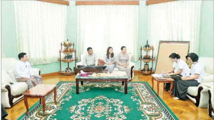
နိုင်ငံတော်စီမံအုပ်ချုပ်ရေးကောင်စီ တွဲဖက်အတွင်းရေးမှူး ဗိုလ်ချုပ်ကြီး ရဲဝင်းဦး၏ မိသားစုက သန်းခေါင်စာရင်းကောက်ယူရေးအဖွဲ့၏ မေးခွန်းများကို ဖြေကြားစဉ်။