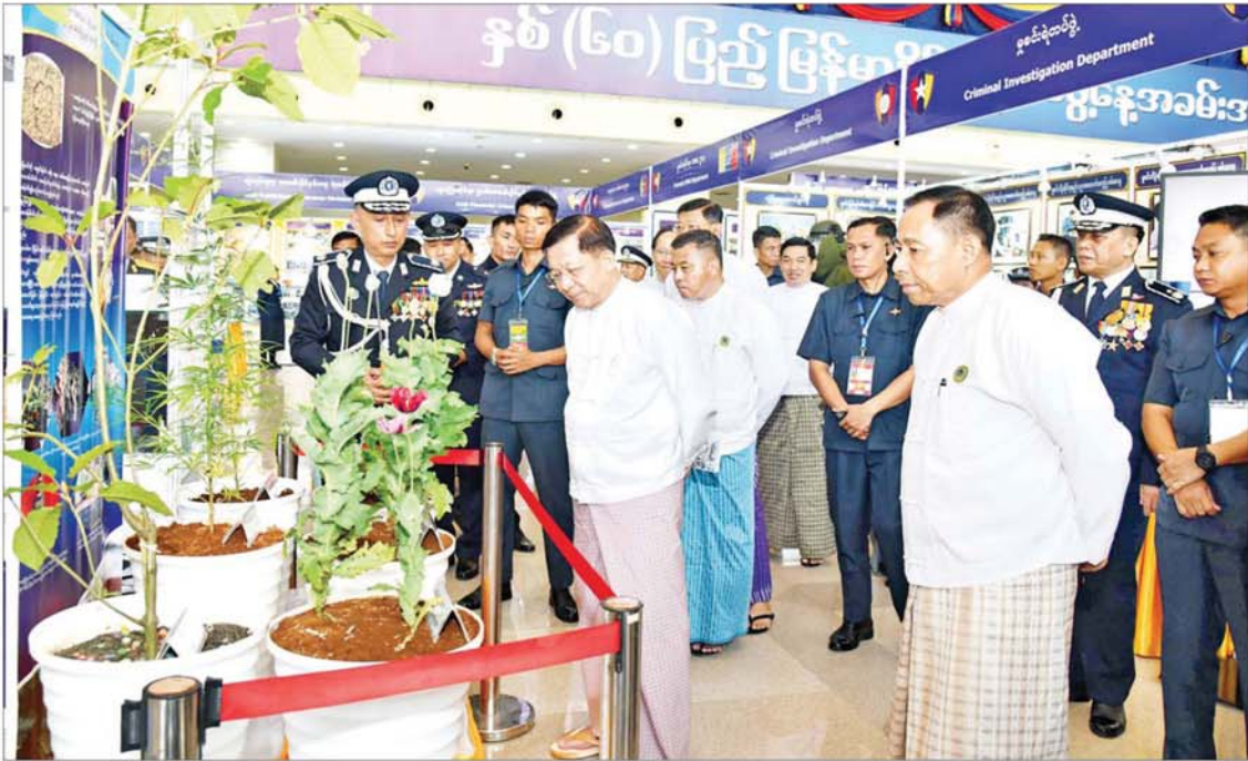
နိုင်ငံတော်စီမံအုပ်ချုပ်ရေးကောင်စီဥက္ကဋ္ဌ နိုင်ငံတော်ဝန်ကြီးချုပ် ဗိုလ်ချုပ်မှူးကြီး မင်းအောင်လှိုင် နှစ်(၆၀) ပြည့် မြန်မာနိုင်ငံရဲတပ်ဖွဲ့နေ့အခမ်းအနား ဝင်းကျင်းပြုသည့် အခမ်းအနားကို လှည့်လည်ကြည့်ရှုစဉ်။

တက်ရောက် အခမ်းအနားသို့ ကောင်စီတွဲဖက် အတွင်းရေးမှူး ဗိုလ်ချုပ်ကြီး ရဲဝင်းဦး၊ ကောင်စီဝင်များ၊ ပြည်ထောင်စုဝန်ကြီး များနှင့် ပြည်ထောင်စုအဆင့်ပုဂ္ဂိုလ်များ၊ နေပြည်တော်ကောင်စီဥက္ကဋ္ဌ၊ ကာကွယ်ရေးဦးစီးချုပ်ရုံးမှ အဆင့်မြင့်တပ်မတော် အရာရှိကြီးများ၊ နေပြည်တော်တိုင်းစစ်ဌာနချုပ်တိုင်းမှူး၊ ဒုတိယဝန်ကြီးများ၊ သံတမန်များ၊ အပြည်ပြည်ဆိုင်ရာအဖွဲ့အစည်းများမှ ဖိတ်ကြားထားသော ဧည့်သည်တော်များ၊ ဌာနဆိုင်ရာ အကြီးအကဲများ၊ အမျိုးသမီးရေးရာနှင့် ဆက်စပ်အဖွဲ့အစည်းများ၊ မြန်မာနိုင်ငံရဲတပ်ဖွဲ့ ရဲချုပ်နှင့် ရဲတပ်ဖွဲ့ဝင်များ၊ အငြိမ်းစားရဲအရာရှိကြီးများနှင့် တာဝန်ရှိသူများ တက်ရောက်ကြသည်။ စာမျက်နှာ ၃ သို့။