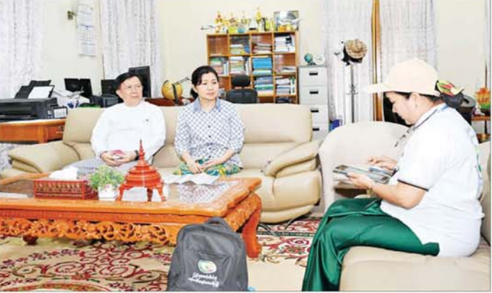
နိုင်ငံတော်စီမံအုပ်ချုပ်ရေးကောင်စီ အတွင်းရေးမှူး ဗိုလ်ချုပ်ကြီးအောင်လင်းဦး၏မိသားစုက သန်းခေါင်စာရင်းကောက်ယူရေးအဖွဲ့၏ မေးခွန်းများကို ဖြေကြားစဉ်။