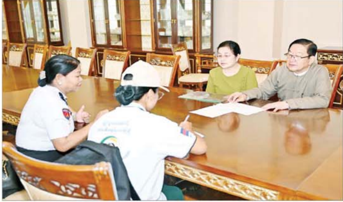
ပြည်သူ့လွှတ်တော်ဥက္ကဋ္ဌ ဦးတီခွန်မြတ်၏မိသားစုက သန်းခေါင်စာရင်းကောက်ယူရေးအဖွဲ့၏ မေးခွန်းများကို ဖြေကြားစဉ်။

* စာရင်းကောက်ယူသူများက နံနက် ၇ နာရီမှ ညနေ ၆ နာရီအတွင်း နေအိမ်များသို့ လာရောက်စာရင်းကောက်ယူမည်ဖြစ်ပြီး နေအိမ်များသို့ စာရင်းလာကောက်မည့်နေ့ကို ကြိုတင်အကြောင်းကြားမည် * သန်းခေါင်စာရင်းကောက်ယူခြင်းသည် အိမ်ထောင်စုစာရင်းပုံစံ (၆၆/၆) သို့မဟုတ် ပုံစံ(၁၀) ရှိခြင်း/ မရှိခြင်း၊ နိုင်ငံသားစိစစ်ရေးကတ်ပြားရှိခြင်း/ မရှိခြင်းနှင့် မသက်ဆိုင်ကြောင်း၊ တိုင်းရင်းသားဖြစ်ခြင်း၊ မဖြစ်ခြင်း၊ နိုင်ငံသားဖြစ်ခြင်း၊ မဖြစ်ခြင်းနှင့်မသက်ဆိုင်ကြောင်း၊ သန်းခေါင်စာရင်းထည့်သွင်းမကောက်ရမည့် သူများမှ အပ သန်းခေါင်စာရင်းရည်ညွှန်းချိန်တွင် မြန်မာနိုင်ငံနယ်နိမိတ်အတွင်းရှိနေသူ အားလုံးကို စာရင်းကောက်ယူမည်