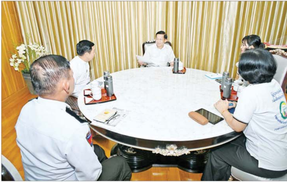
နိုင်ငံတော်စီမံအုပ်ချုပ်ရေးကောင်စီဥက္ကဋ္ဌ နိုင်ငံတော်ဝန်ကြီးချုပ် ဗိုလ်ချုပ်မှူးကြီးမင်းအောင်လှိုင် သန်းခေါင်စာရင်းကောက်ယူရေးအဖွဲ့၏ သန်းခေါင်စာရင်းမေးခွန်းများကို ပြည့်ပြည့်စုံစုံ ဖြေကြားစဉ်။

စာရင်းကောက်ယူ ယနေ့မှစလှိုင်းတွင် နိုင်ငံတော် စီမံအုပ်ချုပ်ရေးကောင်စီ ဥက္ကဋ္ဌ နိုင်ငံတော်ဝန်ကြီးချုပ် ဗိုလ်ချုပ် မှူးကြီးမင်းအောင်လှိုင်၏ မိသားစု လူဦးရေနှင့် အိမ်အကြောင်းအရာ သန်းခေါင်စာရင်းအား လူဝင်မှု ကြီးကြပ်ရေးနှင့် ပြည်သူ့အင်အား ဝန်ကြီးဌာန ပြည်ထောင်စုဝန်ကြီး ဦးမြင့်ကြိုင် ဦးဆောင်သည့် သန်းခေါင်စာရင်း ကောက်ယူရေး အဖွဲ့က ကာကွယ်ရေးဦးစီးချုပ် ရုံး(ကြည်း) ဝင်းအတွင်းရှိ တပ်မတော် ဧည့်ရိပ်သာသို့ လာရောက်၍ စာရင်းကောက်ယူ ကြသည်။