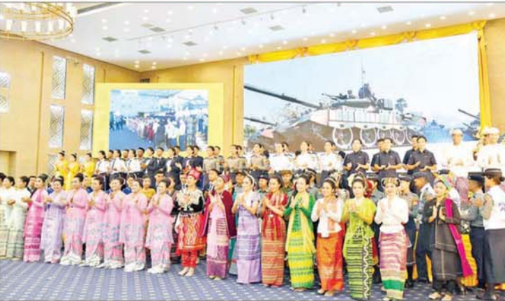
နှစ်(၆၀)ပြည့် မြန်မာနိုင်ငံရဲတပ်ဖွဲ့နေ့အထိမ်းအမှတ် ဂုဏ်ပြုညစာစားပွဲအခမ်းအနား ကျင်းပစဉ်။

နိုင်ငံဝန်ထမ်းများအား မည်သည့်နည်းလမ်းဖြင့်မဆို ခြိမ်းခြောက်ခြင်း၊ တာဝန်ထမ်းဆောင်မှုအား နှောင့်ယှက်ခြင်းများ ဆောင်ရွက်ပါက တည်ဆဲဥပဒေများနှင့်အညီ အရေးယူခံရနိုင်ပါသည်။