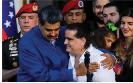
ကရာကတစ် အောက်တိုဘာ ၁၉ နိုင်ငံရေးမဟာမိတ်၊ လုပ်ငန်း ရှင်အလက်စ်ဆတ်ဘ်ကို စက်မှု ဝန်ကြီးအဖြစ် ပင်နီစွဲလားသမ္မတ နီကိုလတ်စ်မာဂူရိုက ခန့်အပ်လိုက် ကြောင်း အယ်လ်ဂျိုးနားသတင်း

ဌာနက ဖော်ပြသည်။ ကျန်းမာရေးကြောင့် နုတ် ထွက်သွားသော စက်မှုဝန်ကြီး ဟောင်း ပေးဒရိုတယ်လီချီယာ၏ နေရာတွင် ၎င်းကို မိမိတို့ဗင်နီ စွဲလားအစိုးရအဖွဲ့၏ အဖွဲ့ဝင် ဝန်ကြီးအဖြစ် ခန့်အပ်လိုက် ကြောင်း သမ္မတ နီကိုလတ်စ်မာ ဂူရိုက အောက်တိုဘာ ၁၈ ရက် တွင် ထုတ်ဖော်ကြေညာခဲ့သည်။ ဩဂုတ်လတွင်ပြုလုပ်ခဲ့သော ဝန်ကြီးနေရာအပြောင်းအလဲ၏ နောက်ဆုံးအဆင့်ဖြစ်မည်ဟု ပင်နီစွဲလားအစိုးရ ဖောင်ကြည့် လေ့လာသူများက သုံးသပ်သည်။ ဆတ်ဘ်သည် ၂၀၂၃ ခုနှစ် ဒီဇင်ဘာလက ပြုလုပ်ခဲ့သော အမေရိကန်-ဗင်နီစွဲလား နှစ်နိုင်ငံ အကျဉ်းသားအဖြန့်အလှူလုပ်ငန်း ရေးအစီအစဉ်အရ အမေရိကန်အ ကျဉ်းထောင်မှ လွတ်မြောက်လာ ခဲ့သူဖြစ်ကြောင်း သိရသည်။ Mon 0-0-0-0-0