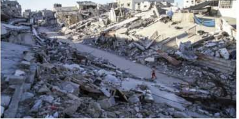
များတွင် အရပ်သားများကိုအကာ အကွယ်ယူကာ ခိုအောင်းနေဆဲ ဖြစ်ကြောင်း သိရသည်။ Mon

ဂျေရုဇလင် အောက်တိုဘာ ၁၉ ဂါဇာကမ်းမြောင်ဒေသ မြောက် ပိုင်းတစ်နေရာ၌ အောက်တိုဘာ ၁၈ ရက်တွင် အစွဲရေးဘက်က တိုက်ခိုက်သဖြင့် အရပ်သား ၃၃ ဦး သေဆုံးသည်ဟု ပါလက်စ တိုင်းကျန်းမာရေးဝန်ကြီးဌာနက အတည်ပြုကြောင်း ဘီဘီစီ သတင်းဌာနက ဖော်ပြသည်။ အမေရိကန်နှင့် အခြားကမ္ဘာ နိုင်ငံအချို့က ဂါဇာကမ်းမြောင် ဒေသ၌ အပစ်အခတ်ရပ်စဲရန်လို လားနေသော်လည်း ဟားမတ်စ် လက်ကွန်များကို ရှင်းလင်းရဦး မည်ဟု အစွဲရေးက ထုတ်ပြန် ကြေညာသည်။ ဟားမတ်စ်တို့သည် ပါလက် စတိုင်းဒုက္ခသည်စခန်းနှင့် ဆေးရုံ