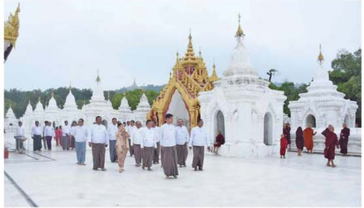
နိုင်ငံက မဟာလောကမာရဇိန် ကုသိုလ်တော် ဘုရားနှင့်နန်းမြေဘုံသာစံနန်းတော်ရာ စန္ဒာမုနိဘုရားတို့တွင် တပ်ဆင်မည့် ဘုရားဖူးလမ်းညွှန် Pagoda Digital Directory ဆောင်ရွက်ပြီးစီးမှုအခြေအနေများကို ရှင်းလင်းပြသရာ တိုင်းဒေသကြီးဝန်ကြီးချုပ်က လိုအပ်သည်များကို ဖြည့်ဆည်းဆောင်ရွက်ပေးခဲ့ကြောင်း သိရသည်။ (မန္တလေးနေ့စဉ်)