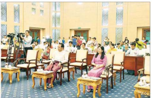
ပြည်ထောင်စုဝန်ကြီး ဦးမောင်မောင်အုန်းနှင့် ဇနီး ဝါသနာရှင်အဆင့် (ဒုတိယတန်း) အမျိုးသားရုပ်သေးကြီးဆွဲပြိုင်ပွဲတွင် တနင်္သာရီတိုင်းဒေသကြီးမှ ပြိုင်ပွဲဝင်တစ်ဦး မင်းသားကြီးဆွဲရုပ်သေး ကကြီးကကွက်စုံလင်စွာဖြင့် ယှဉ်ပြိုင်နေမှုကို ကြည့်ရှုအားပေးစဉ်။

နယ်၊ မွန်ပြည်နယ်၊ ရန်ကုန်တိုင်းဒေသကြီး၊ ဧရာဝတီတိုင်းဒေသကြီး၊ ရှမ်းပြည်နယ် နှင့် ချင်းပြည်နယ်တို့မှ ပြိုင်ပွဲဝင်များက လည်းကောင်း၊ ဝါသနာရှင်အဆင့် (ဒုတိယတန်း) အမျိုးသမီးပြိုင်ပွဲတွင် မန္တလေးတိုင်းဒေသကြီး၊ ကချင်ပြည်နယ်၊ မကွေးတိုင်းဒေသကြီး၊ ရှမ်းပြည်နယ်၊ ကယားပြည်နယ်၊ မွန်ပြည်နယ်၊ ဧရာဝတီတိုင်းဒေသကြီး၊ ပဲခူးတိုင်းဒေသကြီး၊ စစ်ကိုင်းတိုင်းဒေသကြီး၊ ချင်းပြည်နယ်၊ ကရင်ပြည်နယ်နှင့် ရန်ကုန်တိုင်းဒေသကြီးတို့မှ ပြိုင်ပွဲဝင်များကလည်းကောင်း မင်းသားကြီးဆွဲရုပ်သေး ရုပ်နှင့် ဇော်ဂျီကြီးဆွဲရုပ်သေးရုပ်တို့ဖြင့် ကကြီးကကွက် စုံလင်စွာယှဉ်ပြိုင်ကြသည်။ တိုင်းရင်းသားရိုးရာ/ ကျေးလက်ရိုးရာ အလွတ်တန်းအဆင့် အကပြိုင်ပွဲ တိုင်းရင်းသားရိုးရာ/ကျေးလက်ရိုးရာ အလွတ်တန်းအဆင့် အကပြိုင်ပွဲကို မြန်မာအပြည်ပြည်ဆိုင်ရာ ကွန်ဗင်းရှင်း ဗဟိုဌာန (၂) Plenary Hall ၌ ကျင်းပရာ ပဲခူးတိုင်းဒေသကြီး ကိုယ်စားပြု ရှမ်းတိုင်းရင်းသားရိုးရာအကအဖွဲ့၊ ရန်ကုန်တိုင်းဒေသကြီးကိုယ်စားပြု ကျေးလက်ရိုးရာအကအဖွဲ့၊ မကွေးတိုင်းဒေသကြီးကိုယ်စားပြု ကျေးလက်ရိုးရာအကအဖွဲ့၊ စစ်ကိုင်းတိုင်းဒေသကြီး ကိုယ်စားပြု ကျေးလက်ရိုးရာအကအဖွဲ့၊ ချင်းပြည်နယ်