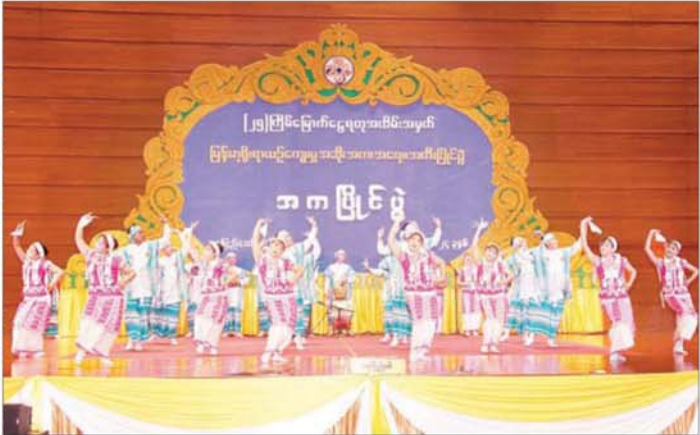
နိုင်ငံတော်စီမံအုပ်ချုပ်ရေးကောင်စီဥက္ကဋ္ဌ နိုင်ငံတော်ဝန်ကြီးချုပ် ဗိုလ်ချုပ်မှူးကြီး မင်းအောင်လှိုင်၊ ဇနီး ဒေါ်ကြူကြူလှနှင့်အဖွဲ့ဝင်များ တိုင်းရင်းသားရိုးရာ/ ကျေးလက်ရိုးရာ အလွတ်တန်းအဆင့် အကပြိုင်ပွဲတွင် ကရင်ပြည်နယ်ကိုယ်စားပြု ရိုးရာအကအဖွဲ့ က ရသမြောက်စွာ ကပြယှဉ်ပြိုင်နေမှုကို ကြည့်ရှုအားပေးစဉ်။