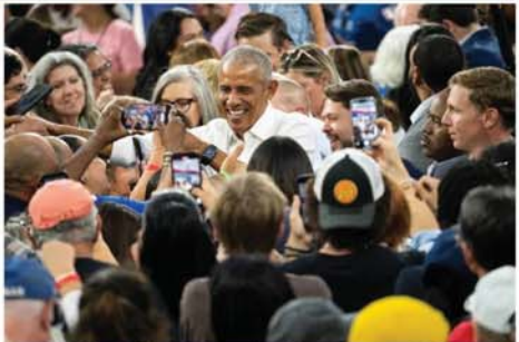
အာရိန်းနားပြည်နယ် တပ်ဆွန်မြို့တွင် အောက်တိုဘာ ၁၈ ရက်က ဒီမိုကရက်တစ်သမ္မတလောင်း ကာမာလာဟဲလ်စ်အတွက် မဲဆွယ်စည်းရုံးပေးနေသော သမ္မတဟောင်း ဘားရက်အိုဘားမားကို တွေ့ရစဉ်။ Mon