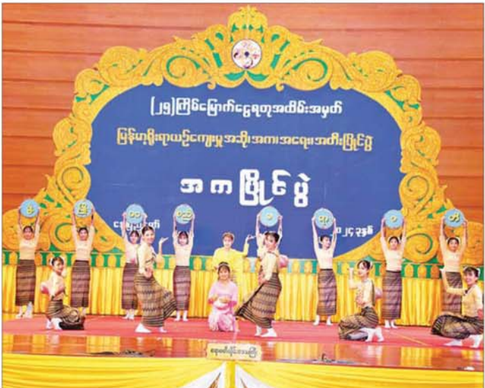
တိုင်းရင်းသားရိုးရာ/ ကျေးလက်ရိုးရာ အလွတ်တန်းအဆင့် အကပြိုင်ပွဲတွင် ဧရာဝတီတိုင်းဒေသကြီးကိုယ်စားပြု ရိုးရာအကအဖွဲ့က ကပြယုဉ်ပြိုင်နေမှုကို တွေ့ရစဉ်။