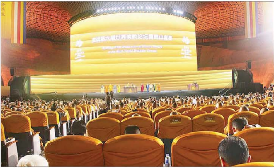
ဖိရမ်တက်ရောက် နိုင်ငံတော်သံဃမဟာနာယ ကအဖွဲ့ဥက္ကဋ္ဌ ဒေါက်တာဘဒ္ဒန္တ

စန္ဒိမာဘိဝံသ အမျိုးပြုသော ဗုဒ္ဓဘာသာကိုယ်စားလှယ်အဖွဲ့နှင့် သာသနာရေးနှင့် ယဉ်ကျေးမှုဝန်ကြီးဌာန ဒုတိယ ဝန်ကြီး ဦးအေးထွန်း တို့သည် အောက်တိုဘာ ၁၅ ရက် မှ ၁၇ ရက်အထိ တရုတ်ပြည်သူ့ သမ္မတနိုင်ငံ ကျွန်းပြည်နယ်၊ နင်းဘိုမြို့၊ ရွယ်တိုးတောင်၌ ကျင်းပပြုလုပ်သည့် ဆဋ္ဌမအကြိမ် ကမ္ဘာ့ဗုဒ္ဓဘာသာ ဖိရမ်သို့တက် ရောက်ပြီး(ယာယု) ခရီးစဉ်အတွင်း Howard Johnson ဟိုတယ် စည်ခန်းမ၌ နိုင်ငံတော်သံဃမဟာ နာယကအဖွဲ့ဥက္ကဋ္ဌ ဆရာတော် အမျိုးပြုသော ဆရာတော်ကြီး များသည် The Buddhist Association of China ၏ ဥက္ကဋ္ဌ ဆရာတော် Yan Jue အမျိုးပြု သော ဆရာတော်ကြီးများနှင့် တွေ့ဆုံခဲ့သည်။(အောက်ပုံ)