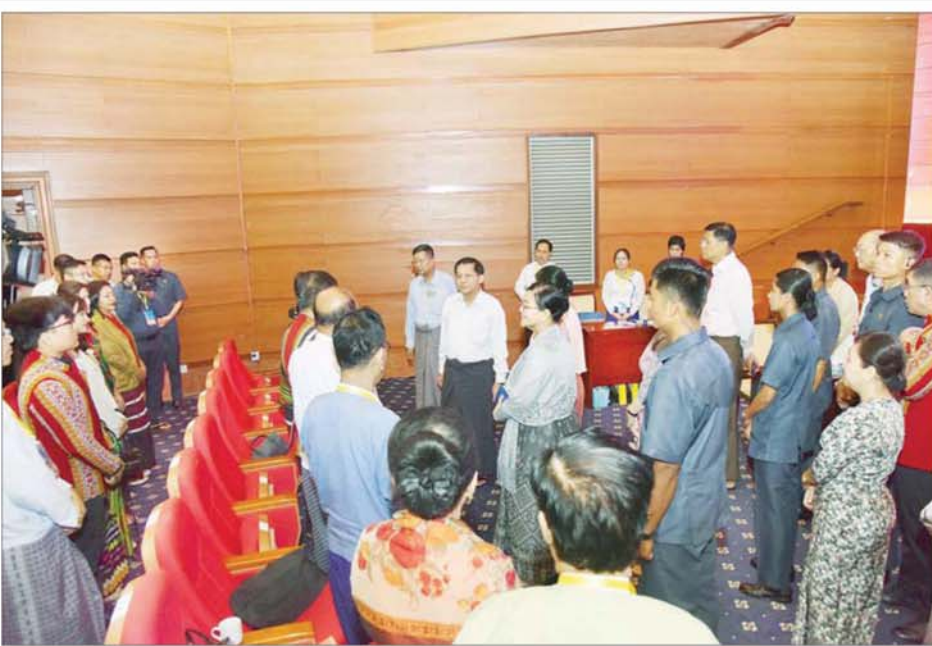
နိုင်ငံတော်စီမံအုပ်ချုပ်ရေးကောင်စီဥက္ကဋ္ဌ နိုင်ငံတော်ဝန်ကြီးချုပ် ဗိုလ်ချုပ်မှူးကြီး မင်းအောင်လှိုင် ပြိုင်ပွဲအဆင့်အလိုက် အကဲဖြတ်ဆောင်ရွက်ပေးနေသည့် အကဲဖြတ်ပညာရှင်များနှင့် ပြိုင်ပွဲဝင်များအား ရင်းရင်းနှီးနှီး နှုတ်ဆက်စဉ်။