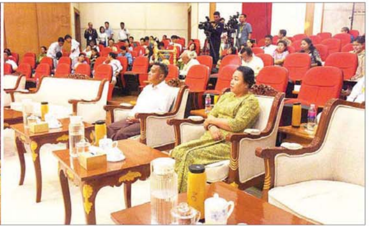
နိုင်ငံတော်စီမံအုပ်ချုပ်ရေးကောင်စီ တွဲဖက်အတွင်းရေးမှူး ဗိုလ်ချုပ်ကြီး ရဲဝင်းဦးနှင့် ဇနီး အခြေခံပညာရှင်အဆင့် (အသက် ၁၀ နှစ်မှ ၁၅ နှစ်အတွင်း) အမျိုးသား ပတ္တလားအတီးပြိုင်ပွဲတွင် ရန်ကုန်တိုင်းဒေသကြီးမှ ပြိုင်ပွဲဝင်တစ်ဦး ငြိမ်းညောင်းသာယာစွာ တီးခတ်ယှဉ်ပြိုင်နေမှုကို ကြည့်ရှုအားပေးစဉ်။