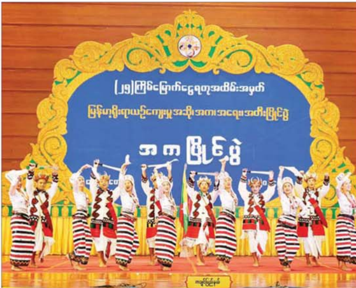
တိုင်းရင်းသားရိုးရာ/ ကျေးလက်ရိုးရာ အလွတ်တန်းအဆင့် အကပြိုင်ပွဲတွင် ကချင်ပြည်နယ် ကိုယ်စားပြု ရိုးရာအကအဖွဲ့က ကပြယုဉ်ပြိုင်နေမှုကို တွေ့ရစဉ်။