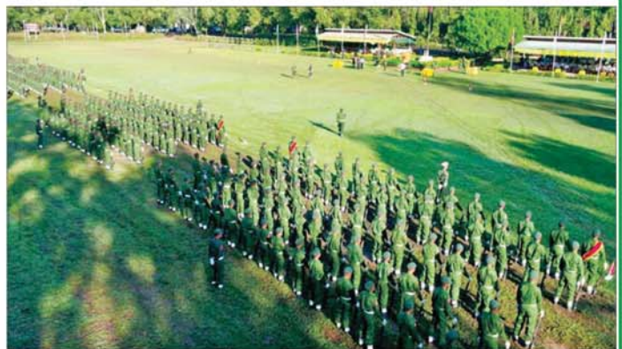
ရန်ကုန်တိုင်းဒေသကြီး ပြည်သူ့စစ်မှုထမ်းသင်တန်းဆင်းပွဲ ကျင်းပစဉ်။