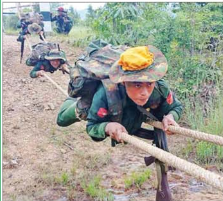
ပြည်သူ့စစ်မှုထမ်းသင်တန်းသားများ လေ့ကျင့်ရေးဆောင်ရွက်နေမှုကို တွေ့ရစဉ်။