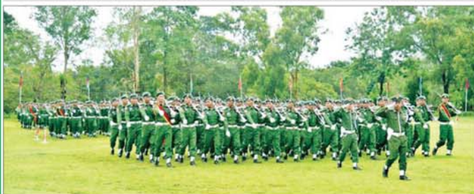
ရန်ကုန်တိုင်းဒေသကြီး ပြည်သူ့စစ်မှုထမ်းသင်တန်းဆင်းပွဲ ကျင်းပစဉ်။