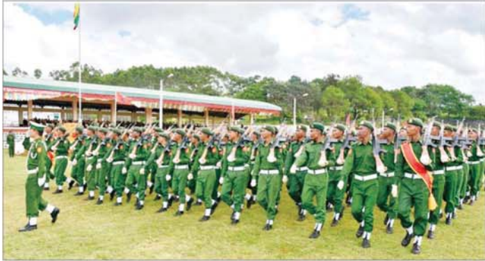
ရုမ်းပြည်နယ် ပြည်သူ့စစ်မှုထမ်းသင်တန်းဆင်းပွဲ ကျင်းပစဉ်။

နေပြည်တော် အောက်တိုဘာ ၂၅ နိုင်ငံသားတိုင်းသည် ပြည်ထောင်စုဖွဲ့ကြံရေး၊ တိုင်းရင်းသား စည်းလုံးညီညွတ်မှုဖွဲ့ကြံရေးနှင့် အချုပ်အခြာအာဏာ တည်တံ့ခိုင်မြဲရေးဟူသည့် ဒို့တာဝန်အရေးသုံးပါးကို စောင့်ထိန်းရန်တာဝန်ရှိသဖြင့် ယင်းတာဝန်များကိုထမ်းဆောင်နိုင်ရန်အတွက် နိုင်ငံသားတိုင်းစစ်ပညာသင်ကြားရန်နှင့် နိုင်ငံတော်ကာကွယ်ရေးအတွက် စစ်မှုထမ်းဆောင်နိုင်ရန် ပြည်သူ့စစ်မှုထမ်းသင်တန်းအမှတ်စဉ်(၄) ၂၀၂၄ ခုနှစ် ဖေဖော်ဝါရီ ၁၀ ရက်တွင် စတင်အာဏာတည်ခဲ့ပြီး နိုင်ငံတော်ကာကွယ်ရေးနှင့် လုံခြုံရေးတာဝန်များကို ထမ်းဆောင်ရန် စိတ်အားထက်သန်စွာ လာရောက် စာရင်းပေးသွင်းကြသည့်လူငယ်များကို ပြည်သူ့စစ်မှုထမ်းသင်တန်းများ ဖွင့်လှစ်သင်ကြားပေးလျက်ရှိသည်။ ယခုအခါ ပြည်သူ့စစ်မှုထမ်းသင်တန်း အမှတ်စဉ်(၄)သင်တန်းဆင်းပွဲ အခမ်းအနားများကို ယနေ့နံနက်ပိုင်းတွင် တိုင်းစစ်ဌာနချုပ်များအလိုက် နယ်မြေခွဲသင်တန်းကျင်းပအသီးသီးတွင် ကျင်းပကြသည်။ အဆိုပါ သင်တန်းဆင်းပွဲများကို သင်တန်းဆင်းစစ်ရေးပြ အစီအစဉ်အတိုင်းဆောင်ရွက်ကြပြီး သင်တန်းသားများက နိုင်ငံတော်အလံကိုကိုင်၍ ကတိသစ္စာခံယူကြသည်။