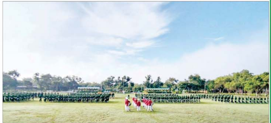
ရန်ကုန်တိုင်းဒေသကြီး ပြည်သူ့စစ်မှုထမ်းသင်တန်းဆင်းပွဲ ကျင်းပစဉ်။