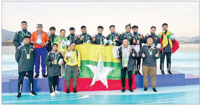
ရန်ကုန် အောက်တိုဘာ ၂၅ အပြည်ပြည်ဆိုင်ရာ ကနူးလှေလှော်အဖွဲ့ချုပ်၏ ၂၀၂၄ ခုနှစ် ကမ္ဘာ့ပလား နဂါးလှေလှော်ပြိုင်ပွဲ (2024 ICF Dragon Boat World Cup) နှင့် ကမ္ဘာ့ချန်ပီယံရှစ် နဂါးလှေလှော်ပြိုင်ပွဲ (2024 ICF Dragon Boat World Championships) ကို တရုတ်ပြည်သူ့သမ္မတနိုင်ငံ Yichang မြို့နှင့် ဖိလစ်ပိုင်သမ္မတနိုင်ငံ Puerto Princesa မြို့တို့၌ စာမျက်နှာ ၁၈ သို့ *