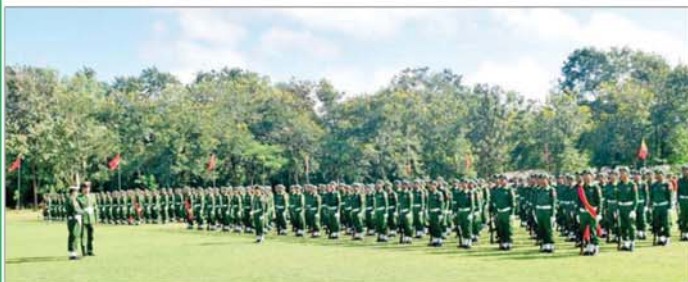
ပဲခူးတိုင်းဒေသကြီး ပြည်သူ့စစ်မှုထမ်းသင်တန်းဆင်းပွဲ ကျင်းပစဉ်။