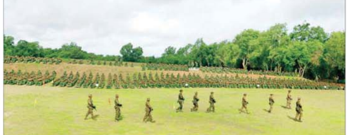
ပြည်သူ့စစ်မှုထမ်းသင်တန်းသားများ လေ့ကျင့်ရေးဆောင်ရွက်နေမှုကို တွေ့ရစဉ်။