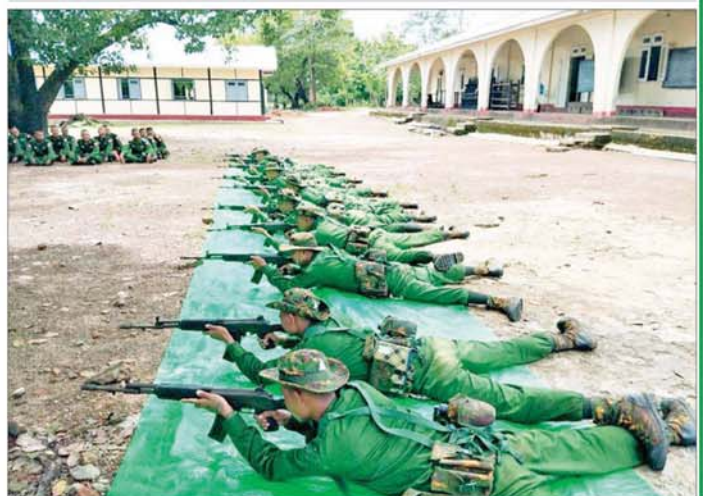
ပြည်သူ့စစ်မှုထမ်းသင်တန်းသားများ လေ့ကျင့်ရေးဆောင်ရွက်နေမှုကို တွေ့ရစဉ်။