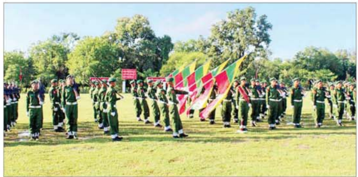
မန္တလေးတိုင်းဒေသကြီး ပြည်သူ့စစ်မှုထမ်းသင်တန်းဆင်းပွဲ ကျင်းပစဉ်။

ပြည်သူ့စစ်မှုထမ်းသင်တန်း အမှတ်စဉ်(၄)တွင် တက်ရောက်ခဲ့ရသည့် အတွေ့အကြုံများ၊ သင်တန်းမှ ရရှိခဲ့သည့် အလေ့အကျင့်ကောင်းများ၊ ယုံကြည်ချက်၊ ခံယူချက်များနှင့် သင်တန်းဆင်းပြီးနောက် မိမိတို့ တာဝန်ကျရာတပ်ရင်း၊ တပ်ဖွဲ့များ၌ ဆက်လက်တာဝန် ထမ်းဆောင်သွားမည့် အခြေအနေများနှင့်ပတ်သက်၍ သင်တန်းဆင်း နိုင်ငံ့သားကောင်းစစ်သည်များ၏ စကားသံများကိုလည်း ယခုလို ကြားသိရပါသည်။ ၁။ ဒီသင်တန်းတက်ရောက်ရတဲ့ အဓိက ရည်ရွယ်ချက်ကတော့ နိုင်ငံတော်ကိုကာကွယ်ဖို့နဲ့ နိုင်ငံတော်အလံအလှူအခါ ကျွန်တော်ဘက်က အသင့်ဖြစ်အောင်လို့ ဒီသင်တန်းကိုလာရောက် တက်တာပါ။ ကျွန်တော်က တစ်ကျောင်းလုံးရဲ့ ကိုယ်စားအနေနဲ့ စံပြုဆုကိုရရှိခဲ့တာပါ။ ဒီဆုကိုရရှိဖို့ အတော်ကို ကြိုးစားခဲ့ရပါတယ်။ သင်ခန်းစာတွေအားလုံးကို စိတ်ပါဝင်စားစွာနဲ့ လုပ်ဆောင်ခဲ့ပါတယ်။ အကျင့်စာရိတ္တကောင်းမွန်အောင် စည်းကမ်းက အစအကုန်လုံးကို တလေးတစားနဲ့လိုက်နာလုပ်ဆောင်ခဲ့ရပါတယ်။ အဓိကကတော့ ကိုယ့်ကိုယ်ကိုယ် ကာကွယ်နိုင်မယ်။ နောက်ပြီး နိုင်ငံတော်ကိုလည်း ကာကွယ်လို့ရတယ်။ ကျွန်တော်တို့သင်တန်းကာလ တွေ့ပြီးသွားတဲ့အခါ ကိုယ့်တာဝန်ကိုယ်ပြီးဆုံးတဲ့အခါ ကျွန်တော်တို့ရပ်ရွာမှ မိသားစုတွေကိုလည်း ကာကွယ် လို့ရတယ်လို့ ကျွန်တော်အနေနဲ့ယုံကြည်ပါတယ်။