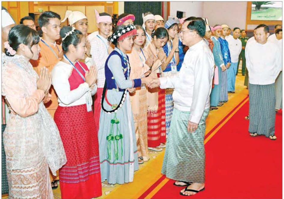
နိုင်ငံတော်စီမံအုပ်ချုပ်ရေးကောင်စီဥက္ကဋ္ဌ နိုင်ငံတော်ဝန်ကြီးချုပ် ဗိုလ်ချုပ်မှူးကြီးမင်းအောင်လှိုင် ကျောင်းသား၊ ကျောင်းသူများကို တစ်ဦးချင်း ရင်းရင်းနှီးနှီး မေးမြန်းနှုတ်ဆက်အားပေးစဉ်။

အတတ်ပညာ ပြည့်ဝရေးသည် အခြေခံလိုအပ်ချက် ဖြစ်သကဲ့သို့ အသိပညာ၊ ဗဟုသုတ၊ အတွေးအခေါ် အယူအဆ ပြည့်စုံမှုမှန်ကန်ရေးသည်လည်း မရှိမဖြစ် လိုအပ်ကြောင်း၊ ထို့ကြောင့် တစ်နိုင်ငံလုံး အတိုင်းအတာဖြင့် အတတ်ပညာ သာမက အသိပညာဗဟုသုတများ ရှာဖွေနိုင်ရန် စာကြည့်တိုက်များ ဖွံ့ဖြိုးတိုးတက်ရေးနှင့် စာဖတ်ရိုက်မြှင့်တင်ရေး လှုပ်ရှားမှုများကို အလေးထား ဆောင်ရွက်ပေးလျက် ရှိကြောင်း၊ အဆိုပါလုပ်ငန်းသည် ပညာရေးနှင့် ဆက်စပ်နေခြင်းဖြစ်သဖြင့် မောင်တို့၊ မယ်တို့ ရောက်ရာဒေသ၊ တာဝန်ကျသည့် နေရာများတွင် အောင်မြင်အောင် ပူးပေါင်း ဆောင်ရွက်ပေးကြရန် မှာကြားလိုကြောင်း။ ဦးထမ်းပဲ့ထမ်း တာဝန်ထမ်းဆောင် မျက်မှောက်ကာလ မြန်မာ့အခြေအနေ၊ ကမ္ဘာ့အခြေအနေတို့အရ မြန်မာနိုင်ငံသားတိုင်း ကိုယ့်မြေ၊ ကိုယ့်ရေ၊ ကိုယ့်လူမျိုး၊ ကိုယ့်အချုပ်အခြာ အာဏာကို ကာကွယ်ရန် အချိန်ကျရောက်လာ ပြီဖြစ်ကြောင်း၊ ပြည်သူတစ်ယောက် အနေဖြင့် နိုင်ငံတော်ကာကွယ်ရေး တာဝန်ကို ထမ်းဆောင်ခြင်းသည် နိုင်ငံတော်ကြီးတစ်ခုလုံးနှင့် နိုင်ငံ