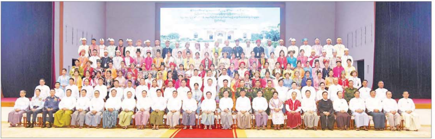
နိုင်ငံတော်စီမံအုပ်ချုပ်ရေးကောင်စီဥက္ကဋ္ဌ နိုင်ငံတော်ဝန်ကြီးချုပ် ဗိုလ်ချုပ်မှူးကြီးမင်းအောင်လှိုင်နှင့် အခမ်းအနားတက်ရောက်လာကြသူများ၊ ကျောင်းသား ကျောင်းသူများ စုပေါင်းမှတ်တမ်းတင်ဓာတ်ပုံရိုက်စဉ်။