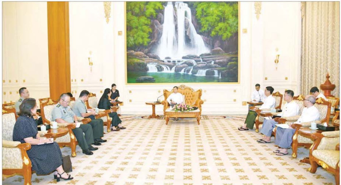
နိုင်ငံတော် စီမံအုပ်ချုပ်ရေးကောင်စီဒုတိယဥက္ကဋ္ဌ ဒုတိယဝန်ကြီးချုပ် ဒုတိယဗိုလ်ချုပ်မှူးကြီး စိုးဝင်း မြန်မာနိုင်ငံဆိုင်ရာ တရုတ်ပြည်သူ့သမ္မတနိုင်ငံ သံအမတ်ကြီး H.E. Ms. Ma Jia အား လက်ခံတွေ့ဆုံစဉ်။

နေပြည်တော် အောက်တိုဘာ ၂၅ နိုင်ငံတော် စီမံအုပ်ချုပ်ရေးကောင်စီဒုတိယဥက္ကဋ္ဌ ဒုတိယဝန်ကြီးချုပ် ဒုတိယဗိုလ်ချုပ်မှူးကြီး စိုးဝင်းသည် မြန်မာနိုင်ငံဆိုင်ရာ တရုတ်ပြည်သူ့သမ္မတနိုင်ငံ သံအမတ်ကြီး H.E. Ms. Ma Jia အား ယနေ့မွန်နန်းလွဲပိုင်းတွင် နေပြည်တော်ရှိ နိုင်ငံတော်စီမံအုပ်ချုပ်ရေးကောင်စီ ဥက္ကဋ္ဌရုံးညွှန်ခန်းမ၌ လက်ခံတွေ့ဆုံသည်။ စာမျက်နှာ ၆ သို့ *