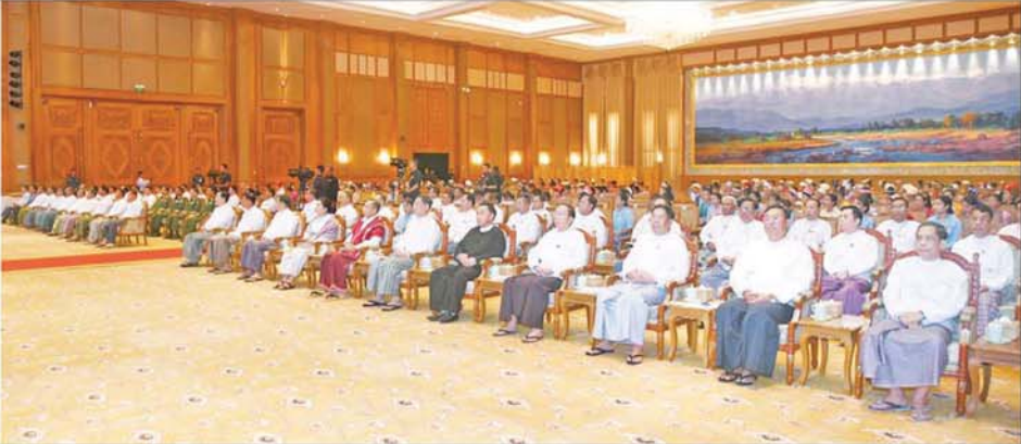
နိုင်ငံတော်စီမံအုပ်ချုပ်ရေးကောင်စီဥက္ကဋ္ဌ နိုင်ငံတော်ဝန်ကြီးချုပ် ဗိုလ်ချုပ်မှူးကြီးမင်းအောင်လှိုင် ပြည်ထောင်စုတိုင်းရင်းသားလူမျိုးများဖွံ့ဖြိုးရေးတက္ကသိုလ် ပညာရေးဘွဲ့ ငါးနှစ်သင်တန်း အမှတ်စဉ်(၆)မှ ကျောင်းသား ကျောင်းသူများကို တွေ့ဆုံအမှာစကားပြောကြားစဉ်။

၎င်းတို့အား ပြည်ထောင်စုတိုင်းရင်းသားလူမျိုးများ ဖွံ့ဖြိုးရေးသိပ္ပံကို ၁၉၉၁ ခုနှစ် မေ ၁၀ ရက်တွင် ပြည်ထောင်စုတိုင်းရင်းသားလူမျိုးများ ဖွံ့ဖြိုးရေး တက္ကသိုလ်အဖြစ် အဆင့်တိုးမြှင့်ပေးခဲ့ကြောင်း၊ ပြည်ထောင်စုတိုင်းရင်းသားလူမျိုးများဖွံ့ဖြိုးရေး တက္ကသိုလ်အနေဖြင့် လေ့ကျင့်ပြုစု ပျိုးထောင်ပေးခဲ့သည့်မှ ယခုအခါ သင်တန်းဆင်း ကျောင်းသား ကျောင်းသား ၁၄၂၈၈ ဦး မွေးထုတ်ပေးနိုင်ခဲ့ပြီးဖြစ်ကြောင်း၊ ဘက်စုံပညာရေးစနစ် တိုးတက်ဖြစ်ပေါ်ရေး ကြိုးပမ်းဆောင်ရွက် နိုင်တန်ဆိုင် ဖွံ့ဖြိုးတိုးတက်မှု၏ အခြေခံအုတ်မြစ်သည် ပညာတတ် အရင်းအမြစ်များ ပေါများခြင်းပင် ဖြစ်ကြောင်း၊ နိုင်ငံတော်အနေဖြင့် လည်း အသိပညာ၊ အတတ်ပညာ ပြည့်စုံသည့် ပညာတတ်များနှင့် သာယာဝပြောသည့် အနာဂတ် နိုင်ငံတော်ကြီးကို တည်ဆောက် ရန် ဦးတည်ဆောင်ရွက်နေပြီး အရည်အချင်းပြည့်ဝသည့် ဘက်စုံ ပညာရေးစနစ် တိုးတက်ဖြစ်ပေါ် ရေးကိုလည်း ကြိုးပမ်းဆောင်ရွက် လျက်ရှိကြောင်း။