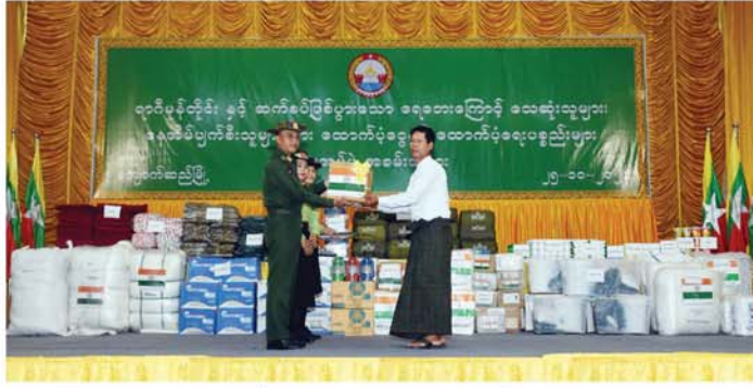
(မန္တလေးနေ့စဉ်)

အတွက် ထောက်ပံ့ငွေကျပ် ၃၄၆၅၀၀၀၀၀၊ သေဆုံးသူ တစ်ဦးလျှင် အမျိုးသားသဘာဝဘေးအန္တရာယ်စီမံခန့်ခွဲမှုကော်မတီမှ ထောက်ပံ့ငွေကျပ် ၅၀၀၀၀ နှုန်းဖြင့် သေဆုံးသူ ၁၄၀ ဦးအတွက် ထောက်ပံ့ငွေကျပ် ၇၀၀၀၀၀၀၊ စုစုပေါင်း ထောက်ပံ့ငွေကျပ် ၇၀၇၁၇၅၀၀၀၀ ထောက်ပံ့ပေးအပ်ခဲ့ပြီးဖြစ်ကြောင်း သိရသည်။