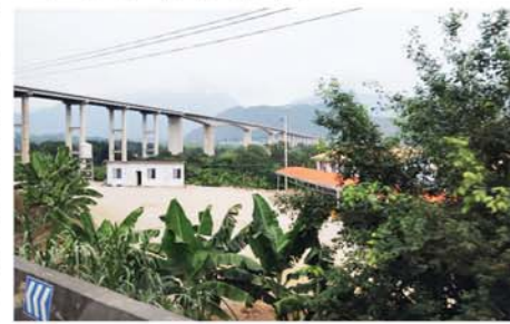
မောင်ပြည်သူ(မန္တလေး)

မန္တလေးမီဒီယာလေ့လာရေးအဖွဲ့သည် ညနေ၄နာရီတွင် လူကျန်းမြို့နယ် ရှင်းကျိုက်ကျေးရွာမှ မော်တော်ယာဉ်များဖြင့် ထွက်ခွာခဲ့ပြီး လှပသောတောတောင်ရှုခင်းများ၊ ဥမင်များ၊ တံတားကြီးများဖြတ်သန်းကာ ဒေသစံတော်ချိန် ည ၆နာရီတွင် မန်စီအပြည်ပြည်ဆိုင်ရာ လေဆိပ်သို့ရောက်ရှိပြီး ည၇နာရီ မိနစ် ၄၀ တွင် တရုတ်လေကြောင်း Ruili Air ဖြင့် ပြန်လည်ထွက်ခွာလာရာ မန္တလေးအပြည်ပြည်ဆိုင်ရာလေဆိပ်သို့ မြန်မာစံတော်ချိန် ည ၇နာရီ ၁၀မိနစ်တွင် ပြန်လည်ရောက်ရှိခဲ့သည်။