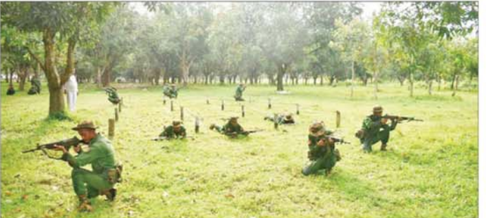
ပြည်သူ့စစ်မှုထမ်းသင်တန်းသားများ လေ့ကျင့်ရေးဆောင်ရွက်နေမှုကို တွေ့ရစဉ်။

၂။ ကျွန်တော်လာရောက်ရတဲ့ ရည်ရွယ်ချက်ကတော့ နိုင်ငံတော်ကာကွယ်ရေးဖို့နဲ့ ကျွန်တော်တို့ မိသားစုကို ကာကွယ်နိုင်ဖို့အတွက်ဝင်ရောက်ရခြင်းဖြစ်ပါတယ်။ ဒီမှာသင်ကြားခဲ့တဲ့ပညာရပ်တွေနဲ့ မိသားစုတင်မကဘဲနဲ့ ရပ်ရွာအေးချမ်းသာယာရေးအတွက်ကော၊ ပြည်သူ့လူထုအတွက်ကော၊ နိုင်ငံတော်အတွက်ပါ ကာကွယ်သွားဖို့ အစီအစဉ်ရှိပါတယ်။ သင်တန်းကရတဲ့ အကျိုးကျေးဇူးတွေကတော့ အများနဲ့ ဆောင်ရွက်တတ်တာတွေ၊ ပြီးတော့ ကိုယ်ချင်းစာနာတတ်မှုတွေ ဒီရောက်မှပိုပြီး သိလာတယ်။ နောက်ပြီး တပ်မတော်သားတွေရဲ့ အနေအထိုင်ပြုမူရင့်ကြဲတာတွေ နားလည်လာတယ်။