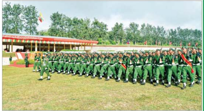
ရမ်းပြည်နယ် ပြည်သူ့စစ်မှုထမ်းသင်တန်းဆင်းပွဲ ကျင်းပစဉ်။