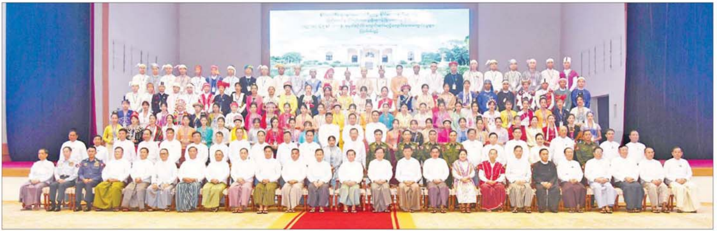
နိုင်ငံတော်စီမံအုပ်ချုပ်ရေးကောင်စီဥက္ကဋ္ဌ နိုင်ငံတော်ဝန်ကြီးချုပ် ဗိုလ်ချုပ်မှူးကြီးမင်းအောင်လှိုင်နှင့် အခမ်းအနားတက်ရောက်လာကြသူများ၊ ကျောင်းသား၊ ကျောင်းသူများ စုပေါင်းမှတ်တမ်းတင်ဓာတ်ပုံရိုက်စဉ်။

» စာမျက်နှာ ၃ မှ လူသားများ၏ဘဝသည် အသိပညာ၊ အတတ်ပညာ ပြည့်စုံမှု ရှိမရှိ အပေါ်တွင် မူတည်ပြီး ကွာခြားမှုများ၊ ပြောင်းလဲမှုများ ရှိနေခြင်းပင်ဖြစ်ကြောင်း၊ ငယ်စဉ်ကတည်းက ပညာကို တစိုက်မတ်မတ်ဖြင့် ဆုံးခန်းတိုင်အောင် သင်ယူနိုင်ကြပါက ဘဝအတွက် ပိုမို အကျိုးရှိမည်ဖြစ်ကြောင်း၊ ပညာ တစ်စိတ်တစ်ပိုင်းဖြင့် ကျောင်းထွက်ကြရပြီး အကြောင်းအမျိုးမျိုးကြောင့် ပညာကိုဆုံးခန်းတိုင် မသင်နိုင်ကြပါက ပညာပြည့်ဝသင့်သလောက် မပြည့်ဝနိုင်ဘဲ ဘဝတွင် လိုအပ်ချက်များ ရှိနေကြမည်ပင်ဖြစ်ကြောင်း၊ မူလတန်း၊ အလယ်တန်း၊ အထက်တန်း၊ အဆင့်မြင့် အစရှိသည့် ပညာကိုသင်ယူပါက သင်ယူနိုင်သလောက် ဘဝတွင်လိုအပ်ချက်များ ပြည့်စုံနိုင်သည်ကို မိမိကိုယ်တွေ့နှင့် နှိုင်းယှဉ်ပြီး မိမိတို့တပည့်များအား ပညာကို သင်ယူနိုင်သလောက်သင်ယူကြရန်၊ အတတ်ပညာရှင်အသိပညာရှင်၊ ကျွမ်းကျင်သူ၊ ပါရဂူများဖြစ်သည့် အထိ ကြိုးစားသွားကြရန်၊ တိုက်တွန်းလေ့ကျင့်ပေးကြရန် မှာကြားလိုကြောင်း။