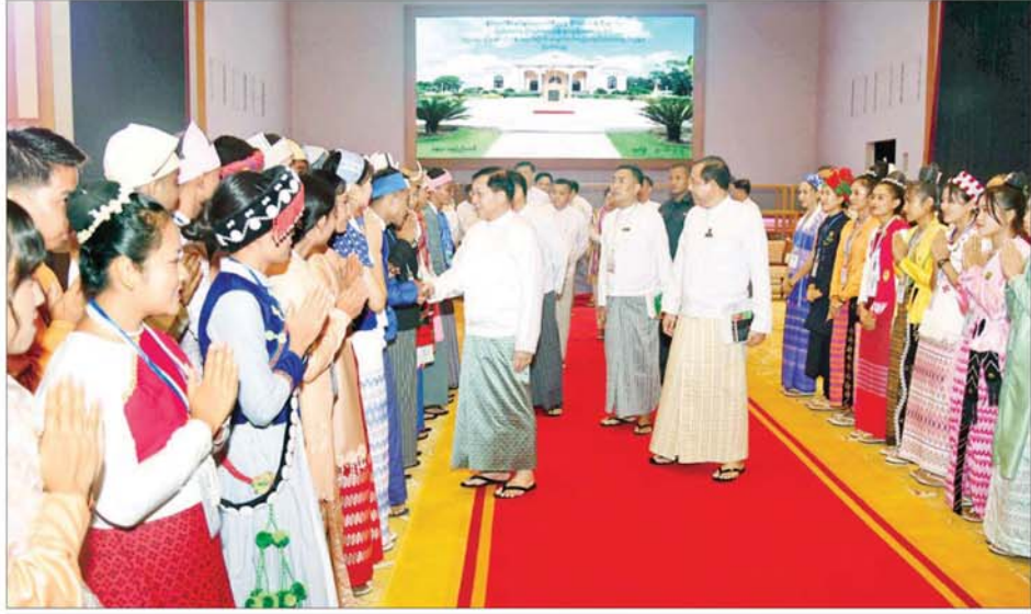
နိုင်ငံတော်စီမံအုပ်ချုပ်ရေးကောင်စီဥက္ကဋ္ဌ နိုင်ငံတော်ဝန်ကြီးချုပ် ဗိုလ်ချုပ်မှူးကြီးမင်းအောင်လှိုင် ကျောင်းသား ကျောင်းသူများကို တစ်ဦးချင်း ရင်းရင်းနှီးနှီး မေးမြန်းနှုတ်ဆက်အားပေးစဉ်။

အတွက် ဆရာ ဆရာမများ၏ သင်ကြားပြသမှု၊ သွန်သင်ဆုံးမမှု ကောင်းမွန်ခြင်း အပေါ်တွင် မူတည်နေကြောင်း၊ ကျောင်းသား ကျောင်းသူများ၏ စိတ်ဓာတ်၊ စည်းကမ်း၊ ပညာကို မှန်ကန်အောင် တည့်မတ်ပေးရေးသည် ဆရာ ဆရာမများ၏ တာဝန်ပင် ဖြစ်ကြောင်း၊ ထို့ပြင် တာဝန်ကျရာ ဒေသအသီးသီးက စာသင်ကျောင်း များတွင် ကျောင်းနေအရွယ် ကလေးတိုင်း ကျောင်းနေရာခိုင်နှုန်း မြင့်မားရေး၊ ကျောင်းသား ကျောင်းသူများကို အတန်းပညာ တတ်မြောက်စေရေး၊ တန်းစဉ်ကူး ပြောင်းနှုန်း မြင့်မားစေရေးသာမက ဉာဏ်ပညာနှင့် တည်ဆောက်ထား သည့် လူ့ဘောင်အသိုင်းအဝိုင်း ဖြစ်ပေါ်လာစေရေး အလေးထား ကြိုးပမ်းဆောင်ရွက်သွားကြရန် မှာကြားလိုကြောင်း။