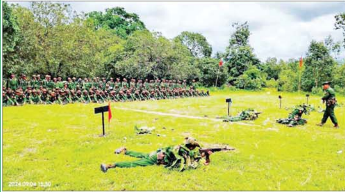
ပြည်သူ့စစ်မှုထမ်းသင်တန်းသားများ လေ့ကျင့်ရေးဆောင်ရွက်နေမှုကို တွေ့ရစဉ်။