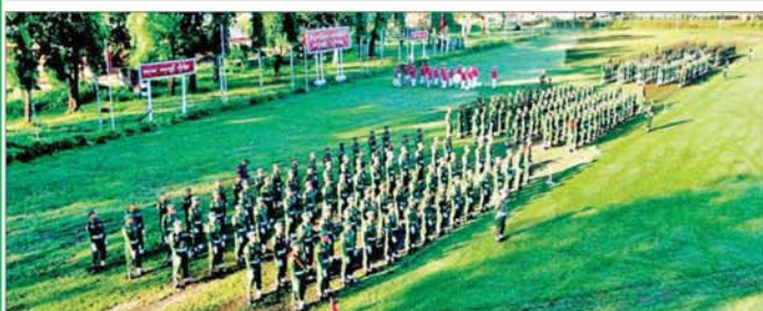
ရန်ကုန်တိုင်းဒေသကြီး ပြည်သူ့စစ်မှုထမ်းသင်တန်းဆင်းပွဲ ကျင်းပစဉ်။