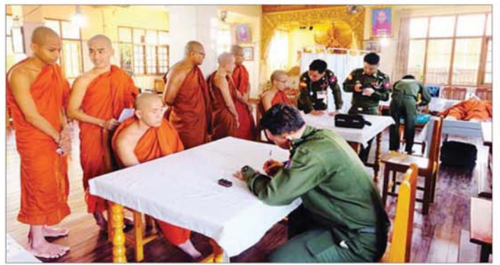
နိုင်ရေး စီစဉ်ဆောင်ရွက်ပေးသည်။ ကြည့်ရှုစစ်ဆေးပြီး လိုအပ်သည်များ ညှိနှိုင်း ယင်းသို့ဆောင်ရွက်နေမှုများကို သက်ဆိုင်ရာ ဆောင်ရွက်ပေးခဲ့ကြောင်း သတင်းရရှိသည်။ တိုင်းစစ်ဌာနချုပ်မှ တာဝန်ရှိသူများက သွားရောက် သတင်းစဉ်

သာစံမြို့နယ် အနှိပ်တော်ရပ်ကွက် ကထိန်တော် ကျောင်းတိုက်ရှိ သံဃာတော်များနှင့် ဒေသခံပြည်သူ များအား အလယ်ပိုင်းတိုင်းစစ်ဌာနချုပ် နယ်မြေခံ ဆေးကုသရေးအဖွဲ့က အဆိုပါကျောင်းတိုက်ရှိ ဓမ္မာရုံ၌ ကျန်းမာရေးစောင့်ရှောက်မှုလုပ်ငန်းများ ဆောင်ရွက်ပေးသည်။ ထိုသို့ဆောင်ရွက်ပေးရာတွင် ဆေးကုသရေး အဖွဲ့က သံဃာတော် ၁၀၉ ပါးနှင့် ဒေသခံပြည်သူ ၂၂ ဦးတို့အား သွေးတိုးရောဂါ၊ အဆစ်အမျက်ရောင် ရောဂါ၊ ဆီးချိုရောဂါ၊ အသက်ရှူလမ်းကြောင်းဆိုင်ရာ ရောဂါ၊ မျက်စိရောဂါ၊ သွားနှင့်ခံတွင်းရောဂါ၊ ခွဲစိတ် ကုသမှုဆိုင်ရာရောဂါ၊ အထွေထွေရောဂါတို့နှင့် ပတ်သက်၍ လိုအပ်သည့်ကျန်းမာရေးစစ်ဆေး ကုသ ပေးခြင်းများ ဆောင်ရွက်ပေးပြီး ကျန်းမာရေးဆိုင်ရာ အသိပညာပေးခြင်းများ လောပေါ်ပွားစေရန်ကုသ ဆေးရုံတက်ရောက်ရန်လိုအပ်သည့် လူနာများအား နယ်မြေခံတပ်မတော်ဆေးရုံသို့ တက်ရောက်ကုသ