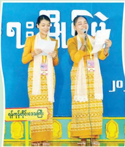
ရန်ကုန်တိုင်းဒေသကြီး အရေးပြိုင်ပွဲ အခြေခံပညာအဆင့်(အသက် ၁၅ နှစ်မှ ၂၀ နှစ် အတွင်း)၌ ပထမဆုရရှိသည့် ရန်ကုန်တိုင်းဒေသကြီးမှ အိမ်ခြံမြေနှင့်ပိုင်ရှင် "လူငယ်အားမာန် အမြဲရှင်သန် နိုင်ငံပြည်ကျိုးဆောင်သယ်ပိုး" ခေါင်းစဉ်ဖြင့် ယှဉ်ပြိုင်မှုကို တွေ့ရစဉ်။