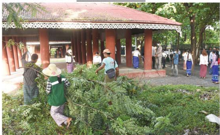
သတင်း-စာမျက်နှာ ၂၄