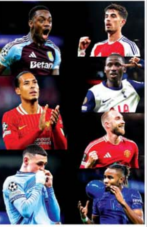
နိုင်ငံပေ