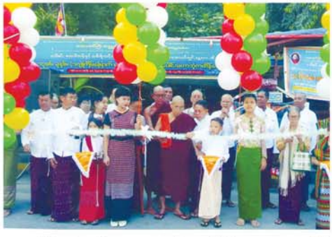
အခဲအဖြစ် တင်းတင်းမာမာ ဖုံးလွှမ်းအောင်မြင်နေတဲ့ ကာလဖြစ်ခြင်းကြောင့် 'ဖုန်းတုန်း၊ လုံးတုန်း တန်ဆောင်မုန်း' လို့ ဆိုရိုးပြုကြပါတယ်။

ကထိန်ခင်းကျင်း သင်္ကန်းလှူဒါန်းခြင်းကို ဗုဒ္ဓမြတ်စွာဘုရား သက်တော်ထင်ရှားရှိစဉ်ကပင် ခွင့်ပြုတော်မူခဲ့ပါတယ်။ သာဝတ္ထိပြည်ကောသလမင်းကြီးရဲ့ အဖတူအမိကျွန်ကြတဲ့ ဘဒ္ဒဂင်္ဂညီနောင် မင်းသား သုံးကျိပ်တို့ဟာ ငယ်ရွယ်သူ မင်းညီမင်းသားများဖြစ်သည့် အားလျော်စွာ တစ်နေ့သောအခါမှာ ဇနီးမယားကိုယ်စီနဲ့ အပျော်အပါး ထွက်ခဲ့ကြပါတယ်။ မင်းသား သုံးကျိပ်ထဲမှာ လူပျိုကြီး မင်းသားတစ်ယောက်ကတော့ ဇနီးမယားမရှိတဲ့အတွက် ပြည့်တန်ဆာမတစ်ယောက်ကို အငှားမယားအဖြစ်ခေါ်ခဲ့ပါတယ်။