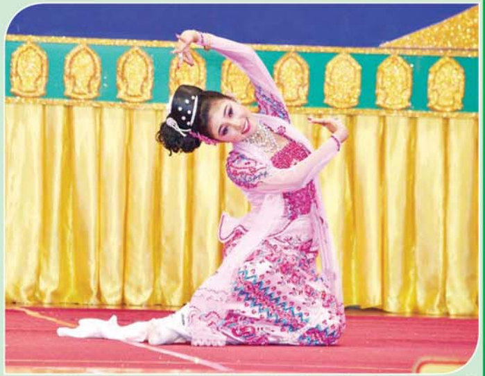
အကပြိုင်ပွဲအခြေခံပညာအဆင့် (အမျိုးသမီး အသက် ၁၀ နှစ်မှ ၁၅ နှစ်အတွင်း)၌ ပထမဆုရရှိသည့် မန္တလေးတိုင်းဒေသကြီးမှ မြေလင်းဖြူ ခေါင်း၊ ခါး၊ မြေ၊ လက် အချိုးအဆစ်ညီညာစွာဖြင့် ကပြယှဉ်ပြိုင်ဟန်။