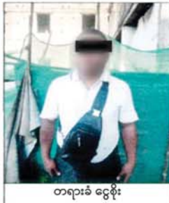
တရားခံ ငွေစိုး