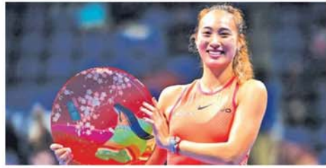
တိုကျို အောက်တိုဘာ ၂၀ ရက်နေ့တွင် တိုကျိုမြို့တွင် ကျင်းပပြုလုပ်လျက်ရှိသော အမျိုး

ဆုကို တရုတ်တင်းနစ်မယ် Zheng Qinwen က ထိုက်ထိုက်တန်တန် ဆွတ်ခူးခဲ့သည်။ အဆိုပါ တရုတ်တင်းနစ်မယ် Zheng Qinwen သည် 2024 Toray Pan Pacific Open တင်းနစ်ပြိုင်ပွဲ ဗိုလ်လွှဲပွဲ အဆင့်တွင် ရုရှားတင်းနစ်မယ် Sofia Kenin အား ၆-၅၊ ၆-၃ ဖြင့် အနိုင်ရရှိကာ ချန်ပီယံအဖြစ် ဆွတ်ခူးခဲ့ခြင်းဖြစ်သည်။ (အပေါ်ပုံ)