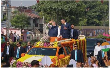
ဒေါ်အောင်ဆန်းစုကြည်အား နာရင်ဒရာမိုဒိက ဖိတ်ခေါ်ခဲ့ပြီး နာရင်ဒရာမိုဒိက နေပြည်တော်သို့ ရောက်ရှိလာရာ ဖြစ်ကြောင်း သိရသည်။

ဘီဘီစီသတင်းဌာနက ဖော်ပြသည်။ ၁၈ နှစ်ကာလအတွင်း အိန္ဒိယနိုင်ငံသို့ ပထမဆုံး အလည်အပတ်ရောက်ရှိလာသော စပိန်ဝန်ကြီးချုပ်ဖြစ်သဖြင့် ဂူရာဂရတ်ပြည်နယ် ဗာဒိုဒါရာမြို့မှ ဒေသခံများက လမ်းဘေးမှ စောင့်ဆိုင်းပြီး ကြိုဆိုနှုတ်ဆက်ခဲ့ကြသည်။ အဆိုပါဝန်ကြီးချုပ်နှစ်ဦးသည် ထိုမြို့တွင် မကြာသေးမီက ဆောက်လုပ်ပြီးစီးသွားသော အိန္ဒိယနိုင်ငံ စပိန်စက်စစ်လေယာဉ်ထုတ်လုပ်ရေးစက်ရုံသို့ သွားရောက်ကာ ဖွင့်လှစ်ပေးခဲ့သည်။ ယင်းစစ်လေယာဉ်စက်ရုံကို တာတာအဆင့်မြင့်စနစ်များကုမ္ပဏီနှင့် အဘတ်စ်ကုမ္ပဏီတို့ ဖက်စပ်ရင်းနှီးမြုပ်နှံကာ စစ်လေယာဉ်များ ထုတ်လုပ်သွားမည်ဟု ဆိုသည်။ လာမည့် ၂၀၂၆ ခုနှစ်တွင် ထိုစက်ရုံမှ အိန္ဒိယနိုင်ငံလုပ် စီ ၂၉၅ လေယာဉ်များ ထွက်ရှိလာမည်ဖြစ်ကြောင်း သိရသည်။ Mon 0-0-0-0-0