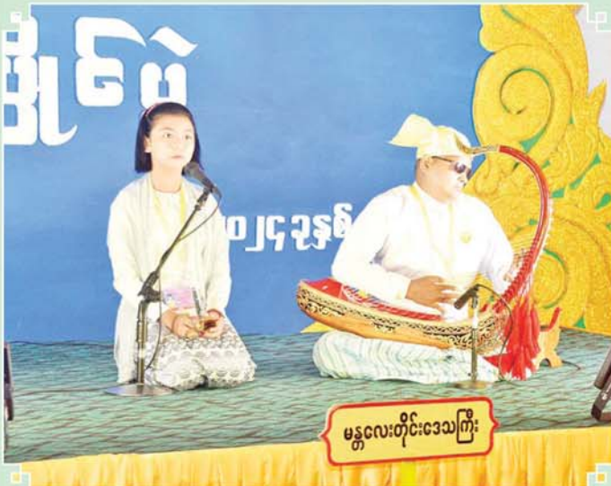
မန္တလေးတိုင်းဒေသကြီး