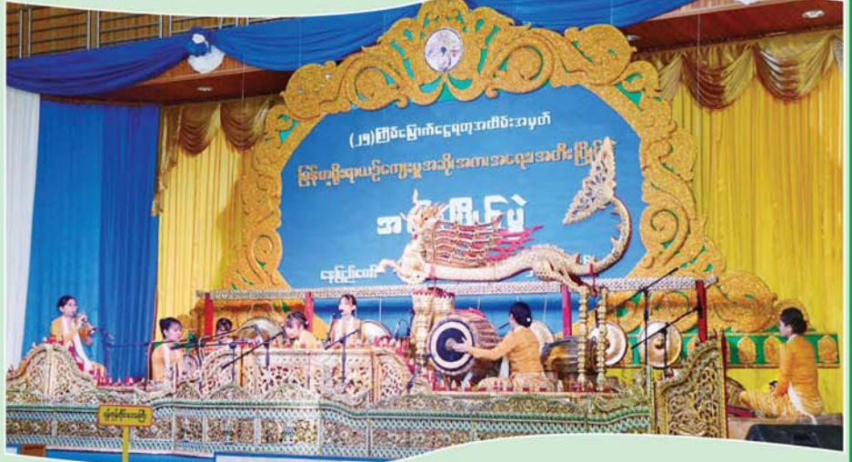
ဆိုင်းအဖွဲ့လိုက်အတီးပွဲဖြင့်ပွဲ အဆင့်မြင့်ပညာအဆင့် (အမျိုးသမီး) ၌ ပထမဆုရရှိသည့် ရန်ကုန်တိုင်းဒေသကြီးမှ မယမင်းသူနှင့်အဖွဲ့ တီးခတ်ယှဉ်ပြိုင်မှုကို တွေ့ရစဉ်။