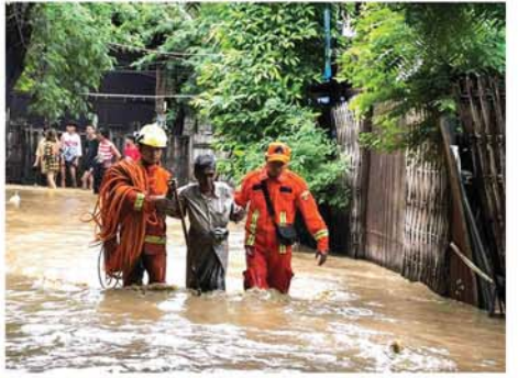
ပြောင်းပြာချောင်းရေမြင့်တက် ရေဘေးလွတ်ရာသို့ ရွှေ့ပြောင်း အုတ်တံတိုင်းပြိုကျမှု ဖြစ်ပွား

မြင်းခြံ အောက်တိုဘာ ၂၀ မန္တလေးတိုင်းဒေသကြီး၊ မြင်းခြံမြို့နယ်တွင် မိုးများအဆက်မပြတ် ရွာသွန်းမှုကြောင့် အောက်တိုဘာ ၂၅ ရက် နံနက် ၇ နာရီ ၅၅ မိနစ်ခန့်က ပြောင်းပြာချောင်းရေမြင့်တက်မှုဖြစ်ပွားပြီး မြင်းခြံမြို့ အမှတ်(၂)ရပ်ကွက်၊ အမှတ်(၃)ရပ်ကွက်၊ အမှတ်(၄)ရပ်ကွက်နှင့် အမှတ်(၅)ရပ်ကွက်တို့တွင် ရေများ ဝင်ရောက်မှုဖြစ်ပွားကြောင်း သတင်းရရှိသဖြင့် မြင်းခြံခရိုင် မီးသတ်အဖွဲ့သားတစ်ဦး သေဆုံးပြီး အမျိုးသားတစ်ဦး ထိခိုက်ဒဏ်ရာမရှိရုံတင်အား လူမှုကူညီရေးအသင်းယာဉ်ဖြင့် မြင်းခြံခရိုင်ဆေးရုံသို့ ပို့ဆောင်ပေးခဲ့သည်။ (အပေါ်ပုံ) (၀၄၅)