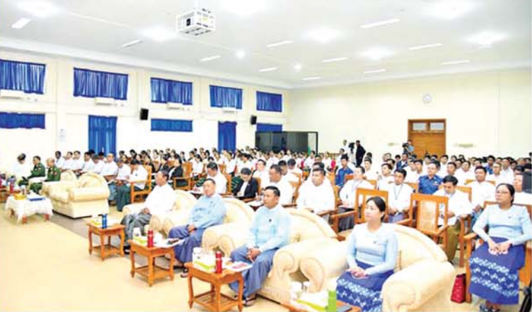
နိုင်ငံတော်စီမံအုပ်ချုပ်ရေးကောင်စီအဖွဲ့ဝင်၊ ဒုတိယဝန်ကြီးချုပ်နှင့် ကာကွယ်ရေးဝန်ကြီးဌာန ပြည်ထောင်စုဝန်ကြီး ဗိုလ်ချုပ်ကြီးတင်အောင်စန်း၊ ကာကွယ်ရေးဝန်ကြီးဌာနနှင့် အဂတိလိုက်စားမှုတိုက်ဖျက်ရေးကော်မရှင်တို့ ပူးပေါင်း၍ အဂတိလိုက်စားမှုတားဆီးကာကွယ်ရေးဆိုင်ရာ အသိပညာပေးရှင်းလင်းဆွေးနွေးပွဲတွင် အမှာစကားပြောကြားစဉ်။

ဆွေးနွေးပွဲသို့ နိုင်ငံတော်စီမံအုပ်ချုပ်ရေးကောင်စီအဖွဲ့ဝင်၊ ဒုတိယဝန်ကြီးချုပ်နှင့် ကာကွယ်ရေးဝန်ကြီးဌာန ပြည်ထောင်စုဝန်ကြီး ဗိုလ်ချုပ်ကြီးတင်အောင်စန်း၊ အဂတိလိုက်စားမှုတိုက်ဖျက်ရေးကော်မရှင် ဥက္ကဋ္ဌ ဦးစစ်အေးနှင့် တာဝန်ရှိသူများ၊ ဒုတိယဝန်ကြီးနှင့် ဌာနဆိုင်ရာ အကြီးအကဲများ၊ အရာထမ်း၊ အမှုထမ်းများ တက်ရောက်ကြသည်။ ဒုတိယဝန်ကြီးချုပ်နှင့် ကာကွယ်ရေးဝန်ကြီးဌာန ပြည်ထောင်စုဝန်ကြီးက မိမိတို့နိုင်ငံတွင် အဂတိလိုက်စားမှုတိုက်ဖျက်ရေး မဟာဗျူဟာစီမံချက်(၂၀၂၂-၂၀၂၅)ကို ရေးဆွဲချမှတ်ပြီး အကောင်အထည်ဖော်ဆောင်ရွက်လျက်ရှိကြောင်း၊ မဟာဗျူဟာစီမံချက်တွင် တားဆီးကာကွယ်ခြင်း၊ အသိပညာပေးခြင်းနှင့် စုံစမ်းစစ်ဆေးရေးယူခြင်းလုပ်ငန်းစဉ်များ ပါဝင်ပါကြောင်း၊ နိုင်ငံတော်စီမံအုပ်ချုပ်ရေးကောင်စီဥက္ကဋ္ဌ နိုင်ငံတော်ဝန်ကြီးချုပ်က ၂၀၂၂ ခုနှစ် အပြည်ပြည်ဆိုင်ရာ အဂတိလိုက်စားမှုတိုက်ဖျက်ရေးအစီအစဉ် အစည်းအဝေးအတွင်း နိုင်ငံတော်ဖွံ့ဖြိုးတိုးတက်မှုနှင့် တည်ငြိမ်အေးချမ်းမှုကို စာမျက်နှာ ၁၃ သို့ □