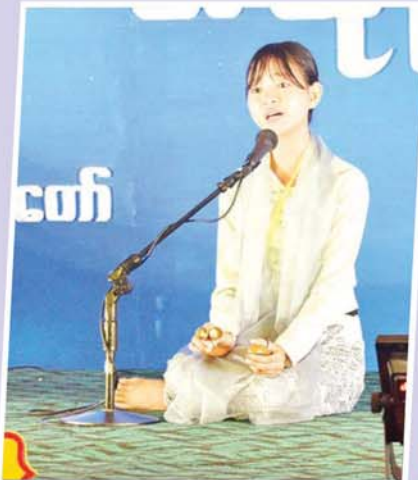
မဟာဂီတအဆိုပြိုင်ပွဲ အခြေခံပညာအဆင့် (အမျိုးသမီး အသက် ၁၀ နှစ်မှ ၁၅ နှစ်အတွင်း)၌ ပထမဆုရရှိသည့် မန္တလေးတိုင်းဒေသကြီးမှ မသော်တာရတီတိုး "မြိုင်ပေမာ" (ယိုးဒယား)သီချင်းဖြင့် သီဆိုယှဉ်ပြိုင်စဉ်။