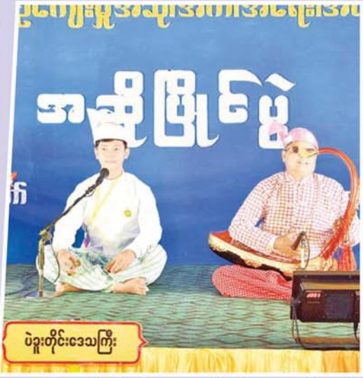
ပဲခူးတိုင်းဒေသကြီး