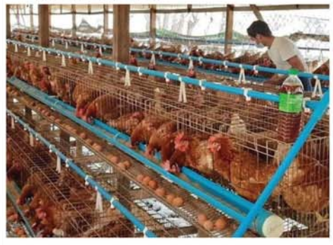
သစ်တောသစ်ပင် ချစ်ခင်တဲ့လူမျိုး၊ သစ်ပင်ကိုနှစ်စဉ်စိုက်ရွှေတိုက်ကိုစိုး။

ဇန်နဝါရီလလောက်တုန်းက ကြက်သားတစ်ပိဿာကို ငွေကျပ် ၁၃၀၀၀ နှင့် ဗမာကြက်သားက တစ်ပိဿာကို ငွေကျပ် ၂၀၀၀၀ သာ ပေါက်ဈေးရှိခဲ့ရာ ၉ လအတွင်း ကြက်သားတစ်ပိဿာလျှင် ငွေကျပ် ၁၀၀၀၀ခန့် ဈေးမြင့်တက်လာခြင်းဖြစ်ကြောင်း သိရသည်။ (အောက်ပုံ) (မန္တလေးနေ့စဉ်-၆) ၀-၀-၀-၀-၀-၀