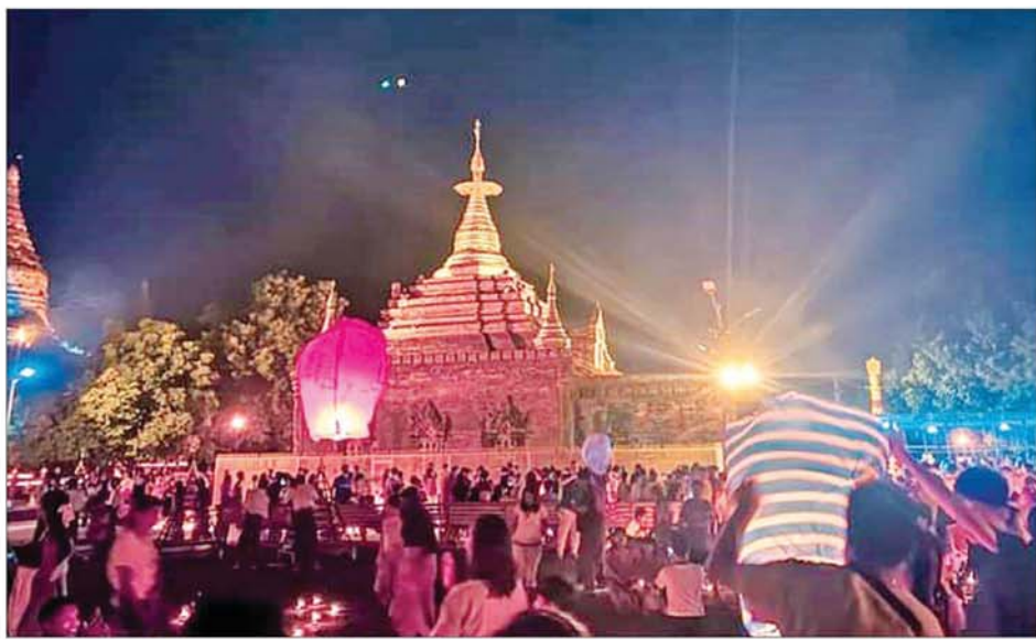
ပုဂံယဉ်ကျေးမှုနယ်မြေရှိ အလိုတော်ပြည့်ဘုရားတွင် သီတင်းကျွတ်ကာလ၌ ဘုရားဖူးလာပြည်သူများဖြင့် စည်ကားလျက်ရှိသည်ကို တွေ့ရစဉ်။

ခရီးသွားအကျင့်စီမံမှုများသည် ပုဂံခရီးစဉ်အတွက် ပြည်ပခရီးသွားများအား ဝန်ဆောင်မှုပေးရာတွင် ပုဂံပုဂံတောင်နှင့် ပုဂံပုဂံတောင်အမျိုးသားဘုမိဉ္ဇယုဂျီတို့ကိုပါ တစ်ဆက်တည်းဝင်ရောက်လည်ပတ်သော ခရီးစဉ်ဒေသများအဖြစ် ဝန်ဆောင်မှုပေးလျက်ရှိကြောင်း