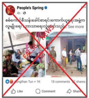
လူမှုရေး၊ စီးပွားရေး၊ ပညာရေး၊ ကျန်းမာရေး၊ လုံခြုံရေး စသည့်လိုအပ်သည့် လုပ်ငန်းများကို ပြည့်ဆည်း ဆောင်ရွက်ပေးနိုင်မည်ဖြစ်ရာ သန်းခေါင်စာရင်းသည် နိုင်ငံတော်၏ စီမံကိန်း များအောင်မြင်စေရန် အထောက်အပံ့ဖြစ်စေ

နေပြည်တော် အောက်တိုဘာ ၃ နိုင်ငံတော် စီမံအုပ်ချုပ်ရေးကောင်စီ၏ ဝန်ထမ်းများက သန်းခေါင်စာရင်းကောက် စဉ် လူမျိုးရေး၊ ဘာသာရေးလှုံ့ဆော်သည့် စကားများပြောကြောင်း တရားမဝင် ပြည်ဖျက် မိဒီယာများက သတင်းအမှားများ မဟုတ်မမှန် ရေးသားဖြန့်ဝေလျက်ရှိကြောင်း တွေ့ရှိရ သည်။ ရေးသားဖြန့်ဝေနေ ပြည်ဖျက်မိဒီယာများသည် နိုင်ငံတော် အစိုးရကို ပြည်သူလူထုက အထင်အမြင်လွှဲမှား စေရန် ရည်ရွယ်ချက်ရှိရှိ ရေးသားဖြန့်ဝေနေ ခြင်းသာဖြစ်ကြောင်း၊ လူဦးရေစာရင်းနှင့် ဆက်စပ်သည့်အကြောင်းအရာအချက်အလက် များကို တိကျမှန်ကန်စွာ ကောက်ယူပြုစုရ ခြင်းဖြစ်ကြောင်း၊ ရရှိလာမည့် စာရင်းများကို အခြေခံ၍ နိုင်ငံတော်နှင့် ပြည်သူများအတွက်