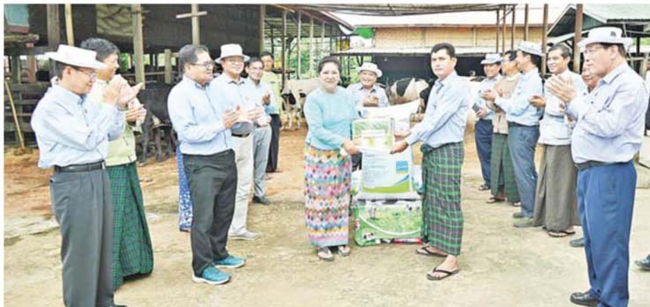
နိုင်ငံတော်စီမံအုပ်ချုပ်ရေးကောင်စီအဖွဲ့ဝင် ဒေါ်ဒွဲဘူ နိုင်ငံစီးပွားမြှင့်တင်ရေးရန်ပုံငွေမှ ချေးငွေဖြင့် ဆောင်ရွက်လျက်ရှိသည့် နွားမွေးမြူရေးလုပ်ငန်းရှင်အား မွေးမြူရေးအထောက်အကူပြုဆေးဝါးများ၊ ခြံဖုန်းပိုးသတ်ဆေးဘူးများနှင့် ရောစပ်အစာအုတ်များ ထောက်ပံ့ပေးအပ်စဉ်။

မြစ်ကြီးနား အောက်တိုဘာ ၃ နိုင်ငံတော်စီမံ အုပ်ချုပ်ရေးကောင်စီအဖွဲ့ဝင် ဒေါ်ဒွဲဘူသည် ကချင်ပြည်နယ် ဝန်ကြီးချုပ် ဦးခက်ထိုက်နိန့်၊ တာဝန်ရှိသူများနှင့်အတူ ယနေ့နံနက်ပိုင်းတွင် မြစ်ကြီးနားမြို့နယ် ငါးအိုးခေတ်မိတ်ပြကျေးရွာအတွင်း နိုင်ငံစီးပွားမြှင့်တင်ရေးရန်ပုံငွေမှ ရင်းနှီးမတည်ငွေကျပ် ၁၀ သန်းဖြင့် ပေါင်းစည်းလယ်ယာ (Integrated Farm) စနစ် အကောင်အထည်ဖော် ဆောင်ရွက်လျက်ရှိသည့် တောင်သူ ဦးဆင်ဝါးနေ့၏ ခြံသို့ သွားရောက် ကြည့်ရှုစစ်ဆေးသည်။