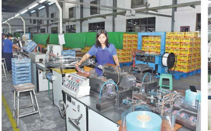
သတင်း-စာမျက်နှာ ၄