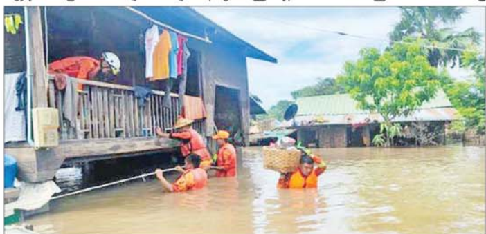
ကူညီကယ်ဆယ်ရေးအဖွဲ့များက ဒေသခံပြည်သူများအား ရေဘေးလွတ်ရာသို့ ကူညီရွှေ့ပြောင်းပေးစဉ်။

နေထိုင်ကြသူများအနေဖြင့် ရေကြီးရေလျှံမှုများကို ကြိုတင်သတိပြုရှောင်ရှားနိုင်ပါရန်နှင့် ပြည်တွင်းရေကြောင်းသွားလာရေးနှင့် လေကြောင်းပျံသန်းရေးအနေဖြင့်လည်း ကြိုတင်သတိပြုနိုင်ပါရန် မိုးလေဝသနှင့် စလဖေဒဏ္ဍန်ကြားမှုဦးစီးဌာနမှ သတိပေးနှိုးဆော်ထားပြီး ပြည်သူများအနေဖြင့် မိုးလေဝသသတင်းများကို စဉ်ဆက်မပြတ် လေ့လာဖတ်ရှု၍ သတိပြုနေထိုင်ကြပါရန် အသိပေးထားသည်။ သတင်းစဉ်