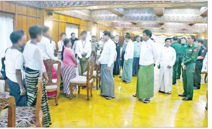
ပြီးဖြစ်ရာ ပြစ်မှုကျူးလွန်ခြင်းမရှိသော PDF အဖွဲ့ ဝင်များက တိုင်းဒေသကြီးနှင့် ပြည်နယ်အသီးသီး၌ ဥပဒေဘောင်အတွင်း ပြန်လည်ဝင်ရောက်လျက်ရှိကြ သဖြင့် သက်ဆိုင်ရာ တာဝန်ရှိသူများက ၎င်းတို့၏ မိဘအုပ်ထိန်းသူများထံသို့ လွှဲပြောင်းအပ်နှံပေးလျက် ရှိကြောင်း သိရသည်။ သတင်းစဉ်

အုပ်ထိန်းသူများထံသို့ လွှဲပြောင်းအပ်နှံကာ ထောက်ပံ့ပစ္စည်းများ ပေးအပ်သည်။ ယင်းနောက် ဥပဒေဘောင်အတွင်း ပြန်လည်ဝင်ရောက်ခဲ့သည့် ပြစ်မှုကျူးလွန်ခြင်းမရှိသော PDF သင်တန်းဆင်း လူငယ်များ၏ မိသားစုဝင်များကိုယ်စား အုပ်ထိန်းသူ တစ်ဦးက ကျေးဇူးတင်စကား ပြန်လည်ပြောကြားသည်။ ယင်းနောက် တိုင်းဒေသကြီး ဝန်ကြီးချုပ်၊ တိုင်းမှူးနှင့် တာဝန်ရှိသူများက ဥပဒေဘောင်အတွင်း ပြန်လည်ဝင်ရောက်လာသူများနှင့် မိသားစုဝင်များ အား ရင်းရင်းနှီးနှီး တွေ့ဆုံနှုတ်ဆက်ခဲ့ပြီး စားသောက် ဖွယ်ရာများဖြင့် ဧည့်ခံခဲ့ကြသည်။ PDF အပါအဝင် အဖွဲ့အစည်းအမျိုးမျိုးတို့ အနေဖြင့် နိုင်ငံတော်၏ ရှေ့လုပ်ငန်းစဉ်များတွင် ပါဝင်ပူးပေါင်းဆောင်ရွက်နိုင်ရေး သတ်မှတ် စည်းကမ်းချက်များနှင့်အညီ ဥပဒေဘောင်အတွင်းသို့ လက်နက်အပ်နှံပြီး ပြည်သူ့ဘဝသို့ ပြန်လည် ဝင်ရောက်ခြင်းပြုမည်ဆိုပါက ကြိုဆိုလက်ခံသွား မည်ဖြစ်ကြောင်း နိုင်ငံတော်အစိုးရက ထုတ်ပြန်ထား