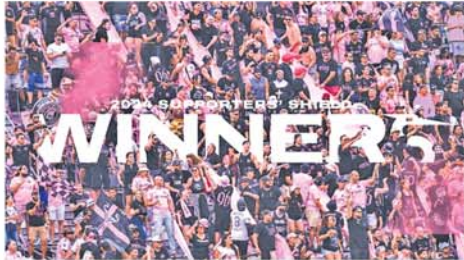
၂၀၂၄ ဘောလုံးရာသီ မေဂျာ ပါဝင်ကစားနေသည့် အင်တာမိုင် လိဂ်ဖြင့်ပွဲအတွက် Supporters' လာမီအသင်းက ထိုက်ထိုက်တန် တန် ချန်ပီယံဆုကို မက်ဆီ

အင်တာမိုင် ယာမီအသင်း သည် မေဂျာလိဂ်ဖြင့်ပွဲတွင် ဖြိုင် ပွဲစုံ ၃၂ ပွဲကစားပြီး ရမှတ် ၆၈ မှတ် ရရှိကာ ဖြိုင်ပွဲပြီးဆုံးရန် လက်ကုန် နှစ်ပွဲအလှူပာဝင် Sup porters' Shield ချန်ပီယံဆု အား ဆွတ်ခူးခဲ့ခြင်းဖြစ်သည်။ အင်တာမိုင် ယာမီအသင်း သည် ကလပ်အသင်းသမိုင်း တစ်လျှောက်တွင် Supporters' Shield ချန်ပီယံဆုကို ပထမဆုံး