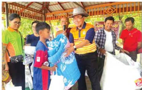
သာစည်မြို့နယ် ရေဘေးသင့်အိမ်ထောင်စုများအား စားသောက်ကုန်နှင့်အသုံးအဆောင်ပစ္စည်းများ ထောက်ပံ့