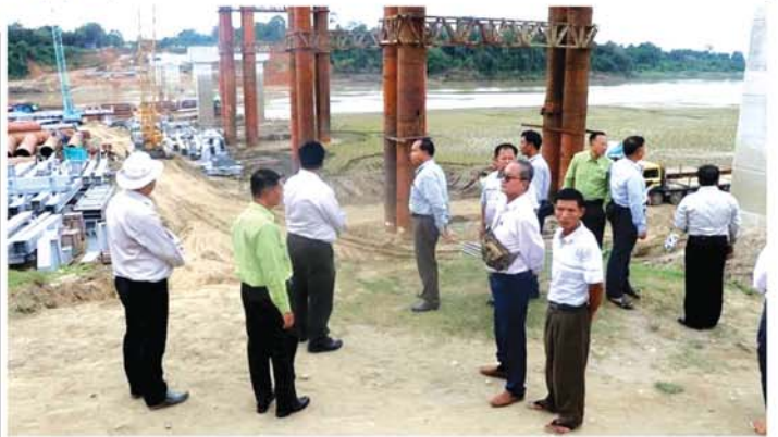
ချင်းတွင်းမြစ်ကူးတံတား(ထမံသီ) တည်ဆောက်မှု(၆၆)ရာခိုင်နှုန်း ပြီးစီး

ဖြစ်ပါတယ်ဟု ၎င်းက ဆက် လက်ပြောကြားသည်။ EV ယာဉ်များ တင်သွင်း ရောက်ရှိလာပြီး ကုသုတ္တင် ဩဂုတ်လကုန်ထိ ယာဉ်မှတ်ပုံ တင်စာရင်းများအရ နှစ်ဘီးတပ်၊ သုံးဘီးယာဉ်နှင့် EV လူစီးယာဉ် အစီးရေအပါအဝင် စုစုပေါင်း ၁၃၈၆၃ စီးရှိသည့်အနက် နှစ်ဘီး တပ် (EV ဆိုင်ကယ်)အစီးရေ ၈၅၆၉ စီး၊ သုံးဘီးယာဉ် ၄၀၂ စီး၊ ကုန်တင် (ဝန်ပေါ့)၂၁ စီးနှင့် EV လူစီးယာဉ် ၄၈၇၃ စီးဖြစ်ကြောင်း သိရသည်။ (အောက်ပုံ) (မန္တလေးစေ့စဉ်-၉)