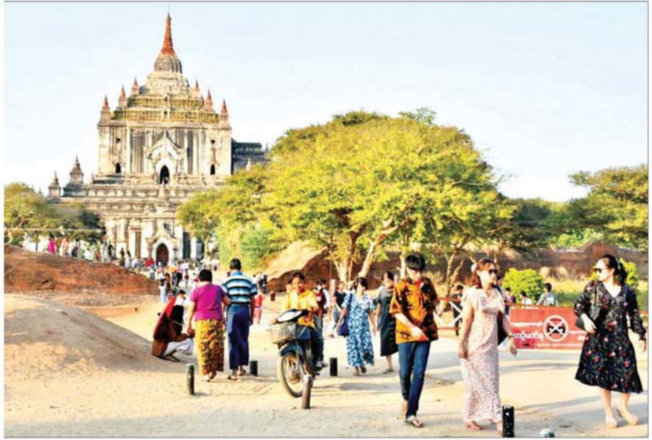
ပုဂံရှေးဟောင်းဒေသရှိ သမ္ဗညုဘုရားသို့ ဘုရားဖူးလာရောက်ကြသူများကို တွေ့ရစဉ်။

စိတ်ဝင်စားမှုများ “ပုဂံခရီးစဉ်ကို ဒီသီတင်းကျွတ်ကာလ ရုံးပိတ်ရက်တွေအတွက် ကျွန်ုပ်တို့အိမ်ကနေ တော်အသွားများကြမှာ တွေ့ရတယ်။ စိတ်ဝင်စားမှုလည်း များနေတယ်။ ရန်ကုန်က အများဆုံး သွားတယ်လို့ပြောရမယ်။ ရန်ကုန်စည်သည်တွေ သွားကြတယ်။ ပုဂံခရီးစဉ်မှာဆိုရင် ပုဂံအပြင် ပုပ္ဖားတောင်မကြီး ဒေသတွေလည်းပါတယ်။ ခရီးသွားတွေ စိတ်ဝင်စားတယ်။ အသွားများကြတယ်”ဟု The Unlock Travels & Tour မှ တာဝန်ရှိသူ