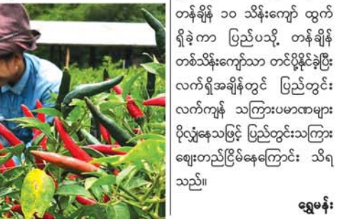
ရွှေမန်း

လက်ရှိအချိန်တွင် သကြားစက်ရုံနှစ်ရုံအလိုက် ကြိုစိုက်ခင်းများကို ပေါင်ရှင်းခြင်း၊ ပေါင်လုံးခြင်း၊ မြေဩဇာညှိညှက်ကျွေးခြင်းများကို တောင်သူများ ဆောင်ရွက်လျက်ရှိသည်။ ပြီးခဲ့သည့် ကြာရာသီက မြန်မာနိုင်ငံတစ်ဝန်းမှ သကြားတန်ဖိုး ၁၀ သိန်းကျော် ထွက်ရှိခဲ့ကာ ပြည်ပသို့ တန်ဖိုးနိမ့်တစ်သိန်းကျော်သာ တင်ပို့နိုင်ခဲ့ပြီး လက်ရှိအချိန်တွင် ပြည်တွင်းလက်ကုန် သကြားပမာဏများ ပိုလျှံနေသဖြင့် ပြည်တွင်းသကြားဈေးတည်ငြိမ်နေကြောင်း သိရသည်။