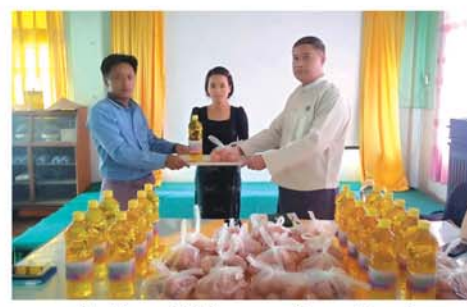
များအား ဆီ ၁ ပိဿာနှင့်ကြက်ဥ ၁၀ လုံး စားသောက်ကုန်များကို ထောက်ပံ့ပေးအပ်ခဲ့သည်။ (အပေါ်ပုံ) (၀၄၅)

မန္တလေး အောက်တိုဘာ ၄ မန္တလေးတိုင်းဒေသကြီး၊ အသေးစားစက်မှုလက်မှုလုပ်ငန်း ဦးစီးဌာနဝန်ထမ်းများနှင့် တွေ့ဆုံပွဲ စားသောက်ကုန်များ ထောက်ပံ့ပေးအပ်ပွဲကို အောက်တိုဘာ ၃ ရက် နံနက်ပိုင်းက အောက်မြေသာစံမြို့နယ် ၅ လမ်းနှင့်၂၅လမ်း ထောင့်ရှိ တိုင်းရုံးအစည်းအဝေးခန်းမတွင် ကျင်းပသည်။ အခမ်းအနားတွင် မန္တလေးတိုင်းဒေသကြီး အသေးစားစက်မှု