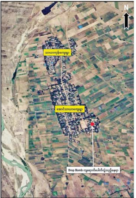
Drop Bomb တွေ့ရောက်ပစ်ခတ်မှုရှိသည့်နေရာ

ကန့်ဘလူမြို့နယ် အောင်သာယာကျေးရွာကို PDF အမည်ခံ အကြမ်းဖက်သမားများက Drop Bomb ပစ်ချတိုက်ခိုက်ခဲ့သည့် နေရာပြပုံ။