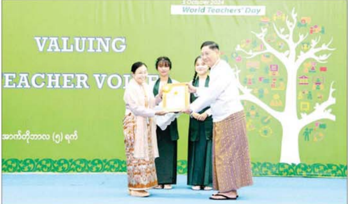
နိုင်ငံတော်စီမံအုပ်ချုပ်ရေးကောင်စီအဖွဲ့ဝင် ဒေါက်တာ ဘရွှေ ၂၀၂၄ ခုနှစ် ကမ္ဘာ့ဆရာများနေ့ အခမ်းအနားတွင် ဆုရရှိသူတစ်ဦးအား ဂုဏ်ပြုမှတ်တမ်းလွှာနှင့် ဂုဏ်ပြုဆုငွေများ ပေးအပ်ချီးမြှင့်စဉ်။