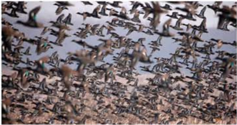
ပျောက်ကွယ်ရခြင်း၏ အဓိက တို့က ကောက်ချက်ချခဲ့သည်။

ဝါရှင်တန် အောက်တိုဘာ ၅ ဂေဟစနစ်ဆိုင်ရာ အကျိုး သက်ရောက်မှုများကြောင့် နှစ် ပေါင်း ၁၃၀၀၀၀ အတွင်း ငှက် မျိုးစိတ် ၆၁၀ မျိုးသုဉ်းခဲ့သည် ဟု ဗြိတိန်နိုင်ငံမှ တွစ်တက်သယူး ဦးဆောင်သော ငှက်သုတေသီများ မကြာသေးမီက တင်ပြခဲ့ကြောင်း ဘီဘီစီသတင်းဌာနက ဖော်ပြ သည်။ လူသားတို့၏ မဆင်မခြင် ပြုမှုသည် ငှက်အများစုမျိုးသုဉ်း စားကျက်တွင် ပေါက်ရောက်သော သီးနှံများမှထွက်ရှိသည့် အစေ့ အဆန်များ ရာသီဥတုအပြောင်း အလဲကြောင့် ကွယ်ပျောက်သွားရာ မှ အကောင်ရေနည်းပါးကာ မျိုး သုဉ်းသွားခြင်းဖြစ်သည်ဟု ထို သုတေသီများ သုံးသပ်သည်။