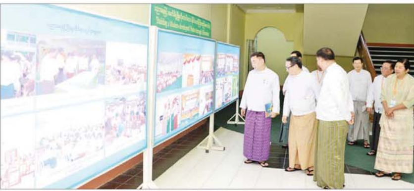
နိုင်ငံတော်စီမံအုပ်ချုပ်ရေးကောင်စီအဖွဲ့ဝင်များနှင့် တက်ရောက်လာကြသူများ ၂၀၂၄ ခုနှစ် ကမ္ဘာ့ဆရာများနေ့ အခမ်းအမှတ် ပြခန်းအား လှည့်လည်ကြည့်ရှုစဉ်။

နေပြည်တော် အောက်တိုဘာ ၅ ၂၀၂၄ ခုနှစ် ကမ္ဘာ့ဆရာများနေ့ အခမ်းအမှတ် အခမ်းအနားကို ယနေ့ နံနက်ပိုင်းက နေပြည်တော်ရှိ ပညာရေး ဝန်ကြီးဌာန၌ ကျင်းပသည်။ တက်ရောက်