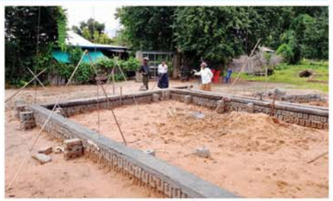
ဦးစီးအရာရှိ ဒေါ်မေသက်နွယ်နှင့် လိုအပ်သည်များ ဆွေးနွေးမှာကြားခဲ့ကြောင်း သိရသည်။ အဆိုပါ ကျေးရွာစာကြည့်တိုက် ဆောက်လုပ်ရန်အတွက် ပဏာမတင်မင်္ဂလာကို စက်တင်ဘာ ၂၈ ရက်က မြို့နယ်စီမံအုပ်ချုပ်ရေး အဖွဲ့ဥက္ကဋ္ဌနှင့် အဖွဲ့ဝင်များ တက်ရောက် ဆောင်ရွက်ပေးခဲ့ခြင်းဖြစ်ပြီး ယခုအခါ အောက်ခံခုံ (Foundation) ပြီးစီးပြီဖြစ်၍ အဆောက်အအုံ ဆောက်လုပ်ရန်အတွက် အောက်ခံခုံ (Foundation) ပြီးစီးမှုအခြေအနေအား သွားရောက်ကြည့်ရှု စစ်ဆေးခဲ့ကြပြီး ကျေးရွာစာကြည့်တိုက်ကော်မတီဝင်များနှင့် တွေ့ဆုံ၍

ကျောက်ပန်းတောင်း အောက်တိုဘာ ၅ မန္တလေးတိုင်းဒေသကြီး၊ ကျောက်ပန်းတောင်းမြို့နယ် လယ်ယားတောင်ကျေးရွာအုပ်စု၊ တောင်ခြေကျေးရွာတွင် ကျေးရွာစာကြည့်တိုက် ဆောက်လုပ်ရန်အတွက် အဆောက်အအုံ အောက်ခံခုံ (Foundation) ပြီးစီးမှုအား အောက်တိုဘာ ၄ ရက် မွန်းလွဲ ၂ နာရီက ပြန်ကြားရေးနှင့် ပြည်သူ့ဆက်ဆံရေးဦးစီးဌာန မြို့နယ်ဦးစီးအရာရှိမှ သွားရောက်ကြည့်ရှုစစ်ဆေးခဲ့ကြောင်း သိရသည်။ ပြန်ကြားရေးနှင့် ပြည်သူ့ဆက်ဆံရေးဦးစီးဌာန၊ မြို့နယ်