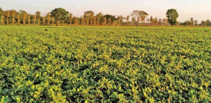
(အောက်ပုံ) (၄၄၅)

ပြင်ခြင်းလုပ်ငန်းများကို ကြိုးပမ်း ဆောင်ရွက်လျက်ရှိပြီး ထောပတ်ပဲ သီးနှံစိုက်ပျိုးခြင်းကို နိုဝင်ဘာ လဆန်းလောက်မှာ စတင်စိုက်ပျိုး သွားမှာဖြစ်ပါတယ် ဟု ပွင့်ဖြူ မြို့နယ်စိုက်ပျိုးရေးဦးစီးဌာန မြို့နယ်