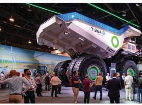
အားသွင်းစနစ်ကို ထုတ်လုပ်နိုင်ခဲ့ ခြင်းဖြစ်သည်။

တွင်ပါရှိသော ၁၉၀၀ ကီလိုဝပ် ဓာတ်အားကို မိနစ် ၃၀ အတွင်း ပြည့်အောင်သွင်းပေးနိုင်ကြောင်း မကြာသေးမီက လက်တွေ့မိတ် ဆက်ပြသခဲ့သည်။ အဆိုပါအားသွင်းစနစ်ကို တွင်ကျယ်စွာ အသုံးပြုလာနိုင် လျှင် လျှပ်စစ်ကားအကြီးစားများ အနာဂတ်တွင် အစင်းရေများလာ မည်ဖြစ်သည်ဟု ဖော်တက်စ်ဗလူး ကုမ္ပဏီအမှုဆောင်ဥက္ကဋ္ဌ အန်ဒရူး ဖောရက်စ်က ပြောကြားသည်။