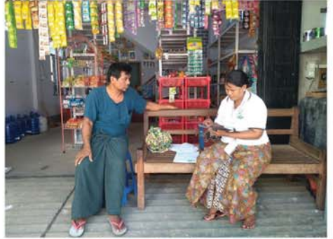
အရာများတိကျမှန်ကန်စွာရရှိ ခုနှစ်ကာကောက်ယူသည့် စနစ် နိုင်ရေးအတွက် CAPL နည်း ပညာဖြင့် Tablet အသုံးပြု ကြောင်း သိရသည်။ (အပေါ်ပုံ) ကောက်ယူခြင်းဖြစ်သဖြင့် ၂၀၁၄ (မန္တလေးနေ့စဉ်-၆)

ကောက်ခံတဲ့ စနစ်က ပိုမိုတိကျ မြန်ဆန်ပါကြောင်း နိုင်ငံတော် ကနေ ပြည်သူတွေအတွက် လူမှု စီးပွားရေးများ အဆင်ပြေအောင် အခြေခံသန်းခေါင်စာရင်းကောက်ခံ တာဖြစ်လို့ အားလုံးပူးပေါင်းပိုင်း ဝန်းပါဝင်ရမှာဖြစ်ကြောင်း ၈၉- ၁၉ ရပ်ကွက်နေ ပြည်သူတစ်ဦး က ပြောသည်။ ချမ်းမြသာစည်မြို့နယ်အတွင်း သန်းခေါင်စာရင်းကောက်ကွက် ပေါင်း ၄၇၉ ကွက် ကောက်ယူ လျက်ရှိရာ နေ့စဉ် နံနက် ၇နာရီမှ ညနေ ၆ နာရီထိ စာရင်းကောက် များက လူဦးရေနှင့်အိမ်အကြောင်း