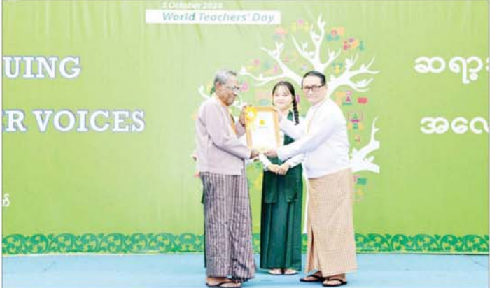
နိုင်ငံတော်စီမံအုပ်ချုပ်ရေးကောင်စီအဖွဲ့ဝင် ဒေါက်တာ မှုထန် ၂၀၂၄ ခုနှစ် ကမ္ဘာ့ဆရာများနေ့ ဂုဏ်ထူးဆောင် ပုဂ္ဂိုလ်ကြီးတစ်ဦးအား ဂုဏ်ပြုမှတ်တမ်းလွှာနှင့် ဂုဏ်ပြုဆုငွေများ ပေးအပ်ချီးမြှင့်စဉ်။