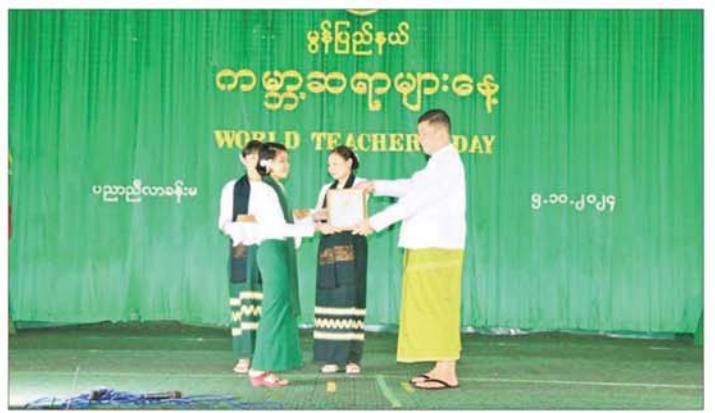
ဂုဏ်ပြုဖော်ဖြေတင်ဆက်ပေးခဲ့ကြသည့် ဆရာ အငြိမ်းစားဆရာကြီး ဆရာမကြီးများ၊ ဆရာ ဆရာမ ဆရာမများအား ဂုဏ်ပြုဆုပေးအပ်သည်။ များအား ရင်းရင်းနှီးနှီး လိုက်လံနှုတ်ဆက်ခဲ့ကြောင်း သိရသည်။ ခရိုင်(မြန်/ဆက်)

မော်လမြိုင် အောက်တိုဘာ ၅ ကမ္ဘာ့ဆရာများနေ့အထိမ်းအမှတ်အခမ်းအနား ကို ယနေ့နံနက်ပိုင်းက မော်လမြိုင်မြို့ ပညာရေးဒီဂရီ ကောလိပ် ပညာညီလာခံခန်းမ၌ ကျင်းပသည်။ အခမ်းအနားတွင် နိုင်ငံတော်စီမံအုပ်ချုပ်ရေး ကောင်စီဥက္ကဋ္ဌ နိုင်ငံတော်ဝန်ကြီးချုပ် ဗိုလ်ချုပ်မှူးကြီး သတိုးမဟာသရေစည်သူ သတိုးသီရိသုဓမ္မ မင်းအောင်လှိုင်ထံမှ ကမ္ဘာ့ဆရာများနေ့ အထိမ်း အမှတ်အခမ်းအနားသို့ ပေးပို့သည့်သဝဏ်လွှာကို မွန်ပြည်နယ်ဝန်ကြီးချုပ် ဦးအောင်ကြည်သိန်းက ဖတ်ကြားသည်။ ထို့နောက် မွန်ပြည်နယ်ပညာရေးမျိုး ဒေါ်နန့်စယ်လီလှိုင်က ကုလသမဂ္ဂလက်အောက်ခံ အဖွဲ့ ငါးဖွဲ့၏ အဖွဲ့ခေါင်းဆောင်များက ပေးပို့သော စုပေါင်းသဝဏ်လွှာကို ဖတ်ကြားကာ ၂၀၂၄ ခုနှစ် ကမ္ဘာ့ဆရာများနေ့အထိမ်းအမှတ် စာစီစာကုံးနှင့် ကဗျာပြိုင်ပွဲများတွင် ပြည်နယ်အဆင့် ဆုရရှိခဲ့သည့် ကျောင်းသား ကျောင်းသူများအား ပြည်နယ်ဝန်ကြီး ချုပ်နှင့် ပြည်နယ်တရားလွှတ်တော်တရားသူကြီး ချုပ်တို့က ဂုဏ်ပြုဆုများချီးမြှင့်ကြသည်။ ဂုဏ်ပြုဆုပေးအပ် ဆက်လက်၍ မော်လမြိုင်မြို့နယ်မှ ဆရာ ဆရာမများက မြတ်ဆရာတေးသီချင်းဖြင့် သီဆို ဂုဏ်ပြုဖော်ဖြေမှုကို ကြည့်ရှုအားပေးကာ ပြည်နယ် လုံခြုံရေးနှင့် နယ်စပ်ရေးရာဝန်ကြီး ဗိုလ်မှူးကြီး ကျော်စွာမြင့်က ကမ္ဘာ့ဆရာများနေ့အထိမ်းအမှတ်