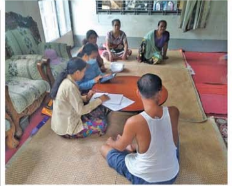
စစ်ကိုင်း အောက်တိုဘာ ၅ စစ်ကိုင်းတိုင်းဒေသကြီး၊ စစ်ကိုင်းမြို့တွင် မြို့နယ်သန်းခေါင် စာရင်းကော်မတီ၏ ကြီးကြပ်မှု ဖြင့် ၂၀၂၄ခုနှစ် လူဦးရေနှင့်အိမ် အကြောင်းအရာသန်းခေါင်စာရင်း မြို့နယ်အဆင့် စာရင်းစစ်၊စာရင်း ကောက်များသည် အောက်တိုဘာ ၁ ရက် နံနက်ပိုင်းမှစတင်၍ မြို့ပေါ် ရပ်ကွက်များတွင် လှည့်လည် ကောက်ယူခဲ့ကြသည်။ သန်းခေါင်စာရင်းကောက်ယူ ရာသို့ မြို့နယ်အထွေထွေအုပ်ချုပ် ရေးဦးစီးဌာနမှ တာဝန်ရှိသူများ၊ မြို့နယ်သန်းခေါင်စာရင်းကော်မတီ ဝင်များ၊ အထောက်အကူပြု ကော်မတီများ၊ ခရိုင်၊ မြို့နယ် လူဝင်မှုကြီးကြပ်ရေးနှင့် ပြည်သူ့ အင်အားဝန်ကြီးဌာနမှ တာဝန်ရှိသူ များက အနီးကပ်ကြီးကြပ်၍ လိုအပ်သည်များ စီမံဆောင်ရွက် ပေးခဲ့ကြောင်း သိရသည်။ (အပေါ်ပုံ) မြို့နယ်(ပြန်/ဆက်)

အဖွဲ့ဝင်များ၊ ဌာနဆိုင်ရာများက လှည့်လည်ကြည့်ရှု အားပေးခဲ့ကြ သည်။ အဆိုပါ လူဦးရေနှင့် အိမ် အကြောင်းအရာ သန်းခေါင်စာရင်း ကောက်ယူခြင်းလုပ်ငန်းများကို ညောင်ဦးမြို့နယ်အတွင်း ကြီးကြပ် သူ ၉၂ ဦး ရပ်ကျေးအုပ်ချုပ်ရေး မှူးနှင့် စာရေးဝန်ထမ်းများ ၁၈၄ ဦး၊ ကျောင်းဆရာ၊ ဆရာမ ၂၁၇ ဦး၊ စုစုပေါင်း ၄၉၃ ဦးပါဝင် သောအဖွဲ့ဖြင့် အောက်တိုဘာ ၁ ရက်မှ ၁၅ ရက်အထိ နေ့စဉ် နံနက် ၇ နာရီမှ ညနေ ၆ နာရီ အထိ စာရင်းကောက်ယူလျက်ရှိ ကြောင်း သိရသည်။ (အောက်ပုံ) (၄၈၁) *-*-*-*-*