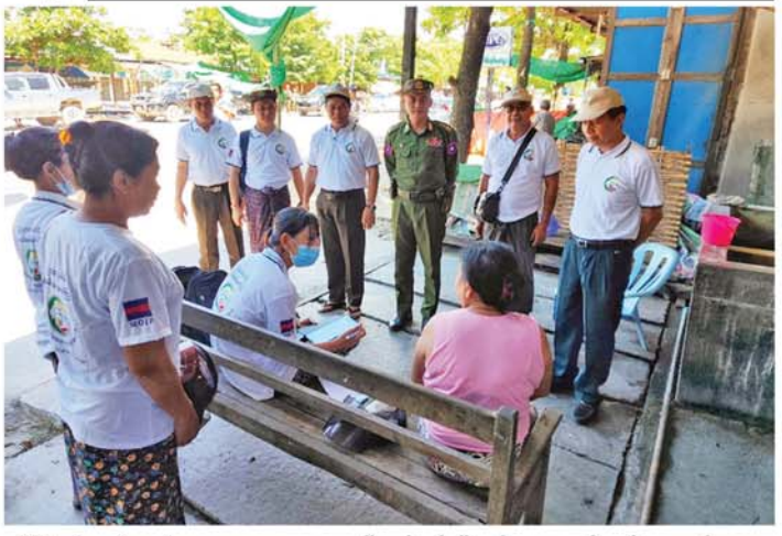
ဝန်ကြီးနှင့် အဖွဲ့သည် မတ္တရာမြို့နယ်၌ အခြေခံပညာအထက်တန်းကျောင်း(စလွန်ဖြူ)သို့ သွားရောက်ကာ ကျောင်းအုပ်ဆရာမကြီးနှင့် ဆရာ၊ ဆရာမများအား တွေ့ဆုံ၍ အားပေးစကားများ ပြောကြားခဲ့ပြီး ထောက်ပံ့ပစ္စည်းများနှင့် ထောက်ပံ့ပစ္စည်းများ ပေးအပ်ခဲ့ကြောင်း သိရသည်။

စာရင်းစစ်စာရင်းကောက်များအတွက် လက်ဆောင်ပစ္စည်းများ ပေးအပ်ခဲ့သည်။ ထို့နောက် လုံခြုံရေးနှင့် နယ်စပ်ရေးရာဝန်ကြီးဗိုလ်မှူးကြီးနေလင်းစိုးနှင့် အဖွဲ့သည် မတ္တရာမြို့၊ အမှတ် ၅ ရပ်ကွက်ရှိ အခြေခံပညာအထက်တန်းကျောင်း(စလွန်ဖြူ)သို့ သွားရောက်ကာ ကျောင်းအုပ်ဆရာမကြီးနှင့် ဆရာ၊ ဆရာမများအား တွေ့ဆုံ၍ အားပေးစကားများ ပြောကြားခဲ့ပြီး ထောက်ပံ့ပစ္စည်းများနှင့် ထောက်ပံ့ပစ္စည်းများ ပေးအပ်ခဲ့သည်။ ဆက်လက်၍