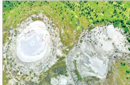
ကျောက်ဖြူမြို့နယ် စိုင်ခြံကျေးရွာအနီးရှိ ဝက်အင်းနဂါးရွှံ့မီးတောင် ပေါက်ကွဲမှုကိုတွေ့ရစဉ်။

စာမျက်နှာ ၂၄ မှ ရွှံ့မီးတောင်များ၏အမြင့်များမှာ ပင်လယ်ရေမျက်နှာပြင်အထက် မီတာ ၅၀ မှ မီတာ ၆၀ ခန့်အထိရှိကြောင်း၊ ရွှံ့မီးတောင်သည် မီးတောင်ပေါက်ကွဲရန် ပုံပိုးပေးသည့် ကုန်းမြေထုလုပ်ရှားမှုနှင့် မြေအောက်ဓာတ်ငွေ့များ စုစည်းကာ ပေါက်ကွဲထွက်လာမှုတို့ကြောင့် ဖြစ်ပေါ်ရခြင်းဖြစ်ကြောင်းနှင့် ယခုပေါက်ကွဲခဲ့သည့် ဝက်အင်းနဂါးရွှံ့မီးတောင်သည် ၂၀၂၃ ခုနှစ် နိုဝင်ဘာ ၅ ရက်တွင် နောက်ဆုံးအကြိမ် ပေါက်ကွဲခဲ့ပြီး ၂၀၁၆ ခုနှစ်မှ ၂၀၂၄ ခုနှစ်အထိ (၆)ကြိမ် ပေါက်ကွဲခဲ့ကြောင်း သိရသည်။ သတင်းစဉ်