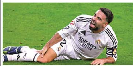
ပိုင်ဆိုင်လို့ အတိုင်းမသိပျော်ရွှင်မိပါ။ အောက်ထပ်လည်း ယခုလို မှတ်တမ်းတွေနဲ့ အသင်းအား ဆုပေးလာတွေ့ ရရှိအောင် အစွမ်းကုန်ကြိုးစားပေးသွားမှာပါ ဟု ပြောသည်။ (ယာပုံ) (NGB)

အဝေးကွင်းပွဲစဉ်အား ကိုင်တွယ်ပြီးနောက် ယခုလို မှတ်တမ်းတစ်ရပ်ပိုင်ဆိုင်ခဲ့ခြင်း ဖြစ်သည်။ နည်းပြအာနီစလော့သည် လီဗာပူးအသင်းအား ယခုနှစ်ဘောလုံးရာသီမှ စတင်ကိုင်တွယ်ခဲ့ပြီး ပြိုင်ပွဲ ၁၀ ပွဲတွင် ၁၀ ပွဲစလုံး ရှုံးပွဲမရှိအောင်လည်း စွမ်းဆောင်နိုင်ခဲ့သည်။ အသက်(၄၆)နှစ်အရွယ်ရှိ အာနီစလော့က ကွန်တော် အခုလို မှတ်တမ်းကောင်းတစ်ရပ်