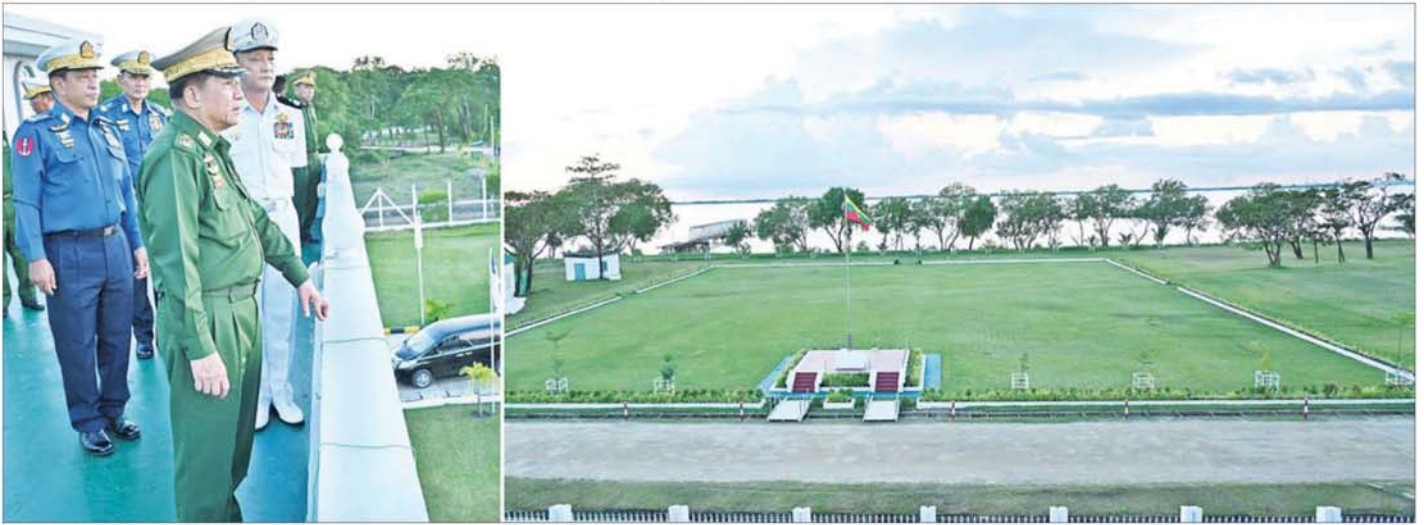
နိုင်ငံတော်စီမံအုပ်ချုပ်ရေးကောင်စီဥက္ကဋ္ဌ တပ်မတော်ကာကွယ်ရေးဦးစီးချုပ် ဗိုလ်ချုပ်မှူးကြီး မင်းအောင်လှိုင်နှင့်အဖွဲ့ဝင်များ ကမ်းခြေစောင့်တပ်ဖွဲ့ ကွပ်ကဲမှုဌာနချုပ်ဝင်းအတွင်း ကြည့်ရှုစစ်ဆေးစဉ်။