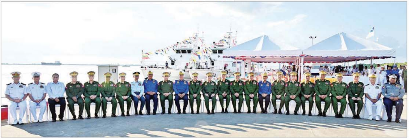
နိုင်ငံတော်စီမံအုပ်ချုပ်ရေးကောင်စီဥက္ကဋ္ဌ တပ်မတော်ကာကွယ်ရေးဦးစီးချုပ် ဗိုလ်ချုပ်မှူးကြီး မင်းအောင်လှိုင် နှင့်အဖွဲ့ဝင်များ တက်ရောက်လာကြသည့် စည်သူတော်များနှင့်အတူ မှတ်တမ်းတင်ဓာတ်ပုံရိုက်စဉ်။