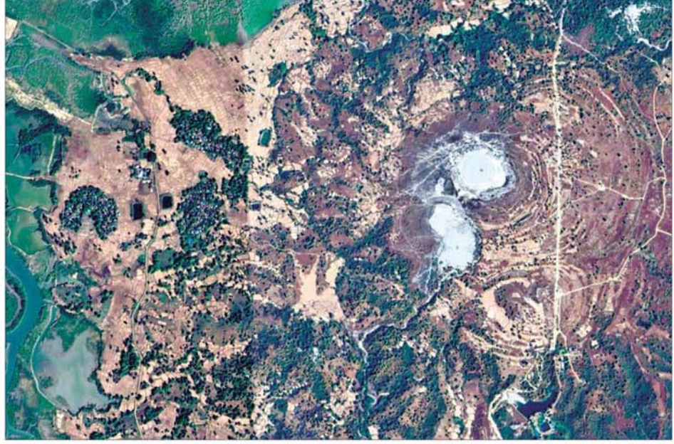
ကျောက်ဖြူမြို့နယ် စိုင်ခြံကျေးရွာအနီးရှိ ဝက်အင်းနဂါး ရွှံ့မီးတောင် ပေါက်ကွဲမှုကိုတွေ့ရစဉ်။

နေပြည်တော် အောက်တိုဘာ ၆ ရခိုင်ပြည်နယ် ကျောက်ဖြူမြို့နယ် စိုင်ခြံကျေးရွာအနီးတွင် ဒေသအခေါ် ဝက်အင်းနဂါးအမည်ရှိ ရွှံ့မီးတောင်လေးခုပါ မီးတောင် အုပ်စုမှ ကျောက်ဘက်အစွန်ဆုံးမီးတောင်သည် အောက်တိုဘာ ၅ ရက် နံနက် ၁၁ နာရီခန့်တွင် မိနစ် ၃၀ ကြာ ပေါက်ကွဲမှုဖြစ်ပေါ်ခဲ့ရာ ရွှံ့ရည်ပူ များသည် အမြင့် ၁၀ ပေခန့်အထိ လွင့်စဉ်ပေါက်ထွက်ခဲ့ပြီး ရွှံ့မီးတောင် စါးဘေးပတ်လည် ပေ ၃၀၀ ခန့် ရွှံ့ချော်ရည်များ ဖုံးလွှမ်းခဲ့သည်။ အဆိုပါ မီးတောင်ပေါက်ကွဲမှုကြောင့် လူ၊ တိရစ္ဆာန်နှင့် လယ်ယာမြေစိုက်ခင်းများ ထိခိုက်ပျက်စီးဆုံးရှုံးမှုမရှိကြောင်း သိရသည်။ အများဆုံးပေါက်ကွဲလေ့ရှိ ရမ်းဗြဲကျွန်း ကျောက်ဖြူမြို့နယ် စိုင်ခြံကျေးရွာအနီးတွင် ဝက်အင်း နဂါးရွှံ့မီးတောင်အုပ်စု၊ ပန်းရည်နဂါးရွှံ့မီးတောင်အုပ်စုနှင့် သပြေတော နဂါးရွှံ့မီးတောင်အုပ်စု သုံးခုရှိပြီး ပန်းရည်နဂါးရွှံ့မီးတောင်အုပ်စု နှင့် ဝက်အင်းနဂါးရွှံ့မီးတောင်အုပ်စုတို့မှာ အများဆုံးပေါက်ကွဲလေ့ ရှိကြောင်း၊ စာမျက်နှာ ၁၀ သို့