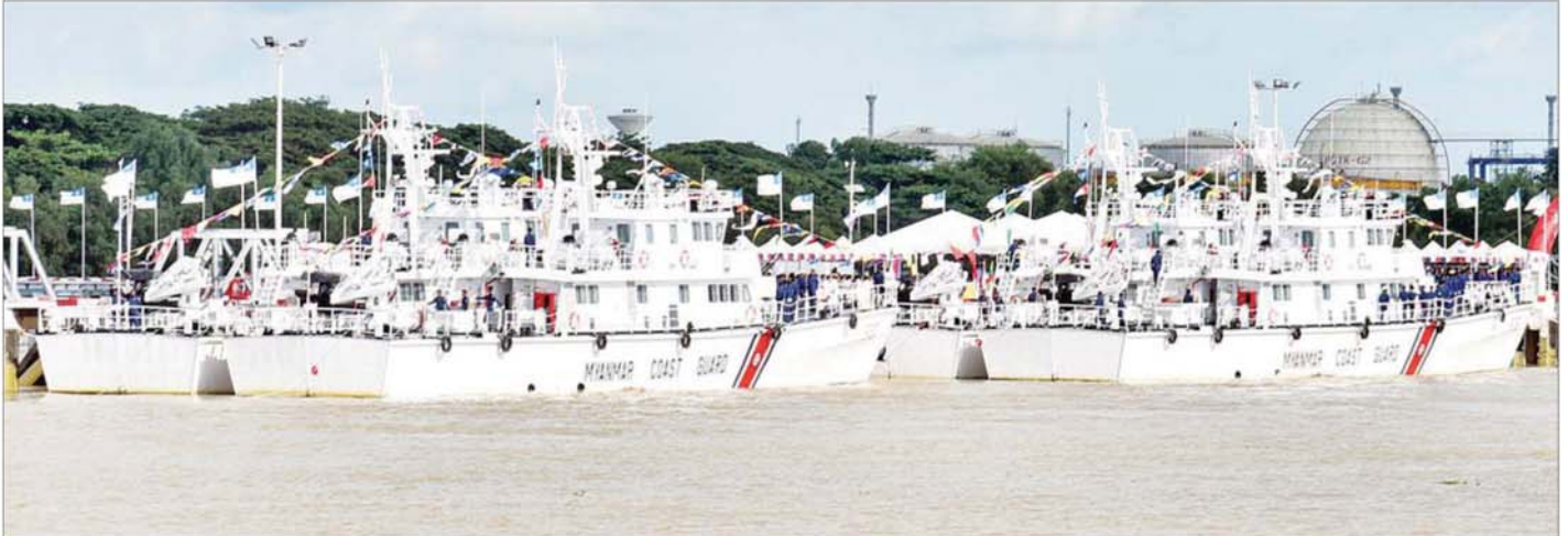
တပ်တော်ဝင်ရေယာဉ်များဖြစ်သော ၄၈ မီတာ အမြန်သွားကင်းလှည့်ရေယာဉ် လေးစင်းအား တွေ့ရစဉ်။