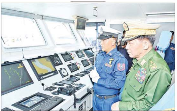
နိုင်ငံတော်စီမံအုပ်ချုပ်ရေးကောင်စီဥက္ကဋ္ဌ တပ်မတော်ကာကွယ်ရေးဦးစီးချုပ် ဗိုလ်ချုပ်မှူးကြီး မင်းအောင်လှိုင် အမြန်သွားကင်းလှည့်ရေယာဉ်အတွင်း ကြည့်ရှုစဉ်။

မှတ်တမ်းတင်လက်မှတ်ရေးထိုး ထို့နောက် နိုင်ငံတော်စီမံအုပ်ချုပ်ရေးကောင်စီ