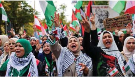
အောက်တိုဘာ ၇ ရက်တွင် ကျရောက်မည့် ဂါစာစစ်မက် နှစ်ပတ်လည်နေ့မတိုင်မီ ဂျာမနီနိုင်ငံ ဘာလင်မြို့တော်၌ စစ်အဆုံးသတ်ရေးအတွက် ယမန်နေ့က စုဝေးတောင်းဆိုနေကြစဉ်။ Mon