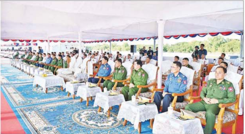
နိုင်ငံတော်စီမံအုပ်ချုပ်ရေးကောင်စီဥက္ကဋ္ဌ တပ်မတော်ကာကွယ်ရေးဦးစီးချုပ် ဗိုလ်ချုပ်မှူးကြီး မင်းအောင်လှိုင် ပြည်ထောင်စုသမ္မတမြန်မာနိုင်ငံတော် ကမ်းခြေစောင့်တပ်ဖွဲ့ကွပ်ကဲမှူးဌာနချုပ် တည်ထောင်ခြင်း (၃) နှစ်ပြည့် နှစ်ပတ်လည်နေ့အထိမ်းအမှတ်နှင့် အမြန်သွား ကင်းလှည့်ရေယာဉ်လေးစင်း တပ်တော်ဝင်ခြင်းအခမ်းအနားတွင် အမှာစကားပြောကြားစဉ်။

၎င်းတို့အား အခမ်းအနားသို့ နိုင်ငံတော်စီမံအုပ်ချုပ်ရေးကောင်စီဥက္ကဋ္ဌ တပ်မတော်ကာကွယ်ရေးဦးစီးချုပ်နှင့်အတူ ပြည်ထောင်စုအဆင့်ပုဂ္ဂိုလ်များ၊ ကာကွယ်ရေးဦးစီးချုပ်ရုံးမှ အဆင့်မြင့်တပ်မတော်အရာရှိကြီးများ၊ ရန်ကုန်တိုင်းစစ်ဌာနချုပ် တိုင်းမှူး၊ ကမ်းခြေစောင့်တပ်ဖွဲ့ညွှန်ကြားရေးမှူးချုပ် ဗိုလ်ချုပ်ကိုကိုကျော်၊ သက်ဆိုင်ရာ ရေတပ်စခန်းဌာနချုပ်မှူးမှ ဌာနချုပ်မှူးများ၊ တပ်မတော်(ရေ)နှင့် ကမ်းခြေစောင့်တပ်ဖွဲ့ ကွပ်ကဲမှူးဌာနချုပ်မှ အရာရှိ၊ စစ်သည်များ တက်ရောက်ကြသည်။