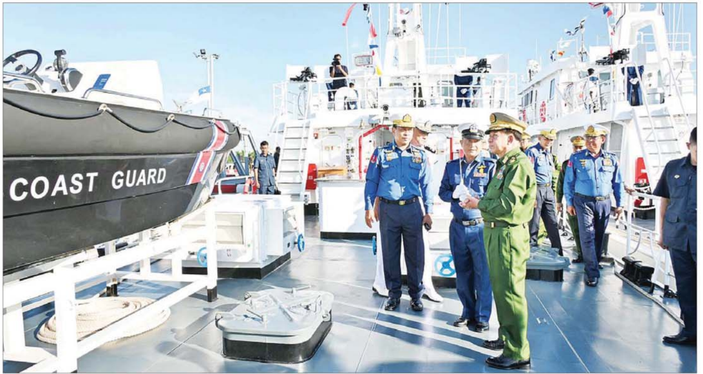
နိုင်ငံတော်စီမံအုပ်ချုပ်ရေးကောင်စီဥက္ကဋ္ဌ တပ်မတော်ကာကွယ်ရေးဦးစီးချုပ် ဗိုလ်ချုပ်မှူးကြီး မင်းအောင်လှိုင်နှင့်အဖွဲ့ဝင်များ တပ်တော်ဝင်ရေယာဉ်များဖြစ်သော ၄၈ ဗီတာ အမြန်သွားကင်းလှည့်ရေယာဉ် လေးစင်းအား လှည့်လည်ကြည့်ရှုစဉ်။