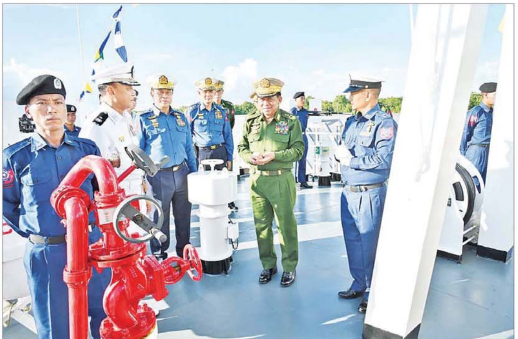
နိုင်ငံတော်စီမံအုပ်ချုပ်ရေးကောင်စီဥက္ကဋ္ဌ တပ်မတော်ကာကွယ်ရေးဦးစီးချုပ် ဗိုလ်ချုပ်မှူးကြီး မင်းအောင်လှိုင်နှင့်အဖွဲ့ဝင်များ တပ်တော်ဝင်ရေယာဉ်များဖြစ်သော ၄၈ ဝိတာ အမြန်သွားကင်းလှည့်ရေယာဉ် လေးစင်းအား လှည့်လည်ကြည့်ရှုရာ တာဝန်ရှိသူများက လိုက်လံရှင်းလင်းပြသစဉ်။

ကမ်းခြေစောင့်တပ်ဖွဲ့အနေဖြင့် ယခုကဲ့သို့ များပြားသည့် ရေကြောင်းဆိုင်ရာတာဝန်များကို ထမ်းဆောင်နိုင်ရေး နှစ်စဉ်တိုးချဲ့ဖွဲ့စည်းပေးနိုင် ခဲ့ပြီးဖြစ်ကြောင်း၊ ရေမိုင် ၁၃၀၀ ခန့်ရှိသည့် ကမ်းရိုး တန်း၊ ကျွန်းပေါင်း (၁၄၀၀) ရှိပြီး ရေပြင်နယ်နိမိတ် စတုရန်း ရေမိုင် (၁၄၃,၁၁၀.၇၂) ရှိသည့် မိမိတို့ နိုင်ငံအတွက် ကမ်းခြေစောင့်တပ်ဖွဲ့ကို ယခုထက် များစွာသောရေယာဉ်၊ လက်နက်ပစ္စည်းကိရိယာ၊