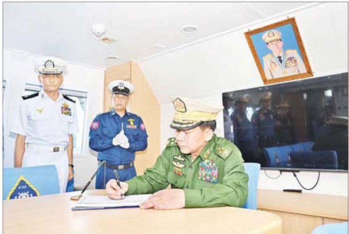
နိုင်ငံတော်စီမံအုပ်ချုပ်ရေးကောင်စီဥက္ကဋ္ဌ တပ်မတော်ကာကွယ်ရေးဦးစီးချုပ် ဗိုလ်ချုပ်မှူးကြီး မင်းအောင်လှိုင် အမြန်သွားကင်းလှည့်ရေယာဉ်ပေါ်ရှိ စည်သူတော်မှတ်တမ်းတင်ဓာတ်ပုံတွင် မှတ်တမ်းတင်လက်မှတ်ရေးထိုးစဉ်။

□ ကမ်းခြေစောင့်တပ်ဖွဲ့အနေဖြင့် ယခုကဲ့သို့များပြားသည့် ရေကြောင်းဆိုင်ရာတာဝန် များကို ထမ်းဆောင်နိုင်ရေး နှစ်စဉ်တိုးချဲ့ဖွဲ့စည်းပေးနိုင်ခဲ့ပြီးဖြစ်၊ ရေမိုင် ၁၃၀၀ ခန့် ရှိသည့် ကမ်းရိုးတန်း၊ ကျွန်းပေါင်း (၁၄၀၀) ရှိပြီး ရေပြင်နယ်နိမိတ် စတုရန်း ရေမိုင် (၁၄၃,၁၁၀.၇၂) ရှိသည့် မိမိတို့နိုင်ငံအတွက် ကမ်းခြေစောင့်တပ်ဖွဲ့ကို ယခုထက် များစွာသောရေယာဉ်၊ လက်နက်ပစ္စည်းကိရိယာ၊ လူစွမ်းအားများကို တိုးချဲ့သွားရဦး မည်ဖြစ်