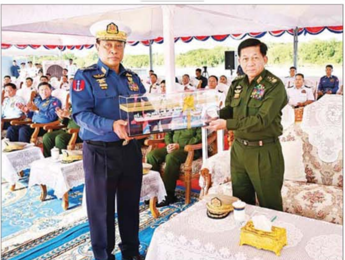
နိုင်ငံတော်စီမံအုပ်ချုပ်ရေးကောင်စီဥက္ကဋ္ဌ တပ်မတော်ကာကွယ်ရေးဦးစီးချုပ် ဗိုလ်ချုပ်မှူးကြီး မင်းအောင်လှိုင်ထံ နိုင်ငံတော်စီမံအုပ်ချုပ်ရေးကောင်စီဝင်၊ ပြည်ထောင်စုဝန်ကြီး ဗိုလ်ချုပ်ကြီး တင်အောင်စန်းက တပ်တော်ဝင်အခမ်းအနားအထိမ်းအမှတ် ရေယာဉ်ပုံစံငယ်ကို ဂါရဝပြုပေးအပ်စဉ်။

ဥက္ကဋ္ဌ တပ်မတော်ကာကွယ်ရေးဦးစီးချုပ်ထံသို့ ကောင်စီဝင်၊ ကာကွယ်ရေးဝန်ကြီးဌာန ပြည်ထောင်စုဝန်ကြီး ဗိုလ်ချုပ်ကြီး တင်အောင်စန်းက တပ်တော်ဝင်အခမ်းအနားအထိမ်းအမှတ် ရေယာဉ်ပုံစံငယ်ကို ဂါရဝပြုပေးအပ်သည်။ ယင်းနောက် နိုင်ငံတော်စီမံအုပ်ချုပ်ရေးကောင်စီဥက္ကဋ္ဌ တပ်မတော်ကာကွယ်ရေးဦးစီးချုပ်က ဂုဏ်ပြုအမှာစကားပြောကြားရာ၌ ယနေ့သည် ၄၈ ဇီတာ အမြန်သွားကင်းလှည့်ရေယာဉ်သစ်လေးစင်းကို မြန်မာနိုင်ငံကမ်းခြေစောင့်တပ်ဖွဲ့တွင် အင်အားဝင် ရေယာဉ်များအဖြစ် တပ်တော်ဝင်စာရင်းသွင်းနိုင်သည့် မင်္ဂလာရီသောနေ့တစ်နေ့ဖြစ်သကဲ့သို့ မိမိတို့ တပ်မတော်နှင့် ကမ်းခြေစောင့်တပ်ဖွဲ့အတွက် အားသစ်လောင်းသည့် နေ့တစ်နေ့လည်းဖြစ်ကြောင်း၊ ထို့ပြင် ၂၀၂၁ ခုနှစ်၊ အောက်တိုဘာလ ၆ ရက်တွင် စတင်ခဲ့သည့် ကမ်းခြေစောင့်တပ်ဖွဲ့၏ ၃ နှစ်မြောက် တပ်နှစ်ပတ်