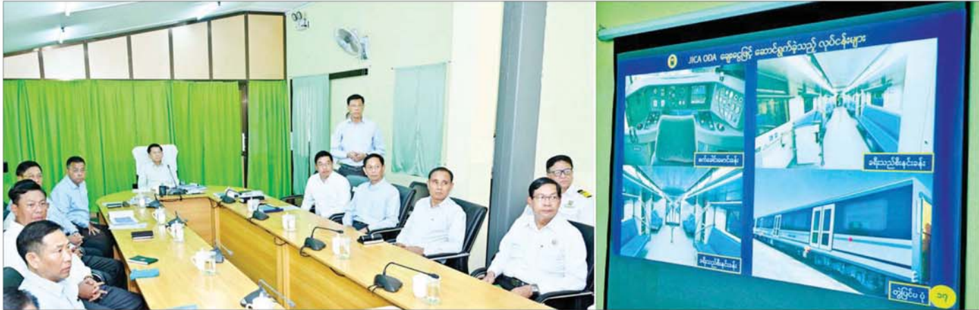
နိုင်ငံတော်စီမံအုပ်ချုပ်ရေးကောင်စီဥက္ကဋ္ဌ နိုင်ငံတော်ဝန်ကြီးချုပ် ဗိုလ်ချုပ်မှူးကြီး မင်းအောင်လှိုင်အား နိုင်ငံတော်စီမံအုပ်ချုပ်ရေးကောင်စီအဖွဲ့ဝင် ပြည်ထောင်စုဝန်ကြီး ဗိုလ်ချုပ်ကြီး မြထွန်းဦးက ရှင်းလင်းတင်ပြစဉ်။

(၃-၉-၂၀၂၄ ရက်နေ့တွင် နိုင်ငံတော်စီမံအုပ်ချုပ်ရေးကောင်စီဥက္ကဋ္ဌ နိုင်ငံတော် ဝန်ကြီးချုပ် ဗိုလ်ချုပ်မှူးကြီး မင်းအောင်လှိုင် ရှမ်းပြည်နယ် အစိုးရအဖွဲ့ဝင်များ၊ ပြည်နယ်နှင့် ခရိုင်အဆင့် ဌာနဆိုင်ရာတာဝန်ရှိသူများအား ပြောကြားသည့် အမှာ စကားမှ ကောက်နုတ်ချက် )