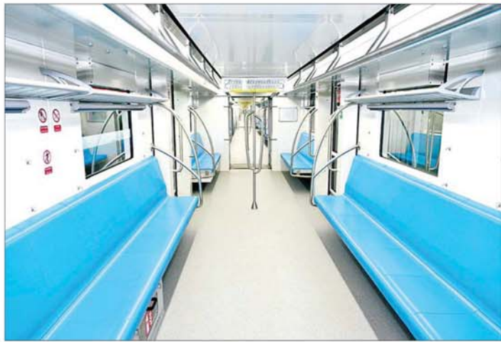
စပိန်နိုင်ငံမှ ရောက်ရှိလာသည့် DEMU ရထားတွဲဆိုင်းအသစ်တစ်စင်း၏အတွင်းပိုင်းကို တွေ့ရစဉ်။

✦ စာမျက်နှာ ၃ မှ ဆောင်ရွက်ရာတွင် အချို့လမ်းပိုင်း အကွေ့နေရာများအား အမြန်နှုန်း ကန့်သတ်ချက်များ ကိုက်ညီမှု ရှိစေရေး လမ်းပိုင်းအလိုက် သုတေသနပြု ဆောင်ရွက်ရမည် ဖြစ်ကြောင်း၊ ထို့ပြင် အဆိုပါ အမြန်နှုန်းနှင့် ကိုက်ညီမှုရှိသည့် ရထားလမ်းနေရာများ၊ တံတား နေရာများကိုလည်း လေ့လာဆန်း စစ်ခြင်းများဆောင်ရွက်၍ မိမိတို့ နိုင်ငံရှိ လမ်းပိုင်းများနှင့်ကိုက်ညီ သည့် အမြန်နှုန်းစံတစ်ခုကို သတ်မှတ်ဆောင်ရွက်သွားကြရမည်ဖြစ် ကြောင်း၊ မိမိတို့နိုင်ငံ၌ မီးရထား သယ်ယူပို့ဆောင်ရေးသည် ၁၈၇၇ ခုနှစ်ကတည်းက စတင်ခဲ့ခြင်းဖြစ်