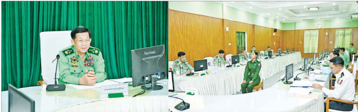
နိုင်ငံတော်စီမံအုပ်ချုပ်ရေးကောင်စီဥက္ကဋ္ဌ တပ်မတော်ကာကွယ်ရေးဦးစီးချုပ် ဗိုလ်ချုပ်မှူးကြီး မင်းအောင်လှိုင် တပ်မတော်(ကြည်း) ဗိုလ်သင်တန်းကျောင်း(မှော်ဘီ) ဘွဲ့ရအမျိုးသမီးဗိုလ်လောင်းသင်တန်း အမှတ်စဉ်(၁၁) စစ်လက်ရုံး ရွေးချယ်ပွဲသို့ တက်ရောက်စိစစ်ရွေးချယ်စဉ်။

◆ နိုင်ငံတော်စီမံအုပ်ချုပ်ရေးကောင်စီ ဦးတည်ချက်(၉)ရပ်များ က ဆောင်ရွက်ရခြင်းဖြစ်သကဲ့သို့ နိုင်ငံကိုပျက်စီးအောင်လည်း အပျက်သမားစိတ်ဓာတ်ရှိသည့် ၎င်းနိုင်ငံသားများကပင် အဓိကပြုလုပ်ခြင်းဖြစ်... ◆ ဒေသတစ်ခုပျက်စီးစေရန်အတွက် လုပ်ဆောင်ကြသူများမှာ အဆိုပါဒေသတွင် နေထိုင်ကြသည့် ဒေသအပျက်သမားအကြမ်းဖက်များပင်ဖြစ်... ◆ အခြားဒေသတွင်နေထိုင်သူများက လာရောက်လုပ်ဆောင်နိုင်ခြင်းမရှိ... ◆ ဥပမာပေးရမည်ဆိုပါက “အရိပ်နေနေ့ အခက်ချိုးချိုး” ပြုလုပ်နေသူများဖြစ်... ◆ ၎င်းကဲ့သို့အကြမ်းဖက်အပျက်သမားများကိုလူထုအားဖြင့် ကာကွယ်ထိန်းသိမ်းရန်လို... (နိုင်ငံတော်စီမံအုပ်ချုပ်ရေးကောင်စီဥက္ကဋ္ဌ နိုင်ငံတော်ဝန်ကြီးချုပ် ဗိုလ်ချုပ်မှူးကြီး မင်းအောင်လှိုင်၏ ၂၀၂၄ ခုနှစ်၊ ဇွန်လ ၇ ရက်နေ့တွင် ပြုလုပ်သော နိုင်ငံတော်စီမံအုပ်ချုပ်ရေးကောင်စီ အစည်းအဝေး (၃/၂၀၂၄) သို့ တက်ရောက်အမှာစကားပြောကြားမှုမှ ကောက်နုတ်ချက်)