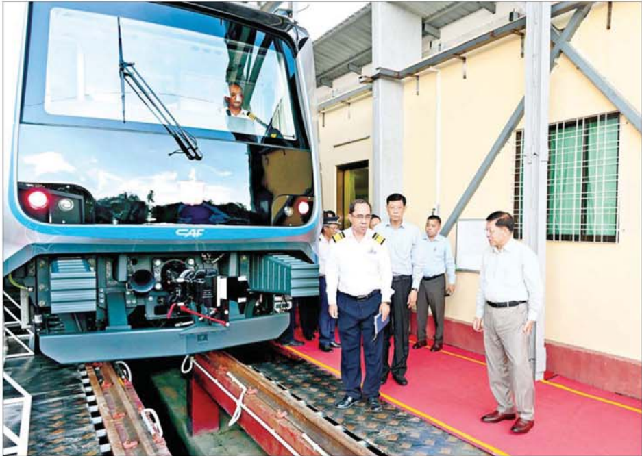
နိုင်ငံတော်စီမံအုပ်ချုပ်ရေးကောင်စီဥက္ကဋ္ဌ နိုင်ငံတော်ဝန်ကြီးချုပ် ဗိုလ်ချုပ်မှူးကြီး မင်းအောင်လှိုင် စစ်နိမ့်စင်မှ ရောက်ရှိလာသည့် DEMU ရထားတွဲဆိုင်းအသစ်များကို ကြည့်ရှုစစ်ဆေးစဉ်။

ပြေးဆွဲနိုင်ရေးအတွက် ဆောင်ရွက် ထားရှိမှု အခြေအနေများနှင့် ပတ်သက်၍ လုပ်ငန်းဆောင်ရွက်ခဲ့ မှုအခြေအနေများနှင့် လေ့လာရေး အဖွဲ့၏ တွေ့ရှိချက်များ၊ မြို့ပတ် လျှပ်စစ်ရထားအတွက် သုံးသပ် တင်ပြချက်များကို လည်းကောင်း၊ ဒုတိယဝန်ကြီး ဦးအောင်မြိုင်က အဓိက မီးရထားလမ်းပိုင်းများ၌ မြန်နှုန်းမြှင့်တင် မောင်းနှင်နိုင်ရေး ဆောင်ရွက်လျက်ရှိမှု အခြေအနေ များနှင့်ပတ်သက်၍ မြန်မာ့မီးရထား ၏ နောက်ခံအခြေအနေ၊ လမ်းပိုင်း ဆိုင်ရာ အချက်အလက်များနှင့် လိုအပ်ချက်များ၊ စက်ခေါင်း၊ တွဲနှင့် DEMU (Rolling Stock) များ၏ တစ်လျှောက် လျှပ်စစ်ရထား