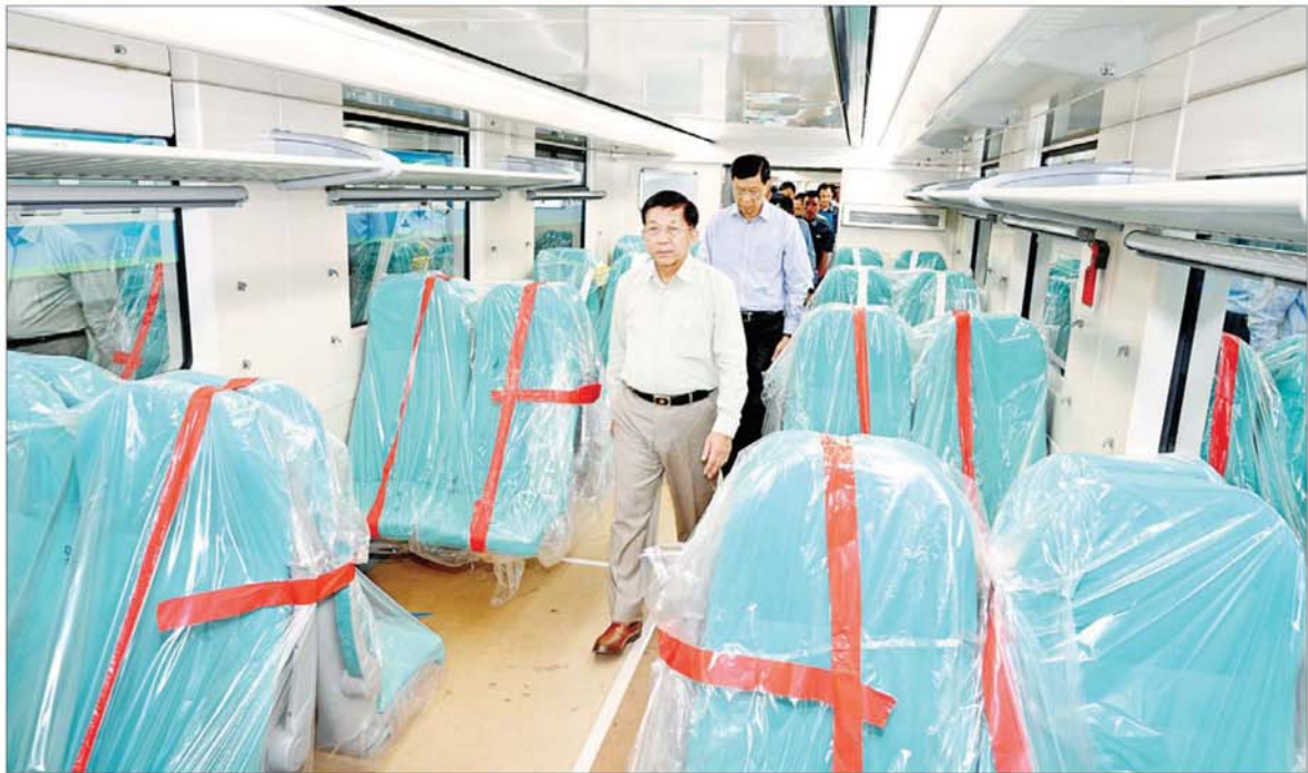
နိုင်ငံတော်စီမံအုပ်ချုပ်ရေးကောင်စီဥက္ကဋ္ဌ နိုင်ငံတော်ဝန်ကြီးချုပ် ဗိုလ်ချုပ်မှူးကြီး မင်းအောင်လှိုင် စစ်နံနိုင်းမှ ရောက်ရှိလာသည့် DEMU ရထားတွဲဆိုင်အသစ်များကို ကြည့်ရှုစစ်ဆေးစဉ်။

နေပြည်တော် အောက်တိုဘာ ၇ နိုင်ငံတော် စီမံအုပ်ချုပ်ရေးကောင်စီဥက္ကဋ္ဌ နိုင်ငံတော်ဝန်ကြီးချုပ် ဗိုလ်ချုပ်မှူးကြီးမင်းအောင်လှိုင်သည် ယနေ့နံနက်ပိုင်းတွင် ခရီးစဉ်တွင်လိုက်ပါလာသည့် အဖွဲ့ဝင်များ၊ ရန်ကုန်တိုင်းဒေသကြီးဝန်ကြီးချုပ်၊ ရန်ကုန်တိုင်းစစ်ဌာနချုပ် တိုင်းမှူးနှင့် တာဝန်ရှိသူများလိုက်ပါ၍ ရန်ကုန်တိုင်းဒေသကြီး အင်းစိန်မြို့နယ်ရှိ ပို့ဆောင်ရေးနှင့် ဆက်သွယ်ရေးဝန်ကြီးဌာန မြန်မာ့မီးရထား ဖြို့ပတ်ဒီဇယ်စက်ခေါင်းရုံ (အင်းစိန်) သို့ သွားရောက်၍ လုပ်ငန်းဆောင်ရွက်နေမှု အခြေအနေများကို ကြည့်ရှုစစ်ဆေးသည်။ ရှင်းလင်းတင်ပြ ဦးစွာ နိုင်ငံတော်စီမံအုပ်ချုပ်ရေးကောင်စီဥက္ကဋ္ဌ နိုင်ငံတော်ဝန်ကြီးချုပ်အား စက်ရုံအစည်းအဝေးခန်းမတွင် နိုင်ငံတော်စီမံအုပ်ချုပ်ရေးကောင်စီဝင် ပို့ဆောင်ရေးနှင့် ဆက်သွယ်ရေး ဝန်ကြီးဌာန ပြည်ထောင်စုဝန်ကြီး ဗိုလ်ချုပ်ကြီး ဖြေထွန်းဦးက ရန်ကုန်မြို့ပတ်လမ်းစာမျက်နှာ ၃ သို့ ။