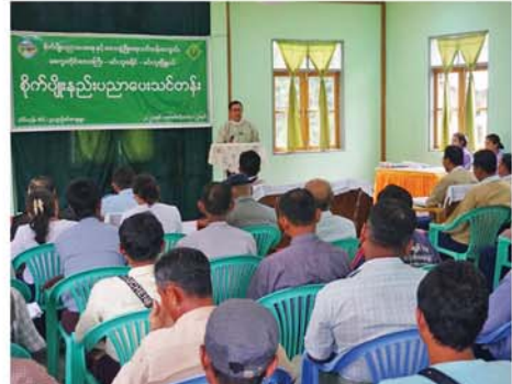
(အောက်ပုံ) (၅၀၀)

စနစ်များ၊ မြေဆီလွှာ ကျန်းမာ ရေးဆောင်ရွက်ရမည့်အချက်များ၊ သန်စွမ်းဖွံ့ဖြိုးတိုးတက်စေရန် သဘာဝမြေဩဇာများ ပြုလုပ် သုံးစွဲနည်းနှင့် ဓာတ်မြေဩဇာများ စနစ်တကျသုံးစွဲရေး၊ သီးနှံစိုက်ပျိုး ရာတွင် မျိုးကောင်းမျိုးသန့်များ ကို စနစ်တကျရွေးချယ်သုံးစွဲ စိုက် ပျိုးရေး၊ အထွက်နှုန်းပိုရရှိရေး၊ သီး နှံများ၏ အရည်အချင်းလကွေ့စာ များ၊ သီးနှံများတွင် ကျရောက် တတ်သည့် ရောဂါပိုးမွှားများ အကြောင်းနှင့် ရောဂါပိုးမွှား အန္တရာယ်ကြိုတင်ကာကွယ်နည်း