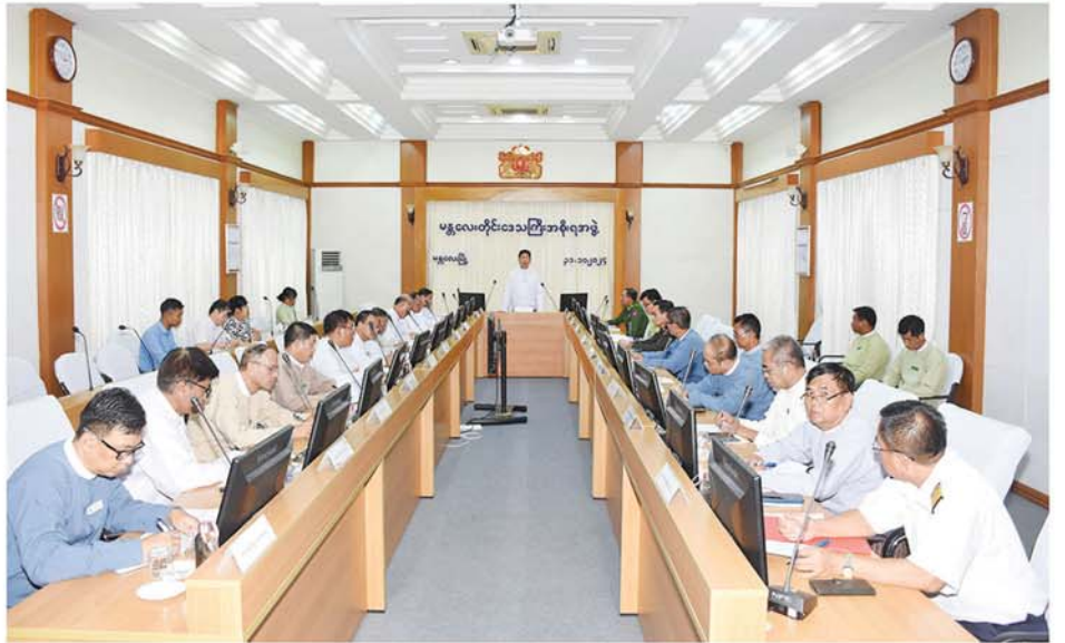
ရွက်သွား ကြရမည်ဖြစ်ပါ လာသည့် သက်ဆိုင်ရာဌာနများ တိုင်းဒေသကြီးအစိုးရအဖွဲ့ဝင် က ပေါင်းစပ်ညှိနှိုင်းဆောင်ရွက် ကြောင်း ပြောကြားခဲ့သည်။ မှ တာဝန်ရှိသူများက ကဏ္ဍ ဝန်ကြီးများက ဖြည့်စွက်ဆွေးနွေး ပေးခဲ့ကြောင်း သိရသည်။ ငှင်းနောက် တက်ရောက် အလိုက် ရှင်းလင်းတင်ပြပြီး ရာ တိုင်းဒေသကြီးဝန်ကြီးချုပ် (မန္တလေးနေ့စဉ်)

မန္တလေး အောက်တိုဘာ ၃၁ ရှိသူများ တက်ရောက်ကြသည်။ သဘာဝဘေးဖြစ်ပွားပြီး လုပ်ငန်းညှိနှိုင်းအစည်းအဝေး၌ မန္တလေးတိုင်းဒေသကြီး အစိုးရအဖွဲ့ဝင် အဖွဲ့ဝင်များနှင့် ချုပ်က အဖွဲ့အမှတ်စဉ်အရ အစည်းအဝေး ပြောကြားရာတွင် သဘာဝဘေး အန္တရာယ် ရာစုနှစ်တိုင်း၏ အကျိုး သက်ရောက်မှုကြောင့် တိုင်း ဒေသကြီးအတွင်း ထိခိုက်ပျက်စီးမှုများနှင့် စစ်လျဉ်း၍ မန္တလေးတိုင်းဒေသ ကြီး ကနဦးလိုအပ်ချက် စစ်တမ်း ကောက်ယူရေး၊ ပျက်စီးဆုံးရှုံးမှု အတည်ပြုရေးနှင့် လိုအပ်ချက် များ ဆန်းစစ်ဖော်ထုတ်ရေး လုပ်ငန်းအဖွဲ့၏ လုပ်ငန်းညှိနှိုင်း အစည်းအဝေးကို ယနေ့မနက် ၉ ဝှက်က မန္တလေးတိုင်းဒေသကြီး အစိုးရအဖွဲ့ရုံး အစည်းအဝေး ခန်းမတွင် ကျင်းပရာ မန္တလေး တိုင်းဒေသကြီး သဘာဝဘေး အန္တရာယ်ဆိုင်ရာစီမံခန့်ခွဲမှုမှ အဖွဲ့ဥက္ကဋ္ဌ၊ တိုင်းဒေသကြီး အစိုးရအဖွဲ့ ဝန်ကြီးချုပ် ဦးမျိုးအောင်၊ တိုင်းဒေသကြီး အစိုးရအဖွဲ့ဝင် ဝန်ကြီးများနှင့် သက်ဆိုင်ရာဌာနများမှ တာဝန်