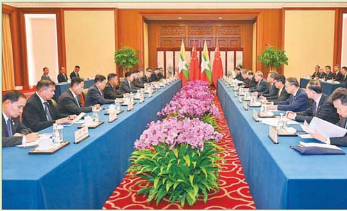
နိုင်ငံတော်စီမံအုပ်ချုပ်ရေးကောင်စီဥက္ကဋ္ဌ နိုင်ငံတော်ဝန်ကြီးချုပ် ဗိုလ်ချုပ်မှူးကြီးမင်းအောင်လှိုင်နှင့် တရုတ်ပြည်သူ့သမ္မတနိုင်ငံဝန်ကြီးချုပ် H.E. Mr. Li Qiang တို့ တွေ့ဆုံဆွေးနွေးစဉ်။