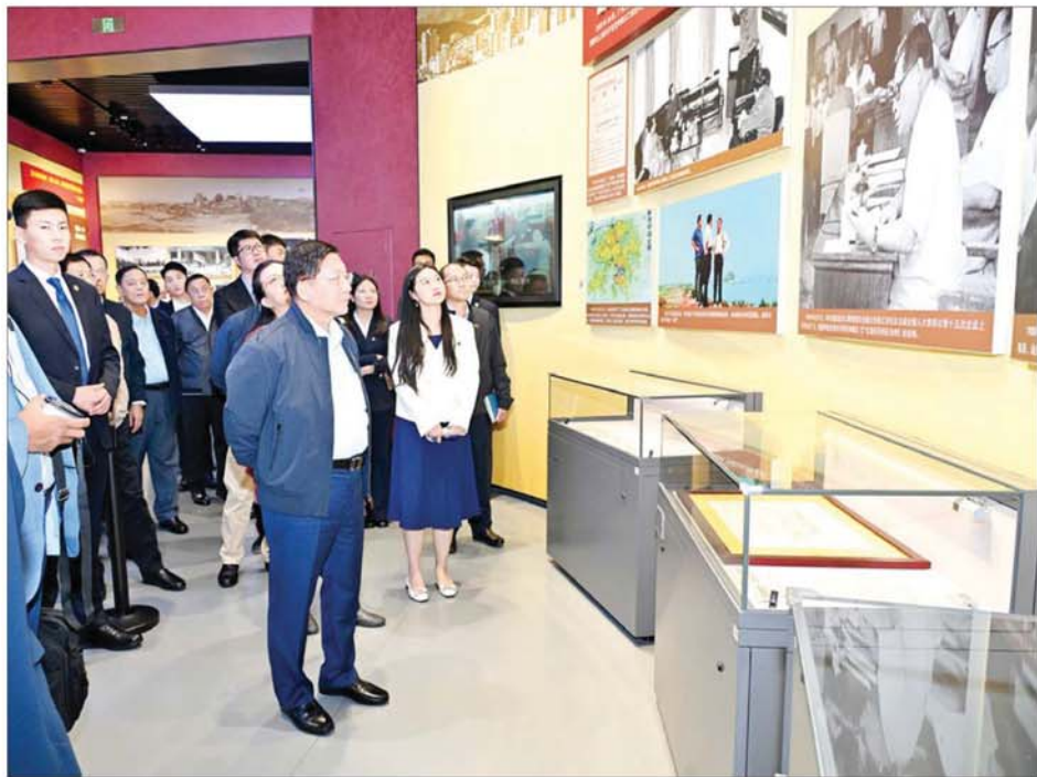
နိုင်ငံတော်စီမံအုပ်ချုပ်ရေးကောင်စီဥက္ကဋ္ဌ နိုင်ငံတော်ဝန်ကြီးချုပ် ဗိုလ်ချုပ်မှူးကြီးမင်းအောင်လှိုင် ဦးဆောင်သည့် မြန်မာအဆင့်မြင့်ကိုယ်စားလှယ်အဖွဲ့ ရုန်းကျန်မြို့ရှိ The Tide Rises in the Pearl River Exhibition Center ၌ ကြည့်ရှုလေ့လာစဉ်။

ပါတီဗဟိုကော်မတီက ချမှတ်ပေးခဲ့သော ပြုပြင်ပြောင်းလဲမှုနှင့် အဆင့်ဆင့် ပြောင်းလဲတိုးတက်လာမှု ပြခန်းများကို လေ့လာကြည့်ရှုခဲ့ပြီး ပြတိုက်မှူးနှင့် ပြကွက်များအလိုက် တာဝန်ခံများ၏ ရှင်းလင်းတင်ပြမှုများအပေါ် သိရှိလိုသည်များကို ပြန်လည်မေးမြန်းဆွေးနွေးပြောကြားသည်။ ညပိုင်းတွင် နိုင်ငံတော်စီမံအုပ်ချုပ်ရေးကောင်စီဥက္ကဋ္ဌ နိုင်ငံတော်ဝန်ကြီးချုပ်နှင့် အဖွဲ့ဝင်များသည် Civic Center သို့ ရောက်ရှိကြပြီး LED Light Show ရောင်စုံမီးအလှများအား နည်းပညာအသုံးပြု၍ လူအများ စိတ်ဝင်စားစေရန် ဆောင်ရွက်ထားရှိမှုကို သွားရောက်ကြည့်ရှုလေ့လာကြသည်။ ထို့နောက် နိုင်ငံတော်စီမံအုပ်ချုပ်ရေးကောင်စီ ဥက္ကဋ္ဌ နိုင်ငံတော်ဝန်ကြီးချုပ်နှင့် အဖွဲ့ဝင်များသည် ပြည်ထောင်စုသမ္မတမြန်မာနိုင်ငံတော်နှင့် စက်မှုလက်မှုလုပ်ငန်းရှင်များအသင်းချုပ် (UMFCCI) မှ တည်ခင်းစည်ခံသည့် ခရီးစဉ်ဂုဏ်ပြုညစာစားပွဲကို အတူတကွ စာမျက်နှာ ၅ သို့ »»