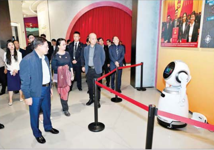
နိုင်ငံတော်စီမံအုပ်ချုပ်ရေးကောင်စီဥက္ကဋ္ဌ နိုင်ငံတော်ဝန်ကြီးချုပ် ဗိုလ်ချုပ်မှူးကြီးမင်းအောင်လှိုင် ဦးဆောင်သည့် မြန်မာအဆင့်မြင့်ကိုယ်စားလှယ်အဖွဲ့ ရှမ်းကျွန်းမြို့ရှိ The Tide Rises in the Pearl River Exhibition Center တွင် ကြည့်ရှုလေ့လာစဉ်။

»» စာမျက်နှာ ၄ မှ တက်ရောက်သုံးဆောင်ခဲ့ကြပြီး ခရီးစဉ်တွင် လိုက်ပါလာသည့် အဖွဲ့ဝင်များအား ရင်းရင်းနှီးနှီး နှုတ်ဆက်ခဲ့ကြသည်။ BYD မော်တော်ကား ထုတ်လုပ်ရေးကုမ္ပဏီ ယနေ့နံနက်ပိုင်းတွင် နိုင်ငံတော်စီမံအုပ်ချုပ်ရေးကောင်စီ ဥက္ကဋ္ဌ နိုင်ငံတော်ဝန်ကြီးချုပ်နှင့် အဖွဲ့ဝင်များသည် ရှမ်းကျွန်းမြို့ရှိ BYD မော်တော်ကား ထုတ်လုပ်ရေးကုမ္ပဏီသို့ ရောက်ရှိလေ့လာကြရာ ကုမ္ပဏီမှ Asia-Pacific Auto Sales Division Country Head of BYD Myanmar ဖြစ်သူ Mrs. Gillian Li နှင့် တာဝန်ရှိသူများက ကြိုဆိုနှုတ်ဆက်ကြပြီး ကုမ္ပဏီမှ ထုတ်လုပ်ထားသည့် BYD-U9 မော်ဒယ်ဖြင့် သရုပ်ပြသပြီး ကုမ္ပဏီပြခန်းအတွင်း၌ ထုတ်လုပ်ထားသည့် ကားအမျိုးအစားများအား တစ်စီးချင်းစီ အလိုက် ရှင်းလင်းပြသ၍ ကုမ္ပဏီ သမိုင်းအကျဉ်းနှင့် လုပ်ငန်းဆောင်ရွက်နေမှု မှတ်တမ်းကို ဖွင့်လှစ်ပြသသည်။ ယင်းနောက် မော်တော်ယာဉ် ဖွဲ့စည်းတည်ဆောက်မှု အစိတ်