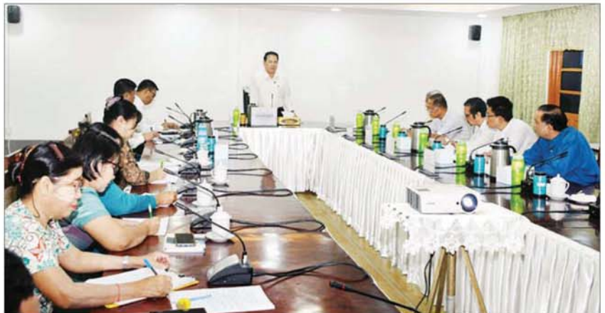
ပြည်ထောင်စုဝန်ကြီး ဦးမောင်မောင်အုန်း ၂၀၂၄ ခုနှစ်အတွက် မြန်မာ့ရုပ်ရှင်ထူးချွန်ဆု ချီးမြှင့်ပွဲအခမ်းအနား အောင်မြင်စွာ ကျင်းပရေး လုပ်ငန်းညှိနှိုင်းအစည်းအဝေးတွင် အမှာစကားပြောကြားစဉ်။

အောင်မြင်စွာကျင်းပ ရေးဦးစွာ ပြည်ထောင်စုဝန်ကြီး က ၂၀၂၄ ခုနှစ်အတွက် မြန်မာ့ရုပ်ရှင်ထူး ချွန်ဆုချီးမြှင့်ပွဲ အခမ်းအနားကို ၂၀၂၅ ခုနှစ် ဖေဖော်ဝါရီလတွင် နေပြည်တော်၌ ကျင်းပပြုလုပ်ရန် စီမံထားရှိပါကြောင်း၊ ၎င်းအခမ်းအနားကို ယခင်နှစ်ကျင်းပခဲ့ သည့် အစဉ်အလာအတိုင်း ခမ်းနား တင့်တယ်စွာ ကျင်းပနိုင်ရေးအတွက် သက်ဆိုင်ရာ ပုဂ္ဂိုလ်များအနေဖြင့် လိုအပ် သည့်များ ကြိုတင်ပြင်ဆင်ထားရှိစေလို ကြောင်း၊ မြန်မာ့ရုပ်ရှင်ထူးချွန်ဆုများ ချီးမြှင့်ရေးနှင့်ပတ်သက်၍ ရသင့်ရထိုက် သည့် အနုပညာရှင်များ ရရှိစေရေးအတွက် ဆုများအကဲဖြတ်စိစစ်ရေးအဖွဲ့ကို စနစ် တကျ ဖွဲ့စည်းတာဝန်ပေးရန်လိုကြောင်း၊ အဆိုပါ စိစစ်ရေးအဖွဲ့တွင် အတ္တကင်းကင်း၊ ပုဂ္ဂိုလ်ရွဲကင်းကင်းဖြင့် ရွေးချယ်ပေးမည့် ပုဂ္ဂိုလ်များအား တာဝန်ပေးအပ်ရန်လိုပါ ကြောင်း၊ အထူးသဖြင့် ၂၀၂၄ ခုနှစ်တွင် ရုံတင်ပြသခဲ့သော ရုပ်ရှင်ဇာတ်ကားများ၌ ပါဝင်ခဲ့သည့် ပုဂ္ဂိုလ်များနှင့် ရုပ်ရှင် ထူးချွန်ဆု ချီးမြှင့်ခံရနိုင်ဖွယ်ရှိသည့် ပုဂ္ဂိုလ်များကို အစကတည်းကပင် ဆုများ အကဲဖြတ်စိစစ်ရေးအဖွဲ့တွင် တာဝန် ပေးအပ်ရန် မပြုသင့်ပါကြောင်း၊ ၎င်းတို့ အား အကဲဖြတ်စိစစ်ရေးအဖွဲ့ တာဝန် ပေးအပ်ပါက မလိုလားအပ်သည့် အထင် အမြင် လွဲမှားမှုများ ကြုံတွေ့ရနိုင်ပါ ကြောင်း၊ ယခုကျင်းပမည့် မြန်မာ့ရုပ်ရှင် ထူးချွန်ဆုချီးမြှင့်ပွဲ အခမ်းအနားကြီးကို ပြန်ကြားရေးဝန်ကြီးဌာနနှင့် မြန်မာနိုင်ငံ ရုပ်ရှင်အစည်းအရုံးတို့က တာဝန်ယူ၊ တာဝန်ခံစိတ်ဖြင့် အောင်မြင်စွာကျင်းပ