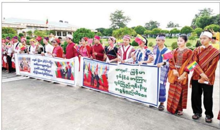
နိုင်ငံတော်စီမံအုပ်ချုပ်ရေးကောင်စီဥက္ကဋ္ဌ နိုင်ငံတော်ဝန်ကြီးချုပ် ဗိုလ်ချုပ်မှူးကြီးမင်းအောင်လှိုင် ဦးဆောင်သည့် မြန်မာအဆင့်မြင့်ကိုယ်စားလှယ်အဖွဲ့အား မြန်မာနိုင်ငံသား တရုတ်နယ်ပွားပြည်သူများ၊ တရုတ်ရိုးရာဇာနင်းနှင့် ခြေဆွဲအကအဖွဲ့၊ တိုင်းရင်းသားယဉ်ကျေးမှုအဖွဲ့များနှင့် အကအဖွဲ့များ၊ ကျောင်းသား ကျောင်းသူများနှင့် ဒေသခံပြည်သူများက ကြိုဆိုနှုတ်ဆက်ကြစဉ်။