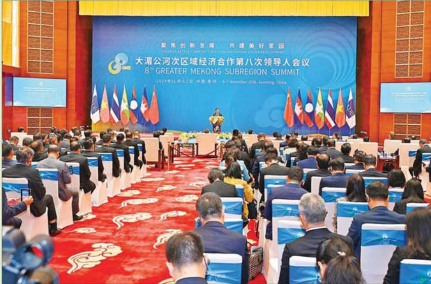
နိုင်ငံတော်စီမံအုပ်ချုပ်ရေးကောင်စီဥက္ကဋ္ဌ နိုင်ငံတော်ဝန်ကြီးချုပ် ဗိုလ်ချုပ်မှူးကြီးမင်းအောင်လှိုင် အဖွဲ့အကြိမ်မြောက် မဟာခေါင်ဒေသခွဲ (ဂျီအမ်အက်စ်) ထိပ်သီးအစည်းအဝေးတွင် အမှာစကားပြောကြားစဉ်။