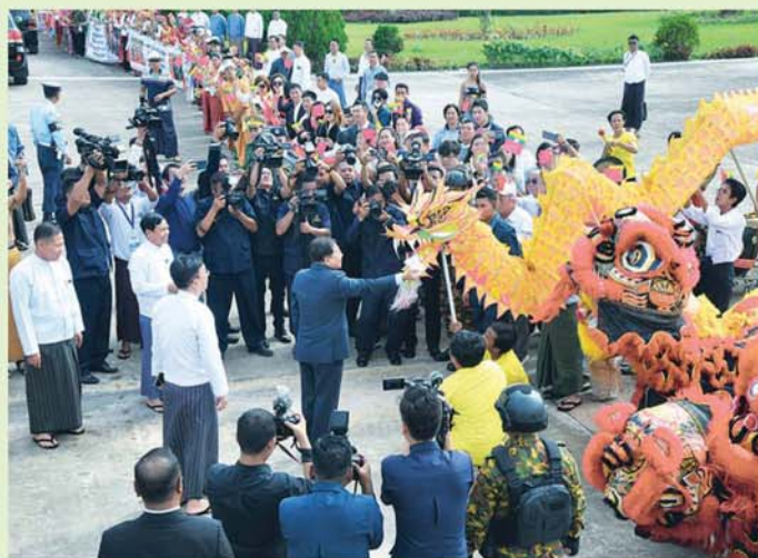
နိုင်ငံတော်စီမံအုပ်ချုပ်ရေးကောင်စီဥက္ကဋ္ဌ နိုင်ငံတော်ဝန်ကြီးချုပ် ဗိုလ်ချုပ်မှူးကြီးမင်းအောင်လှိုင် ဦးဆောင်သော မြန်မာအဆင့်မြင့်ကိုယ်စားလှယ်အဖွဲ့အား နေပြည်တော်တပ်မတော်လေဆိပ်၌ တရုတ်ရိုးရာ နဂါးနှင့်ခြင်္သေ့အကအဖွဲ့တို့ဖြင့် ဂုဏ်ပြုကြိုဆိုနေစဉ်။