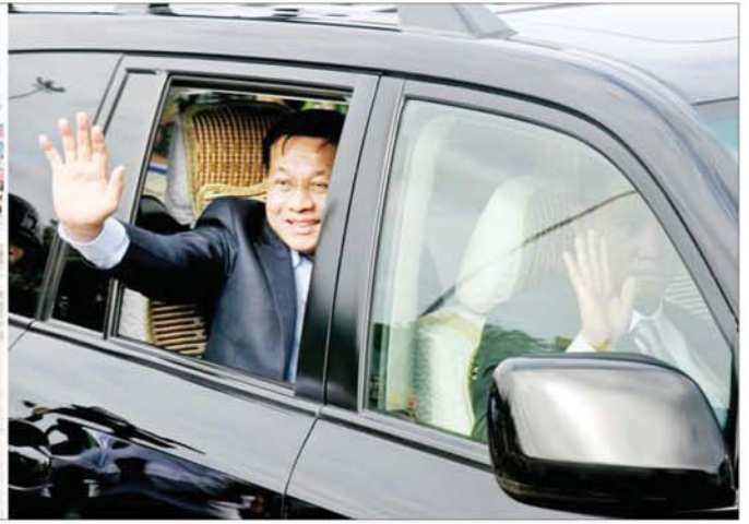
နိုင်ငံတော်စီမံအုပ်ချုပ်ရေးကောင်စီဥက္ကဋ္ဌ နိုင်ငံတော်ဝန်ကြီးချုပ် ဗိုလ်ချုပ်မှူးကြီးမင်းအောင်လှိုင်အား ပြည်သူလူထုများက သောင်းသောင်းဖြဖြ ကြိုဆိုနှုတ်ဆက်စဉ်။