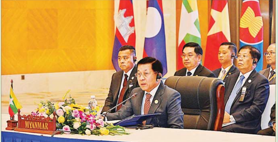
(၁၁)ကြိမ်မြောက် ကမ္ဘောဒီးယား-လာအို-မြန်မာ-ဗီယက်နမ် ပူးပေါင်းဆောင်ရွက်မှု(စီအယ်လ်အမ်ဗီ)ထိပ်သီးအစည်းအဝေးဥက္ကဋ္ဌ နိုင်ငံတော်စီမံအုပ်ချုပ်ရေးကောင်စီဥက္ကဋ္ဌ နိုင်ငံတော်ဝန်ကြီးချုပ် ဗိုလ်ချုပ်မှူးကြီးမင်းအောင်လှိုင် (၁၁)ကြိမ်မြောက် ကမ္ဘောဒီးယား-လာအို - မြန်မာ - ဗီယက်နမ် ပူးပေါင်းဆောင်ရွက်မှု(စီအယ်လ်အမ်ဗီ)ထိပ်သီးအစည်းအဝေးတွင် အဖွင့်အမှာစကားပြောကြားစဉ်။