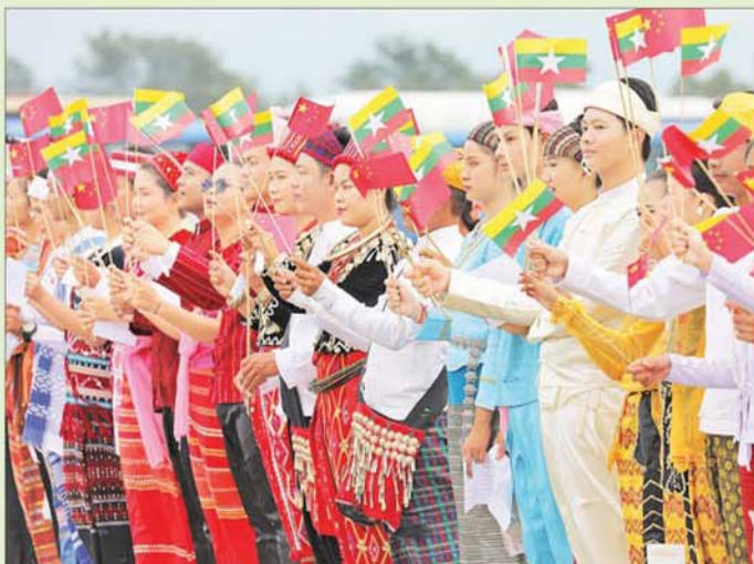
နိုင်ငံတော်စီမံအုပ်ချုပ်ရေးကောင်စီဥက္ကဋ္ဌ နိုင်ငံတော်ဝန်ကြီးချုပ် ဗိုလ်ချုပ်မှူးကြီးမင်းအောင်လှိုင် ဦးဆောင်သော မြန်မာအဆင့်မြင့်ကိုယ်စားလှယ်အဖွဲ့အား နေပြည်တော်တပ်မတော်လေဆိပ်၌ တိုင်းရင်းသားပြည်သူများက လှိုက်လှဲရွေးထွေးစွာ သောင်းသောင်းဖြူဖြူကြိုဆိုနေစဉ်။