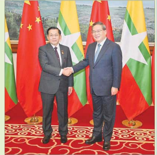
နိုင်ငံတော်စီမံအုပ်ချုပ်ရေးကောင်စီဥက္ကဋ္ဌ နိုင်ငံတော်ဝန်ကြီးချုပ် ဗိုလ်ချုပ်မှူးကြီးမင်းအောင်လှိုင်အား တရုတ်ပြည်သူ့သမ္မတနိုင်ငံဝန်ကြီးချုပ် H.E. Mr. Li Qiang က ကြိုဆိုနှုတ်ဆက်စဉ်။