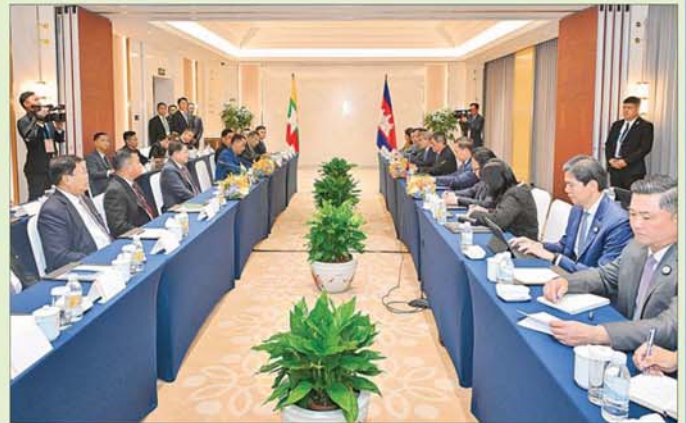
နိုင်ငံတော်စီမံအုပ်ချုပ်ရေးကောင်စီဥက္ကဋ္ဌ နိုင်ငံတော်ဝန်ကြီးချုပ် ဗိုလ်ချုပ်မှူးကြီးမင်းအောင်လှိုင်နှင့် ကမ္ဘောဒီးယားနိုင်ငံဝန်ကြီးချုပ် H.E.Mr. Hun Manet တို့ တွေ့ဆုံဆွေးနွေးစဉ်။