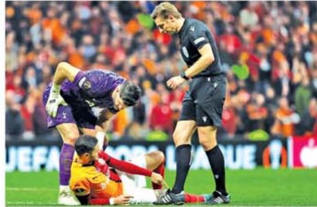
၂၀၂၃-၂၀၂၄ ခုနှစ် ဝက်စဖီးယာ ဘောလုံးရာသီအထိ ဖြည့်ပွဲစုံ ၈၇ ပွဲကစားပြီး ၆၁ဂိုး သွင်းယူကာ ခြေစွမ်းပြထားသည်။

လန်ဒန် နိုဝင်ဘာ ၁၀ ဂါလာတာစာရေးအသင်း တိုက်စစ်မှူး ဒီကာဒီ ခူးအရွတ် ဒဏ်ရာကြောင့် ကာလရှည် အနားယူရမယ့်ရှိသည်။ (ယာဝု) အဆိုပါ တိုက်စစ်မှူးသည် ယူရိုပါလိဂ်ပွဲစဉ်အဖြစ် ဂါလာတာ စာရေးအသင်းက စပါးအသင်း အား သုံးဂိုး၊ နှစ်ဂိုးဖြင့် အနိုင်ရရှိ ခဲ့သည့်ပွဲစဉ်တွင် ဒဏ်ရာပြင်းထန်