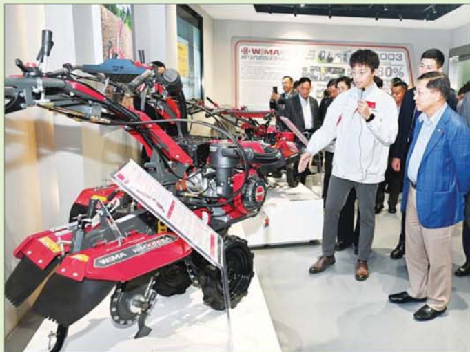
နိုင်ငံတော်စီမံအုပ်ချုပ်ရေးကောင်စီဥက္ကဋ္ဌ နိုင်ငံတော်ဝန်ကြီးချုပ် ဗိုလ်ချုပ်မှူးကြီးမင်းအောင်လှိုင် နှင့် အဖွဲ့ဝင်များ Weima လယ်ယာစက်မှုထုတ်ကုန်ကုမ္ပဏီမှ ထုတ်လုပ်ထားရှိသည့် လယ်ယာ လုပ်ငန်းသုံး ထုတ်ကုန်ပစ္စည်းများ ခင်းကျင်းပြသထားမှုကို ကြည့်ရှုလေ့လာကြစဉ်။