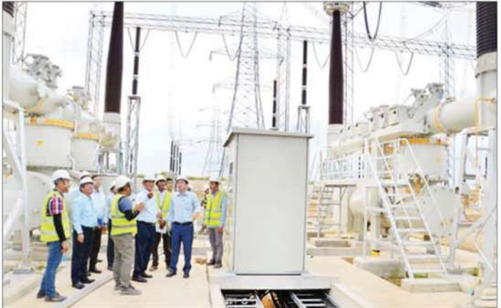
ထို့နောက် ဓာတ်အားပေးစက်ရုံ Switchyard အတွင်း လက်ရှိဓာတ်အားလှိုင်းများနှင့် ထရန်စဖော်မာများ၏ ဝန်အားထိန်းညှိလွှတ်ပေးနေမှု၊ ဓာတ်အားပေးစက်ရုံ၏ ဓာတ်အားထိန်းချုပ်ခန်းနှင့် တာဘိုင်စက်ခန်းများအတွင်း ဓာတ်အားပေးစက်များ မောင်းနှင်၍ နိုင်ငံတော်ဓာတ်အားစနစ်သို့ ချိတ်ဆက် ပြီး လျှပ်စစ်ဓာတ်အားများ ထုတ်လုပ်လွှတ်ပေးနေ မှု၊ ရေလျှောင့်တစ်အတွင်း ရေဝင်ရောက်မှု၊ ရေသိုလျှောင့်ထားရှိမှု၊ ရေယူအဆောက်အအုံ၊ ရေပိုလွှဲ နှင့် တစ်၏ကြိုင်ခံ့မှုအခြေအနေတို့ကို လှည့်လည်

လျှပ်စစ်စွမ်းအားဝန်ကြီးဌာန ပြည်ထောင်စုဝန်ကြီး ဦးဉာဏ်ထွန်းသည် ယမန်နေ့ နံနက်ပိုင်းတွင် မန္တလေးတိုင်းဒေသကြီး ကျောက်ဆည်မြို့နယ်ရှိ ရဲရွာရေအားလျှပ်စစ် ဓာတ်အားပေးစက်ရုံ၏ လျှပ်စစ် ဓာတ်အားထုတ်လုပ်နေမှုနှင့် မိတ္ထီလာမြို့နယ်ရှိ ၅၀၀ ကေဗီ ကံကောင်းဓာတ်အားခွဲရုံစီမံကိန်းလုပ်ငန်း တိုးတက်မှုတို့ကို သွားရောက်ကြည့်ရှုစစ်ဆေးသည်။