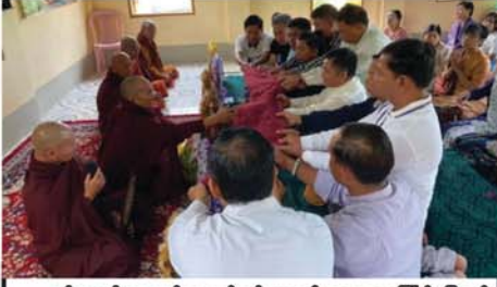
နန်းတော်ရှေ့ငယ်သူငယ်ချင်းများ၏ အဖွဲ့အကြိမ်မြောက် စုပေါင်းဘုံကထိန်ကို ပုသိမ်ကြီးမြို့နယ်၊ အရှေ့ရမ်းရိုးမ၊ သာဓိတောင်ရှိ နဂါးညီနောင်ကျောင်းတိုက်တွင် နိုဝင်ဘာ ၁၀ ရက်က ကျင်းပရာ နန်းတော်ရှေ့ငယ်သူငယ်ချင်းများက ကထိန်လှူသက်န်းဆက်ကပ်လှူဒါန်းစဉ်။ (၀၄၁)

ဆောက်တည်ပြီး ကြွရောက်လာသည့် ဆရာတော်၊ သံဃာတော်များထံမှ ပရိတ်တရားတော်များ နာယူကြည့်ညိုကြသည်။ ဆက်လက်၍ ကထိန်အလှူရှင်များက ဆရာတော်၊ သံဃာတော်များထံ ကထိန်လှူသက်န်းနှင့် အိန်အရံ လှူဖွယ်ဝတ္ထုအစုစုအား ဆက်ကပ်လှူဒါန်းကြပြီး ဆရာတော်ဦးဩဘာသက အနုမောဒနာတရား ဟောကြားတော်မူကာ လှူဒါန်းမှုအစုစုအတွက် ရေစက်သွန်းချ အမျှပေးဝေကာ အခမ်းအနားကို ရုပ်သိမ်းခဲ့ကြောင်း သိရသည်။ (ကဆ)