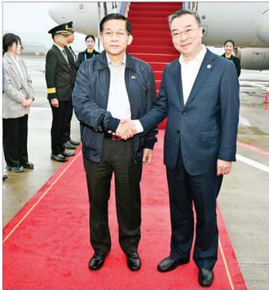
နိုင်ငံတော်စီမံအုပ်ချုပ်ရေးကောင်စီဥက္ကဋ္ဌ နိုင်ငံတော်ဝန်ကြီးချုပ် ဗိုလ်ချုပ်မှူးကြီး မင်းအောင်လှိုင်အား ချီချင်မြို့ ကျန်းပေးအပြည်ပြည်ဆိုင်ရာလေဆိပ်၌ ချီချင်မြို့ ဒုတိယမြို့တော်ဝန် Mr. Shang Kui က ပို့ဆောင်နှုတ်ဆက်စဉ်။

( ၃-၉-၂၀၂၄ ရက်နေ့တွင် နိုင်ငံတော်စီမံအုပ်ချုပ်ရေးကောင်စီဥက္ကဋ္ဌ နိုင်ငံတော် ဝန်ကြီးချုပ် ဗိုလ်ချုပ်မှူးကြီး မင်းအောင်လှိုင် ရှမ်းပြည်နယ် အစိုးရအဖွဲ့ဝင်များ၊ ပြည်နယ်နှင့် ခရိုင်အဆင့် ဌာနဆိုင်ရာတာဝန်ရှိသူများအား ပြောကြားသည့် အမှာ စကားမှ ကောက်နုတ်ချက် )