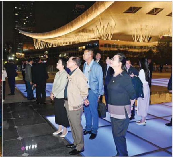
နိုင်ငံတော်စီမံအုပ်ချုပ်ရေးကောင်စီဥက္ကဋ္ဌ နိုင်ငံတော်ဝန်ကြီးချုပ် ဗိုလ်ချုပ်မှူးကြီးမင်းအောင်လှိုင် ဦးဆောင်သည့် မြန်မာအဆင့်မြင့်ကိုယ်စားလှယ်အဖွဲ့ Civic Center ၌ LED Light Show ရောင်စုံမီးအလှများအား နည်းပညာအသုံးပြု၍ လူအများ စိတ်ဝင်စားစေရန် ဆောင်ရွက်ထားရှိမှုကို ကြည့်ရှုလေ့လာစဉ်။

»» စာမျက်နှာ ၃ မှ သွားရောက် လေ့လာကြည့်ရှုကြရာ ပြတိုက်မှူး Mr. Huang Chen နှင့် တာဝန်ရှိသူများက ကြိုဆိုနှုတ်ဆက်ကြသည်။ ယင်းနောက် နိုင်ငံတော်စီမံအုပ်ချုပ်ရေးကောင်စီ ဥက္ကဋ္ဌ နိုင်ငံတော်ဝန်ကြီးချုပ်နှင့် အဖွဲ့ဝင်များအား ရုန်းကျန်မြို့၏ ခေတ်အဆက်ဆက် ပြုပြင်ပြောင်းလဲတိုးတက်လာမှု သမိုင်းမှတ်တမ်းကို ဖွင့်လှစ်ပြသသည်။ ဆက်လက်၍ နှစ်အလိုက် ပြောင်းလဲလာသည့် ကွမ်းကျီးလူနေမှုဘဝ၊ ပညာရေးစနစ်၊ အုပ်ချုပ်ရေးစနစ်၊ ကွမ်းတုံ့ပြည်နယ်၏ သင်္ကေတ၊ ၁၉၈၀ နောက်ပိုင်း ပြည်တွင်း၊ ပြည်ပတင်ပို့ရောင်းချလျက်ရှိသည့် ချည်ထည်ပြခန်းအပါအဝင် ကဏ္ဍစုံ၌ ဖွံ့ဖြိုးတိုးတက်လာသည့် မှတ်တမ်းဓာတ်ပုံများ၊ သရုပ်ပြပုံများ၊ အထူးစီးပွားရေးစုနံ့ စတင်ထုထောင်ခဲ့မှုမှတ်တမ်းများ၊ အခြေခံ အဆောက်အအုံ စတင်ဆောက်လုပ်ခဲ့သည့် မှတ်တမ်းဓာတ်ပုံများနှင့် ပစ္စည်းများခင်းကျင်းပြသထားရှိမှုနှင့် ပြုပြင်ပြောင်းလဲမှုကာလတစ်လျှောက်