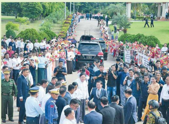
နိုင်ငံတော်စီမံအုပ်ချုပ်ရေးကောင်စီဥက္ကဋ္ဌ နိုင်ငံတော်ဝန်ကြီးချုပ် ဗိုလ်ချုပ်မှူးကြီးမင်းအောင်လှိုင် ဦးဆောင်သော မြန်မာအဆင့်မြင့်ကိုယ်စားလှယ်အဖွဲ့အား နေပြည်တော်တပ်မတော်လေဆိပ်၌ တိုင်းရင်းသားပြည်သူများက လှိုက်လှဲရွေးထွေးစွာ သောင်းသောင်းဖြူဖြူကြိုဆိုနေစဉ်။