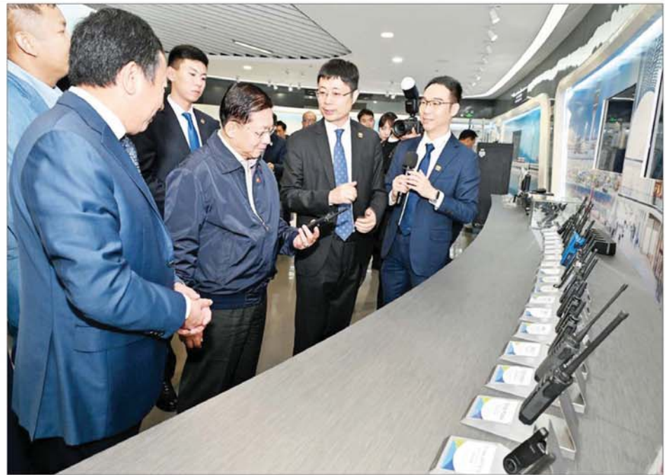
နိုင်ငံတော်စီမံအုပ်ချုပ်ရေးကောင်စီဥက္ကဋ္ဌ နိုင်ငံတော်ဝန်ကြီးချုပ် ဗိုလ်ချုပ်မှူးကြီးမင်းအောင်လှိုင် ဦးဆောင်သည့် မြန်မာအဆင့်မြင့် ကိုယ်စားလှယ်အဖွဲ့၊ ရှန်းကျန်မြို့ရှိ Hytera Communications Corporation Limited တွင် ကြည့်ရှုလေ့လာစဉ်။

စေရေး ဆောင်ရွက်နိုင်ခဲ့မှုများ အတွက် ဆုတ်ဆိပ်ရရှိခဲ့မှုများ၊ ခေတ်အလိုက် ပြောင်းလဲတိုးတက် လာသည့် နည်းပညာနှင့်အတူ ဆန်းသစ်တီထွင် ထုတ်လုပ်ထား ရှိပြီး ဈေးကွက်အတွင်း ဖြန့်ဖြူး ပေးလျက်ရှိသည့် ဆက်သွယ်ရေး ပစ္စည်းကိရိယာများ စသည်တို့ကို လိုက်လံရှင်းလင်း တင်ပြကြရာ နိုင်ငံတော်စီမံအုပ်ချုပ်ရေးကောင်စီ ဥက္ကဋ္ဌ နိုင်ငံတော်ဝန်ကြီးချုပ်က သိရှိလိုသည်များနှင့် အကြံပြုချက် များကို ပြန်လည်ဆွေးနွေးခဲ့သည်။ The Tide Rises in the Pearl River Exhibition Center ထို့နောက် နိုင်ငံတော်စီမံအုပ်ချုပ် ရေးကောင်စီဥက္ကဋ္ဌ နိုင်ငံတော် ဝန်ကြီးချုပ်နှင့် အဖွဲ့ဝင်များသည် ကွမ်တုံပြည်နယ်၏ ပြုပြင် ပြောင်းလဲမှုနှင့် တံခါးဖွင့်စီးပွားရေး ဆောင်ရွက်မှုကို အကောင်အထည် ဖော်ခဲ့သည့် နှစ် ၄၀ မြောက် အထိမ်းအမှတ်အဖြစ် ဖွင့်လှစ်ထား သည့် "The Tide Rises in the Pearl River Exhibition Center" သို့