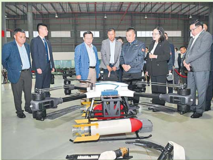
နိုင်ငံတော်စီမံအုပ်ချုပ်ရေးကောင်စီဥက္ကဋ္ဌ နိုင်ငံတော်ဝန်ကြီးချုပ် ဗိုလ်ချုပ်မှူးကြီးမင်းအောင်လှိုင် Zhongyue Aviation UAV Firefighting-Drone Co.,Ltd. မှ ထုတ်လုပ်ထားသော လူမှုကယ်ဆယ်ရေး လုပ်ငန်းများတွင်အသုံးပြုသည့် အဆင့်မြင့်ဒရုန်းများ ခင်းကျင်းပြသထားမှုကို ကြည့်ရှုလေ့လာစဉ်။