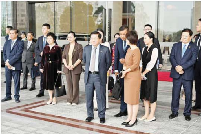
နိုင်ငံတော်စီမံအုပ်ချုပ်ရေးကောင်စီဥက္ကဋ္ဌ နိုင်ငံတော်ဝန်ကြီးချုပ် ဗိုလ်ချုပ်မှူးကြီးမင်းအောင်လှိုင် ဦးဆောင်သည့် မြန်မာအဆင့်မြင့်ကိုယ်စားလှယ်အဖွဲ့ BYD မော်တော်ကားထုတ်လုပ်ရေးကုမ္ပဏီမှ ထုတ်လုပ်ထားသည့် BYD-U9 မော်ဒယ်ဖြင့် သရုပ်ပြသမှုကို ကြည့်ရှုလေ့လာစဉ်။