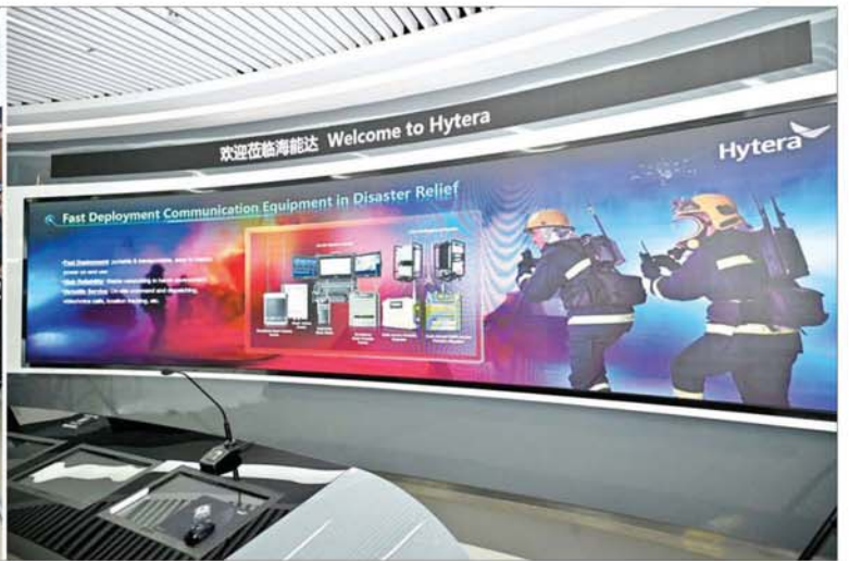
နိုင်ငံတော်စီမံအုပ်ချုပ်ရေးကောင်စီဥက္ကဋ္ဌ နိုင်ငံတော်ဝန်ကြီးချုပ် ဗိုလ်ချုပ်မှူးကြီးမင်းအောင်လှိုင် ဦးဆောင်သည့် မြန်မာအဆင့်မြင့်ကိုယ်စားလှယ်အဖွဲ့ ရှန်းကျန်မြို့ရှိ Hytera Communications Corporation Limited ဌာနကြည့်ရှုလေ့လာစဉ်။