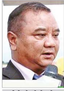
ဗိုလ်ချုပ်စော်မင်းထွန်း