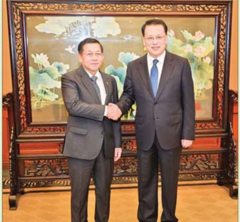
နိုင်ငံတော်စီမံအုပ်ချုပ်ရေးကောင်စီဥက္ကဋ္ဌ နိုင်ငံတော်ဝန်ကြီးချုပ် ဗိုလ်ချုပ်မှူးကြီးမင်းအောင်လှိုင်နှင့် တရုတ်ကွန်မြူနစ်ပါတီဗဟိုကော်မတီ ပေါလစ်ဗျူရှိအဖွဲ့ဝင်၊ ချုံချင်မြို့နယ်ပါတီကော်မတီအတွင်းရေးမှူး Mr.Yuan Jiajun တို့ ရင်းရင်းနှီးနှီးနှုတ်ဆက်စဉ်။