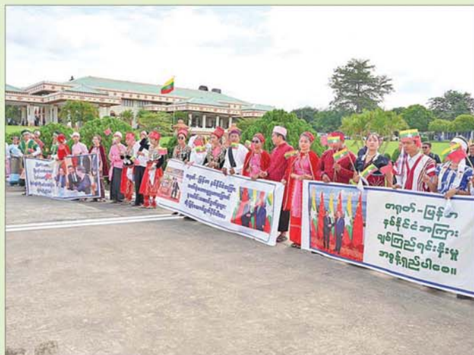
နိုင်ငံတော်စီမံအုပ်ချုပ်ရေးကောင်စီဥက္ကဋ္ဌ နိုင်ငံတော်ဝန်ကြီးချုပ် ဗိုလ်ချုပ်မှူးကြီးမင်းအောင်လှိုင် ဦးဆောင်သော မြန်မာအဆင့်မြင့်ကိုယ်စားလှယ်အဖွဲ့၏ ကြိုးပမ်းဆောင်ရွက်မှုများအပေါ် တိုင်းရင်းသား ပြည်သူလူထုက အားပေးထောက်ခံဂုဏ်ပြုကြိုဆိုနေစဉ်။