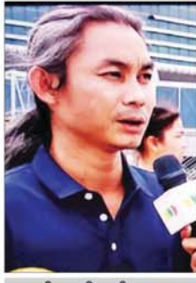
ဦးနောင်တော်လေး

ပတ်သက်ပြီး တရုတ်နိုင်ငံမှာ မြန်မာနိုင်ငံကိုလာပြီး ရင်းနှီးမြုပ်နှံချင် တဲ့စီးပွားရေးလုပ်ငန်းရှင်တွေနဲ့ကျွန်တော်တို့ကူမင်းနဲ့ချုံ့ချင်မှာလည်း တွေ့ဆုံခဲ့ပါတယ်။ အောင်မြင်မှုရခဲ့ပါတယ်။ မြန်မာနိုင်ငံကို လာရောက်ပြီး စီးပွားရေးရင်းနှီးမြုပ်နှံလို့မူ စိတ်ဝင်စားတဲ့သူတွေများပါတယ်။ ကျွန်တော် တို့အနေနဲ့က တရုတ်နိုင်ငံမှာ ဆောင်ရွက်ခဲ့တာတွေကို Action Plan အနေနဲ့သက်ဆိုင်ရာတာဝန်ရှိသူတွေက တက်တက်ကြွကြွလိုက်လုပ်ဖို့ပဲ လိုအပ်တယ်လို့မြင်ပါတယ်။ တရုတ်ရဲ့ One Belt One Road စီမံကိန်း စတဲ့ မြန်မာနဲ့ဆိုင်တဲ့ CMR မြန်မာ-တရုတ်စီးပွားရေးစင်္ကြံစီမံကိန်း တွေနဲ့ပတ်သက်ပြီးလည်း မကြာမီဖို့မြင်လာမယ်လို့ မျှော်မှန်းပါတယ်။ လူမှုရေးပိုင်းနဲ့ပတ်သက်ပြီး ပညာရေးကဏ္ဍဖြစ်ပါတယ်။ ပညာရေး ကဏ္ဍမှာ တရုတ်နိုင်ငံကနေ မြန်မာနိုင်ငံကို ပြည်နယ်အဆင့်မှာရော ဗဟိုအစိုးရအဆင့်မှာပါ ကျွန်တော်တို့ ပညာတော်သင်အဖွဲ့တွေပိုပြီး တော့ခေါ်မှာဖြစ်ပါတယ်။ မြန်မာနိုင်ငံ လူမှုစီးပွားဘဝမြင့်မားတိုးတက်စေ ရေးကို ဆက်လက်ပြီး ကူညီဆောင်ရွက်ပါမယ်။ ခရီးစဉ်ရဲ့အနှစ်ချုပ်ကို ပြောရမယ်ဆိုရင် ခရီးစဉ်ဟာ တရုတ်နိုင်ငံတင်မကဘဲ လာအိုနိုင်ငံ၊ ထိုင်းနိုင်ငံ၊ ကမ္ဘောဒီးယားနိုင်ငံတို့ရဲ့ ဝန်ကြီးချုပ်တို့နဲ့ဆွေးနွေးခဲ့တာဖြစ် ပါပါတယ်။ ခရီးစဉ်ဟာ မြန်မာပြည်သူလူထုရဲ့ လူမှုစီးပွားဘဝ မြင့်တက် စေရေးအတွက် အထူးကိုပဲ အောင်မြင်တဲ့ခရီးစဉ်တစ်ခုဖြစ်တယ်လို့ ကျွန်တော် ပြောချင်ပါတယ်။