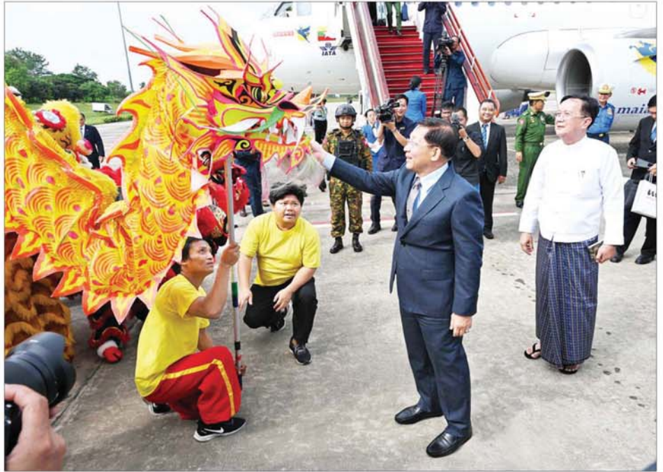
နိုင်ငံတော်စီမံအုပ်ချုပ်ရေးကောင်စီဥက္ကဋ္ဌ နိုင်ငံတော်ဝန်ကြီးချုပ် ဗိုလ်ချုပ်မှူးကြီးမင်းအောင်လှိုင်အား တရုတ်ရိုးရာနဂါးနှင့် ခြင်္သေ့အက အဖွဲ့က ကြိုဆိုနှုတ်ဆက်ကြစဉ်။

နှစ်နိုင်ငံအကြား ဘက်စုံမဟာ ဗျူဟာမြောက် ပူးပေါင်းဆောင် ရွက်မှုများ တိုးမြှင့်ဆောင်ရွက်နိုင် ပါစေ” “တရုတ်-မြန်မာနှစ်နိုင်ငံ ဆက်ဆံရေး ပိုမိုတိုးတက်အောင် ဆောင်ရွက်ခဲ့သည့် နိုင်ငံတော်စီမံ အုပ်ချုပ်ရေးကောင်စီဥက္ကဋ္ဌ နိုင်ငံ တော်ဝန်ကြီးချုပ် ဗိုလ်ချုပ်မှူးကြီး မင်းအောင်လှိုင်အား လိုက်လံရှာ ကြိုဆိုပါသည်” “တရုတ်မြန်မာ ကြိုကြည့်ရှာ တွဲလက်ဖြစ်ပါစေ” “မြန်မာနိုင်ငံ ဘက်စုံဖွံ့ဖြိုး တိုးတက်ရေးအတွက် ကြိုးပမ်း ဆောင်ရွက်ခဲ့သော ဗိုလ်ချုပ်မှူး ကြီး မင်းအောင်လှိုင်အား လိုက်လံ ရွာကြိုဆိုပါစေ” စသည့် ဆိုင်းဘုတ် များ ကိုင်ဆောင်၍ လည်းကောင်း၊ “တရုတ်-မြန်မာ ချစ်ကြည်ရေး အခွန်ရှည်တည်တံ့ပါစေ” “အမျိုး၊ ဘာသာ၊ သာသနာအတွက် ကြိုးပမ်း ဆောင်ရွက်နေသည့် ဗိုလ်ချုပ်မှူးကြီး မင်းအောင်လှိုင် ကျန်းမာပါစေ” “နိုင်ငံတော်စီမံ အုပ်ချုပ်ရေးကောင်စီဥက္ကဋ္ဌ နိုင်ငံ တော်ဝန်ကြီးချုပ် ဗိုလ်ချုပ်မှူးကြီး မင်းအောင်လှိုင် ကျန်းမာပါစေ” “တရုတ်-မြန်မာ ချစ်ကြည်ရေး နိုင်ငံဖြစ်ပါစေ” “ဆွေမျိုးပေါက်ပေါက် ချစ်ကြည်ရေး အခွန်ရှည်ပါစေ” စသည့် ကြွေးကြော်သံများကို ကြွေးကြော်၍ လည်းကောင်း၊ တရုတ်-မြန်မာ နှစ်နိုင်ငံအလင်ငယ် များ ဝှေ့ယမ်း၍ လည်းကောင်း သောင်းသောင်းဖြဖြ ကြိုဆိုနှုတ်ပြု နှုတ်ဆက်ခဲ့ကြကြောင်း သိရ သည်။ သတင်းစဉ်