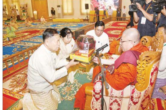
နိုင်ငံတော်စီမံအုပ်ချုပ်ရေးကောင်စီဥက္ကဋ္ဌ နိုင်ငံတော်ဝန်ကြီးချုပ် ဗိုလ်ချုပ်မှူးကြီးမင်းအောင်လှိုင်နှင့် ဇနီး ဒေါ်ကြူကြူလှက ထိန်အလှူခံကျောင်း နေပြည်တော်ဥက္ကဋ္ဌရသီရိမြို့နယ် ဝဇီရာနန္ဒသုဗောဓာရုံကျောင်းတိုက် ပါမောက္ခချုပ်ဆရာတော်ကြီး ဒေါက်တာ ဘဒ္ဒန္တ နန္ဒမာလာဘိဝံသထံ ကထိန်လှူသက်န်းနှင့် လှူဖွယ်ပစ္စည်းများ ဆက်ကပ်လှူဒါန်းစဉ်။