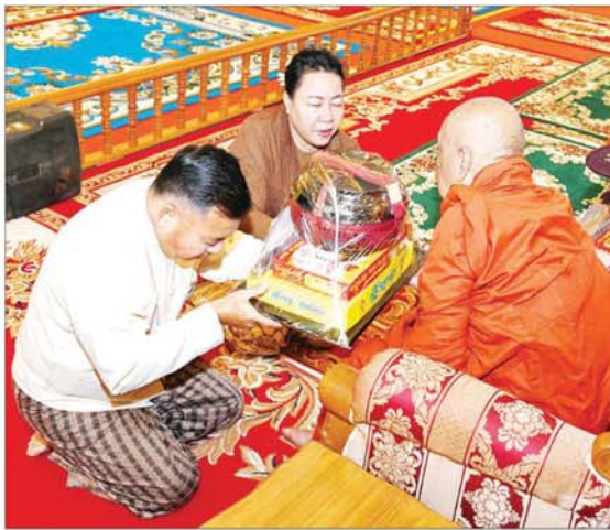
နိုင်ငံတော်စီမံအုပ်ချုပ်ရေးကောင်စီ တွဲဖက်အတွင်းရေးမှူး ဗိုလ်ချုပ်ကြီး ရဲဝင်းဦးနှင့်ဇနီး ဆရာတော်ထံ ကထိန်သင်္ကန်းနှင့် လှူဖွယ်ပစ္စည်းများ ဆက်ကပ် လှူဒါန်းစဉ်။