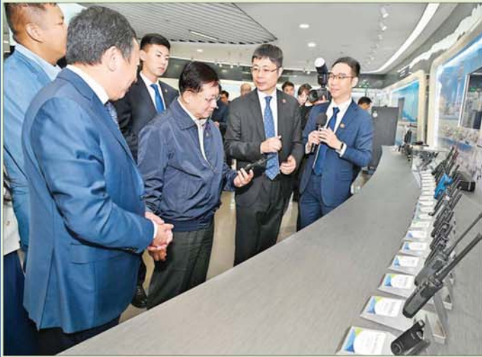
နိုင်ငံတော်စီမံအုပ်ချုပ်ရေးကောင်စီဥက္ကဋ္ဌ နိုင်ငံတော်ဝန်ကြီးချုပ် ဗိုလ်ချုပ်မှူးကြီးမင်းအောင်လှိုင် ရုံးကျန်ဖြန့်ဖြူးရုံ Hytera Communications Corporation Limited တွင် ကြည့်ရှုလေ့လာစဉ်။