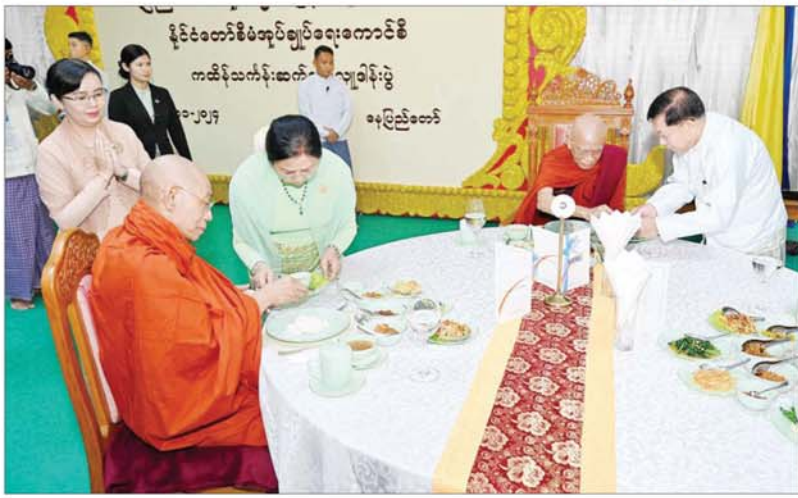
နိုင်ငံတော်စီမံအုပ်ချုပ်ရေးကောင်စီဥက္ကဋ္ဌ နိုင်ငံတော်ဝန်ကြီးချုပ် ဗိုလ်ချုပ်မှူးကြီးမင်းအောင်လှိုင်နှင့် ဇနီး ဒေါ်ကြူကြူလှ သန့်လှိုင်မင်းကျောင်းဆရာတော်ကြီး ဒေါက်တာ တက္ကသိုလ်ဗဟိုဘိဝံသ အမှူးပြုသည့် ဆရာတော် သံဃာတော်များအား နေ့ဆွမ်းဆက်ကပ်လှူဒါန်းစဉ်။