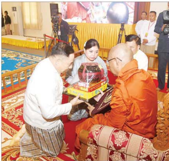
နိုင်ငံတော်စီမံအုပ်ချုပ်ရေးကောင်စီအဖွဲ့ဝင် ဒုတိယဗိုလ်ချုပ်ကြီး ရာပြည့်နှင့် ဇနီး ဆရာတော်ထံ ကထိန်သင်္ကန်းနှင့် လှူဖွယ်ပစ္စည်းများ ဆက်ကပ်လှူဒါန်းစဉ်။