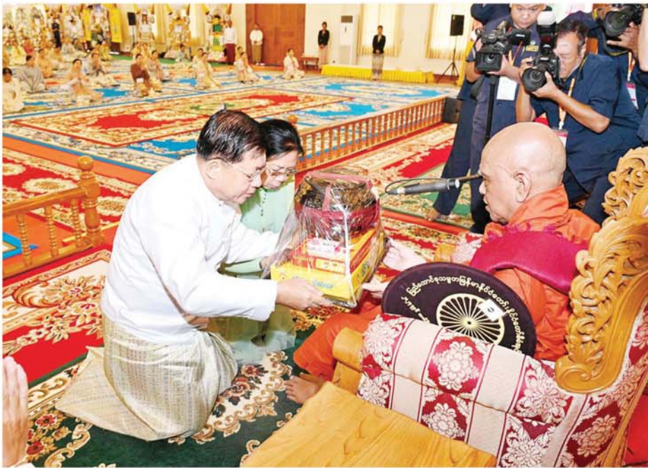
နိုင်ငံတော်စီမံအုပ်ချုပ်ရေးကောင်စီဥက္ကဋ္ဌ နိုင်ငံတော်ဝန်ကြီးချုပ် ဗိုလ်ချုပ်မှူးကြီးမင်းအောင်လှိုင်နှင့် ဇနီး ဒေါ်ကြူကြူလှ သန်လျင် မင်းကျောင်းဆရာတော်ကြီး ဒေါက်တာ ဘဒ္ဒန္တဝိဇ္ဇာမာဘိဝံသထံ ကထိန်သင်္ကန်းနှင့် လှူဖွယ်ပစ္စည်းများ ဆက်ကပ်လှူဒါန်းစဉ်။

❖ ယနေ့ ကျင်းပပြုလုပ်သည့် ပြည်ထောင်စုသမ္မတ မြန်မာနိုင်ငံ တော် နိုင်ငံတော်စီမံအုပ်ချုပ်ရေး ကောင်စီ ၂၀၂၄ခုနှစ်ကထိန်သင်္ကန်း ဆက်ကပ်လှူဒါန်းပွဲ အခမ်းအနား တွင် ပဒေသာပင် ၄၉ ပင်၊ တန်ဖိုးငွေ ကျပ် ၅၃၂၃၃၄၀ နှင့် လှူဒါန်းငွေ ကျပ် ၈၀၆၉၀၈၀၀ ဖြစ်သဖြင့် စုစုပေါင်းလှူဒါန်းမှုမှာ တန်ဖိုးငွေ ကျပ် ၁၃၃၉၂၄၁၄၀ ဖြစ်