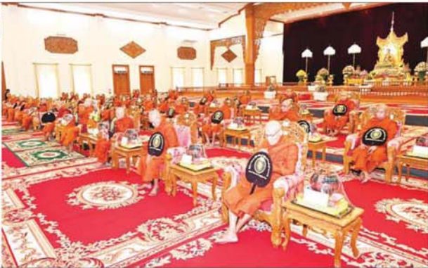
နိုင်ငံတော်စီမံအုပ်ချုပ်ရေးကောင်စီဥက္ကဋ္ဌ နိုင်ငံတော်ဝန်ကြီးချုပ် ဗိုလ်ချုပ်မှူးကြီး မင်းအောင်လှိုင်နှင့် ဇနီး ဒေါ်ကြူကြူလှ၊ အခမ်းအနားတက်ရောက်လာသည့် ဧည့်သည်များက သန့်လျှင်မင်းကျောင်းဆရာတော်ကြီး ဒေါက်တာဘဒ္ဒန္တဓနိမာ တီဝံသထံမှ ငါးပါးသီလခံလှူဆောင်တည်ကြစဉ်။