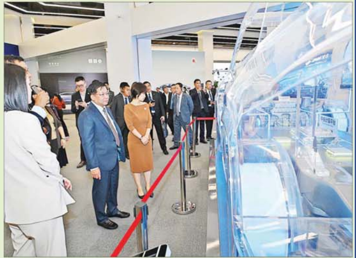
နိုင်ငံတော်စီမံအုပ်ချုပ်ရေးကောင်စီဥက္ကဋ္ဌ နိုင်ငံတော်ဝန်ကြီးချုပ် ဗိုလ်ချုပ်မှူးကြီးမင်းအောင်လှိုင် BYD မော်တော်ကားထုတ်လုပ်ရေးကုမ္ပဏီတွင် ကြည့်ရှုလေ့လာစဉ်။