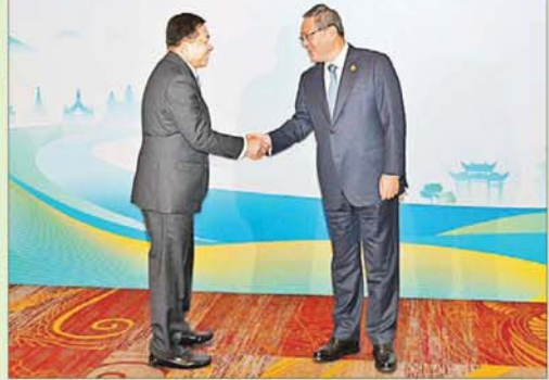
နိုင်ငံတော်စီမံအုပ်ချုပ်ရေးကောင်စီဥက္ကဋ္ဌ နိုင်ငံတော်ဝန်ကြီးချုပ် ဗိုလ်ချုပ်မှူးကြီးမင်းအောင်လှိုင်အား (၈)ကြိမ်မြောက် မဟာမိခေါင်ဒေသခွဲ ထိပ်သီးအစည်းအဝေး ကြိုဆိုညှာစားပွဲအခမ်းအနားတွင် တရုတ်ပြည်သူ့ သမ္မတနိုင်ငံဝန်ကြီးချုပ် H.E. Mr. Li Qiang က ရင်းရင်းနှီးနှီးကြိုဆို နှုတ်ဆက်စဉ်။

2024年11月6-7日 中国·昆明 6-7 November 2024 Kunming