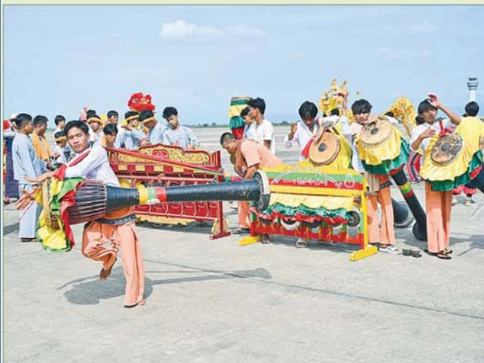
နိုင်ငံတော်စီမံအုပ်ချုပ်ရေးကောင်စီဥက္ကဋ္ဌ နိုင်ငံတော်ဝန်ကြီးချုပ် ဗိုလ်ချုပ်မှူးကြီးမင်းအောင်လှိုင် ဦးဆောင်သော အဆင့်မြင့်ကိုယ်စားလှယ်အဖွဲ့၏ ကြီးပမ်းဆောင်ရွက်မှုများအပေါ် တိုင်းရင်းသားပြည်သူ များက တိုင်းရင်းသားရိုးရာအကအလှများဖြင့် ဂုဏ်ပြုကြိုဆိုစဉ်။