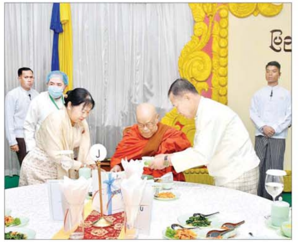
နိုင်ငံတော်စီမံအုပ်ချုပ်ရေးကောင်စီ ဒုတိယဥက္ကဋ္ဌ ဒုတိယဝန်ကြီးချုပ် ဒုတိယ ဗိုလ်ချုပ်မှူးကြီးစိုးဝင်းနှင့် ဇနီး ဒေါ်သန်းသန်းနွယ် ဆရာတော် သံဃာတော်များအား နေ့ဆွမ်းဆက်ကပ်လှူဒါန်းစဉ်။