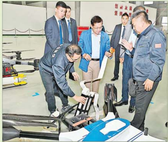
နိုင်ငံတော်စီမံအုပ်ချုပ်ရေးကောင်စီဥက္ကဋ္ဌ နိုင်ငံတော်ဝန်ကြီးချုပ် ဗိုလ်ချုပ်မှူးကြီး မင်းအောင်လှိုင် Zhongyue Aviation UAV Firefighting-Drone Co.,Ltd မှ ထုတ်လုပ်ထားသော လူမှုကယ်ဆယ်ရေးလုပ်ငန်းများတွင် အသုံးပြုသည့် အဆင့်မြင့် ဒရုန်းများ ခင်းကျင်းပြသထားမှုကို ကြည့်ရှုလေ့လာစဉ်။