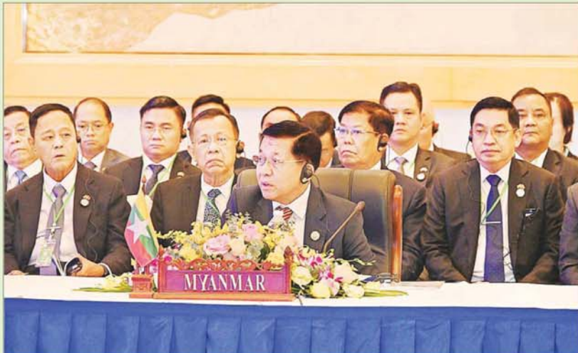
နိုင်ငံတော်စီမံအုပ်ချုပ်ရေးကောင်စီဥက္ကဋ္ဌ နိုင်ငံတော်ဝန်ကြီးချုပ် ဗိုလ်ချုပ်မှူးကြီးမင်းအောင်လှိုင် (၁၀)ကြိမ်မြောက် ဧရာဝတီ - ကျောက်ဖရား- မဲခေါင် စီးပွားရေးပူးပေါင်းဆောင်ရွက်မှုမဟာဗျူဟာ(အက်မက်စ်) ထိပ်သီးအစည်းအဝေးသို့ တက်ရောက်ဆွေးနွေးစဉ်။