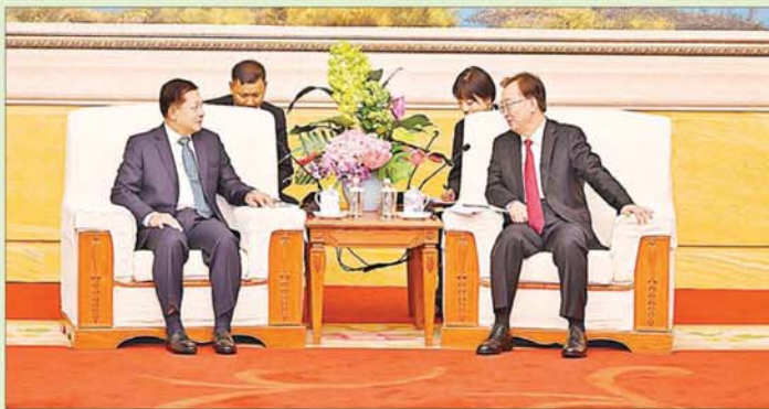
နိုင်ငံတော်စီမံအုပ်ချုပ်ရေးကောင်စီဥက္ကဋ္ဌ နိုင်ငံတော်ဝန်ကြီးချုပ် ဗိုလ်ချုပ်မှူးကြီးမင်းအောင်လှိုင် တရုတ်ကွန်မြူနစ်ပါတီ ဗဟိုကော်မတီပေါလစ်ဗျူရီအဖွဲ့ဝင်၊ ချူချင်မြူနီစီပယ်ပါတီကော်မတီအတွင်းရေးမှူး Mr. Yuan Jiajun နှင့် တွေ့ဆုံဆွေးနွေးစဉ်။