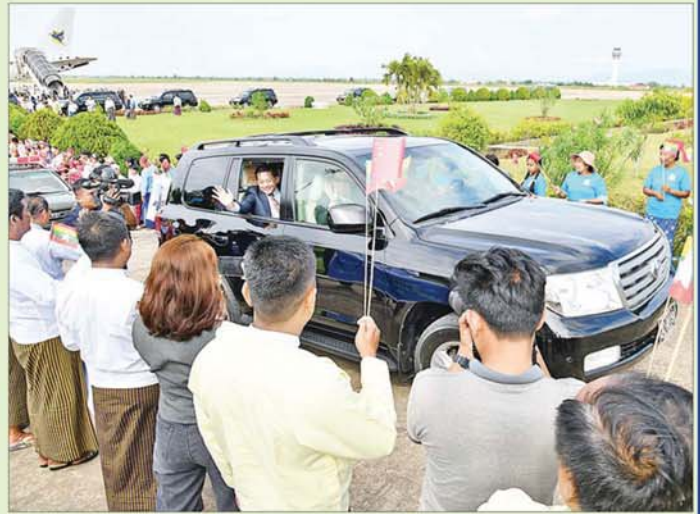
နိုင်ငံတော်စီမံအုပ်ချုပ်ရေးကောင်စီဥက္ကဋ္ဌ နိုင်ငံတော်ဝန်ကြီးချုပ် ဗိုလ်ချုပ်မှူးကြီးမင်းအောင်လှိုင် ဦးဆောင်သော အဆင့်မြင့်ကိုယ်စားလှယ်အဖွဲ့အား နေပြည်တော် တပ်မတော်လေဆိပ်၌ တိုင်းရင်းသား ပြည်သူများက လိုက်လံနွှေးထွေးစွာ သောင်းသောင်းဖြဖြကြိုဆိုစဉ်။