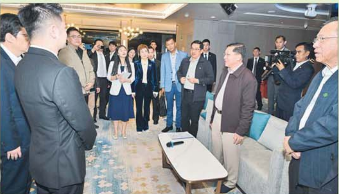
နိုင်ငံတော်စီမံအုပ်ချုပ်ရေးကောင်စီဥက္ကဋ္ဌ နိုင်ငံတော်ဝန်ကြီးချုပ် ဗိုလ်ချုပ်မှူးကြီးမင်းအောင်လှိုင် ချူချင်မြို့မှ စီးပွားရေးလုပ်ငန်းရှင်များနှင့် တွေ့ဆုံဆွေးနွေးစဉ်။