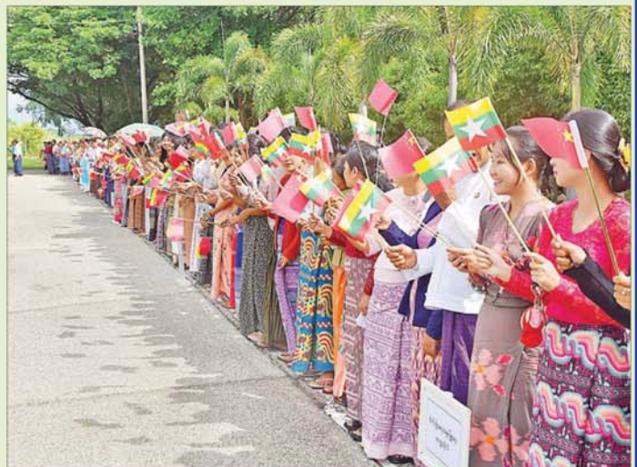
နိုင်ငံတော်စီမံအုပ်ချုပ်ရေးကောင်စီဥက္ကဋ္ဌ နိုင်ငံတော်ဝန်ကြီးချုပ် ဗိုလ်ချုပ်မှူးကြီးမင်းအောင်လှိုင် ဦးဆောင်သော အဆင့်မြင့်ကိုယ်စားလှယ်အဖွဲ့အား နေပြည်တော် တပ်မတော်လေဆိပ်၌ တိုင်းရင်းသား ပြည်သူများက လိုက်လံနွှေးထွေးစွာ သောင်းသောင်းဖြဖြကြိုဆိုစဉ်။