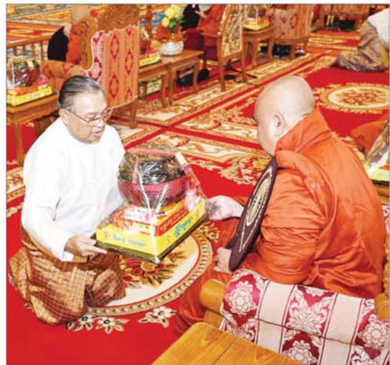
နိုင်ငံတော်စီမံအုပ်ချုပ်ရေးကောင်စီအဖွဲ့ဝင် ဦးဝဏ္ဏမောင်လွင် ဆရာတော်ထံ ကထိန်သင်္ကန်းနှင့် လှူဖွယ်ပစ္စည်းများ ဆက်ကပ်လှူဒါန်းစဉ်။