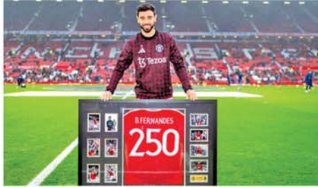
ဘရူနိုဖာနန်ဒက်စ် မန်ချက်စတာယူနိုက်တက်အသင်းကစားသမားဘဝ ပြိုင်ပွဲစုံ ပွဲ ၂၅၀ ပြည့်မြောက်

မန်ချက်စတာ နိုဝင်ဘာ ၁၁ - ကွင်းလယ်ကစားသမား ဘရူနိုဖာနန်ဒက်စ် မန်ချက်စတာယူနိုက်တက်အသင်းကစားသမားဘဝ ပြိုင်ပွဲစုံ ပွဲ ၂၅၀ ပြည့်မြောက်သည် မှတ်တမ်းကောင်းတစ်ရပ် ပိုင်ဆိုင်ခဲ့သည်။ အဆိုပါ ကွင်းလယ်ကစားသမားသည် ပရီးမီးယားလိဂ်ပွဲစုံ