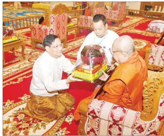
နိုင်ငံတော်စီမံအုပ်ချုပ်ရေးကောင်စီအဖွဲ့ဝင် ဒေါက်တာတာရွှေ ဆရာတော်ထံ ကထိန်သင်္ကန်းနှင့် လှူဖွယ်ပစ္စည်းများ ဆက်ကပ်လှူဒါန်းစဉ်။

သည့် ဆရာတော် သံဃာတော်များအား နိုင်ငံတော် စီမံအုပ်ချုပ်ရေးကောင်စီ ဥက္ကဋ္ဌနှင့်ဇနီး၊ ဧည့်ပရိသတ်များက နေ့ဆွမ်းဆက်ကပ်လှူဒါန်းခဲ့သည်။