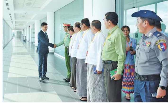
ပူးပေါင်းဆောင်ရွက်မှုများဖြင့် ကိုယ်စားလှယ်အဖွဲ့သည် နိုဝင် တင်နိုင်ရေးတို့အတွက် ကျင်းပ ဘာ ၁၃ ရက်နေ့တွင် ချန်သူးမြို့ မှ လုံရှန်းမြို့သို့ ဆက်လက် ထွက်ခွာသွားမည်ဖြစ်ကြောင်း သိရသည်။ (မန္တလေးနေ့စဉ်)

ဆောင်ရွက်ရေးနှင့် ပွဲမြို့တိုး တက်ရေးဆွေးနွေးပွဲ (2024 Sichuan International Friendship Cities Cooperation and Development Conference)၊ နိုဝင်ဘာ ၁၄ ရက်နေ့ တွင်ကျင်းပမည့် ညောင်ဦးမြို့နယ်၊ ပုဂံမြို့နှင့် စစ်ချွမ်းပြည်နယ်၊ လုံရှန်းမြို့တို့အကြား ချစ်ကြည် ရေး ညီအစ်မမြို့တော်တည် ထောင်ရေး နားလည်မှုစာချွန် ဝွာ(MoU) လက်မှတ်ရေးထိုးပွဲ သို့ တက်ရောက်မည်ဖြစ်ပြီး မြန်မာနိုင်ငံနှင့် တရုတ်နိုင်ငံနှစ် နိုင်ငံအစိုးရအကြား ချစ်ကြည် ရင်းနှီးစွာ ပူးပေါင်းဆောင်ရွက် နိုင်ရေးနှင့် နှစ်နိုင်ငံအကြားချစ် ကြည်ရင်းနှီးစွာ ဆက်ဆံမှုနှင့်