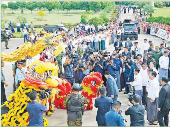
နိုင်ငံတော်စီမံအုပ်ချုပ်ရေးကောင်စီဥက္ကဋ္ဌ နိုင်ငံတော်ဝန်ကြီးချုပ် ဗိုလ်ချုပ်မှူးကြီးမင်းအောင်လှိုင် ဦးဆောင်သော အဆင့်မြင့်ကိုယ်စားလှယ်အဖွဲ့အား နေပြည်တော် တပ်မတော်လေဆိပ်၌ တရုတ်ရိုးရာ နဂါးနှင့်ခြင်သေ့အကအဖွဲ့တို့ဖြင့် ဂုဏ်ပြုကြိုဆိုစဉ်။