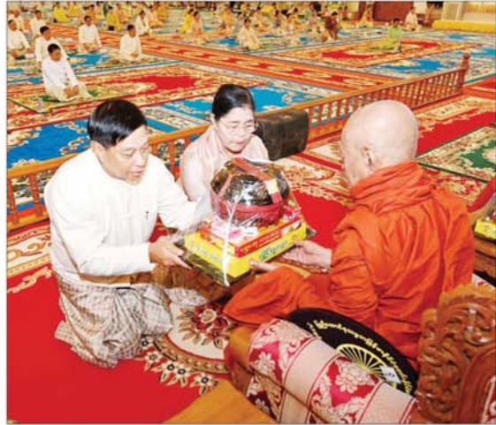
နိုင်ငံတော်စီမံအုပ်ချုပ်ရေးကောင်စီအဖွဲ့ဝင် ဗိုလ်ချုပ်ကြီး တင်အောင်ဇနီးနှင့် ဇနီး ဆရာတော်ထံ ကထိန်သင်္ကန်းနှင့် လှူဖွယ်ပစ္စည်းများ ဆက်ကပ်လှူဒါန်းစဉ်။