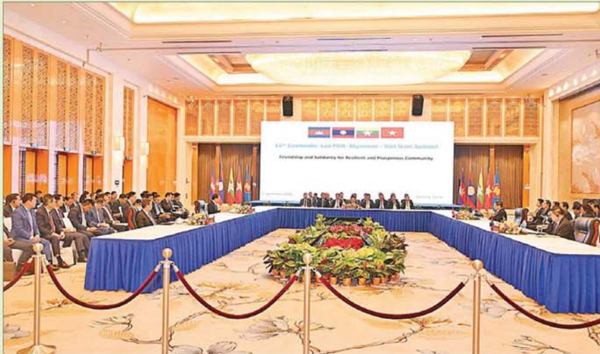
နိုင်ငံတော်စီမံအုပ်ချုပ်ရေးကောင်စီဥက္ကဋ္ဌ နိုင်ငံတော်ဝန်ကြီးချုပ် ဗိုလ်ချုပ်မှူးကြီးမင်းအောင်လှိုင် (၁၁)ကြိမ်မြောက်ကမ္ဘောဒီးယား-လာအို-မြန်မာ-ဗီယက်နမ်ပူးပေါင်းဆောင်ရွက်မှု ထိပ်သီးအစည်းအဝေးသို့ တက်ရောက် အမှာစကားပြောကြားစဉ်။

2024年11月6-7日 中国·昆明 6-7 November 2024 Kunming