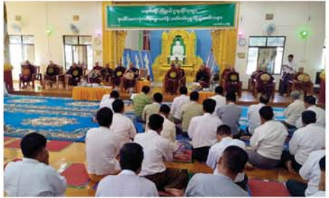
စုပေါင်းဘုံကထိန်လှူ သက်နိုးဆက်ကပ်လှူဒါန်းပွဲ ကျင်းပ

သေဋ္ဌိလအမှူးရှိသော ပုရိမဝါမှ ထမြောက်တော်မူကြသည့် သံဃာတော်များအား ရပ်ကွက်အုပ်ချုပ်ရေးနှင့် ဆွဲဝင်အားက ကထိန်လှည့်သင်တန်းနှင့်ဝတ္ထုရေးများ၊ လူမှုပစ္စည်းများကို ဆက်ကပ်လှူဒါန်းကြသည်။ ရဲမွန်တောင် ရပ်ကွက်အုပ်ချုပ်ရေးမှူးရုံး၏ ပထမအကြိမ် စုပေါင်းမဟာဘုံကထိန်တော်တွင် ကထိန် မ.တည့်အလှူငွေ၊ လူမှုပစ္စည်းပဒေသာပင်များ၊ ဆွမ်းနှင့် ဧည့်ခံကျွေးမွေးမှုများအတွက် စုစုပေါင်းအလှူငွေ ကျပ် ၈၆၅၀၀၀ လှူဒါန်းနိုင်ခဲ့သည်။