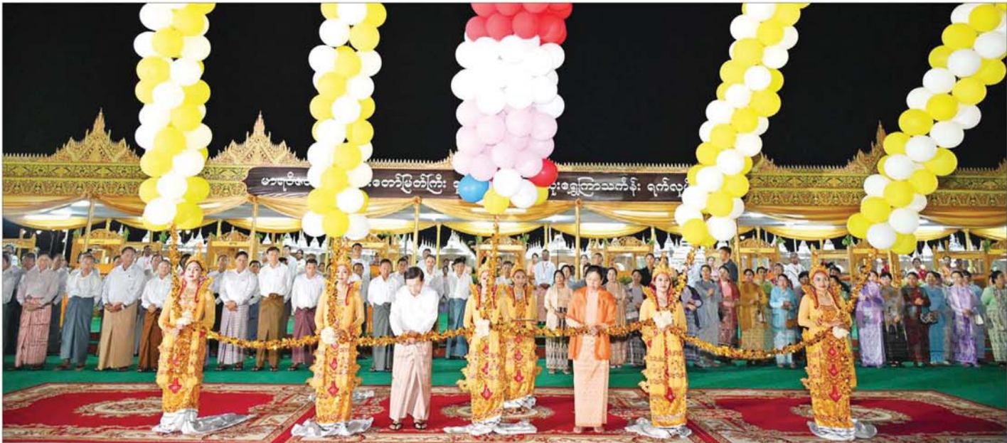
နိုင်ငံတော်စီမံအုပ်ချုပ်ရေးကောင်စီဥက္ကဋ္ဌ နိုင်ငံတော်ဝန်ကြီးချုပ် ဗိုလ်ချုပ်မှူးကြီးမင်းအောင်လှိုင်နှင့် ဇနီး ဒေါ်ကြူကြူလှ မာရဝိဇယဗုဒ္ဓရုပ်ပွားတော်မြတ်ကြီးအား ဒုတိယအကြိမ် မသိုးရွှေကြာသင်္ဂါန်းတော် ရက်လုပ်ပူဇော်ပွဲ ဖွင့်ပွဲအခမ်းအနားကို ဖဲကြိုးဖြတ်ဖွင့်လှစ်ပေးစဉ်။