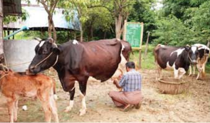
ရောဂါကင်းစင် စိတ်လန်းရွှင် အမြင်လည်းလှ သန်ရှင်းကြ။

နို့စားမွေးမြူရေး တိုးပွားလာသည့် အပြင် ယင်းနို့စားမွေးမြူမှု နှား နို့များ စတင်ရရှိပြီဖြစ်၍ နို့စား မွေးမြူသူများ နှားနို့များ စတင်ရောင်းချရပြီဖြစ်ရာ နို့စား မွေးမြူသူများ အဆင်ပြေ လျက်ရှိကြောင်း သိရသည်။ (အောက်ပုံ) (၄၆၉) ၀-၀-၀-၀-၀-၀-၀-၀