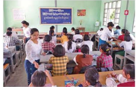
လိပ်သောက်ခြင်း၏ ဆိုးကျိုး အန္တရာယ်များနှင့် မူးယစ်ဆေးဝါးအန္တရာယ်နှင့်ပတ်သက်သည့် အသိပညာပေး နံရံကပ်စာစောင်နှင့် မှတ်တမ်းဓာတ်ပုံများကို ပြသခဲ့ရာ ကျောင်းသား၊ ကျောင်းသူများက စိတ်ပါဝင်စားစွာ ကြည့်ရှုလေ့လာခဲ့ကြောင်း သိရသည်။ (အပေါ်ပုံ) မြို့နယ်(ပြန်/ဆက်) ၀-၀-၀-၀-၀-၀