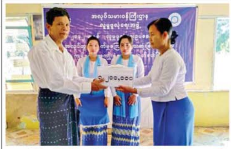
သာစည်မြို့နယ်တွင် အလုပ်ခွင်ထိခိုက်မှုကြောင့် သေဆုံးသူအတွက် ကျန်ရစ်သူငွေလုံးငွေရင်းအကျိုးခံစားခွင့် ထုတ်ပေး

ပြောင်းလဲခြင်းကြောင့် သဘာဝအန္တရာယ်များဖြစ်ပေါ်လာခြင်းအကြောင်း၊ ရာသီဥတုပြောင်းလဲခြင်းအား လျော့ချရမည့်နည်းလမ်းများနှင့်သစ်ပင်စိုက်ပျိုး၊ ပြုစုထိန်းသိမ်းခြင်းဖြင့် ရာသီဥတုကောင်းမွန်လာစေခြင်းစသည့် အကြောင်းအရာများကိုလည်း ကောင်း၊ တာချီလိတ်ခရိုင် ပတ်ဝန်းကျင်ထိန်းသိမ်းရေးဦးစီးဌာနမှ