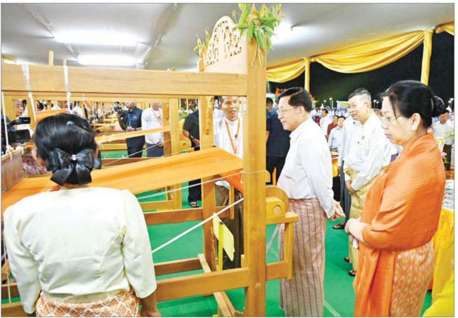
နိုင်ငံတော်စီမံအုပ်ချုပ်ရေးကောင်စီဥက္ကဋ္ဌ နိုင်ငံတော်ဝန်ကြီးချုပ် ဗိုလ်ချုပ်မှူးကြီးမင်းအောင်လှိုင်နှင့်ဇနီး ဒေါ်ကြူကြူလှတို့ မသိုးရွှေကြာသက်န်း ရက်လုပ်နေမှုကို ကြည့်ရှုအားပေးစဉ်။

ဝန်ကြီးချုပ် ဗိုလ်ချုပ်မှူးကြီး မင်းအောင်လှိုင်နှင့် ဇနီး ဒေါ်ကြူကြူလှတို့က မာရဝိဇယ ဗုဒ္ဓရုပ်ပွားတော်မြတ်ကြီးအား ဒုတိယအကြိမ် မသိုးရွှေကြာ သက်န်းတော် ရက်လုပ်ပူဇော်ပွဲ ဖွင့်ပွဲအခမ်းအနားကို ဖဲကြိုးဖြတ် ၍ ဖွင့်လှစ်ပေးကြသည်။ မသိုးရွှေကြာသက်န်းတော်များ စတင်ရက်လုပ် ယင်းနောက် မာရဝိဇယဗုဒ္ဓ ရုပ်ပွားတော်မြတ်ကြီး ဂေါပက အဖွဲ့ဝင် ဦးသန့်ဆွေက မင်္ဂလာ ရွှေမောင်းကို တီးခတ်၍ အချက်ပေးရာ ရက်ကန်းအဖွဲ့ များက ရက်ကန်းစင်တော်များ၌ မသိုးရွှေကြာသက်န်းတော်များကို စတင်ရက်လုပ်ကြသည်။ ထိုသို့ ရက်ကန်းအဖွဲ့များက ရက်ကန်း စတင်ရက်လုပ်သည်နှင့် တစ်ပြိုင်နက် ပြန်ကြားရေးဝန်ကြီးဌာန မြန်မာ့အသံနှင့် ရုပ်မြင်သံကြားမှ အနုပညာရှင်များ၊ သာသနာရေး နှင့် ယဉ်ကျေးမှုဝန်ကြီးဌာန အနုပညာဦးစီးဌာနမှ ယဉ်ကျေးမှု အဖွဲ့များနှင့် ပြည်သူ့ဆက်ဆံရေး နှင့် စိတ်ဓာတ်စစ်ဆင်ရေး ညွှန်ကြား ရေးမှူးရုံးကွပ်ကဲမှုအောက် မြဝတီ တေးဂီတအဖွဲ့မှ အနုပညာရှင်များ က မြိုင်မြိုင်ဆိုဆိုလတန်းဆောင် တိုင် တေးသီချင်းဖြင့် သီဆို