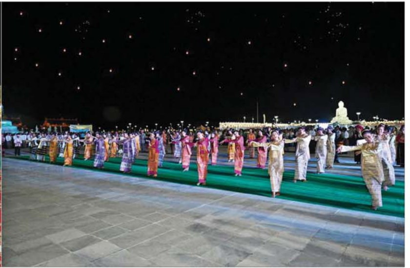
နိုင်ငံတော်စီမံအုပ်ချုပ်ရေးကောင်စီဥက္ကဋ္ဌ နိုင်ငံတော်ဝန်ကြီးချုပ် ဗိုလ်ချုပ်မှူးကြီးမင်းအောင်လှိုင်နှင့်ဇနီး ဒေါ်ကြူကြူလှ၊ အခမ်းအနားတက်ရောက်လာကြသူများ ယဉ်ကျေးမှုအဖွဲ့များ၏ ဖျော်ဖြေတင်ဆက်မှုကို ကြည့်ရှုအားပေးစဉ်။

» စာမျက်နှာ ၃ မှ ထို့နောက် နိုင်ငံတော်စီမံအုပ်ချုပ်ရေးကောင်စီ ဥက္ကဋ္ဌ နိုင်ငံတော်ဝန်ကြီးချုပ်နှင့် ဇနီးနှင့် ဧည့်ပရိသတ်များသည် နေပြည်တော် ကောင်စီနယ်မြေ အပါအဝင် တိုင်းဒေသကြီးနှင့် ပြည်နယ်အသီးသီးရှိ ရက်ကန်းစင်တော် ၁၅ ခုမှ ရက်ကန်းအဖွဲ့များ၏ မသိုးရွှေကြာသင်္ကန်း ရက်လုပ်နေမှုများကို ရက်ကန်းစင်တော် တစ်ခုချင်းစီအလိုက် စိတ်ဝင်တစား လှည့်လည်ကြည့်ရှုအားပေးကြသည်။ နိုင်ငံတော် စီမံအုပ်ချုပ်ရေးကောင်စီဥက္ကဋ္ဌ နိုင်ငံတော်ဝန်ကြီးချုပ်နှင့် ဇနီး၊ အခမ်းအနားတက်ရောက်လာကြသူများသည် စိန်နားပန်မီးပုံးပျံများနှင့် ညမီးကျည်(ညမီးကြီး) မီးပုံးပျံများ လွှတ်တင်မှုများကို မာရ်ဇီယဗုဒ္ဓရုပ်ပွားတော်မြတ်ကြီး တန်ဆောင်တိုင် မီးထွန်းပွဲတော်သို့ လာရောက်ကြသည့် ဘုရားဖူးလာရဟန်းရှင်လူ ပြည်သူများနှင့်အတူ ကြည့်ရှုအားပေးကြသည်။ ပြည်ထောင်စုနယ်မြေ နေပြည်