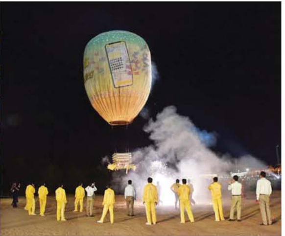
နိုင်ငံတော်စီမံအုပ်ချုပ်ရေးကောင်စီဥက္ကဋ္ဌ နိုင်ငံတော်ဝန်ကြီးချုပ် ဗိုလ်ချုပ်မှူးကြီးမင်းအောင်လှိုင်နှင့်ဇနီး ဒေါ်ကြူကြူလှ၊ အခမ်းအနားတက်ရောက်လာကြသူများ စိန်နားပန်မီးပုံးပျံများ လွှတ်တင်မှုကို ကြည့်ရှုအားပေးစဉ်။

ရှေ့ဖွဲ့မှ အခမ်းအနားသို့ နိုင်ငံတော် စီမံအုပ်ချုပ်ရေးကောင်စီ ဥက္ကဋ္ဌ နိုင်ငံတော်ဝန်ကြီးချုပ်နှင့် ဇနီး တို့နှင့်အတူ နိုင်ငံတော်စီမံအုပ်ချုပ် ရေးကောင်စီဒုတိယဥက္ကဋ္ဌ ဒုတိယ ဝန်ကြီးချုပ်နှင့်ဇနီး၊ ကောင်စီ အတွင်းရေးမှူးနှင့်ဇနီး၊ တွဲဖက် အတွင်းရေးမှူးနှင့်ဇနီး၊ ကောင်စီ ဝင်များနှင့် ဇနီးများ၊ ပြည်ထောင်စု အဆင့်ပုဂ္ဂိုလ်များ၊ ပြည်ထောင်စု ဝန်ကြီးများနှင့် ဇနီးများ၊ နေပြည်တော် ကောင်စီဥက္ကဋ္ဌ၊ ကာကွယ်ရေး ဦးစီးချုပ်မှူးမှ အဆင့်မြင့် တပ်မတော်အရာရှိကြီး များနှင့် ဇနီးများ၊ နေပြည်တော် တိုင်းစစ်ဌာနချုပ် တိုင်းမှူးနှင့် တာဝန်ရှိသူများ တက်ရောက် ကြပြီး ဘုရားဖူးလာ ရဟန်းရှင်လူ ပြည်သူများကလည်း စည်ကား များပြားစွာ လာရောက်ကြည့်ရှု ကြသည်။ ဦးစွာ အခမ်းအနားကို “နမော တဿ” သုံးကြိမ်ရွတ်ဆို ဘုရား ကန်တော့ဖွင့်လှစ်ကြပြီး သာသနာ ရေးနှင့် ယဉ်ကျေးမှုဝန်ကြီးဌာန ပြည်ထောင်စုဝန်ကြီး ဦးတင်ဦးလွင် က “ဇယဏ်လာစာစာမ်းလွှာ” ကို ဖတ်ကြားသည်။ ထို့နောက် နိုင်ငံတော်စီမံအုပ်ချုပ် ရေးကောင်စီဥက္ကဋ္ဌ နိုင်ငံတော်