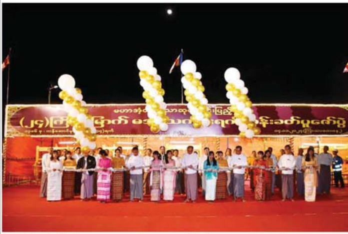
ဦးဦးလွင် နိုဝင်ဘာ ၁၄ တွင်းကံသာဘုရား(၂၄)ကြိမ်မြောက် မသိုးသင်္ကန်းရက်ကန်းခတ်ပူဇော်ပွဲကို ယနေ့ ညနေ ၆ နာရီက ဘုရားကြီးရင်ပြင်ပေါ်၌ မြောက် မသိုးသင်္ကန်းရက်ကန်း

ခတ်ပူဇော်ပွဲကို တာဝန်ရှိသူများက ဖဲကြီးဖြတ်ဖွင့်လှမ်းပေးကြပြီး ရက်ကန်းခတ်နေ့မှစ၍ လှည့်လှည့်ကြည့်ရကြသည်။ (ခဲပုံ) ထို့နောက် မသိုးသင်္ကန်း ရက်ကန်းခတ်ပူဇော်ပွဲကို သုမလာ၊ သုစိတ္တာ၊ သုနန္ဒာ၊ သုမ္မောနှင့် သုစိတာ စသည့် ရက်ကန်းစင်များဖြင့် မိမိတို့ရက်ကန်းစင်အလိုက်ရက်ဖောက်ရောက်ခြင်း၊ ချည်ဆက်ခြင်း၊ ရက်ကန်းစင်များမှ ရရှိသော သင်္ကန်းအား စက်ချုပ်ခြင်း၊ တို့ဖြင့် မသိုးသင်္ကန်းကို အချိန်မီ ပြီးစီးနိုင်ရန်အတွက် တက်ညီလက်ညီ ပူးပေါင်းဆောင်ရွက်နေကြကြောင်း တာဝန်ရှိသူတစ်ဦး၏ ပြောကြားချက်အရ သိရသည်။