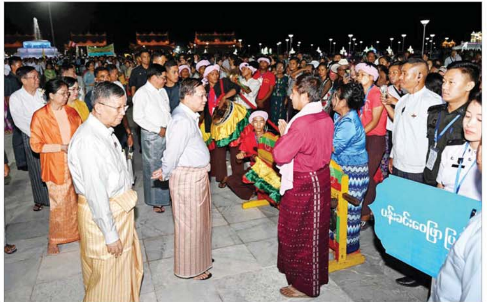
နိုင်ငံတော်စီမံအုပ်ချုပ်ရေးကောင်စီဥက္ကဋ္ဌ နိုင်ငံတော်ဝန်ကြီးချုပ် ဗိုလ်ချုပ်မှူးကြီးမင်းအောင်လှိုင်နှင့်ဇနီး ဒေါ်ကြူကြူလှ ဘုရားဖူးလာရဟန်းရှင်လူပြည်သူများအား ရင်းရင်းနှီးနှီးနှုတ်ဆက်စဉ်။

တော် ဒက္ခိဏသီရိမြို့နယ်ရှိ မာရ်ဇီယဗုဒ္ဓရုပ်ပွားတော်မြတ်ကြီး ဗုဒ္ဓဥယျာဉ်တော်အတွင်း၌ တန်ဆောင်တိုင်ပွဲတော် အခါသမယအဖြစ် တန်ဆောင်တိုင်မီးထွန်းပွဲတော်ကို နိုဝင်ဘာ ၁၃ ရက်မှ ၁၅ ရက်အထိ ရိုးရာယဉ်ကျေးမှုအစဉ်အလာများနှင့်အညီ ခမ်းနားထည်ဝါစွာဖြင့် စည်ကားသိုက်မြိုက်စွာ ကျင်းပပြုလုပ်သွားမည်ဖြစ်ပြီး အသံမစ်မဟာပဋ္ဌာန်းရွတ်ဖတ်ပူဇော်ခြင်း၊ ဝတ်အသင်းအဖွဲ့များမှ ဝတ်ရွတ်စဉ်များဖြင့် ပူဇော်ခြင်း၊ မီးရှူးမီးပန်းများ ပစ်လွှတ်ပူဇော်ခြင်း၊ အလှည့်မီးကြီးနှင့် စိန်နားပန်မီးပုံးပျံကြီးများ လွှတ်တင်ပူဇော်ခြင်း၊ ဒုတိယအကြိမ် မသိုးရွှေကြာသင်္ကန်းရက်လုပ် ကပ်လှူပူဇော်ခြင်းများကို ဆောင်ရွက်သွားမည်ဖြစ်သည့်အပြင် ဗုဒ္ဓဥယျာဉ် ဝတ္ထုကံတော်အတွင်း LED မီးများဖြင့် အလှဆင် ပူဇော်ထားရှိခြင်း၊ အသေးစား၊ အငယ်စားနှင့် အလတ်စားစီးပွားရေး (MSME) လုပ်ငန်းများ၏ ဒေသထွက်ကုန်၊ စားသောက်ကုန်၊ လူသုံးကုန်