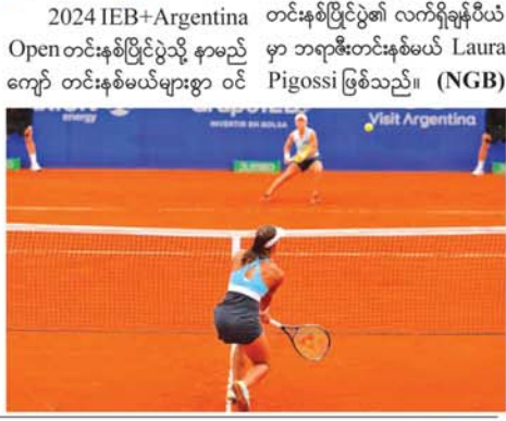
2024 IEB+Argentina Open တင်းနစ်ပြိုင်ပွဲသို့ နာမည်ကျော် တင်းနစ်မယ်များစွာ ဝင်တင်နှစ်ဖြင့်ပွဲ၏ လက်ရှိချန်ပီယံမှာ ဘရာဇီးတင်နစ်မယ် Laura Pigossi ဖြစ်သည်။ (NGB)

လန်ဒန် နိုင်ငံဘာ ၁၄ အာဂျင်တီးနားနိုင်ငံတွင် ကျင်းပလုပ်မည်ဖြစ်သော အဆိုပါ သမီး တင်းနစ်ပြိုင်ပွဲဖြစ်သည့် 2024 IEB+Argentina Open တင်းနစ်ပြိုင်ပွဲ လာမည့် နိုင်ငံဘာ ၂၅ရက်တွင် စတင်သွားမည်ဖြစ်သည်။ (ယာပုံ) အဆိုပါ 2024 IEB+Argentina Open တင်းနစ်ပြိုင်ပွဲကို နိုင်ငံဘာ ၂၅ရက်မှ ဒီဇင်ဘာ ၂ရက်အထိ စရက်ကြာကျင်းပသွားမည် ဖြစ်သည်။