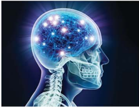
SCI များကသာမက သက်ဆိုင်ရာအင်္ဂါအစိတ်အပိုင်းများနှင့်သက်ဆိုင်သော ဆဲလ်များကလည်း မှတ်သားပေးထားသည်ဟု အဆိုပါသုတေသီများ ဖော်ထုတ်တွေ့ရှိခဲ့ကြောင်း သိရသည်။

ခန္ဓာကိုယ်အတွင်းရှိ အင်္ဂါအစိတ်အပိုင်းများနှင့်သက်ဆိုင်သော အတွေ့အကြုံအသီးသီးကို ဦးနှောက်ထဲရှိ မှတ်ဉာဏ်ဆဲလ်များကသာမက သက်ဆိုင်ရာအင်္ဂါအစိတ်အပိုင်းများနှင့်သက်ဆိုင်သော ဆဲလ်များကလည်း မှတ်သားပေးထားသည်ဟု အဆိုပါသုတေသီများ ဖော်ထုတ်တွေ့ရှိခဲ့ကြောင်း သိရသည်။