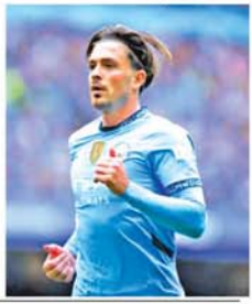
(အောက်ပုံ)(NGB)

လန်ဒန် နိုင်ငံဘာ ၁၄ စပီးအသင်းသည် မန်ချက်စတာစီးတီးအသင်းနှင့် အနာဂတ်မရေမရာဖြစ်နေသည့် တောင်ပံကစားသမား ဂရီးလစ်ရှ်အား ခေါ်ယူရန် စီစဉ်လျက်ရှိသည်။ အသက်(၂၀)နှစ်အရွယ်ရှိ တောင်ပံကစားသမားသည် လက်ရှိအချိန် မန်ချက်စတာစီးတီးအသင်းတာဝန်ရှိသူများနှင့် အဆင်မပြေဖြစ်နေခြင်းကြောင့် အသင်းမှ ထွက်ခွာချင်လျက်ရှိနေခြင်းကြောင့် စပီးအသင်းက ခေါ်ယူရန် စီစဉ်လာခြင်းဖြစ်သည်။ တောင်ပံကစားသမား ဂရီးလစ်ရှ်သည် မန်ချက်စတာစီးတီးအသင်းနှင့်အတူ ၂၀၂၁-၂၀၂၂မှ ၂၀၂၄-၂၀၂၅ ဘောလုံးရာသီအထိ ပြိုင်ပွဲစွဲ ၁၃၅ပွဲကစားပြီး ၁၄ဂိုး သွင်းယူကာ ခြေစွမ်းပြထားသည်။ ထို့ကြောင့် စပီးအသင်း အနေဖြင့် လာမည့် ဆောင်းရာသီ ဈေးကွက်အတွင်းတွင် မန်ချက်စတာစီးတီးအသင်းထံမှ ဂရီးလစ်ရှ်အား ရရှိအောင် ခေါ်ယူနိုင်မည်လားဆိုသည်မှာ စိတ်ဝင်စားဖွယ်စောင့်ကြည့်ရမည် ဖြစ်သည်။ (အောက်ပုံ)(NGB)