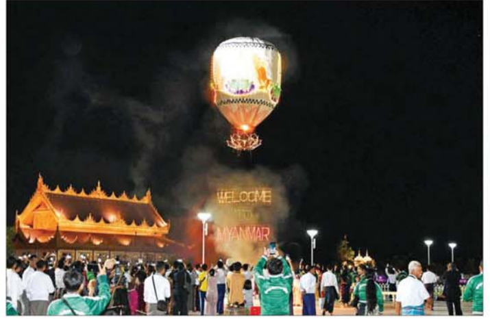
စိန်နားပန်မီးပုံးပျံများ လွှတ်တင်ပူဇော်မှုကို ဘုရားဖူးလာ ရဟန်းရှင်လူပြည်သူများက ကြည့်ရှုအားပေးစဉ်။