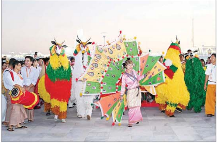
တိုင်းရင်းသားရိုးရာယဉ်ကျေးမှုအဖွဲ့များက တိုင်းရင်းသားရိုးရာအကများဖြင့် ကပြဖျော်ဖြေစဉ်။

အနေဖြင့် လာရောက်ဖူးမြော်ကြည့်သည့်ကြည့်ရှုနိုင်ကြောင်း သိရသည်။ သတင်းစဉ်