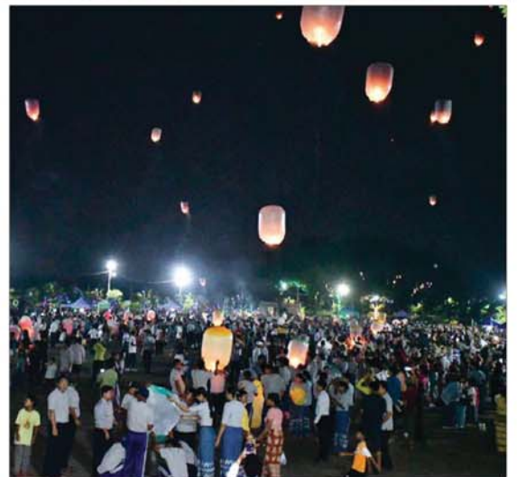
မီးပုံးပျံလွှတ်တင်ပူဇော်ပွဲကျင်းပစဉ်။