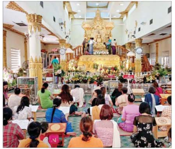
ဘုရား၊ စေတီ၊ ပုထိုးများ၌ ကုသိုလ်ကောင်းမှုပြုကြသူများကို တွေ့ရစဉ်။

★ စာမျက်နှာ ၂၄ မှ ဆီမီး ၁၀၀၀ ထွန်းညှိပူဇော်ခြင်းများဖြင့် တန်ဆောင်မုန်းလပြည့်သာမညဖလ အခါတော်နေ့ တန်ဆောင်တိုင်မီးထွန်းပွဲတော်ကို ပျော်ရွှင်ကြည်နူးစွာ ဆင်နွှဲခဲ့ကြသည်။ အလားတူ တန်ဆောင်တိုင်မီးထွန်းပွဲတော်အထိမ်းအမှတ်အဖြစ် ကာကွယ်ရေးဦးစီးချုပ်ရုံး(ကြည်း) ဝင်းအတွင်း၌လည်း လမ်း၊ အဆောက်အအုံများနှင့် ပန်းအလှသစ်ပင်များတွင် ရောင်စုံမီးအလှများဖြင့် မီးထွန်းပွဲတော်ကို သာယာလှပစွာ ရှုမငြီးဖွယ် ပြုလုပ်ထားရှိပြီး ပျော်ရွှင်ပွဲများကိုလည်း ပြုလုပ်ကြရာ ကာကွယ်ရေးဦးစီးချုပ်ရုံး(ကြည်း၊ ရေ၊ လေ) မိသားစုများက စိတ်နှလုံးအေးချမ်းစွာဖြင့် ပျော်ရွှင်ကြည်နူးစွာ ဆင်နွှဲခဲ့ကြသည်။ “တန်ဆောင်”မှာ မီးရှူး၊ မီးတိုင်း၊ ဆီမီး ဟု အဓိပ္ပာယ်ရပြီး “မုန်း”မှာ တောက်ပသည် ဟူသော အနက်ကိုယူ၍ ဝေါဟာရပေါင်းစည်းသည်အခါ “ဆီမီးတိုင်းများ မျက်စိတစ်ဆုံး ပွားများထွန်းလင်းနေသည်”ဟု ဆိုလိုသည်ဖြစ်၍ တိုင်းဒေသကြီးနှင့် ပြည်နယ်အသီးသီးရှိ ဘုရား၊ စေတီ၊ ပုထိုး