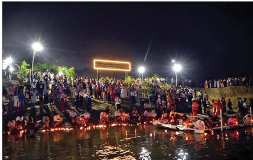
ရှင်ဥပဂုတ္တမထေရ်မြတ်ပူဇော်ပွဲနှင့် မီးမျှောပူဇော်ပွဲ ကျင်းပစဉ်။