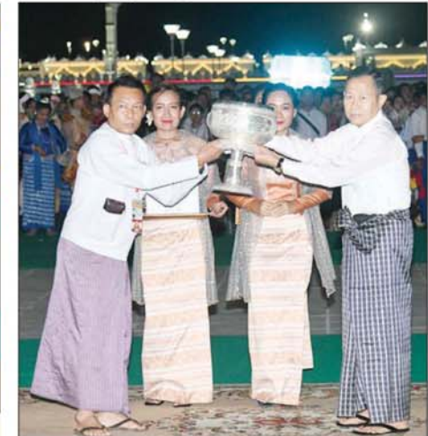
နိုင်ငံတော်စီမံအုပ်ချုပ်ရေးကောင်စီဒုတိယဥက္ကဋ္ဌ ဒုတိယဝန်ကြီးချုပ် ဒုတိယဗိုလ်ချုပ်မှူးကြီးစိုးဝင်း၊ မသုံးရွှေကြာသက်နိုးရက်လုပ်ပူဇော်ပြိုင်ပွဲတွင် ဒုတိယဆုရရှိသည့် တနင်္သာရီတိုင်းဒေသကြီးကိုယ်စားပြုအသင်းအား ဆုပေးလှူဒါန်းပေးအပ်ချီးမြှင့်စဉ်။