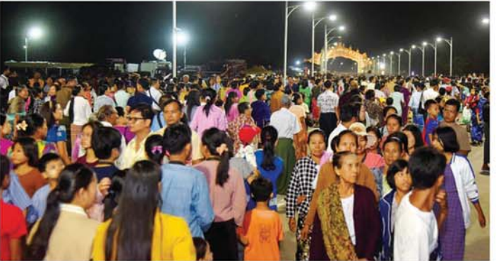
မာရဂိဗယဗုဒ္ဓရုပ်ပွားတော်မြတ်ကြီး၌ တန်ဆောင်တိုင်မီးထွန်းပွဲတော်နောက်ဆုံးနေ့တွင် အနယ်နယ်အရပ်ရပ်မှ ဘုရားဖူးလာပြည်သူများဖြင့် အထူးစည်ကားများပြားလျက်ရှိသည်ကို တွေ့ရစဉ်။