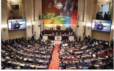
ဘိုဂိုတာ နိုဝင်ဘာ ၁၅ ခြင်းဥပဒေပြင်ဆင်ပြဋ္ဌာန်းရန် ကလေးသူငယ်လက်ထပ် အတွက် ကိုလံဘီယာလွှတ်တော်

က မဲပေးပြီး အတည်ပြုလိုက်ပြီ ဖြစ်ကြောင်း စီအင်အင်နီသတင်းဌာနက ဖော်ပြသည်။ ကိုလံဘီယာနိုင်ငံတွင် ကျင့်သုံးသော မူလကလေးသူငယ်လက်ထပ်ခြင်းဥပဒေအရ မိဘများသဘောတူလျှင် အသက် ၁၄ နှစ်အရွယ် မိန်းကလေးများ လက်ထပ်ခွင့်ရှိသည်ဟု ပြဋ္ဌာန်းခဲ့သည်။ မိန်းကလေးများ အသက် ၁၈ နှစ်ပြည့်မှ လက်ထပ်ခွင့်ရှိသည်ဟု ယခုပြင်ဆင်လိုက်ရာ ကိုလံဘီယာသမ္မတ ဝူစတာဒိုပေထရီ လက်မှတ်ရေးထိုးပြီး အတည်ပြု ပြဋ္ဌာန်းရန်သာ လိုတော့သည်။ အသက်မပြည့်သေးသော မိန်းကလေးများသည် လိင်ဖျော်ဖြေရေးပစ္စည်းများ မဟုတ်ကြောင်း အမျိုးသမီးလွှတ်တော်အမတ် ကလယ်ရာလိုပက်စ်အိုဘာရေဂွန်က ထုတ်ဖော်ပြောကြားသည်။ တစ်ကမ္ဘာလုံး၌ တစ်နှစ်လျှင် အသက်မပြည့်သေးသော မိန်းကလေးပေါင်း ၁၂ သန်းခန့် ထိမ်းမြားလက်ထပ်နေရသည်ဟု ကုလသမဂ္ဂယူနီဆက်စ်အဖွဲ့အစည်းက မှတ်တမ်းတင်ထားကြောင်း သိရသည်။ Mon