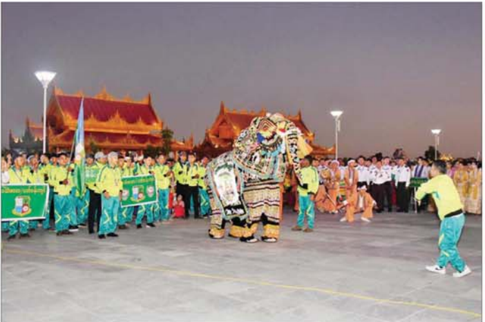
တိုင်းရင်းသားရိုးရာအကအလှများဖြင့် မျော်မြေတင်ဆက်စဉ်။