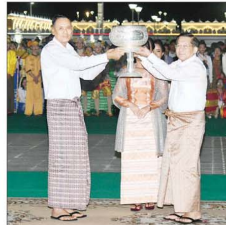
နိုင်ငံတော်စီမံအုပ်ချုပ်ရေးကောင်စီဥက္ကဋ္ဌ နိုင်ငံတော်ဝန်ကြီးချုပ် ဗိုလ်ချုပ်မှူးကြီးမင်းအောင်လှိုင် စိန်နားပန်းမီးပုံးပျံလွှတ်တင်ပူဇော်ပြိုင်ပွဲတွင် ပထမဆုရရှိသည့် ကာကွယ်ရေးဝန်ကြီးဌာန ကာကွယ်ရေးဦးစီးချုပ်(ရေ)အသင်းအား ဆုပေးအပ်ခြင်းဖြစ်သည်။