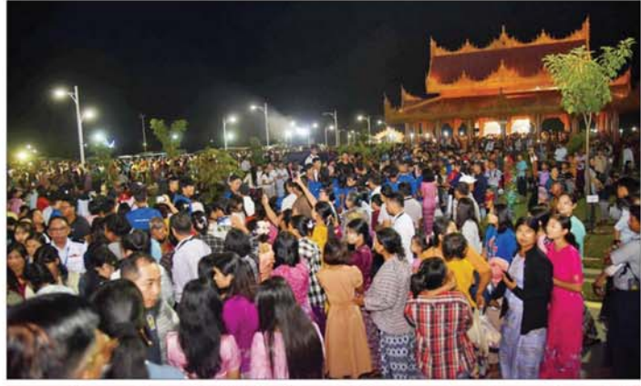
မာရဂိဗယဗုဒ္ဓရုပ်ပွားတော်မြတ်ကြီး၌ တန်ဆောင်တိုင်မီးထွန်းပွဲတော်နောက်ဆုံးနေ့တွင် အနယ်နယ်အရပ်ရပ်မှ ဘုရားဖူးလာပြည်သူများဖြင့် အထူးစည်ကားများပြားလျက်ရှိသည်ကို တွေ့ရစဉ်။

စည်ကားသိုက်မြိုက်အောင်မြင်စွာ ကျင်းပနိုင်ခဲ့ပြီး အနယ်နယ်အရပ်ရပ်မှ ဘုရားဖူးလာပြည်သူများအနေဖြင့်လည်း ပွဲတော်ကြီးအား စိတ်အားထက်သန်စွာ တစ်ခဲနက် ပါဝင်ဆင်နွှဲခဲ့ကြသည့်အတွက်လည်း အထူးစည်ကားများပြားခဲ့ကာ တန်ဆောင်တိုင်ည၏အလှနှင့် ရသကို အပြည့်အဝခံစားနိုင်ခဲ့ကြောင်း သိရသည်။ အောင်ရဲညွှင်၊ အေးအေးသန့်