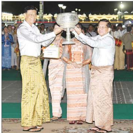
နိုင်ငံတော်စီမံအုပ်ချုပ်ရေးကောင်စီဥက္ကဋ္ဌ နိုင်ငံတော်ဝန်ကြီးချုပ် ဗိုလ်ချုပ်မှူးကြီးမင်းအောင်လှိုင် ညမီးကျည်(ညမီးကြီး) မီးပုံးပျံလွှတ်တင်ပူဇော်ပြိုင်ပွဲတွင် ပထမဆုရရှိသည့် ပိုးဆောင်ရေးနှင့် ဆက်သွယ်ရေးဝန်ကြီးဌာနအသင်းအား ဆုပေးအပ်ခြင်းဖြစ်သည်။

အပေါ်တွင် မြတ်ရောင်ခြည် စာသားကို အပြာရောင်ဖြင့် ရေးဆွဲထားပြီး မီးပုံးပျံ၏ အောက်ဆွဲတွင် ကြာပန်းပုံနှင့် ဘုရားတီးရားစာသားကို မီးပုံးရောင်စုံများဖြင့် လှပစွာချိတ်ဆွဲထားရှိသည်။ စာမျက်နှာ ၅ သို့ *