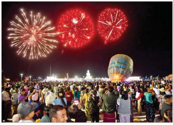
မီးရှူး၊ မီးပန်းများ ပစ်ဖောက်ပူဇော်ခြင်းနှင့် မီးပုံးပျံများ လွှတ်တင်ပူဇော်နေမှုကို တွေ့ရစဉ်။

ရောက် လေ့လာနိုင်မည့် နေရာ များကို အလွယ်တကူသွားရောက် နိုင်ရေးအတွက် လမ်းညွှန်ပြသပေး ကြသည်။ ထို့နောက် တန်ဆောင် တိုင်မီးထွန်းပွဲတော်သို့ လာရောက် ကြသည့် ဘုရားဖူးလာရဟန်းရှင်