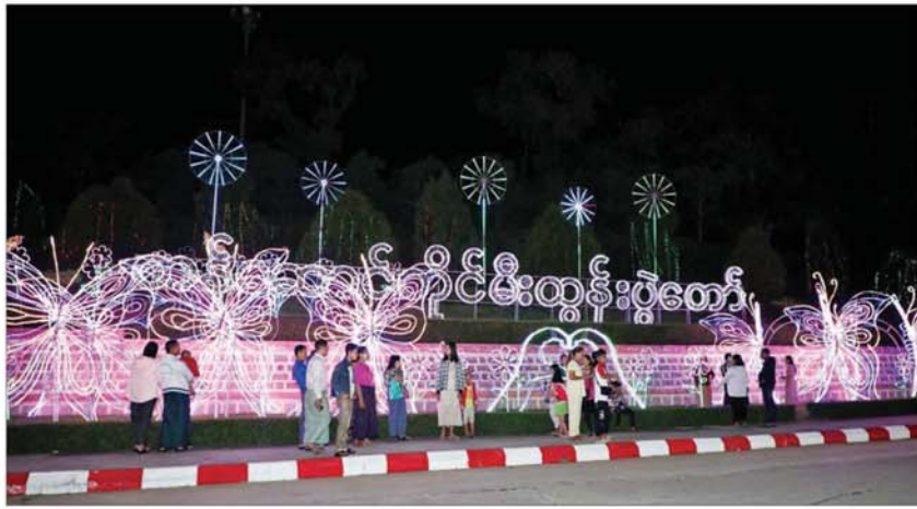
တန်ဆောင်တိုင်မီးထွန်းပွဲတော် အထိမ်းအမှတ်အဖြစ် ကာကွယ်ရေးဦးစီးချုပ်ရုံး(ကြည်း)ဝင်းအတွင်း လမ်း၊ အဆောက်အအုံများနှင့် ပန်းအလှသစ်ပင်များ၌ ရောင်စုံမီးအလှများ ပြုလုပ်ထားရှိမှုကို တွေ့ရစဉ်။