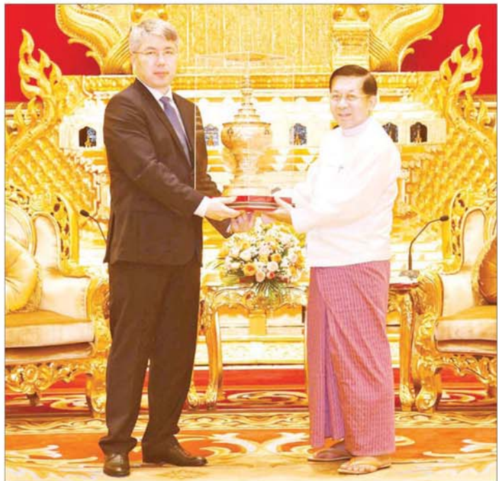
နိုင်ငံတော်စီမံအုပ်ချုပ်ရေးကောင်စီဥက္ကဋ္ဌ နိုင်ငံတော်ဝန်ကြီးချုပ် ဗိုလ်ချုပ်မှူးကြီးမင်းအောင်လှိုင် နှင့် ရုရှားဖက်ဒရေးရှင်းနိုင်ငံ ဘုရားတီးရားပြည်နယ်အကြီးအကဲ ဘုရားတီးရားပြည်နယ်အစိုးရဥက္ကဋ္ဌ H. E. Mr. Alexey Sambuevich Tsydenov တို့ အမှတ်တရလက်ဆောင်ပစ္စည်းများ အပြန်အလှန်ပေးအပ်စဉ်။

အဆိုပါ ရုရှားဖက်ဒရေးရှင်း နိုင်ငံ ဘုရားတီးရားပြည်နယ် အကြီးအကဲဘုရားတီးရားပြည်နယ် အစိုးရဥက္ကဋ္ဌ ဦးဆောင်သည့် ကိုယ်စားလှယ်အဖွဲ့သည် နိုဝင်ဘာ ၁၂ ရက်တွင် မြန်မာနိုင်ငံသို့ ရောက်ရှိခဲ့ပြီး ရောက်ရှိနေချိန် အတွင်း ရန်ကုန်မြို့ရှိ ရွှေတိဂုံ စေတီတော်မြတ်ကြီးအပါအဝင် အထင်ကရနေရာများ၊ ဧရာဝတီ တိုင်းဒေသကြီးရှိ ချောင်းသာ ကမ်းခြေနှင့် အထင်ကရနေရာများ သို့သွားရောက်လေ့လာလည်ပတ် ခဲ့ပြီး ဆက်လက်၍လည်း မြန်မာ နိုင်ငံအတွင်းရှိ အထင်ကရနေရာ များသို့ သွားရောက်လေ့လာ လည်ပတ်သွားမည်ဖြစ်ကြောင်း သိရသည်။