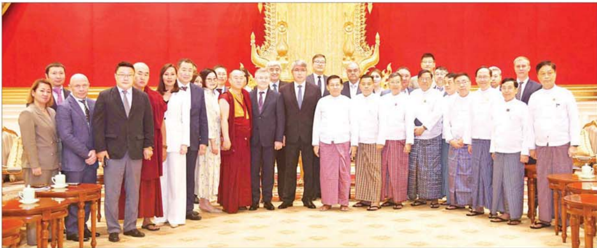
နိုင်ငံတော်စီမံအုပ်ချုပ်ရေးကောင်စီဥက္ကဋ္ဌ နိုင်ငံတော်ဝန်ကြီးချုပ် ဗိုလ်ချုပ်မှူးကြီးမင်းအောင်လှိုင် ဦးဆောင်သောအဖွဲ့နှင့် ရုရှားဖက်ဒရေးရှင်းနိုင်ငံ ဘုရားတီးရားပြည်နယ် အကြီးအကဲ ဘုရားတီးရားပြည်နယ်အစိုးရဥက္ကဋ္ဌ H. E. Mr. Alexey Sambuevich Tsydenov ဦးဆောင်သည့် ကိုယ်စားလှယ်အဖွဲ့တို့ တွေ့ဆုံမိတ်တမ်းတင်စာတံပုံရိုက်စဉ်။

ယင်းနောက် ဘုရားတီးရား ပြည်နယ်အကြီးအကဲဘုရားတီးရား ပြည်နယ်အစိုးရဥက္ကဋ္ဌက ယခု