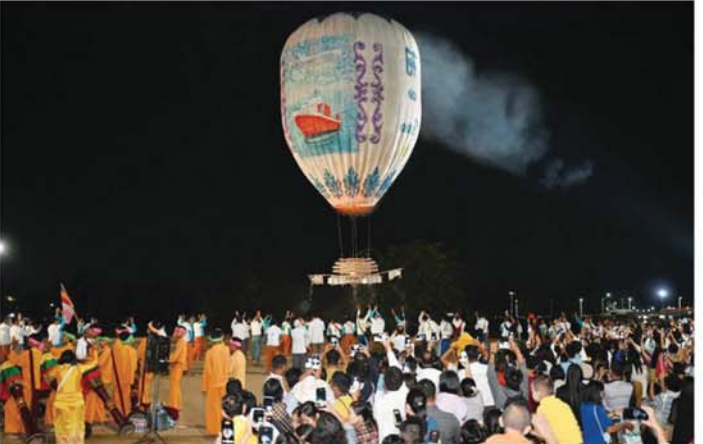
စိန်နားပန်မီးပုံးပျံကြီး လွှတ်တင်ပူဇော်မှုကို တွေ့ရစဉ်။