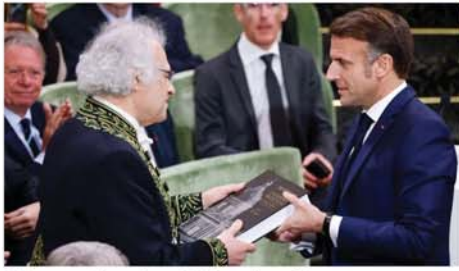
ပြင်ပပညာရှင်များ၏ အကြံပြုချက်များလည်း ရယူခဲ့ကြောင်း သိရသည်။ Mon

ဝဲရစ် နိုဝင်ဘာ ၁၅ သား၊ အမျိုးသမီးပေါင်း ၄၀ ဦး နဝမမြောက် ပြင်ဆင်ထုတ်ဝေသော ပြင်သစ်အဘိဓာန်ကို နိုဝင်ဘာ ၁၄ ရက်တွင် ပြင်သစ်အဘိဓာန်ပြုစုရေးကော်မတီက အပ်နှင်းရာ သမ္မတ အိမ်နိမ့်ယယ်လ်မာရွန် လက်ခံရယူခဲ့ကြောင်း ဘီဘီစီသတင်းဌာနက ဖော်ပြသည်။ ဘာသာဗေဒပညာရှင် အမျိုးသား၊ အမျိုးသမီးပေါင်း ၄၀ ဦး စုစည်းကာ နှစ် ၄၀ ကြာ တည်းဖြတ်ခဲ့ရသော အဆိုပါ ပြင်သစ်အဘိဓာန်တွင် ဝေါဟာရသစ် ၂၀၀၀၀ ပါဝင်သည်ဟု ဆိုသည်။ ပြင်သစ်အဘိဓာန်ပြုစုရေးကော်မတီဝင်များသည် အပတ်စဉ် ကြာသပတေးနေ့ နံနက်တိုင်း တွေ့ဆုံကာ အဓိပ္ပာယ်ဖွင့်ဆိုမှုများနှင့်ပတ်သက်၍ ညှိနှိုင်းကာ