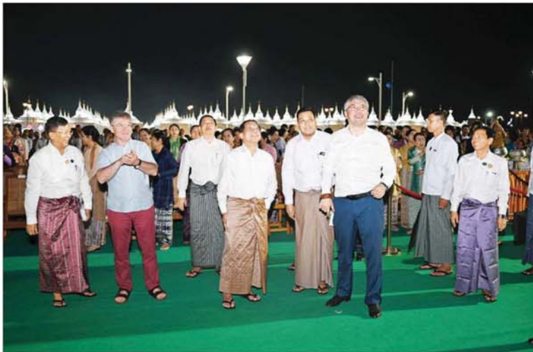
နိုင်ငံတော်စီမံအုပ်ချုပ်ရေးကောင်စီဥက္ကဋ္ဌ နိုင်ငံတော်ဝန်ကြီးချုပ် ဗိုလ်ချုပ်မှူးကြီးမင်းအောင်လှိုင်နှင့် ဇနီး ဒေါ်ကြူကြူလှ ရုရှားဖက်ဒရေးရှင်းနိုင်ငံ ဘုရားတီးရားပြည်နယ်အကြီးအကဲ ဘုရားတီးရားပြည်နယ်အစိုးရဥက္ကဋ္ဌ H.E. Mr. Alexey Sambuevich Tsydenov နှင့် ချစ်ကြည်ရေးကိုယ်စားလှယ်အဖွဲ့များ၊ အခမ်းအနားတက်ရောက်လာကြသူများ ရုရှား- မြန်မာ ချစ်ကြည်ရေးအထိမ်းအမှတ်အဖြစ် မြတ်ရောင်မြည် စိန်နားပန် မီးပုံးပျံလွှတ်တင်မှုကို ကြည့်ရှုအားပေးစဉ်။

ယင်းနောက် ပဉ္စမဆုရရှိသည့် နေပြည်တော်ကောင်စီ ကိုယ်စားပြုအသင်းအား ကောင်စီဝင်ဗိုလ်ချုပ်ကြီး မြထွန်းဦးက လည်းကောင်း၊ စတုတ္ထဆုရရှိသည့် ကချင်ပြည်နယ် ကိုယ်စားပြုအသင်းအား ကောင်စီတွဲဖက်အတွင်းရေးမှူးကလည်းကောင်း၊ တတိယဆုရရှိသည့် စစ်ကိုင်းတိုင်းဒေသကြီး ကိုယ်စားပြုအသင်းအား ကောင်စီအတွင်းရေးမှူးကလည်းကောင်း၊ ဒုတိယဆုရရှိသည့် တနင်္သာရီတိုင်းဒေသကြီးကိုယ်စားပြုအသင်းအား နိုင်ငံတော်စီမံအုပ်ချုပ်ရေး ကောင်စီဒုတိယဥက္ကဋ္ဌ ဒုတိယဝန်ကြီးချုပ်ကလည်းကောင်းဆုပေးလှူဒါန်းရင်းနှီးမြှင့်ခဲ့ခြင်းစီးပွား