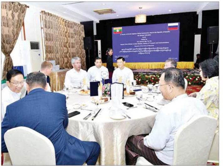
နိုင်ငံတော်စီမံအုပ်ချုပ်ရေးကောင်စီအဖွဲ့ဝင် ဒုတိယဝန်ကြီးချုပ်နှင့် ပြည်ထောင်စုဝန်ကြီး ဗိုလ်ချုပ်ကြီး မြထွန်းဦး ဘူရားတီးရားပြည်နယ်အကြီးအကဲ H. E. Mr. Alexey Sambuevich Tsydenov ဦးဆောင်သော ကိုယ်စားလှယ်အဖွဲ့အား ဂုဏ်ပြုနေ့လယ်စာဖြင့် တည်ခင်းစဉ်ခံခဲ့သည်။

တက်ရောက်ညှိပိုင်းတွင် ဘူရားတီးရားပြည်နယ် အကြီးအကဲနှင့် အဖွဲ့သည် နေပြည်တော်ကောင်စီနယ်မြေ နေပြည်တော် ဒုတိယဝန်ကြီးချုပ် ဒုဒွယျာဉ်တော်အတွင်း ကျင်းပလျက်ရှိသည့် တန်ဆောင်တိုင် မီးထွန်းပွဲတော်နှင့် မီးပုံးပျံလွှတ်တင်ပူဇော်ပွဲတော်သို့ တက်ရောက်ကြသည်။ သတင်းစဉ်