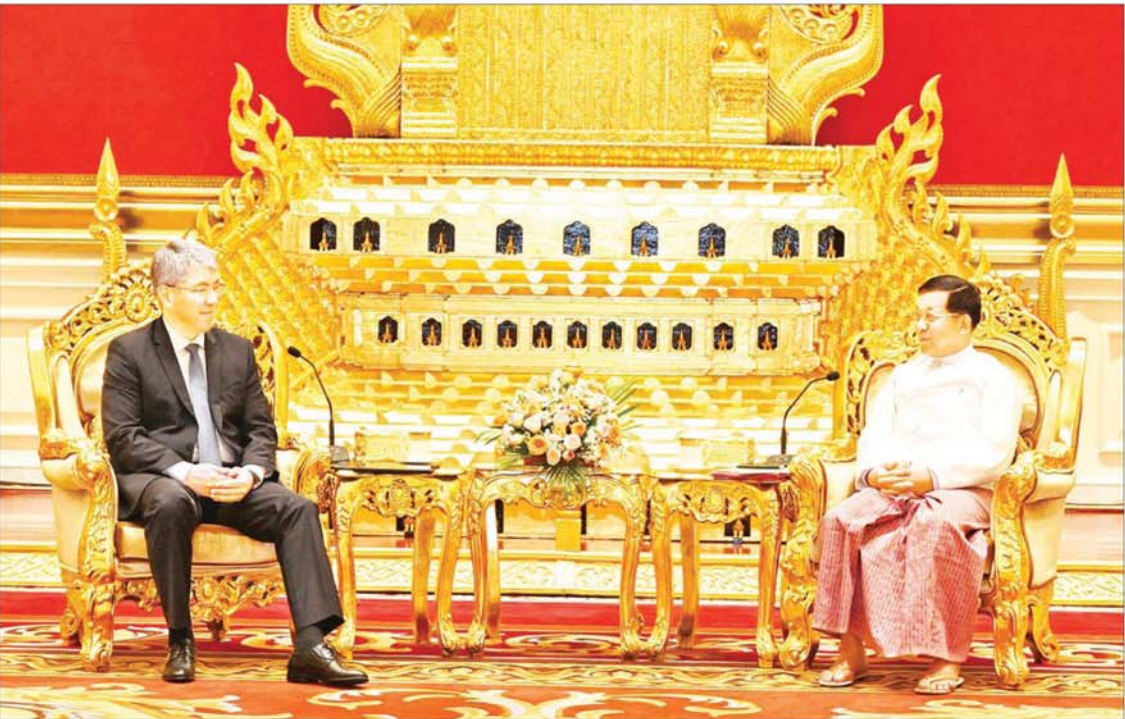
နိုင်ငံတော်စီမံအုပ်ချုပ်ရေးကောင်စီဥက္ကဋ္ဌ နိုင်ငံတော်ဝန်ကြီးချုပ် ပိုလ်ချုပ်မှူးကြီးမင်းအောင်လှိုင် ရုရှားဖက်ဒရေးရှင်းနိုင်ငံ ဘူရားတီးရားပြည်နယ်အကြီးအကဲ ဘူရားတီးရားပြည်နယ်အစိုးရဥက္ကဋ္ဌ H. E. Mr. Alexy Sambuevich Tsydenov အား လက်ခံတွေ့ဆုံစဉ်။

နေပြည်တော် နိုဝင်ဘာ ၁၅ နိုင်ငံတော်စီမံအုပ်ချုပ်ရေးကောင်စီ ဥက္ကဋ္ဌ နိုင်ငံတော်ဝန်ကြီးချုပ် ပိုလ်ချုပ်မှူးကြီး မင်းအောင်လှိုင်သည် ရုရှား ဖက်ဒရေရှင်းနိုင်ငံ ဘူရားတီးရားပြည်နယ် အကြီးအကဲ ဘူရားတီးရားပြည်နယ် အစိုးရဥက္ကဋ္ဌ H. E. Mr. Alexy Sambuevich Tsydenov ဦးဆောင်သော ကိုယ်စားလှယ်အဖွဲ့အား ယနေ့နံနက်ပိုင်းတွင် နေပြည်တော်ရှိ နိုင်ငံတော်စီမံအုပ်ချုပ်ရေးကောင်စီဥက္ကဋ္ဌရုံး သံတမန်ဆောင် စည်ခန်းမ၌ လက်ခံတွေ့ဆုံသည်။