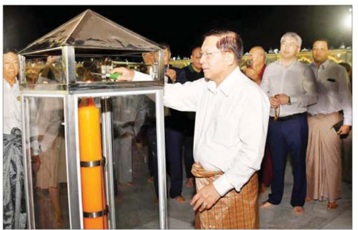
နိုင်ငံတော်စီမံအုပ်ချုပ်ရေးကောင်စီဥက္ကဋ္ဌ နိုင်ငံတော်ဝန်ကြီးချုပ် ဗိုလ်ချုပ်မှူးကြီးမင်းအောင်လှိုင် မာရဝိဇယဗုဒ္ဓရုပ်ပွားတော်မြတ်ကြီးအား ဆီမီးထွန်းညှိပူဇော်စဉ်။

တီးရားပြည်နယ်အစိုးရဥက္ကဋ္ဌနှင့် အခမ်းအနားတက်ရောက်လာသူများသည် မာရဝိဇယဗုဒ္ဓရုပ်ပွားတော်မြတ်ကြီးအား ဖူးမြော်ကြည့်ညှိ၍ ပန်း၊ ရေချမ်း၊ ဆီမီးများ ကပ်လှူပူဇော်ကြပြီး ဆီမီးများကို အတူတကွ ထွန်းညှိပူဇော်ကြသည်။ ယင်းနောက် မာရဝိဇယဗုဒ္ဓရုပ်ပွားတော် မြတ်ကြီးအား လက်ယာရစ် လှည့်လည်ပူဇော်ပြီး သဒ္ဓါမိပတိ ခေါင်းလောင်းတော်အား ထိုးခတ်ပူဇော်ကြသည်။ ထို့နောက် နိုင်ငံတော်စီမံအုပ်ချုပ်ရေးကောင်စီဥက္ကဋ္ဌ နိုင်ငံတော်ဝန်ကြီးချုပ်နှင့် ဧည့်သည်သည်များအဖွဲ့များ၊ အခမ်းအနားတက်ရောက်လာသူများသည် အခမ်းအနားကျင်းပမည့် နေရာသို့ရောက်ရှိကြရာ တိုင်းရင်းသားရိုးရာယဉ်ကျေးမှုအဖွဲ့များက တိုင်းရင်းသားရိုးရာ အကအလှများဖြင့် ကြိုဆိုကြသည်။ ဆက်လက်၍ နိုင်ငံတော်စီမံအုပ်ချုပ်ရေးကောင်စီ ဥက္ကဋ္ဌ နိုင်ငံတော်ဝန်ကြီးချုပ်နှင့် ရှုရှားဖက်ဒရေးရှင်းနိုင်ငံ ဘုရားတီးရားပြည်နယ်အကြီးအကဲ ဘုရား