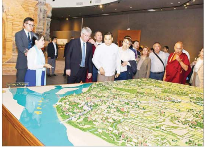
ဘူရားတီးရားပြည်နယ်အကြီးအကဲ H. E. Mr. Alexey Sambuevich Tsydenov ဦးဆောင်သော ကိုယ်စားလှယ်အဖွဲ့ အမျိုးသားပြတိုက်တွင် ကြည့်ရှုလေ့လာခဲ့သည်။