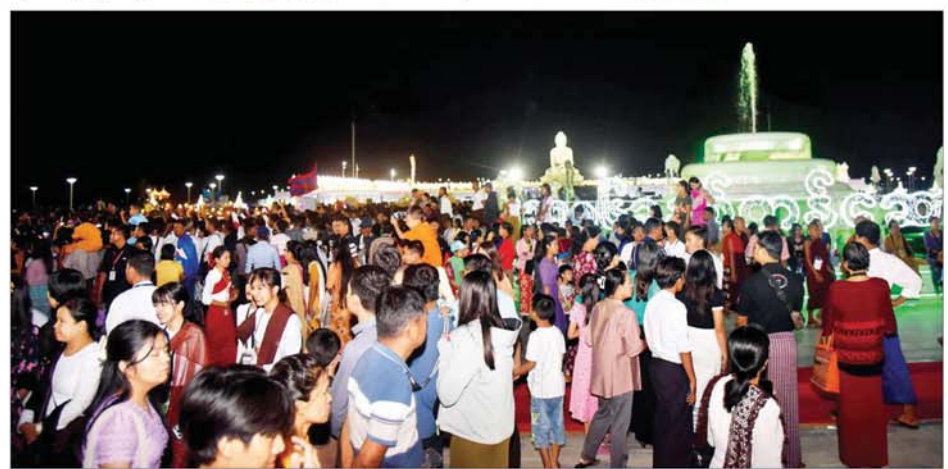
မာရဝိဇယဗုဒ္ဓရုပ်ပွားတော်မြတ်ကြီး၌ တန်ဆောင်တိုင်မီးထွန်းပွဲတော်နောက်ဆုံးနေ့တွင် အနယ်နယ်အရပ်ရပ်မှ ဘုရားဖူးလာပြည်သူများဖြင့် အထူးစည်ကားများပြားလျက်ရှိသည်ကို တွေ့ရစဉ်။

ထိန်းရံတပ်ဖွဲ့ဝင်များက ဘုရား အဝင်၊ အထွက် လမ်းကြောင်းများ ပိတ်ဆို့မှုမရှိစေရေးအတွက် စနစ် တကျဆောင်ရွက်ပေးကာ ဗုဒ္ဓ ဥယျာဉ် ဝတ္ထုကြတ်တော်အတွင်း မီးထွန်း ပွဲတော်ကြီး၌လည်း တပျော်တပါး ပါဝင်ဆင်နွှဲရန် ရောက်ရှိလာကြသည့် ဘုရားဖူး ပြည်သူများဖြင့် အထူးစည်ကား လျက်ရှိသည်ကို ကြည့်နူးဖွယ်ရာ တွေ့မြင်ရသည်။ ဘုရားမုခ်ဦးများ ရှေ့၌လည်း တန်ဆောင်တိုင် မီးထွန်း ပွဲတော်လာ ဘုရားဖူးပြည်သူများ ဘေးအန္တရာယ် ကင်းရှင်းစွာဖြင့် စိတ်လက်အေးချမ်းစွာ ဘုရား ဖူးမြော် ပါဝင်ဆင်နွှဲနိုင်ရေး အတွက် တာဝန်ရှိသူများက လုံခြုံ ရေးအရ လိုအပ်သည့်စစ်ဆေးမှု များ ဆောင်ရွက်ပေးပြီး ပွဲတော် အတွင်း ကာသိုလ်ပြု ဆီမီးထွန်းညှိ နိုင်မည့်နေရာများ၊ မီးပုံးပျံလွှတ် တင် ပူဇော်မည့်နေရာများ၊ ဈေး ပွဲတော်နေရာများနှင့် အခြားသွား