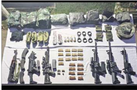
ရှမ်းပြည်နယ်(အရှေ့ပိုင်း) တာချီလိတ်မြို့နယ် ရန်အောင်မြေရပ်ကွက်ရှိ First Rate Mobile ဖုန်းဆိုင်အား သေနတ်ဖြင့် ဝင်ရောက် ပစ်ခတ်လုယက်မှုမှ လုယက်မှုကျူးလွန်ရာတွင် အသုံးပြုခဲ့သည့် ဆိုင်ကယ်နှစ်စီးနှင့် လက်နက်ခဲယမ်းများ ထပ်မံသိမ်းဆည်းရမိမှုမှတ်တမ်း ဓာတ်ပုံ။

နိုဝင်ဘာ ၁၃ ရက် နံနက် ၁၀ နာရီ ၄၅ မိနစ်တွင် ရှမ်းပြည်နယ် (အရှေ့ပိုင်း) တာချီလိတ်မြို့နယ် ရန်အောင်မြေရပ်ကွက် ဗိုလ်ချုပ်လမ်းမဘေးရှိ First Rate Mobile ဖုန်းဆိုင်သို့ အမျိုးသား လေးဦး(စိစစ်ဆဲ)က သေနတ်များကိုင်ဆောင်ဝင်ရောက်လာပြီး ဆိုင်ဝန်ထမ်း တစ်ဦးအား သေနတ်ဖြင့်ပစ်ခတ်သတ်ဖြတ်၍ ဆိုင်အတွင်းရှိ iPhone အမျိုးအစား လက်ကိုင်ဖုန်းအလုံး ၂၀ (တစ်ဦးစီလျှင် ၁၀) သိမ်းဆည်းကာ လုယက်ယူဆောင်ထွက်ပြေးသွားခဲ့သဖြင့် တာချီလိတ် မြို့မရဲစခန်းတွင် အမှုဖွင့်လှစ်ကာ တရားခံများဖမ်းဆီးရမိနိုင်ရေး လုံခြုံရေးတပ်ဖွဲ့ဝင် များက လုယက်မှုကျူးလွန်သူတရားခံများ ခိုအောင်းရောက်ရှိနေထိုင် လျက်ရှိသည့် အသုံးပြုခဲ့သည့် ပစ္စည်းအသုံးစရိတ် လေးလက်နှင့် တရားခံများက သေနတ်များဖြင့် စတင်ပစ်ခတ်ကာ ထွက်ပြေးရန် ကြိုးစားသဖြင့် ပြန်လည်ခုခံပစ်ခတ်ဖမ်းဆီးခဲ့ရာ လုယက်မှုကျူးလွန်ခဲ့သူ တရားခံ ၅ ဦး(၃၄)နှစ် (ဘ)ဦးဖန်ကျင်းလျှစ်ပါ အမျိုးသားလေးဦးအား လုယက်မှုကျူးလွန်စဉ် အသုံးပြုခဲ့သည့် ပစ္စည်းအသုံးစရိတ် လေးလက်နှင့် ဆက်စပ်ပစ္စည်းများ၊ မော်တော်ယာဉ်တစ်စီး၊ လုယက်မှုကျူးလွန် ရာမရရှိသည့် လက်ကိုင်ဖုန်း ၁၂ လုံးတို့နှင့်အတူ အသေပစ်ခတ်ဖမ်းဆီးရ မိခဲ့ကြောင်း နိုဝင်ဘာ ၁၅ ရက် ထုတ်နိုင်ငံပိုင်သတင်းစာများ၌ သတင်း ထုတ်ပြန်ပြီးဖြစ်ပါသည်။