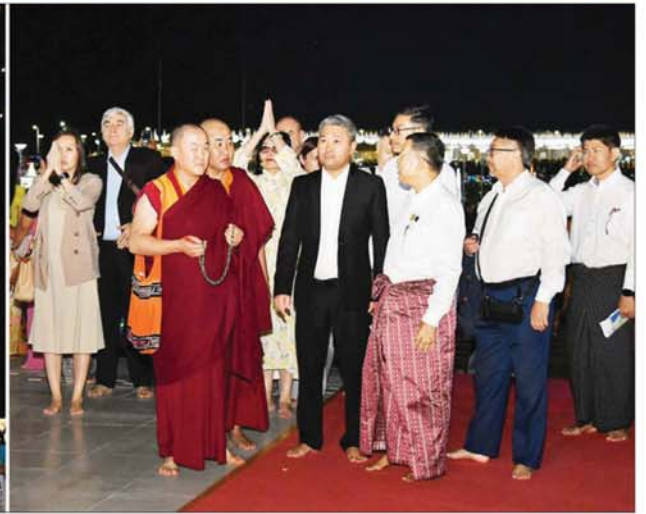
ဘူရားတီးရားပြည်နယ်အကြီးအကဲ H. E. Mr. Alexey Sambuevich Tsydenov ဦးဆောင်သော ကိုယ်စားလှယ်အဖွဲ့ နေပြည်တော်ကောင်စီနယ်မြေ နေပြည်တော် ဒုတိယဝန်ကြီးချုပ် ဒုဒွယျာဉ်တော်အတွင်းရှိ မာရဂိဇယရပ်ပွားတော်မြတ်ကြီးအား ဖူးမြော်ကြည့်ရှုခဲ့သည်။

ရေးနှင့်ဆက်သွယ်ရေးဝန်ကြီးဌာန ပြည်ထောင်စုဝန်ကြီး ဗိုလ်ချုပ်ကြီး မြထွန်းဦးက ဘူရားတီးရားပြည်နယ်အကြီးအကဲနှင့်အဖွဲ့အား Aureum Palace Hotel ၌ ဂုဏ်ပြုနေ့လယ်စာဖြင့် တည်ခင်းစဉ်ခံခဲ့ရသည့်ပွဲသို့ ဒုတိယဝန်ကြီးချုပ်နှင့်စီမံကိန်းနှင့်ဘဏ္ဍာရေးဝန်ကြီးဌာန ပြည်ထောင်စုဝန်ကြီး ဦးဝင်းရှိန်အပါအဝင် ပြည်ထောင်စုဝန်ကြီးများ၊ မြန်မာနိုင်ငံဆိုင်ရာ ရုရှားသံအမတ်ကြီးနှင့် ကိုယ်စားလှယ်အဖွဲ့များ တက်ရောက်ခဲ့ကြသည်။