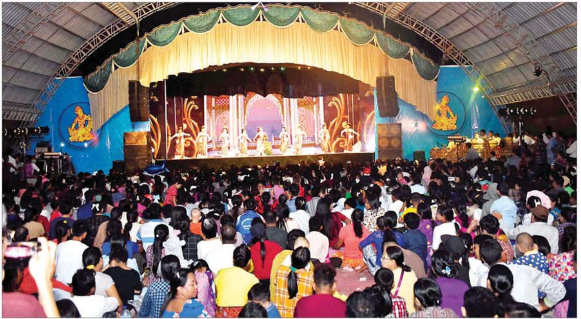
ဓာတ်မင်းသားဖိုးချစ်နှင့်အတူ သာသနာရေးနှင့်ယဉ်ကျေးမှုဝန်ကြီးဌာနမှ အနုပညာရှင်ဝန်ထမ်းများက ဖျော်ဖြေတင်ဆက်ကြစဉ်။

အလားတူဘုရားဖူးလာပြည်သူများ ဒေသထွက်လက်ဆောင်အဖြစ် ဝယ်ယူနိုင်ရန်အတွက် အသေးစား၊ အငယ်စားနှင့်