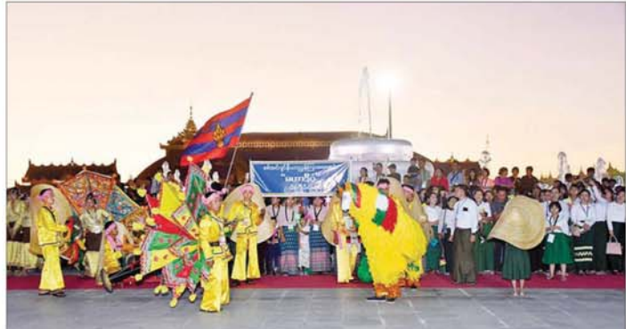
တိုင်းရင်းသားရိုးရာအကအလှများဖြင့် ဖျော်ဖြေတင်ဆက်စဉ်။