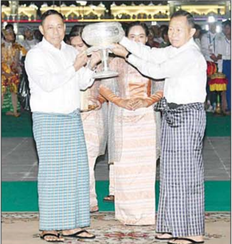
နိုင်ငံတော်စီမံအုပ်ချုပ်ရေးကောင်စီဒုတိယဥက္ကဋ္ဌ ဒုတိယဝန်ကြီးချုပ် ဒုတိယဗိုလ်ချုပ်မှူးကြီးစိုးဝင်း၊ ညမီးကျည် (ညမီးကြီး) မီးပုံးပျံလွှတ်တင်ပူဇော်ပြိုင်ပွဲတွင် ဒုတိယဆုရရှိသည့် ပြည်ထဲရေးဝန်ကြီးဌာန ကိုယ်စားပြုအသင်းအား ဆုပေးလှူဒါန်းပေးအပ်ချီးမြှင့်စဉ်။