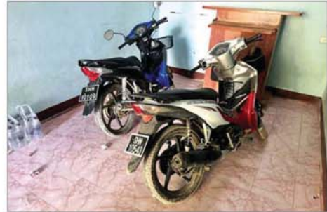
ရှမ်းပြည်နယ်(အရှေ့ပိုင်း) တာချီလိတ်မြို့နယ် ရန်အောင်မြေရပ်ကွက်ရှိ First Rate Mobile ဖုန်းဆိုင်အား သေနတ်ဖြင့် ဝင်ရောက် ပစ်ခတ်လုယက်မှုမှ လုယက်မှုကျူးလွန်ရာတွင် အသုံးပြုခဲ့သည့် ဆိုင်ကယ်နှစ်စီးနှင့် လက်နက်ခဲယမ်းများ ထပ်မံသိမ်းဆည်းရမိမှုမှတ်တမ်း ဓာတ်ပုံ။