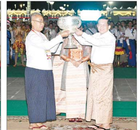
နိုင်ငံတော်စီမံအုပ်ချုပ်ရေးကောင်စီဥက္ကဋ္ဌ နိုင်ငံတော်ဝန်ကြီးချုပ် ဗိုလ်ချုပ်မှူးကြီးမင်းအောင်လှိုင် မသိုးရွှေကြာသင်္ကန်းရက်လုပ်ပူဇော်ပြိုင်ပွဲတွင် ပထမဆုရရှိသည့် မန္တလေးတိုင်းဒေသကြီးကိုယ်စားပြု အသင်းအား ဆုပေးအပ်ခြင်းဖြစ်သည်။