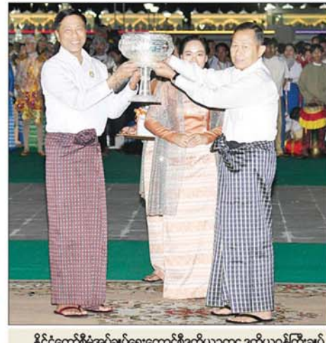
နိုင်ငံတော်စီမံအုပ်ချုပ်ရေးကောင်စီဒုတိယဥက္ကဋ္ဌ ဒုတိယဝန်ကြီးချုပ် ဒုတိယဗိုလ်ချုပ်မှူးကြီးစိုးဝင်း၊ စိန်နားပန် မီးပုံးပျံလွှတ်တင်ပူဇော်ပြိုင်ပွဲတွင် ဒုတိယဆုရရှိသည့် လှပဝန်ထမ်း၊ ကယ်ဆယ်ရေးနှင့် ပြန်လည်နေရာချထားရေးဝန်ကြီးဌာန ကိုယ်စားပြုအသင်းအား ဆုပေးလှူဒါန်းပေးအပ်ချီးမြှင့်စဉ်။