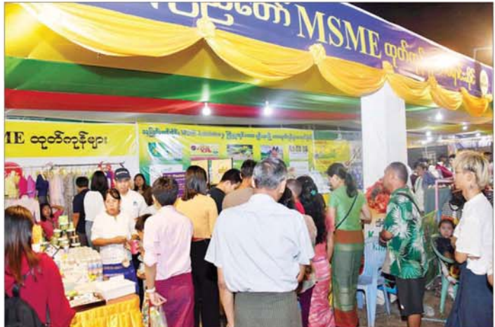
ဒေသထွက်ကုန်၊ စားသောက်ကုန်နှင့် လူသုံးကုန်ပစ္စည်းအရောင်းဆိုင်များတွင် ဝယ်ယူအားပေးကြ သူများကို တွေ့ရစဉ်။