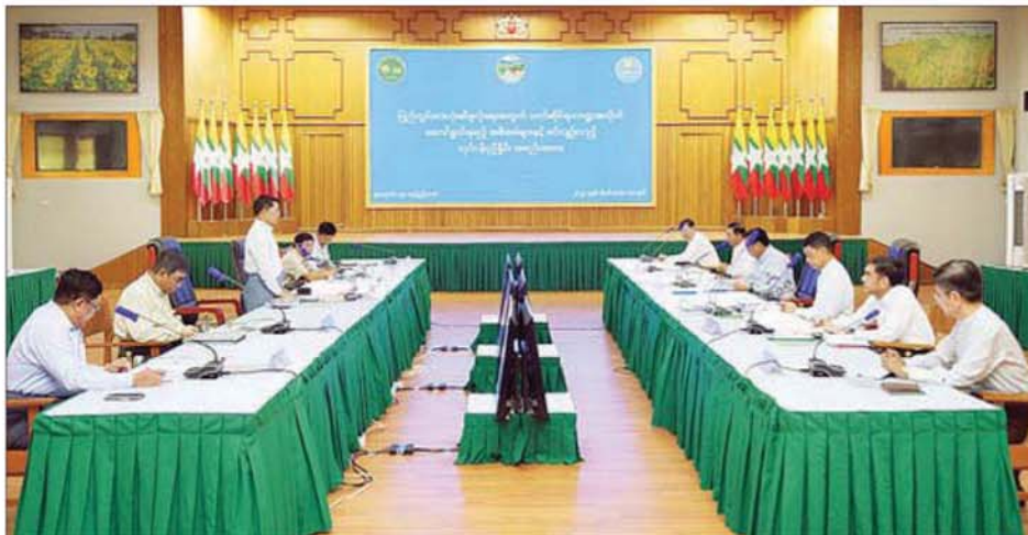
“ရက်” တိုင်ဖွန်းမန်တိုင်းကြောင့် တိုင်းဒေသကြီးနှင့် ပြည်နယ်များတွင် သီးနှံများ ရေကြီးနစ်မြုပ်ပျက်စီးခဲ့မှုအခြေအနေများကို ဆွေးနွေးခဲ့ကြပြီး သက်ဆိုင်ရာဌာနများ ပူးပေါင်းပါဝင်သည့် လုပ်ငန်းအဖွဲ့များဖြင့် ပြည်တွင်းစားသုံးဆီဖုလုံရေးနှင့် ပြည်ပမှ စားသုံးဆီတင်သွင်းမှု လျှော့ချနိုင်ရေးလုပ်ငန်းများကို ဆက်လက်ဆောင်ရွက်သွားမည်ဖြစ်ကြောင်း သိရသည်။ သတင်းစဉ် ၀-၀-၀-၀

ဆီထွက်သီးနှံများ တိုးချဲ့စိုက်ပျိုးထုတ်လုပ်ရေးနှင့် ပြည်တွင်းဆိကြိတ်စက်များ၏ ကုန်ကြမ်းလိုအပ်ချက်အပေါ် ပံ့ပိုးနိုင်ရေး ဆွေးနွေးပွဲကို ယနေ့နံနက်ပိုင်းက နေပြည်တော် ရုံးအမှတ်(၁၅) အစည်းအဝေးခန်းမ၌ ကျင်းပသည်။ အစည်းအဝေးတွင် ပြည်ထောင်စုဝန်ကြီး ဦးမင်းဆောင်၊ ဒေါက်တာ ချာလီသန်းနှင့် ဦးထွန်းအံ့တို့က ဦးဆောင်ဆွေးနွေးကြပြီး စိုက်ပျိုးရေး၊ မွေးမြူရေးနှင့် ဆည်မြောင်းဝန်ကြီးဌာန၊ စက်မှုဝန်ကြီးဌာနနှင့် စီးပွားရေးနှင့် ကူးသန်းရောင်းဝယ်ရေးဝန်ကြီးဌာနတို့မှ ဒုတိယဝန်ကြီးနှင့် အမြဲတမ်းအတွင်းဝန်များ၊ ညွှန်ကြားရေးမှူးချုပ်များ၊ ဘာသာရပ်ဆိုင်ရာကျွမ်းကျင်သူများက သက်ဆိုင်ရာကဏ္ဍများအလိုက် တင်ပြ ဆွေးနွေးခဲ့ကြသည်။ ထိုသို့ဆွေးနွေးရာတွင် ၂၀၂၄-၂၀၂၅ ခုနှစ် စိုက်ပျိုးရာသီတွင် ဆီထွက်သီးနှံများ စိုက်ပျိုးထုတ်လုပ်ရန် လျာထားချက်နှင့် ယနေ့အထိ ဆီထွက်သီးနှံများ စိုက်ပျိုးပြီးစီးမှု၊ တိုင်းဒေသကြီး၊ ပြည်နယ်အလိုက် မိုးခြေပမာဏ၊ မိုးခန့်ခွဲမှု၊ မိုးအကြာသီးနှံများ စိုက်ပျိုးထားရှိမှုအခြေအနေနှင့် ယခင်နှစ် ကာလတူနှင့် နှိုင်းယှဉ်ချက်၊ စက်မှုကြီးကြပ်ရေးနှင့် စစ်ဆေးရေးဦးစီးဌာနမှ စာရင်းကောက်ယူရရှိသည့် တစ်နှစ်ကုန်ကြမ်း လိုအပ်ချက်အပေါ် ၂၀၂၃-၂၀၂၄ ခုနှစ် ဆီထွက်သီးနှံစိုက်ပျိုးထုတ်လုပ်မှုမှ ဒေသအလိုက် လအလိုက် ကုန်ကြမ်းပံ့ပိုးနိုင်မည့်အခြေအနေ၊