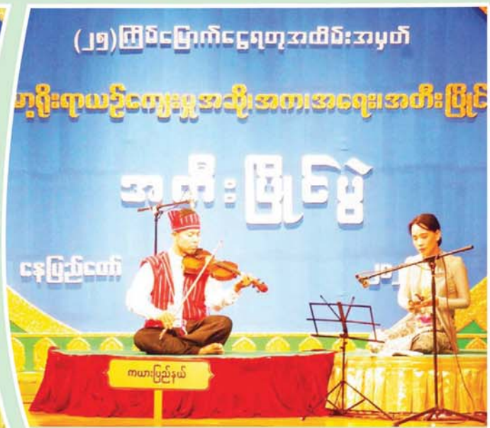
တယောအတီးဖြိုင်ပွဲ ဝါသနာရှင် အဆင့်မြင့်ပညာအဆင့် (အမျိုးသား)၌ ပထမဆုရရှိသည့် ကယားပြည်နယ်မှ မောင်စိုးသူ "ကျွန်းကျွန်းပိုင်သ" (ကြိုး) သီချင်းဖြင့် တီးခတ်ယှဉ်ပြိုင်ပွဲစဉ်။