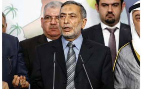
အီရတ်ပါလီမန်ဥက္ကဋ္ဌအဖြစ် ရွေးကောက်တင်မြှောက်ခံရသည့် မာမူတ်အယ်လ်မတ်ရှ်ဟာဒါနီကို အောက်တိုဘာ ၃၁ ရက်က တွေ့ရစဉ်။

တပ်ဖွဲ့ဝင်များနှင့် နယ်စပ်ရှိ အစွဲရနေစခန်းများကို မိမိတို့ဦးတည်တိုက်ခိုက်ခဲ့ခြင်းဖြစ်ကြောင်း ဟစ်ဘိုလာတို့ဘက်က သတင်းထုတ်ပြန်သည်။ ဒုံးလက်နက်များ လာရာလမ်းကြောင်းကို အစွဲရောက်ကာ ထောက်လှမ်းကာ ဟစ်ဘိုလာပစ်မှတ်များကို တန်ပြန်တိုက်ခိုက်ရန် စီစဉ်နေကြောင်း သိရသည်။