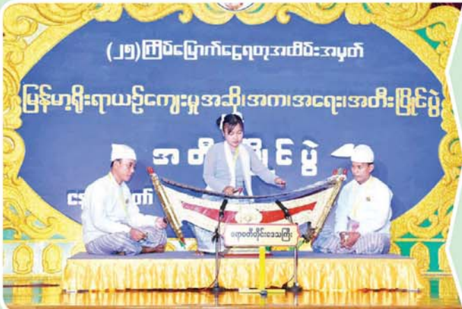
(၂၅)ကြိမ်မြောက်ငွေရတုအထိမ်းအမှတ်

ဒိုးပတ်အတီးပြိုင်ပွဲ အခြေခံပညာအဆင့် (အမျိုးသား အသက် ၁၅ နှစ်မှ ၂၀ နှစ်အတွင်း)၌ ပထမဆုရရှိသည့် စစ်ကိုင်းတိုင်းဒေသကြီးမှ မောင်မြိုးသူရနှင့်အဖွဲ့ တီးခတ်ယှဉ်ပြိုင်ဟန်။