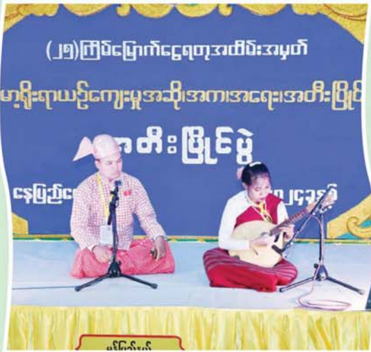
(၂၅)ကြိမ်မြောက်ငွေရတုအထိမ်းအမှတ်

မြန်မာ့ရိုးရာယဉ်ကျေးမှုအဆို၊အက၊အရေး၊အတီးပြိုင်ပွဲ