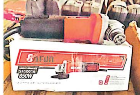
(မန္တလေးနေ့စဉ်သတင်းအဖွဲ့)