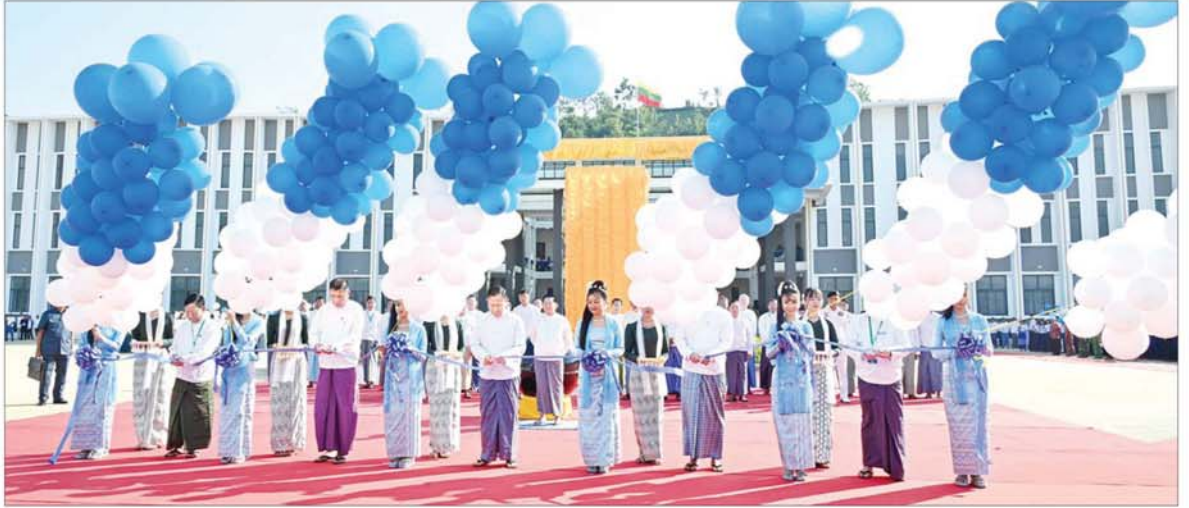
နိုင်ငံတော်စီမံအုပ်ချုပ်ရေးကောင်စီ ဒုတိယဥက္ကဋ္ဌ ဒုတိယဝန်ကြီးချုပ် ဒုတိယဗိုလ်ချုပ်မှူးကြီးစိုးဝင်း၊ ပြည်ထောင်စုဝန်ကြီးများဖြစ်ကြသည့် ဒေါက်တာမျိုးသိန်းကျော်နှင့် ဦးမျိုးသန့်၊ အင်ဂျင်နီယာကောင်စီဥက္ကဋ္ဌ ဒေါက်တာအောင်ကျော်မြတ်၊ ဗိသုကာကောင်စီဥက္ကဋ္ဌ ဦးဝင်းဇော်တို့ မြန်မာနိုင်ငံအင်ဂျင်နီယာပညာရေး နှစ်(၁၀၀)ပြည့် ရာပြည့်သဘင်နှင့် Naypyitaw State Polytechnic University ဖွင့်ပွဲအခမ်းအနားကို ဖဲကြီးဖြတ်ဖွင့်လှစ်ပေးစဉ်။

အခမ်းအနားသို့ နိုင်ငံတော် စီမံအုပ်ချုပ်ရေးကောင်စီ ဒုတိယ ဥက္ကဋ္ဌ ဒုတိယဝန်ကြီးချုပ် ဒုတိယ ဗိုလ်ချုပ်မှူးကြီးစိုးဝင်း၊ ကောင်စီ တွဲဖက်အတွင်းရေးမှူး ဗိုလ်ချုပ်ကြီး ရဲဝင်းဦး၊ ကောင်စီဝင်များ၊ ပြည်ထောင်စု ဝန်ကြီးများနှင့် ပြည်ထောင်စုအဆင့်ပုဂ္ဂိုလ်များ၊ နေပြည်တော်ကောင်စီ ဥက္ကဋ္ဌ၊ ကာကွယ်ရေး ဦးစီးချုပ်ရှေးမှ အဆင့်မြင့်တပ်မတော်အရာရှိကြီး များ၊ နေပြည်တော်တိုင်းစစ်ဌာနချုပ်တိုင်းမှူး၊ ဒုတိယဝန်ကြီးများ၊ တက္ကသိုလ်အသီးသီးမှ ပါမောက္ခချုပ်၊ ဒုတိယပါမောက္ခချုပ်များ၊ ပြည်တွင်း၊ ပြည်ပ အဖွဲ့အစည်းများမှ အင်ဂျင်နီယာပညာရှင်ကြီးများ၊ ဖိတ်ကြားထားသူများ၊ ဆရာဆရာမ များနှင့် ကျောင်းသား ကျောင်းသူ များ တက်ရောက်ကြသည်။