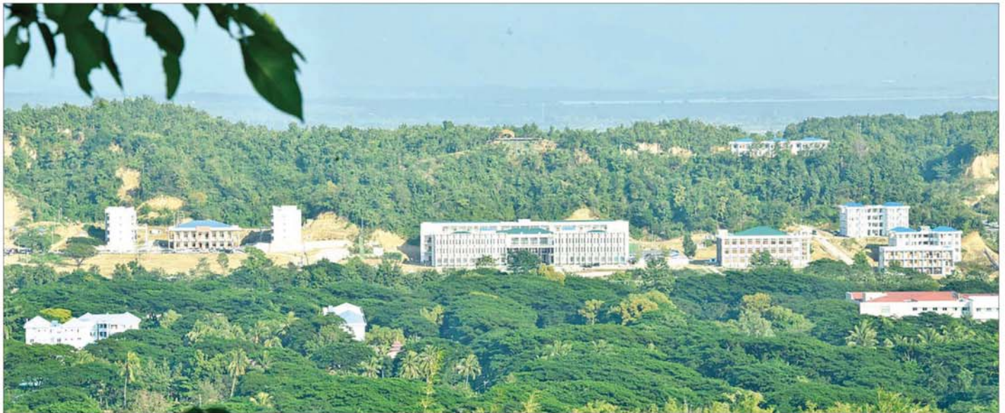
Naypyitaw State Polytechnic University ကို တွေ့ရစဉ်။

»» စာမျက်နှာ ၄ မှ ထို့အပြင် အရည်ပေး ဓါတ်ပစ္စည်း ပေးပို့သည့် Cable-Stayed တံတား အမျိုးအစား ပဲခူးမြစ်ကူးတံတား (သန်လျင်တံတား အမှတ်-၃) ကိုလည်း မြန်မာ့အင်ဂျင်နီယာ ပညာရပ်များ၏ ကြံ့ခိုင်မှုအားထုတ်မှုဖြင့် တည်ဆောက်ခဲ့ပြီး ၂၀၂၄ ခုနှစ် ဇူလိုင်လမှာ ဂုဏ်ယူဝင်ကြားစွာ ဖွင့်လှစ်နိုင်ခဲ့ကြောင်း။ မြန်မာနိုင်ငံအင်ဂျင်နီယာ ပညာရေးသမိုင်းကြောင်းကို ပြန်ပြောင်းကြည့်မည်ဆိုပါက ၁၉၂၃-၁၉၂၄ ပညာသင်နှစ်တွင် ရန်ကုန် တက္ကသိုလ်၌ အင်ဂျင်နီယာဌာန စတင်ဖွင့်လှစ်နိုင်ခဲ့ခြင်းကို မြန်မာနိုင်ငံအင်ဂျင်နီယာ ပညာရေး၏ အစဟု ဆိုနိုင်မည်ဖြစ်ကြောင်း။ ၁၉၂၄-၁၉၂၅ ပညာသင်နှစ်တွင် ဖြို့ပြအင်ဂျင်နီယာသင်တန်းကို စတင်ဖွင့်လှစ်နိုင်ခဲ့ပြီး ၁၉၂၈ ခုနှစ်တွင် မြန်မာ့ပထမဦးဆုံး အင်ဂျင်နီယာဘွဲ့ ၅ ဦးကို မွေးထုတ်ပေးနိုင်ခဲ့ကြောင်း။ ၁၉၆၁ ခုနှစ်တွင် ယခုလက်ရှိ အင်းစိန်မြို့နယ် ကြို့ကုန်းတွင်ရှိသည့် ရန်ကုန်နည်းပညာ တက္ကသိုလ်နေရာကို ပြောင်းရွှေ့