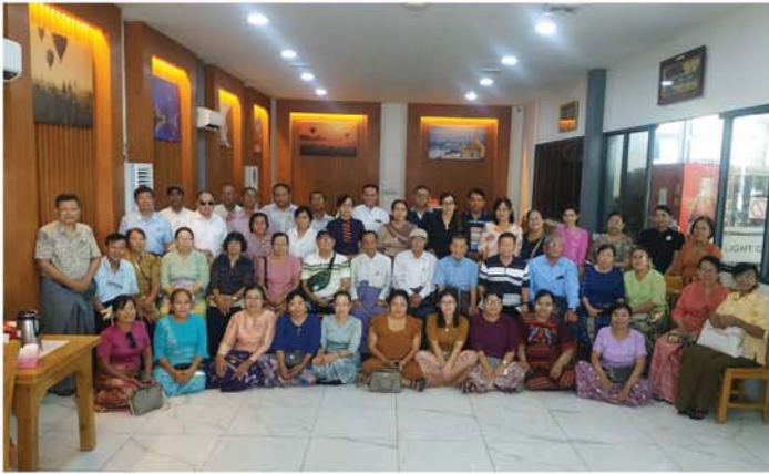
သန့်ရှင်းကျော်စော၊ ရွှေရဲပေါလျက် သွက်လက်ချက်ချာ၊ ရေဆာလောင်ကင်း အဆင်းလုပ်၊ အသက်ရှည်ရပြီး သုဗေလ၊ ဉာဏ်ထက်စွာ ဆယ်ဝ ရေအကျိုး

ရေသည် ကမ္ဘာပေါ် လူ၊ သက်ရှိသတ္တဝါတိုင်း အတွက် မရှိမဖြစ် လိုအပ်သော အရာဖြစ်ပါတယ်။ ဗုဒ္ဓမြတ်စွာဘုရားက ရေကုသိုလ်ဆိုသည်မှာ ဂုဏ်အိမ် နေသော်လည်း မအိမ်သည်ကုသိုလ်ဖြစ်ကြောင်း၊ အမြဲ တမ်းတိုးပွားနေသည့်ကုသိုလ်၊ တာဝရကုသိုလ်မျိုး ဖြစ်ကြောင်း၊ ရေကုသိုလ်၏ ပစ္စုပ္ပန်လက်ငင်း ကောင်းကျိုးတွေကို စေတနာထားပြီး ဆောင်ရွက် ပါက ဆုမတောင်းဘဲကောင်းကျိုးဆယ်ပါးရရှိ စေနိုင်ကြောင်းစသည်ဖြင့် မှတ်သားသိရှိရပါ တယ်။