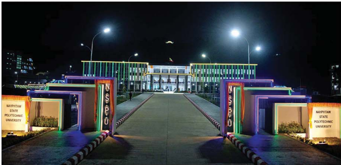
Naypyitaw State Polytechnic University ညရောင်ကို တွေ့ရစဉ်။

ယနေ့တွင် Naypyitaw State Polytechnic University ဖွင့်လှစ် မှုနှင့်အတူ တစ်ချိန်တည်း၌ ကျိုင်းတုံမြို့၊ ပင်လုံမြို့၊ မြိတ်မြို့၊ တားဝယ်မြို့နှင့် မအူပင်မြို့တို့တွင် လည်း Polytechnic University များကို ဖွင့်လှစ်နိုင်ခဲ့ပြီး Naypyitaw State Polytechnic University ကို Smart University ဖြစ်လာ စေရေး၊ နိုင်ငံတကာ ပိုလီတက္ကနစ် တက္ကသိုလ်များနည်းတူ အထူးပြု နယ်ပယ်ပေါင်းစုံနှင့် တွဲလွန်ဒီဂရီ သင်တန်းများကိုပါ တိုးမြှင့်ဖွင့်လှစ် နိုင်ရေး၊ နိုင်ငံအကျိုးပြုသုတေ သနလုပ်ငန်းများ ဆောင်ရွက်နိုင် ရေးအဆင့်ဆင့်ဆက်လက်ဆောင် ရွက်သွားမည်ဖြစ်ကြောင်း သိရ သည်။