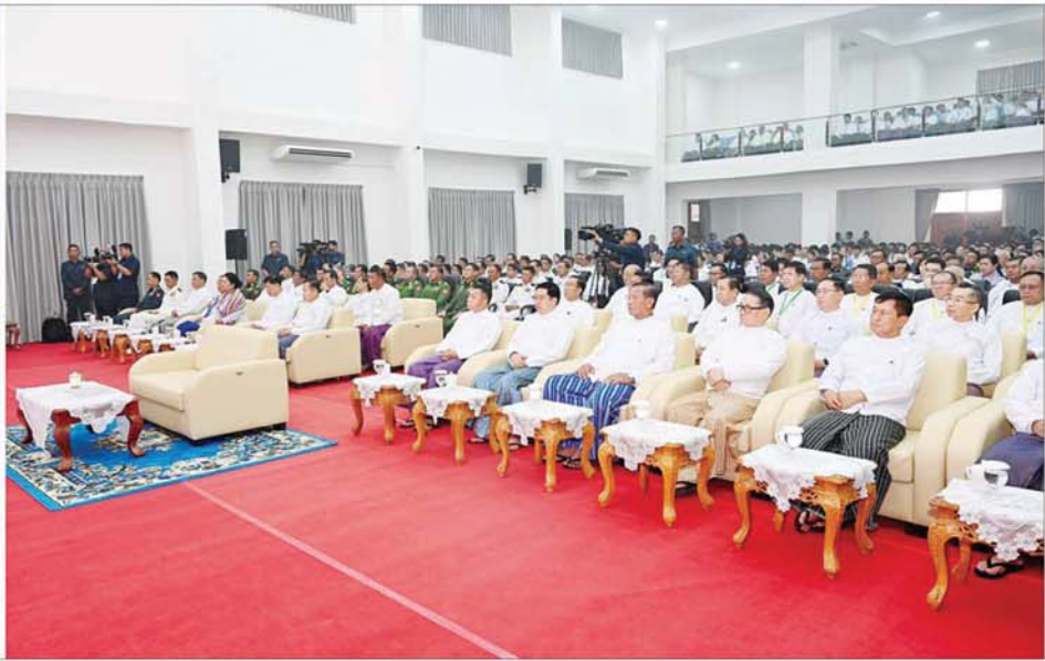
နိုင်ငံတော်စီမံအုပ်ချုပ်ရေးကောင်စီဥက္ကဋ္ဌ နိုင်ငံတော်ဝန်ကြီးချုပ် ဗိုလ်ချုပ်မှူးကြီးမင်းအောင်လှိုင် မြန်မာနိုင်ငံအင်ဂျင်နီယာပညာရေး နှစ်(၁၀၀)ပြည့် ရာပြည့်သဘင်နှင့် Naypyitaw State Polytechnic University ဖွင့်ပွဲ အခမ်းအနားတွင် အမှာစကားပြောကြားစဉ်။