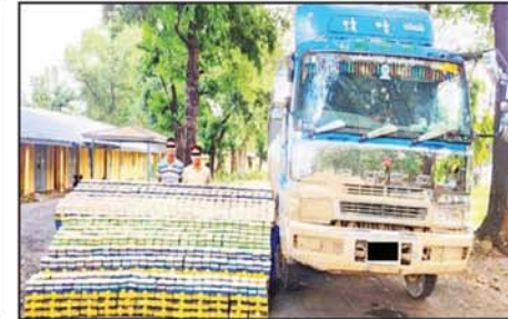
ဖြစ်မှုကျူးလွန်သူများကို ကလေးမြို့ ကျိုကုန်းကျေးရွာလမ်းဆုံ၌ သိမ်းဆည်းရမိသည့် မူးယစ်ဆေးဝါးများနှင့်အတူ တွေ့ရစဉ်။