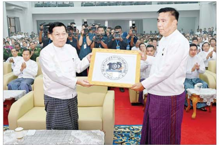
နိုင်ငံတော်စီမံအုပ်ချုပ်ရေးကောင်စီဥက္ကဋ္ဌ နိုင်ငံတော်ဝန်ကြီးချုပ် ဗိုလ်ချုပ်မှူးကြီးမင်းအောင်လှိုင် ထံ ပြည်ထောင်စုဝန်ကြီး ဒေါက်တာမျိုးသိန်းကျော်က မြန်မာနိုင်ငံအင်ဂျင်နီယာပညာရေးနှစ်(၁၀၀) ပြည့် ရာပြည့်သဘင်အထိမ်းအမှတ် အမှတ်တရလက်ဆောင်ပစ္စည်း ဂါရဝပြုပေးအပ်စဉ်။

သင်ကြားပို့ချပေးသည့် တက္ကသိုလ် ၅၆ ခုအထိ ဖွင့်လှစ်နိုင်ခဲ့ပြီ ဖြစ်ကြောင်း။ ယနေ့ဖွင့်လှစ်သည့် Naypyitaw State Polytechnic University နှင့်အတူ Polytechnic University ငါးခုကို ကျိုင်းတုံမြို့၊ ပင်လုံမြို့၊ မြိတ်မြို့၊ ထားဝယ်မြို့ နှင့် မအူပင်မြို့တို့တွင် ယနေ့ တစ်ပြိုင်နက်တည်း ဖွင့်လှစ်နိုင်ခဲ့ ပြီဖြစ်သည့်ကို တစ်ပါတည်း ပြောကြားလိုကြောင်း။ Polytechnic University ဆိုသည်မှာ သိပ္ပံ၊ နည်းပညာ၊ အင်ဂျင်နီယာ၊ သင်္ချာပညာရပ်နှင့် အသုံးချသိပ္ပံ၊ စီးပွားရေး၊ စီမံခန့်ခွဲမှုဆိုင်ရာ အဆင့်မြင့်ပညာရပ်များကို ဘွဲ့ကြိုသင်တန်းများသာမက ဘွဲ့လွန်သင်တန်းများအထိ လက်တွေ့ကျကျ လေ့ကျင့်သင်ကြားမှုများအပြင် လက်တွေ့လုပ်ငန်းခွင်နှင့် ချိတ်ဆက်သင်ကြားပို့ချပေးသည့် တက္ကသိုလ် တစ်ခုဖြစ်ကြောင်း။ ကျောင်းသားများ၏ အသက်မွေးဝမ်းကျောင်းမှ အတွက် လက်တွေ့ကျသည့် ပညာရေးကို သင်ကြားပို့ချပေးခြင်း။ ခေတ်မီနည်းပညာနှင့် သုတေသန ဖွံ့ဖြိုးတိုးတက်ရေး