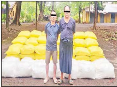
ဖြစ်မှုကျူးလွန်သူများကို ကလေးမြို့ တာဟန်းရပ်ကွက်တွင် သိမ်းဆည်းရမိသည့် ကဖင်းနှင့် မူးယစ်ဆေးဝါးများနှင့်အတူ တွေ့ရစဉ်။

နေပြည်တော် နိုဝင်ဘာ ၂၁ စစ်ကိုင်းတိုင်းဒေသကြီးနှင့် မန္တလေးတိုင်းဒေသကြီးတို့တွင် မူးယစ်မောင့်ခို ကိုဏ်းအဖွဲ့အား ငွေကျပ် ၂၇ ဒသမ ၅ ဘီလီယံကျော် တန်ဖိုးရှိ ဘိန်းဖြူ ကီလို ၁၅၀ ကျော်၊ စိတ်ကြွေးသွပ်ဆေးပြား ငါးသန်းကျော်၊ အိုက်စ်(မက်သ်အဖက်တမင်း) ၄၁၂ ကီလိုနှင့် ထိန်းချုပ်စာတုပစ္စည်း ကဖင်းသုံးတန်တို့နှင့်အတူ ဖော်ထုတ်ဖမ်းဆီးရမိခဲ့ကြောင်း မြန်မာနိုင်ငံရဲတပ်ဖွဲ့မှ သိရသည်။