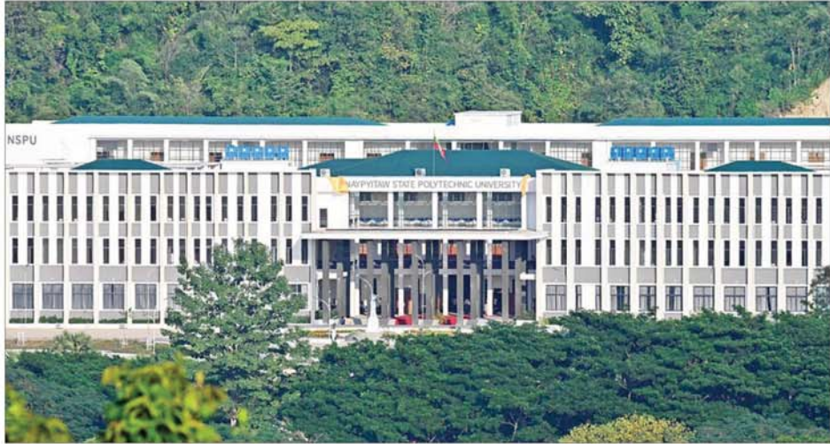
Naypyitaw State Polytechnic University အဆောက်အအုံကို တွေ့ရစဉ်။

ကို အထောက်အကူပြုနိုင်ရေး စသည့် ရည်ရွယ်ချက်များဖြင့် နေပြည်တော်နည်းပညာတက္ကသိုလ်ကို ၂၀၂၂ ခုနှစ် နိုဝင်ဘာလ ၁ ရက်တွင် အစိုးရနည်းပညာ ကောလိပ် (နေပြည်တော်)အဖြစ်မှ တက္ကသိုလ်အဖြစ် အဆင့်တိုးမြှင့် ဖွင့်လှစ်ပေးခဲ့ကြောင်း။ ၂၀၂၂-၂၀၂၃ ပညာသင်နှစ်တွင် အင်ဂျင်နီယာအထူးပြု ဘာသာရပ် ခြောက်ခုဖြင့် စတင်ဖွင့်လှစ်သင်ကြားပေးခဲ့ပြီး၊ ၂၀၂၃-၂၀၂၄ ပညာသင်နှစ်တွင် စိုက်ပျိုးရေး အင်ဂျင်နီယာ အထူးပြုဘာသာရပ်ကိုပါ တိုးချဲ့ဖွင့်လှစ်ခဲ့ကြောင်း။ ယခု ၂၀၂၄-၂၀၂၅ ပညာသင်နှစ်တွင် နေပြည်တော် နည်းပညာ တက္ကသိုလ်ကို Naypyitaw State Polytechnic University အဖြစ် ပြောင်းလဲတိုးချဲ့ဖွင့်လှစ်နိုင်ခဲ့ပြီး အင်ဂျင်နီယာအထူးပြု ဘာသာရပ် များသာမက ကွန်ပျူတာသိပ္ပံနှင့် ကွန်ပျူတာနည်းပညာ ဘာသာရပ်များကိုပါ တိုးချဲ့ဖွင့်လှစ် သင်ကြားပေးနိုင်ခဲ့ပြီ ဖြစ်ကြောင်း။