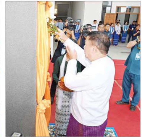
ပြည်ထောင်စုဝန်ကြီး ဒေါက်တာမျိုးသိန်းကျော် Naypyitaw State Polytechnic University ကမ္ဘည်းမော်ကွန်းကို အမွှေးနံ့သာ ရည်ပတ်ဖျန်းပေးစဉ်။