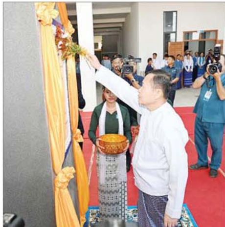
နိုင်ငံတော်စီမံအုပ်ချုပ်ရေးကောင်စီ ဒုတိယဥက္ကဋ္ဌ ဒုတိယဝန်ကြီးချုပ် ဒုတိယဗိုလ်ချုပ်မှူးကြီးစိုးဝင်း Naypyitaw State Polytechnic University ကမ္ဘည်းမော်ကွန်းကို အမွှေးနံ့သာရည် ပတ်ဖျန်းပေးစဉ်။

ယဉ်ကျေးမှု၊ မြန်မာ့ဗိသုကာ လက်ရာများနှင့် ခြယ်မှုန်းပြီး မြန်မာဗိသုကာပညာရှင်များ အလေးချိန်အများဆုံး စတင် ကျောက်ရုပ်ပွားတော်ကြီးတစ်ဆူ အဖြစ် မြန်မာ့အင်ဂျင်နီယာနှင့် ဗိသုကာပညာရှင်များ၏ ပူးပေါင်း ဆောင်ရွက်မှုဖြင့် CNC နည်းပညာ ကို အသုံးပြုပြီး အောင်မြင်စွာ တည်ထားခဲ့ခြင်း ဖြစ်ကြောင်း။ စာမျက်နှာ ၅ သို့ »»