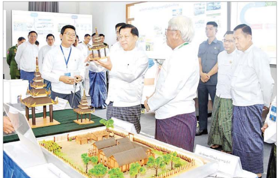
နိုင်ငံတော်စီမံအုပ်ချုပ်ရေးကောင်စီဥက္ကဋ္ဌ နိုင်ငံတော်ဝန်ကြီးချုပ် ဗိုလ်ချုပ်မှူးကြီးမင်းအောင်လှိုင် ခင်းကျင်းပြသထားသည့် ပြခန်းများကို လှည့်လည်ကြည့်ရှုစဉ်။

တန်းနိုင်သည့် ပညာရှင်များ ဖြစ်လာစေရေး အဘက်ဘက်မှ ပိုင်းခန်းကြီးပမ်းဆောင်ရွက်ကြ ရမည်ဖြစ်ကြောင်း။ နိုင်ငံအကျိုးကို ဆောင်ရွက် မြန်မာနိုင်ငံ သမိုင်းစဉ် တစ်လျှောက်တွင် မြန်မာရိုးရာ အင်ဂျင်နီယာနှင့် ဗိသုကာအတတ် ပညာဖြင့် နိုင်ငံ၏ဂုဏ်အဖုံဖုံကို မြှင့်တင်ပေးခဲ့ကြသည့် ရှေး ပညာရှင် အကျော်အမော်များ အားလုံး ခေတ်သစ်အင်ဂျင်နီယာ ပညာများနှင့် နိုင်ငံ့ဂုဏ်ဆောင် ခဲ့ကြသည့် အင်ဂျင်နီယာပညာရှင် များ အားလုံးကို အထူးပင်ဂုဏ်ပြု ချီးကျူးပါကြောင်းနှင့် ကျေးဇူး ဥပကာရတင်ရှိသည်ကို ပြောကြား လိုကြောင်း၊ ဆက်လက်၍လည်း မြန်မာနိုင်ငံ အင်ဂျင်နီယာပညာ ရေး သမိုင်းတစ်ခေတ်တွင် ခုနစ် နှစ် (၁၀၀) ပြည့်မှသည် နောင်နှစ် ပေါင်းထောင်ချီတိုင် စဉ်ဆက် မပြတ် ဖွံ့ဖြိုးတိုးတက်စေရေး အတွက် အင်ဂျင်နီယာ ကျောင်းသားဟောင်းကြီးများ၊ အင်ဂျင်နီယာ အင်အားရှင်များ၊ စီမံခန့်ခွဲသူများ၊ ဆရာ ဆရာမများ နှင့် ကျောင်းသား ကျောင်းသူများ က လက်တွဲညီညီ ပိုင်းဝန်း ကြိုးပမ်းအကောင်အထည်ဖော်၍ နိုင်ငံအကျိုးကို ဆောင်ရွက်သွား ကြရန် တိုက်တွန်းပြောကြား လိုကြောင်း ပြောကြားသည်။ ဆက်လက်၍ နိုင်ငံတော်စီမံ အုပ်ချုပ်ရေး ကောင်စီဥက္ကဋ္ဌ နိုင်ငံတော်ဝန်ကြီးချုပ်နှင့် အခမ်း အနား တက်ရောက်လာကြသူများ သည် မြန်မာနိုင်ငံအင်ဂျင်နီယာ