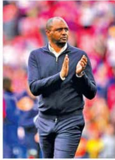
အထူးကျေးဇူးတင်ပါတယ်။ ဂျီနီအာအသင်း ရလဒ်ကောင်းတွေ ပြန်လည်ရရှိစေဖို့ အစွမ်းကုန်ကြိုးစားသွားမှာပါဟု ပြောသည်။ (အေပီပုံ)(NGB)

တူရင် နိုဝင်ဘာ ၂၁ ဖီအဲရာအသင်းသည် အသင်းနည်းပြသစ်အဖြစ် နည်းပြ ဖီအဲရာအား ခန့်အပ်ခဲ့ကြောင်း အတည်ပြု ထုတ်ပြန်ကြေညာခဲ့သည်။ အဆိုပါ နည်းပြသည် နည်းပြဘဝ သက်တမ်းတစ်လျှောက်တွင် နိုင်စံ၊ ခရစ္စတယ်ပဲလစ်စ်၊ စတာရာဘောစသည် ကလပ်အသင်းများအား ကိုင်တွယ်ပြီး အတွေ့အကြုံရှိသည့် နည်းပြတစ်ဦးဖြစ်ခြင်းကြောင့် ဂျီနီအာအသင်းက နည်းပြသစ်အဖြစ် ခန့်အပ်ခြင်းဖြစ်သည်။ အသက်(၄၈)နှစ်အရွယ်ရှိ ဖီအဲရာက ကွန်တော် အခုလို ဂျီနီအာအသင်းနည်းပြသစ်အဖြစ် ခန့်အပ်ခြင်းခံရလို့ အတိုင်းမသိပျော်ရွှင်မိပါတယ်။ ကွန်တော်ကို ယုံကြည်စွာနဲ့ တာဝန်ပေးအပ်ခဲ့တဲ့ အသင်းတာဝန်ရှိသူအားလုံးကို