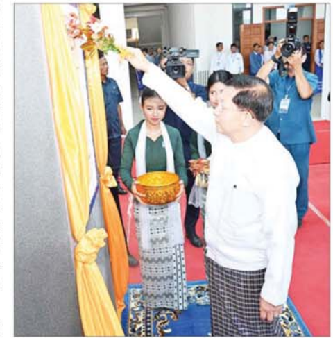
နိုင်ငံတော်စီမံအုပ်ချုပ်ရေးကောင်စီဥက္ကဋ္ဌ နိုင်ငံတော်ဝန်ကြီးချုပ် ဗိုလ်ချုပ်မှူးကြီးမင်းအောင်လှိုင် Naypyitaw State Polytechnic University ကမ္ဘည်းမော်ကွန်းကို အမွှေးနံ့သာရည်ပတ်ဖျန်းပေးစဉ်။

အံ့” ကြွေးကြော်သံဖြင့် ရတနာပုံဝပ် ရှိသည့် ဘီလူးချောင်းအမှတ်(၂) လောဝီတရေအားလျှပ်စစ်စက်ရုံ ကို တည်ဆောက်ခဲ့ပြီး ၁၉၇၄ ခုနှစ်တွင် ၁၆၈ မဂ္ဂါဝပ်အထိ တိုး မြှင့်ထုတ်လုပ်ဖြန့်ဖြူးပေးနိုင်ခဲ့ ကြောင်း။ ၁၉၇၀ ပြည့်နှစ်အစော ပိုင်းတွင် တက္ကသိုလ်များ ကွန်ပျူ တာစတင်တာကို တည်ထောင်ခဲ့ပြီး ICL-1902S Mainframe အမျိုး အစား ကွန်ပျူတာစက်ကြီး တစ်လုံးကို ပထမဆုံး ကွန်ပျူတာ အဖြစ် တပ်ဆင်ခဲ့ပြီး ၁၉၇၃ ခုနှစ် မြန်မာနိုင်ငံ သန်းခေါင်စာရင်း ကောက်ယူခြင်း လုပ်ငန်းတွင် အသုံးပြုခဲ့ကြောင်း။