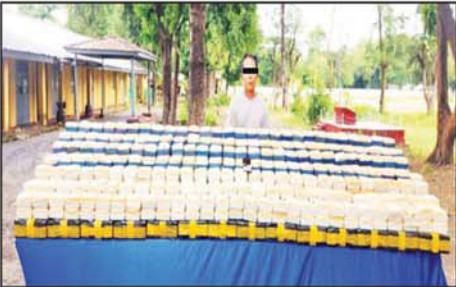
ဖြစ်မှုကျူးလွန်သူတစ်ဦးကို ကလေးမြို့ လှိုင်သာယာရပ်ကွက်တွင် သိမ်းဆည်းရမိသည့် မူးယစ်ဆေးဝါးများနှင့်အတူ တွေ့ရစဉ်။