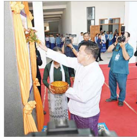
နိုင်ငံတော်စီမံအုပ်ချုပ်ရေးကောင်စီ တွဲဖက်အတွင်းရေးမှူး ဗိုလ်ချုပ်ကြီး ရဲဝင်းဦး Naypyitaw State Polytechnic University ကမ္ဘည်းမော်ကွန်းကို အမွှေးနံ့သာရည်ပတ်ဖျန်းပေးစဉ်။