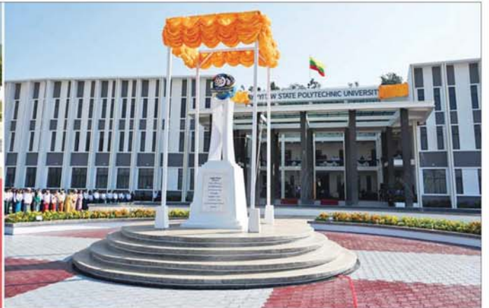
နိုင်ငံတော်စီမံအုပ်ချုပ်ရေးကောင်စီဥက္ကဋ္ဌ နိုင်ငံတော်ဝန်ကြီးချုပ် ဗိုလ်ချုပ်မှူးကြီးမင်းအောင်လှိုင် မြန်မာနိုင်ငံ အင်ဂျင်နီယာပညာရေး နှစ်(၁၀၀)ပြည့် ရာပြည့်သဘင် အထိမ်းအမှတ်ရုပ်တုနှင့် Naypyitaw State Polytechnic University ဆိုင်းဘုတ်အား စက်ခလုတ်နှိပ် ဖွင့်လှစ်ပေးစဉ်။