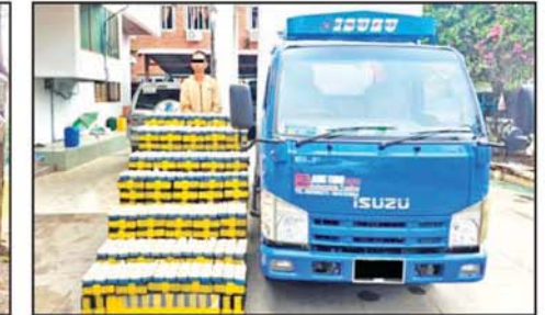
ဖြစ်မှုကျူးလွန်သူတစ်ဦးကို ချမ်းမြသာစည်မြို့နယ် ကန်သာယာရပ်ကွက်တွင် ဘောက်မော်တော်ယာဉ်နှင့် သိမ်းဆည်းရမိသည့် မူးယစ်ဆေးဝါးများနှင့်အတူ တွေ့ရစဉ်။