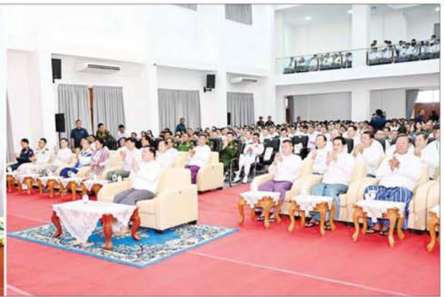
နိုင်ငံတော်စီမံအုပ်ချုပ်ရေးကောင်စီဥက္ကဋ္ဌ နိုင်ငံတော်ဝန်ကြီးချုပ် ဗိုလ်ချုပ်မှူးကြီးမင်းအောင်လှိုင်နှင့် အခမ်းအနားတက်ရောက်လာကြသူများ မျိုးဆက်သစ်အင်ဂျင်နီယာကျောင်းသား ကျောင်းသူများ၏ သာဓုပေးကံပြုပေးပွဲအဖြစ် ကြည့်ရှုအားပေးစဉ်။