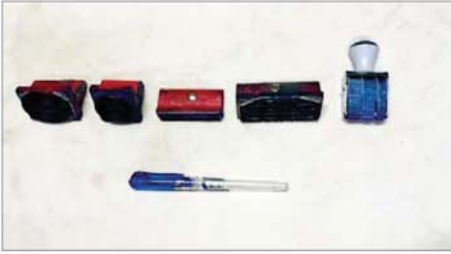
တရားခံ သိန်းကျမ်း (ခ) သိန်းဝင်း၏ နို့တြိပြုလုပ်ရာတွင် အသုံးပြုခဲ့ သည့် တံဆိပ်တုံးများနှင့် ဖုန်းကို တွေ့ရစဉ်။