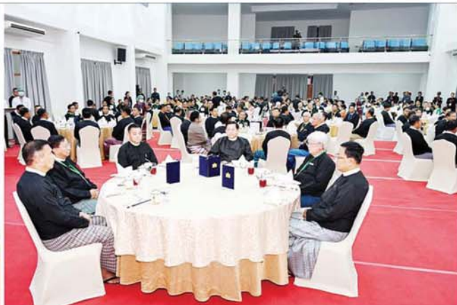
နိုင်ငံတော်စီမံအုပ်ချုပ်ရေးကောင်စီဥက္ကဋ္ဌ နိုင်ငံတော်ဝန်ကြီးချုပ် ဗိုလ်ချုပ်မှူးကြီးမင်းအောင်လှိုင်နှင့် အခမ်းအနားတက်ရောက်လာကြသူများ မြန်မာနိုင်ငံအင်ဂျင်နီယာပညာရေး နှစ် (၁၀၀)ပြည့် ရာပြည့်သဘင်နှင့် Naypyitaw State Polytechnic University ဖွင့်ပွဲ အထိမ်းအမှတ် ဂုဏ်ပြုညစာစားပွဲအခမ်းအနားတွင် ကျောင်းသား ကျောင်းသူများ၏ သီဆိုကပြပျော်ဖြေမှုကို ကြည့်ရှုအားပေးစဉ်။