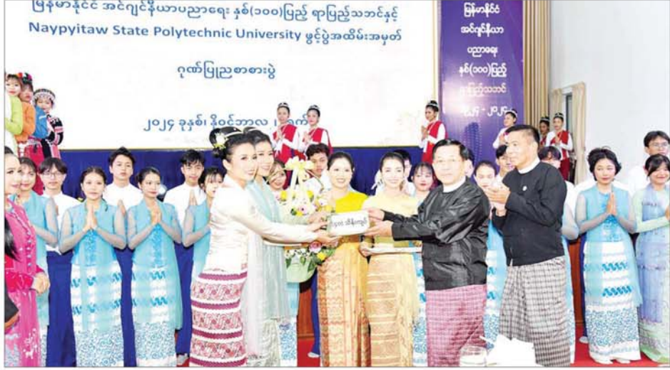
နိုင်ငံတော်စီမံအုပ်ချုပ်ရေး ကောင်စီဥက္ကဋ္ဌ နိုင်ငံတော် ဝန်ကြီးချုပ် ဗိုလ်ချုပ်မှူးကြီး မင်းအောင်လှိုင် သီဆို ကပြ ဖော်ပြခြင်းကြောင့် ကျောင်းသား ကျောင်းသူများ နှင့် အနုပညာရှင်များအား ဂုဏ်ပြုပန်းခြင်းနှင့် ဂုဏ်ပြု ဆုငွေများ ပေးအပ်စဉ်။