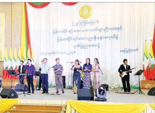
နိုင်ငံတော်စီမံအုပ်ချုပ်ရေးကောင်စီဒုတိယဥက္ကဋ္ဌ ဒုတိယဝန်ကြီးချုပ် ဒုတိယဗိုလ်ချုပ်မှူးကြီးစိုးဝင်းနှင့် အဖွဲ့ဝင်များ (၂၃)ကြိမ်မြောက် မြန်မာတိုင်းရင်းဆေးသမားတော်များညီလာခံနှင့် မြန်မာတိုင်းရင်းဆေးပညာနှီးနှောဖလှယ်ပွဲ ဂုဏ်ပြုညစာစားပွဲအခမ်းအနားတွင် ပြန်ကြားရေးဝန်ကြီးဌာန မြန်မာအသံနှင့် ရုပ်မြင်သံကြားမှ အနုပညာရှင်များ၏ တေးသံသာများဖြင့် သီဆိုဖျော်ဖြေမှုကို ကြည့်ရှုအားပေးစဉ်။

ဆေး)၏ အကျိုးထိရောက်မှုကို သုတေသနပြုလုပ်အောင်မြင်ခဲ့ကြကြောင်း၊ ဆေးဝါး၏ အရည်အသွေးဆိုင်ရာ ဓာတ်ခွဲစမ်းသပ်စစ်ဆေးခြင်း၊ လတ်တလောနှင့် ရေတိုအဆီအာနိသင်ဆိုင်ရာ စမ်းသပ်ခြင်း၊ ဆေး၏ခံနိုင်ရည်အား ကျန်းမာသည့်လူများပေါ်တွင် စမ်းသပ်ခြင်းနှင့် ကိုဗစ်-၁၉ ရောဂါ အတည်ပြုသမာဓိလက္ခဏာရှိ လူနာများပေါ်တွင်