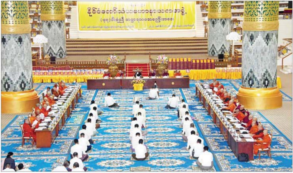
အဋ္ဌမအကြိမ် နိုင်ငံတော်သံဃမဟာနာယကအဖွဲ့ ၄၇ ပါးစုံညီ အဋ္ဌရသမအစည်းအဝေး ပထမနေ့ ကျင်းပစဉ်။