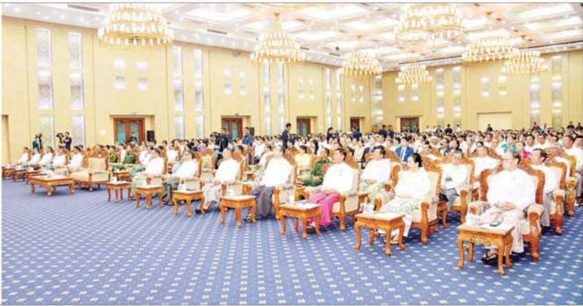
နိုင်ငံတော်စီမံအုပ်ချုပ်ရေးကောင်စီဒုတိယဥက္ကဋ္ဌ ဒုတိယဝန်ကြီးချုပ် ဒုတိယဗိုလ်ချုပ်မှူးကြီးစိုးဝင်း (၂၃)ကြိမ်မြောက် မြန်မာတိုင်းရင်းဆေးပညာနှီးနှောဖလှယ်ပွဲ ဖွင့်ပွဲအခမ်းအနားတွင် အမှာစကားပြောကြားစဉ်။

ဝိုင်းဝန်းညှိနှိုင်းဆွေးနွေးထိုက်ထိုက် ကုထုံးများ၊ တန်ဖိုးမဖြတ်နိုင်သည့် သမိုင်းအစဉ်အလာကြီးမားသော ဆေးကျမ်းများနှင့် အာနိသင်ထက်မြက်သည့် ဆေးဝါးများစသည့် မြန်မာတိုင်းရင်းဆေးပညာရပ်များ၏ အနှစ်သာရ အဆီအနှစ်များကို စုစည်းပြီး အမျိုးသားအမွေအနှစ် ဆေးပညာရပ်တစ်ရပ်အဖြစ် ပိုမိုဖွံ့ဖြိုးတိုးတက်စေရေး ယခုညီလာခံကြီးကနေ ဝိုင်းဝန်းညှိနှိုင်းဆွေးနွေးကြရန် မှာကြားလိုကြောင်း။ ကိုဗစ်-၁၉ ရောဂါ ကပ်ရောဂါဘေးနှင့် ကြုံတွေ့ခဲ့သည့်အချိန်တွင် တိုင်းရင်းဆေးနှင့် ကာကွယ်ကုသနိုင်ရေးအတွက် တိုင်းရင်းဆေးဖုံ (ဝိသမအများပျောက်