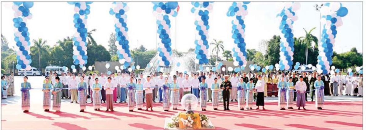
(၂၃)ကြိမ်မြောက် မြန်မာ့တိုင်းရင်းဆေးသမားတော်များညီလာခံနှင့် မြန်မာ့တိုင်းရင်းဆေးပညာနှီးနှောဖလှယ်ပွဲ ဖွင့်ပွဲအခမ်းအနားတွင် ပြည်ထောင်စုဝန်ကြီး ပါမောက္ခ ဒေါက်တာသက်ခိုင်ဝင်း၊ ဒုတိယဝန်ကြီး ပါမောက္ခ ဒေါက်တာအေးထွန်း၊ နေပြည်တော်ကောင်စီဝင် ဗိုလ်မှူးကြီး ရဲမှီး၊ တိုင်းရင်းဆေးပညာဦးစီးဌာန ညွှန်ကြားရေးမှူးချုပ် ဒေါက်တာ စုစုဒွေး၊ မြန်မာနိုင်ငံတိုင်းရင်းဆေးကောင်စီဥက္ကဋ္ဌ ဦးမြင့်ဦး၊ တိုင်းရင်းဆေးပညာရပ်ဆိုင်ရာ အကြံပေးအဖွဲ့ဥက္ကဋ္ဌ ပါမောက္ခ ဒေါက်တာဦးမိတ်ခင်နှင့် မြန်မာနိုင်ငံတိုင်းရင်းဆေး ဆရာအသင်းဗဟိုဥက္ကဋ္ဌ ဦးသိန်းဝင်းတို့က ဖဲကြိုးဖြတ်ဖွင့်လှစ်ပေးစဉ်။

ဦးစွာ (၂၃)ကြိမ်မြောက် မြန်မာ့ တိုင်းရင်းဆေး သမားတော်များ ညီလာခံနှင့် မြန်မာ့တိုင်းရင်းဆေး ပညာ နှီးနှောဖလှယ်ပွဲ ဖွင့်ပွဲ အခမ်းအနားကို ကျင်းပရေးဦးစီး ကော်မတီဥက္ကဋ္ဌ ကျန်းမာရေး ဝန်ကြီးဌာန ပြည်ထောင်စုဝန်ကြီး ပါမောက္ခ ဒေါက်တာ သက်ခိုင်ဝင်း၊ ဒုတိယဝန်ကြီး ပါမောက္ခ ဒေါက်တာ အေးထွန်း၊ နေပြည်တော် ကောင်စီဝင် ဗိုလ်မှူးကြီး ရဲမှီး၊ တိုင်းရင်းဆေးပညာ ဦးစီးဌာန ညွှန်ကြားရေးမှူးချုပ် ဒေါက်တာ စုစုဒွေး၊ မြန်မာနိုင်ငံတိုင်းရင်းဆေး ကောင်စီဥက္ကဋ္ဌ ဦးမြင့်ဦး၊ တိုင်းရင်း ဆေးပညာရပ်ဆိုင်ရာ အကြံပေး အဖွဲ့ဥက္ကဋ္ဌ ပါမောက္ခ ဒေါက်တာ ဦးမိတ်ခင်နှင့် မြန်မာနိုင်ငံတိုင်းရင်း ဆေးဆရာအသင်းဗဟို ဥက္ကဋ္ဌ ဦးသိန်းဝင်း တို့က ဖဲကြိုးဖြတ် ဖွင့်လှစ်ပေးကြသည်။