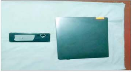
နို့တြိပြုလုပ်ရာတွင် အသုံးပြုခဲ့သည့် တရားခံမြတ်မင်းသူ၏ Laptop နှင့် ဖုန်းကို တွေ့ရစဉ်။

အတွက် Chulalongkorn တက္ကသိုလ်မှ ၎င်းတို့နှစ်ဦးအား တက္ကသိုလ် တက်ရောက်ခွင့် လက်မခံခဲ့ကြောင်း သိရသည်။