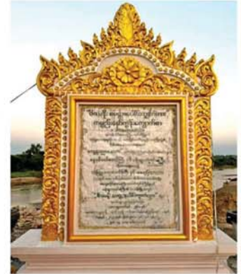
ကောင်းမှုကုသိုလ်(မ)မြီးတရားတော်ကို လေးနက်ကျယ်ပြန့်စွာ ဟောကြားတော်မူခဲ့ပါသည်။

မိဿနိုးမြို့ဟောင်းအနီးရှိ ကြက်ဖြူတောကျေးရွာနှင့် ထမောင်းဧင်ကျေးရွာအကြားတွင် အရှေ့မှ အနောက်သို့စီးဆင်းနေသော ဆဒုံချောင်းကြီးရှိပါသည်။ ချောင်းအကျယ်ပေ ၁၈၀ ကျော်ခန့် ရှိပါသည်။ ဆဒုံချောင်းရေသည် ပင်းချောင်းရေနှင့်