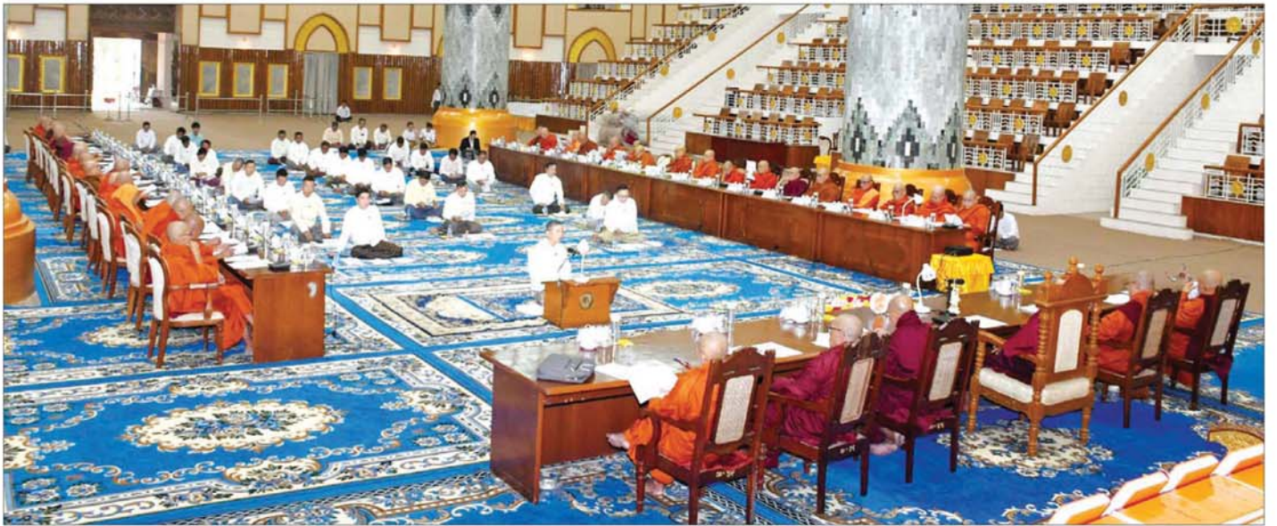
အဋ္ဌမအကြိမ် နိုင်ငံတော်သံဃမဟာနာယကအဖွဲ့ (၄၇)ပါးစုံညီ အဋ္ဌာရသမအစည်းအဝေး ဒုတိယနေ့ ကျင်းပစဉ်။