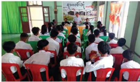
ရေးနှင့်ပြည်သူ့ဆက်ဆံရေးဦးစီးဌာနမှ ရုပ်သံကျွမ်းကျင်-၃ ဦးစေတင်ထွေး(စာရေးဆရာ

သာစည် နိုဝင်ဘာ ၂၃ မန္တလေးတိုင်းဒေသကြီး၊ သာစည်မြို့နယ်၌ စာဖတ်ရိုက်မြှင့်တင်ရေးအဖွဲ့မှ စာပေဆရာများနှင့် ကျောင်းသားလူငယ်များပါဝင်သော ရသလမ်းဆုံ စာဖတ်ပိုင်းကို နိုဝင်ဘာ ၁၉ ရက် နံနက် ၉ နာရီခွဲက မြို့နယ်ပြန်ကြားရေးနှင့်ပြည်သူ့ဆက်ဆံရေးဦးစီးဌာန လူထုအခြေပြုဗဟိုဌာန၌ ကျင်းပသည်။