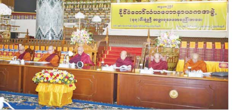
အဋ္ဌမအကြိမ် နိုင်ငံတော်သံဃမဟာနာယကအဖွဲ့ (၄၇)ပါးစုံညီ အဋ္ဌာရသမအစည်းအဝေး ဒုတိယနေ့ ကျင်းပစဉ်။