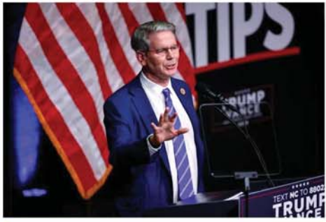
အမေရိကန်ဘဏ္ဍရေးဝန်ကြီးအဖြစ် လျာထားခြင်းခံရသော ရင်းနှီးမြုပ်နှံမှုရန်ပုံငွေဆိုင်ရာမန်နေဂျာ စတော့ဘက်ဆန်ကို တွေ့ရစဉ်။ Mon