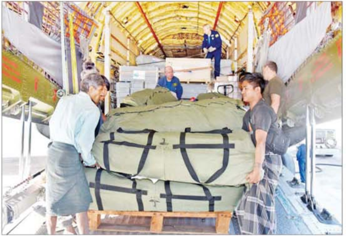
ရာဂီမန်တိုင်းနှင့်ဆက်စပ်ဖြစ်ပွားသော ရေကြီးရေလျှံမှုများကြောင့် ဘေးသင့်ဒေသများ ပြန်လည် ထူထောင်ရေးအတွက် ရုရှားဖက်ဒရေးရှင်းနိုင်ငံကိုယ်စား ရုရှားဖက်ဒရေးရှင်းနိုင်ငံ ဝန်ကြီးဌာနများနှင့် ကုမ္ပဏီများက လူသားချင်းစာနာထောက်ထားမှုအကူအညီပစ္စည်းများ တင်ဆောင်လာသည့် သယ်ယူပို့ဆောင်ရေးလေယာဉ် နေပြည်တော်လေဆိပ်သို့ ရောက်ရှိစဉ်။