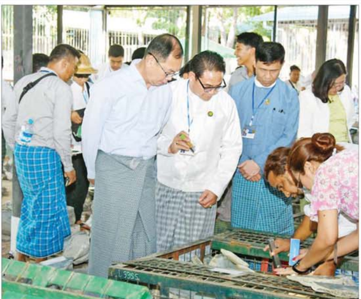
ပြည်တွင်း၊ ပြည်ပရတနာကုန်သည်များ ခင်းကျင်းပြသထားသည့် ကျောက်စိမ်းအတွဲများကို စိတ်ကြိုက်လေ့လာကြည့်ရှုစဉ်။

ညနေပိုင်းတွင် မြန်မာ ကျောက်မျက်နှာတံဆိပ်ပွဲ ဗဟို ကော်မတီနာယက သယံဇာတနှင့် သဘာဝပတ်ဝန်းကျင် ထိန်းသိမ်း ရေးဝန်ကြီးဌာန ပြည်ထောင်စု ဝန်ကြီး ဦးခင်မောင်ရီသည် ပြပွဲကျင်းပရာ မဏိရတနာ ကျောက်စိမ်းခန်းမ အပြင်ဘက် သတိမှတ်နေရာများ အလိုက် ခင်းကျင်းပြသထားသည့် အိတ်ဖွင့် တင်ဒါစနစ်ဖြင့် ရောင်းချမည့် အုပ်စု(စီ)မှ ကျောက်စိမ်းအတွဲများ ကို ရတနာကုန်သည်များက ကြည့်ရှု စစ်ဆေးနေမှုနှင့် ကျောက်စိမ်းအတွဲများအတွက် ဈေးနှုန်း တင်သွင်းလွှာများ ဖွင့်ဖောက်စစ်ဆေးနေမှုကို ကြည့်ရှု စစ်ဆေးပြီး တာဝန်ရှိသူများအား လိုအပ်သည်များ မှာကြားသည်။ ပြပွဲအဖွဲ့နေ့တွင် ရောင်းချမည့် အုပ်စု(စီ)မှ ကျောက်စိမ်းအတွဲ အမှတ်(၂၅၆၀)မှ (၃၃၀၉)အထိကို ပြည်တွင်း ရတနာကုန်သည်များ က ကြည့်ရှုစစ်ဆေးကြပြီး ဈေးနှုန်း တင်သွင်းလွှာများကို သက်ဆိုင်ရာ တင်ဒါပုံစံများအတွင်းသို့ ထည့်သွင်း ကြသည်။ အဆိုပါ ဈေးနှုန်း တင်သွင်းလွှာများကို တာဝန်ရှိသူ များက ညနေပိုင်းတွင် ဖွင့်ဖောက် စစ်ဆေးကာ ရောင်းချရမည့် ကျောက်စိမ်းအတွဲများ စာရင်း ကို နိုဝင်ဘာ ၂၅ ရက် နံနက်ပိုင်း တွင် ကြေညာသွားမည်ဖြစ်ပါသည်။