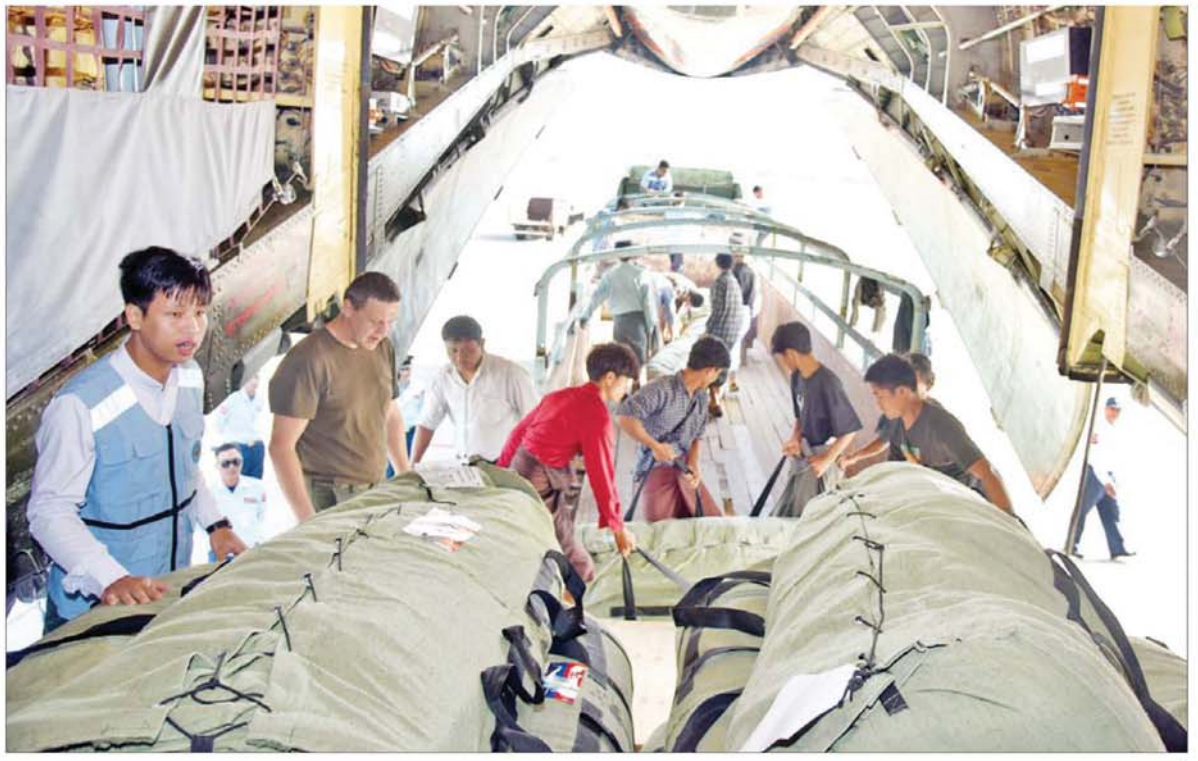
စာမျက်နှာ ၅ သို့ ၀

နေပြည်တော် နိုဝင်ဘာ ၂၄ ရာဂီမုန်တိုင်းနှင့် ဆက်စပ်ပြစ်ပွားသော ရေကြီးရေလျှံမှုများကြောင့် ဘေးသင့်ဒေသများ ပြန်လည်ထူထောင်ရေးအတွက် ရုရှားပက်ဒရေးရှင်းနိုင်ငံကိုယ်စား အရည်တက် ကာကွယ်ရေး၊ အရေးပေါ်အခြေအနေနှင့် သဘာဝဘေးအန္တရာယ်သက်ရောက်မှုများ တိုက်ဖျက်ရေးဆိုင်ရာဝန်ကြီးဌာန၊ စက်မှုနှင့် ကုန်သွယ်ရေးဝန်ကြီးဌာန ရုရှားနိုင်ငံ နျူကလီးယားစွမ်းအင်ကော်ပိုရေးရှင်း (Rosatom) နှင့် Aquarius ကုမ္ပဏီများအပူစိုက်ပေးပို့သည့် လူသားချင်းစာနာထောက်ထားမှု အကူအညီပစ္စည်းများ တင်ဆောင်လာသည့် သယ်ယူပို့ဆောင်ရေး လေယာဉ်သည် ယနေ့ နံနက်ပိုင်းတွင် နေပြည်တော်လေဆိပ်သို့ ရောက်ရှိသည်။