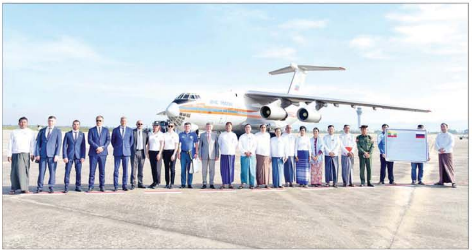
ပြည်ထောင်စုရာထူးဝန်အဖွဲ့ဥက္ကဋ္ဌ မြန်မာ-ရုရှား ချစ်ကြည်ရေးအသင်းဥက္ကဋ္ဌ ဦးအောင်သော်၊ မြန်မာနိုင်ငံဆိုင်ရာ ရုရှားသံအမတ်ကြီး Mr. Iskander Azizov နှင့် တာဝန်ရှိသူများ စုပေါင်းမှတ်တမ်းတင်ဓာတ်ပုံရိုက်စဉ်။

ရေဘေးသင့်ဒေသများ ပြန်လည် ထူထောင်ရေးအတွက် ရုရှား ဖက်ဒရေးရှင်းနိုင်ငံ ဝန်ကြီးဌာန မှားနှင့် ကုမ္ပဏီများက လူသားချင်း စာနာထောက်ထားမှု အကူအညီ ပစ္စည်းများ စုစုပေါင်းတန်ချိန် ၃၇ တန်ခန့်ပါဝင်ပြီး ရေဘေးသင့် ဒေသများသို့ အမြန်ဆုံးပို့ဆောင် ပို့ဆောင်သွားမည် ဖြစ်ကြောင်း သိရသည်။