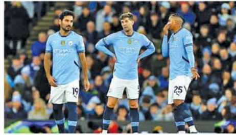
(ပရီးမီးယားလိဂ်)၊ စပါး(ပရီးမီးယားလိဂ်)တို့ ပွဲစဉ်အား ဆက်တိုက်ရှုံးနိမ့်ခဲ့ခြင်းဖြစ်သည်။ မန်ချက်စတာစီးတီးအသင်းသည် ယခုနှစ်ဘောလုံးရာသီ ပရီးမီးယားလိဂ်ပွဲစဉ် ၁၂ ပွဲကစားအပြီးတွင် ရမှတ် ၂၃ မှတ်ဖြင့် အဆင့် (၂) ရေရာတွင် ရပ်တည်ထားသည်။ (အပေါ်ပုံ) (NGB)

ဆိုင်ခဲ့ခြင်းဖြစ်သည်။ အင်္ဂလန်ပြည်တွင်း အမှတ်ပေး ချန်ပီယံအသင်း တစ်သင်းအနေဖြင့် ယခုလို ၅ ပွဲဆက် ဆက်တိုက် ရှုံးနိမ့်မှု မှတ်တမ်းသည် ၁၉၅၅ ခုနှစ်က ချယ်ဆီးအသင်း ဖြစ်ခဲ့ပြီး၊ ယခု ၂၀၂၄ ခုနှစ်တွင် မူ မန်ချက်စတာစီးတီးအသင်းက အဆိုပါ စံချိန်ဆိုးအား ပိုင်ဆိုင်ခဲ့ခြင်းဖြစ်သည်။ မန်ချက်စတာစီးတီးအသင်းသည် နောက်ဆုံး ၅ ပွဲအဖြစ် စပါး(လိဂ်ဖလား)၊ ဘုန်းမောက်(ပရီးမီးယားလိဂ်)၊ ဘရိုက်တန်