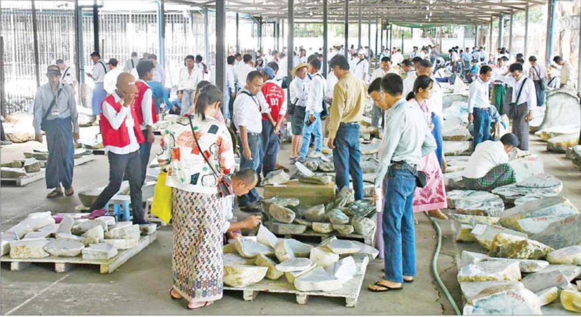
ပြည်တွင်း၊ ပြည်ပရတနာကုန်သည်များ ခင်းကျင်းပြသထားသည့် ကျောက်စိမ်းအတွဲများကို စိတ်ကြိုက်လေ့လာကြည့်ရှုစဉ်။

နေပြည်တော် ဇူလိုင်လ ၂၄ ၂၀၂၄ ခုနှစ် နှစ်လယ် မြန်မာ့ကျောက်မျက်ရတနာပြပွဲ သတ္တမနေ့ကို နေပြည်တော်ရှိ မင်္ဂလာတိုက်ကျောက်စိမ်းခန်းမ၌ ဆက်လက်ကျင်းပရာ နံနက်ပိုင်းမှစတင်၍ ပြည်ပရတနာကုန်သည်များသည် ခန်းမအပြင်ဘက်သတ်မှတ် နေရာများအလိုက် ခင်းကျင်းပြသထားသည့် အုပ်စု(စီ)မှ ကျောက်စိမ်းအတွဲများကို စိတ်ကြိုက်လေ့လာကြည့်ရှုကြသည်။ ယနေ့ပြပွဲတွင် ကျောက်စိမ်းအတွဲအမှတ်(၁၇၀၁)မှ (၂၅၅၉) အထိ ကျောက်စိမ်းအတွဲများကို ပြည်တွင်း၊ ပြည်ပရတနာကုန်သည်များအား အိတ်ဖွင့်တင်ဒါခန့်ဖြင့် ရောင်းချပေးရာ ကျောက်စိမ်းအတွဲပေါင်း ၅၅၉ တွဲ ရောင်းချခဲ့ရကြောင်း ထုတ်ပြန်ကြေညာသည်။ စာမျက်နှာ ၄ သို့ ၆