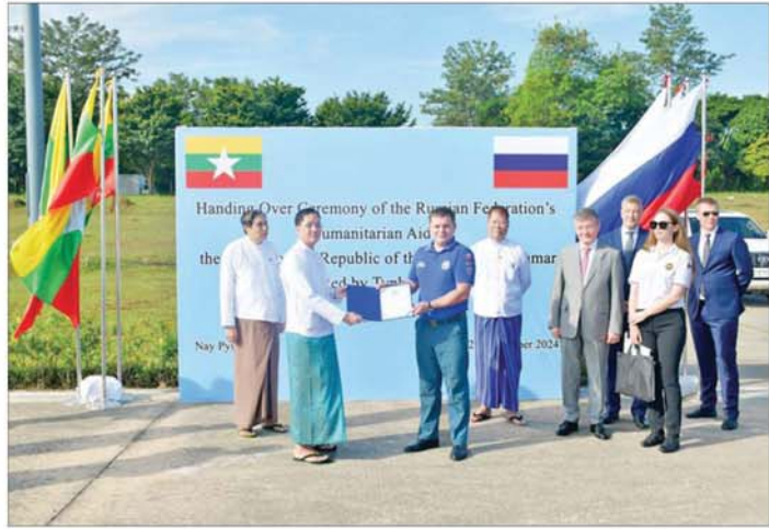
ရာဂီမန်တိုင်းနှင့်ဆက်စပ်ဖြစ်ပွားသော ရေကြီးရေလျှံမှုများကြောင့် ဘေးသင့်ဒေသများ ပြန်လည် ထူထောင်ရေးအတွက် ရုရှားဖက်ဒရေးရှင်းနိုင်ငံကိုယ်စား ရုရှားဖက်ဒရေးရှင်းနိုင်ငံ ဝန်ကြီးဌာနများနှင့် ကုမ္ပဏီများက လူသားချင်းစာနာထောက်ထားမှုအကူအညီပစ္စည်းများ လွှဲပြောင်းပေးအပ်ခြင်း အခမ်းအနားကျင်းပစဉ်။