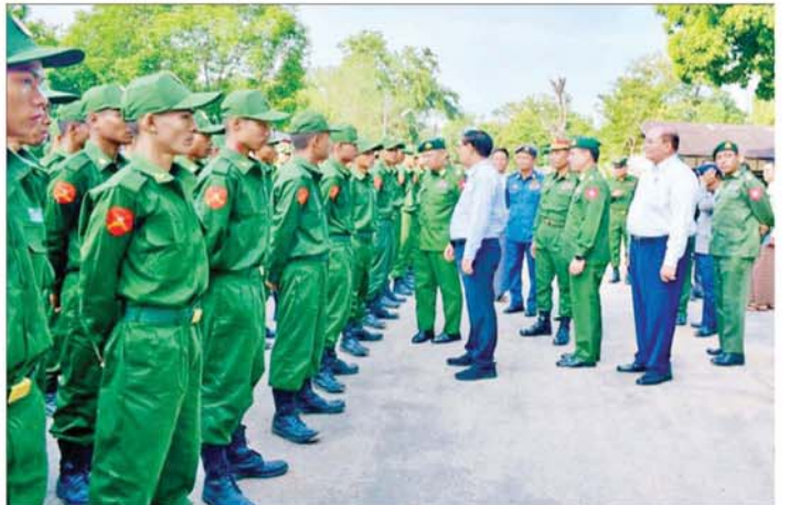
ပဲခူးတိုင်းဒေသကြီးဝန်ကြီးချုပ် ဦးမျိုးဆွေဝင်း ပြည်သူ့စစ်မှုထမ်းသင်တန်းအမှတ်စဉ် (၇) မှ သင်တန်း သားများအား ရင်းရင်းနှီးနှီး လိုက်လံနှုတ်ဆက်စဉ်။