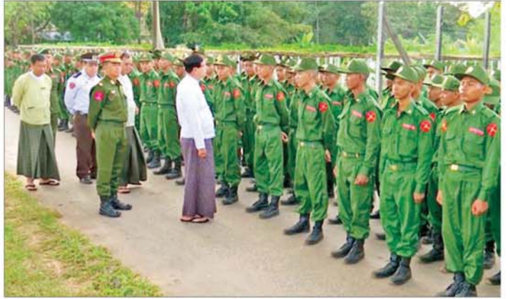
ရန်ကင်းတိုင်းဒေသကြီးဝန်ကြီးချုပ် ဦးစိုးသိန်း ပြည်သူ့စစ်မှုထမ်းသင်တန်းအမှတ်စဉ် (၇) မှ သင်တန်း သားများအား ရင်းရင်းနှီးနှီး လိုက်လံနှုတ်ဆက်စဉ်။