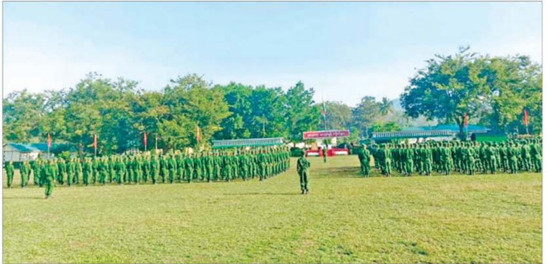
ပြည်သူ့စစ်မှုထမ်းသင်တန်းအမှတ်စဉ် (၇) သင်တန်းဖွင့်ပွဲကျင်းပစဉ်။

အဆိုပါသင်တန်းဖွင့်ပွဲများသို့ နေပြည်တော် ကောင်စီဥက္ကဋ္ဌ တိုင်းဒေသကြီးနှင့် ပြည်နယ်ဝန်ကြီး ချုပ်များ၊ တိုင်းမှူးများနှင့် တာဝန်ရှိသူများ တက်ရောက် ၍ ပြည်သူ့စစ်မှုထမ်း သင်တန်းအမှတ်စဉ်(၇)မှ သင်တန်းသားများအား တွေ့ဆုံကာ သင်တန်းသား များအတွက် ဂုဏ်ပြုချီးမြှင့်ပေးမှုများနှင့် ထောက်ပံ့ ပစ္စည်းများ ပေးအပ်ကြပြီး သင်တန်းသားများအား ရင်းရင်းနှီးနှီး လိုက်လံနှုတ်ဆက်အားပေးကြသည်။ ပြည်ထောင်စုမပြိုကွဲရေး၊ တိုင်းရင်းသား စည်းလုံးညီညွတ်မှုမပြိုကွဲရေးနှင့် အချုပ်အခြာ အာဏာတည်တံ့ခိုင်မြဲရေးဟူသည့် ဒီမိုကရေစီ အရေး သုံးပါးကို ထိန်းသိမ်းစောင့်ရှောက်ရန် နိုင်ငံသား တိုင်းတွင် တာဝန်ရှိကြသဖြင့် ယင်းတာဝန်များကို