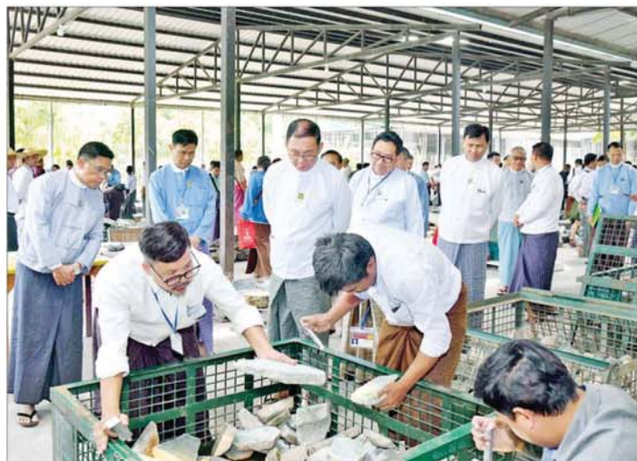
ပြည်ထောင်စုဝန်ကြီး ဦးခင်မောင်ရှိ ခင်းကျင်းပြသထားသည့် အိတ်ဖွင့်တင်ဒါစနစ်ဖြင့် ရောင်းချမည့် အုပ်စု(စီ)မှ ကျောက်စိမ်းအတွဲများအား ရတနာကုန်သည်များက ကြည့်ရှုစစ်ဆေးနေမှုကို ကြည့်ရှုအားပေးစဉ်။

ကျောက်မျက်ရတနာပြပွဲ ဗဟို ကော်မတီနာယက သယံဇာတနှင့် သဘာဝပတ်ဝန်းကျင် ထိန်းသိမ်း ရေးဝန်ကြီးဌာန ပြည်ထောင်စု ဝန်ကြီး ဦးခင်မောင်ရှိသည် ပြပွဲ ကျင်းပရာ မဏိရတနာကျောက် စိမ်းခန်းမအပြင်ဘက် သတ်မှတ် နေရာများအလိုက် ခင်းကျင်းပြသ ထားသည့် အိတ်ဖွင့်တင်ဒါစနစ်ဖြင့် ရောင်းချမည့် အုပ်စု(စီ)မှ ကျောက် စိမ်းအတွဲများအား ရတနာ ကုန်သည်များက ကြည့်ရှုစစ်ဆေး နေမှုကို ကြည့်ရှုအားပေးပြီး တာဝန်ရှိသူများအား လိုအပ်သည် များ မှာကြားသည်။