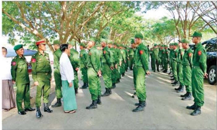
နေပြည်တော်ကောင်စီဥက္ကဋ္ဌ ဦးသန်းထွန်းဦး ပြည်သူ့စစ်မှုထမ်းသင်တန်းအမှတ်စဉ် (၇) မှ သင်တန်း သားများအား ရင်းရင်းနှီးနှီး လိုက်လံနှုတ်ဆက်စဉ်။