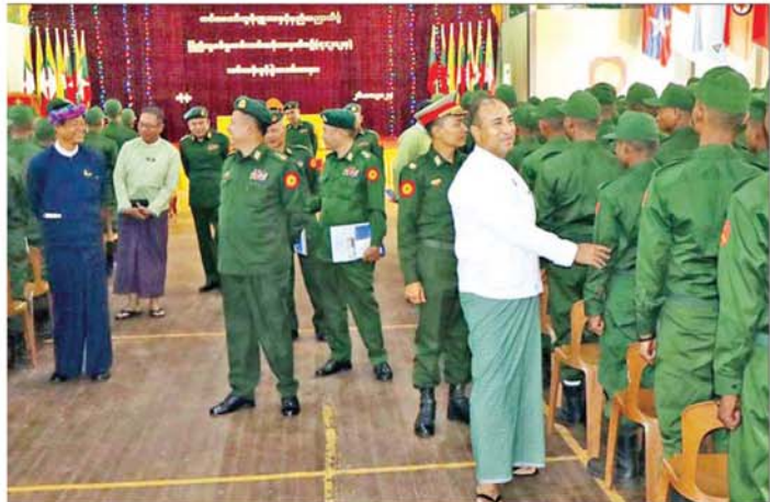
ရှမ်းပြည်နယ်ဝန်ကြီးချုပ် ဦးအောင်အောင် ပြည်သူ့စစ်မှုထမ်းသင်တန်းအမှတ်စဉ် (၇) မှ သင်တန်း သားများအား ရင်းရင်းနှီးနှီး လိုက်လံနှုတ်ဆက်စဉ်။