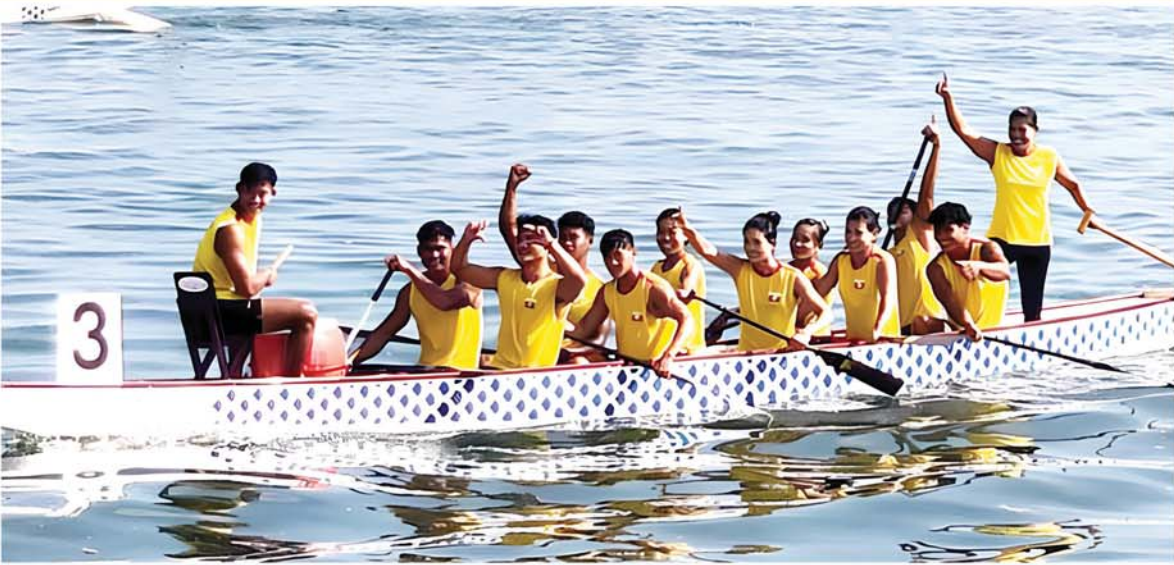
အမျိုးသား+အမျိုးသမီး မီတာ ၅၀၀ (၁၀)တက်လှော်ဗိုလ်လုပွဲတွင် မြန်မာလှေလှော်အသင်း ပန်းဝင်အောင်ပွဲခံနေစဉ်။

ရန်ကုန် နိုဝင်ဘာ ၃ အပြည်ပြည်ဆိုင်ရာ ကနူးလှေလှော်အဖွဲ့ချုပ်၏ ၂၀၂၄ ခုနှစ် ကမ္ဘာ့ပလားနဂါးလှေလှော်ပြိုင်ပွဲ (2024 ICF Dragon Boat World Cup) ကို နိုဝင်ဘာ ၂ ရက်နှင့် ၃ ရက်တို့တွင် ဖိလစ်ပိုင် သမ္မတနိုင်ငံ Puerto Princessa မြို့၌ ကျင်းပခဲ့ရာ မြန်မာလှေလှော်အားကစားအသင်း ရွှေတံဆိပ်တစ်ခုနှင့် ငွေတံဆိပ်တစ်ခုတို့ ဆွတ်ခူးရရှိခဲ့သည်။ မြန်မာ အင်ဒိုနီးရှား၊ တရုတ် (တိုင်ပေ)၊ စပိန်၊ ဖိလစ်ပိုင်၊ ဟန်ဂေရီအသင်းတို့သည် နိုဝင်ဘာ ၂ ရက်က အမျိုးသား၊ အမျိုးသမီး မီတာ ၂၀၀ ဆယ်တက်လှော် ဗိုလ်လုပွဲပြိုင်ပွဲ ယှဉ်ပြိုင်ခဲ့ရာ အင်ဒိုနီးရှားအသင်းက ပထမ (ရွှေတံဆိပ်)၊ မြန်မာအသင်းက ဒုတိယ (ငွေတံဆိပ်)၊ တရုတ် (တိုင်ပေ) အသင်းက တတိယ (ကြေးတံဆိပ်) ရရှိခဲ့ကြသည်။ အလားတူ မြန်မာ၊ ဟန်ဂေရီ၊ အင်ဒိုနီးရှား၊ ကိုရီးယား၊