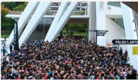
အစိုးရ၏ ရေကြီးမှုကယ်ဆယ်ရေးအဖွဲ့အစည်းတို့ မကျေနပ်သဖြင့် စစ်နိမ့်နိုင်ငံ ဗလင်စီယာမြို့လယ်၌ နိုဝင်ဘာ ၂ ရက်က လူပေါင်းထောင်နှင့်ချီ၍ ဆန္ဒပြနေကြစဉ်။ Mon

တိုကျို နိုဝင်ဘာ ၃ မိုးသည်းထန်မှုအခြေအနေ ပိုမိုဆိုးရွားလာသဖြင့် ဂျပန်နိုင်ငံအနောက်ပိုင်း၌ နိုဝင်ဘာ ၂ ရက်က ဒေသခံများ ရေဘေးလွတ်ရာသို့ ရွှေ့ပြောင်းလျက်ရှိကြောင်း