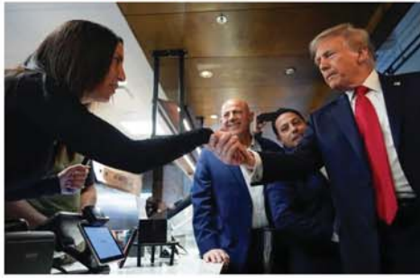
စည်းရုံးရေးအဖွဲ့က နည်းလမ်းရန် စီစဉ်ခဲ့သည်။ ဒေါ်နယ်လ်ထရမ်ကို အောက်

ဝါရှင်တန် နိုဝင်ဘာ ၃ အမေရိကန်သမ္မတရွေးကောက်ပွဲ နီးကပ်လာသည်နှင့်အမျှ ရီပတ်ဘလီကန်သမ္မတလောင်း ဒေါ်နယ်လ်ထရမ်၏ မဲဆွယ်စည်းရုံးမှု အရှိန်မြင့်လာလျက်ရှိကြောင်း ဘီဘီစီသတင်းဌာနက ဖော်ပြသည်။ အစဦးတွင် လူထုအားပေးထောက်ခံမှုနှင့် လူကြိုက်များမှုသာလျှင်သာ ဒီမိုကရက်တစ်သမ္မတလောင်း ကာမလာဟ်ရစ်ကို အနိုင်ရရန် ထရမ်၏ မဲဆွယ်