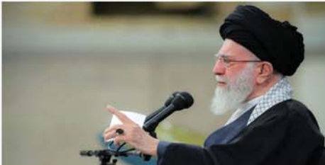
နောက်တစ်ရက်တွင် ၎င်းက အမေရိကန်နှင့်အစွဲရော့ကို သတိပေးခဲ့ခြင်းဖြစ်ကြောင်း သိရသည်။ Mon

တီဟီရန် နိုဝင်ဘာ ၃ အီရန်နိုင်ငံ၏ အကြွင်းမဲ့ဘာသာရေးခေါင်းဆောင် အယာတိုလာခါမေန်က အမေရိကန်နှင့် အစွဲရော့ကို ချေမှုန်းတိုက်ခိုက်မည်ဟု နိုဝင်ဘာ ၂ ရက်တွင် သတိပေးလိုက်ကြောင်း ဘီဘီစီသတင်းဌာနက ဖော်ပြသည်။ ၁၉၇၉ ခုနှစ် အမေရိကန်