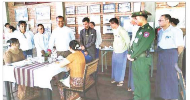
ဟိုတယ်အလုပ်အကိုင်ဆိုင်ရာ သင်တန်းများ ဖွင့်လှစ် ၍ စည်ဆက်မပြတ် ကျွမ်းကျင်မှု စစ်ဆေးအကဲဖြတ် သင်ကြားခြင်းနှင့် အရည်အသွေးရှိ ကျွမ်းကျင်မှု နိုင်ရေး အလေးထားဆောင်ရွက်ရန် မှာကြားခဲ့ စစ်ဆေး အကဲဖြတ်ခြင်းများ ဆောင်ရွက်နိုင်ရေး ကြောင်း သိရသည်။

ဝန်ဆောင်မှု လုပ်ငန်းကဏ္ဍနှင့်ပတ်သက်၍ Level 1 အလုပ်အကိုင် ရှစ်မျိုး၊ Level 2 အလုပ်အကိုင် ရှစ်မျိုးနှင့် Level 3 အလုပ်အကိုင် နှစ်မျိုး၊ စုစုပေါင်း အလုပ်အကိုင် ၁၈ မျိုးအတွက် ကျွမ်းကျင်မှုစစ်ဆေး အတည်ပြုထားပြီး ၂၀၁၄ ခုနှစ်မှ ယနေ့ထိ ဟိုတယ် စားပွဲထိုး၊ အိမ်ခန်းဆောင်ထိန်းသိမ်းရေးနှင့် စည်ကြို အလုပ်အကိုင် သုံးမျိုးတွင် သတ်မှတ် အရည်အချင်း ကိုက်ညီသူ ၁၄၈၅ ဦးကို ကျွမ်းကျင်မှုအသိအမှတ်ပြု လက်မှတ်များ ထုတ်ပေးနိုင်ခဲ့ကြောင်း။