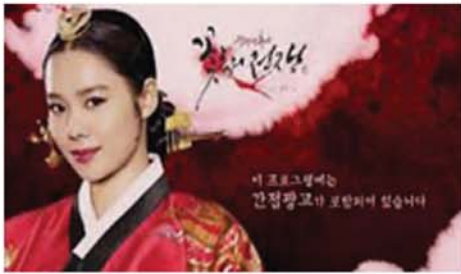
ကိုရီးယားရာဇဝင်ဇာတ်ကား Blooded Palace :The War of Flowers မာယာနန်းတော်တွင် ဂျီဆွန်နန်းတော်၏ မိန်းမကြမ်း

မိပုရားအဖြစ် ဂျီဒြီအင်းကို သတ်မှတ်ခံရသည့် အကြောင်း မိုက်ကူးထားသည်ဟု ကိုရီးယား ဘိုးဝက်ဘ်ဆိုက်တွင် ဖော်ပြ သည်။