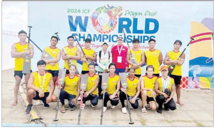
မြန်မာလှေလှော်အားကစားသမားများကို တွေ့ရစဉ်။

ပင့်လျှောက်စာများ အချိန်မီရောက်ရှိပါကလည်း အဆိုပါနေ့ရက်များအတိုင်း ရန်ကုန်တိုင်းဒေသ ကြီး၊ မရမ်းကုန်းမြို့နယ်၊ သီရိမင်္ဂလာကမ္ဘာအေးကုန်းမြေသို့ ကြွရောက်တော်မူကြပါရန် ပင့်လျှောက် အပ်ပါကြောင်း သာသနာရေးဦးစီးဌာနမှ သတင်းရရှိသည်။ သတင်းစဉ်