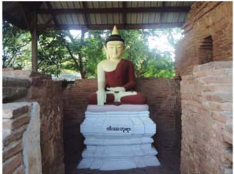
ချိုသန်းညွန့်(ကျေးလက်)

သားများနှင့်တွေ့ဆုံကာ လုပ်ငန်းများ သတ်မှတ်ကာလအတွင်း အချိန်မီပြီးစီးရေး အလေးထားဆောင်ရွက်ကြရန် ဆွေးနွေးမှာကြားသည်။ အဆိုပါ ဘက်စုံသုံးခန်းပဆောင်သည် အလျား ၄၀ အနံ ၂၀ အမြင့် ၁၂ပေရှိပြီး ကျေးရွာဖွံ့ဖြိုးတိုးတက်ရေးလုပ်ငန်း စီမံကိန်းပုံစံရန်ပုံငွေကျပ် (၁၅၀)သိန်း၊ ပြည်သူထည့်ဝင်ငွေကျပ် (၁၀)သိန်း၊ စုစုပေါင်းရန်ပုံငွေကျပ် (၁၆၀)သိန်းကို အသုံးပြုကာ မြို့နယ်ကျေးလက်ဒေသဖွံ့ဖြိုးတိုးတက်ရေးဦးစီးဌာန ဝန်ထမ်းများ၏ကူညီဆင်းကြီးကြပ်မှု၊ နည်းပညာပံ့ပိုးမှု၊ အနီးကပ်ကြီးကြပ်မှုတို့ဖြင့် ကျေးရွာသူ၊ ကျေးရွာသားများကိုယ်တိုင် ယခုနှစ် ဩဂုတ်လ စတင်အကောင်အထည်ဖော်ဆောင်ရွက်ခဲ့ရာ ယခုအခါ လုပ်ငန်းများအားလုံး၏ ၆၈ ရာခိုင်နှုန်းခန့် ဆောင်ရွက်ပြီးစီးပြီဖြစ်ကြောင်း သိရသည်။ (အပေါ်ပုံ)