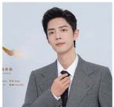
တရုတ်အနုပညာရှင် ရှောင်း ကျန်၏ Fellow Traveller သီချင်းသည် 2024 China Digital Music Industry Conference တွင် Charity ကဏ္ဍ၌ စာရင်းဝင် ဖြစ်ခဲ့သည်ဟု စီနိုဘိုဝက်ဘ်ဆိုက် တွင် ဖော်ပြသည်။

ရှောင်းကျန်၏ သာယာချို အေးသောအသံနှင့် Fellow Traveller သီချင်းသည် ၂၀၂၄ ခုနှစ် တရုတ်ဒစ်ဂျစ်တယ်တေး ဂီတဖျော်ဖြေပွဲ၏ Charity ကဏ္ဍ တွင် Excellent Digital Music work အဖြစ် ဆန့်ခါတင် စာရင်းဝင် ဖြစ်ခဲ့ခြင်း ဖြစ်သည်။