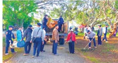
မြို့နယ်စီမံအုပ်ချုပ်ရေးအဖွဲ့ဥက္ကဋ္ဌနှင့် အဖွဲ့ဝင်များ၊ တာဝန်ရှိသူများက လိုက်လံကြည့်ရှုအားပေးခဲ့ကြကြောင်း သိရသည်။ (၃၃၈)

ခဲ့သည်။ သန့်ရှင်းရေးလုပ်ငန်းများကို ပြည်သူ့ဆေးရုံဝင်း အတွင်း၊ အပြင်များ၊ ချွံနွယ်ပိတ်ပေါင်းများ ရှင်းလင်းခြင်း၊ ရေမြောင်းများ ရှင်းလင်းခြင်း၊ အဆောက်အအုံများနှင့် ငြိုနေသည့်သစ်ကိုင်းများအား ခုတ်ထွင်ရှင်းလင်းခြင်း၊ အမှိုက်များ ရှင်းလင်းလုပ်ငန်းများ ဆောင်ရွက်နေမှုများအား