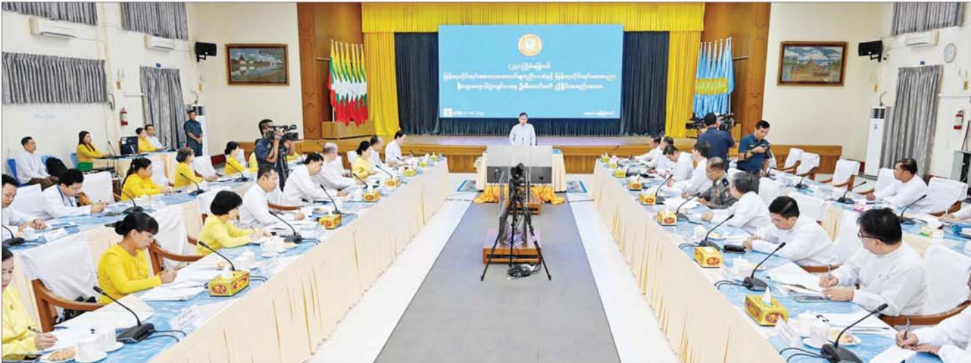
နိုင်ငံတော်စီမံအုပ်ချုပ်ရေးကောင်စီ ဒုတိယဥက္ကဋ္ဌ ဒုတိယဝန်ကြီးချုပ် ဒုတိယဗိုလ်ချုပ်မှူးကြီးစိုးဝင်း (၂၃) ကြိမ်မြောက် မြန်မာတိုင်းရင်းဆေးသမားတော်များညီလာခံနှင့် မြန်မာတိုင်းရင်းဆေးပညာ နှီးနှောဖလှယ်ပွဲကျင်းပရေးဦးစီးကော်မတီ ညှိနှိုင်းအစည်းအဝေးတွင် အမှာစကားပြောကြားစဉ်။

နေပြည်တော် နိုဝင်ဘာ ၄ နိုင်ငံတော်စီမံအုပ်ချုပ်ရေးကောင်စီဥက္ကဋ္ဌ နိုင်ငံတော်ဝန်ကြီးချုပ် ဗိုလ်ချုပ်မှူးကြီး မင်းအောင်လှိုင်သည် တရုတ်ပြည်သူ့သမ္မတနိုင်ငံ၏ ဖိတ်ကြားချက်အရ မကြာမီရက်ပိုင်းအတွင်း တရုတ်ပြည်သူ့သမ္မတနိုင်ငံသို့ သွားရောက်မည်ဖြစ်သည်။ ခရီးစဉ်အတွင်း တရုတ်ပြည်သူ့သမ္မတနိုင်ငံ ကူမင်းမြို့တွင် နိုဝင်ဘာ ၆ ရက်မှ ၇ ရက် အထိ ကျင်းပပြုလုပ်မည့် အရှေ့အာရှဒေသခွဲထိပ်သီးအစည်းအဝေး 8 th Greater Mekong Subregion Economic Cooperation Program (GMS) Summit၊ (၁၀) ကြိမ်မြောက် ဧရာဝတီ-ကျောက်ဖရား-မဲခေါင်စီးပွားရေး ပူးပေါင်းဆောင်ရွက်မှုမဟာဗျူဟာ ထိပ်သီးအစည်းအဝေး 10 th Ayeyawady-Chao Phraya-Mekong Economic Cooperation Strategy (ACMECS) Summit နှင့် (၁၁) ကြိမ်မြောက် ကမ္ဘောဒီးယား-လာအို-မြန်မာ-ဗီယက်နမ် ပူးပေါင်းဆောင်ရွက်မှု ထိပ်သီးအစည်းအဝေး 11 th Cambodia-Lao PDR-Myanmar-Vietnam (CLMV) Summit တို့သို့ ပါဝင်တက်ရောက်ခြင်း၊ တရုတ်ပြည်သူ့သမ္မတနိုင်ငံအစိုးရအဖွဲ့ တာဝန်ရှိသူများနှင့် တွေ့ဆုံဆွေးနွေးခြင်းများကို ဆောင်ရွက်သွားမည်ဖြစ်ပြီး နှစ်နိုင်ငံအစိုးရနှင့် ပြည်သူများအကြား ချစ်ကြည်ရေး၊ စီးပွားရေးနှင့်ကဏ္ဍပေါင်းစုံတွင် ပူးပေါင်းဆောင်ရွက်မှုများ ပိုမိုတိုးတက်ခိုင်မာအောင် ဆွေးနွေးဆောင်ရွက်သွားမည်ဖြစ်ကြောင်း သိရသည်။