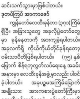
ဒုတိယကြိမ် အာကာဇော်

ပဉ္စမအကြိမ် အမျိုးသားအားကစား ပွဲတော်မှာ ဝင်ရောက်ပြီးတော့ လေထီး ခွန်ခွင့်ရရှိခဲ့ပါတယ်။ အခုလို လုပ်နိုင်တဲ့ အရွယ်မှာ ပါဝင်ခွင့်ရတဲ့အတွက် ဂုဏ်ယူ ဝမ်းမြောက်မိပါတယ်။ ရဟတ်ယာဉ်နှစ်စင်း နဲ့ အမြင့်ပေ ၆၀၀၀ ကနေ ရှစ်ယောက်တဲ့ ခုန့်မှာ ဖြစ်ပါတယ်။ အမြင့်ပေ ၆၀၀၀ ကနေ လေထီးအလွတ်ခွန်မယ်၊ သတ်မှတ် အမြင့်ပေ ၄၅၀၀ မှာ လေထီးဖွင့်ပြီးတော့ အပေါ်မှာ အနိမ့်အမြင့်စီပြီး ဆင်းသက်မှာ ဖြစ်ပါတယ်။ ဆင်းသက်တဲ့အခါမှာ ပွဲတော်အလံနဲ့တိုင်းဒေသကြီးနဲ့ပြည်နယ် အလံကို သယ်ဆောင်ပြီးတော့ သရုပ်ပြ