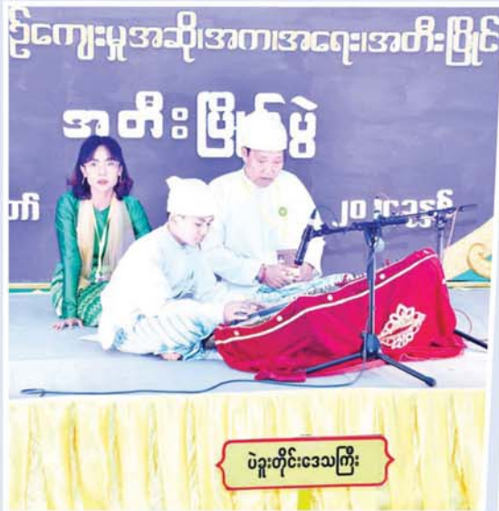
ပဲခူးတိုင်းဒေသကြီး