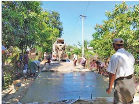
ကွန်ကရစ်လမ်းခင်းခြင်းလုပ်ငန်းဆောင်ရွက်နေမှု စစ်ဆေး

မိုးခတ် နိုဝင်ဘာ ၄ ရမ်းကင်းစေ့အသက် (၂)နှစ် အောက် ကလေးငယ်များနှင့် ကိုယ်ဝန်ဆောင်မိခင်များအား ပုံမှန်ကာကွယ်ဆေးထိုးနှံခြင်းကို နိုဝင်ဘာ ၃ ရက် နံနက်ပိုင်းက မိုးခတ်မြို့နယ်မိခင်နှင့် ကလေး ကျန်းမာရေးဌာနတွင် တိုက်ကျွေး ထိုးနှံပေးသည်။ ထိုသို့ ကာကွယ်ဆေးထိုးနှံ ရာတွင် ကျန်းမာရေးဝန်ထမ်း များက မိုးခတ်မြို့ပေါ်ရှိ ရပ်ကွက် နှင့်ကျေးရွာများရှိ မွေးကင်းစေ့ အသက် (၂)နှစ်အောက် ကလေး ငယ်များအား ပုံမှန်ကာကွယ်ဆေး များဖြစ်သော ဆုံဆုံ၊ ကြက်ညှာ၊ မေးခိုင်၊ အသည်းရောင် အသားဝါ (ဘီ)ပိုး၊ ဦးနှောက်အမြှေးရောင်၊ (ဂ)မျိုးစပ်ကာကွယ်ဆေး၊ ပိုလီယို အကြောသေ၊ ဝက်သက်၊ ဂျီက သုံး၊ ငြင်းထန် ဝမ်းပျက်ဝမ်းလျှော ဖြစ်စေတတ်သော (Rota)ကာ ကွယ်ဆေးကိုပါ တိုက်ကျွေးပြီး ကိုယ်ဝန်ဆောင်မိခင်များအား မေးခိုင် - ဆုံဆုံကာကွယ်ဆေး ထိုးနှံပေးခြင်းတို့ကို တိုက်ကျွေး ထိုးနှံပေးလျက်ရှိကြောင်း သိရ သည်။ (အပေါ်ပုံ) မြို့နယ်(ပြန်/ဆက်)