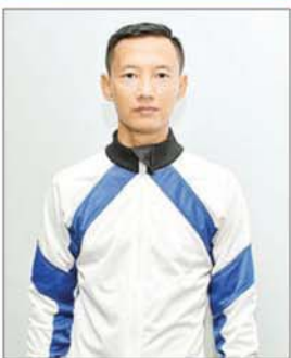
ဗိုလ်ကြီး အောင်ကျော်ဟန်

ကျွန်တော်တို့ လေထီးစစ်သည်တွေ အားလုံး အထက်ကပေးအပ်လိုက်တဲ့ တာဝန်ကို အောင်အောင်မြင်မြင်ဖြစ်ဖို့ အတွက် အလုံးစုံတာဝန်ယူထားပါတယ်။ လေ့ကျင့်မှုအနေနဲ့က နေပြည်တော်ကို မရောက်ခင် မှော်ဘီမှာ (၄၅)ကြိမ် Y-12 လေယာဉ်နဲ့ လေ့ကျင့်ပြီး အခု ကျွန်တော် တို့ နေပြည်တော်မှာ လေ့ကျင့်တာ (၃၁) ကြိမ်ရှိပါပြီ။ အခုလို ပဉ္စမအကြိမ် မြောက် အမျိုးသားအားကစားပွဲတော် ကြီးမှာ တပ်မတော်ရဲ့ စွမ်းရည်ကို ပြသ ရတဲ့အတွက် အလွန်ဂုဏ်ယူမိပါတယ်။