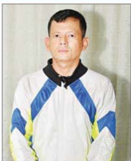
ဗိုလ်မှူး အောင်ထွန်းမင်း