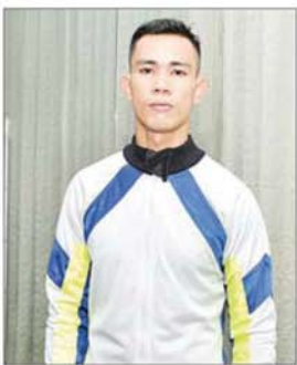
ဒုတိယကြိမ် အာကာဇော်