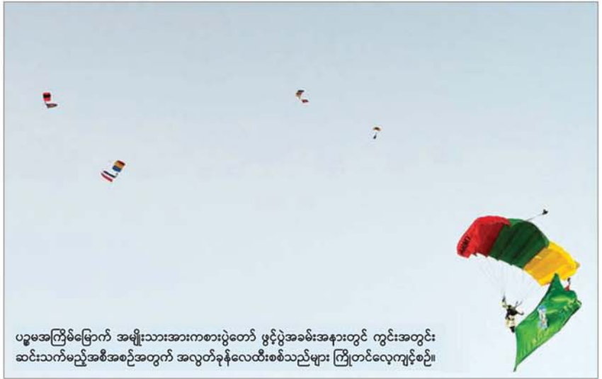
ပဉ္စမအကြိမ်မြောက် အမျိုးသားအားကစားပွဲတော် ဖွင့်ပွဲအခမ်းအနားတွင် ကွင်းအတွင်း ဆင်းသက်မည့်အစီအစဉ်အတွက် အလွတ်ခွန်လေထီးစစ်သည်များ ကြိုတင်လေ့ကျင့်စဉ်။