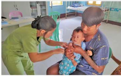
မွေးကင်းစေ့အသက် (၂)နှစ်အောက်ကလေးနှင့် ကိုယ်ဝန်ဆောင်မိခင်များအား ပုံမှန်ကာကွယ်ဆေးတိုက်ကျွေးပေးခြင်း

မိုးခတ် နိုဝင်ဘာ ၄ ရမ်းကင်းစေ့အသက် (၂)နှစ် အောက် ကလေးငယ်များနှင့် ကိုယ်ဝန်ဆောင်မိခင်များအား ပုံမှန်ကာကွယ်ဆေးထိုးနှံခြင်းကို နိုဝင်ဘာ ၃ ရက် နံနက်ပိုင်းက မိုးခတ်မြို့နယ်မိခင်နှင့် ကလေး ကျန်းမာရေးဌာနတွင် တိုက်ကျွေး ထိုးနှံပေးသည်။ ထိုသို့ ကာကွယ်ဆေးထိုးနှံ ရာတွင် ကျန်းမာရေးဝန်ထမ်း များက မိုးခတ်မြို့ပေါ်ရှိ ရပ်ကွက် နှင့်ကျေးရွာများရှိ မွေးကင်းစေ့ အသက် (၂)နှစ်အောက် ကလေး ငယ်များအား ပုံမှန်ကာကွယ်ဆေး များဖြစ်သော ဆုံဆုံ၊ ကြက်ညှာ၊ မေးခိုင်၊ အသည်းရောင် အသားဝါ (ဘီ)ပိုး၊ ဦးနှောက်အမြှေးရောင်၊ (ဂ)မျိုးစပ်ကာကွယ်ဆေး၊ ပိုလီယို အကြောသေ၊ ဝက်သက်၊ ဂျီက သုံး၊ ငြင်းထန် ဝမ်းပျက်ဝမ်းလျှော ဖြစ်စေတတ်သော (Rota)ကာ ကွယ်ဆေးကိုပါ တိုက်ကျွေးပြီး ကိုယ်ဝန်ဆောင်မိခင်များအား မေးခိုင် - ဆုံဆုံကာကွယ်ဆေး ထိုးနှံပေးခြင်းတို့ကို တိုက်ကျွေး ထိုးနှံပေးလျက်ရှိကြောင်း သိရ သည်။ (အပေါ်ပုံ) မြို့နယ်(ပြန်/ဆက်)