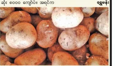
ရွှေမန်း

ငွေကျပ် ၇၀၀၊ OK - မျက်နီက ငွေကျပ် ၆၈၀ ကျပ်၊ A1- မျက်နီ ငွေကျပ် ၅၅၀ ကျပ်၊ A1- ဆုံ မျက်နီအဟောင်းက ငွေကျပ် ၅၂၀ ကျပ်နှင့် ဂေါ်လီဆိုင်- မျက်နီအဟောင်းက တစ်ပိဿာကို ငွေကျပ် ၂၅၀ - ၃၀၀ ပေါက်ဈေးရှိနေသည်။ အာလူးက အဝယ်လိုက်ပြီး ပစ္စည်းအဝင်ကလည်း နည်းတော့ ဈေးက ဆက်တိုက်ထိုးတက်လာတာ။ ရှမ်းတောင်မှာဆိုရင် အခု မဝင်ပေမယ့် ဈေးတန်းက အမြင့်ဆုံး ၈၀၀ ကျပ်ပဲ။ အရင်က ဂေါ်လီဆိုင်သေးဆို တစ်ပိဿာ ငွေကျပ် ၁၅၀ အများဆုံးက နေ အခုငွေကျပ် ၃၀၀ အထိရှိလာတယ် ဟု ကုန်သည်တစ်ဦးက ပြောသည်။ ရှမ်းပြည်နယ်မှာလည်း ရေကြီးနစ်မြုပ်မှုတွေကြောင့် အာလူးစိုက်ခင်းတွေ ပျက်စီးမှုရှိခဲ့သည့်အတွက် အထွက်လျော့ကျပြီး ကုန်စိမ်းပွဲရုံတွေကို ပစ္စည်းဝင်ရောက်မှုနည်းနေတာကြောင့် အာလူးဈေးကွက် တက်လာခြင်းဖြစ်ကြောင်း သိရသည်။