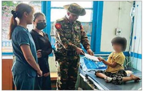
ဒဏ်ရာရရှိခဲ့သည့် ကလေးငယ်များအား တာဝန်ရှိသူများက သွားရောက်အားပေးပြီး ထောက်ပံ့ငွေများပေးအပ်စဉ်။