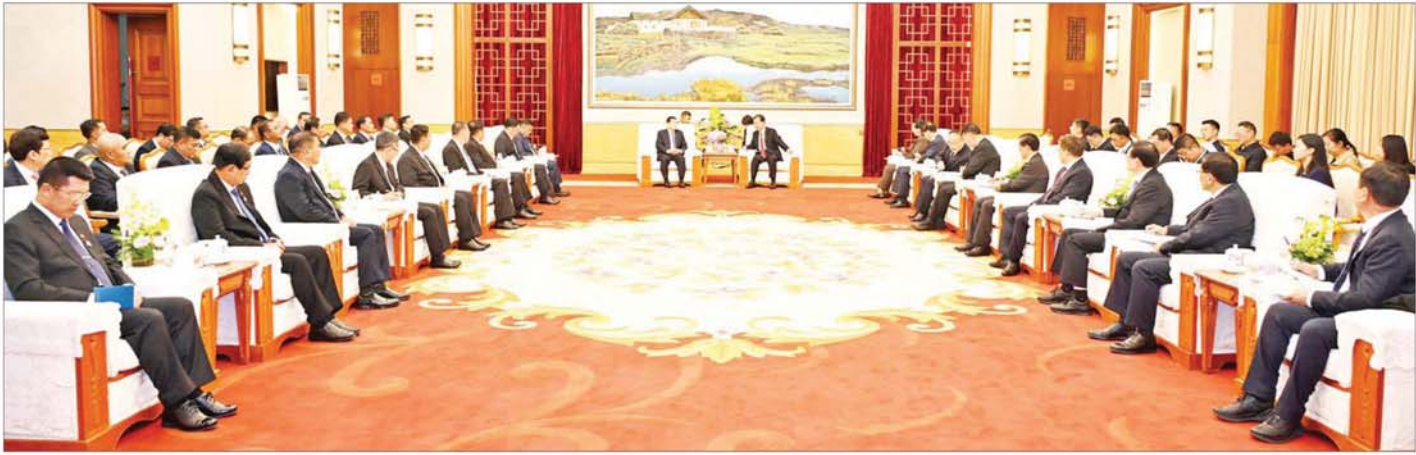
နိုင်ငံတော်စီမံအုပ်ချုပ်ရေးကောင်စီဥက္ကဋ္ဌ နိုင်ငံတော်ဝန်ကြီးချုပ် ဗိုလ်ချုပ်မှူးကြီး မင်းအောင်လှိုင် တရုတ်ကွန်မြူနစ်ပါတီ ဗဟိုကော်မတီအဖွဲ့ဝင်နှင့် ယူနန်ပြည်နယ် ပါတီကော်မတီအတွင်းရေးမှူး H.E. Mr. Wang Ning နှင့် တွေ့ဆုံဆွေးနွေးစဉ်။

( ၃-၉-၂၀၂၄ ရက်နေ့တွင် နိုင်ငံတော်စီမံအုပ်ချုပ်ရေးကောင်စီဥက္ကဋ္ဌ နိုင်ငံတော် ဝန်ကြီးချုပ် ဗိုလ်ချုပ်မှူးကြီး မင်းအောင်လှိုင် ရှမ်းပြည်နယ် အစိုးရအဖွဲ့ဝင်များ၊ ပြည်နယ်နှင့် ဒရိုင်းအဆင့် ဌာနဆိုင်ရာတာဝန်ရှိသူများအား ပြောကြားသည့် အမှာ စကားမှ ကောက်နုတ်ချက် )