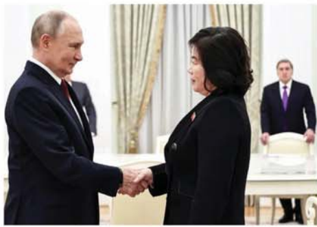
ညွှတ်ရေးနေ့တွင် ၎င်းအလည်အပတ်ရောက်ရှိလာသဖြင့် ဝမ်းမြောက်မိသည်ဟု သမ္မတ ပလာဒီမာပူတင်က ထုတ်ဖော်ပြောကြားသည်။ မြောက်ကိုရီးယားနိုင်ငံခြား

မော်စကို နိုဝင်ဘာ ၅ ရုရှားသမ္မတ ပလာဒီမာပူတင် က နိုဝင်ဘာ ၄ ရက်တွင် မြောက်ကိုရီးယား နိုင်ငံခြားရေးဝန်ကြီး ချောဆွန်ဟွီးအား မော်စကိုမြို့ တော်၌ လက်ခံတွေ့ဆုံခဲ့ကြောင်း စီအင်န်အေသတင်းဌာနက ဖော်ပြသည်။ ထိုသို့တွေ့ဆုံစဉ် မြောက်ကိုရီးယားခေါင်းဆောင် ကင်မ်က လှိုက်လှဲစွာ နှုတ်ခွန်းဆက်သည့် စကားပါးလိုက်ကြောင်း ချောဆွန်ဟွီးက ထုတ်ဖော်ပြောကြားသည်။ ရုရှားနိုင်ငံ၏အမျိုးသားညီ