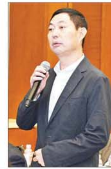
ပြည်ထောင်စုဝန်ကြီး ဒေါက်တာကဇော် ဆွေးနွေးပြောကြားစဉ်။