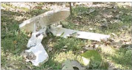
နေပြည်တော်ကောင်စီနယ်မြေရှိ အရေးကြီးနေရာများအား ဖောက်ခွဲဖျက်ဆီးခြင်းများပြုလုပ်ရန် အကြမ်းဖက်သမားများလွှတ်တင်ခဲ့သည့် Fixed Wing များအားလုံး ဟန့်တားနိုင်ခဲ့သည့် မှတ်တမ်းဓာတ်ပုံ။

နေပြည်တော်ကောင်စီနယ်မြေရှိ အရေးကြီးအဆောက်အဦများနှင့် နေရာဌာနများအား ဖောက်ခွဲဖျက်ဆီးရန်နှင့် ပြည်သူများ အထိတ်တလန့်ဖြစ်စေရန် ယုတ်မာကောက်ကျစ်သည့် အကြံအစည်များဖြင့် အကြမ်းဖက်သမားများသည် အရှေ့ဘက်အရပ်မှ ယနေ့နံနက်ပိုင်းက လယ်ဝေးမြို့နယ်အတွင်းသို့ ဒေသန္တရလုပ် Fixed Wing အချို့ စမ်းသပ်ပစ်လွှတ်ခြင်းဖြင့် အကြမ်းဖက်ဖောက်ခွဲရေးလုပ်ရပ်များ လုပ်ဆောင်နိုင်ရန် ကြံစည်ကြိုးပမ်းလာခဲ့သည်။