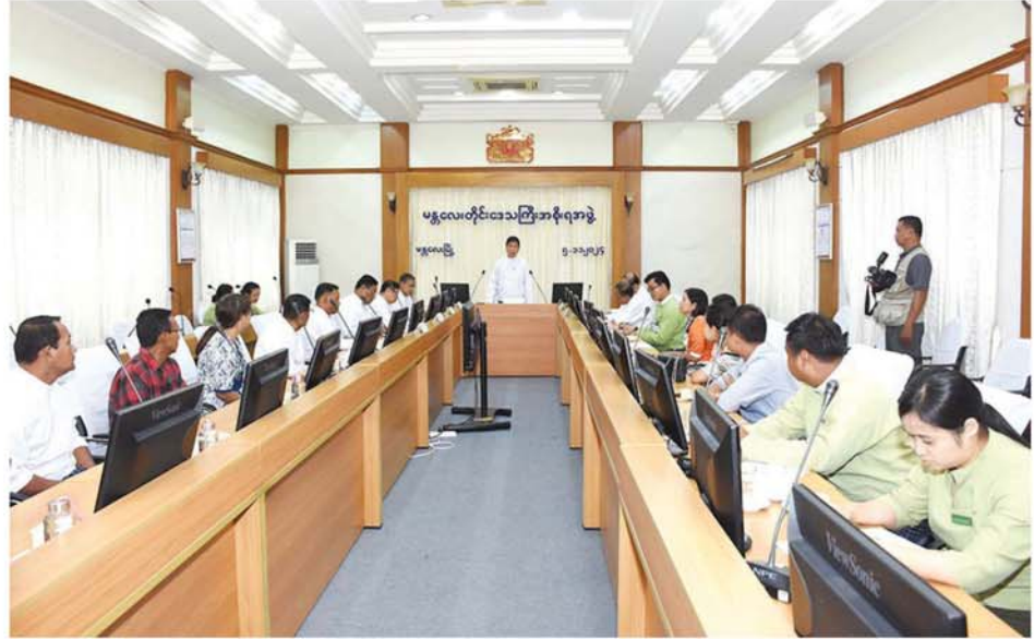
အခြေအနေများကို ရှင်းလင်းတင်ပြရာ တိုင်းဒေသကြီးအစိုးရအဖွဲ့ဝင် ဝန်ကြီးများက ပြည်ခွဲစိတ်ပြောကြားပြီး တိုင်းဒေသကြီးဝန်ကြီးချုပ်က လိုအပ်သည်များကို ပေါင်းစပ်ဖြည့်ဆည်းဆောင်ရွက်ပေး၍ ဖြိုင်ပွဲဝင်အသင်းအတွက် ထောက်ပံ့ငွေကျပ် ၅၅ သိန်းကို တာဝန်ရှိသူများထံ ပေးအပ်ခဲ့ကြောင်း သိရသည်။ (မန္တလေးနေ့စဉ်) ၀-၀-၀-၀

မသိုးသင်္ကန်းရက်လုပ်ပူဇော်ပွဲသည် ထင်ရှားသည့် အလှူဒါနတစ်ခုဖြစ်ပါကြောင်း၊ ကာယ၊ ဉာဏ၊ ဇွဲ၊ လုံ့လ၊ ဝီရိယအားများကို အခြေခံ၍ တတ်မြောက်ထားသည့် ပညာများဖြင့် ရက်လုပ်ပူဇော် လှူဒါန်းရသည့်အတွက် များစွာကုသိုလ်အကျိုးများပါကြောင်း၊ ဖြိုင်ပွဲစည်းမျဉ်းစည်းကမ်းများနှင့်အညီ အသင်းအဖွဲ့စိတ်ဓာတ်အပြည့်ဖြင့် ယှဉ်ပြိုင်ကာ တိုင်းဒေသကြီးဂုဏ်ဆောင်နိုင်သူများဖြစ်အောင် ကြိုးစားသွားစေလိုပါကြောင်း အားပေးစကားများ ပြောကြားခဲ့သည်။ ၎င်းနောက် မာရဝိဇယဗုဒ္ဓရုပ်ပွားတော်မြတ်ကြီး၌ မသိုးသင်္ကန်း လှူဒါန်းပူဇော်ပွဲ၌ ပါဝင်ယှဉ်ပြိုင်မည့် မန္တလေးတိုင်းဒေသကြီးကိုယ်စားပြု အမရရွှေပြည်ရက်ကန်းစင်တော်မှ ဖြိုင်ပွဲဝင်အသင်း အုပ်ချုပ်သူ၊ ကြီးကြပ်သူများက ကြိုတင်ပြင်ဆင်ထားမှု