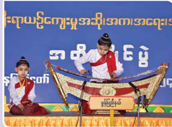
ပတ္တလားအတီးဖြိုင်ပွဲ အခြေခံပညာအဆင့်(အမျိုးသမီး) အသက် ၁၅ နှစ်မှ ၂၀ နှစ်အတွင်း)၌ ပထမဆုရရှိသည့် မွန်ပြည်နယ်မှ မနွေးနွေးထက် "ကျွန်းကျွန်းပိုင်သာ" (ကြိုး)သီချင်းဖြင့် တီးခတ်ယှဉ်ပြိုင်ဟန်။