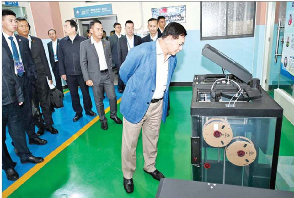
နိုင်ငံတော်စီမံအုပ်ချုပ်ရေးကောင်စီဥက္ကဋ္ဌ နိုင်ငံတော်ဝန်ကြီးချုပ် ဗိုလ်ချုပ်မှူးကြီးမင်းအောင်လှိုင်နှင့်အဖွဲ့ ယူနန်အသက်မွေးဝမ်းကျောင်းနှင့် စက်မှုလက်မှုနည်းပညာကောလိပ်တွင် ကြည့်ရှုလေ့လာစဉ်။

ဦးစွာ နိုင်ငံတော်စီမံအုပ်ချုပ်ရေးကောင်စီဥက္ကဋ္ဌ နိုင်ငံတော်ဝန်ကြီးချုပ်နှင့် အဖွဲ့ဝင်များသည် ယူနန်အသက်မွေးဝမ်းကျောင်းနှင့် စက်မှုလက်မှု နည်းပညာကောလိပ်သို့ ရောက်ရှိကြရာ ကောလိပ်မှ တာဝန်ရှိသူများက ကြိုဆိုနှုတ်ဆက်ကြသည်။ ထို့နောက် ကောလိပ်ဆိုင်ရာ အချက်အလက်များ၊ ကောလိပ်မှ ဖွင့်လှစ်သင်ကြားပေးလျက်ရှိသည့် သက်မွေးပညာဘာသာရပ်များနှင့် နည်းပညာဆိုင်ရာ ဘာသာရပ်များ၊ မြန်မာနိုင်ငံ နယ်စပ်ရေးရာဝန်ကြီးဌာနအောက်ရှိ နယ်စပ်ဒေသနှင့် တိုင်းရင်းသားလူမျိုးများ ဖွံ့ဖြိုးရေးတက္ကသိုလ်အပါအဝင် နိုင်ငံတကာမှ သက်မွေးဘာသာရပ်ဆိုင်ရာ သင်ကြားပေးနေသည့် ကောလိပ်များ၊ တက္ကသိုလ်များဖြင့် ဆက်ဆံမှုစနစ် ထူထောင်ထားရှိ