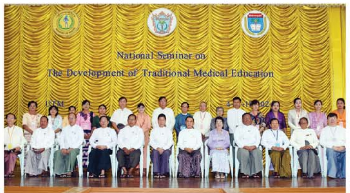
National Seminar on The Development of Traditional Medical Education