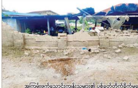
အကြမ်းဖက်သောင်းကျန်းသူများ၏ ပစ်ခတ်တိုက်ခိုက်မှုကြောင့် နေအိမ်များ ပြိုကျပျက်စီးခဲ့မှုများကို တွေ့မြင်ရစဉ်။

နေပြည်တော် နိုဝင်ဘာ ၅ ရှမ်းပြည်နယ် (မြောက်ပိုင်း) နမ့်လန်မြို့နယ် မနိခိုင်ကျေးရွာနှင့် ပန်ဟိုက်ကျေးရွာများကို MNDAA အကြမ်းဖက် သောင်းကျန်းသူများက ယနေ့မုန်းလွှဲပိုင်းတွင် လက်နက်ကြီးများဖြင့် ပစ်ခတ်တိုက်ခိုက်မှုကြောင့် ကလေးငယ်နှစ်ဦး ထိခိုက်ဒဏ်ရာများ ရရှိခဲ့ကြောင်း သိရှိရသည်။