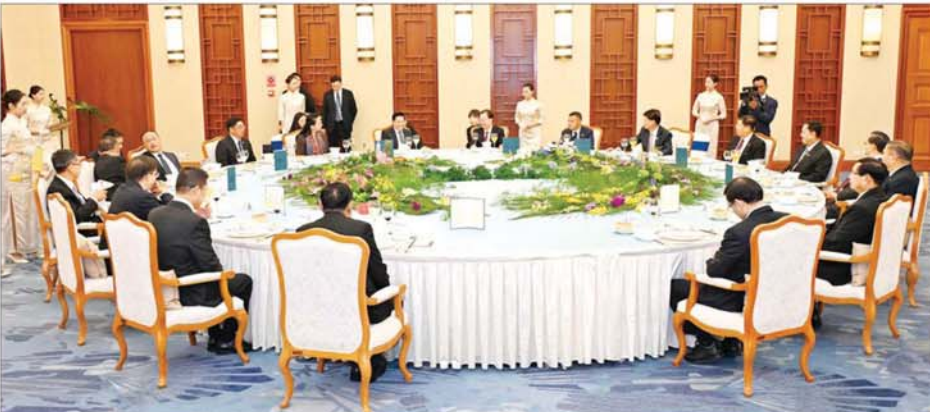
နိုင်ငံတော်စီမံအုပ်ချုပ်ရေးကောင်စီဥက္ကဋ္ဌ နိုင်ငံတော်ဝန်ကြီးချုပ် ပိုလ်ချုပ်မှူးကြီးမင်းအောင်လှိုင်နှင့် အဖွဲ့ဝင်များအား တရုတ်ကွန်မြူနစ်ပါတီ ဗဟိုကော်မတီအဖွဲ့ဝင်နှင့် ယူနန်ပြည်နယ်ပါတီ ကော်မတီအတွင်းရေးမှူးက တည်ခင်းစည်းခံသည့် ညစာကို အတူတကွသုံးဆောင်ကြစဉ်။

တွေ့ဆုံပွဲအပြီးတွင် နိုင်ငံတော်စီမံအုပ်ချုပ်ရေးကောင်စီ ဥက္ကဋ္ဌ နိုင်ငံတော်ဝန်ကြီးချုပ်နှင့် တရုတ်ကွန်မြူနစ်ပါတီ ဗဟိုကော်မတီအဖွဲ့ဝင်နှင့် ယူနန်ပြည်နယ်ပါတီကော်မတီအတွင်းရေးမှူးတို့သည် အမှတ်တရ လက်ဆောင်ပစ္စည်းများ အပြန်အလှန်ပေးအပ်ကြသည်။