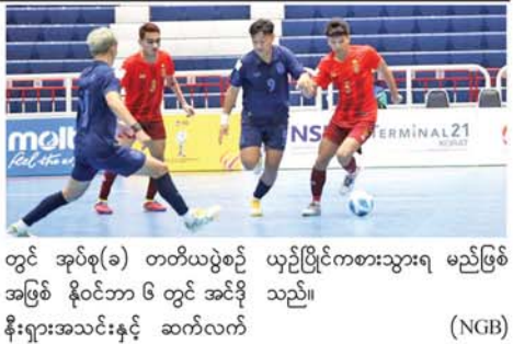
တွင် အုပ်စု(ခ) တတိယပွဲစဉ် ယှဉ်ပြိုင်ကစားသွားရမည်ဖြစ်အဖြစ် နိုင်ငံဘာ ၆ တွင် အင်ဒိုနီးရှားအသင်းနှင့် ဆက်လက် (NGB)

စိတ်ဓာတ်အပြည့်နဲ့ အနိုင်ရရှိအောင် ကစားပေးခဲ့တဲ့ ကစားသမားအားလုံးကို ကျေးဇူးတင်ပါတယ်**ဟု သုံးသပ်ပြောကြားခဲ့သည်။ မြန်မာ့လက်ရွေးစင် ဖူဆယ်အသင်းသည် AFF Futsal Championship 2024 ဖြင့်ပွဲ