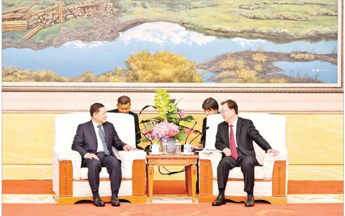
နိုင်ငံတော်စီမံအုပ်ချုပ်ရေးကောင်စီဥက္ကဋ္ဌ နိုင်ငံတော်ဝန်ကြီးချုပ် ဗိုလ်ချုပ်မှူးကြီးမင်းအောင်လှိုင် တရုတ်ကွန်မြူနစ်ပါတီ ဗဟိုကော်မတီအဖွဲ့ဝင်နှင့် ယူနန်ပြည်နယ်ပါတီကော်မတီအတွင်းရေးမှူး H.E. Mr. Wang Ning နှင့် တွေ့ဆုံဆွေးနွေးစဉ်။

နေပြည်တော် နိုဝင်ဘာ ၅ နိုင်ငံတော် စီမံအုပ်ချုပ်ရေးကောင်စီဥက္ကဋ္ဌ နိုင်ငံတော်ဝန်ကြီးချုပ် ဗိုလ်ချုပ်မှူးကြီး မင်းအောင်လှိုင်သည် တရုတ်ပြည်သူ့သမ္မတနိုင်ငံ တရုတ်ကွန်မြူနစ်ပါတီ ဗဟိုကော်မတီအဖွဲ့ဝင်နှင့် ယူနန်ပြည်နယ်ပါတီကော်မတီအတွင်းရေးမှူး H.E. Mr. Wang Ning နှင့် ယနေ့ညနေပိုင်းတွင် ကူမင်းမြို့ရှိ Haigeng Hotel ဧည့်ခန်းမဆောင်၌ တွေ့ဆုံဆွေးနွေးသည်။ ဦးစွာ နိုင်ငံတော်စီမံအုပ်ချုပ်ရေးကောင်စီဥက္ကဋ္ဌ နိုင်ငံတော်ဝန်ကြီးချုပ်နှင့် အဖွဲ့ဝင်များအား တရုတ်ပြည်သူ့သမ္မတနိုင်ငံ တရုတ်ကွန်မြူနစ်ပါတီ ဗဟိုကော်မတီအဖွဲ့ဝင်နှင့် ယူနန်ပြည်နယ်ပါတီကော်မတီ အတွင်းရေးမှူးက လှိုက်လှဲဆွေးနွေးစွာ ကြိုဆိုနှုတ်ဆက်ပြီး မှတ်တမ်းတင်စာတံပုံရိုက်ကြသည်။ ထို့နောက် တွေ့ဆုံဆွေးနွေးရာ၌ တရုတ်ပြည်သူ့သမ္မတနိုင်ငံ တရုတ်ကွန်မြူနစ်ပါတီ ဗဟိုကော်မတီအဖွဲ့ဝင်နှင့် ယူနန်ပြည်နယ်ပါတီကော်မတီ အတွင်းရေးမှူးက စာမျက်နှာ ၃ သို့ ။