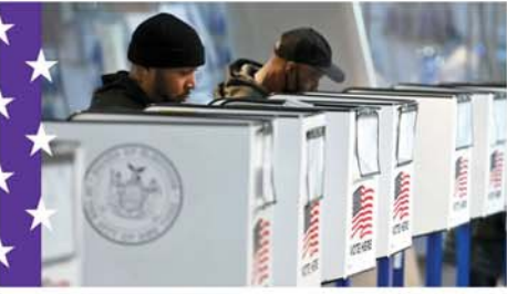
၂၀၂၄ ခုနှစ် သမ္မတရွေးကောက်ပွဲအတွက် အမေရိကန်ပြည်ထောင်စုရှိ မဲရုံတစ်ရုံတွင် နိုဝင်ဘာ ၅ ရက်က လူနစ်ဦး မဲပေးနေကြစဉ်။ Mon

ဒေလီ နိုဝင်ဘာ ၅ အိန္ဒိယနိုင်ငံမြောက်ပိုင်းရှိ ဥတ္တရာဒန်းပြည်နယ်အတွင်း နိုဝင်ဘာ ၄ ရက် နံနက်ပိုင်းက ခရီးသည်တင် ဘတ်စ်ကားတစ်စီး ချောက်ထဲထိုးကျမှုဖြစ်ပွားရာ လူ ၃၆ ဦး သေဆုံးပြီး ၂၇ ဦး ဒဏ်ရာရရှိခဲ့ကြောင်း ဘီဘီစီသတင်းဌာနက ဖော်ပြသည်။ ခရီးသည် ၄၄ ဦးကို တင်ဆောင်ထွက်ခွာခဲ့သည့်ဆိုသော ဘတ်စ်ကားသည် အယ်လ်ဗိုရာခရိုင်အတွင်းရှိ မီတာ ၅၀ ခန့်