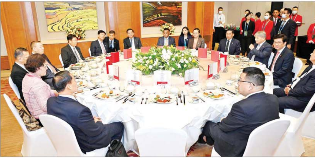
နိုင်ငံတော်စီမံအုပ်ချုပ်ရေးကော်မတီဥက္ကဋ္ဌ နိုင်ငံတော်ဝန်ကြီးချုပ် ဝိလ်ချပ်မြူးကြီးမင်းအောင်လှိုင်နှင့် အဖွဲ့ဝင်များ ပြည်ထောင်စုသမ္မတမြန်မာနိုင်ငံကုန်သည်များနှင့် စက်မှုလက်မှုလုပ်ငန်းရှင်များအသင်းချုပ် (UMFCCI) က တည်ခင်းစဉ်ခံသည့် နေ့လယ်စာကို အတူတကွသုံးဆောင်ကြစဉ်။

ထိုကဲ့သို့ တရုတ်နိုင်ငံမှ ကုမ္ပဏီများ၏ မေးမြန်းဆွေးနွေးမှုများနှင့်ပတ်သက်၍ သက်ဆိုင်ရာဝန်ကြီးဌာနများအလိုက်မှ ပြည်ထောင်စုဝန်ကြီးများက ပြန်လည်ဆွေးနွေးပြောကြားရာတွင် ရင်းနှီးမြှုပ်နှံမှုနှင့် နိုင်ငံခြားစီးပွားဆက်သွယ်ရေးဝန်ကြီးဌာန ပြည်ထောင်စုဝန်ကြီး ဒေါက်တာကဝေဇော်နှင့် စွမ်းအင်ဝန်ကြီးဌာန ပြည်ထောင်စုဝန်ကြီး ဦးကိုကိုလှတို့က မြန်မာနိုင်ငံ၏ လျှပ်စစ်စီးသုံးစွဲမှုစနစ်များနှင့် လျှပ်စစ်ဓာတ်အားထုတ်ယူမှုနှင့်ပတ်သက်၍ ပြန်လည်ပြည်ဖြိုးဖြံ့ဖြိုးဖွံ့ဖြိုးအင်ကို အသုံးပြုမှုအပေါ် နိုင်ငံတော်အနေဖြင့် အားပေးဆောင်ရွက်လျက်ရှိမှု၊ လျှပ်စစ်ဓာတ်အားပြည့်စုံစွာ ထုတ်ယူသုံးစွဲနိုင်ရေးအတွက်လည်း ရေရှည်စိစစ်ချက်များကို ချမှတ်ဆောင်ရွက်လျက်ရှိပြီး သဘာဝပတ်ဝန်းကျင်ကို ထိခိုက်မှုအနည်းဆုံးဖြစ်စေမည့် ရင်းနှီးမြှုပ်နှံမှုများကို မိတ်ဆောင်ဆောင်ရွက်လျက်