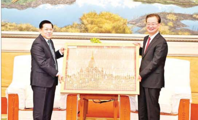
နိုင်ငံတော်စီမံအုပ်ချုပ်ရေးကောင်စီဥက္ကဋ္ဌ နိုင်ငံတော်ဝန်ကြီးချုပ် ဗိုလ်ချုပ်မှူးကြီး မင်းအောင်လှိုင် နှင့် တရုတ်ကွန်မြူနစ်ပါတီ ဗဟိုကော်မတီအဖွဲ့ဝင်နှင့် ယူနန်ပြည်နယ် ပါတီကော်မတီအတွင်းရေးမှူး H.E. Mr. Wang Ning တို့ အမှတ်တရလက်ဆောင်ပစ္စည်းများ အပြန်အလှန်ပေးအပ်စဉ်။

ရှေ့ဖွဲ့မှ နိုင်ငံတော် စီမံအုပ်ချုပ်ရေး ကောင်စီဥက္ကဋ္ဌ နိုင်ငံတော်ဝန်ကြီး ချုပ်နှင့် အဖွဲ့ဝင်များအား ယူနန် ပြည်နယ်မှ လှိုက်လှဲနွေးထွေးစွာ ကြိုဆိုအပ်ပါကြောင်း ဦးစွာ ပြောကြားပြီး ယူနန်ပြည်နယ်၏ ဖွံ့ဖြိုးတိုးတက်နေမှု အခြေအနေ များနှင့် စီးပွားရေးဖွံ့ဖြိုးတိုးတက် မှုရှိစေရေး ဆောင်ရွက်လျက်ရှိမှု၊ တရုတ်နိုင်ငံ ယူနန်ပြည်နယ်နှင့် မြန်မာနိုင်ငံအကြား သံတမန်ရေး အရ၊ စီးပွားရေးအရ ကူးလူး ဆက်ဆံ ဆောင်ရွက်လျက်ရှိမှု၊ နှစ်နိုင်ငံအကြား အေးအတူအမျှ အသိုက်အဝန်း တည်ဆောက်၍ နယ်ပယ်အလိုက် ပူးပေါင်း ဆောင်ရွက်မှုများကို တိုးမြှင့် ဆောင်ရွက်သွားနိုင်ရေး ဆက်လက် ဆောင်ရွက်လျက်ရှိမှု၊ နိုင်ငံ ဖြတ်ကျော် မှုခင်းတိုက်ဖျက်မှုများ ကို အတုတကျပူးပေါင်းဆောင်ရွက် လျက်ရှိမှု၊ နှစ်နိုင်ငံ သဘောတူညီ ပြီးဖြစ်သည့် စီမံကိန်းလုပ်ငန်း များ အမြန်ဆုံး အကောင် အထည်ဖော် ဆောင်ရွက်နိုင် ရေး ကြိုးပမ်းဆောင်ရွက်လျက် ရှိမှုတို့ကို ဆွေးနွေးပြောကြား သည်။ အိမ်နီးချင်းကောင်း နိုင်ငံများဖြစ် ယင်းနောက် နိုင်ငံတော်စီမံ