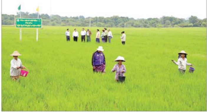
ထိုမှတစ်ဆင့် သာစည်မြို့နယ်ရှိ ညောင်ရမ်းမင်းလှကန်သို့ ရောက်ရှိစစ်ဆေးပြီး ပြည်ထောင်စုဝန်ကြီးက ညောင်ရမ်းကန်နှင့် မင်းလှကန်၏ ရေခြားကန်ပေါင် ပြန်လည်ပြုပြင်ခြင်းလုပ်ငန်းကို လာမည့် နွေစပါးရာသီစိုက်ပျိုးရေးပေးပေးပြီး ကန်ရေ လျော့နည်းချိန်တွင်ဆောင်ရွက်ရန်နှင့်ဘဏ္ဍာငွေအလေ့အလွင်မရှိဆောင်ရွက်နိုင်ရန် ဆွေးနွေးမှာကြားသည်။ ယင်းနောက် ဝမ်းတွင်းမြို့နယ် မြေတိုင်ကန်

နေပြည်တော် နိုဝင်ဘာ ၇ စိုက်ပျိုးရေး၊ မွေးမြူရေးနှင့် ဆည်မြောင်းဝန်ကြီးဌာန ပြည်ထောင်စုဝန်ကြီး ဦးမင်းနောင်သည် ယနေ့နံနက်ပိုင်းတွင် မန္တလေးတိုင်းဒေသကြီး မိတ္ထီလာမြို့နယ် ထမုန်ကန်ကျေးရွာအုပ်စု မိုးစပါး နည်းပညာပေးစံပြစိုက်ကွင်း၌ ကျင်းပသည့် စာတတ်မြေဓာတ်ကြပ်ပတ်ပွဲသို့ တက်ရောက်လာကြသည့် တောင်သူများနှင့် ရင်းနှီးခင်မင်စွာတွေ့ဆုံ၍ စိုက်ပျိုးထုတ်လုပ်မှု အလားအလာကောင်းသော ဒေသများကို အားပေးထောက်ပံ့ကူညီမှုများ ဆောင်ရွက်ပေးလျက်ရှိကြောင်း၊ မျိုးစေ့ထုတ်လုပ်ငန်းရှင်များနှင့် တောင်သူများအကြား မျှတသည့်အကျိုးစီးပွားဖြစ်ထွန်းစေရေး အပြန်အလှန်ပူးပေါင်းဆောင်ရွက်ခြင်းဖြင့် ရေရှည်တည်တံ့သော မျိုးစေ့ထုတ်လုပ်ငန်းများ ဖွံ့ဖြိုးလာစေရေး ကြိုးပမ်းကြစေလိုကြောင်း ဆွေးနွေးပြောကြားပြီး မိုးစပါးခင်းတွင် တောင်သူများ စုပေါင်း၍ စာတတ်မြေဓာတ်ကြပ်ပတ်မှုကို ကွင်းဆင်းကြည့်ရှုအားပေးကြသည်။