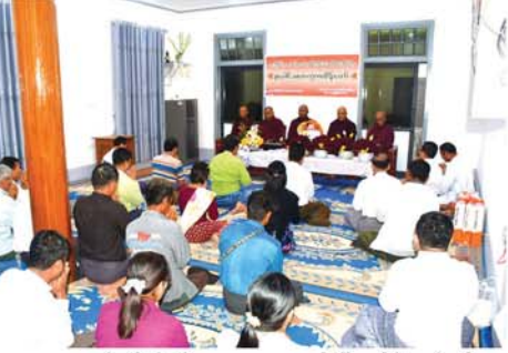
ကျေးရွာကျောင်းတိုက်၊ စီးတောကျေးရွာကျောင်းတိုက်၊ ဘုတ်ကျေးရွာကျောင်းတိုက်တို့ကို လှူဒါန်းမှုစုစုပေါင်းတန်းဖိုး ငွေကျပ် ၁၅၂ သိန်းကျော် လှူဒါန်းခဲ့ပြီး အခမ်းအနားသို့ မြို့နယ်အုပ်ချုပ်ရေးဦးစီးဌာန ဦးစီးဌာန ဝန်ထမ်းများအား အမှတ်တရလက်ဆောင်များ တစ်စိတ်တစ်ဒေသပေးပို့ခဲ့သည်။ အခမ်းအနားသို့ မြို့နယ်စီမံအုပ်ချုပ်ရေးအဖွဲ့ဝင်များ၊ မြို့နယ်အဆင့် ဌာနဆိုင်ရာများ၊ မြို့မိမြို့ဖများနှင့် ဖိတ်ကြားထားသူများ တက်ရောက်ကြည့်ညှိခဲ့ကြောင်း သိရသည်။ (အပေါ်ပုံ)(၀၉၅)

ယင်းနောက် ဌာနဆိုင်ရာ တာဝန်ရှိသူများက သံဃာတော်များအား ကထိန်သင်္ကန်းလျှာဆက်ကပ်လှူဒါန်းပြီး သာဓုအနုမောဒနာတရားနှင့် ရေစက်ချတရား နာယုကြည်ညိုကြသည်။ မြို့နယ်လုံးဆိုင်ရာ စုပေါင်းမဟာဘုံကထိန်တော်၌ မင်းကန်ကျေးရွာကျောင်းတိုက်၊ တောစု