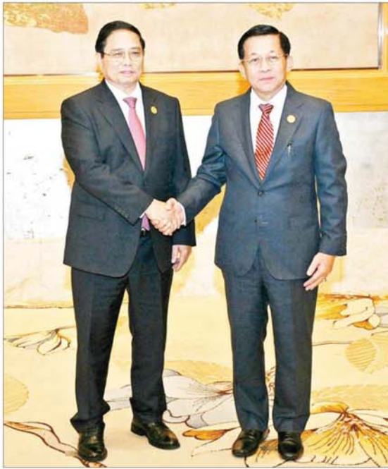
နိုင်ငံတော်စီမံအုပ်ချုပ်ရေးကောင်စီဥက္ကဋ္ဌ နိုင်ငံတော်ဝန်ကြီးချုပ် ဗိုလ်ချုပ်မှူးကြီး မင်းအောင်လှိုင်နှင့် ဗီယက်နမ်နိုင်ငံဝန်ကြီးချုပ် H.E. Mr. Pham Minh Chich တို့ ရင်းရင်းနှီးနှီးနှုတ်ဆက်စဉ်။

ကပ်ရေးဂါဆိုးကြောင့် စီအယ်လ်အမ်စီနိုင်ငံများ၏ စက်မှုကဏ္ဍသည် သိသာထင်ရှားစွာထိခိုက်ခဲ့ကြောင်း၊ အဆိုပါကဏ္ဍ ပြန်လည်ဖွံ့ဖြိုးတိုးတက်ရေးအတွက် မိမိတို့အနေဖြင့် စီးပွားရေးစင်္ကြံများ၊ စီးပွားရေးစင်္ကြံများအကြား ချိတ်