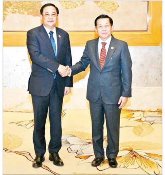
နိုင်ငံတော်စီမံအုပ်ချုပ်ရေးကောင်စီဥက္ကဋ္ဌ နိုင်ငံတော်ဝန်ကြီးချုပ် ဗိုလ်ချုပ်မှူးကြီး မင်းအောင်လှိုင်နှင့် လာအိုနိုင်ငံဝန်ကြီးချုပ် H.E. Mr. Sonexay Siphandone တို့ ရင်းရင်းနှီးနှီးနှုတ်ဆက်စဉ်။

ထို့နောက် (၁၁) ကြိမ်မြောက် ကမ္ဘောဒီးယား- လာအို - မြန်မာ - ဗီယက်နမ် ပူးပေါင်းဆောင်ရွက်မှု (စီအယ်လ်အမ်ပီ) ထိပ်သီးအစည်းအဝေးဥက္ကဋ္ဌ နိုင်ငံတော်စီမံအုပ်ချုပ်ရေးကောင်စီဥက္ကဋ္ဌ နိုင်ငံတော်ဝန်ကြီးချုပ်က အမှာစကားပြောကြားရာတွင် (၈) ကြိမ်မြောက် ဂျီအမ်အက်စ် ထိပ်သီးအစည်းအဝေးနှင့် ဆက်စပ်ကျင်းပသည့် (၁၁) ကြိမ်မြောက် စီအယ်လ်အမ်ပီထိပ်သီးအစည်းအဝေးသို့ ပါဝင်