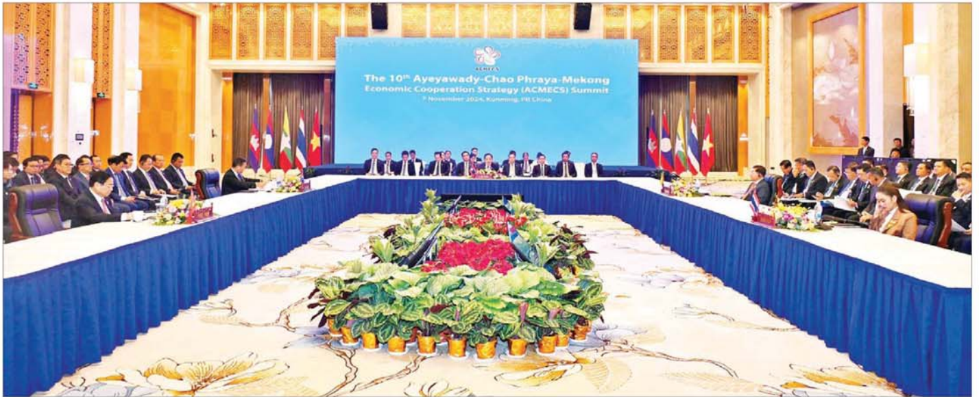
(၁၀)ကြိမ်မြောက် ဧရာဝတီ - ကျောက်ဖရား - မဲခေါင် စီးပွားရေးပူးပေါင်းဆောင်ရွက်မှု မဟာဗျူဟာ(အက်မက်စ်)ထိပ်သီးအစည်းအဝေး ကျင်းပစဉ်။