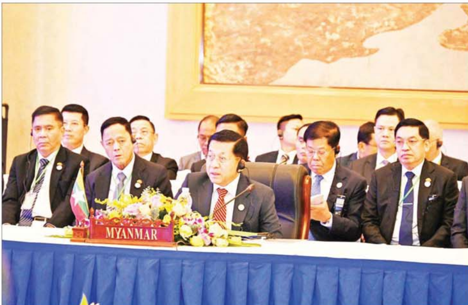
နိုင်ငံတော်စီမံအုပ်ချုပ်ရေးကောင်စီဥက္ကဋ္ဌ နိုင်ငံတော်ဝန်ကြီးချုပ် ဗိုလ်ချုပ်မှူးကြီးမင်းအောင်လှိုင် (၁၀)ကြိမ်မြောက် ဧရာဝတီ- ကျောက်ဖရား- မဲခေါင် စီးပွားရေးပူးပေါင်းဆောင်ရွက်မှု မဟာဗျူဟာ(အက်မက်စ်)ထိပ်သီးအစည်းအဝေးတွင် အမှာစကားပြောကြားစဉ်။

အဖွဲ့ဝင်မိန့်ခွန်း ပြောကြား ထို့နောက် (၁၀)ကြိမ်မြောက် ဧရာဝတီ-ကျောက်ဖရား-မဲခေါင် စီးပွားရေး ပူးပေါင်းဆောင်ရွက်မှု မဟာဗျူဟာ(အက်မက်စ်) ထိပ်သီး အစည်းအဝေးဥက္ကဋ္ဌ လာအိုနိုင်ငံ ဝန်ကြီးချုပ်က အဖွဲ့ဝင်မိန့်ခွန်းကို လည်းကောင်း၊ ကမ္ဘောဒီးယားနိုင်ငံ ဝန်ကြီးချုပ်က အမှာစကားကို လည်းကောင်း ပြောကြားကြသည်။ ယင်းနောက် နိုင်ငံတော် စီမံအုပ်ချုပ်ရေးကောင်စီ ဥက္ကဋ္ဌ နိုင်ငံတော်ဝန်ကြီးချုပ်က အမှာ စကား ပြောကြားရာတွင် ၂၀၁၃ ခုနှစ်က မြန်မာနိုင်ငံ ပုဂံမြို့တွင် အခြေတည်ခဲ့သည့် အက်မက်စ် ပူးပေါင်းဆောင်ရွက်မှုသည် ယခု ဆိုလျှင် ၂၁ နှစ် သက်တမ်းရှိခဲ့ပြီ