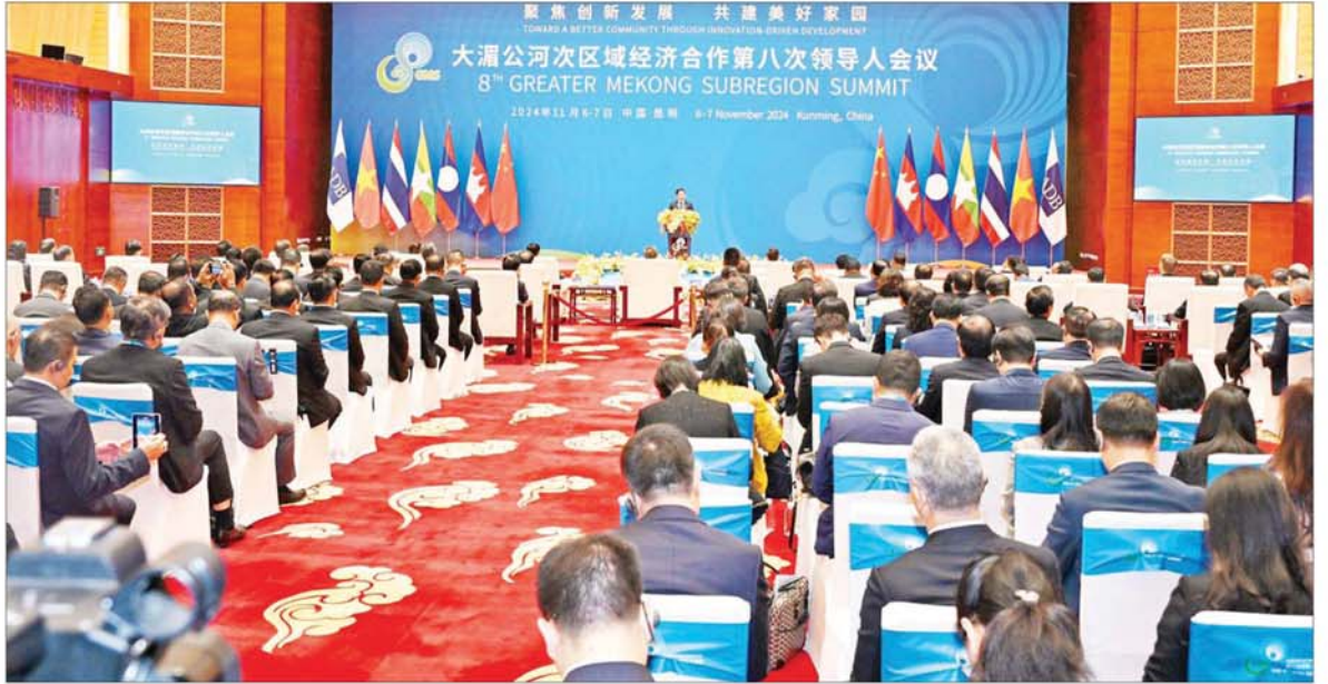
နိုင်ငံတော်စီမံအုပ်ချုပ်ရေးကောင်စီဥက္ကဋ္ဌ နိုင်ငံတော်ဝန်ကြီးချုပ် ဗိုလ်ချုပ်မှူးကြီးမင်းအောင်လှိုင် အဋ္ဌမအကြိမ် မဟာမဲခေါင်ဒေသခွဲ (ဂျီအမ်အက်စ်) ထိပ်သီးအစည်းအဝေးတွင် တက်ရောက် အမှာစကားပြောကြားစဉ်။

တက်ရောက် အစည်းအဝေးသို့ တရုတ် ပြည်သူ့သမ္မတနိုင်ငံ ဝန်ကြီးချုပ် H.E. Mr. Li Qiang၊ ကမ္ဘောဒီးယား ဘုရင့်နိုင်ငံဝန်ကြီးချုပ် H.E. Mr. Hun Manet၊ လာအိုပြည်သူ့ ဒီမိုကရက်တစ် သမ္မတနိုင်ငံ ဝန်ကြီးချုပ် H.E. Mr. Sonexay Siphandone၊ ထိုင်းနိုင်ငံဝန်ကြီး ချုပ် H.E. Ms. Paetongtarn Shinawatra၊ ဗီယက်နမ် ဆိုရှယ်လစ်သမ္မတနိုင်ငံ ဝန်ကြီး ချုပ် H.E. Mr. Pham Minh Chichi အာရှဖွံ့ဖြိုးရေးဘဏ် ဥက္ကဋ္ဌ Mr. Masatsugu Asakawa နှင့် မဟာမဲခေါင်ဒေသခွဲ နိုင်ငံများမှ ဝန်ကြီးများ၊ ဒုတိယဝန်ကြီးများ နှင့် အဆင့်မြင့်အရာရှိကြီးများ၊ တာဝန်ရှိသူများ တက်ရောက်ကြ သည်။ အဋ္ဌမအကြိမ် မဟာ