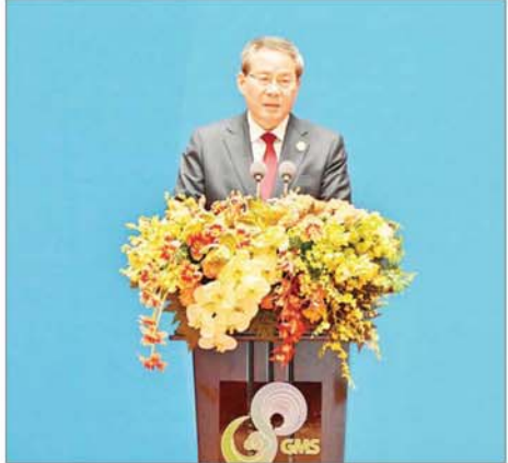
တရုတ်ပြည်သူ့သမ္မတနိုင်ငံ ဝန်ကြီးချုပ် H.E. Mr. Li Qiang က အဖွင့်အမှာစကားပြောကြားစဉ်။

ပေါင်းစည်းပြီး ဆောင်ရွက်မှသာ ပြည့်စုံမည် ဖြစ်ကြောင်း။ နိုင်ငံတစ်နိုင်ငံအတွက် ဆန်းသစ် တီထွင်မှုကို ဖော်ဆောင်ရာတွင် အုပ်ချုပ်မှုယန္တရားအဖြစ် လုပ်ငန်း အဖွဲ့၊ ဖိုရမ် စသည်ဖြင့် ဆောင်ရွက် မည့် အစီအမံများ စနစ်တကျရှိ ရန်လိုအပ်ကြောင်း၊ မြန်မာနိုင်ငံ တွင် အမျိုးသားသိပ္ပံ နည်းပညာ နှင့် ဆန်းသစ်တီထွင်မှုကောင်စီကို ဖွဲ့စည်းထားပြီး ဆန်းသစ်တီထွင်မှု ဆိုင်ရာလုပ်ငန်းများကို ဆောင်ရွက် လျက်ရှိကြောင်း။