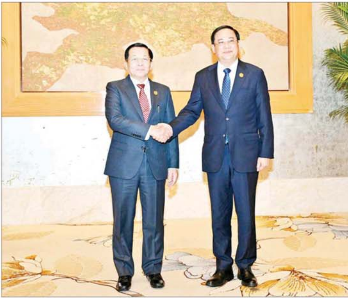
နိုင်ငံတော်စီမံအုပ်ချုပ်ရေးကောင်စီဥက္ကဋ္ဌ နိုင်ငံတော်ဝန်ကြီးချုပ် ဗိုလ်ချုပ်မှူးကြီးမင်းအောင်လှိုင် နှင့် လာအိုနိုင်ငံဝန်ကြီးချုပ် H.E. Mr. Sonexay Siphandone တို့ ရင်းရင်းနှီးနှီး နှုတ်ဆက်စဉ်။

ကုန်သွယ်မှုနှင့် ရင်းနှီးမြှုပ်နှံမှု ကဏ္ဍသည် အက်မက်စ်စီးပွားရေး အတွက် အဓိကမောင်းနှင်အား တစ်ခုဖြစ်ပြီး မိမိတို့နိုင်ငံများ၏ ပြည်တွင်းအသားတင် ထုတ်ကုန် (GDP)၊ ငွေကြေးဖောင်းပွမှုနှုန်း၊ စီးပွားရေးဖွံ့ဖြိုးတိုးတက်မှုနှုန်း၊ အလုပ်အကိုင်ရရှိမှုနှင့် လူမှုဘဝ ဆိုင်ရာအချက်အလက်များအပေါ် လွှမ်းမိုးမှုရှိကြောင်း၊ ကုန်သွယ်မှု နှင့် ရင်းနှီးမြှုပ်နှံမှုဆိုင်ရာ စည်းမျဉ်း စည်းကမ်းများကို ရိုးရှင်း၍ တိကျ ခိုင်မာစေခြင်းဖြင့် ဒေသတွင်း စီးပွားရေးနှင့် ပြည်သူ့လူထု၏ လူနေမှုအဆင့်အတန်းတို့အပေါ် သိသာထင်ရှားစွာ အကျိုးပြုစေ မည်ဖြစ်ကြောင်း။