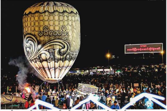
အတွက် အထောက်အကူဖြစ်စေ ရန်ရည်ရွယ်ချက်များဖြင့် ကျင်းပခြင်းဖြစ်ပြီး တောင်ကြီးမြို့ရှိ မဟာမိတ်အစည်းအဝေးအစီအစဉ် (၁၀)နှစ်ပြည့်မြောက်သည့် ၂၀၂၂ ခုနှစ်မှစတင်၍ သုံးနှစ်လျှင် တစ်ကြိမ် မဟာမိတ်အစည်းအဝေးအစီအစဉ်အဖြစ် လက်ခံကျင့်ပ လျက်ရှိရာ မြန်မာနိုင်ငံအနေဖြင့် စတုတ္ထအကြိမ် မဟာမိတ်အစည်းအဝေးအစည်းအဝေးကို ၂၀၁၁ ခုနှစ် ဒီဇင်ဘာ ၁၉ ရက်နှင့် ၂၀ ရက်တို့တွင် အိမ်ရှင်နိုင်ငံအဖြစ် နေပြည်တော်၌ လက်ခံကျင့်ပခဲ့ ကြောင်း၊ ထိပ်သီးအစည်းအဝေး များတွင် အနာဂတ်ကာလ ဒေသ ဟိုတယ်၊ တည်းခိုခန်းများတွင် ပွဲတော်လာရောက်သူများကြောင့် အခန်းလွတ်မရှိ ဖြစ်နေသည် ဟု ဆိုသည်။ (အပေါ်ပုံ) (မန္တလေးနေ့စဉ်-၉)

ပါဝင်မည့် မီးပုံးပျံအမျိုးအစားများမှာ ညမ်းကြီး(ယမ်းမီး) မီးပုံးပျံ ၂၆ ခု၊ စိန်နားပန်းမီးပုံးပျံ ၂၄ ခု၊ နေလွတ် (ခြေနှစ်ချောင်း) ၁၄၇ ခု၊ နေလွတ် (ခြေလေးချောင်း) ၃၈ ခု၊ အရပ်အုပ်စု ၂၃ ခု၊ စုစုပေါင်း ၂၅၈ ခု လွှတ်တင်မည်ဖြစ်ပြီး ပြိုင်ပွဲအမျိုးအစားအလိုက် ဆုများချီးမြှင့်မည်ဖြစ်သည်။ တန်ဆောင်တိုင်ပွဲတော်တွင် ဒေသအစားအစာများနှင့် ဒေသထွက်ကုန်များရောင်းချနိုင်ခြင်းနှင့် ခရီးသွားကဏ္ဍမြှင့်တင်ခြင်း