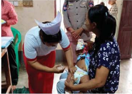
ကာကွယ်ဆေးထိုးနှံပေးရာ များကို ဘီစီဂျီ၊ ပြင်းထန်ဝမ်းပျက် တွင် အသက်(၂)လ ကလေးငယ် ဝမ်းလျှော၊ ပိုလီယို၊ ပြင်းထန်

သရက် နိုဝင်ဘာ ၇ မကွေးတိုင်းဒေသကြီး၊ သရက်မြို့၌ မွေးကင်းစမူ အသက်(၁)နှစ်ခွဲထိ ကလေးငယ်များကို ပုံမှန်ကာကွယ်ဆေးထိုးနှံပေးခြင်းကို နိုဝင်ဘာ ၆ရက် နံနက် ၉နာရီက ပြည်တော်အေးရပ်ကွက် ဆင်ဖြူတော်ဘုရား ဓမ္မာရုံတွင် မြို့ပေါ်(၈)ရပ်ကွက်ရှိ မွေးကင်းစမူ အသက်(၁)နှစ်ခွဲထိ ကလေးငယ်များကို ပုံမှန်ကာကွယ်ဆေးထိုးနှံပေးလျက်ရှိသည်။