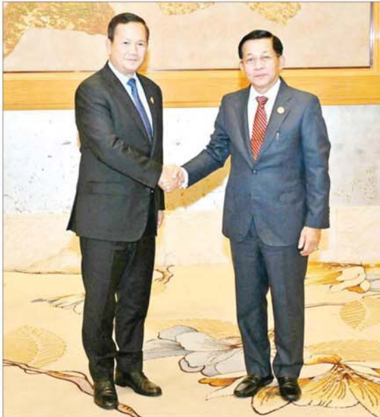
နိုင်ငံတော်စီမံအုပ်ချုပ်ရေးကောင်စီဥက္ကဋ္ဌ နိုင်ငံတော်ဝန်ကြီးချုပ် ဗိုလ်ချုပ်မှူးကြီး မင်းအောင်လှိုင်နှင့် ကမ္ဘောဒီးယားနိုင်ငံဝန်ကြီးချုပ် H.E. Mr. Hun Manet တို့ ရင်းရင်းနှီးနှီးနှုတ်ဆက်စဉ်။

နေပြည်တော် နိုဝင်ဘာ ၇ (၁၁) ကြိမ်မြောက် ကမ္ဘောဒီးယား-လာအို-မြန်မာ-ဗီယက်နမ် ပူးပေါင်းဆောင်ရွက်မှု (စီအယ်လ်အမ်ပီ) ထိပ်သီးအစည်းအဝေး (11 th Cambodia - Lao PDR - Myanmar - Vietnam (CLMV) Summit)ကို ယနေ့မနက်လွှဲပိုင်းတွင် တရုတ်ပြည်သူ့သမ္မတနိုင်ငံ ကူမင်းမြို့ရှိ Wyndham Grand Hotel ၌ ကျင်းပရာ ထိပ်သီးအစည်းအဝေးဥက္ကဋ္ဌ နိုင်ငံတော်စီမံအုပ်ချုပ်ရေးကောင်စီဥက္ကဋ္ဌ နိုင်ငံတော်ဝန်ကြီးချုပ် ဗိုလ်ချုပ်မှူးကြီး မင်းအောင်လှိုင် တက်ရောက်အမှာစကားပြောကြားသည်။ အစည်းအဝေးသို့ အဖွဲ့ဝင်နိုင်ငံများမှ ဝန်ကြီးချုပ်များဖြစ်ကြသည့် ကမ္ဘောဒီးယားနိုင်ငံဝန်ကြီးချုပ် H.E. Mr. Hun Manet၊ လာအိုနိုင်ငံဝန်ကြီးချုပ် H.E. Mr. Sonexay Siphandone၊ ဗီယက်နမ်နိုင်ငံဝန်ကြီးချုပ် H.E. Mr. Pham Minh Chich၊ အာဆီယံအတွင်းရေးမှူးချုပ် H.E. Dr. KAO KIM HOURN၊ အဖွဲ့ဝင်နိုင်ငံများမှ ဝန်ကြီးများ၊ ဒုတိယဝန်ကြီးများနှင့် အဆင့်မြင့်အရာရှိကြီးများ၊ တာဝန်ရှိသူများ တက်ရောက်ကြသည်။ ဦးစွာ (၁၁) ကြိမ်မြောက် ကမ္ဘောဒီးယား-လာအို-မြန်မာ-ဗီယက်နမ်ပူးပေါင်းဆောင်ရွက်မှု(စီအယ်လ်အမ်ပီ) ထိပ်သီးအစည်းအဝေးဥက္ကဋ္ဌ နိုင်ငံတော်စီမံအုပ်ချုပ်ရေးကောင်စီဥက္ကဋ္ဌ နိုင်ငံတော်ဝန်ကြီးချုပ် ဗိုလ်ချုပ်မှူးကြီး မင်းအောင်လှိုင်သည် ထိပ်သီးအစည်းအဝေးသို့ တက်ရောက်ရန် ရောက်ရှိလာကြသည့် အဖွဲ့ဝင်နိုင်ငံများမှ ဝန်ကြီးချုပ်များနှင့် အဖွဲ့ဝင်များကို ကြိုဆိုနှုတ်ဆက်ပြီး စုပေါင်းမှတ်တမ်းတင်ဓာတ်ပုံရိုက်ကြသည်။