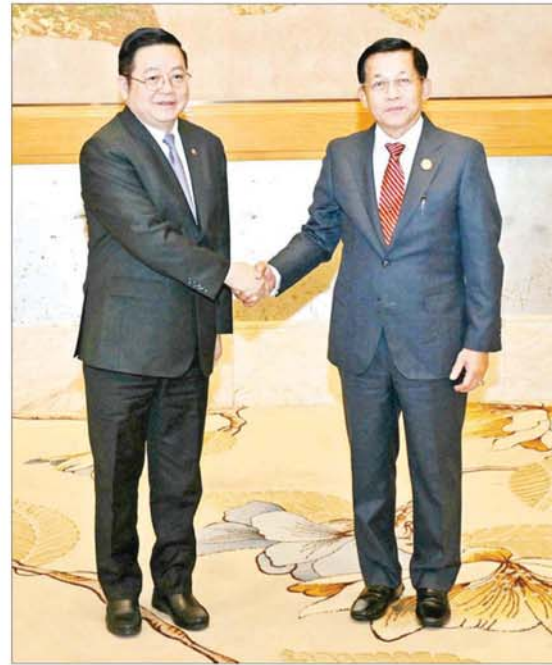
နိုင်ငံတော်စီမံအုပ်ချုပ်ရေးကောင်စီဥက္ကဋ္ဌ နိုင်ငံတော်ဝန်ကြီးချုပ် ဗိုလ်ချုပ်မှူးကြီး မင်းအောင်လှိုင်နှင့် အာဆီယံအတွင်းရေးမှူးချုပ် H.E. Dr. KAO KIM HOURN တို့ ရင်းရင်းနှီးနှီးနှုတ်ဆက်စဉ်။

ဆက်မှုများနှင့် အထူးစီးပွားရေးဇုန်များမှ တစ်ဆင့် စက်မှုနည်းပညာဆိုင်ရာအခြေခံအဆောက်အအုံများနှင့် စက်မှုအဆောက်အအုံများကို တည်ဆောက်၊ အဆင့်မြှင့်တင်ပေးရန် လိုအပ်ကြောင်း။