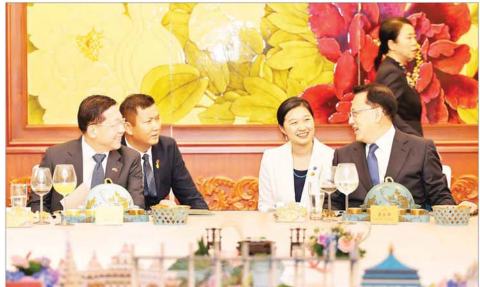
နိုင်ငံတော်စီမံအုပ်ချုပ်ရေး ကောင်စီဥက္ကဋ္ဌ နိုင်ငံတော် ဝန်ကြီးချုပ် ဗိုလ်ချုပ်မှူးကြီး မင်းအောင်လှိုင်နှင့် တရုတ်ပြည်သူ့ သမ္မတနိုင်ငံ တရုတ်ကွန်မြူနစ် ပါတီ ဗဟိုကော်မတီအဖွဲ့ဝင် ချုံချင်မြို့နီစီပယ်ပါတီကော်မတီ အတွင်းရေးမှူး Mr. Yuan Jiajun တို့ ရင်းရင်းနှီးနှီး နှုတ်ဆက်စဉ်။ နိုင်ငံတော်စီမံအုပ်ချုပ်ရေး ကောင်စီဥက္ကဋ္ဌ နိုင်ငံတော် ဝန်ကြီးချုပ် ဗိုလ်ချုပ်မှူးကြီး မင်းအောင်လှိုင် တရုတ်ပြည်သူ့ သမ္မတနိုင်ငံ တရုတ်ကွန်မြူနစ် ပါတီ ဗဟိုကော်မတီအဖွဲ့ဝင် ချုံချင်မြို့နီစီပယ်ပါတီကော်မတီ အတွင်းရေးမှူး Mr. Yuan Jiajun က တည်ခင်းစဉ်ခံသည့် ညစာ ကို အတူတကွသုံးဆောင်စဉ်။