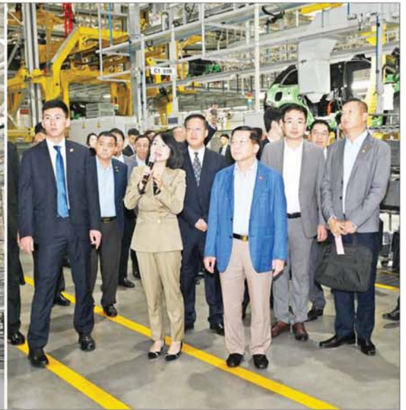
နိုင်ငံတော်စီမံအုပ်ချုပ်ရေးကောင်စီဥက္ကဋ္ဌ နိုင်ငံတော်ဝန်ကြီးချုပ် ဗိုလ်ချုပ်မှူးကြီးမင်းအောင်လှိုင် SERES မော်တော်ကားကုမ္ပဏီ၏ စက်ရုံအတွင်း ကားထုတ်လုပ်နေမှုအဆင့်ဆင့်ကို ကြည့်ရှုလေ့လာစဉ်။

၀ ရှေ့မှ ဆောင်ရွက်ချက် ပြည်တွင်း ပြည်ပမှ ချီးမြှင့်ခြင်း