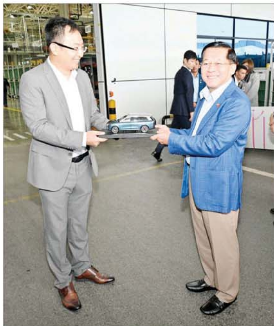
နိုင်ငံတော်စီမံအုပ်ချုပ်ရေးကောင်စီဥက္ကဋ္ဌ နိုင်ငံတော်ဝန်ကြီးချုပ် ဗိုလ်ချုပ်မှူးကြီး မင်းအောင်လှိုင်အား SERES မော်တော်ကားကုမ္ပဏီမှ Chairman ဖြစ်သူ Mr. Li Bo က ကုမ္ပဏီမှထုတ်လုပ်ထားသည့် မော်တော်ကားပုံစံငယ်ကို ဂါရဝပြပေးအပ်စဉ်။