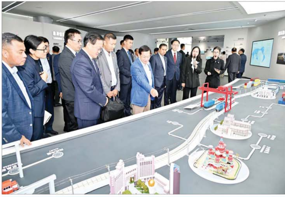
နိုင်ငံတော်စီမံအုပ်ချုပ်ရေးကောင်စီဥက္ကဋ္ဌ နိုင်ငံတော်ဝန်ကြီးချုပ် ဗိုလ်ချုပ်မှူးကြီးမင်းအောင်လှိုင် Chongqing International Logistics Hub Park တွင် ကြည့်ရှုလေ့လာစဉ်။

SERES မော်တော်ကားကုမ္ပဏီ ဆက်လက်ပြီး နိုင်ငံတော်စီမံ အုပ်ချုပ်ရေးကောင်စီဥက္ကဋ္ဌ နိုင်ငံ တော်ဝန်ကြီးချုပ်နှင့် အဖွဲ့ဝင် များသည် SERES မော်တော်ကား ကုမ္ပဏီသို့ သွားရောက်လေ့လာ ကြရာ ကုမ္ပဏီမှ Chairman ဖြစ်သူ Mr. Li Bo နှင့် တာဝန်ရှိ သူများက ကြိုဆိုနှုတ်ဆက်ကြ သည်။