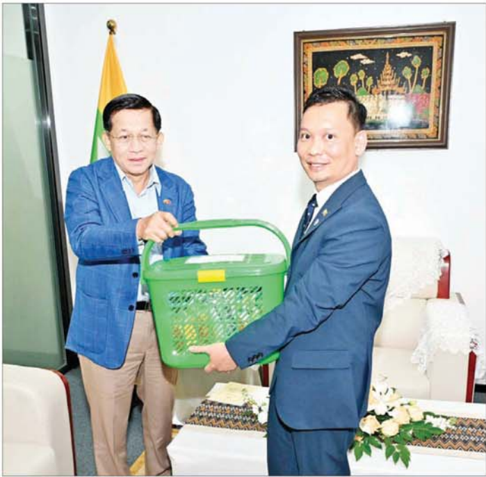
နိုင်ငံတော်စီမံအုပ်ချုပ်ရေးကောင်စီဥက္ကဋ္ဌ နိုင်ငံတော်ဝန်ကြီးချုပ် ဗိုလ်ချုပ်မှူးကြီးမင်းအောင်လှိုင် ကောင်စီဝန်ချုပ်ရုံး ဝန်ထမ်းမိသားစုများနှင့် ပညာတော်သင် သင်တန်းသားများအတွက် လက်ဆောင် ပစ္စည်းများနှင့် ချီးမြှင့်ထောက်ပံ့ငွေများ ပေးအပ်စဉ်။

နှစ်နိုင်ငံအကြား အကျိုးတူ စီးပွားရေးလုပ်ငန်းများ၊ ပို့ကုန် သွင်းကုန်လုပ်ငန်းများ၊ ရင်းနှီး မြှုပ်နှံမှုလုပ်ငန်းများ ဆောင်ရွက် နိုင်ရန် အခွင့်အလမ်းများ ဖော်ဆောင်ပေးနိုင်ရမည် ဖြစ်ကြောင်း၊ ထိုသို့ဆောင်ရွက်နိုင်ပါက ကူးလူးဆက်ဆံမှုများ ပိုမို တိုးတက်လာမည်ဖြစ်ပြီး နှစ်နိုင်ငံ ပြည်သူများအတွက် အကျိုးစီးပွား ကို ဖြစ်ပေါ်စေနိုင်မည်ဖြစ်သကဲ့သို့ နိုင်ငံစီးပွားရေးကိုလည်း မြှင့်တင်နိုင်မည် ဖြစ်ကြောင်း၊ ထို့ပြင် နိုင်ငံတစ်နိုင်ငံ၊ ဒေသတစ်ခု ဖွံ့ဖြိုးတိုးတက်မှု၏ အခြေခံ အုတ်မြစ်သည် လူသားအရင်း အမြစ်များ အများအပြားပေးထုတ် ပေးနိုင်ခြင်းပင် ဖြစ်သည်အတွက် ပညာရေးဖြင့်တင်မှု အခန်းကဏ္ဍ အတွက်လည်း သံတမန်ဝန်ထမ်း များအနေဖြင့် ဖော်ဆောင်ပေး ကြရမည်ဖြစ်ကြောင်း၊ တာဝန် များကို ထမ်းဆောင်ရာတွင် မိမိကိုယ်ကို ထိန်းထိန်းသိမ်းသိမ်း နေထိုင်ခြင်း၊ လုပ်ငန်းတာဝန် များကို ကျေပွန်အောင် ဆောင် ရွက်ခြင်း၊ ဆက်ဆံရေးကောင်းမွန် ခြင်းတို့ဖြင့် မိမိတို့နိုင်ငံ၏ ဂုဏ် ကိုလည်း မြှင့်တင်ဆောင်ရွက်သွား ရန်လိုကြောင်း၊ မြန်မာ-တရုတ် ချစ်ကြည်ရေးနှင့် ကူးသန်း ရောင်းဝယ်ရေးတွင် အဓိက အထောက်အကူပြုသည့် နေရာ တစ်ခုအဖြစ် ရောက်ရှိအောင် ဆောင်ရွက်ပြီး နိုင်ငံဂုဏ်ကို မြှင့်တင်ပိုင်စေကြောင်း မှာကြား