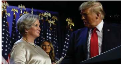
သတင်းဌာနက ဖော်ပြသည်။ ဝါရှင်တန်နယ် အိမ်ဖြူတော်ညွှန်ကြားရေးမှူးချုပ်အဖြစ် ခန့်အပ်မည်ဟု ဒေါ်နယ်လ်ထရပ်က နိုဝင်ဘာ ၇ ရက်တွင် ထုတ်ဖော်အတည်ပြုလိုက်ကြောင်း စီအင်နီအေ

ဝါရှင်တန် နိုဝင်ဘာ ၈ ၂၀၂၄ ခုနှစ် အမေရိကန် သမ္မတရွေးကောက်ပွဲ၌ မိမိအနိုင် ရအောင် မဲဆန္ဒနယ်များလုပ်ငန်းစဉ်အဆင့်ဆင့်ကို စီမံခန့်ခွဲပေးခဲ့သူ အသက် ၆၇ နှစ်အရွယ် ဝါရှင်တန်နယ် အိမ်ဖြူတော်ညွှန်ကြားရေးမှူးချုပ်အဖြစ် ခန့်အပ်မည်ဟု ဒေါ်နယ်လ်ထရပ်က နိုဝင်ဘာ ၇ ရက်တွင် ထုတ်ဖော်အတည်ပြုလိုက်ကြောင်း စီအင်နီအေ