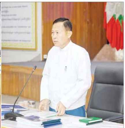
နိုင်ငံတော်စီမံအုပ်ချုပ်ရေးကောင်စီ ဒုတိယဥက္ကဋ္ဌ ဒုတိယဝန်ကြီးချုပ် ဒုတိယဗိုလ်ချုပ်မှူးကြီးစိုးဝင်း အမျိုးသားသဘာဝဘေးအန္တရာယ်ဆိုင်ရာစီမံခန့်ခွဲမှုကော်မတီ လုပ်ငန်းညှိနှိုင်းအစည်းအဝေးတွင် အမှာစကားပြောကြားစဉ်။