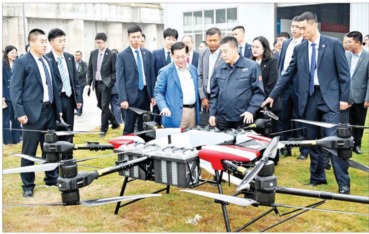
နိုင်ငံတော်စီမံအုပ်ချုပ်ရေးကောင်စီဥက္ကဋ္ဌ နိုင်ငံတော်ဝန်ကြီးချုပ် ဗိုလ်ချုပ်မှူးကြီးမင်းအောင်လှိုင် Zhongyue Aviation UAV Firefighting-Drone Co.,Ltd. မှ ထုတ်လုပ်ထားသော လူမှုကယ်ဆယ်ရေးလုပ်ငန်းများတွင် အသုံးပြုသည့် အဆင့်မြင့်ဒရုန်းများ ခင်းကျင်းပြသထားရှိမှုကို ကြည့်ရှုလေ့လာစဉ်။

နေပြည်တော် နိုဝင်ဘာ ၈ တရုတ်ပြည်သူ့သမ္မတနိုင်ငံသို့ ရောက်ရှိနေသည့် နိုင်ငံတော်စီမံအုပ်ချုပ်ရေးကောင်စီ ဥက္ကဋ္ဌ နိုင်ငံတော်ဝန်ကြီးချုပ် ဗိုလ်ချုပ်မှူးကြီးမင်းအောင်လှိုင် ဦးဆောင်သည့် မြန်မာအဆင့်မြင့်ကိုယ်စားလှယ်အဖွဲ့သည် ယနေ့တွင် ချုံချင့်မြို့ရှိ စက်ရုံ၊ အလုပ်ရုံများသို့ သွားရောက်လေ့လာသည်။ Zhongyue Aviation UAV Firefighting-Drone Co.,Ltd. ဦးစွာ နိုင်ငံတော်စီမံအုပ်ချုပ်ရေးကောင်စီဥက္ကဋ္ဌ နိုင်ငံတော်ဝန်ကြီးချုပ်နှင့် အဖွဲ့ဝင်များသည် Zhongyue Aviation UAV Firefighting-Drone Co.,Ltd. သို့ ရောက်ရှိကြရာ ကုမ္ပဏီမှ Founder & Chairman ဖြစ်သူ Mr. CAO, Bingနှင့် တာဝန်ရှိသူများက ကြိုဆိုနှုတ်ဆက်ကြသည်။ ထို့နောက် ကုမ္ပဏီပြခန်းအတွင်း ကုမ္ပဏီ၏ သမိုင်းအကျဉ်းနှင့် နှစ်အလိုက် ဖွံ့ဖြိုးတိုးတက်မှုများ၊ သုတေသန ပြုလုပ်ဆောင်ရွက်ခဲ့မှုများနှင့် လူသားအကျိုးပြုစာမျက်နှာ ၃ သို့ ၀