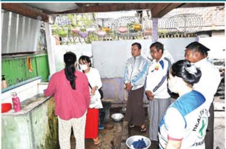
မန္တလေး နိုဝင်ဘာ ၈ မန္တလေးတိုင်းဒေသကြီး၊ သာစံမြို့နယ်၊ ပြည်ကြီးရန်လုံ