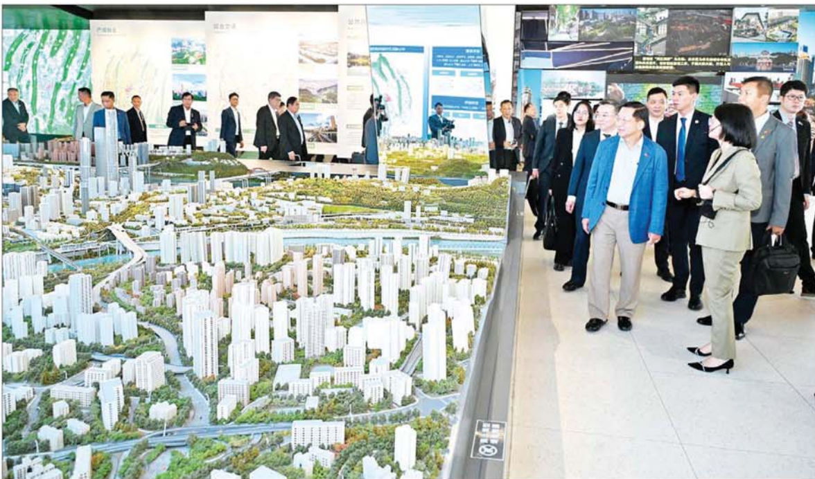
နိုင်ငံတော်စီမံအုပ်ချုပ်ရေးကောင်စီဥက္ကဋ္ဌ နိုင်ငံတော်ဝန်ကြီးချုပ် ဗိုလ်ချုပ်မှူးကြီးမင်းအောင်လှိုင် Chongqing Planning Exhibition ပြတိုက်တွင် မြို့ပြပုံစံငယ်များ ပြသထားရှိမှုကို ကြည့်ရှုလေ့လာစဉ်။

ဆက်လက်၍ မွန်းလွဲပိုင်းတွင် နိုင်ငံတော်စီမံအုပ်ချုပ်ရေးကောင်စီဥက္ကဋ္ဌ နိုင်ငံတော်ဝန်ကြီးချုပ်နှင့် အဖွဲ့ဝင်များသည် Weima လယ်ယာစက်မှုထုတ်ကုန် ကုမ္ပဏီသို့ သွားရောက်လေ့လာကြရာ ဥက္ကဋ္ဌဖြစ်သူ Mr. Yan Hua နှင့် တာဝန်ရှိသူများက ကြိုဆို