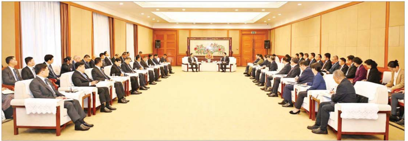
နိုင်ငံတော်စီမံအုပ်ချုပ်ရေးကောင်စီဥက္ကဋ္ဌ နိုင်ငံတော်ဝန်ကြီးချုပ် ဗိုလ်ချုပ်မှူးကြီးမင်းအောင်လှိုင် တရုတ်ပြည်သူ့သမ္မတနိုင်ငံ တရုတ်ကွန်မြူနစ်ပါတီ ဗဟိုကော်မတီအဖွဲ့ဝင် ချုံချင်မြို့နီစီပယ်ပါတီကော်မတီ အတွင်းရေးမှူး Mr. Yuan Jiajun နှင့် တွေ့ဆုံဆွေးနွေးစဉ်။