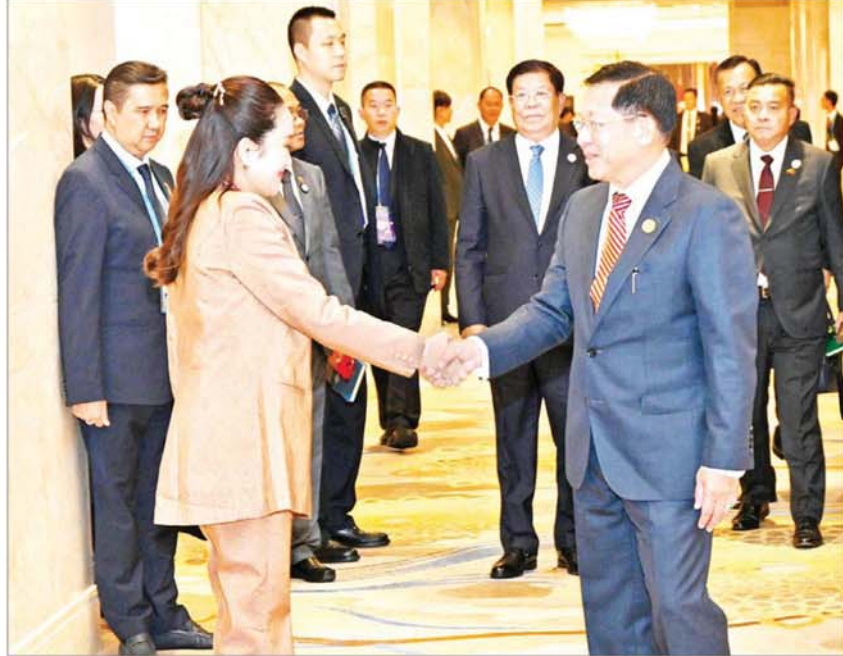
နိုင်ငံတော်စီမံအုပ်ချုပ်ရေးကောင်စီဥက္ကဋ္ဌ နိုင်ငံတော်ဝန်ကြီးချုပ် ဗိုလ်ချုပ်မှူးကြီး မင်းအောင်လှိုင်နှင့် ထိုင်းနိုင်ငံဝန်ကြီးချုပ် H.E. Ms. Paetongtarn Shinawatra တို့ ရင်းရင်းနှီးနှီးနှုတ်ဆက်စဉ်။