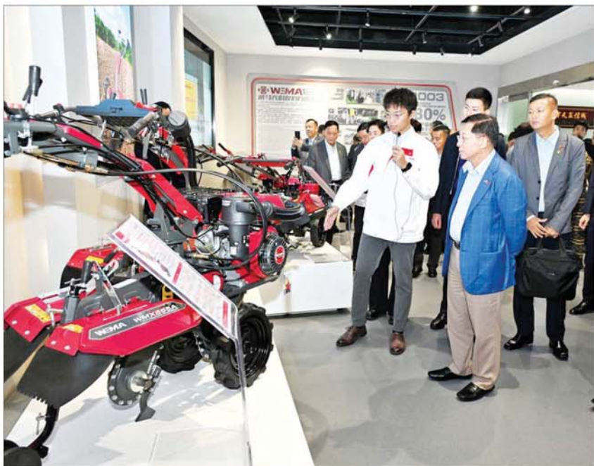
နိုင်ငံတော်စီမံအုပ်ချုပ်ရေးကောင်စီဥက္ကဋ္ဌ နိုင်ငံတော်ဝန်ကြီးချုပ် ဗိုလ်ချုပ်မှူးကြီးမင်းအောင်လှိုင် Weima လယ်ယာစက်မှု ထုတ်ကုန်ကုမ္ပဏီမှ ထုတ်လုပ်ထားသည့် စက်ပစ္စည်းများ ခင်းကျင်းပြသထားမှုကို ကြည့်ရှုလေ့လာစဉ်။