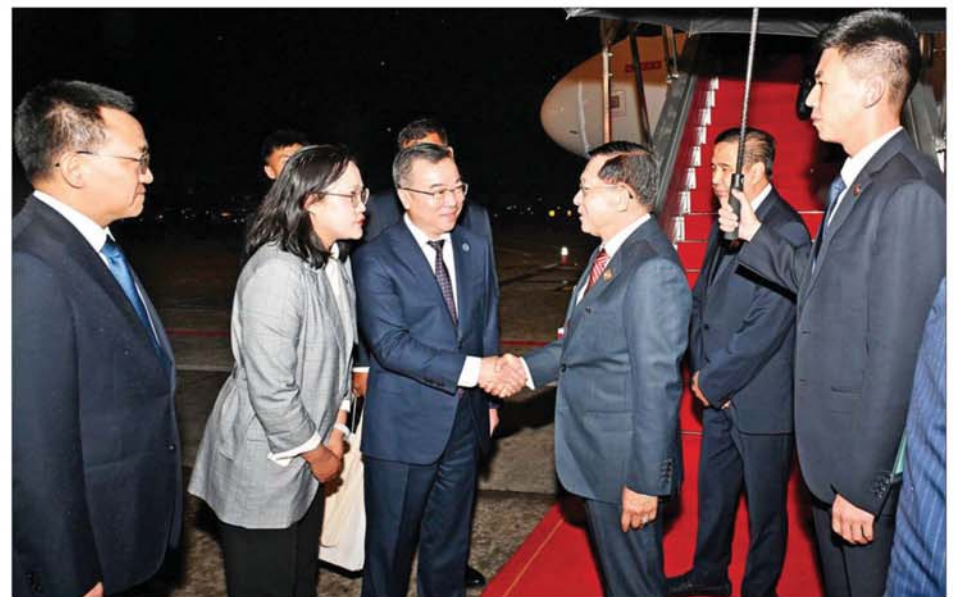
နိုင်ငံတော်စီမံအုပ်ချုပ်ရေးကောင်စီဥက္ကဋ္ဌ နိုင်ငံတော်ဝန်ကြီးချုပ် ဗိုလ်ချုပ်မှူးကြီးမင်းအောင်လှိုင်အား ချုံချင်မြို့ ဒုတိယမြို့တော်ဝန် Mr. Shang Kui နှင့်အဖွဲ့ဝင်များ၊ ချုံချင်မြို့ရှိ မြန်မာကောင်စစ်ဝန်ချုပ်ရုံးမှ ကောင်စစ်ဝန်ချုပ် ဦးကျော်ဇေယျာလင်းနှင့် တာဝန်ရှိသူများက ချုံချင်မြို့ ကျန်းပေအပြည်ပြည်ဆိုင်ရာလေဆိပ်၌ လိုက်လံနွေးထွေးစွာ ကြိုဆိုနှုတ်ဆက်ကြစဉ်။

များသည် ညပိုင်းတွင် ချုံချင်မြို့ ကျန်းပေ အပြည်ပြည်ဆိုင်ရာ လေဆိပ်သို့ ရောက်ရှိကြရာ ချုံချင်မြို့ ဒုတိယမြို့တော်ဝန် Mr. Shang Kui နှင့် အဖွဲ့ဝင်များ၊ ချုံချင်မြို့ရှိ မြန်မာ ကောင်စစ်ဝန်ချုပ်ရုံးမှ ကောင်စစ်ဝန်ချုပ်ဦးကျော်ဇေယျာလင်းနှင့် တာဝန်ရှိသူများက ပန်းစည်းကမ်း၍ လိုက်လံ နွေးထွေးစွာ ကြိုဆိုနှုတ်ဆက်ကြသည်။