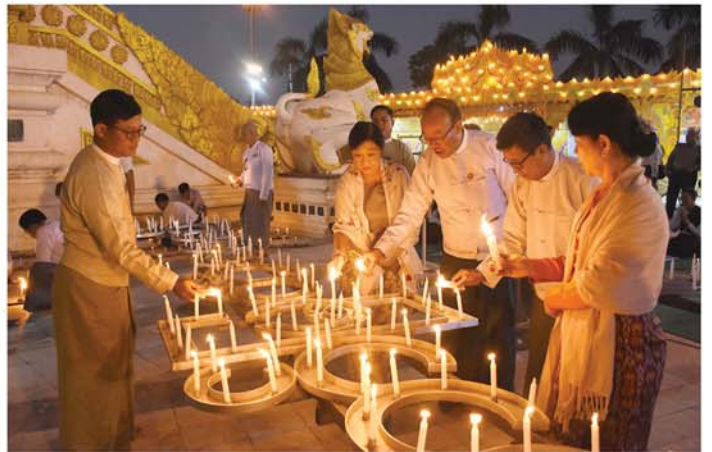
မန္တလေး ဒီဇင်ဘာ ၃

အမရပူရခရိုင် အမရပူရမြို့နယ်ရှိ မဟာဓမ္မပရိသတ်တော်မြတ် ၌ တည်ထားကိုးကွယ်အပ်သော ရတနာပုဏ္ဏဝရဒါဌာဓာတုစေတီယ စွယ်တော်မြတ်စေတီတော်(မန္တလေး)၏ (၂၉)ကြိမ်မြောက် ဗုဒ္ဓပူဇော်ပွဲတော်နှင့် ရွှေကြာသင်္ကန်းရက်လုပ်ပူဇော်ပွဲ ဖွင့်ပွဲအခမ်းအနားကို ယနေ့ညနေပိုင်းက စွယ်တော်မြတ်စေတီတော်ရှင်ပြင်တွင် ကျင်းပရာ မန္တလေးတိုင်းဒေသကြီးတရားလွှတ်တော် တရားသူကြီးချုပ် ဒေါ်ခင်သင်းဝေ၊ တိုင်းဒေသကြီးအစိုးရအဖွဲ့ဝင်ဝန်ကြီးများနှင့် တာဝန်ရှိသူများ၊ ရက်ကန်းပညာရှင်များ၊ စက်ချုပ်ပညာရှင်များ၊