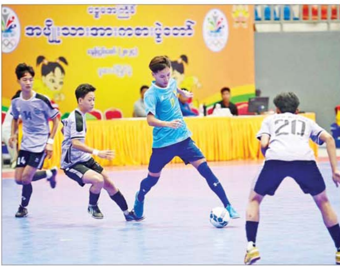
ပုမအကြိမ် အမျိုးသားအားကစားပွဲတော် ပြည်နယ်နှင့်တိုင်းဒေသကြီး အမျိုးသားဖူဆယ်ပြိုင်ပွဲ တွင် စစ်ကိုင်းတိုင်းဒေသကြီးအသင်းနှင့် မကွေးတိုင်းဒေသကြီးအသင်းတို့ ယှဉ်ပြိုင်ကစားကြစဉ်။

ယနေ့ကျင်းပသည့် အားကစား ပြိုင်ပွဲများသို့ ဌာနဆိုင်ရာများ၊ အားကစားနည်းအလိုက်အဖွဲ့ချုပ် များမှ တာဝန်ရှိသူများ၊ ဝန်ထမ်း များ၊ ကျောင်းသား ကျောင်းသူများ နှင့် အားကစားဝါသနာရှင် ပြည်သူ များ စိတ်ပါဝင်စားစွာ လာရောက် ကြည့်ရှုအားပေးခဲ့ကြသည်။ ပုမအကြိမ် အမျိုးသား အားကစားပွဲတော်တွင် ထည့်သွင်း ကျင်းပသည့် ဝန်ကြီးဌာနအဆင့် အားကစားနည်း ခြောက်မျိုးတွင် ပြေးခုန်ပစ် (အမျိုးသား/ အမျိုး သမီး)၊ ဘောလုံး(အမျိုးသား)၊ ဖူဆယ်(အမျိုးသား)၊ ဂေါက်သီး (အမျိုးသား)၊ ဝိုက်ကျော်ခြင်း (အမျိုးသား)နှင့် ဘော်လီဘော (အမျိုးသား)ပြိုင်ပွဲများ၊ ပြည်နယ် နှင့် တိုင်းဒေသကြီးအဆင့် အားကစားနည်း ၂၃ မျိုးတွင် ပြေးခုန်ပစ် (အမျိုးသား/ အမျိုး သမီး)၊ တစ်စကက်ဘော (အမျိုး သား)၊ ကြက်တောင် (အမျိုးသား/ အမျိုးသမီး)၊ ဘီလီယက်/ စနူကာ (အမျိုးသား)၊ လက်ဝှေ့(အမျိုးသား)၊ ကာယဗလနှင့် ကာယကြံ့ခိုင်မှု (အမျိုးသား/ အမျိုးသမီး)၊ ခရစ်ကက် (အမျိုးသား)၊ ဘောလုံး