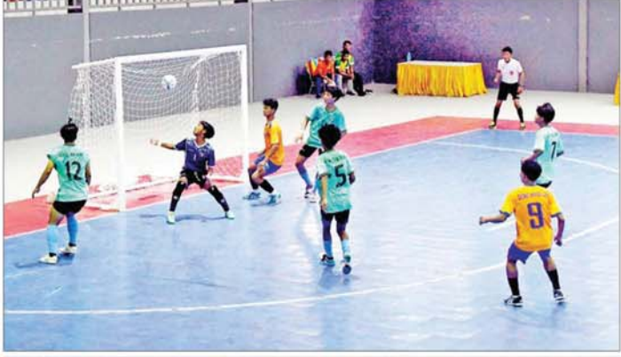
ပဉ္စမအကြိမ် အမျိုးသားအားကစားပွဲတော် ပြည်နယ်နှင့် တိုင်းဒေသကြီး အမျိုးသားဖူဆယ်ပြိုင်ပွဲတွင် ကချင်ပြည်နယ်အသင်းနှင့် ကယားပြည်နယ်အသင်းတို့ ယှဉ်ပြိုင်ကစားကြစဉ်။

အလားတူ ပြည်နယ်နှင့်တိုင်းဒေသကြီး အသက် ၂၁ နှစ်အောက် အမျိုးသားဘောလုံးပြိုင်ပွဲများကို ဝဏ္ဏသိဒ္ဓိအားကစားကွင်း၊ လေ့ကျင့်ရေးကွင်း(၃)/(၄) တို့တွင် ယှဉ်ပြိုင်ကစားကြရာ ပြည်ထောင်စုနယ်မြေ နေပြည်တော်အသင်းနှင့် ရှမ်းပြည်နယ်အသင်းတို့က စာမျက်နှာ ၁၀ သို့ ။