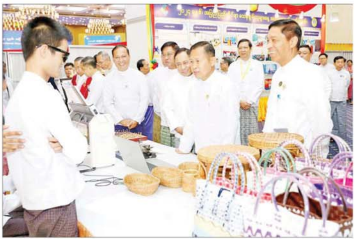
နိုင်ငံတော်စီမံအုပ်ချုပ်ရေးကောင်စီ ဒုတိယဥက္ကဋ္ဌ ဒုတိယဝန်ကြီးချုပ် ဒုတိယဗိုလ်ချုပ်မှူးကြီး စိုးဝင်း ၂၀၂၄ ခုနှစ် အပြည်ပြည်ဆိုင်ရာမသန်စွမ်းသူများနေ့ အထိမ်းအမှတ်ပြခန်းများကို ကြည့်ရှုလေ့လာစဉ်။

မသန်စွမ်းသူများ၏ ဘဝတွင် ရင်ဆိုင်ကြုံတွေ့ရသည့် အခက်အခဲအတားအဆီးများ၊ တန်းတူညီမျှ ရရှိပိုင်ခွင့်များ၊ ပူးပေါင်းဆောင်ရွက်မှုစသည့် စိန်ခေါ်မှုများကို လူသားအားလုံးက လက်တွေ့ကျအောင် ပြေရှင်းဆောင်ရွက်ပေးကြရန်လိုကြောင်း၊ လူလူချင်း တူသော်လည်း ဘဝကြံ့မာအကျိုးပေးကြောင်း ရုပ်ပိုင်းဆိုင်ရာ၊ စိတ်ပိုင်းဆိုင်ရာ ချို့ယွင်းအားနည်းနေသူများကို စာနာထောက်ထားပေးမကူညီပြီး မသန်သော်လည်း စွမ်းဆောင်ရည် ပြည့်ဝသည့် လောကအကျိုးကို သယ်ပိုးနိုင်သည့် လူသားတစ်ဦး ဖြစ်လာအောင် ကူညီအားပေးကြရန် လိုအပ်ကြောင်း။ ထို့ကြောင့် အားလုံးအကျိုးစင်ပိုင်နိုင်ပြီး ရေရှည်ဖွံ့ဖြိုးတိုးတက်သည့် လူ့အဖွဲ့အစည်းကို