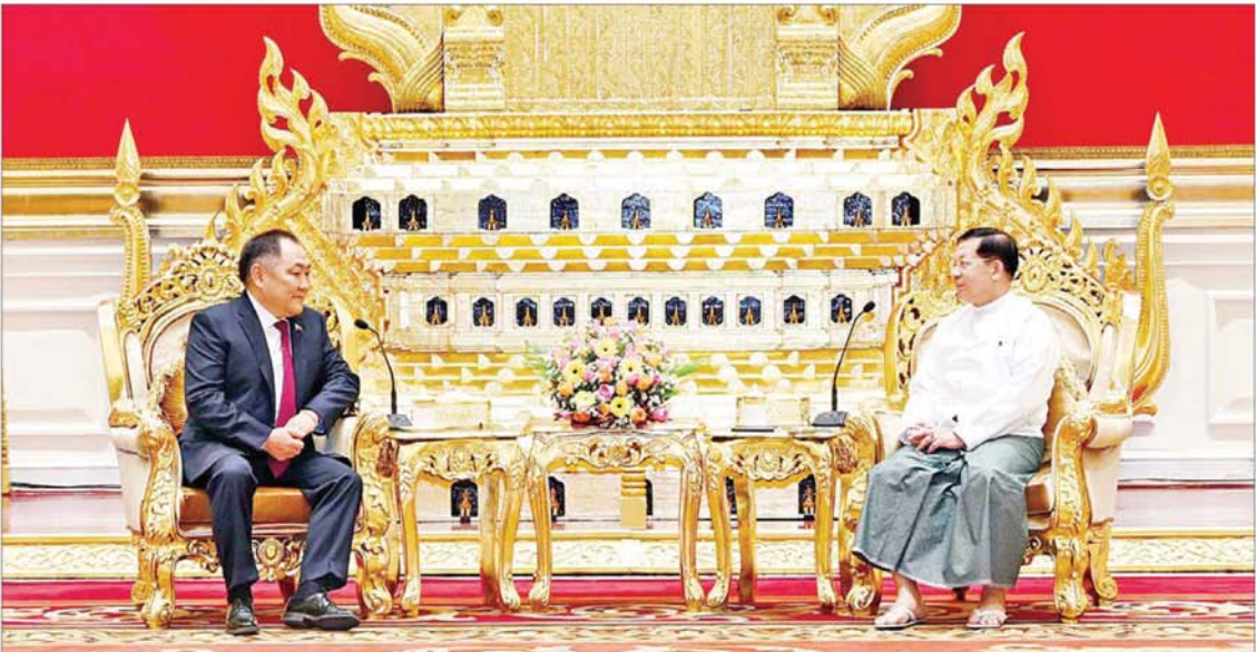
နိုင်ငံတော်စီမံအုပ်ချုပ်ရေးကောင်စီဥက္ကဋ္ဌ နိုင်ငံတော်ဝန်ကြီးချုပ် ဗိုလ်ချုပ်မှူးကြီး မင်းအောင်လှိုင် ရုရှားဖက်ဒရေးရှင်းနိုင်ငံ ဒူးမားလွတ်တော် ဒုတိယဥက္ကဋ္ဌ H. E. Mr. Sholban Kara-Ool အား လက်ခံတွေ့ဆုံပွဲ။

အမြင်ချင်းဖလှယ်ဆွေးနွေး တိုသို့ တွေ့ဆုံရာတွင် နှစ်နိုင်ငံအကြား ရှေးယခင်ကတည်းက ရင်းနှီးသည့်ဆက်ဆံ မှုများရှိခဲ့ပြီး ယခုအခါ ချစ်ကြည်ရင်းနှီး မှုနှင့် ပူးပေါင်းဆောင်ရွက်မှုများ ပိုမို တိုးတက်ကောင်းမွန်လျက်ရှိမှု အခြေ အနေများ၊ နှစ်နိုင်ငံအဆင့်မြင့် အရာရှိကြီး များ ချစ်ကြည်ရေးခရီး အပြန်အလှန် သွားရောက်လျက်ရှိမှု အခြေအနေများ၊ မြန်မာနိုင်ငံ၏ နိုင်ငံရေးဖြစ်ပေါ်ပြောင်းလဲ မှုများအပေါ် နိုင်ငံတကာမျက်နှာစာတွင် ရုရှားနိုင်ငံအနေဖြင့် ခိုင်ခိုင်မာမာရပ်တည် လေးလျက်ရှိမှုနှင့် မြန်မာနိုင်ငံအနေဖြင့် ပေးသည့် ရုရှားနိုင်ငံ၏ နိုင်ငံရေး ဖြစ်ပေါ် ပြောင်းလဲမှုများအပေါ် ခိုင်ခိုင်မာမာ ရပ်တည်ပေးလျက်ရှိမှု အခြေအနေများ၊