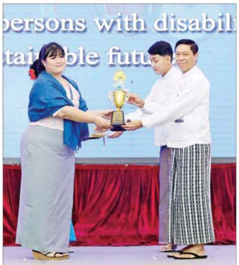
ပြည်ထောင်စုဝန်ကြီး ဒေါက်တာစိုးဝင်း အလုပ်အကိုင်အခွင့်အလမ်း ဂုဏ်ပြုဆုရရှိသူတစ်ဦးအား ဂုဏ်ပြုဆုတံဆိပ် ပေးအပ်ချီးမြှင့်စဉ်။