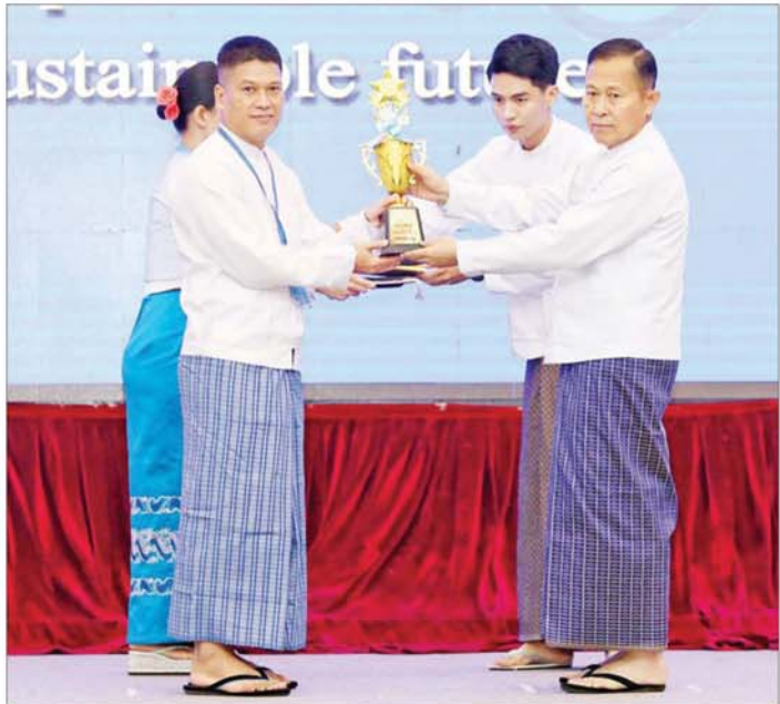
နိုင်ငံတော်စီမံအုပ်ချုပ်ရေးကောင်စီ ဒုတိယဥက္ကဋ္ဌ ဒုတိယဝန်ကြီးချုပ် ဒုတိယဗိုလ်ချုပ်မှူးကြီး စိုးဝင်း ၂၀၂၄ ခုနှစ် အပြည်ပြည်ဆိုင်ရာမသန်စွမ်းသူများနေ့ အထိမ်းအမှတ် အလှူတန်းဆောင်းပါးပြိုင်ပွဲတွင် ဆုရရှိသူတစ်ဦးအား ဂုဏ်ပြုဆုတံဆိပ် ပေးအပ်ချီးမြှင့်စဉ်။

မူဝါဒနှင့်လုပ်ငန်းစဉ်များ ချမှတ်ဆောင်ရွက်ပေးလျက်ရှိပြီး လုပ်ငန်းစဉ်များ အကောင်အထည်ဖော်ဆောင်ရွက်နိုင်ရန်အတွက် မသန်စွမ်းသူများ၏ အခွင့်အရေးများဆိုင်ရာ လုပ်ငန်းကော်မတီကို ဖွဲ့စည်းထားရှိပြီး ဆောင်ရွက်လျက်ရှိကြောင်း။ မသန်စွမ်းသူများ၏ စွမ်းဆောင်ရည်မြှင့်တင်ပေးရေး ဆောင်ရွက်ရာတွင် ပညာရေးကဏ္ဍကို ဦးစားပေး မြှင့်တင်ပေးရမည်ဖြစ်ကြောင်း၊ မိမိတို့နိုင်ငံတွင် ၂၀၁၆ ခုနှစ် လေ့လာဆန်းစစ်ချက်များအရ မသန်စွမ်းသူ ကလေး ၁၃၀၀ နှစ်သိန်းသုံးသောင်းခန့် ရှိပြီး အဆိုပါအထက်ကလေးသုံးဦးတွင် နှစ်ဦးသည် ကျောင်းမတက်ကြဘဲ ၃၆ ရာခိုင်နှုန်းခန့်သာ စာရေးစာဖတ်နိုင်ကြောင်း သိရကြောင်း၊ ထို့ကြောင့် အနာဂတ်တွင် မသန်စွမ်းသူများအတွက် ပညာရေးကို ပိုမိုအလေးထား ဆောင်ရွက်သွားကြရမည်ဖြစ်ကြောင်း၊ မသန်စွမ်းသူများအနေဖြင့် အခြေခံပညာကျောင်းများတွင် တက်ရောက်နိုင်ရန် ဆောင်ရွက်ပေးခြင်း၊ စာမျက်နှာ ၇ သို့ ❖