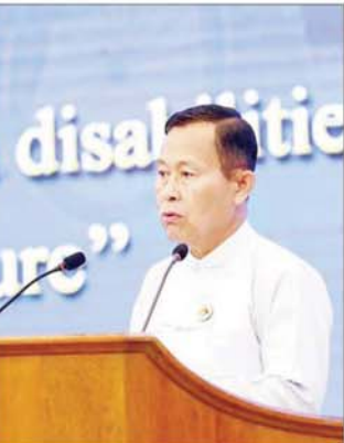
နိုင်ငံတော်စီမံအုပ်ချုပ်ရေးကောင်စီ ဒုတိယဥက္ကဋ္ဌ ဒုတိယဝန်ကြီးချုပ် ဒုတိယဗိုလ်ချုပ်မှူးကြီး စိုးဝင်း ၂၀၂၄ ခုနှစ် အပြည်ပြည်ဆိုင်ရာ မသန်စွမ်းသူများနေ့ အထိမ်းအမှတ်အခမ်း အနားသို့ တက်ရောက် အမှာစကားပြောကြားစဉ်။