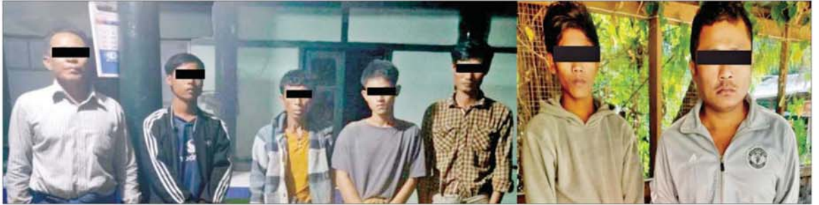
မန္တလေးတိုင်းဒေသကြီး ရမည်းသင်းမြို့နယ် မိုးထိမိုးမိဒေသရှိ သပြေပင်ကျေးရွာအနီး၌ တရားမဝင်ရွှေတူးဖော်လုပ်ကိုင်နေသူများအား ဖမ်းဆီးရမိမှု မှတ်တမ်းဓာတ်ပုံ။

နေပြည်တော် ၃ ဇူလိုင် ၂၀၂၄ - မန္တလေးတိုင်းဒေသကြီး ရမည်းသင်းမြို့နယ် မိုးထိမိုးမိဒေသ၌ တရားမဝင် ရွှေတူးဖော်လုပ်ကိုင်မှုများကြောင့် နိုင်ငံတော်၏အခွန်ဘဏ္ဍာငွေဆုံးရှုံးခြင်းနှင့် သဘာဝပတ်ဝန်းကျင်ထိခိုက်ပျက်စီးခြင်းများဖြစ်ပေါ်စေကာ ငင်းဒေသအနီးကျေးရွာများရှိ ဒေသခံပြည်သူများမှာ ရေကြီးရေလျှံခြင်း၊ မိုးသည်းထန်စွာ ရွာသွန်းမှုကြောင့် တောင်ကျရေများနှင့်အတူ မြေမြိုခြင်းစသည့်သဘာဝဘေးအန္တရာယ်များကို ရင်ဆိုင်ကြုံတွေ့နေရကြောင်း ဒေသခံပြည်သူများ၏ သတင်းပေးပို့တိုင်ကြားချက်များအရ လုံခြုံရေးတပ်ဖွဲ့ဝင်များပါဝင်သော ပူးပေါင်းအဖွဲ့က အဆိုပါ တရားမဝင်ရွှေတူးဖော်လုပ်ကိုင်နေသူများအား ဖော်ထုတ်ဖမ်းဆီးရေးအဖွဲ့ဖြင့် ဖမ်းဆီးဆောင်ရွက်ခဲ့ကြသည်။