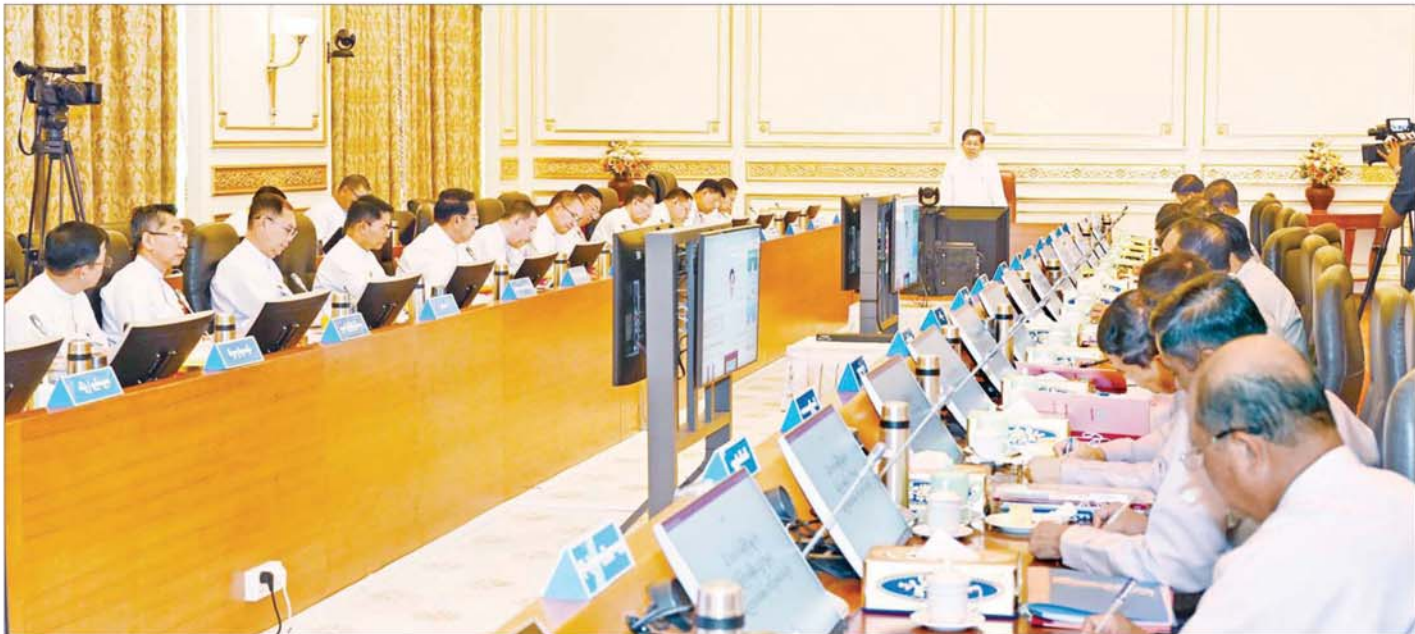
နိုင်ငံတော်စီမံအုပ်ချုပ်ရေးကောင်စီဥက္ကဋ္ဌ နိုင်ငံတော်ဝန်ကြီးချုပ် ဗိုလ်ချုပ်မှူးကြီးမင်းအောင်လှိုင် ပြည်ထောင်စုအစိုးရအဖွဲ့ အစည်းအဝေးတွင် အမှာစကားပြောကြားစဉ်။

စီးပွားရေးနှင့်ပတ်သက်၍ အသား၊ ငါးနှင့် အခြေခံစားကုန် ကုန်ဈေးနှုန်းများ ကြီးမြင့်လာမှုများ ဖြစ်ပေါ်လျက်ရှိ အခြေခံစားကုန်များနှင့် ပတ်သက်၍ သင့်တင့်လျောက်ပတ်သည့် အမြတ်ကိုသာတင်၍ ရောင်းချသွားရန်လို အမြတ်ငွေနည်းနည်းနှင့် ပမာဏများများ ရောင်းချနိုင်ခြင်းဖြင့် ပြည်သူ့လူထု သက်သာချောင်ချိမှုရှိအောင် ဆောင်ရွက်