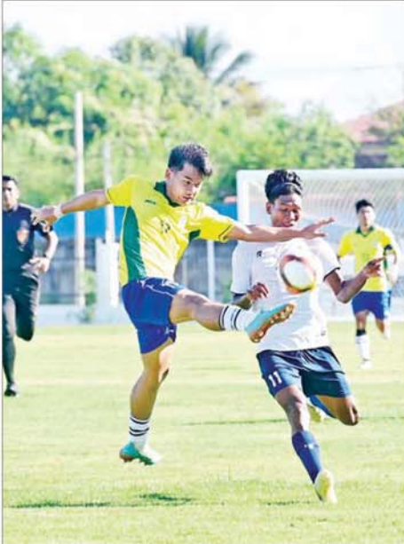
ပုမအကြိမ် အမျိုးသားအားကစားပွဲတော် ဝန်ကြီးဌာနပေါင်းစုံ အလွတ်တန်း အမျိုးသားဘောလုံးပြိုင်ပွဲတွင် လူမှုဝန်ထမ်း၊ ကယ်ဆယ်ရေးနှင့် ပြန်လည်နေရာချထားရေးဝန်ကြီးဌာနအသင်းနှင့် ပို့ဆောင်ရေးနှင့် ဆက်သွယ်ရေးဝန်ကြီးဌာနအသင်းတို့ ယှဉ်ပြိုင် ကစားကြစဉ်။

(အမျိုးသား/ အမျိုးသမီး)၊ ဖူဆယ် (အမျိုးသား/ အမျိုးသမီး)၊ ဂေါက်သီး (အမျိုးသား)၊ ဂျူဒို (အမျိုးသား/ အမျိုးသမီး)၊ ကရာ တေး (အမျိုးသား/ အမျိုးသမီး)၊ ဝိုက်ကျော်ခြင်း (အမျိုးသား/ အမျိုးသမီး)၊ ရေကူး (အမျိုးသား/ အမျိုးသမီး)၊ စားပွဲတင်တင်းနှစ် (အမျိုးသား/ အမျိုးသမီး)၊ တိုက်ကွပ်ခို (အမျိုးသား/ အမျိုး သမီး)၊ တင်းနှစ် (အမျိုးသား)၊ ရိုးရာ ခြင်းလုံး (အမျိုးသား/ အမျိုးသမီး)၊ မြန်မာ့သိုင်း (အမျိုးသား/ အမျိုး သမီး)၊ ဘော်လီဘော (အမျိုးသား/ အမျိုးသမီး)၊ ဗိုလီနစ် (အမျိုးသား/ အမျိုးသမီး)၊ အလေးမ (အမျိုးသား/ အမျိုးသမီး)၊ ဝုရှူး (အမျိုးသား/ အမျိုးသမီး)ပြိုင်ပွဲများ၊ မသန်စွမ်း အားကစားနည်း လေးမျိုးတွင် ပြေးခုန်ပစ် (အမျိုးသား/ အမျိုး သမီး)၊ ရေကူး (အမျိုးသား/ အမျိုး သမီး)၊ ထိုင်လျက်ဘော်လီဘော နှင့် မျက်မမြင်စစ်တူရင် (အမျိုး သား/ အမျိုးသမီး) ပြိုင်ပွဲများကို ထည့်သွင်းကျင်းပလျက်ရှိသည်။ ပြည်နယ်နှင့် တိုင်းဒေသကြီး