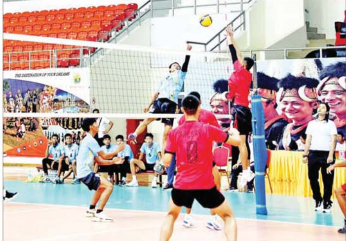
ပဉ္စမအကြိမ် အမျိုးသားအားကစားပွဲတော် ပြည်နယ်နှင့် တိုင်းဒေသကြီး အမျိုးသားဘော်လီဘော ပြိုင်ပွဲတွင် ချင်းပြည်နယ်အသင်းနှင့် ပဲခူးတိုင်းဒေသကြီးအသင်းတို့ ယှဉ်ပြိုင်ကစားကြစဉ်။