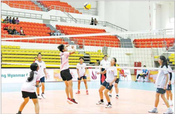
ပဉ္စမအကြိမ် အမျိုးသားအားကစားပွဲတော် ပြည်နယ်နှင့် တိုင်းဒေသကြီး အမျိုးသမီးဘော်လီဘော ပြိုင်ပွဲတွင် ပြည်ထောင်စုနယ်မြေ နေပြည်တော်အသင်းနှင့် ရှမ်းပြည်နယ်အသင်းတို့ ယှဉ်ပြိုင်ကစားကြစဉ်။