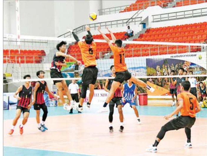
ပုမအကြိမ်အမျိုးသားအားကစားပွဲတော် ပြည်နယ်နှင့်တိုင်းဒေသကြီး အမျိုးသားဘော်လီဘောပြိုင်ပွဲ တွင် စရာဂဝတီတိုင်းဒေသကြီးအသင်းနှင့် ကချင်ပြည်နယ်အသင်းတို့ ယှဉ်ပြိုင်ကစားကြစဉ်။