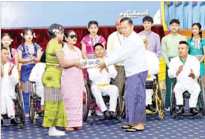
နိုင်ငံတော်စီမံအုပ်ချုပ်ရေးကောင်စီ ဒုတိယဥက္ကဋ္ဌ ဒုတိယဝန်ကြီးချုပ် ဒုတိယဗိုလ်ချုပ်မှူးကြီးစိုးဝင်း ၂၀၂၄ ခုနှစ် အပြည်ပြည်ဆိုင်ရာ မသန်စွမ်းသူများနေ့ အထိမ်းအမှတ်အခမ်းအနားတွင် ဖျော်ဖြေတင်ဆက်ခဲ့သူများအား ဂုဏ်ပြုချီးမြှင့်ပေးခြင်းပေးအပ်စဉ်။

မသန်စွမ်းသူများသည် အများနည်းတူ ရာနှုန်းပြည့်ကျန်းမာ သန်စွမ်းမှုမရှိသော်လည်း ၎င်းတို့၏ ကောင်းမွန်ပြီး ကျန်းမာ သန်စွမ်းသော ခန္ဓာကိုယ်အစိတ်အပိုင်းနှင့်ကိုက်ညီသည့် လုပ်ရားဆောင်ရွက်နိုင်မည့် ကဏ္ဍအလိုက် ပါဝင်လုပ်ဆောင်နိုင်ရန် စီမံဆောင်ရွက်ပေးကြရမည် ဖြစ်ကြောင်း၊ ထိုသို့ စီမံဆောင်ရွက်ပေးမည်ဆိုပါက မသန်စွမ်းသူများ၏ စိတ်အား