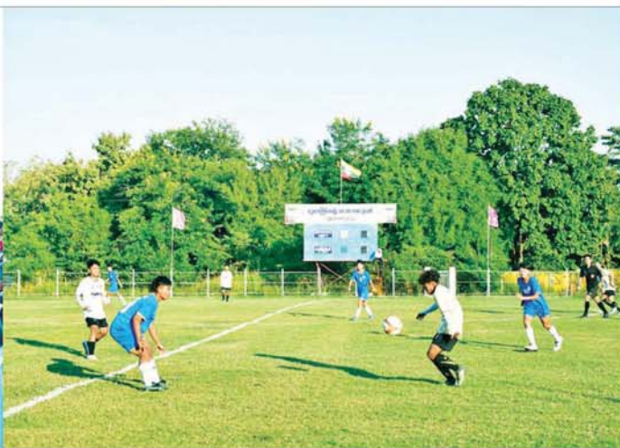
ပုမအကြိမ် အမျိုးသားအားကစားပွဲတော် ပြည်နယ်နှင့်တိုင်းဒေသကြီး အသက် ၂၅ နှစ်အောက် အမျိုးသမီးဘောလုံးပြိုင်ပွဲတွင် ပြည်ထောင်စုနယ်မြေ နေပြည်တော်အသင်းနှင့် ကချင်ပြည်နယ်အသင်းတို့ ယှဉ်ပြိုင်နေမှုကို အားကစားပရိသတ်များ တစ်ခဲနက်အားပေးနေကြစဉ်။