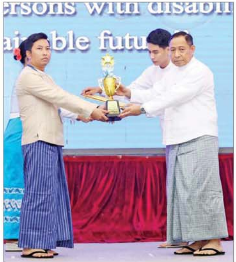
နိုင်ငံတော်စီမံအုပ်ချုပ်ရေးကောင်စီအဖွဲ့ဝင် ဒုတိယဗိုလ်ချုပ်ကြီး ရာပြည့် မသန်စွမ်းသူများအတွက် အတားအဆီးမဲ့ခရီးသွားလာရေး ဂုဏ်ပြုဆုရရှိသူတစ်ဦးအား ဂုဏ်ပြုဆုတံဆိပ် ပေးအပ်ချီးမြှင့်စဉ်။