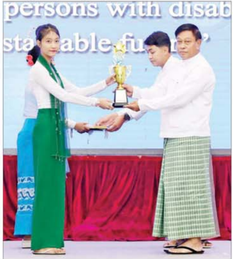
နိုင်ငံတော်စီမံအုပ်ချုပ်ရေးကောင်စီအဖွဲ့ဝင် ဗိုလ်ချုပ်ကြီး တင်အောင်စန်း အခြေခံပညာအထက်တန်းအဆင့် စာစီစာကုံးပြိုင်ပွဲတွင် ဆုရရှိသူတစ်ဦးအား ဂုဏ်ပြုဆုတံဆိပ် ပေးအပ်ချီးမြှင့်စဉ်။