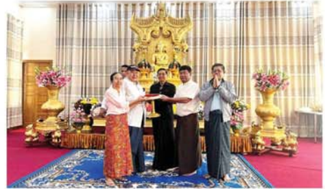
မီးတော်ပူဇော်ရန်၊ ငွေပဒေသာပင် စိုက်ထူရန် အလှူငွေလှူဒါန်းလို သော အလှူရှင်များအနေဖြင့် KBZBank ငွေစာရင်းအမှတ် ၀၈၇၃၀၂၀၆၀၀၄၄၉၀၁၀ နှင့် UAB ဘဏ် ငွေစာရင်းအမှတ် ၀၁၇၃၀၀၀၀၁၂၅၉ နှင့် နိုင်ငံ