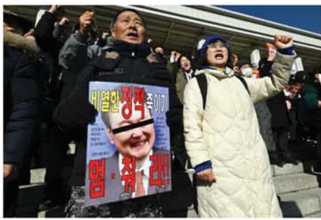
အတိုက်အခံ နိုင်ငံရေးအင်အားစုများက ပြင်းထန်စွာ ဝေဖန်ကန့်ကွက်ကြသဖြင့် အဆိုပါ

ဆိုးလ် ဒီဇင်ဘာ ၄ တောင်ကိုရီးယားသမ္မတ ယွန်းဆွတ်ယူးလ် ရာထူးမှ နုတ်ထွက်ပေးရန် အတိုက်အခံနိုင်ငံရေးအင်အားစုများ ပူးပေါင်းပီအီးပေးလျက်ရှိကြောင်း စီအင်န်အေ သတင်းဌာနက ဖော်ပြသည်။ ၎င်းကို မလိုလားသူများ ဆိုးလ်မြို့တော်၌ လမ်းပေါ်ထွက်ပြီး စုဝေးတောင်းဆိုဆန္ဒပြခဲ့သည်ကို ထိန်းချုပ်ရန် ဒီဇင်ဘာ ၃ ရက်က စစ်ဥပဒေထုတ်ပြန်ကြေညာခဲ့သည်။