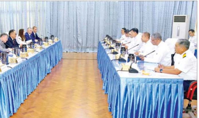
ရုရှားဖက်ဒရေးရှင်းနိုင်ငံ သံအမတ်ကြီးနှင့် တာဝန်ရှိသူများ တက်ရောက် ဝန်ကြီးများ၊ အမြဲတမ်းအတွင်းဝန်နှင့် ဌာနအကြီးအကဲများ၊ ရုရှား ကြသည်။ သတင်းစဉ်