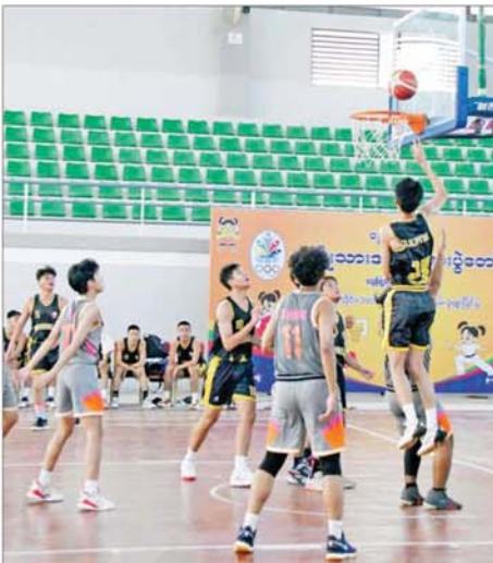
ပုမအကြိမ် အမျိုးသားအားကစားပွဲတော် ပြည်နယ်နှင့် တိုင်း ဒေသကြီး အမျိုးသားဘော်လီဘောဖြိုင်ပွဲတွင် မန္တလေးတိုင်း ဒေသကြီးအသင်းနှင့် နေပြည်တော်အသင်းတို့ ယှဉ်ပြိုင်ကစားကြစဉ်။

တိုင်းဒေသကြီး အသင်းက တနင်္သာရီတိုင်းဒေသကြီး အသင်း ကို ရမှတ် (၇၉-၃၂) မှတ်ဖြင့်လည်း ကောင်း၊ ပဲခူးတိုင်းဒေသကြီး အသင်းက ဧရာဝတီတိုင်းဒေသ ကြီးအသင်းကို ရမှတ်(၉၆-၆၆) မှတ်ဖြင့်လည်းကောင်း၊ ရှမ်းပြည် နယ်အသင်းက ကယားပြည်နယ် အသင်းကို ရမှတ် (၇၀-၃၄) မှတ် ဖြင့်လည်းကောင်း၊ ကချင်ပြည် နယ်အသင်းက မကွေးတိုင်းဒေသ ကြီးအသင်းကို ရမှတ် (၇၇-၆) မှတ်ဖြင့်လည်းကောင်း အနိုင်ရရှိ ခဲ့ကြသည်။ ပြည်နယ်နှင့် တိုင်းဒေသကြီး ဖူဆယ်ဖြိုင်ပွဲ ပွဲစဉ်များကို ဝဏ္ဏ သိဒ္ဓိအားကစားကွင်း၊ ဖူဆယ် အားကစားရုံ၌ ကျင်းပရာ အမျိုးသား ဖူဆယ်ဘောလုံးဖြိုင်ပွဲတွင် ရခိုင် ပြည်နယ်အသင်းက ကရင်ပြည် နယ်အသင်းကို လေးဂိုး - နှစ်ဂိုး၊ မကွေးတိုင်းဒေသကြီး အသင်းက မွန်ပြည်နယ်အသင်းကို နှစ်ဂိုး - ဂိုးမရှိ၊ ရှမ်းပြည်နယ်အသင်းက စစ်ကိုင်းတိုင်းဒေသကြီးအသင်းကို ငါးဂိုး-တစ်ဂိုး၊ မန္တလေးတိုင်းဒေသ ကြီးအသင်းက ကယားပြည်နယ် အသင်းကို ခြောက်ဂိုး - ဂိုးမရှိ၊ ကချင်ပြည်နယ်အသင်းက ချင်း ပြည်နယ်အသင်းကို ၁၀ ဂိုး-တစ်ဂိုး၊ ရန်ကုန်တိုင်းဒေသကြီး အသင်းက ပဲခူးတိုင်းဒေသကြီး အသင်းကို နှစ်ဂိုး- ဂိုးမရှိဖြင့် လည်းကောင်း၊ အမျိုးသမီးဖူဆယ်ဘောလုံးဖြိုင်ပွဲ တွင် ရန်ကုန်တိုင်းဒေသကြီး အသင်းက ကချင်ပြည်နယ်အသင်း ကို တစ်ဂိုး- ဂိုးမရှိ၊ မွန်ပြည်နယ် အသင်းက ကရင်ပြည်နယ်အသင်း ကို သုံးဂိုး- ဂိုးမရှိ၊ ပြည်ထောင်စု နယ်မြေ နေပြည်တော်အသင်းက ပဲခူးတိုင်းဒေသကြီး အသင်းကို ငါးဂိုး- တစ်ဂိုးဖြင့် လည်းကောင်း အနိုင်ရရှိခဲ့ကြသည်။ စာမျက်နှာ ၁၃ သို့ ❖