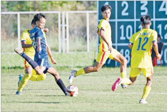
ပဉ္စမအကြိမ် အမျိုးသားအားကစားပွဲတော် ပြည်နယ်နှင့် တိုင်းဒေသကြီး အမျိုးသားဘောလုံးပြိုင်ပွဲတွင် မွန်ပြည်နယ်အသင်းနှင့် ချင်းပြည်နယ်အသင်းတို့ ယှဉ်ပြိုင်ကစားကြစဉ်။

ပြည်နယ်နှင့် တိုင်းဒေသကြီးအသက် ၂၀ နှစ်အောက် ဘော်လီဘောပြိုင်ပွဲများကို ဝဏ္ဏသိဒ္ဓိအားကစားကွင်း(B)ရုံ၌ ကျင်းပရာ အမျိုးသား ဘော်လီဘောပြိုင်ပွဲတွင် ကယားပြည်နယ်အသင်းက မကွေးတိုင်းဒေသကြီးအသင်းကို သုံးပွဲ နှစ်ပွဲ၊ ပြည်ထောင်စုနယ်မြေ နေပြည်တော်အသင်းက ရန်ကုန်တိုင်းဒေသကြီး အသင်းကို သုံးပွဲ နှစ်ပွဲ၊ မန္တလေးတိုင်းဒေသကြီးအသင်းက မွန်ပြည်နယ်အသင်းကို သုံးပွဲပြတ်ဖြင့်လည်းကောင်း၊ အမျိုးသမီးဘော်လီဘောပြိုင်ပွဲတွင် ရန်ကုန်တိုင်းဒေသကြီးအသင်းက ဧရာဝတီတိုင်းဒေသကြီးအသင်းကို သုံးပွဲပြတ်၊ စစ်ကိုင်းတိုင်းဒေသကြီးအသင်းက ကရင်ပြည်နယ်အသင်းကို သုံးပွဲ နှစ်ပွဲဖြင့်လည်းကောင်း၊ အနိုင်ရရှိခဲ့ကြသည်။ အမျိုးသားဘောလုံးပြိုင်ပွဲများ ပြည်နယ်နှင့် တိုင်းဒေသကြီးအသက် ၂၀ နှစ်အောက် အမျိုးသားဘောလုံးပြိုင်ပွဲများကို ဝဏ္ဏသိဒ္ဓိအားကစားကွင်း လေ့ကျင့်ရေးကွင်း(၃)/၄) တို့တွင် ယှဉ်ပြိုင်