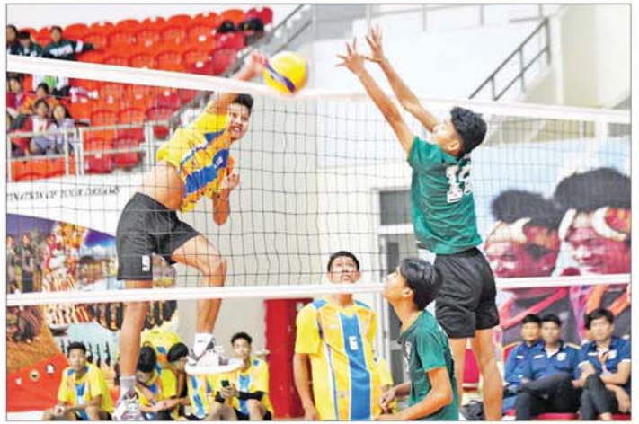
ပဉ္စမအကြိမ် အမျိုးသားအားကစားပွဲတော် ပြည်နယ်နှင့် တိုင်းဒေသကြီး အမျိုးသား ဘော်လီဘောပြိုင်ပွဲတွင် မန္တလေးတိုင်းဒေသကြီးအသင်းနှင့် မွန်ပြည်နယ်အသင်းတို့ ယှဉ်ပြိုင်ကစားကြစဉ်။