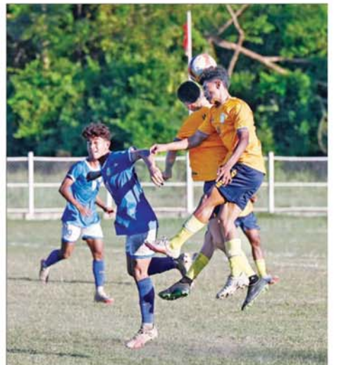
ပုမအကြိမ် အမျိုးသားအားကစားပွဲတော် ပြည်နယ်နှင့် တိုင်း ဒေသကြီး အမျိုးသားဘောလုံးဖြိုင်ပွဲတွင် ရန်ကုန်တိုင်းဒေသကြီး အသင်းနှင့် မကွေးတိုင်းဒေသကြီးအသင်းတို့ ယှဉ်ပြိုင်ကစားကြစဉ်။