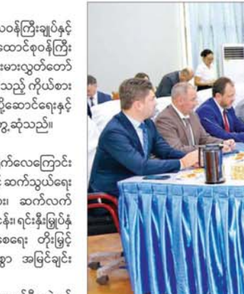
တွေ့ဆုံပွဲသို့ ပို့ဆောင်ရေးနှင့် ဆက်သွယ်ရေးဝန်ကြီးဌာန ဒုတိယ ဝန်ကြီးများ၊ အမြဲတမ်းအတွင်းဝန်နှင့် ဌာနအကြီးအကဲများ၊ ရုရှား ဖက်ဒရေးရှင်းနိုင်ငံ ဒူးမားလွတ်တော် ဒုတိယဥက္ကဋ္ဌ မြန်မာနိုင်ငံဆိုင်ရာ

နေပြည်တော် ၂၅ ဇူလိုင် ၂၀၂၄ ခုနှစ် နိုင်ငံတော်စီမံအုပ်ချုပ်ရေးကောင်စီအဖွဲ့ဝင် ဒုတိယဝန်ကြီးချုပ်နှင့် ပို့ဆောင်ရေးနှင့် ဆက်သွယ်ရေးဝန်ကြီးဌာန ပြည်ထောင်စုဝန်ကြီး ဗိုလ်ချုပ်ကြီးမြထွန်းဦးသည် ရုရှားဖက်ဒရေးရှင်းနိုင်ငံ ဒူးမားလွတ်တော် ဒုတိယဥက္ကဋ္ဌ H.E. Mr. Sholban Kara-Ool ဦးဆောင်သည့် ကိုယ်စားလှယ်အဖွဲ့ကို ယနေ့နံနက်ပိုင်းတွင် နေပြည်တော်ရှိ ပို့ဆောင်ရေးနှင့် ဆက်သွယ်ရေးဝန်ကြီးဌာန ရုံးအမှတ်(၅)၅၅ လက်ခံတွေ့ဆုံသည်။ အမြင်ချင်းဖလှယ် ဆွေးနွေး တွေ့ဆုံစဉ် မြန်မာ-ရုရှား နှစ်နိုင်ငံအကြား တိုက်ရိုက်လေကြောင်း ခရီးစဉ်များ ပျံသန်းလျက်ရှိမှုအပါအဝင် ပို့ဆောင်ရေးနှင့် ဆက်သွယ်ရေး ကဏ္ဍ၌ ပူးပေါင်းဆောင်ရွက်လျက်ရှိသည့် ကိစ္စရပ်များ၊ ဆက်လက် တိုးမြှင့်ဆောင်ရွက်သွားမည့် ကိစ္စရပ်များ၊ ခရီးသွားလုပ်ငန်း၊ ရင်းနှီးမြှုပ်နှံမှုနှင့် ကုန်သွယ်မှုလုပ်ငန်းများ ပိုမိုတိုးတက်လာစေရေး တိုးမြှင့်ဆောင်ရွက်သွားမည့် ကိစ္စရပ်များကို ရင်းနှီးပွင့်လင်းစွာ အမြင်ချင်း ဖလှယ်ဆွေးနွေးကြသည်။ တွေ့ဆုံပွဲအပြီးတွင် နိုင်ငံတော်စီမံအုပ်ချုပ်ရေးကောင်စီအဖွဲ့ဝင် ဒုတိယဝန်ကြီးချုပ်နှင့် ပြည်ထောင်စုဝန်ကြီးနှင့် ရုရှားဖက်ဒရေးရှင်းနိုင်ငံ ဒူးမားလွတ်တော် ဒုတိယဥက္ကဋ္ဌတို့သည် လက်ဆောင်ပစ္စည်းများ အပြန်အလှန်ပေးအပ်ကြသည်။