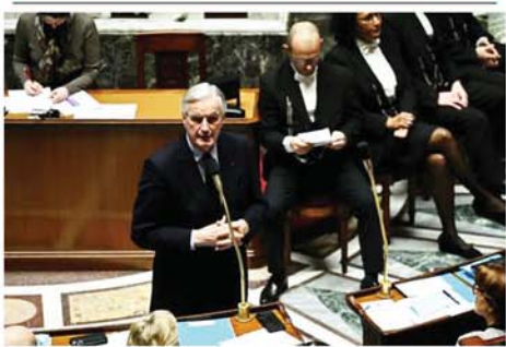
အယုံအကြည်မရှိ အဆိုတင်သွင်းခံရမည့် ဝန်ကြီးချုပ် မီချယ်ဘာနီယာ ပြင်သစ်ပါလီမန်တွင် ယမန်နေ့က ရှင်းလင်းပြောကြားနေစဉ်။ Mon