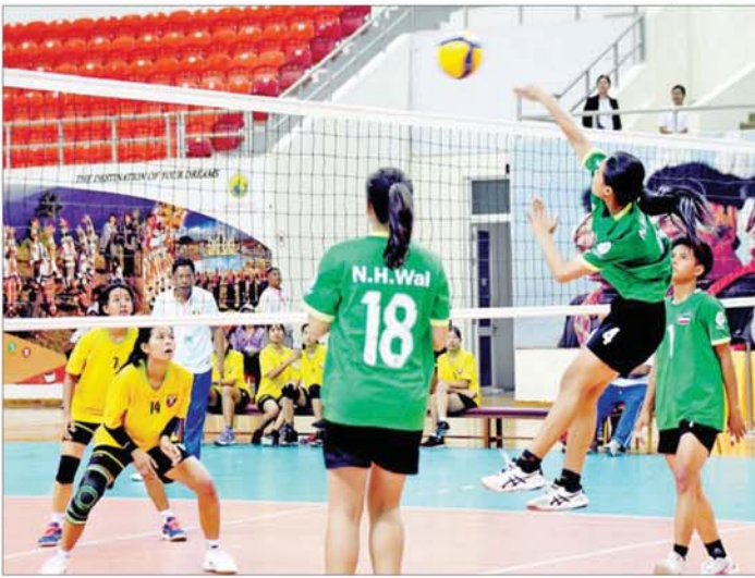
ပုမအကြိမ် အမျိုးသားအားကစားပွဲတော် ပြည်နယ်နှင့် တိုင်းဒေသကြီး အမျိုးသမီးဘော်လီဘော ဖြိုင်ပွဲတွင် စစ်ကိုင်းတိုင်းဒေသကြီးအသင်းနှင့် ကရင်ပြည်နယ်အသင်းတို့ ယှဉ်ပြိုင်ကစားကြစဉ်။