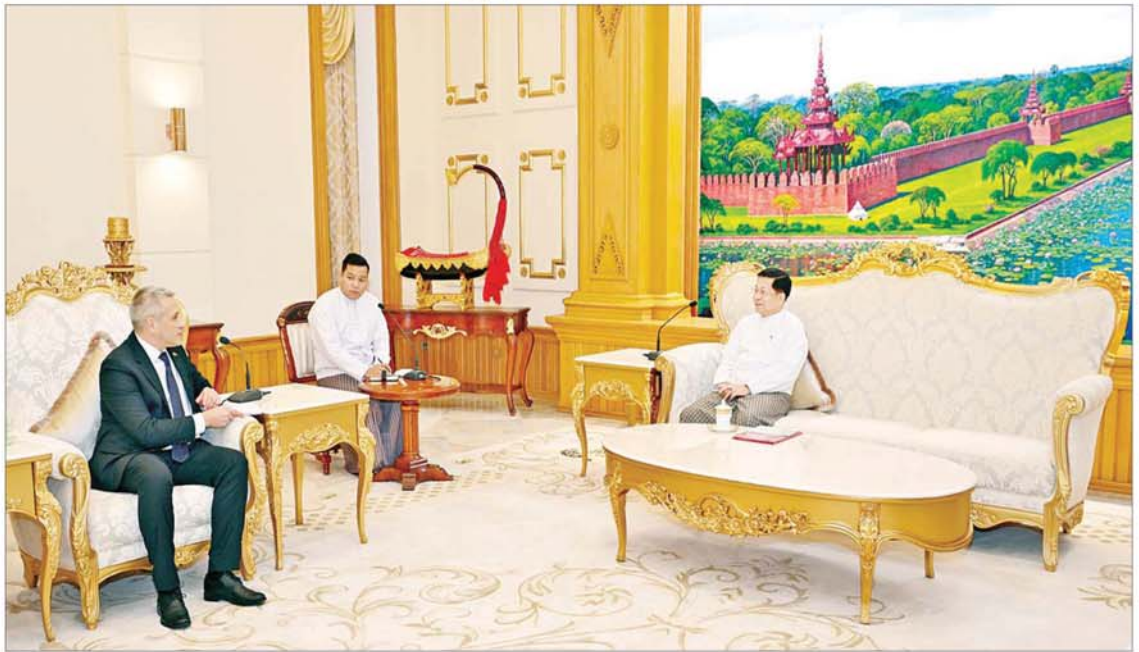
နိုင်ငံတော်စီမံအုပ်ချုပ်ရေးကောင်စီဥက္ကဋ္ဌ နိုင်ငံတော်ဝန်ကြီးချုပ် ဗိုလ်ချုပ်မှူးကြီးမင်းအောင်လှိုင် ဟန့်ရှင်းမြို့အခြေစိုက် မြန်မာနိုင်ငံဆိုင်ရာ ဘယ်လားရစ်နိုင်ငံ သံအမတ်ကြီး H.E. Mr. Uladzimir Baravikou အား လက်ခံတွေ့ဆုံစဉ်။

တွေ့ဆုံပွဲအပြီးတွင် နိုင်ငံတော်စီမံအုပ်ချုပ်ရေးကောင်စီဥက္ကဋ္ဌ နိုင်ငံတော်ဝန်ကြီးချုပ်နှင့် မြန်မာနိုင်ငံဆိုင်ရာ ဘယ်လားရစ်နိုင်ငံ သံအမတ်ကြီးတို့သည် အမှတ်တရ လက်ဆောင်ပစ္စည်းများ အပြန်အလှန်ပေးအပ်ကြပြီး စုပေါင်းမှတ်တမ်းတင်ဓာတ်ပုံ ရိုက်ခဲ့ကြကြောင်း သိရသည်။ သတင်းစဉ်