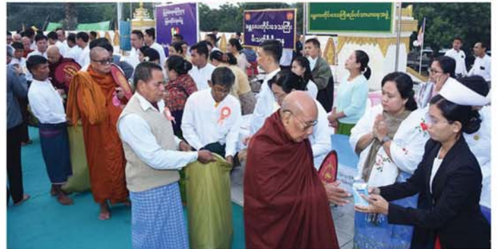
(မန္တလေးနေ့စဉ်-၄)