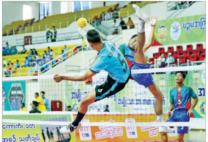
ပဉ္စမအကြိမ် အမျိုးသားအားကစားပွဲတော် ပြည်နယ်နှင့် တိုင်းဒေသကြီး အမျိုးသား ဝိုက်ကျော်ခြင်းပြိုင်ပွဲတွင် ကချင်ပြည်နယ်အသင်းနှင့် ကယားပြည်နယ်အသင်းတို့ ယှဉ်ပြိုင်ကစားကြစဉ်။