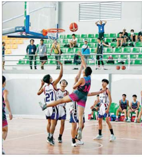
ပုမအကြိမ် အမျိုးသားအားကစားပွဲတော် ပြည်နယ်နှင့် တိုင်း ဒေသကြီး အမျိုးသားဘော်လီဘောဖြိုင်ပွဲတွင် တနင်္သာရီတိုင်း ဒေသကြီးအသင်းနှင့် စစ်ကိုင်းတိုင်းဒေသကြီးအသင်းတို့ ယှဉ်ပြိုင် ကစားကြစဉ်။

ပုမအကြိမ် အမျိုးသား အားကစားပွဲတော် ပြည်နယ် နှင့် တိုင်းဒေသကြီး အမျိုးသား ဘော်လီဘော ဖြိုင်ပွဲတွင် နေပြည်တော် အသင်းနှင့် ရန်ကုန်တိုင်းဒေသကြီး အသင်း တို့ ယှဉ်ပြိုင်ကစားကြစဉ်။