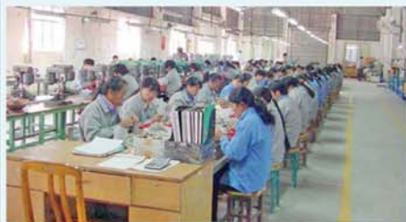
မန္တလေး ဒီဇင်ဘာ ၄

အလုပ်ရှင်၊ အလုပ်သမားအကြား အငြင်းပွားမှုဖြေရှင်းနိုင်ရန်အတွက် အလုပ်သမားရေးရာ လုပ်ငန်းညှိနှိုင်းကော်မတီ(WCC) များ ဖွဲ့စည်းရန်လိုအပ်ကြောင်း အလုပ်သမားဝန်ကြီးဌာနအလုပ်သမားရေးရာဆက်ဆံရေးဦးစီးဌာနက သိရသည်။ အလုပ်ရှင်နှင့် အလုပ်သမားအကြား အငြင်းပွားမှုများကို ပြေလည်စွာဖြေရှင်းနိုင်ရန်၊ လုပ်ငန်းခွင်ဆက်ဆံရေးကောင်းမွန်လာစေရန် လုပ်ငန်းခွင်အတွင်း၌ အလုပ်ရှင်အလုပ်သမား ဆွေးနွေးညှိနှိုင်းမှုများကို ပြုလုပ်နိုင်ရန်အတွက် အလုပ်သမား ၃၀ ဦးနှင့် အထက်ရှိသော စက်ရုံ၊ အလုပ်ရုံများတွင် အလုပ်သမား