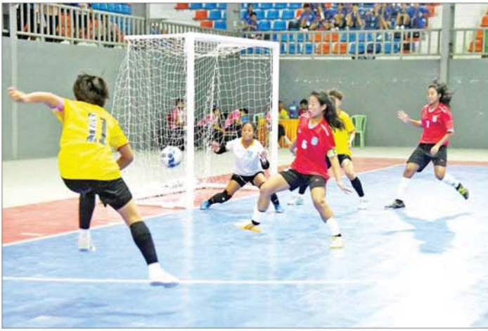
ပဉ္စမအကြိမ် အမျိုးသားအားကစားပွဲတော် ပြည်နယ်နှင့် တိုင်းဒေသကြီး အမျိုးသမီးဖူဆယ်ပြိုင်ပွဲတွင် ရန်ကုန်တိုင်းဒေသကြီးအသင်းနှင့် ကချင်ပြည်နယ်အသင်းတို့ ယှဉ်ပြိုင်ကစားကြစဉ်။