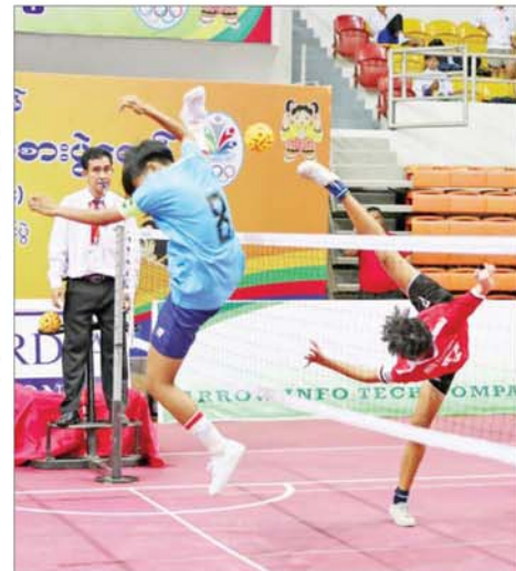
ပုမအကြိမ် အမျိုးသားအားကစားပွဲတော် ပြည်နယ်နှင့် တိုင်း ဒေသကြီး အမျိုးသမီးပိုက်ကျော်ခြင်းဖြိုင်ပွဲတွင် ဧရာဝတီတိုင်း ဒေသကြီးအသင်းနှင့် ပဲခူးတိုင်းဒေသကြီးအသင်းတို့ ယှဉ်ပြိုင်ကစား ကြစဉ်။