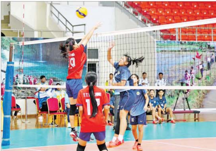
ပဉ္စမအကြိမ် အမျိုးသားအားကစားပွဲတော် ပြည်နယ်နှင့် တိုင်းဒေသကြီး အမျိုးသမီးဘော်လီဘောပြိုင်ပွဲတွင် ဧရာဝတီတိုင်းဒေသကြီးအသင်းနှင့် ရန်ကုန်တိုင်းဒေသကြီးအသင်းတို့ ယှဉ်ပြိုင်ကစားကြစဉ်။

နေပြည်တော်၌ ၂၀၁၅ ခုနှစ်တွင် စတုတ္ထအကြိမ် ကျင်းပခဲ့ကာ ယခု ၂၀၂၄ ခုနှစ်တွင် ပဉ္စမအကြိမ် အမျိုးသား အားကစားပွဲတော်ကြီးကို ပြန်လည်ကျင်းပနိုင်ခဲ့ခြင်းဖြစ်ပြီး အားကစားသမား ၉၀၀၀ ကျော် ပါဝင်ယှဉ်ပြိုင်ကစားလျက်ရှိကြောင်း သိရသည်။ မသန်စွမ်းရေးကူး(အမျိုးသား/အမျိုးသမီး) ဗီတာ ၅၀ အလွတ်ကူးပြိုင်ပွဲနှင့် ရင်ပေါင်တန်းကူးပြိုင်ပွဲကို ဝဏ္ဏသိဒ္ဓိရေးရာကန်၌ လည်းကောင်း၊ မသန်စွမ်းမျက်မြင်စစ်တုရင်(အမျိုးသား/အမျိုးသမီး) ပြိုင်ပွဲများကို လယ်ဝေးအားကစားကွင်း၌ လည်းကောင်း၊ မသန်စွမ်းထိုင်လျက် ဘော်လီဘော(အမျိုးသား)ပြိုင်ပွဲနှင့် မသန်စွမ်းပြေးခုန်ပစ် (အမျိုးသား/အမျိုးသမီး) ပြိုင်ပွဲများကို လယ်ဝေး TC-2အားကစားကွင်း၌လည်းကောင်း၊ ဒီဇင်ဘာ ၅ ရက် နံနက်ပိုင်းမှစတင်၍ ယှဉ်ပြိုင်ကစားသွားကြမည် ဖြစ်ရာ အားကစားဝါသနာရှင် မိဘပြည်သူများအနေဖြင့် မည်သူမဆို လာရောက်ကြည့်ရှု အားပေးနိုင်ကြောင်း သိရသည်။ သတင်းစဉ်