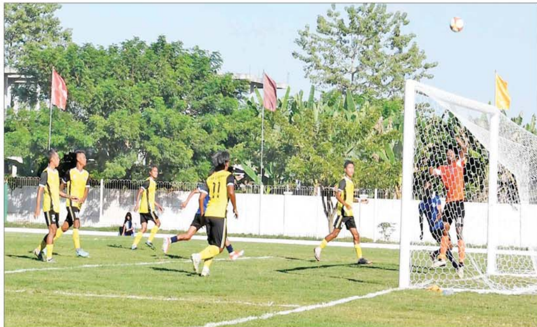
ပဉ္စမအကြိမ် အမျိုးသားအားကစားပွဲတော် ဝန်ကြီးဌာနပေါင်းစုံ အလွတ်တန်းအမျိုးသားဘောလုံးပြိုင်ပွဲ၌ မြန်ကြားရေးဝန်ကြီးဌာနအသင်းနှင့် လျှပ်စစ်စွမ်းအားဝန်ကြီးဌာနအသင်းတို့ ယှဉ်ပြိုင်ကစားကြစဉ်။

နေပြည်တော် ဒီဇင်ဘာ ၄ ၂၀၂၄ ခုနှစ် ပဉ္စမအကြိမ် အမျိုးသားအားကစားပွဲတော် အားကစားပြိုင်ပွဲ အုပ်စုပွဲစဉ်များကို ယနေ့ နံနက်ပိုင်းတွင် နေပြည်တော်ကောင်စီနယ်မြေအတွင်းရှိ သတ်မှတ်ထားသော အားကစားကွင်း၊ အားကစားရုံများ၌ ဆက်လက်ယှဉ်ပြိုင်ကစားကြသည်။ ပြည်နယ်နှင့် တိုင်းဒေသကြီး ပိုက်ကျော်ခြင်းပြိုင်ပွဲကို ဝဏ္ဏသိဒ္ဓိအားကစားကွင်း (A) ရှိ၍ ကျင်းပရာ အမျိုးသားနှစ်ယောက်တို့ ပိုက်ကျော်ခြင်းပြိုင်ပွဲတွင် ပဲခူးတိုင်းဒေသကြီးအသင်းက မန္တလေးတိုင်းဒေသကြီးအသင်းကို နှစ်ပွဲပြတ်၊ မကွေးတိုင်းဒေသကြီးအသင်းက ဧရာဝတီတိုင်းဒေသကြီးအသင်းကို နှစ်ပွဲတစ်ပွဲ၊ ကရင်ပြည်နယ်အသင်းက ချင်းပြည်နယ်အသင်းကို နှစ်ပွဲပြတ်၊ ရန်ကုန်တိုင်းဒေသကြီးအသင်းက ရှမ်းပြည်နယ်အသင်းကို နှစ်ပွဲပြတ်၊ တနင်္သာရီတိုင်းဒေသကြီးအသင်းက မွန်ပြည်နယ်အသင်းကို နှစ်ပွဲ တစ်ပွဲ၊ ပြည်ထောင်စုနယ်မြေ နေပြည်တော်အသင်းက ရခိုင်ပြည်နယ်အသင်းကို နှစ်ပွဲပြတ်၊ ကချင်ပြည်နယ်အသင်းက ကယားပြည်နယ်အသင်းကို နှစ်ပွဲ တစ်ပွဲဖြင့်လည်းကောင်း၊ ပဲခူးတိုင်းဒေသကြီးအသင်းက ဧရာဝတီတိုင်းဒေသကြီးအသင်းကို