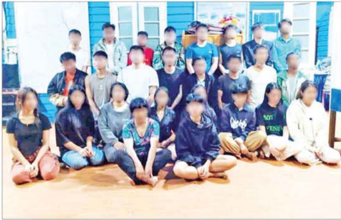
တန့်ယန်းမြို့နယ်၌ အွန်လိုင်းအသုံးပြု၍ ငွေလိမ်လုပ်ငန်းလုပ်ကိုင်နေသည့် မြန်မာနိုင်ငံသား အားဖျင် (ခ)စောက်ရီချိုပါ အမျိုးသား ၁၇ ဦးနှင့် အမျိုးသမီး ၁၀ ဦး၏ မှတ်တမ်းဓာတ်ပုံ။

ထိုသို့ ဆောင်ရွက်လျက်ရှိရာ ၂၀၂၄ ခုနှစ် ဒီဇင်ဘာ ၂ ရက် မွန်းလွဲ ၁ နာရီ ၁၅ မိနစ်တွင် လုံခြုံရေးတပ်ဖွဲ့ဝင်များ ပါဝင်သော ပူးပေါင်းအဖွဲ့သည် ရှမ်းပြည်နယ် (မြောက်ပိုင်း) တန့်ယန်းမြို့နယ် နောင်တီးကျေးရွာရှိ နေအိမ်တစ်လုံး၌ တရုတ်နိုင်ငံသားများနှင့် မြန်မာနိုင်ငံသားများ ပူးပေါင်းကာ အွန်လိုင်းအသုံးပြု၍ ငွေလိမ်လုပ်ငန်းများ လုပ်ကိုင်နေကြောင်း သတင်းရရှိသဖြင့် အဆိုပါနေအိမ်အား သက်သေများနှင့်အတူ ဝင်ရောက်ရှာဖွေစစ်ဆေးခဲ့သည်။