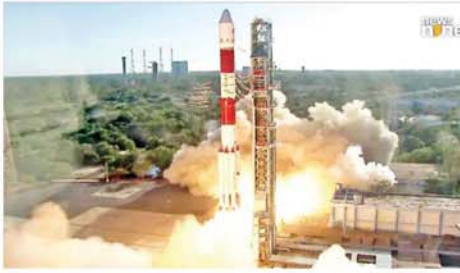
အိန္ဒိယအာကာသ သုတေသနအဖွဲ့က အတည်ပြုပြောကြားသည်။ PSLV-C59 ခုံးပျံယာဉ်တွင် တင်ဆောင်ထားသည့် Proba-3

နယူးဒေလီ ဒီဇင်ဘာ ၅ အိန္ဒိယနိုင်ငံ၏ အာကာသ အေဂျင်စီဖြစ်သည့် အိန္ဒိယအာကာသ သုတေသနအဖွဲ့ (ISRO) သည် ဥရောပအာကာသအေဂျင်စီ၏ Proba-3 ပြုတ်တုများတင်ဆောင်ထားသည့် PSLV-C59 ခုံးပျံယာဉ်ကို ယနေ့ အောင်မြင်စွာ လွှတ်တင်ခဲ့ကြောင်း အိန္ဒိယ အာကာသ သုတေသနအဖွဲ့က အတည်ပြုပြောကြားသည်။ လွှတ်တင်မှုကို တောင်ပိုင်း