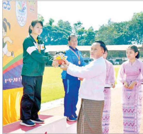
နိုင်ငံတော်စီမံအုပ်ချုပ်ရေးကောင်စီအဖွဲ့ဝင် ဦးကျော်စွမ်း အမျိုးသမီးသံလုံးပစ် F 44/62/63/64 ပြိုင်ပွဲတွင် ပထမဆုရရှိသည့် မွန်ပြည်နယ်မှ ပြိုင်ပွဲဝင်တစ်ဦးအား ဂုဏ်ပြုဆုတံဆိပ်နှင့် အမျိုးသားအားကစားပွဲတော်အထိမ်းအမှတ်အရပ် ပေးအပ်ချီးမြှင့်စဉ်။

ကြီးနှင့် တတိယဆုရရှိသည့် ဧရာဝတီတိုင်းဒေသကြီးတို့မှ ပြိုင်ပွဲဝင်များအားလည်းကောင်း၊ ဂုဏ်ပြုဆုတံဆိပ်နှင့် အမျိုးသားအားကစားပွဲတော် အထိမ်းအမှတ်အရပ်အား ပေးအပ်ချီးမြှင့်သည်။ ဆက်လက်၍ နိုင်ငံတော်စီမံအုပ်ချုပ်ရေးကောင်စီအဖွဲ့ဝင် ဦးကျော်စွမ်းက အမျိုးသမီးသံလုံးပစ် F 44/62/63/64 ပြိုင်ပွဲတွင် ပထမဆုရရှိသည့် မွန်ပြည်နယ်၊ ဒုတိယဆုရရှိသည့် ပြည်ထောင်စုနယ်မြေ နေပြည်တော်နှင့် တတိယဆုရရှိသည့် ပဲခူးတိုင်းဒေသကြီးအသင်းတို့မှ ပြိုင်ပွဲဝင်များအားလည်းကောင်း၊ အမျိုးသမီးမိတာ ၂၀၀ T 44/64 အပြေးပြိုင်ပွဲတွင် ပထမဆုရရှိသည့် ဧရာဝတီတိုင်းဒေသကြီး၊ ဒုတိယဆုရရှိသည့် မွန်ပြည်နယ်နှင့် တတိယဆုရရှိသည့် ရန်ကုန်တိုင်းဒေသကြီးအသင်းတို့မှ ပြိုင်ပွဲဝင်များအားလည်းကောင်း၊ ဂုဏ်ပြုဆုတံဆိပ်နှင့် အမျိုးသားအားကစားပွဲတော် အထိမ်းအမှတ်အရပ်အား ပေးအပ်ချီးမြှင့်သည်။