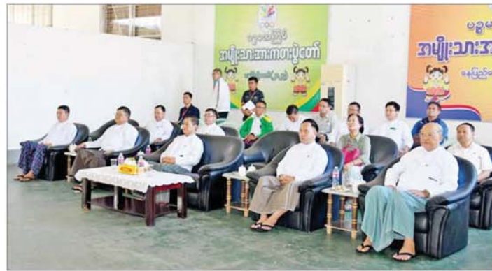
နိုင်ငံတော်စီမံအုပ်ချုပ်ရေးကောင်စီအဖွဲ့ဝင်များဖြစ်ကြသည့် ခွန်စံလွင်၊ ဦးရွှေကြိမ်းနှင့် ဦးရန်ကျော်၊ ပြည်ထောင်စုဝန်ကြီးများဖြစ်သည့် ဦးမင်းသိန်း၊ Jeng Phang နော်တောင်၊ ဒုတိယဝန်ကြီးများနှင့် တာဝန်ရှိသူများ မသန်စွမ်းအမျိုးသားထိုင်လျက်ဘော်လီဘောပြိုင်ပွဲတွင် ရန်ကုန်တိုင်းဒေသကြီးအသင်းနှင့် ပဲခူးတိုင်းဒေသကြီးအသင်းတို့ယှဉ်ပြိုင်နေမှုကို ကြည့်ရှုအားပေးကြစဉ်။

၆ ရေဖုံးမှ ပြိုင်ပွဲယှဉ်ပြိုင်မှုများအပြီးတွင် ဆု ချီးမြှင့်ပွဲအခမ်းအနားကို ဆက်လက် ကျင်းပရာ ဒုတိယဝန်ကြီး ဦးထိန်လင်း က မသန်စွမ်းရေးကူ့အမျိုးသား 56/10 မီတာ ၅၀ အလွတ်ကူးပြိုင်ပွဲတွင် ပထမ ဆုရရှိသည့် ဧရာဝတီတိုင်းဒေသကြီး၊ ဒုတိယဆုရရှိသည့် ရန်ကုန်တိုင်းဒေသ ကြီး၊ တတိယဆုရရှိသည့် ပဲခူးတိုင်းဒေသ ကြီးအသင်းတို့မှ ပြိုင်ပွဲဝင်များအား လည်းကောင်း၊ ဒုတိယဝန်ကြီး ခေါက်တာ အောင်ကြီးက အမျိုးသား 59/10 မီတာ ၅၀ ရင်ပေါင်တန်းကူးပြိုင်ပွဲတွင် ပထမဆု ရရှိသည့် ပဲခူးတိုင်းဒေသကြီး၊ ဒုတိယဆု ရရှိသည့် မန္တလေးတိုင်းဒေသကြီးနှင့် တတိယဆုရရှိသည့် ပဲခူးတိုင်းဒေသကြီး အသင်းတို့မှ ပြိုင်ပွဲဝင်များအား လည်းကောင်း၊ ဂုဏ်ပြုဆုတံဆိပ်နှင့် အမျိုးသားအားကစားပွဲတော် အထိမ်း အမှတ်အရပ်အား ပေးအပ်ချီးမြှင့်ကြ သည်။ ထို့နောက် ပြည်ထောင်စုဝန်ကြီး ဦးမင်းသိန်းဇံက မသန်စွမ်းရေးကူ့ အမျိုးသား 59/10 မီတာ ၅၀ အလွတ်ကူး ပြိုင်ပွဲတွင် ပထမဆုရရှိသည့် ပဲခူးတိုင်း ဒေသကြီး၊ ဒုတိယနှင့် တတိယဆုရရှိကြ သည့် ရန်ကုန်တိုင်းဒေသကြီးအသင်းတို့မှ ပြိုင်ပွဲဝင်များအားလည်းကောင်း၊ ဂုဏ်ပြု ဆုတံဆိပ်နှင့် အမျိုးသားအားကစား ပွဲတော် အထိမ်းအမှတ်အရပ်အား ပေးအပ်ချီးမြှင့်သည်။ ယင်းနောက် နိုင်ငံတော်စီမံအုပ်ချုပ် ရေးကောင်စီအဖွဲ့ဝင် ဒေါက်တာဘန္တေက မသန်စွမ်းရေးကူ့ အမျိုးသား 56/7 မီတာ ၅၀ အလွတ်ကူးပြိုင်ပွဲတွင် ပထမဆုရရှိသည့် ဧရာဝတီ တိုင်းဒေသကြီးအသင်းမှ ပြိုင်ပွဲဝင်တစ်ဦးအား ဂုဏ်ပြုဆုတံဆိပ်နှင့် အမျိုးသား အားကစားပွဲတော်အထိမ်းအမှတ်အရပ် ပေးအပ်ချီးမြှင့်စဉ်။