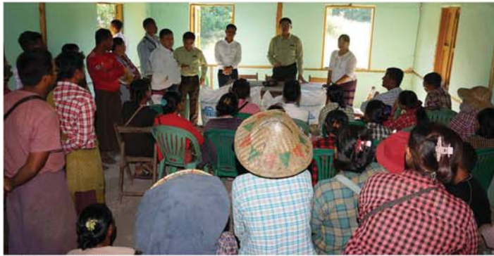
မိတ္ထီလာ ဒီဇင်ဘာ ၅

မန္တလေးတိုင်းဒေသကြီး၊ မိတ္ထီလာမြို့နယ် ဆပ်ခင်းပေါက် ကျေးရွာရှိ ကြက်သွန်စိုက် တောင်သူများ ပန်းတိုင်အထွက်နှုန်း ထွက်ရှိရေး ဓာတ်မြေဩဇာများ ပေးအပ်ပွဲကို ယမန်နေ့က ကန့်သာကျေးရွာအုပ်စု ရန်ကုန်-မန္တလေးကားလမ်းဟောင်းအနီး တောင်သူနည်းပညာပေးရုံးတွင်