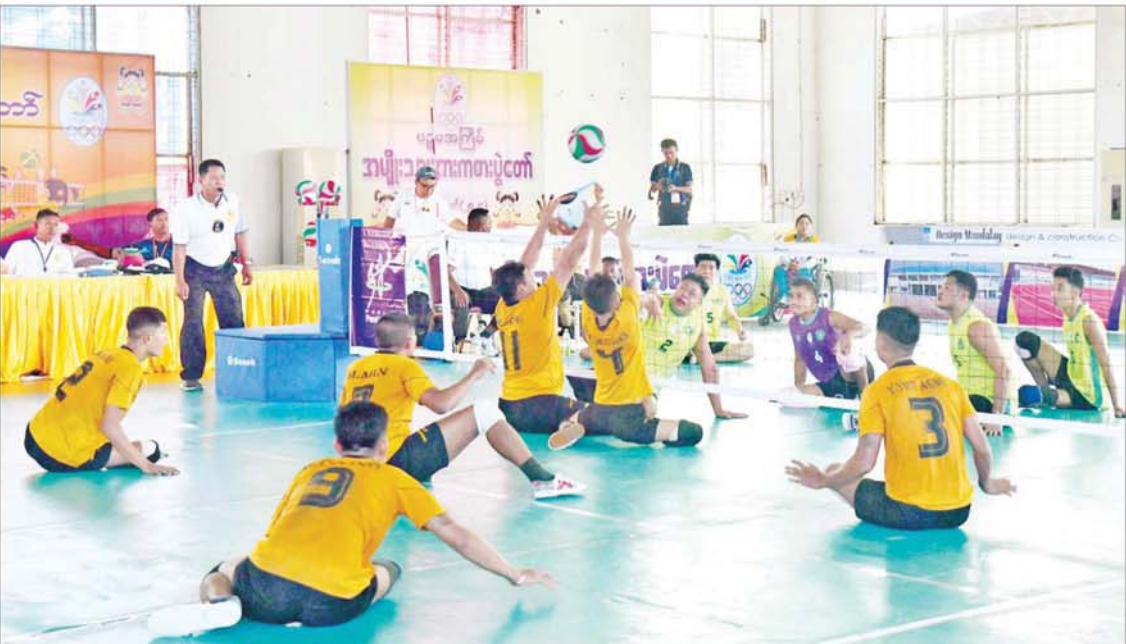
၂၀၂၄ ခုနှစ် ပဉ္စမအကြိမ် အမျိုးသားအားကစားပွဲတော် မသန်စွမ်းအားကစား ထိုင်လျက်တော်လီတောပြိုင်ပွဲ၌ ရန်ကုန်တိုင်းဒေသကြီးအသင်းနှင့် ပဲခူးတိုင်းဒေသကြီးအသင်းတို့ ယှဉ်ပြိုင်ကစားကြစဉ်။