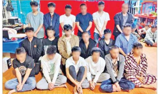
တန့်ယန်းမြို့နယ်၌ အွန်လိုင်းအသုံးပြု၍ ငွေလိမ်လုပ်ငန်းလုပ်ကိုင်နေသည့် တရုတ်နိုင်ငံသား ချိန်လှပါ အမျိုးသား ၁၈ ဦး၏ မှတ်တမ်းဓာတ်ပုံ။