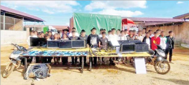
တန့်ယန်းမြို့နယ်၌ တရုတ်နိုင်ငံသား ၁၈ ဦးနှင့် မြန်မာနိုင်ငံသား ၂၇ ဦးတို့အား အွန်လိုင်းအသုံးပြု၍ ငွေလိမ်လုပ်ငန်းလုပ်ကိုင်ရာတွင်အသုံးပြုသည့် ဆက်စပ်ပစ္စည်းများ၊ လက်နက်၊ ခဲယမ်းများနှင့်အတူ ဖမ်းဆီးရမိမှုမှတ်တမ်းဓာတ်ပုံ။

နှင့်အညီ ထိရောက်စွာ အရေးယူနိုင်ရေး တန့်ယန်းမြို့မရဲစခန်း၌ အီလက်ထရောနစ်ဆက်သွယ်ရေး ဆိုင်ရာဥပဒေပုဒ်မ ၃၃(က) ဖြင့် လည်းကောင်း၊ လဝကအက်ဥပဒေ ပုဒ်မ ၁၃(၁)ဖြင့် လည်းကောင်း အမှုဖွင့်စစ်ဆေးဆောင်ရွက်လျက် ရှိကြောင်း သိရသည်။ သတင်းစဉ်