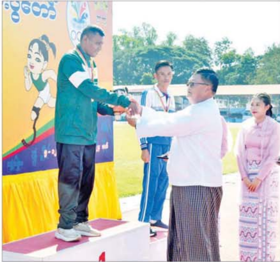
နိုင်ငံတော်စီမံအုပ်ချုပ်ရေးကောင်စီအဖွဲ့ဝင် ဦးရန်ကျော် အမျိုးသား မိတာ ၂၀၀ T 64 အပြေးပြိုင်ပွဲတွင် ပထမဆုရရှိသည့် မွန်ပြည်နယ်မှ ပြိုင်ပွဲဝင်တစ်ဦးအား ဂုဏ်ပြုဆုတံဆိပ်နှင့် အမျိုးသားအားကစားပွဲတော်အထိမ်းအမှတ်အရပ် ပေးအပ်ချီးမြှင့်စဉ်။

နိုင်ငံတော်စီမံအုပ်ချုပ်ရေးကောင်စီအဖွဲ့ဝင် ဦးရန်ကျော်က အမျိုးသားသံလုံးပစ် F 56/57 ပြိုင်ပွဲတွင် ပထမဆုရရှိသည့် ဧရာဝတီတိုင်းဒေသကြီး၊ ဒုတိယဆုရရှိသည့် မွန်ပြည်နယ်နှင့် တတိယဆုရရှိသည့် ရန်ကုန်တိုင်းဒေသကြီးတို့မှ ပြိုင်ပွဲဝင်များအားလည်းကောင်း၊ အမျိုးသားမိတာ ၂၀၀ T 64 အပြေးပြိုင်ပွဲတွင် ပထမဆုရရှိသည့် မွန်ပြည်နယ်၊ ဒုတိယဆုရရှိသည့် မန္တလေးတိုင်းဒေသ