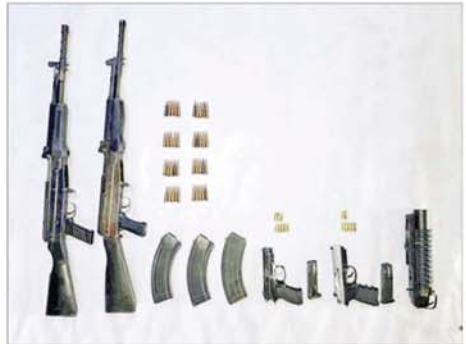
တန့်ယန်းမြို့နယ်၌ အွန်လိုင်းအသုံးပြု၍ ငွေလိမ်လုပ်ငန်းလုပ်ကိုင်သူများအား ဖမ်းဆီးရမိမှုမှ CZ 75 D 9MM အမျိုးအစားပစ္စတိုသေနတ်တစ်လက်၊ ကျည်ရစ်တောင့်၊ Beretta 9MM အမျိုးအစားပစ္စတိုသေနတ်တစ်လက်၊ ကျည်ခဲနှစ်တောင့်၊ Type-81 အမျိုးအစားသေနတ်နှစ်လက်၊ ကျည်အိမ်သုံးခု၊ ကျည်တောင့် ၄၀၊ ၄၀ မမ ပြောင်းတစ်ခု သိမ်းဆည်းရမိမှု မှတ်တမ်းဓာတ်ပုံ။

ကျည်ရစ်တောင့်၊ Beretta 9MM အမျိုးအစား ပစ္စတိုသေနတ်တစ်လက်၊ ကျည်ခဲနှစ်တောင့်၊ Type-81 အမျိုးအစား သေနတ်နှစ်လက်၊ ကျည်အိမ် သုံးခု၊ ကျည်တောင့် ၄၀၊ ၄၀ မမ ပြောင်းတစ်ခု၊ စကားပြောစက်၊ ခြောက်လုံး၊ ဆိုင်ကယ်နှစ်စီး၊ မီးစက်တစ်လုံး၊